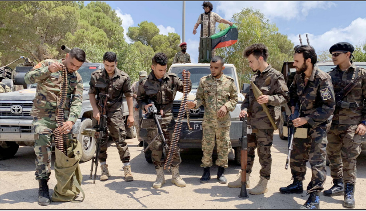
عناصر من القوات التابعة لحكومة الوفاق الليبية

الدول الأوروبية من مجريات الأحداث في ليبيا، قال قائل: "لثابتاً تتبنى موقفاً بناءً، فمؤتمر برلين كانت خطوة جيدة، فالألمان انركوا جيداً بأن حفتر هو من يعكر صفو محادثات السلام". وأردف: الرئيس اردوغان أبغض ميركل بوجود عدم الثقة بحفتر، لأنه هرب من محادثات موسكو وعلق ما يتنبه ذلك في مؤتمر برلين، واعتقد أن الألمان باتوا على قناعة بأن حفتر هو من لا يريد الحل السياسي".