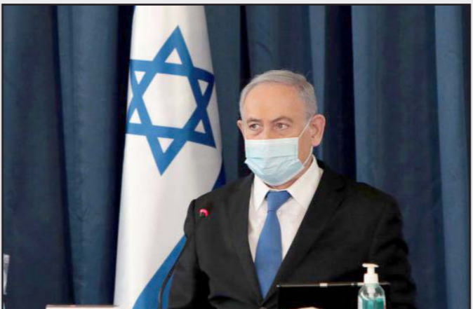
رئيس الوزراء الإسرائيلي بنيامين نتيناهو

هذه (ويوجد بضع عشرات فقط) هي في سياقات البحث والتطوير، ويمكنها أن تؤثر بعد بضع سنوات فقط... ومن أجل الوصول إلى مادة مشعة بتخصيب 90 في المئة، يتعين على إيران أن تظرد الوكالة الدولية للطاقة الذرية وهذا لا يحصل... ويشكل عام، ووفقا للاستخبارات الأمريكية، ليس لإيران اليوم برنامج لتطوير سلاح نووي.