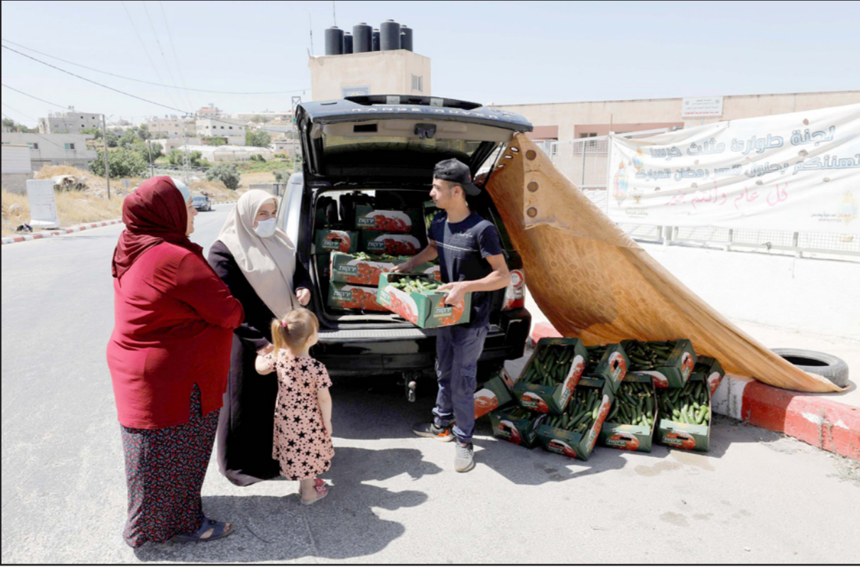
بائع يستغل إغلاق مدينة الخليل بسبب كورونا لبيع محصوله من الخيار