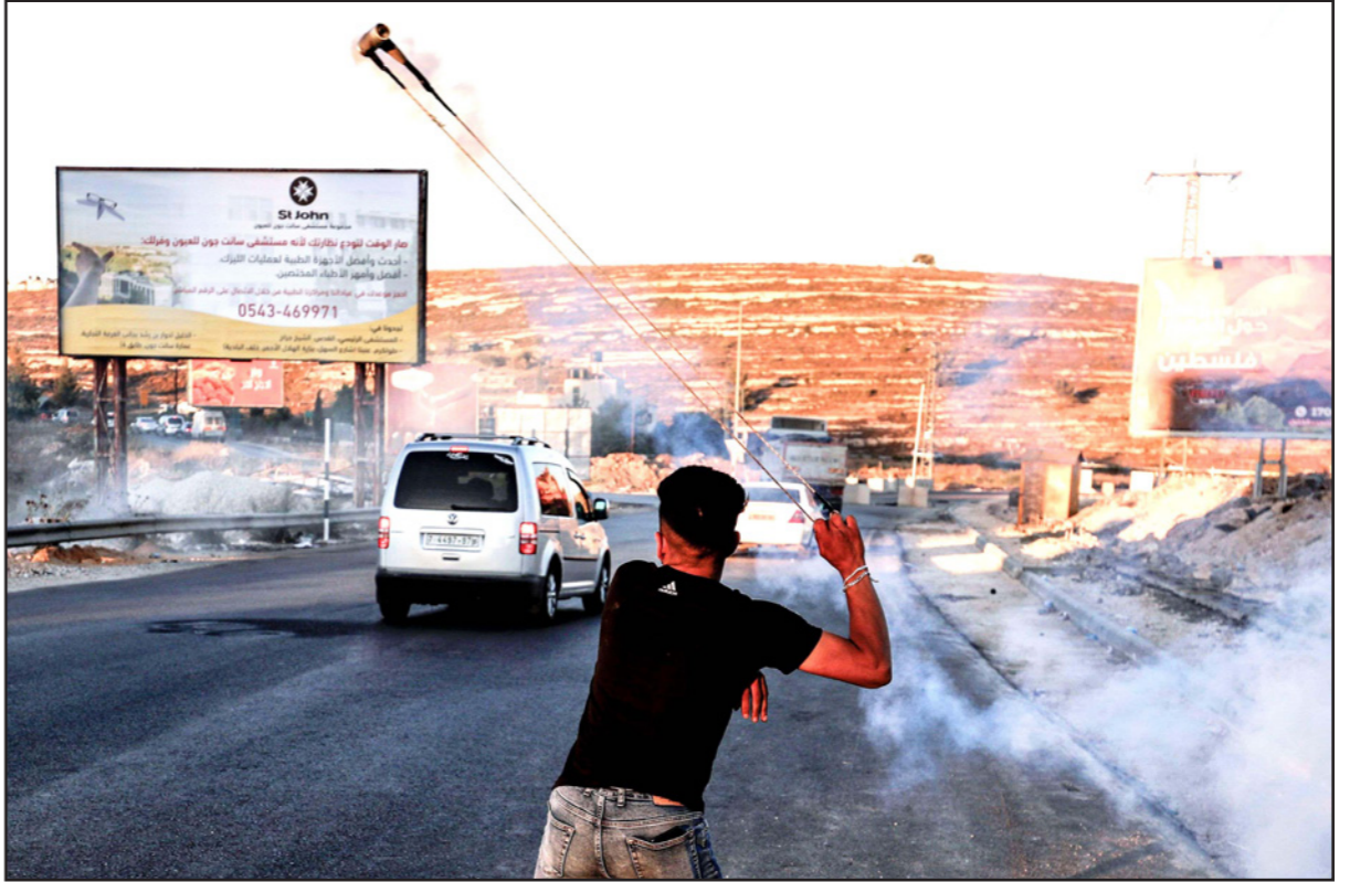
شاب فلسطيني يعيد إلى جنود الاحتلال قنبلة غاز أطلقوها صوبه خلال مواجهات في شمال رام الله