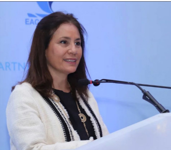
وزيرة الطاقة هالة زواتي

■ عمان – رويترز: قال الأردن أن خطة مدتها عشر سنوات لتوسيع مصادر الطاقة المتجددة وإنتاج النفط الصخري ستقلل الاعتماد على واردات الوقود الأجنبية المكلفة التي تنقل كامل اقتصاده وستدفعه نحو الاكتفاء الذاتي. وقالت وزيرة الطاقة، هالة زواتي، أنه بحلول عام 2030 فإن 48.5 في المئة من توليد الكهرباء في البلاد ستأتي من مصادر محلية للطاقة، بموجب «استراتيجية قطاع الطاقة 2020-2030»، التي وافقت عليها الحكومة وكشفت النقاب عنها يوم الثلاثاء، وتبلغ النسبة حالياً 15 في المئة فقط.