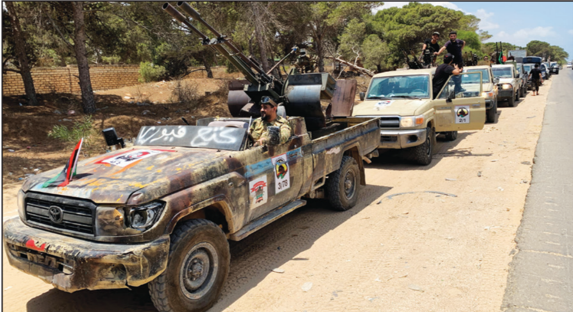
عناصر تابعة لحكومة «الوفاق» خلال استعدادات الهجوم على سرت

هذا وصرح وزير الخارجية الروسي سيرغي لافروف أمس الأربعاء، أن ما يسمى بالجيش الوطني الليبي، بقيادة المشير خليفة حفتر، مستعد للتوقيع على اتفاق لوقف فوري لإطلاق النار، إلا أن حكومة طرابلس لا ترغب في ذلك وتعمل على الحل العسكري. (تفاصيل ص 23)