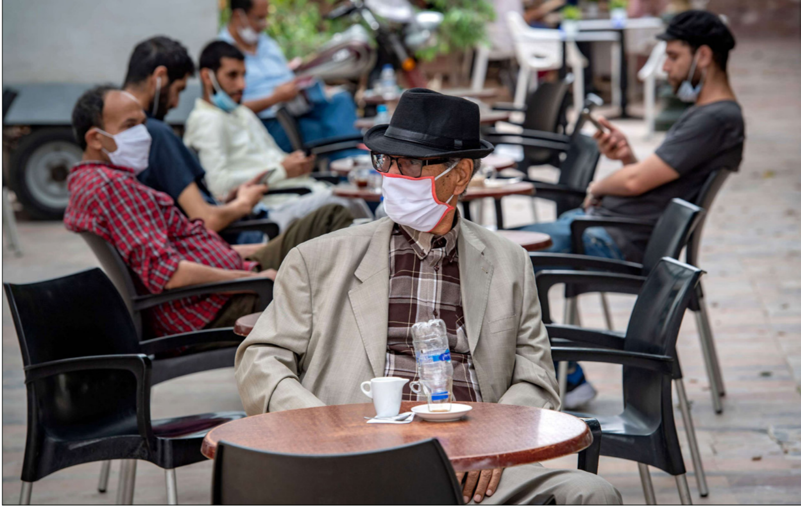
مغربي يرتدي كمامة في احد مقاهي الرباط