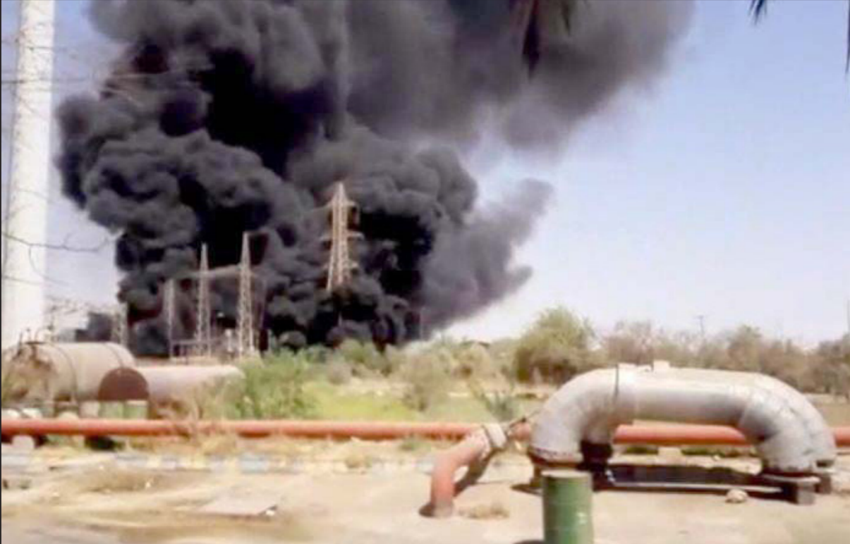
الدخان يتصاعد من منشأة نظنر النووية جراء الانفجار

إيران وإسرائيل، حيث هناك في الخلفية أزمة اقتصادية غير مسبوقة في لبنان، وحزب الله يقع تحت ضغط عام شديد، وإن احتكاكاً عسكرياً مع إسرائيل يبدو الآن وكأنه الأمر الأخير الذي يحتاجه أو يريد سكرتير عام حزب الله، حسن نصر الله، ولكن توقع اتجاه التطورات يظل رهن المجهول.