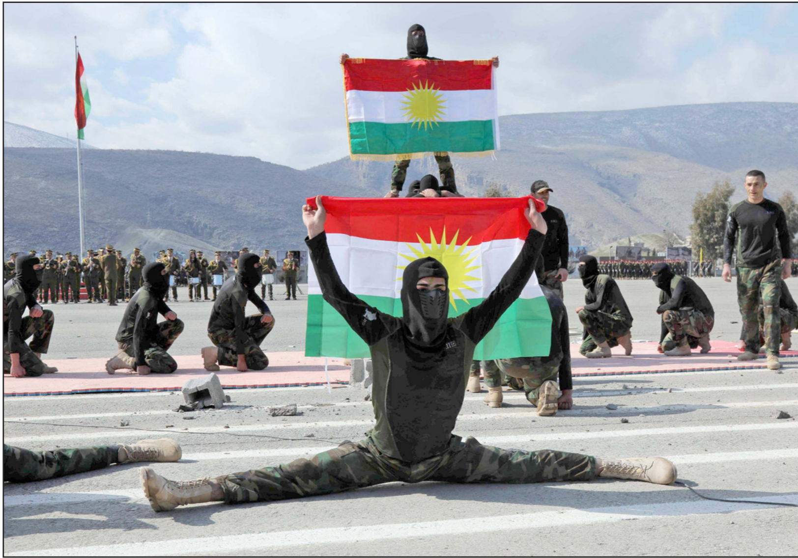
عناصر من البيشمركة الكردية يشاركون في حفل تخرج في بلدة سوران شمال شرق أربيل

وعدّ النائب عن ائتلاف المالكي، محافظة كركوك بأنها «اتحادية، حالها حال المحافظات الأخرى، وفرض الأمن والنظام من واجب الحكومة الاتحادية حصراً، ولن نسبح بأي اتفاق سياسي أو حزبي يكون على حساب المحافظة لأي جهة كانت من خلال عودة البيشمركة (ب) صفقة سياسية»، مشدداً على أهمية عدم الموافقة تحت سيطرة الحكومة الاتحادية كون هذا مطلب اهالي المحافظة وممثليهم داخل مجلس النواب ولن