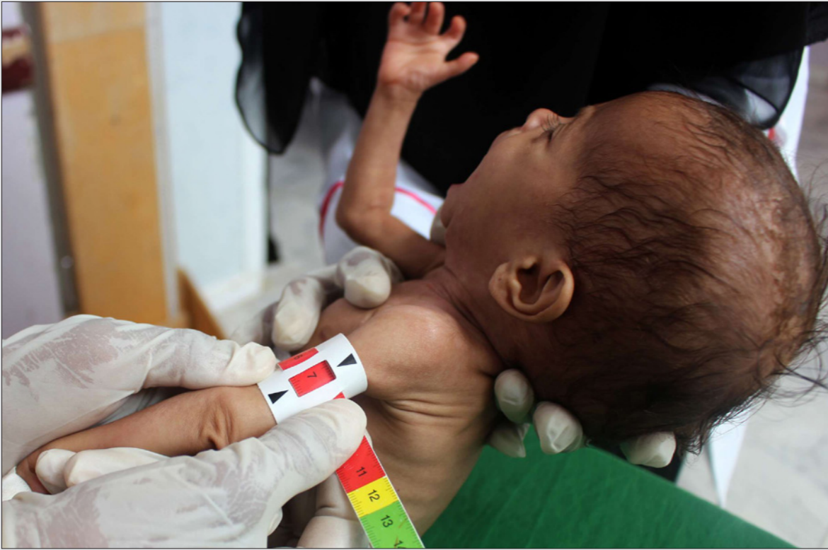
طفل يعاني من سوء التغذية جراء حرب السعودية وحلفائها على اليمن

قال أندرو سميت منسق الحملة ضد تجارة السلاح في مقال نشرته صحيفة «إندبندنت» أن نفاق الحكومة البريطانية بدأ واضحا بعد أقل من 24 ساعة من إعلان وزير خارجيتها دومينك راب عن «بريطانيا العالمة» التي تدافع عن حقوق الإنسان.