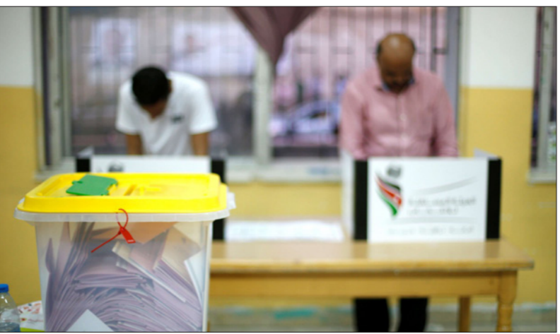
هل الأردنيون على موعد مع الانتخابات في تشرين الثاني المقبل؟