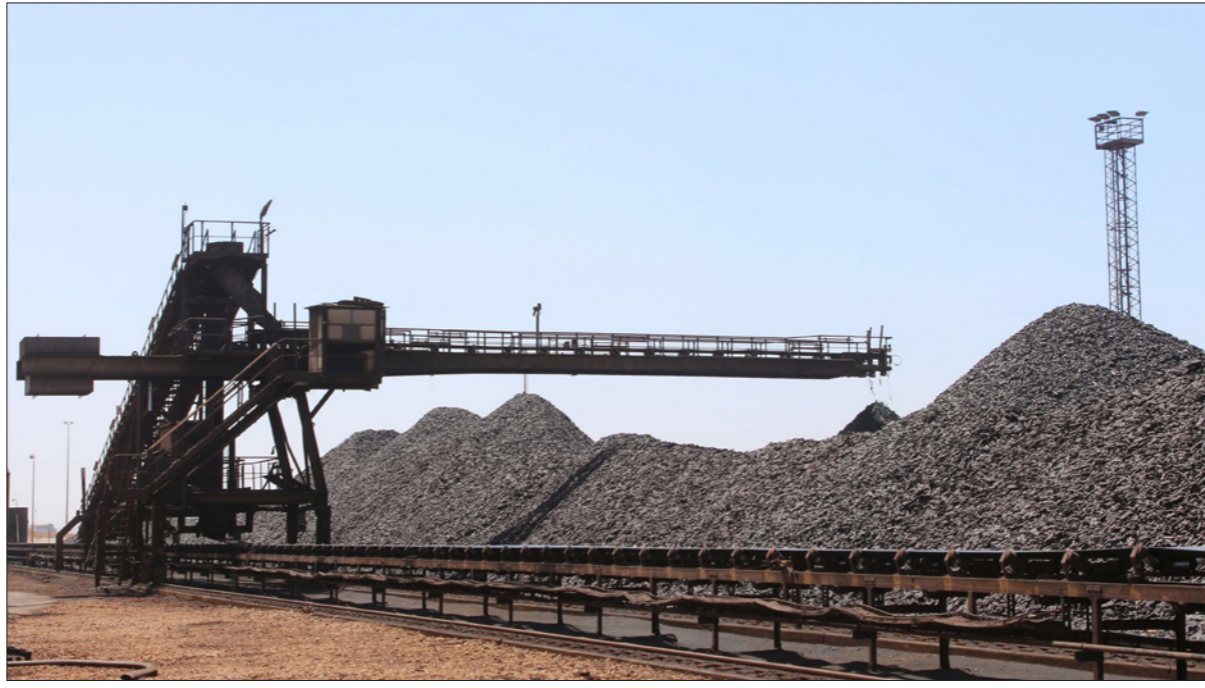
جانب من شركة الحديد والصلب الليبية (ليسكو) في مصراتة

موقعها الإلكتروني، وتمكن مصنع الشركة في مصراتة من تصدير كميات منه إلى الخارج. وتتحدث عدة تقارير عن تواجد مناجم اليورانيوم في الجنوب الغربي لليبية في منطقة العيونات الغربية بالقرب من مدينة غات، الحدودية مع الجزائر، حسب المجلس الليبي للنفط والغاز. وهذا الثلث السوداني بين ليبيا والجزائر والنيجر، معروف بتواجد كميات من اليورانيوم فيه، لكنه غير مستغل إلا في النيجر، نظراً لأن الشركة النووية الفرنسية «أريفا» تحتكر استغلال هذا النجم، وغير خام اليورانيوم يتم استخراج الطاقة الكهربائية في فرنسا بعد تصديره في مفاعلات نووية. وهذا أحد الأسباب التي تجعل فرنسا تهتم باليمن وقزان، الذي يوجد فيه اليورانيوم، ناهيك عن النفط والغاز، وتوجد شواهد على تواجد في منطقة العيونات الشرقية، قرب مثلث الحدود الليبية مع مصر والسودان. كما توجد في جبال تيبستي من الجانب الليبي على الحدود مع تشاد شواهد على وجود الذهب والفضة. لكن ذهب ليبيا في تيبستي عرضة للنهب من الباحثين الأفرقة عن المعدن الأصفر والذبح جوبون الصحراء الكبرى من السودان شرقاً إلى موريتانيا غرباً مروراً بنشاد، وليبيا والنيجر والجزائر للتعقب عن الذهب بوسائل بسيطة. وفي المنطقة نفسها، توجد رواسب بكميات