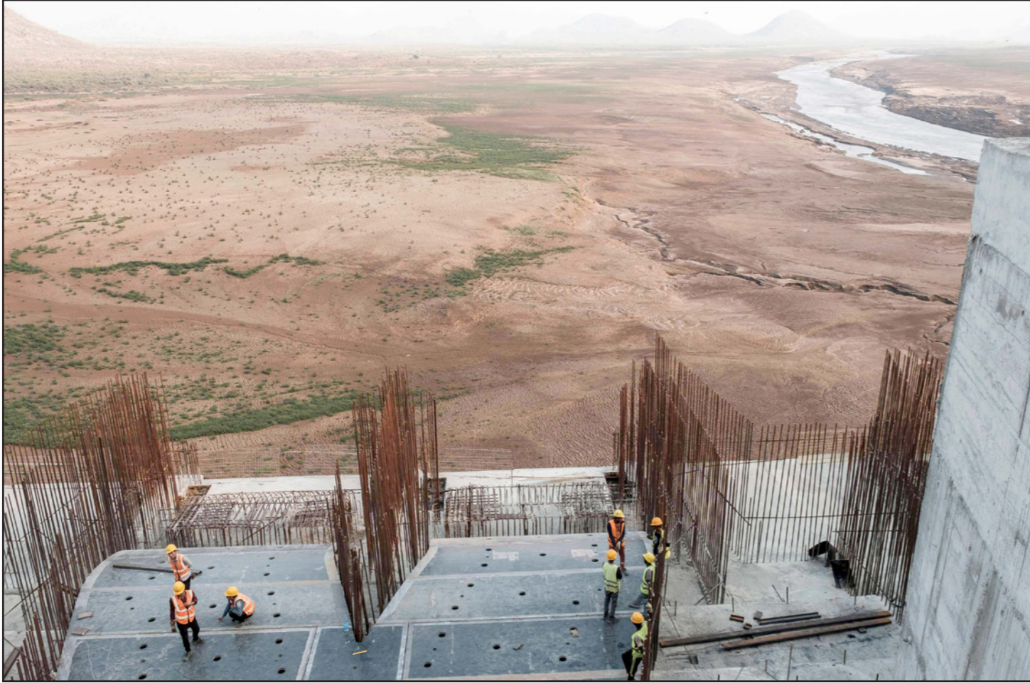
من أعمال بناء سد النهضة الإثيوبي

وأثيوبيا، وأعلن رئيس مفوضية الاتحاد الأفريقي، موسى في، في وقت سابق حل معظم القضايا في المفاوضات لتسوية أزمة سد النهضة بين مصر وإثيوبيا والسودان. وسد النهضة الذي بدأت أديس أبابا ببنائه في 2011 سيصبح عند إنجازه أكبر سد كهرومائي في القارة الأفريقية. وتخوض مصر وإثيوبيا والسودان مفاوضات شاقة منذ سنوات لمعالجة مخاوف مصر من سد النهضة الذي تبنيه إثيوبيا (دولة المنبع) على النيل الأزرق، وتخشي القاهرة من تأخيرها على حصتها من مياه النيل التي تبلغ 55 مليار متر مكعب.