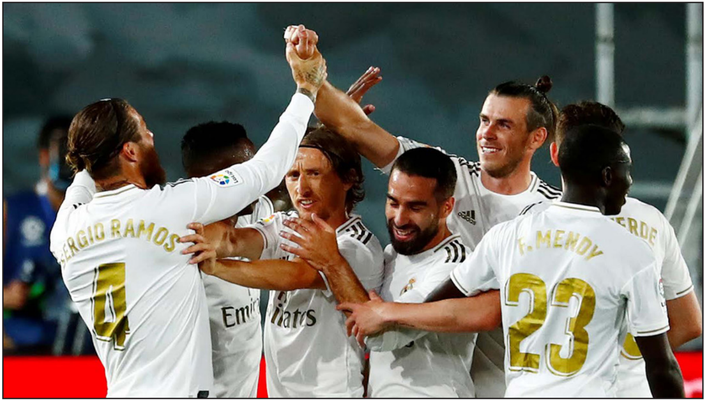
لاعبو الريال يعنون النفس بالاحتفال مجدداً بإحراز لقب الدوري