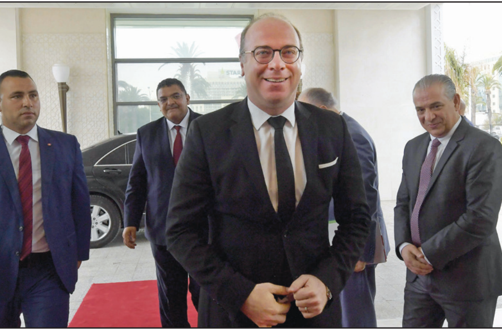
رئيس الوزراء التونسي المستقيل الياس الفخفاخ لحظة وصوله إلى مؤتمر في تونس العاصمة أمس