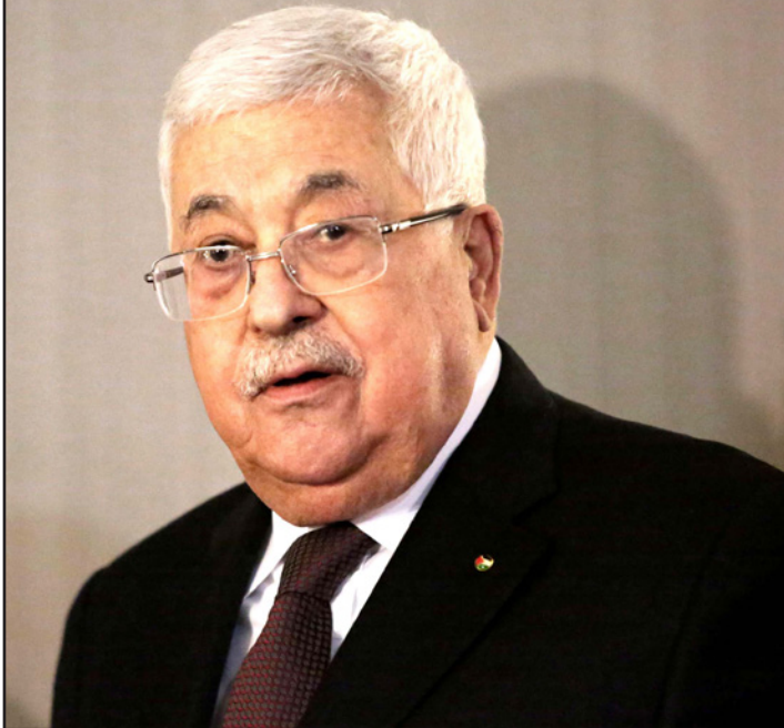
الرئيس الفلسطيني محمود عباس

يشار إلى أن الرئيس عباس أعلن في 16 أيار/مايو الماضي التحلل من كل الاتفاقيات الوعّدة بين منظمة التحرير الفلسطينية وإسرائيل، بما فيها الاتفاقيات الأمنية والسياسية والاقتصادية كرد على خطة الضم. وتحلل الاتصال إطلاع رئيس وزراء بريطانيا على الجهود الفلسطينية لمواجهة الموجة الثانية من جائحة فيروس "كورونا" التي تضرب الأراضي الفلسطينية، والعمل على السيطرة عليها، مثنياً جهود بريطانيا في مكافحة الوباء، وما تقدمه من مساعدات لفلسطين في هذا المجال.