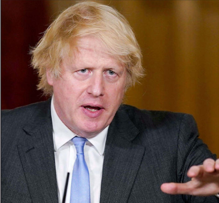
رئيس الوزراء البريطاني بوريس جونسون

هذا المجال. وأكد رئيس وزراء بريطانيا على موقف بلاده كما ورد في البرلمان البريطاني وفي مقاله، الداعم لتحقيق السلام على أساس "حل الدولتين". وشدد على ضرورة الالتزام بتطبيق قرارات الشرعية الدولية، ورفض أي إجراءات تقوم بها إسرائيل لضم أراض فلسطينية باعتبارها مخالفة لقرارات الشرعية الدولية. وأكد على أهمية إعادة إحياء عملية السلام، وقال إن بلاده "ستواصل دعم السلام وعلى استعداد لبذل جهود في هذا الإطار". وانتهى الاتصال بين الرئيس عباس وجونسون