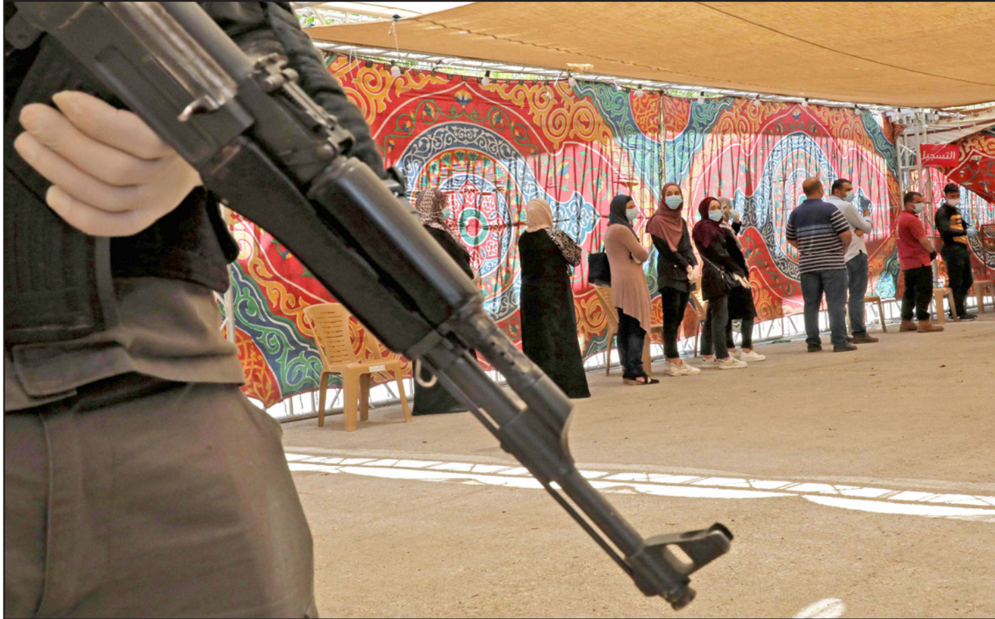
طابور في الخليل ينتظر دوره لفحص كورونا

7 محلات تجارية لتصويب وضعها القانوني، كذلك أغلقت الشرطة في محافظة جنين 66 محلا تجاريا، وحجرت 13 مخالفة لأشخاص منها 3 بحق منشآت لعدم الالتزام بحالة الطوارئ، كما ضبطت 5 مركبات غير قانونية، وأعلنت وزارة الاقتصاد الوطني أن الرقابة ستكون مشددة وصارمة على المنشآت الاقتصادية الصغيرة وبعض الحرف التي تسمح لها بالعمل وفق قرار مجلس الوزراء للتأكد من الالتزام بالإجراءات الوقائية حفاظا على سلامته وصحة المواطن، وطلبت الجميع بالتعاون والتكاتف من أجل حصر الوباء.