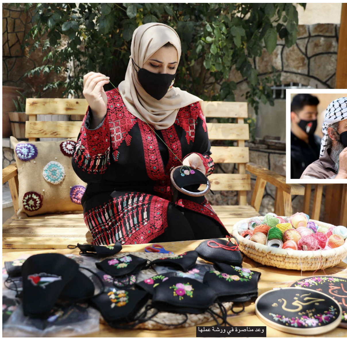
وعد مناصرة في ورشة عملها