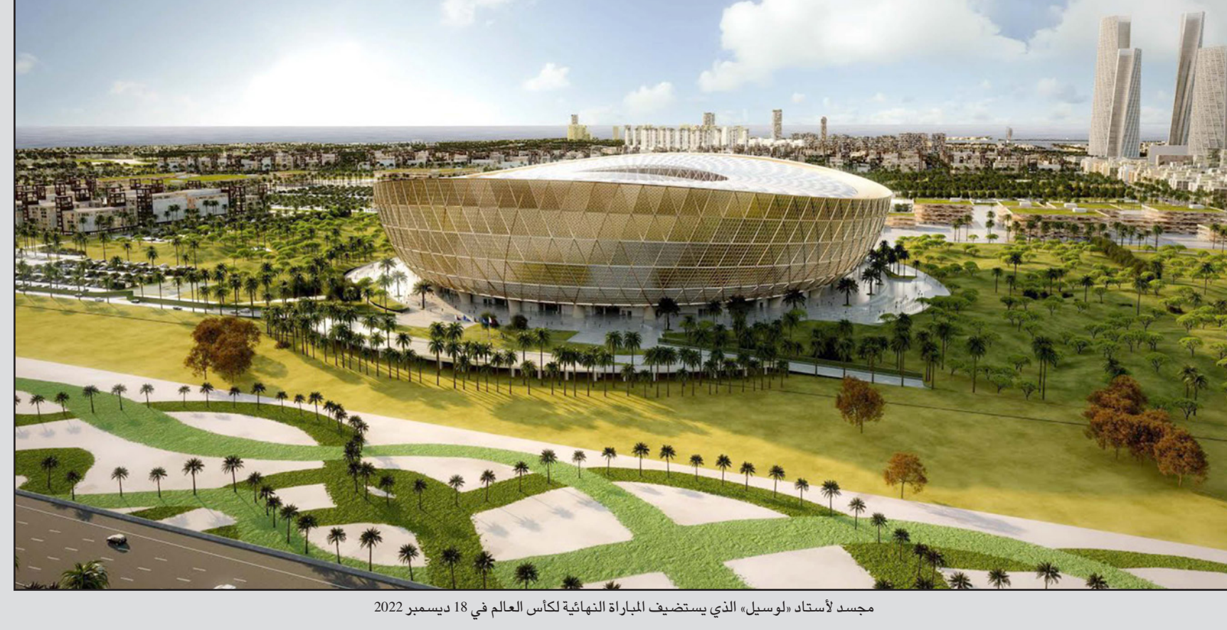
مسجد لأستاذ «لوسيل» الذي يستضيف المباراة النهائية لكأس العالم في 18 ديسمبر 2022