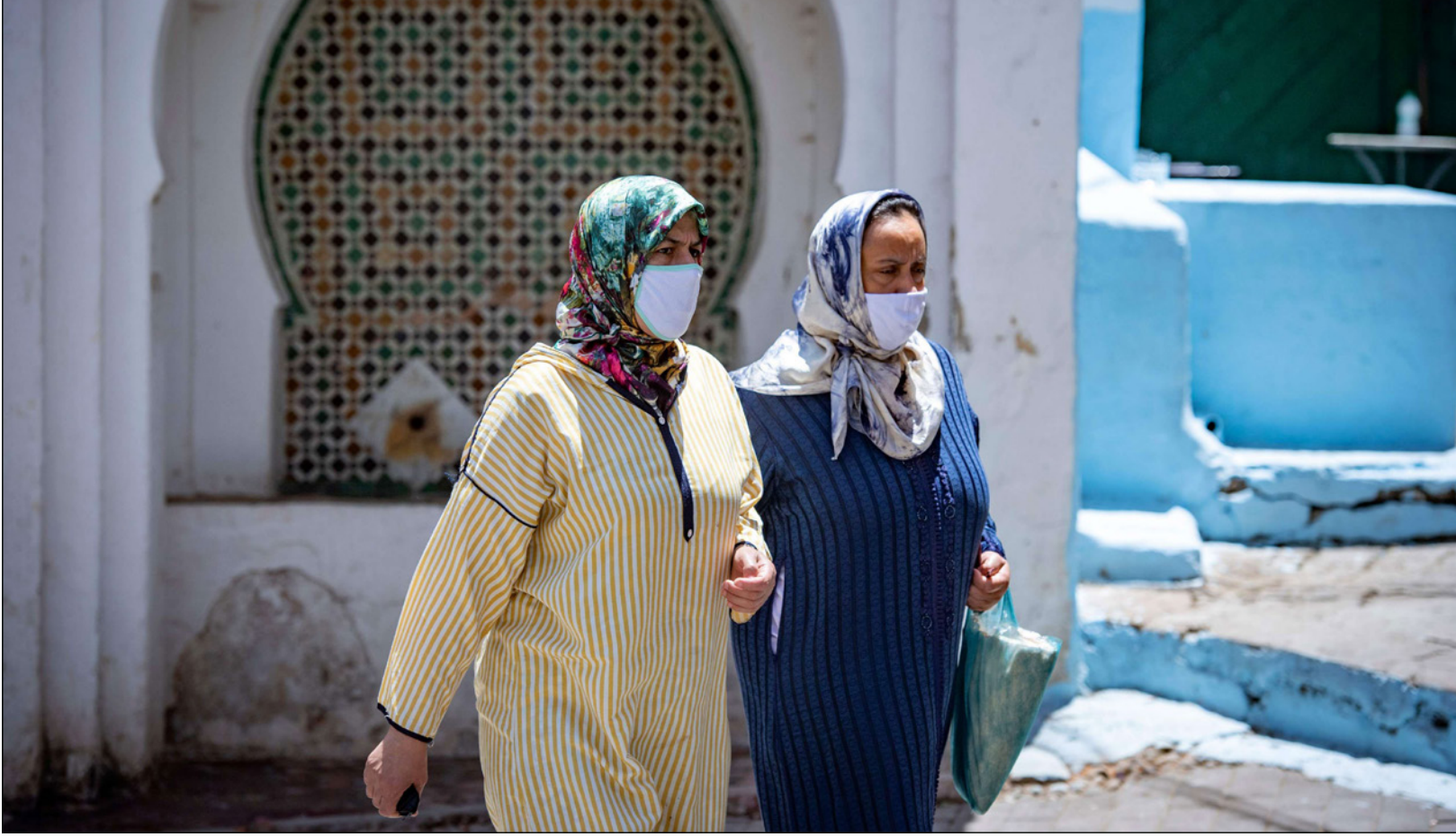
مغربيتان ترتديان كمامتيهما لالتقاء فيروس كورونا

من أي تراخ فيما يتعلق باحترام الإجراءات الصحية والوقائية المتخذة من قبل السلطات العمومية للحد من انتشار فيروس «كوفيد-19»، وقال: «تم في الآونة الأخيرة تسجيل تراخ في الإجراءات الصحية، مشدداً على ضرورة الاحترام الصارم للتدابير الوقائية التي توصي بها السلطات (ارتداء الأقنعة، واحترام التباعد) من أجل الحد من انتشار فيروس كورونا المستجد، مشيراً إلى أن «الحالة الوبائية قد شهدت تحيراً في المغرب وفي العالم كله، معبراً عن انشغاله بارتفاع حالات الوفيات وحالات الإصابة بالحمى بـ«كوفيد-19».