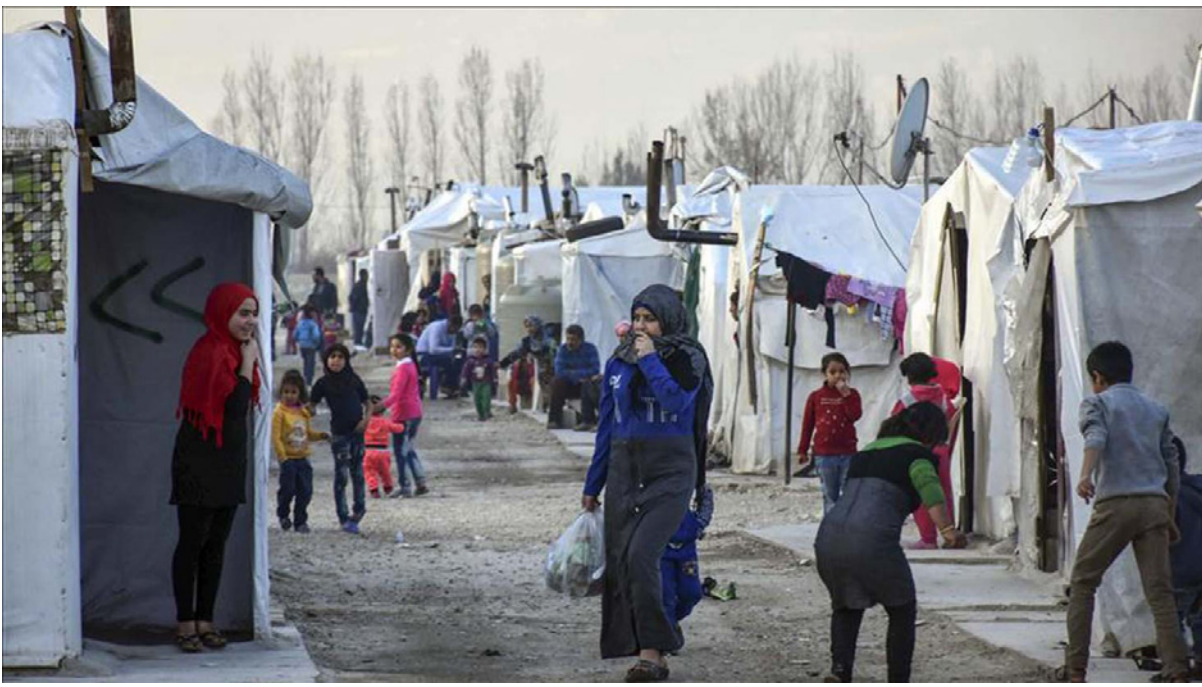
لاجئون سوريون في أحد مخيمات شمال لبنان

وواسع النطاق، ويتعين على صانعي السياسات الدوليين تشجيع الحكومة اللبنانية على السماح للاجئين بالعمل، وتعزيز إمكاناتهم، وتمكينهم من إعالة أنفسهم، وتخفيف ضحّ مطلوب بشدة لأموال جديدة على اقتصاد البلاد. ونكر التقرير أن الحكومة اللبنانية تأمل في أن يؤدي حصولها على قرض من «صندوق النقد الدولي» إلى إنقاذها. وأضاف «لكن حتى بعد تلقي القرض، سوف يحتاج لبنان إلى إعادة التفكير في أسس اقتصاده وكيف يعمل مواطنيه والناخبين في البلاد». يذكر أنه في كل عام تزداد قروض تمويل مساعدة للاجئين السوريين، وليست هناك دلائل على أن اللاجئين السوريين سيعودون إلى بلادهم في أي وقت قريب. وفي رأي الباحثين فإنه مع بدء تراجع الدعم من جانب الجهات الدولية المانحة، من الممكن أن يظهر ممثلو القطاع الخاص كشركاء مفيدين، وإذا ما قام صانعو السياسات اللبنانيون بخلق ظروف مساعدة، ودعم مرونة الشروعات الصغيرة والمتوسطة، والسماح للاجئين بالعمل من الممكن أن يشارك المؤسسات الدولية بصورة أكبر في لبنان بمجرد خروجه من الأزمة وأن تكشف القرص التي تغيب اللبنانيين المحتاجين واللاجئين على السواء. ويضيف الباحثان «يستطيع القطاع الخاص الإسهام في التوصل لحلول لهذه الأزمات بعدة طرق، أولاها، أن الاستثمار في مجتمعات الناخبين ومجتمعات اللبنانيين المحتاجين سوف يحفز زيادة فرص العمل، ويخلق فرص عمل جديدة للاجئين والمجتمعات المضيفة لهم على السواء،