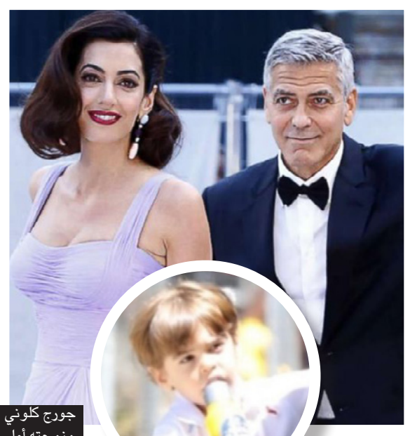
جورج كلوني وزوجته أمل