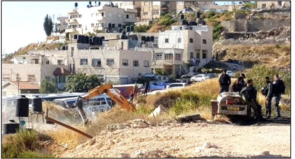
سلطات الاحتلال تهدم منزلاً في حي جبل المكبر في القدس المحتلة

وقت كانت فيه قوات الاحتلال تشدد إجراءات الدخول على المصلين المقدسين. وجميع هذه الاعتداءات والإجراءات التي تنفذها قوات الاحتلال تمس بالإجراءات الواقية التي تتخذها الجهات الرسمية الفلسطينية، للحد من تفشي فيروس "كورونا"، وتندرج بوضوح المرص بشكل كبير إلى داخل السجون، وهو ما من شأنه أن يحدث كارثة.