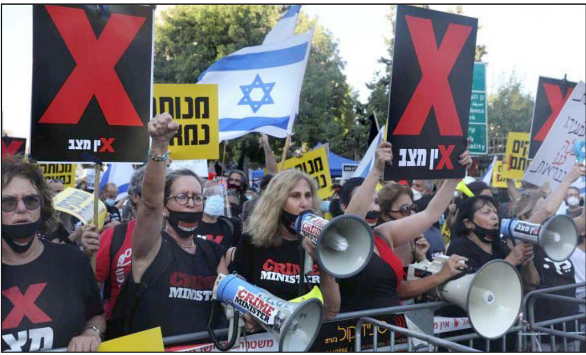
متظاهرون ضد نتيناهو من أمام مكان إقامته يوم أمس

علينا ألا ننسى: صحيح أن رئيس الوزراء سواء في حينه واليوم أيضاً، هو ذاته من