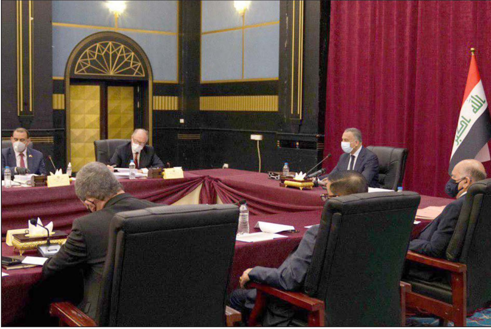
رئيس الوزراء العراقي مصطفى الكاظمي يتراس جلسة مجلس الوزراء في محافظة البصرة أمس

وحسب البيان، فقد «تدارس مجلس الوزراء المواضيع الاستراتيجية وأعماله، واتخذ جولة من القرارات التي تخص محافظة البصرة، تبدأ بالموافقة على المضي بإجراءات التعاقذ، في مشروع ماء البصرة الكبير، الذي يعد من أبرز المشاريع الاستراتيجية والمشاريع في العمل بإحالة مشاريع محافظة البصرة في الأعمال التابعة الدورية لمشروع ماء البصرة الكبير، عبر لجان متخصصة من أجل التنسيق مع وزارة الإعمار والإسكان والبلديات والأشغال العامة، ومن بين القرارات الحكومية «تكليف وزارة