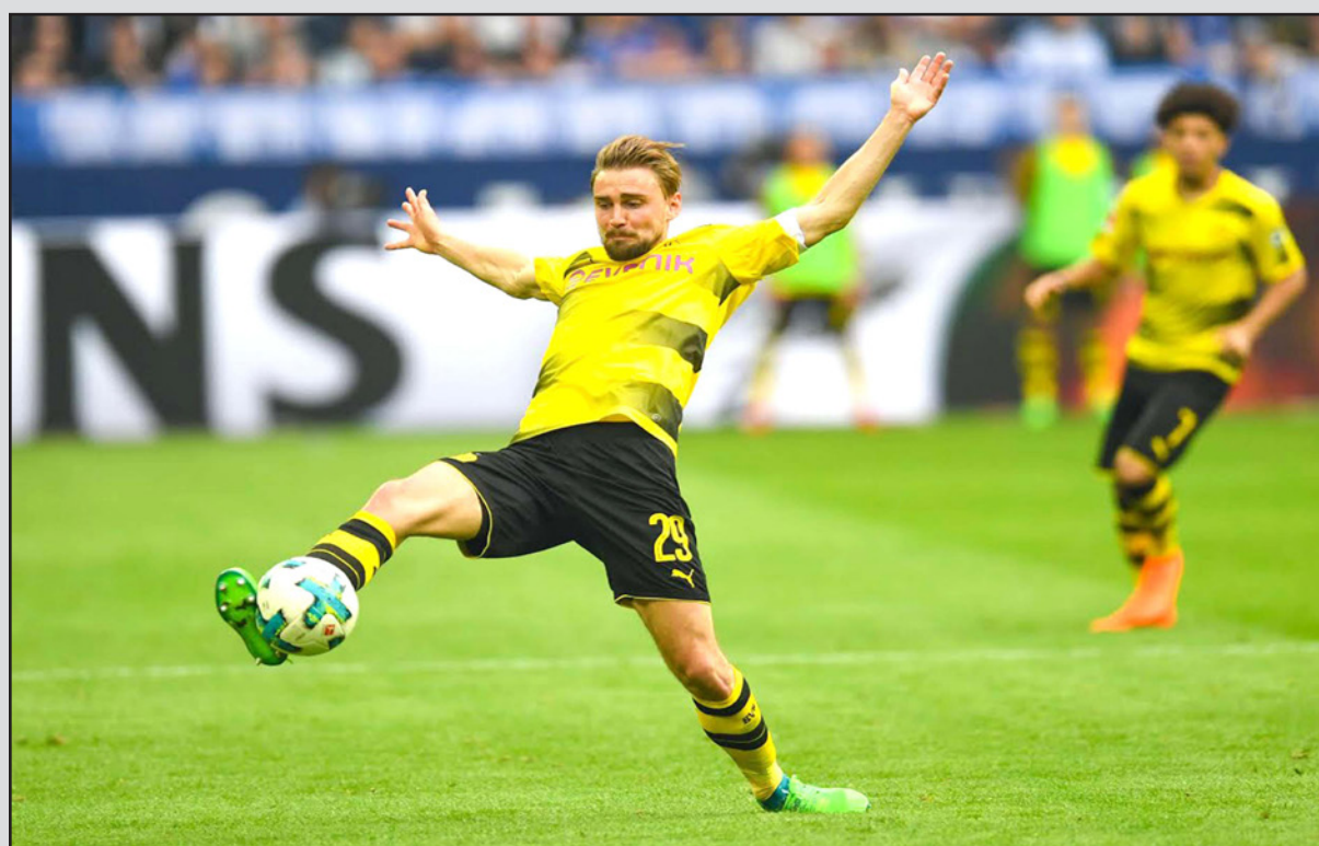
شميلزر قد يغيب عن دورتموند شهورا طويلة