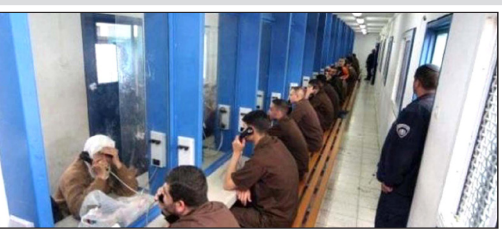
صورة أرشيفية لأسرى خلال زيارات أهلهم التي أوقفها الاحتلال بسبب كورونا

صحة الجمهور من أجل التنكيل بالأسرى. وتشير «أمستي» إلى أن لزيارات العائلات للأسرى تأثيراً كبيراً على الوضع النفسي للأسرى القاصرين، الذين يقعون، بطبيعة الحال، في ظروف إغراق صعبة، ولذلك يمكن اعتبار منع الزيارات دون مبررات طبية واقعية كإساءة وتضييق مسطر.