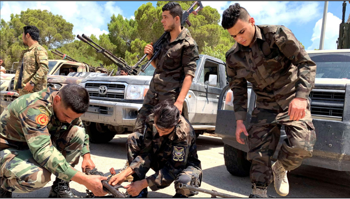
عناصر من القوات التابعة لحكومة الوفاق الليبية تستعد لمعركة مدينة سرت

مجدداً، محور النزاع بين السلطتين المتنافستين. ومساء الإثنين، أعلن مجلس نواب طريق المؤيد لحفر أنه أجاز لمصر التدخل عسكرياً في ليبيا «لحماية الأمن القومي» للبلدين، مشدداً على أهمية تضافر جهودهما من أجل «دحر المحتل الغازي» التركي. وقال البرلمان، ومقره طريق (شرق) في بيان، إن للقوات المسلحة المصرية حق التدخل لحماية الأمن القومي الليبي والمصري إذارات أنّ هناك خطراً داهماً وشيكاً يطال أمن بلدينا». ودعا البيان إلى تضافر الجهود بين الشقيقتين ليبيا ومصر بما يضمن دحر المحتل الغازي ويحفظ أمننا القومي المشترك ويحقق الأمن والاستقرار في بلادنا والمنطقة». وذكر في بيانه بما تمثله جمهورية مصر العربية من عمق استراتيجي لليبيا على كافة الأصعدة، الأمنية والاقتصادية والاجتماعية على مر التاريخ، وبما تمثله المخاطر الناجمة عن الاحتلال التركي من تهديد مباشر لبلادنا ودول الجوار، وفي مقدمتها الشقيقة مصر. وكان الرئيس المصري عبد الفتاح السيسي حذر في 20 حزيران/يونيو من أنّ تقدم القوات الموالية لحكومة الوفاق الوطني التي تسيطر على طرابلس والمدعومة من تركيا نحو الشرق سيدفع بلاده إلى التدخل العسكري المباشر في ليبيا. وقال في كلمة عقب تفقده وحدات الجيش