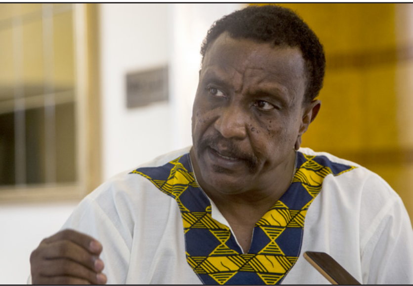
نائب رئيس الحركة الشعبية شمال السودان ياسر عرمان

وأكد عرمان أن قوى الحرية والتغيير «تعاني من مصاعب، وتحتاج أن تعيد إنتاج نفسها وتقديمها على نحو جديد، وتوسع القاعدة الاجتماعية للثورة والقوى المشاركة في عملية الانتقال السياسي».