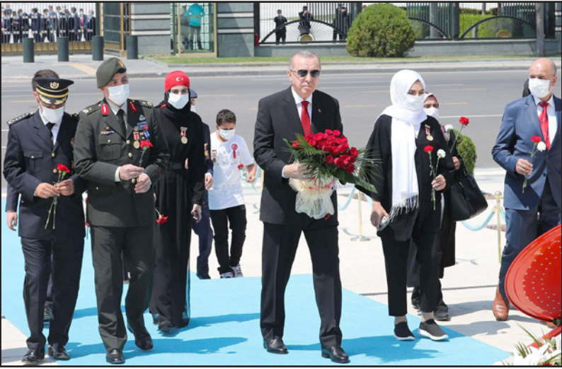
الرئيس التركي رجب طيب اردوغان يضع اكليل من الزهور على قبر الجندي المجهول في أنقرة

فتح اللغ غولن، أو زعيم جماعة الخدمة، أو ما أطلق عليه لاحقا الكيان الموازي وتنظيم غولن الإرهابي، هو تنظيم متكامل تفاعل داخل أروقة الدولة بقوة كبيرة جدا وعلى مدار سنوات طويلة، نحو الجهور، وللحفاظ على الديمقراطية فيها،