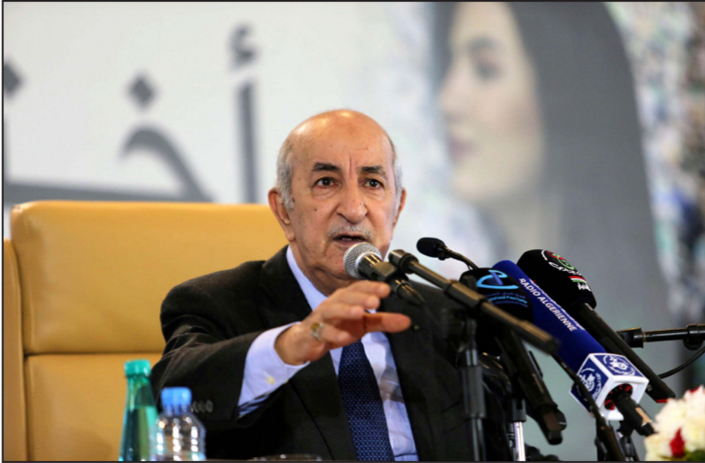
الرئيس الجزائري عبد المجيد تبون

سيحاسبون ويعاقبون. وذكر الرئيس أن هناك قوى تعمل في الخفاء ضد الاستقرار السياسي، وأنها ما زالت تسعى إلى خلط الأمور، وحذراً تلك الأطراف بأن