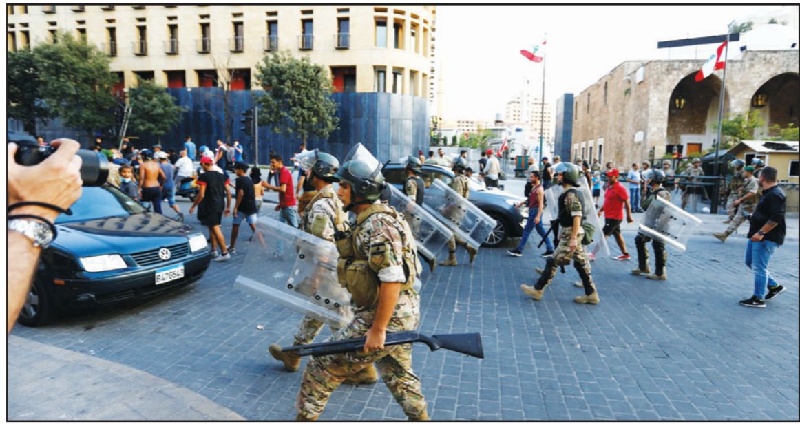
جنود لبنانيون ينتشرون خلال احتجاج على المسؤولين عن انفجار مرقا في بيروت

وعليه، قرر وزير المالية في حكومة تصريف الأعمال اللبنانية غازي وزني، منع بيع العقارات ذات الطابع التراثي والتاريخي في البلاد.