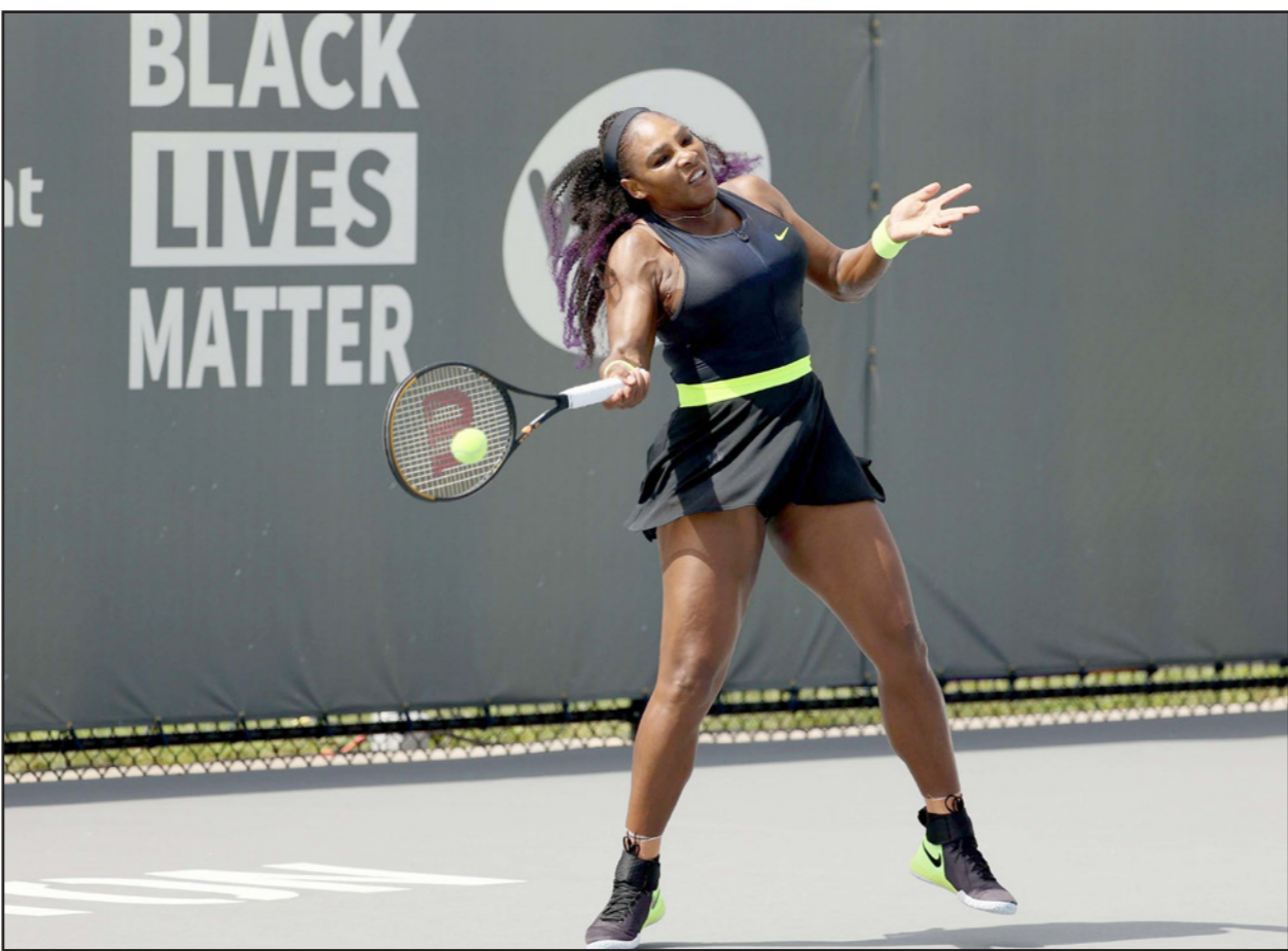
المخضمة سيرينا وليامز فازت بصعوبة على برنارد بير

■ كنتاكي (الولايات المتحدة) - رويترز: عادت المخضمة سيرينا وليامز إلى منافسات التنس لأول مرة منذ أزمة جائحة كوفيد-19، وفازت بصعوبة على برنارد بير 4-6 و6-4 و1-6 لتصبح على موعد في الدور الثاني مع شقيقتها فينوس في بطولة للالعاب الأولويات في كنتاكي في الولايات المتحدة. وكانت سيرينا على بعد خمس نقاط من الخسارة أمام مواطنها الأمريكية بير، التي تلعب باليد اليسرى، في المجموعة الثانية لكنها أظهرت روحها القتالية العالية وخرجت بالانتصار لتصبح على موعد في الدور الثاني مع شقيقتها فينوس غير الصنفة التي فازت بـ 3 و6 و2 على فيكتوريا أزيينكا الصنفة الأولى عالمياً سابقاً.