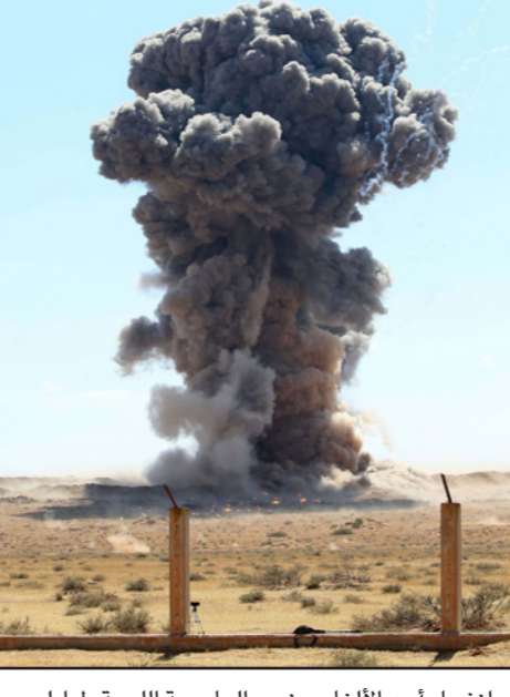
انفجار أحد الأناغم جنوب العاصمة الليبية طرابلس

■ طرابلس – الأناضول: قالت وزارة الدفاع الليبية إن إحصائية ضحايا الأناغم، التي زرعتها ميليشيات الجيوش الانقلابية خلفت حفتر، جنوبي العاصمة طرابلس ومدينة سرت (شمال وسط) ارتفعت إلى 55 وفاة. وأضافت، في بيان، أن إجمالي الضحايا ارتفع إلى 162، بينها 55 وفاة و107 مصابين، وأشارت إلى أن الضحايا بينهم 64 من المختصين في مجال إزالة الألغام، و98 من المدنيين، ولقتل إلى أن الإحصائية تم تسجيلها في الفترة بين 22 أيار/ مايو الماضي و9 آب/ أغسطس الجاري. وفي 13 تموز/ يوليو الماضي، حذرت الأمم المتحدة من المخاطر الناجمة عن الأناغم والمتفجرات التي زرعتها ميليشيات حفتر جنوبي طرابلس وفي سرت، وقالت إن 52 شخصاً لقوا مصرعهم وأصيب 96 آخرون بسبب هذه الأناغم. وشنت ميليشيات حفتر، بدعم من دول عربية وأوروبية، عدواناً على العاصمة الليبية طرابلس، انطلاقاً من 4 نيسان/ أبريل 2019، قبل أن يحقق الجيش الليبي انتصارات على أبرزها تحرير كامل الحدود الإدارية للعاصمة، ومدىنتي ترمونة وبنسي وليد، وكامل مدن القضاء الغربي، وقاعدة الوطية الجوية، وبلدات بالجبل الغربي.