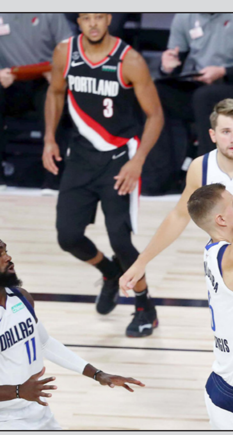
داميان ليلارد نجم بورتلاند يحاول التسجيل في سلة دالاس مافريكس

■ فلوريدا (الولايات المتحدة) - أ ف ب: سجل نجم بورتلاند ترايل بلايزرز داميان ليلارد 61 نقطة ليفوز فريقه في المباراة. وابتدأ الفوز ارتقي بورتلاند إلى المركز الثامن آخر المراكز المؤهلة إلى البلاي أوف متقدماً على ممفيس غريزلز. ويتلقى صاحباً المركزين الثامن والتاسع في مباراة فاصلة لتحديد هوية المتاهل منهنما، ينذكر أن فوز بورتلاند على بروكلين نتس الخميس سيمضئ له خوض المباراة الحاسمة للمتاهل إلى البلاي أوف.