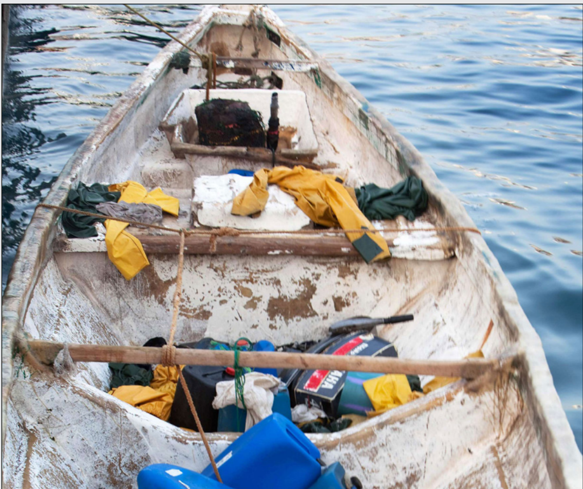
مركب صغير بها ممتلكات المهاجرين المحتلمين في ميناء لوس كريستيانوس الإسبانية

مصرعهم على طريق المحيط الأطلسي يعادل نصف عدد الوفيات أو المفقودين المسجل في البحر المتوسط، بحسب المنظمة الدولية للهجرة. وأشار سانثانا إلى أن عدد المهاجرين كان أقل بكثير مما كان عليه في عام 2006، عندما تم تسجيل أكثر من 30 ألف وافد، لكن صعوبة العبور بالغة.. لا تأتي القوارب فحسب من المغرب وموريتانيا، البلدين الأقرب إلى جزر الكناري، ولكن من السنغال وغامبيا، على بعد أكثر من ألف كيلومتر إلى الجنوب، أيضا. وعلى متن السفينة، يتزايد عدد النساء والأطفال، والوفيات في البحر. وأوضح سانثانا: «يصل الناس في قوارب مكتظة وغير آمنة يقودها أشخاص يفتقرون إلى الخبرة»، وتشير غريكو إلى أن «كل شيء قد تدهور، فالقوارب مهترئة، من دون قبطان، وأحيانا ليس». وتضيف أن غالبية المهاجرين يفرون من الساحل وغرب إفريقيا، لكن بعضهم يأتون من مناطق أبعد، من جنوب السودان أو من أرخبيل جزر القمر في المحيط الهندي.