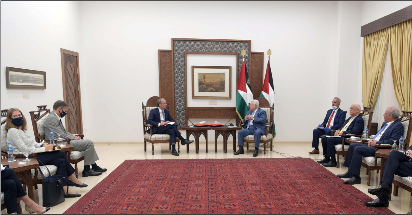
الرئيس عباس يستقبل وزير الخارجية البريطاني دومينيك راب في مكتبه في رام الله

ولفت في الوقت ذاته إلى التزام الفلسطينيين بالتصديق على المصالحة "العالي"، ومواصلة المساعي للمصالحة الفلسطينية وصولاً للاتحادات العامة. ورحب الرئيس عباس بضيافته، متمنياً الزيارة في هذه الظروف التي وصفها بـ