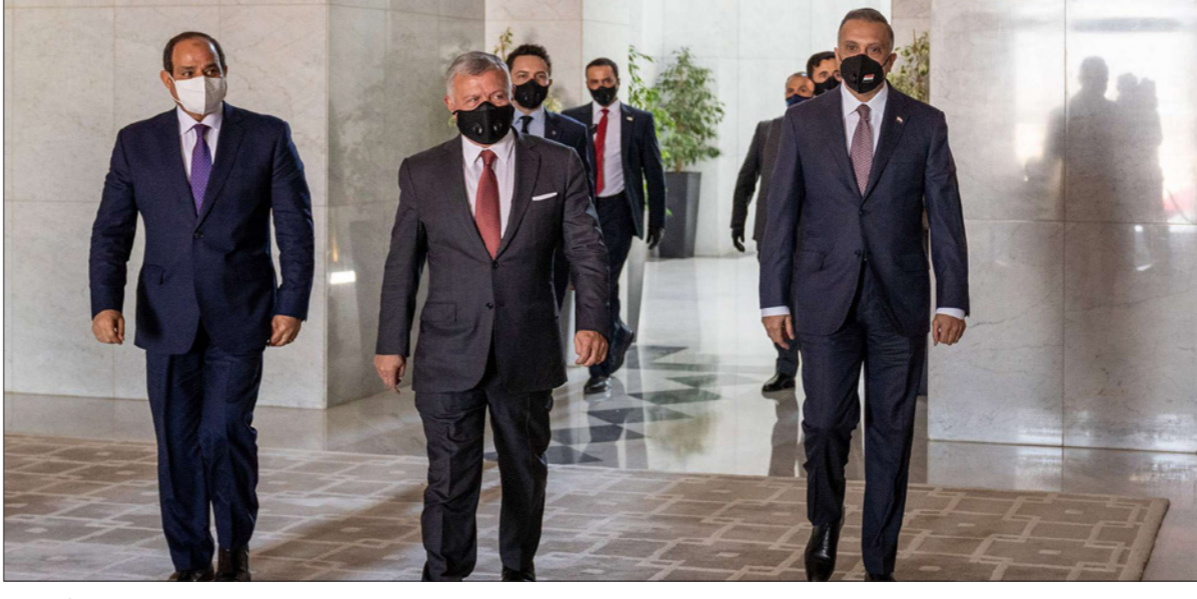
الملك عبد الله الثاني (وسط) يصل مع الرئيس المصري عبد الفتاح السيسي (يسار) ورئيس الوزراء العراقي مصطفى الكاظمي لعددة القمة في عمان أمس

في كل حال، هو اللقاء الأول الذي جرى ترتيبه بعناية على المستوى الثلاثي بعدما دخل الكاظمي إلى معادلات الترتيبات الإقليمية والدولية، قمة عمان الثلاثية التي تم الإعلان عنها ظهر أمس الثلاثاء في وجود الكاظمي والرئيس المصري عبد الفتاح السيسي تنجز اليوم بتدبيرنا معاهدة الجديد في الوقت الذي وصل فيه إلى العاصمة الأردنية ولم يظهر بعد علناً على الأقل النجم والسفير الأمريكي المنتظر هنري وستر، صاحب