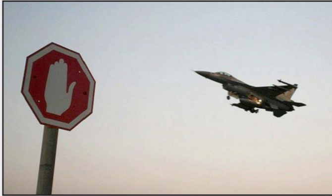
صفقة اف 35 ليست للبيع لدول شرق أوسطية

ونجاحها في هذا المجال جدير بالإشارة كما ويساعد على تركيز الجهود على التهديد الإيراني تجاه إسرائيل. على أي حال، تتمتع إسرائيل باستقرار أمني غير مسبوق يستند إلى قوة الجيش الإسرائيلي وصورة القوة الأمنية العامة. أما الدول العربية فيعد أن جربت وفشلت في إبداء إسرائيل، فقد توصلت إلى الاستنتاج بأنه لا توجد إمكانية كهذه، ومن الأفضل التعاون معها في جملة من المجالات، وعلى رأسها الأمني والعسكري والسياسي. ولكن حذرًا لن ننسى إسرائيل، ولو للحظة صغيرة، بأن تضعف قوتها قد يسحب البساط من تحت أقدامها في المدى البعيد، وعليه فقد نشأ ارتباط متير للاهتمام ومهم مع الولايات المتحدة التي تعهدت وتتعهد بحفظ التفوق العسكري النوعي لإسرائيل. ويندرج هذا التعهد عميقاً في القانون الأمريكي الذي يلزم الولايات المتحدة بالحفاظ على التفوق العسكري النوعي لإسرائيل. والمعنى العملي لذلك هو أن الولايات المتحدة تتمتع كسياسة، ملزمة بها حسب القانون، عن بيع منظومات سلاح متطورة وذكية للدول العربية حتى ولو ارتبطت إسرائيل بعلاقات سلام. وثمة مثال ملموس على ذلك، وهو طائرات «إف 35» التي تزود بها سلاح الجو في السنوات الأخيرة، ويدير الحديث في واقع الأمر عن منظومات قتالية ذكية ومتعددة الأبعاد تمنح إسرائيل تفوقاً ساحقاً إلى جانب عناصر قوة أخرى. وعليه، فقد قررت الولايات المتحدة، علناً أيضاً، بأن ليس في نيتها بيع هذه الطائرات لدول عربية رغم الإغراء