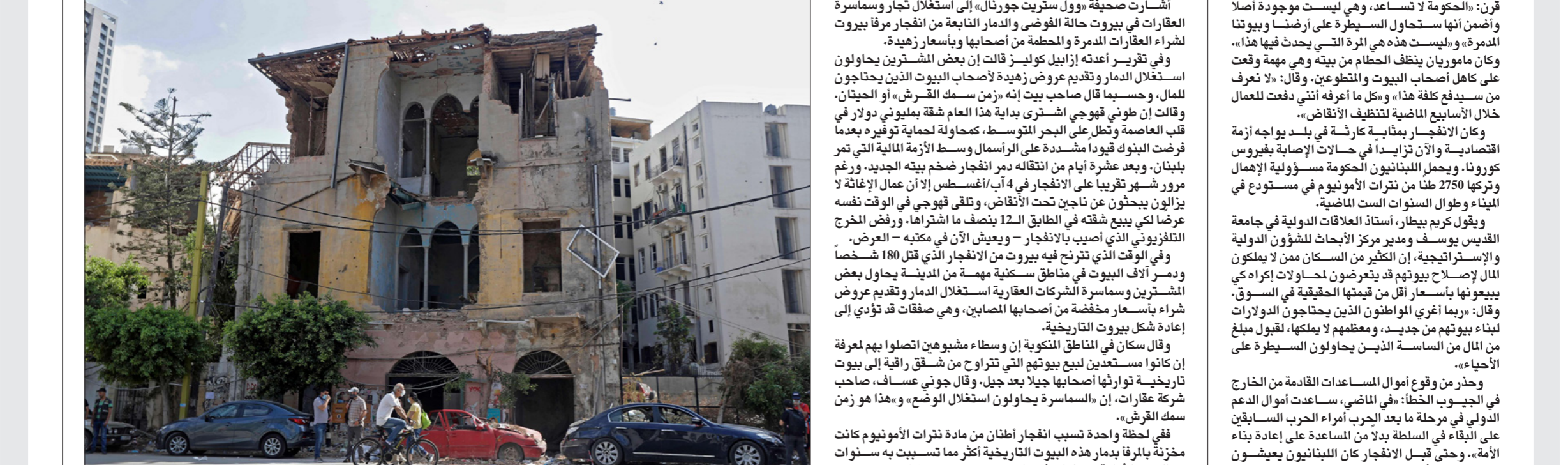
أحد الأبنية اللبنانية التقليدية في حي الجميزة تضرر بشدة بسبب انفجار ميناء بيروت

التصديدين للناس الضعاف: «بيت مدرم له قيمة أكبر من ملايين الدولارات في المصارف اللبنانية»، وقال موسي إن الطب على العقارات لن يخف حتى يحصل لبنان على حزمة إنقاذ من صندوق النقد الدولي يمكن أن تمنح الاقتصاد استقراراً. وفشلت المفاوضات قبل الانفجار لعدم اتفاق الحكومة اللبنانية على ززمة الإصلاح، وتعيش النخبة اللبنانية وسقط جدل حول الحكومة الجديدة بعد استقالة حكومة حسان دياب في أعقاب الانفجار. ويرى موسي إن الطب على العقارات سيزداد لأن الانفجار زاد من الغفوض حول منظور الإصلاح اللبناني، وقال سمسار إنه تلقى مكاتبات من مشتر محتمل ووعود بعملية جيدة لو استطاع إقناع أصحاب البيوت التاريخية للحمة لبيع بيوتهم. وقال إن المشتري كان يخطط لتحويل البيوت للإيجار من خلال نظام «إير بي إن بي» أو فرشها عشق سكانية ولكنه رفض.