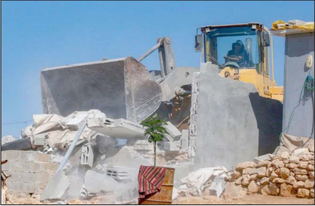
جرافة إسرائيلية تهدم منشآت لفلسطينيين في يطا، أرشيف

■ يصعب أن يخطر بالبال أن المستوطنين السياسيين والأمني في إسرائيل لا يدركان أن هدم منازل العائلات الفلسطينية المشاركة في إرهاب قاتل ضد مواطنين أو في قتل جنود الجيش الإسرائيلي في إطار مقاومة الاحتلال العنيفة، لا يخلق في الجانب الفلسطيني أي رعب لاستمرار الإرهاب والمقاومة. بالعكس، ثمة افتراض بأن إسرائيل تعرف الحقيقة الواضحة والقاطعة، التي أحسن جدوع لبني وصفها قبل فترة قصيرة عندما قال: «من بين أنقاض كل بيت هدمته سيتمو المخرّب القادم» («هأرتس»، 8/13)، لكنها تواصل عملية الهدم رغم هذا الإدراك، ولأسباب عميقة لا تسمح لها بالكف عنها.