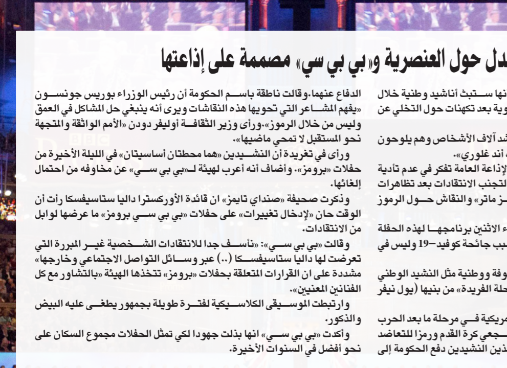
صورة من الأرشيف لحظة «برومز» السنوية

لندن - أف ب: أعلنت هيئة «بي بي سي» أنها ستسحب أغاني وطنية خلال الألفية الأخيرة من سلسلة حفلات «برومز» السنوية بعد تكمينات حول التخلي عن هذا التقليد خشية من أن تنعت بالعنصرية. وخلال الألفية الأخيرة من حفلات «برومز» ينشد آلاف الأشخاص وهم يلوحون بأعلام بريطانية «رول بريتايا» ولاند أوف هوب أند جلوري. لكن صحيفة «صنداى تايمز» ذكرت أن هيئة الإذاعة العامة تفكر في عدم تأدية هذين الشندين المرتبطين بالاستعمار والعيودية لتجنب الانتقادات بعد تظاهرات مناهضة للعنصرية مرتبطة بحركة «بلاك لايفز ماتر» والنقاش حول الرموز الاستعمارية في المملكة المتحدة. وأعلنت «بي بي سي» في نهاية المطاف مساء الإثنين برنامجها لهذه الحفلة الأخيرة التي تقام هذه السنة عبر الإنترنت بسبب جائحة كوفيد-19 وليس في قاعة «رويال البرت هال» في لندن. وأشارت إلى أن الحفلة ستشجع «عناصر مألوفة ووطنية مثل الشنيد الوطني وستضم محطات جديدة تختزل أجواء هذه المرحلة الفريدة» من بنينا (يول نيفر ووك الون). وهذه الأغنية مستقاة من مسرحية غنائية أمريكية في مرحلة ما بعد الحرب العالمية الثانية، أصبحت في بريطانيا نشيداً للشجي كرا القدم ورمزاً للتعااض خلال مرحلة الجائحة، وكان احتمال التخلي عن هذين الشندين دفع الحكومة إلى