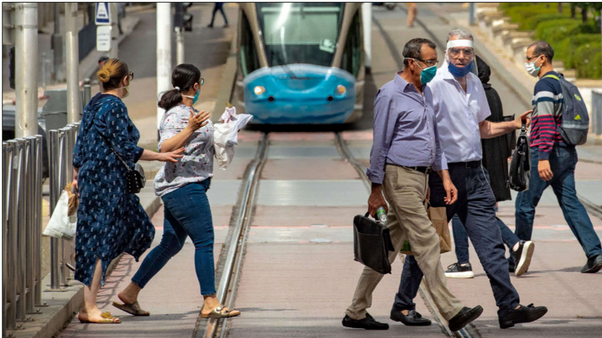
مغاربة ملتزمون بالاجراءات الاحترازية في أحد شوارع العاصمة الرباط

وأثار ارتفاع عدد الوفيات القلق بعد أن وصلت 888 في موجة وفيات يومية صارت إحصاءها بقي العشرات، بعدما كان المغرب يسجل أياما بدون وفيات، أو حتى تسجيل وفاة واحدة أو اثنتين. وكان للدار البيضاء النصيب الأكبر من الوفيات المسجلة التي ارتفعت نتيجة تسجيل أعلى الإصابات وتزايد عدد الحالات الصعبة والدرجة بمستشفيات العاصمة الاقتصادية للمغرب. وبلغت مدينة الدار البيضاء في أول يوم واحد 53 وفاة، متأثرة بفيروس كورونا المستجد، وهي الحصيلة التي استغرقت جهة الدار البيضاء - سطات بأكملها تزيد من ثلاثة أشهر لتسجلها، حيث