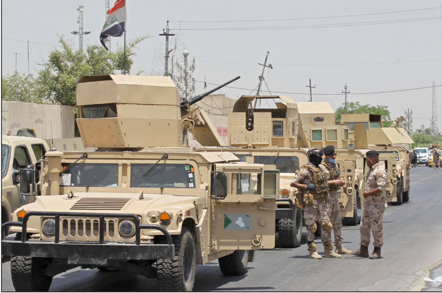
عناصر من الجيش العراقي