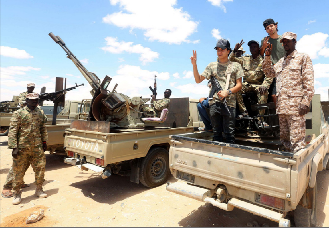
قوات تابعة لحكومة الوفاق الليبية

استجابة السلطات الليبية (في إشارة لحكومة الوفاق المعترف بها دولياً) لمكافحة كورونا الشخصية. وقال إن الأمم المتحدة قدمت مساعدات إنسانية إلى أكثر من 243 ألفاً، بينهم 66 ألف تازح داخلي و58 ألف مهاجر ولاجئ في ليبيا، منذ مطلع العام الجاري، وفق المؤتمر ذاته. وفي سياق متصل، جدد الاتحاد الأوروبي، الإثنيتين، التأكيد على دعم اتفاق وقف إطلاق النار في ليبيا. جاء ذلك خلال لقاء سفير الاتحاد الأوروبي لدى ليبيا، آسن بوجيا، مع رئيس المجلس الرئاسي الليبي فائز السراج، طرابلس، وفق بيان المكتب الإعلامي للمجلس الرئاسي. وأكد "دعم الاتحاد الأوروبي لمبادرة المجلس الرئاسي التي أعلنتها في 21 أغسطس/ آب لتحقيق الأمن والسلام في ليبيا". فيما شدّد السراج على "تمسك حكومة الوفاق (معترف بها دولياً) بالتوثبات الوطنية في معالجة الأوضاع في ليبيا". وأضاف أن المبادرة الليبية تحتاج إلى دعم الاتحاد الأوروبي خلال مراحلها المختلفة بدءاً من وقف إطلاق النار، وصولاً إلى إجراء الانتخابات البرلمانية والرئاسية في البلاد. وبحث الجانبان "ملف الهجرة غير الشرعية، وسبل دعم المرافق الصحية في البلاد، تداعيات هذه الظاهرة"، حسب البيان ذاته.