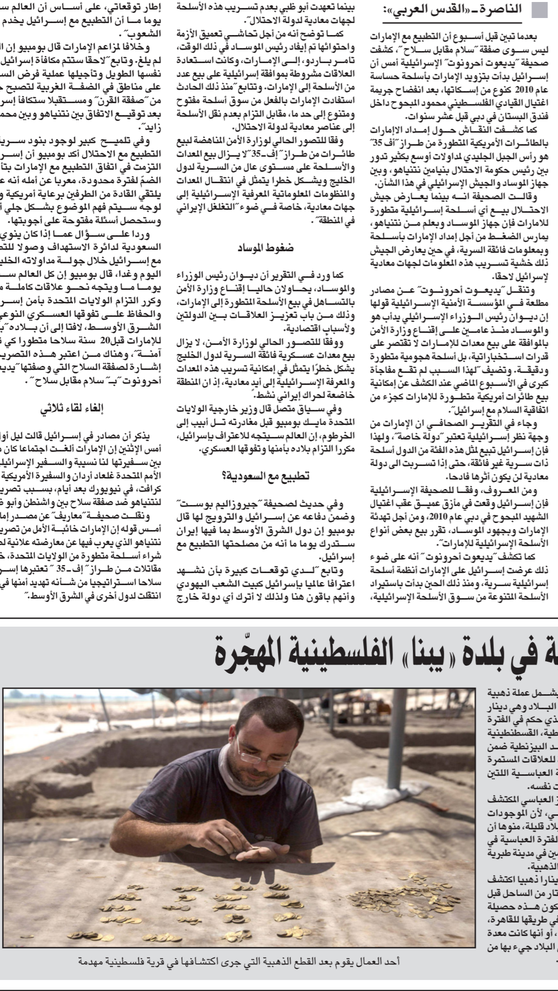
أحد العمال يقوم بعد القطع الذهبية التي جرى اكتشافها في قرية فلسطينية مهجرة

وتساءل ما الذي منعه من العودة لكنزها؟ لا أحد يعلم ويوسعتنا فقط التخمين، اكتشاف مثل هذه الدنانير الذهبية يهدد الكمية الكبيرة هو أمر نادر والحفريات الأثرية لا