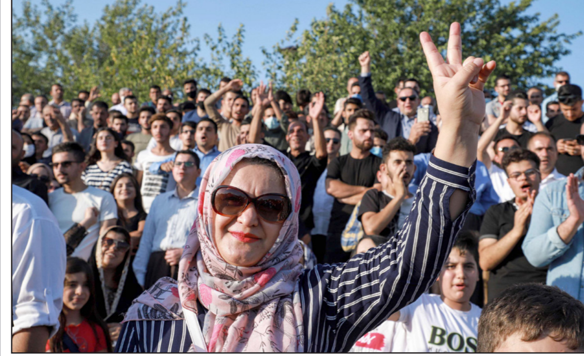
من تظاهرات كردستان