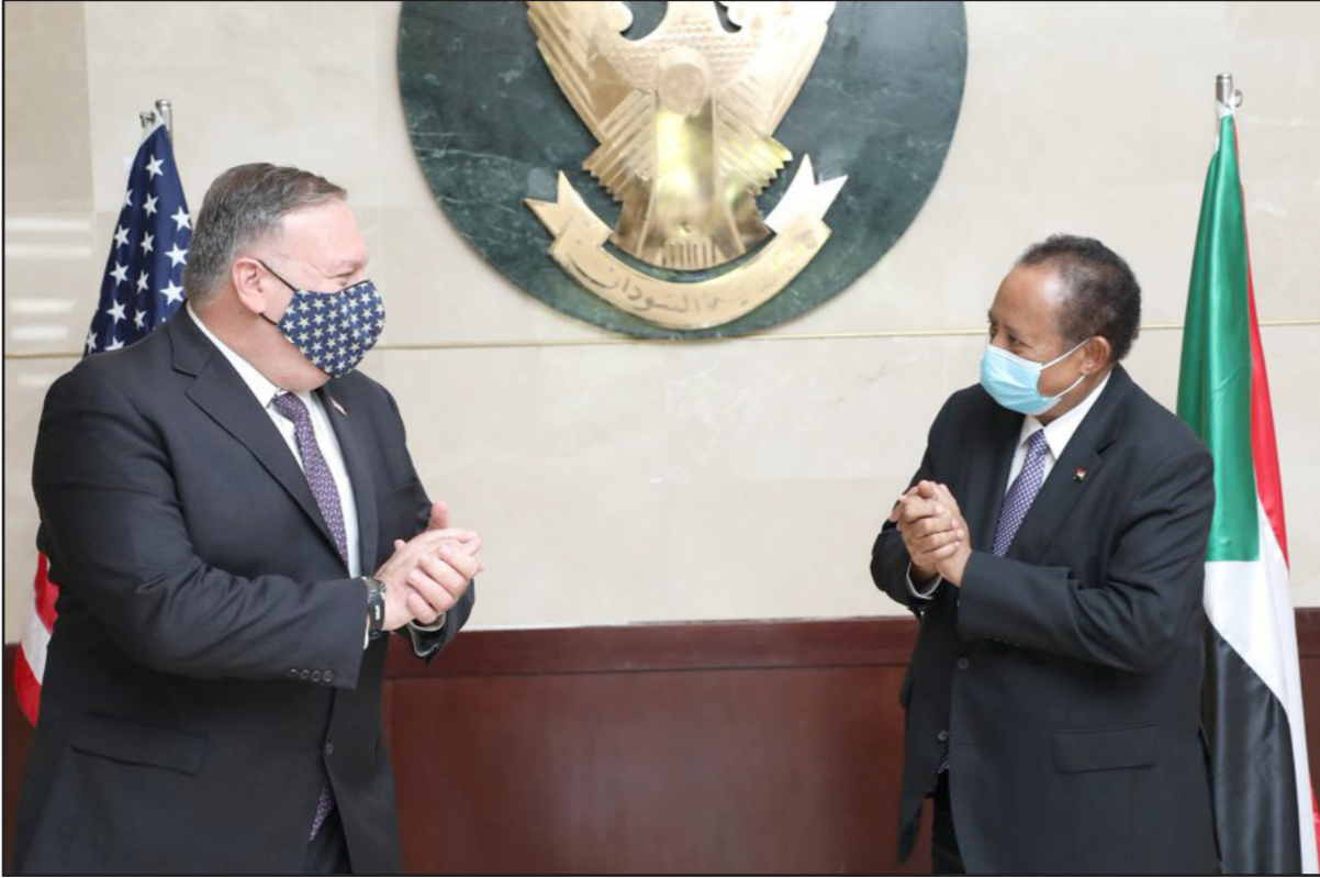
رئيس الحكومة السوداني عبد الله حمدوك خلال لقائه وزير الخارجية الأمريكي مايك بومبيو في الخرطوم

وطالب البرهان خلال لقاء بومبيو برفع اسم بلاده من قائمة الدول الراضية للإرهاب. وأعرب، حسب بيان مجلس السيادة، عن سعادته بـ«التقدم» الذي تشهده العلاقات بين السودان والولايات المتحدة.» كما أعرب عن سعادته بدعم الولايات المتحدة لثورة ديسمبر/ كانون الأول 2018، التي أطاحت بالرئيس العزل عمر البشير. واعتبر دعم واشنطن للفترة الانتقالية (بدات قبل أشهر، عقب الإطاحة بالبشير) يسرع عملية التحول الديمقراطي في البلاد. بومبيو أعرب عن سعادته بزيارة الخرطوم، واصفا إياها بـ«همة» وأن الولايات المتحدة تقف مع السودان في كافة القضايا واندماجه في المحيط الإقليمي والدولي.