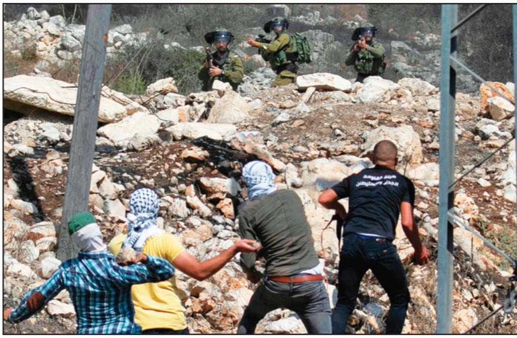
جنود إسرائيليون يوجهون بناذقتهم نحو شبان فلسطينيين خلال احتجاجات في بلدة كفر قدوم أمس

المتعلقة بعمل الجمعية المستقبلية». وأضافت أنه «بعد استكمال الاستعدادات لهذا المؤتمر وتوزيع الدعوة على المنتسبين وبعض منظمات المجتمع المدني والدبلوماسية الشعبية، وقبل أربع وعشرين ساعة فقط من انعقادها، رفضت العديد من القاعات استضافتها». (تفاصيل ص 23)