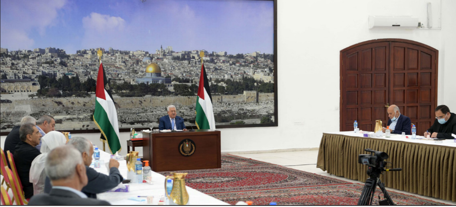
اجتماع اللجنة المركزية لحركة فتح برئاسة أبو مازن في رام الليلة قبل الماضية

كما كان متوقفا، صادقت اللجنة المركزية لحركة فتح، في اجتماع لها برئاسة الرئيس محمود عباس، بالإجماع على التوافقات التي تمت بين وفدنا ووفد من حركة حماس وآخرها قبل عدة أيام. وقد جرى التوصل إليه بعد عدة جلسات حوار في مقر القنصلية الفلسطينية في مدينة اسطنبول التركية، والخاصة بإنهاء الانقسام وإجراء الانتخابات. وخلال اجتماع اللجنة المركزية جرت مناقشة عدة ملفات سياسية مهمة، وبعد ان استمعت إلى تقرير من جبريل الرجوب، وروحي فتوح، وعزام الأحمد عن الحوارات التي جرت مع حركة حماس وفصائل منظمة التحرير الفلسطينية واللقاءات في كل من اسطنبول والدوحة والقاهرة وعمان، صادقت اللجنة المركزية بالإجماع على التوافقات. وأكدت أن «مسار الشراكة الوطنية خيار استراتيجي لا رجعة عنه»، مؤكدة أهمية «الشراكة النضالية» في مواجهة «صفقة القرن» والضم والتطبيع من خلال «المقاومة الشعبية»، والعمل على تطوير هذه الشراكة في كل مكونات النظام السياسي في السلطة ومنظمة التحرير الفلسطينية الممثل الشرعي والوحيد للشعب الفلسطيني من خلال الانتخابات الحرة والنزيهة بالتنسيق مع المجلس الوطني للأراضي الفلسطينية وعلى رأسها القدس الشرقية، وصولاً إلى إقامة الدولة الفلسطينية المستقلة وعاصمتها القدس الشرقية.