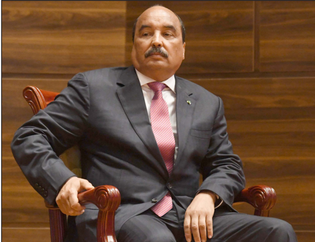
الرئيس السابق محمد ولد عبد العزيز

على عواهنه، بعدم شرعية المتابعات القضائية المباشرة ضد موكلهم، وإثارة حق هذا الأخير في التزام الصمت المطبق أمام ضباط وكلاء الشرطة القضائية المكلفين بالتحقيق معه، وادعاء عدم شرعية قيام الجمعية الوطنية بتشكيل لجان تحقيق برلمانية، والقول بأن الإجراء المانع لموكلهم من الخروج خارج حدود ولاية نوآكشوط الغربية يعد تعدياً على حرية". ومن أجل إثارة الرأي العام حول مختلف هذه النقاط، يضيف البيان، يستغرب فريقنا من تلويع زملاتنا بحري به في نظره أن يمنح لرئيس الجمهورية السابق حصانة مطلقة وإفلاتاً تاماً من العقاب حتى من جنح وجرائم الخاضع للقانون العام، مع أن مقتضيات المعتمد عليها نصت حرفاً على أن "رئيس الجمهورية ليس مسؤولاً عن الأفعال التي يرتكبها أثناء ممارسة وظائفه إلا في حالة الخيانة العظمى" فينتص من ذلك أن هذه الحصانة مقيدة في حدود مادية جلية فهي تمنح لرئيس الجمهورية ما دام في مأموريته فقط وللأعمال التي تدخل في إطار ممارسة وظائفه حصراً. وأضاف: "هل من المستعجب بحال من الأحوال ربط ممارسات الفساد والجرائم العديدة المماثلة لها من جنح وجنابات غسل الأموال، التي هي موضوع التحقيق الحالي، بالممارسة العادية لوظائف رئيس الجمهورية على النحو المحدد في المادة 30 وما تلاها من الدستور؟ وعلاوة على ذلك، هل تحتاج المصادر، ولا تلد عليه التحقيقات ولا الإجراءات المتخذة وبينها منع مسار السابق من التحرك خارج منطقة سكنه، ولكم محامو الدفاع عن الدولة في بيانهم، الذي ظلت القدس العربي نسخة منه، أن "محامي رئيس الجمهورية السابق في السيطرة المذكورة أعلاه بقرجات اللامية تتنازل، تكرر القول، إلقاء للكلام