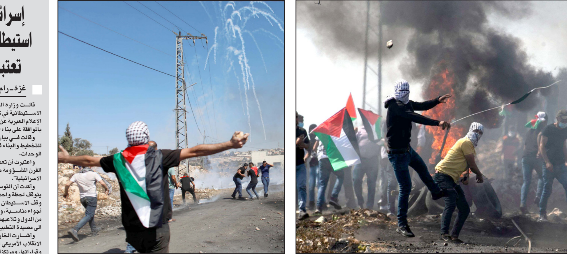
مواجهات في كنف قدوم شمال الضفة وفي الخليل

وأكد على استمرار الموقف الفلسطيني الراض لكل المخططات الرامية لتصفية القضية الفلسطينية، وقال «لن نحاور أحداً على أرضية ما تسمى بصفقة القرن، والحوار الوحيد الذي نقبل به هو ذلك المستند إلى الشرعية الدولية والهادف إلى إنهاء الاحتلال وإقامة الدولة الفلسطينية المستقلة وعاصمتها القدس الشرقية على حدود الرابع من يونيو/ حزيران 1967». ونصح الجاغوب الوزير الأمريكي بـ«عدم