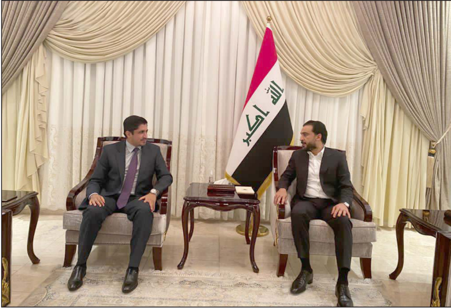
رئيس البرلمان العراقي محمد الحلبوسي مستقبلاً أمس القيادي في المشروع العربي مصطفى الكبيسي

وأكدت النائية مها الجنابي، أنها لا تنتمي لأي مشروع