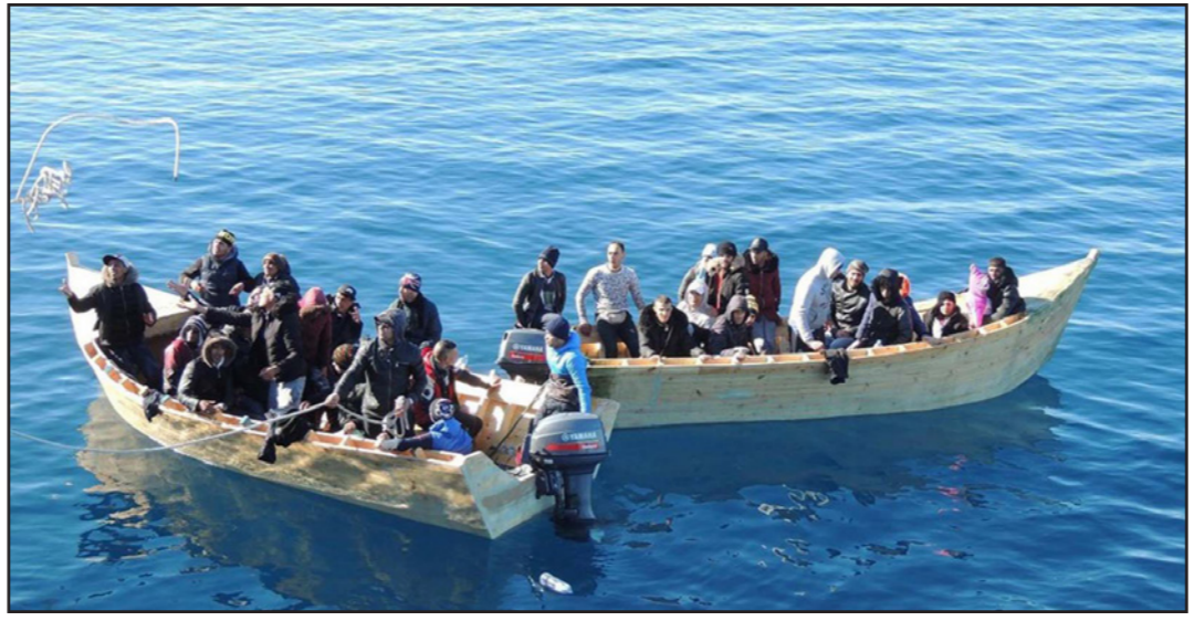
انقاذ مهاجرين غير شرعيين قبالة السواحل الجزائرية

الجزائر - د ب أ: قضت محكمة جزائرية أمس الثلاثاء، بالسجن لمدة شهرين نافذين في حق 3 أشخاص جرى اعتقالهم عشية الاستفتاء الشعبي على الدستور الذي نظم في أول تشرين ثاني/ نوفمبر الجاري. وذكرت صحيفة "الجزير" في موقعها الإلكتروني، أن محكمة الجنج في ولاية (محافظة) تيزي وزو أصدرت حكماً بالبراءة في حق 10 آخرين، مشيرة إلى أن ممثل النيابة العامة التمس السجن لمدة خمس سنوات سجناً نافذاً في حق الموقعين الـ 13 الذين اتهموا بـ"عرقلة الاستفتاء الدستوري". وأعلن المجلس الدستوري الخميس الماضي، عن النتائج النهائية للاقتراع الخاص بالاستفتاء على مشروع تعديل الدستور، مشيراً إلى أن نسبة المشاركة بلغت 23,83 في المئة. ووافق 66,80 في المئة من الناخبين على تعديل الدستور، فيما رفضه 33,20 في المئة.