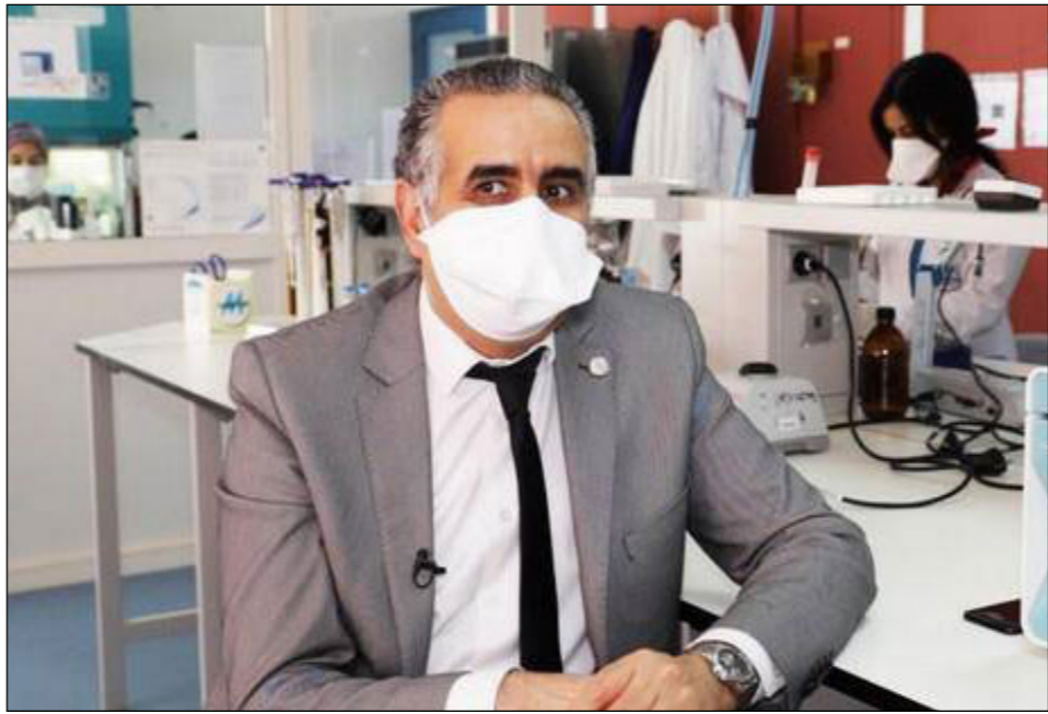
البروفيسور عز الدين الإبراهيمي

المتحدة بسبب أوضاعهما الداخلية، لا سيما الأخيرة التي تعيش حالة من الارتباك نتيجة رفض اعتراف الرئيس دونالد ترامب بخسارته، وتركز الأمم المتحدة على الدول الثلاث، وهي إسبانيا وفرنسا وروسيا، وانخرطت إسبانيا في دعم مساعي الأمم المتحدة بصفتها السابفة كدولة مستعمرة للصرخاء وتحت كثيرا على تعيين مبعوث محدد، وأن الصين قامت بتجريب اللقاح على سكانها، فأثبت فعاليته، مشددا أن ما جرى تداوله من مزاعم تدعي أن اللقاح يتوفر على شريحة تمكن من التجسس وبمراقبة تحركات المواطنين يعتبر كلاما غير منطقي. في السياق نفسه، أفادت صحيفة «الأحداث المغربية»