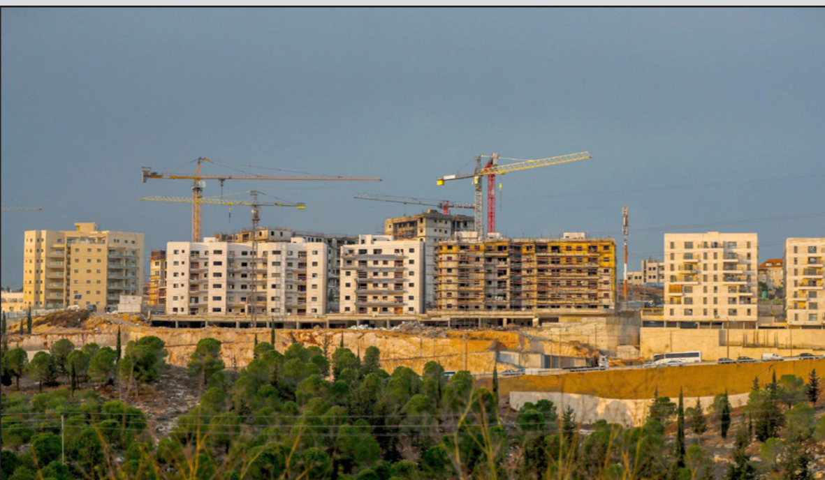
أعمال البناء جارية في مستوطنة رامات شلومو