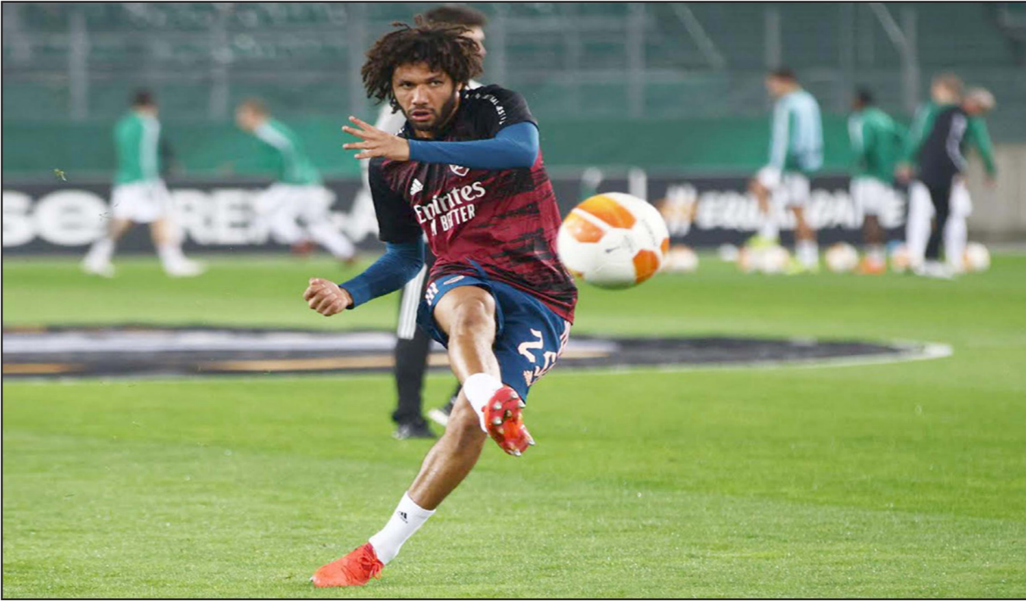
النتي نجم منتخب مصر وأرسنال آخر ضحايا فيروس كورونا في عالم كرة القدم

■ عواصم - الأناضول: ضرب فيروس كورونا بقوة عالم كرة القدم، ففي الأيام الماضية، موقعا الكثير من الإصابات في اللاعبين حول العالم، وبينهم نجوم عالميين. وأعلنت اتحادات كرة القدم في العديد من دول العالم، إصابة لاعبين وحراس فرق شهيرة بالفيروس، ما أربك الملاعب وأصابها بشلل مؤقت قبيل بطولات ومباريات ودية.