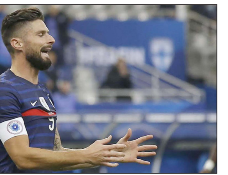
جيرو يعاني من قلة اللعب مع تشلسي ما يؤثر على وجوده مع المنتخب

وجاءت ثلاث نتائج إيجابية يوم الاثنين لاعبي