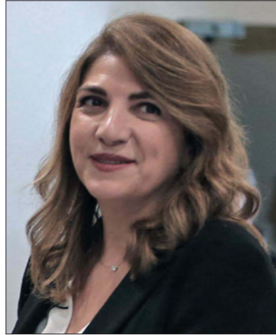
وزيرة العدل ماري كلود نجم

وفي إطار المواقف، جذّه «تكتل لبنان القوي» الذي انعقد برئاسة باسيل دعوته «للاِسراع في تشكيل حكومة إنقاذ تنفّذ البنود الإصلاحية التي تضمّنتها المبادرة الفرنسية وتحصّن الاستقرار والتضامن الوطني في مرحلة هي من أخطر المراحل التي تمرّ بها منطقة الشرق الأوسط وسط مؤشرات عدّة متناقضة وغير مطمئنة»، واعتبر «أن موقفه المسهل تابع من إدراكه لخطورة الوضع، ولذلك يشدّد على أن يتم اعتماد معيار واحد في عملية تشكيل الحكومة ليتأمن لها أوسع دعم نيابي وسياسي وشعبي ممكن» مؤكداً أن حكومة الأخصاص والخبرة والكفاءة لا يمكنها أن تعمل وتنجح بمعزل عن مبدأ حفظ التوازن الوطني الذي لا يمكن تجاوزه أو التنازل عنه. وفي إشارة إلى رغبة الحريري بتسمية الوزراء المسيحيين نَبّه التكتل «إلى وجود معطيات أكيدة ومؤشرات مقلقة توحي برغبة البعض بالعودة 15 سنة إلى