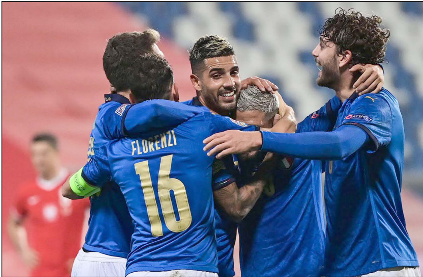
لاعب المنتخب الإيطالي يحتفلون بالانتصار على بولندا في الجولة الماضية

■ ساراييفو - أف ب: اختتمت اليوم منافسات دور المجموعات من نسخة الثانية لدوري الأمم الأوروبية، حيث سيكون مصير إيطاليا وبلجيكا بين يديهما حين تواجهان البوسنة والدنمارك تواليا في الموعدين الأولى والثانية. وتدخل إيطاليا الجولة السادسة الأخيرة بعد فوزها المستحق الأحد على صيفتها بولندا 2-0 صفر في ريجيو إميليا. وأبقت إيطاليا على سجلها الخالي من الهزائم للمباراة الحادية والعشرين تواليا، بينها سلسلة من 11 فوزا متتاليا (إنجاز قياسي للمنتخب)، وانتزعت الصدارة بفوزها الثاني في المجموعة وتحقق غياب مدربها روبرتو مانشيني لاصابته بفيروس كورونا الذي أبعاد أيضا الهدف تشيرو إيموبيلي عن تشكيلة غاب عنها العديد من العناصر مثل قلبى الدفاع ليوناردو بونوتشي وجورجيو كيليني. وبعدها فوجت فرصة الفوز في لقاء الذهاب الذي سيطرت عليه في غدانسك (صفر-صفر) قبل قرابة شهر، نجحت إيطاليا الأحد في الوصول إلى الشباك البولندية وظفت الصدارة قبل الجولة الختامية التي تحل فيها ضيفة على البوسنة الهابطة إلى المستوى الثاني بعد خسارتها الأحد أمام هولندا 3-1. وستضمن إيطاليا بطاقتها إلى الدور نصف النهائي بحال فوزها على البوسنة، بغض النظر عن نتيجة المباراة الثانية بين بولندا وصيفتها هولندا اللتين تملكان فرصة التأهل شرط خسارة