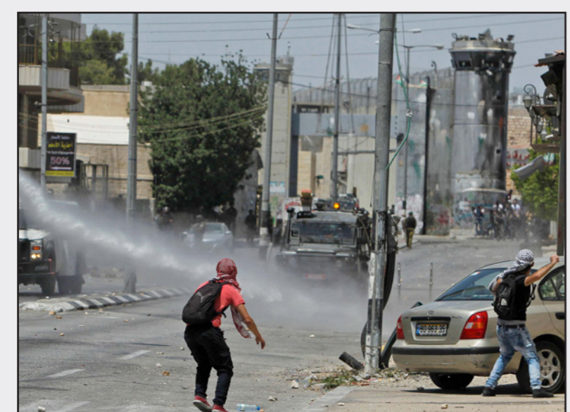
موجهات في الضفة

وحسب المؤسسة تتعين أهمية هذا الكتاب في جمعه شتات آراء ومواقف وسجلات عدد كبير من مثقفي فلسطين وكتاها في النصف الأول من القرن العشرين، وفي تبيان كيفية رد هؤلاء المثقفين من خلال الصحف والمؤلفات السياسية والفكرية المختلفة على الانتداب البريطاني وعلى الغزوة الصهيونية، وفي الوقت نفسه كيفية معالجة بعض القضايا الداخلية الخاصة بالاجتمع الفلسطيني وركته الوطنية، معتبرة أنه لم يكن من المهن الرجوع إلى عدد كبير من المصادر والراجع، من صحف وجلات ومؤلفات ويومييات ومذكرات