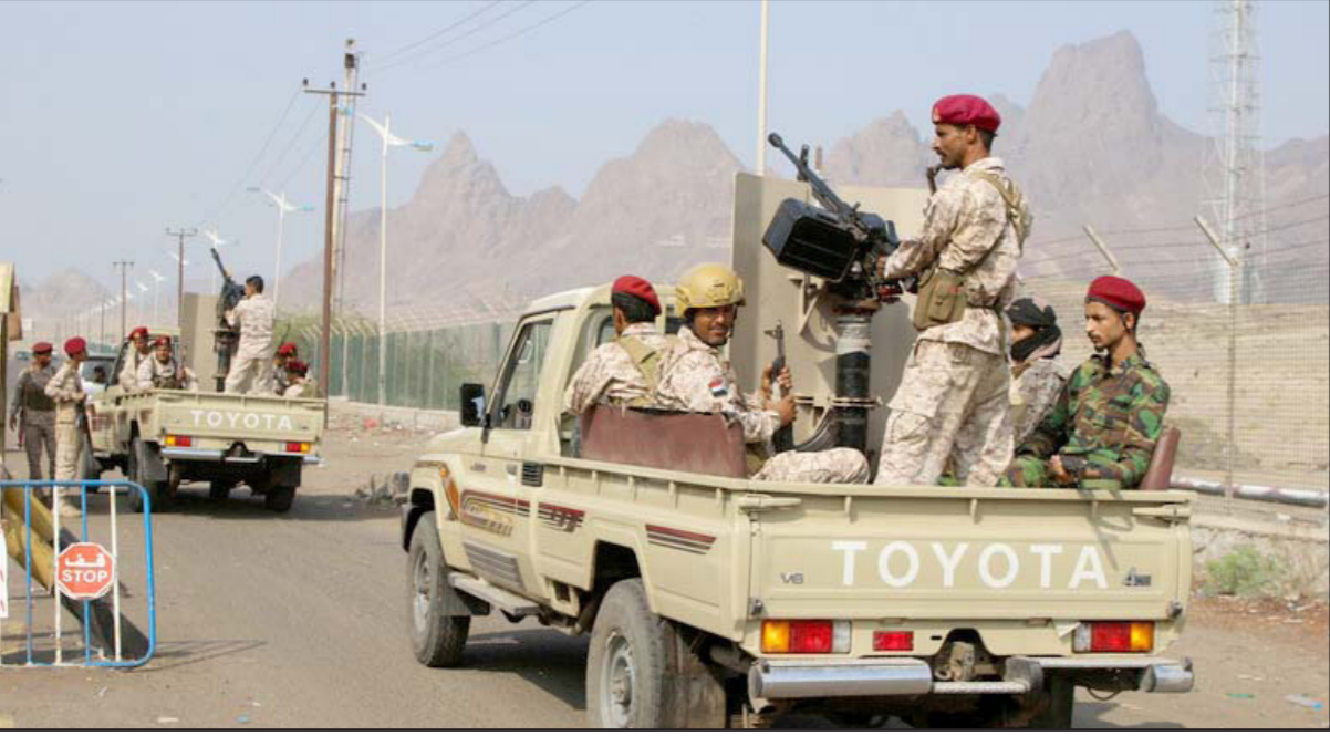
أرشيفية لعناصر ميليشيا الانتقالي المدعومة من الإمارات

يتعلق بالجانب العسكري والأمني والنسحاب ميليشياته من العاصمة الحكومية عدن، كشرط مشاركتها في الحكومة المزمع تشكيلها. وظل الرئيس هادي طوال الفترة الماضية يصر على ضرورة تطبيق الجانب العسكري والأمني من بنود اتفاق الرياض، وأن تشكيل الحكومة مرهون بإنهاء التمرد المسلح في محافظات عدن