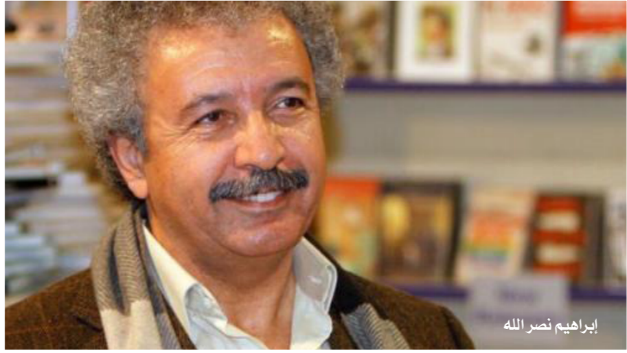
إبراهيم نصر الله

المنظور الإنساني، أو ضرورة تلقّي الشخصيات الروائيّة من حيث كونها شخصيات إنسانية، بعيداً عن نوعها الاجتماعي، يتكشف في تأكيد آخر المقالة أنّ «الظلم واقع على الجميع»، وأنّ «الحياة نفسها لا تقوم على فقر معادلة وهيبة كيد». لكنه قبل أن يختم بذلك، لم يهمل التحدّث عن الشخصيات النسائية «الرائعة بكل معنى الكلمة» في رواياته، الأمر الذي دفع ناقدة أن تكتب عن نساء زمن الخيول البيضاء الرائعات، بيد أنّ كاتبنا لا تزجّه الدراسات المتصورة حول صورة المرأة، ولا يمانع الكتابة عنها ما دامت شخصياتها النسائية ستُمدّح ويُقدّر عليها الثناء، يعني أنّه لا يتبني