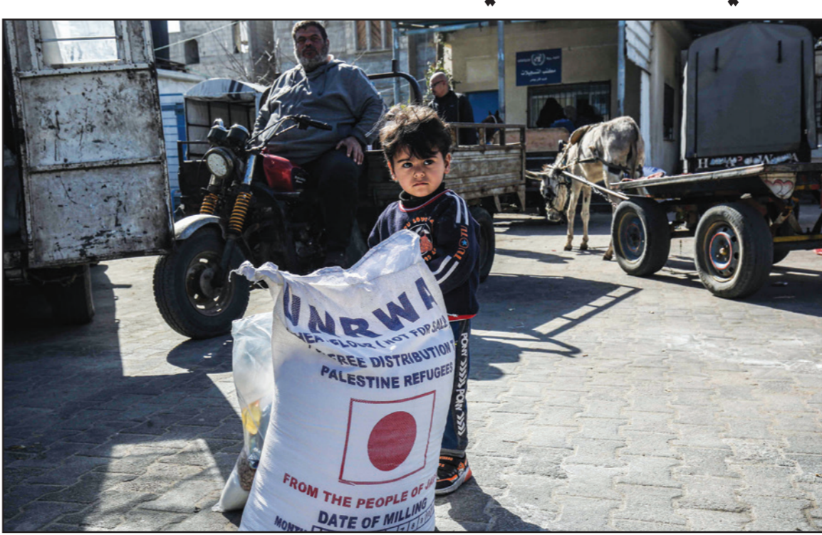
طفل فلسطيني يقف قرب كيس لحمين مع وصول الناس لاستلام دعم غذائي من وكالة الإغاثة في غزة

تعلّق بالفسطينيين فإن «القلق في إسرائيل هو من استئناف الضغوط الدولية على إسرائيل من أجل تقديم تنازلات للفسطينيين»