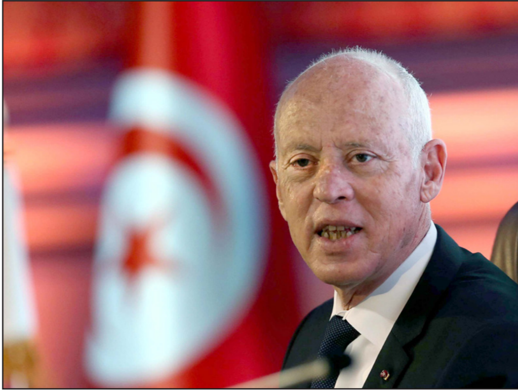
الرئيس التونسي قيس سعيد

وتساءل الكحلاوي بقوله: "لماذا تصطف عبيد موسى مع هؤلاء، أو الأرجح وراء هؤلاء؟ لأنها ببساطة مطلب لدى قوى أجنبية معادية للديمقراطية ومتعاطفة مع طروحات الاستبداد. موسى ليست وطنية تونسية، هي استنساخ كاريكاتيري للنموذج الوظيفي لبن علي، الذي كان من رواد التطبيع مع إسرائيل ومن أعمدة الاستبداد في المنطقة. عبيد موسى حسان طروادة المحر الإماراتي - السعودي - المصري الخائب والتافه.. آخر هزائمه انحصار ترامب، يختلف مع الإسلام السياسي، لكن على قاعدة الاختلاف ضمن الأجندة الوطنية والإطار الديمقراطي". وأضاف: "بالمناسبة، نظام بن علي، وحينها كانت عبيد موسى موظفة بصفة حزبية فيه، استضافت في شهر أكتوبر/ تشرين الأول سنة 2009 الشيخ القرضاوي بصفته رئيس اتحاد علماء المسلمين، وذلك بمناسبة اختيار القيروان عاصمة للثقافة الإسلامية. إذا كان القرضاوي إرهابياً فالأولى والأحرى أن يكون بن علي إرهابياً، وموظفوه ومنهم