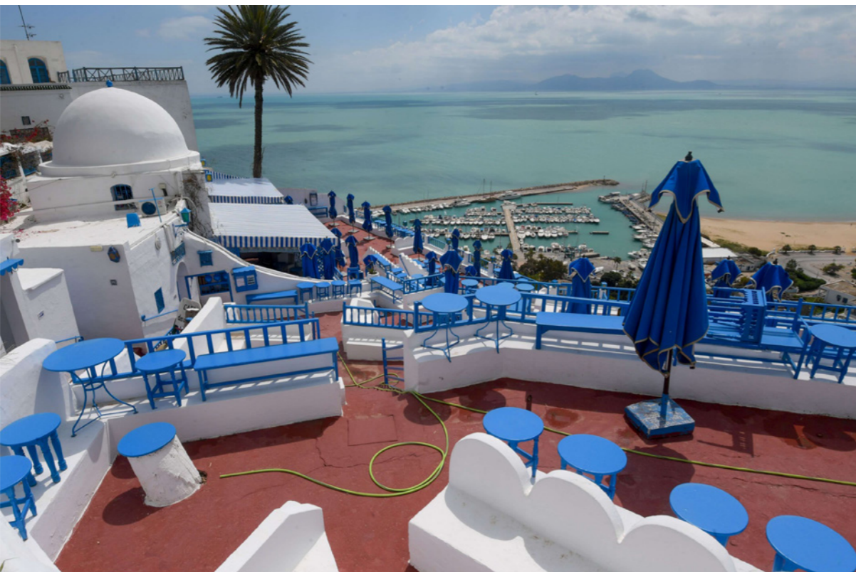
مقهى عمال على شاطئ قرية سيدي بوسعيد خال من السياح بسبب تفشي الوباء

■ تونس - وكالات الأنباء: أعلن وزير السياحة التونسي، الحبيب عمار، عن حزمة من القرارات بهدف حماية عشرات آلاف فرص العمل المهددة في القطاع السياحي الأكثر تضررا من جائحة فيروس كورونا، وقال أن قطاع السياحة والصناعات التقليدية في البلاد «في حالة شلل تام».