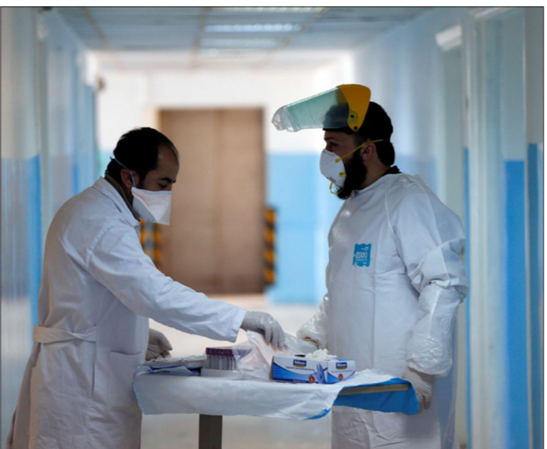
طبيبان أردنيان في مستشفى البشير الحكومي في عمان الذي تم تخصيص جناح خاص فيه لاستقبال مرضى كوفيد-19

وحيث - وهذا الأهم - نقص كبير في أطباء غرف الإنعاش ومجمل التخصصات الطبية وفي أطباء التخدير وهو الآن نقص تستعين الحكومة لتعويضه بمستشفيات القطاع الخاص وبدون قررت السيطرة على المعطيات الصحية والطبية الخاصة بسبب قرب الانتقال لمرحلة التفشي الوبائي الخامسة، بعد العبور بإعلان الخرابشة