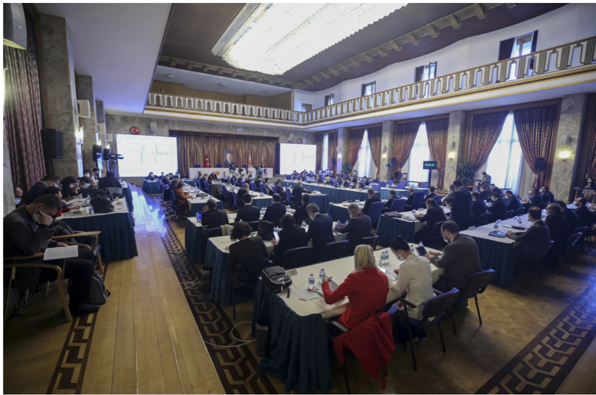
اجتماع كبار المسؤولين الماليين في تركيا خلال عرض وزير المالية الخطوط العامة لميزانية العام المقبل

■ أنقرة - الأناضول: صرح وزير الخزانة والمالية التركي، لطفي ألوان، أن بلاده ستقوم بإصلاحات هيكلية لتحسين مناخ الاستثمار المحلي والخارجي. جاء ذلك في كلمة القاها أمس الثلاثاء في البرلمان التركي في العاصمة أنقرة خلال مناقشة ميزانية البلاد لعام 2021. وقال ألوان «سنقوم بإصلاحات هيكلية لتحسين مناخ المستثمرين المحليين والدوليين، وزيادة جودة النفقات والإيرادات العامة». وأشار إلى أن الدعم المالي واسع النطاق الذي قدمته الحكومات العام الحالي لمواجهة تداعيات وباء كوفيد-19، تسبب في إدخال الاقتصادات العالمية في منحى متزايد لعجز الميزانيات ومخزون الديون. وتوقع بلوغ نسبة عجز الميزانية إلى الدخل القومي في تركيا 4.9 في المئة، ونسبة الدين العام إلى إجمالي الدخل الوطني إلى 41.1 في المئة. ونكر أن التطبيع الجزئي في الحياة الاقتصادية في تركيا التي بدأت في منتصف مايو/أيار الماضي، والتطبيع الكامل في يونيو/حزيران الماضي، دعم النشاط الاقتصادي للبلاد، وانعكس على بيانات الإنتاج الصناعي ومؤشرات الثقة.