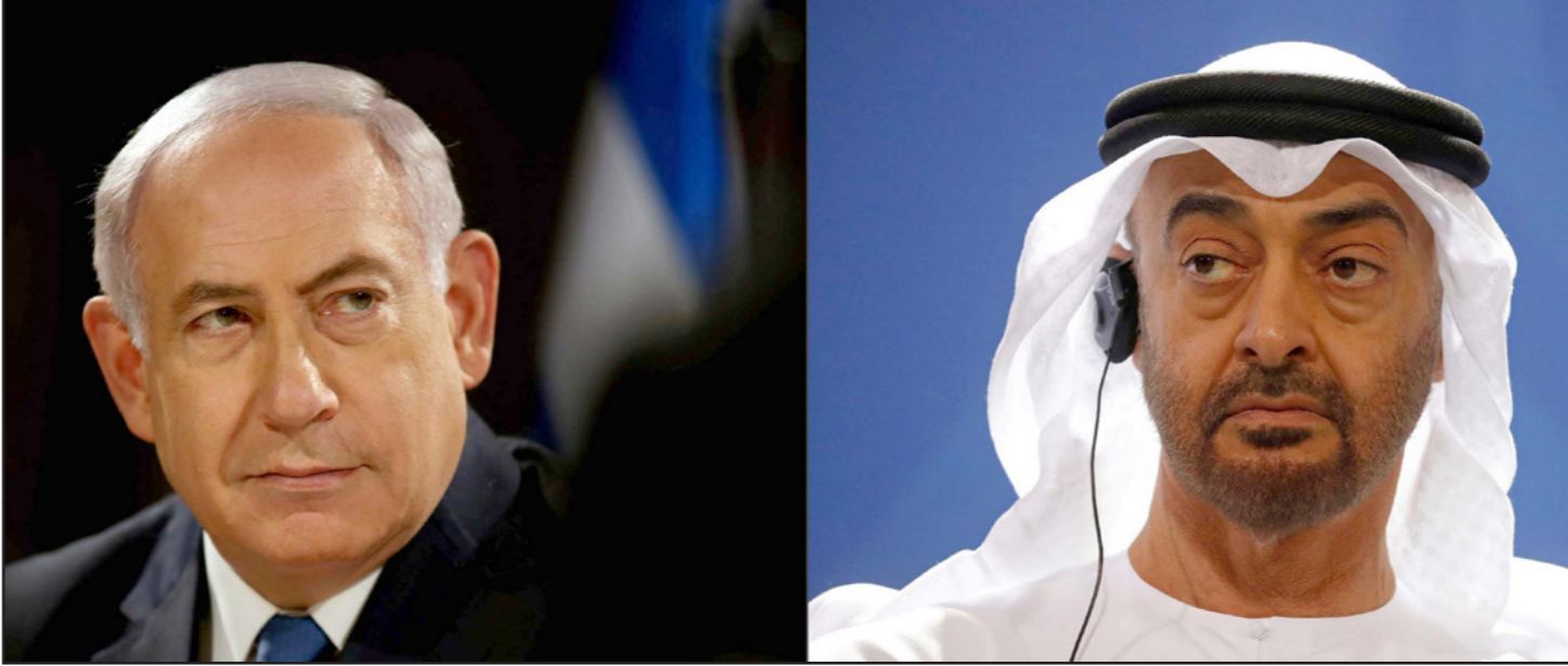
محمد بن زايد وبنيامين نتينهاو

صوتها بشكل واضح تجاه بايدن، إلا أن مخاوفها تركزت حول تغيير موقف الإدارة الأمريكية من تركيا. وحسب موقع "واللا" العبري، يجري تنسيق بين إدارة ترامب ونتنياهو ودول خليجية لفرض عقوبات إضافية على إيران، لعرقلة دعوتها للاتفاق النووي. وذكرت القنسة 13 أيضا أن زيارة بومبيو قد تستمر ثلاثة أيام في إسرائيل وتستقبل العديد من اللقاءات التي سيتم فيها بحث الخطوات التي يجب القيام بها من قبل الولايات المتحدة وإسرائيل ضد إيران. قبل تسلم بايدن الرئاسة، وأشارت القادة إلى أنهم في إسرائيل يتوقعون أن تنشأ أزمة بين إسرائيل وإدارة بايدن إذا عاد إلى مرحلة ما قبل ترامب في التعامل مع إيران.