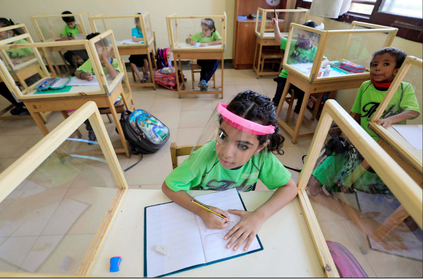
طلاب في مدرسة خاصة في المعادي في القاهرة

بفيروس كورونا» قائلة: «طول ما في ممارسات تتيج للفيروس الانتقال من إنسان لآخر فإنه نتوقع زيادة كبيرة جدا في أعداد الإصابات بكورونا». وأضافت: «يجب ارتداء الكمامة والحفاظ على التباعد الاجتماعي وغسل اليدين باستمرار». وسجلت مصر رسميا 111009 ألف مصاب بفيروس كورونا المستجد، توفي منهم 6465 شخصا، لكن الأعداد الحقيقية أكثر بكثير، حسب مسؤولين، نظرا لقلّة عدد المسحات التي تجريها وزارة الصحة.