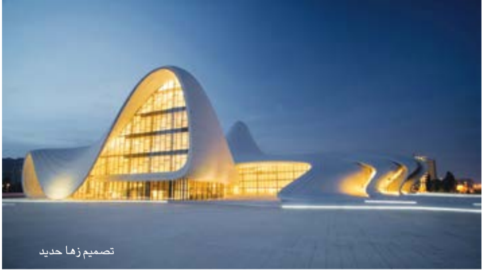
تصميم زها حديد

تغذير رغبةٍ جدّه الملك فرثيواله بعثّة إلى باريس لدراسة فن الرسم، كما هيأوا له مدرّسًا للغة الفرنسية. ولما عاد فائق من«البوزارت» بدأت أعمال المهتمّين بالفنون في بغداد انظار المهتمّين بالرسم تسترعي الخمسينات. ومن المبدعين في فن الرسم في الفترة اللاحقة: ليلى العطار، التي استحوذت على اهتمام الفنّانين والأدباء بما كانت تعرضه من لوحات في كثير من المعارض. وقد استمرّت الحكومات المتعاقبة في رسم صُور السلاطين والقريبين منهم. أمّا تحت التماثيل للبشر، أو للسلاطين، فلم يَكُن في الوارد، لأنّ أنشطة الرسم، ولكنها تكاد تنحصر في رسم صُور السلاطين والقريبين منهم. أمّا تحت التماثيل للبشر، أو للسلاطين، فلم يَكُن في الوارد، لأنّ ذلك العربي الإسلامي كان يحسب تماثيل البشر تشبيها لعمل الخالق؛ لذا كانت تُسمّى بالأصنام، وما يزال الناس في أواسط العراق وجنوبه يسمّون تماثل الشخص صنمًا؛ وبعد زوال الحكم العثماني برّزت فعاليات طبّية في مجال الرسم والنحت وصنع التماثيل للطلوك والأشخاص. تقام في الساحات العامة في البلاد. وقد برز في بغداد والخمسينات عددٌ من الرّسامين والنحاتّين الذين تخزجوا في معهد الفنون الجميلة في بغداد، وبعضهم تخصص في دراسة الرسم والنحت في بريطانيا وفرنسا وإيطاليا. وفي تلك الأيام كانت الحكومة والشعب تشجّع وتدعم الحركة الفنّية في العراق، خلافا لما صار يجري في العقدين الأخيرين، عندما صارت أمور الحكم في البلاد بأيدي أناس لا تشكّل الفنون ودعمها أولوية في أنشطتهم.