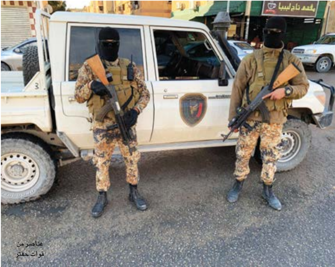
عناصر من قوات حفتر

ومع السلاسة الظاهرية لاجتماعات اللجنة العسكرية، التي توصلت إلى اتفاقات تحمل على التفاوض، خاصة في غدامس وسرت، لم يباشر الجانبان الأمريكية لافتاء، سواء عبر رئيسة البعثة الأممية بالوكالة ستيفاني وليامز، أم عن طريق الدبلوماسيين الأمريكيين، الذين تحركوا بكثافة في كواليس ملتقى الحوار الليبي، وقد حظرت الأمم المتحدة على الإعلاميين التواصل معهم. ولوحظ أن الوفدة الأممية أدانت بأشد الكلمات اغتيال الحامية والناشطة الحقوقية البارزة حنان البرعصي، في بنغازي، على أيدي عناصر موالية لحفتر، معتبرة أن مقتلها «يُبين بجلاء التهديدات والمخاطر الشخصية التي تواجهها المرأة الليبية بسبب المجاهرة برأيها». وهذه الجريمة هي واحدة من سلسلة عمليات مشابهة، أشهرها اختطاف النائبة والطبيبة النفسية سهام سرفوية من بيتها وضرب زوجها. ولم يُعرف مصيرها إلى اليوم.