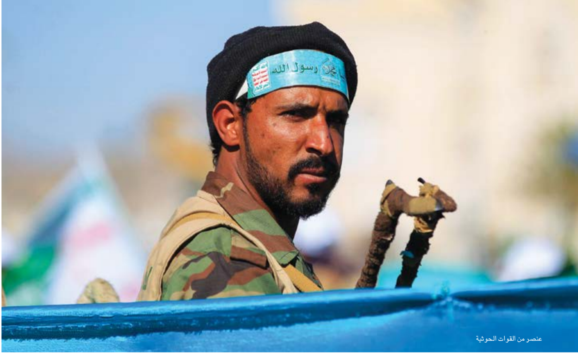
عنصر من القوات الحوثية

مليشيا الانقلابيين الحوثيين التي سيطرت على العاصمة صنعاء في أيلول (سبتمبر) من العام 2014 انهار الوضع في الجنوب ونجح عنه صعود مليشيا المجلس الانتقالي الجنوبي المدعوم من دولة الإمارات العربية المتحدة والتي سيطرت على العاصمة الحكومية الموقّعة عدن في آب (أغسطس) 2019 وأصبحت بذلك الأزمة اليمنية مركبة ومعقدة، والتي أخرجت الحكومة الشرعية عن التأثير، رغم أنها ما زالت تسيطر على منابع الثروة ومناطق إنتاج النفط في البلاد.