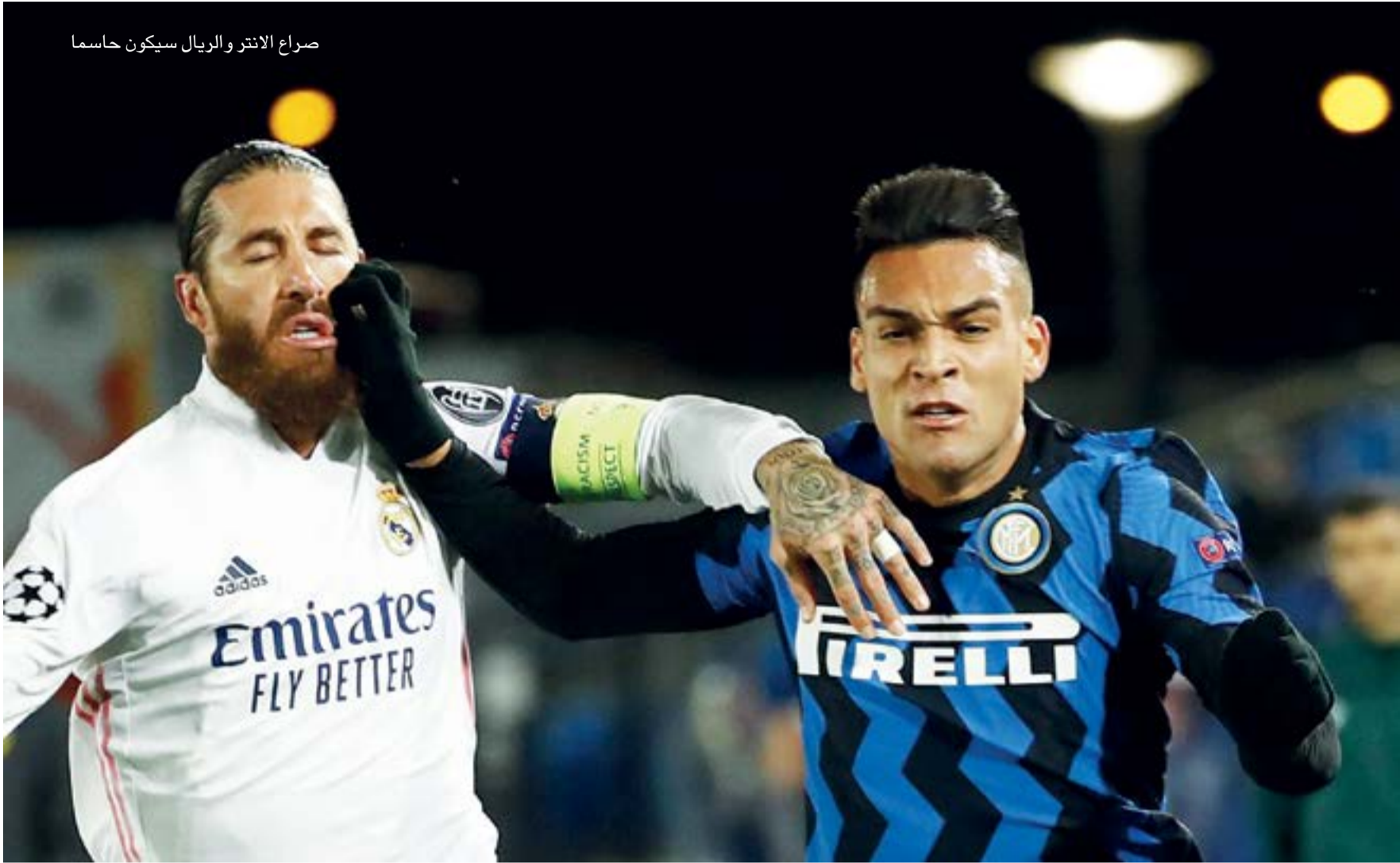
صراع الانتر والريال سيكون حاسما