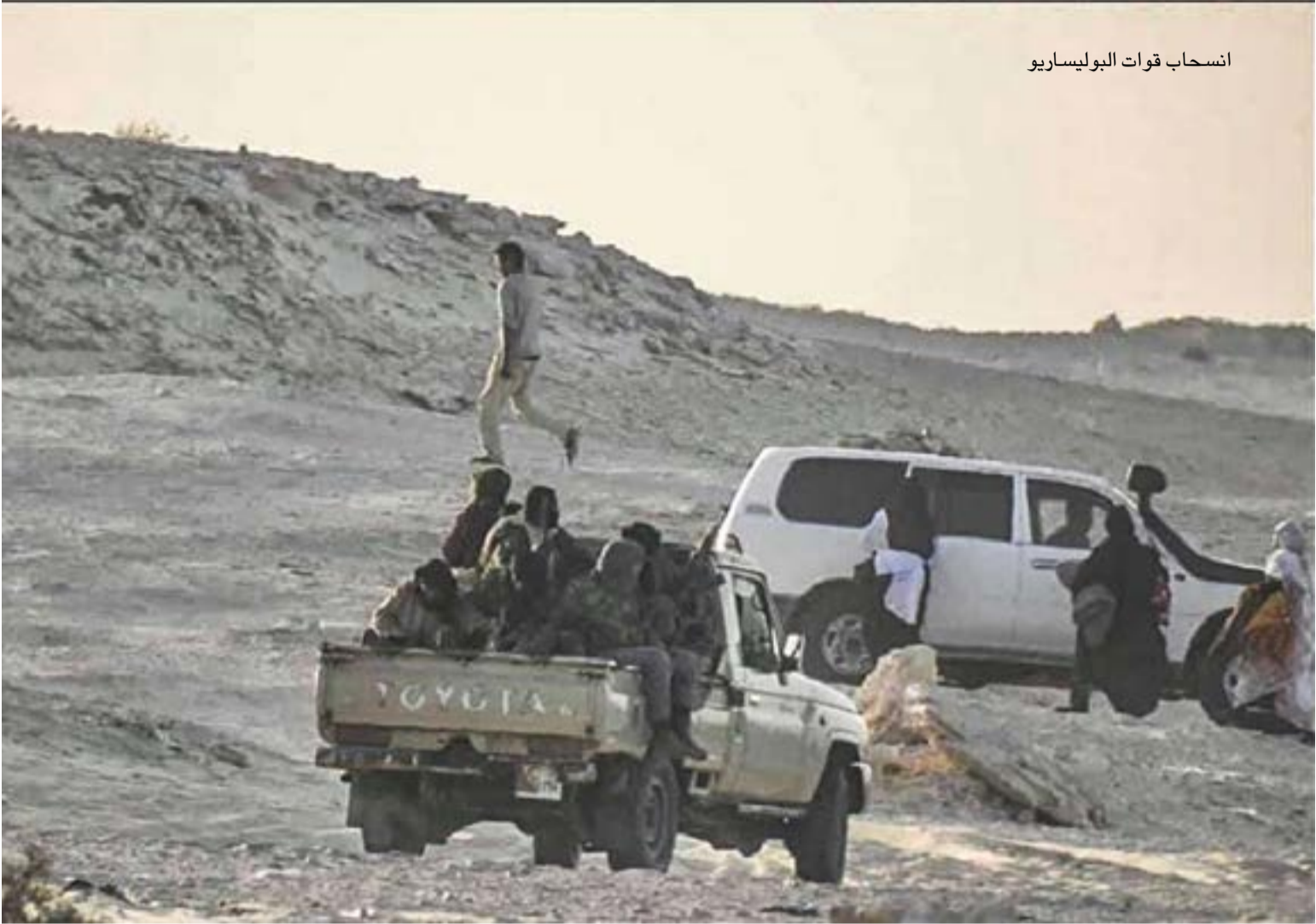
انسحاب قوات البوليساريو

الدستورية أو الأسس الديمقراطية أو الوحدة الوطنية أو الترابية للمملكة المغربية.