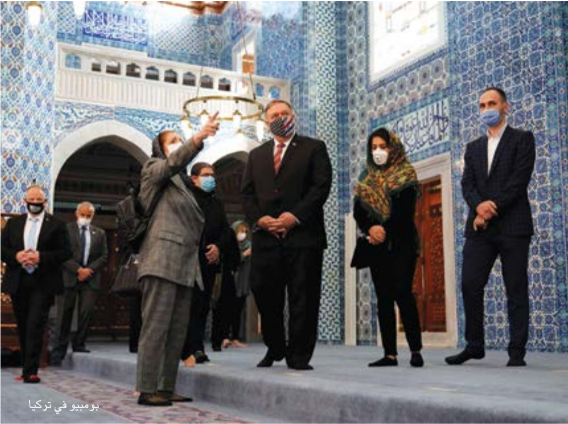
بومبيو في تركيا

وعلى العكس من هذه التفسيرات، فإن تصريحات بومبيو التي وصفت في تركيا بـ«العدائية» تشير إلى موقف أمريكي حاد ضد تركيا في الوقت بدل الضائع لإدارة