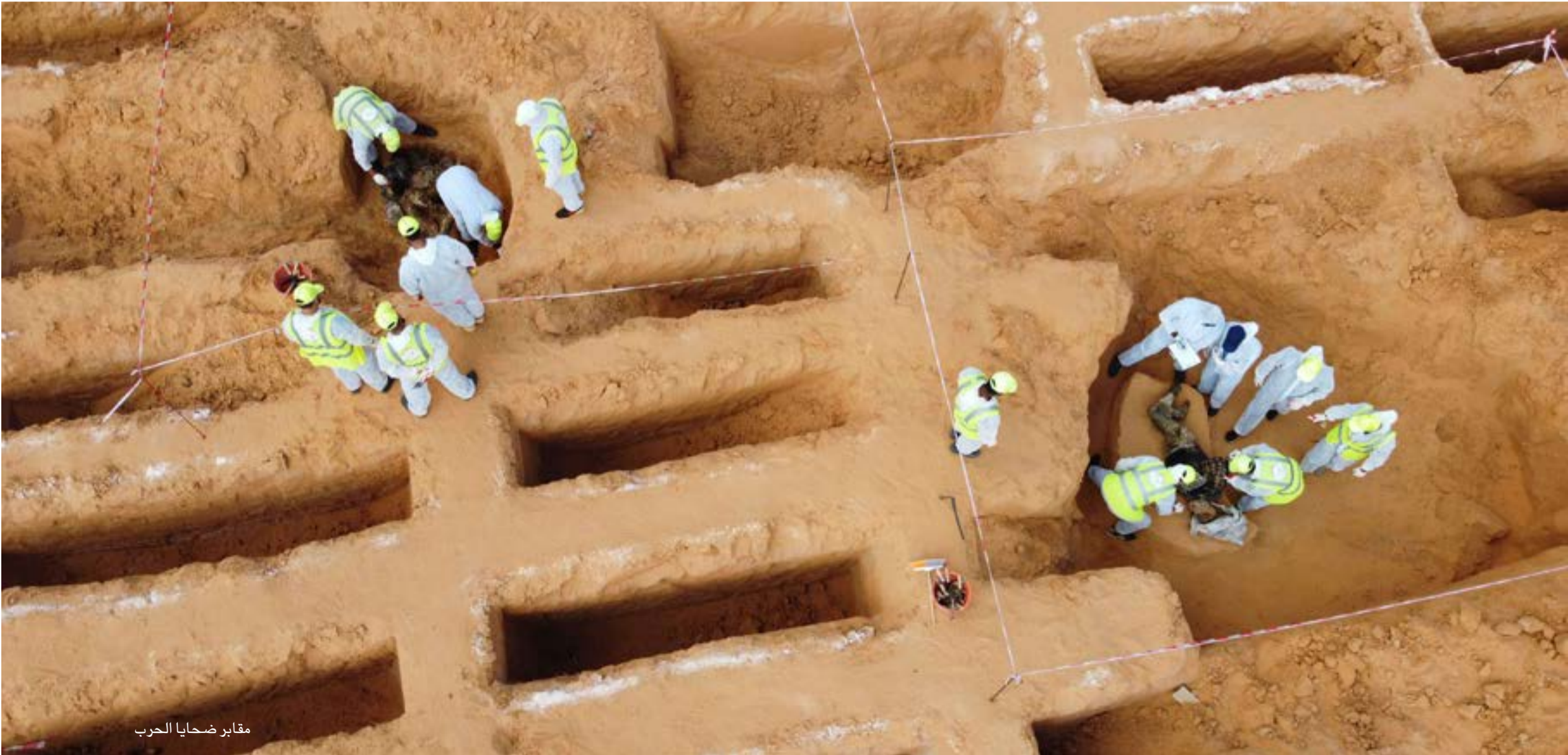
مقابر ضحايا الحرب

○ إننا نضع على عاتقنا حماية حقوق المواطن العربي وحرياته من خلال متابعة وكشف كل الانتهاكات بخصوصها. ولنا أمل كبير في تحسن مستوى الحقوق والحريات في العالم العربي بناء على ما نشهده من ثورة في عالم الاتصالات الذي يساعد في رصد التجاوزات وكشفها والأهم من ذلك هو تحسن وعي المواطن العربي وارتفاع سقف مطالبه في عالم الحقوق والحريات. إضافة إلى تطور مؤسسات المجتمع المدني والدور الفاعل لمنظمات حقوق الإنسان.