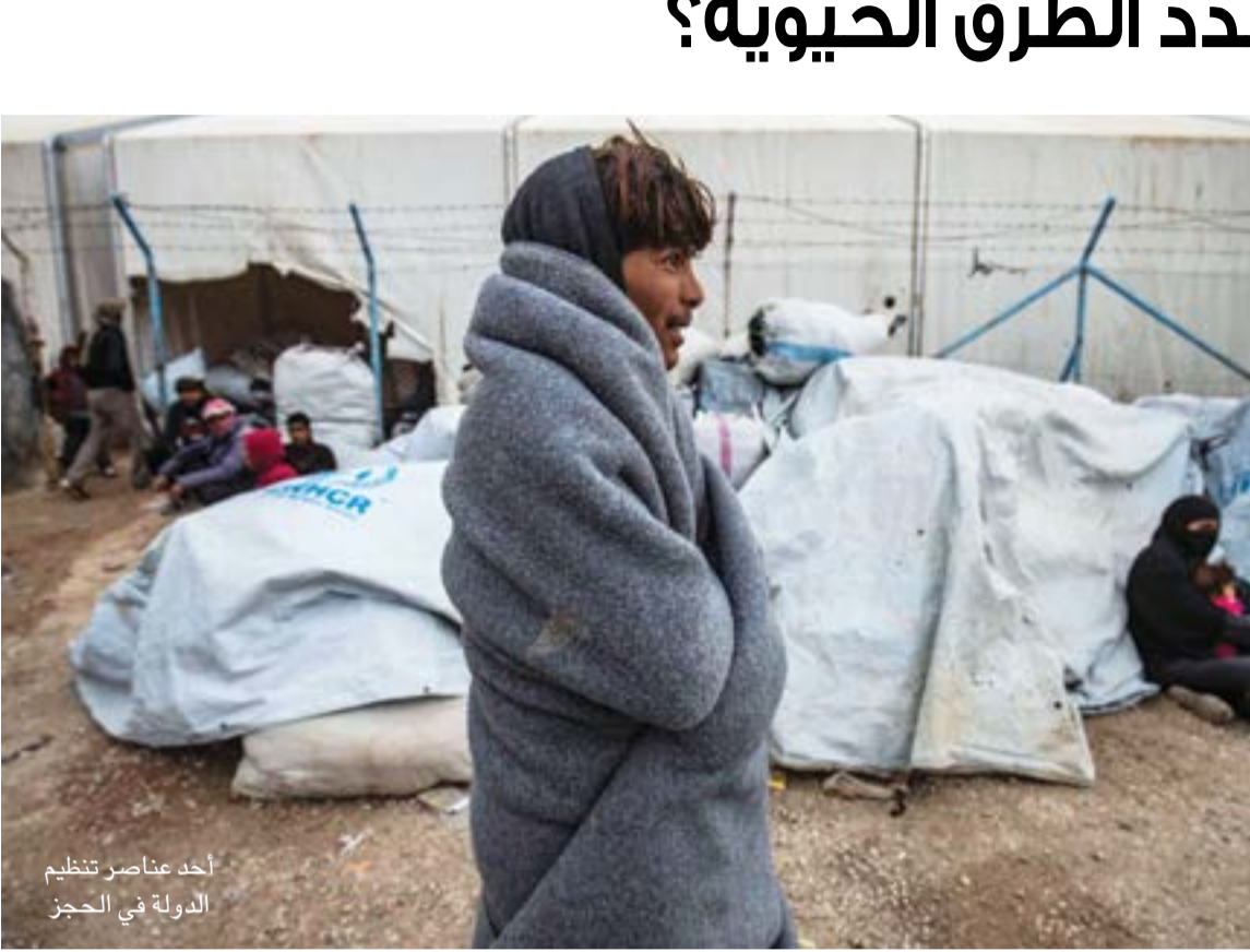
أحد عناصر تنظيم الدولة في الحجز

أهمهم القاطري ووكلائه. والتغيرات تفرض على الروس والإيرانيين وتعزل مناطق سيطرة النظام كما حصل في الأعوام 2013 و2018 لكنهاستجعل كلفة التنقل باهظة جدا. وستجبره على التفكير بأهمية المنطقة الشرية عموما، وأنه سيعود لتهديد طريق سلمية-حناصـر-حلب وهو شريان وصولا إلى منبج والباب.