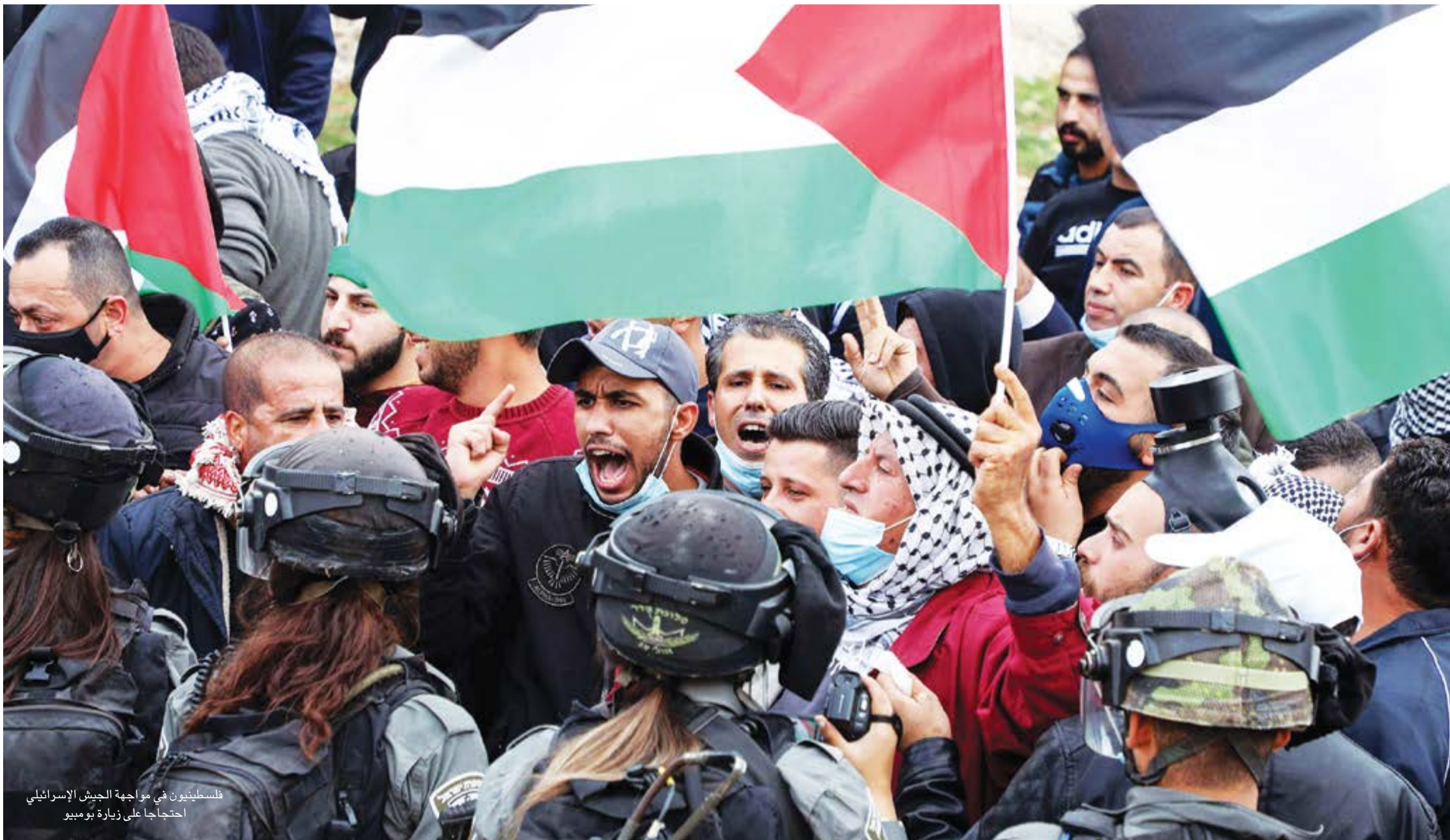
فلسطينيون في مواجهة الجيش الإسرائيلي احتجاجاً على زيارة بومبيو

واشنطن-«القدس العربي»: تصور العديد من المعلقين، وفي الواقع، هذه الرحلة هي مؤشر دقيق للسياسات الأمريكية المقبلة في المنطقة، وهي بالتأكيد أكثر من «لحظة ختامية» في دائرة الضوء الدولية لدلال ترامب. جولة بومبيو جاءت لتعزيز مصالح كيان الاحتلال الإسرائيلي