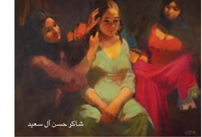
شاكر حسن آل سعيدي

ويعد تخرّجها في الجامعة الأمريكية ببيروت، متخصصةً بالرياضيات، ذهبت إلى لندن للتخصّص في فنون المعمار. وقد أبدعت في ذلك واسترعت أنظار المتخصّصين في العمارة في بريطانيا وأوروبا وأمريكا، كان لهذه العراقية المتميّزة أسلوبًا أصيلًا في العمارة، يتميّز بالضخامة والارتخاع، والخطوط والزوايا غير التقليدية. وقد أقامت ابنةٌ غير مسبوقة في عالم المعمار فنون المعمار. وقد أبدعت في ذلك واسترعت أنظار المتخصّصين في العمارة في بريطانيا وأوروبا وأمريكا، كان لهذه العراقية المتميّزة أسلوبًا أصيلًا في العمارة، يتميّز بالضخامة والارتخاع، والخطوط والزوايا غير التقليدية. وقد أقامت ابنةٌ غير مسبوقة في عالم المعمار فنون المعمار. وقد أبدعت في ذلك واسترعت أنظار المتخصّصين في العمارة في بريطانيا وأوروبا وأمريكا، كان لهذه العراقية المتميّزة أسلوبًا أصيلًا في العمارة، يتميّز بالضخامة والارتخاع، والخطوط