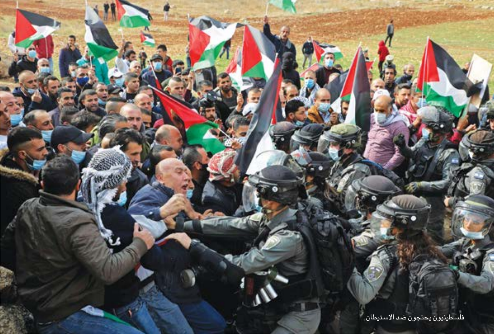
فلسطينيون يحتجون ضد الاستيطان

التي حصلت، لكنهم اعتبروا أن التصعيد عبر الأذرع العسكرية سيقبى مضبوطاً ومدروساً بما لا يحدث مفاجآت ليست في الحسبان.