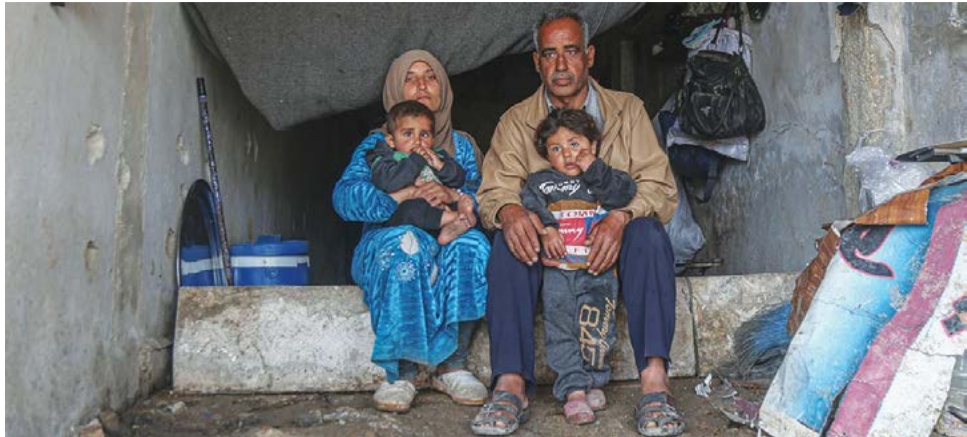
سوري على النزوح.

أما الثالثة، وهم الذين تتراوح أعمارهم ما بين 16- 18 عاما، وهؤلاء هم النسبة الأكبر، إذ تبلغ 52 في المئة من المجم.