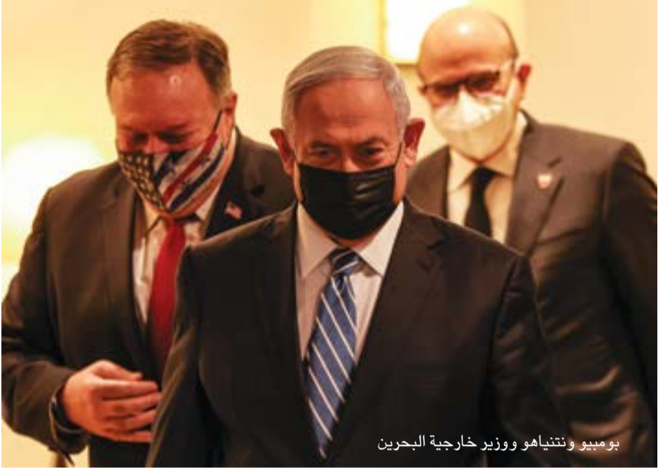
بومبيو وتنتياهو ووزير خارجية البحرين

بقرب رحيل ترامب، الذي تقربا منه وداعاً على إدارته مئات المليارات من عقود السلاح، واشترى صمته على جرائم الحرب التي يرتكبونها في اليمن أو في ليبيا، (على حد تأكيد عدد من التقارير الأمية والحقوقية) أسوة بانتهاكات حقوق الإنسان وتصفية المعارضين جسدياً.