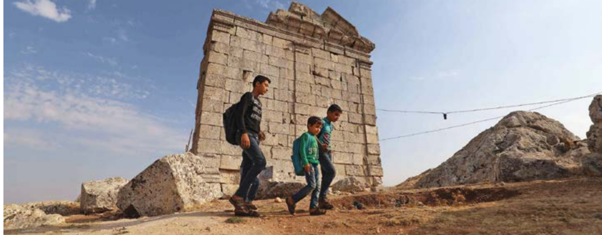
بلد سوريا، حيث أشارت الشبكة السورية لحقوق الإنسان «غير رسمية» إلى أن الغالبية العظمى من دول العالم صوتت لصالح حقوق الشعب السوري، لافتة إلى أن انضمام روسيا والصين إلى المجلس يُعزز تحالف الدول المعادية لحقوق الإنسان.