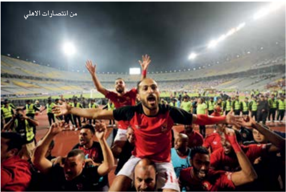
من انتصارات الاهلي