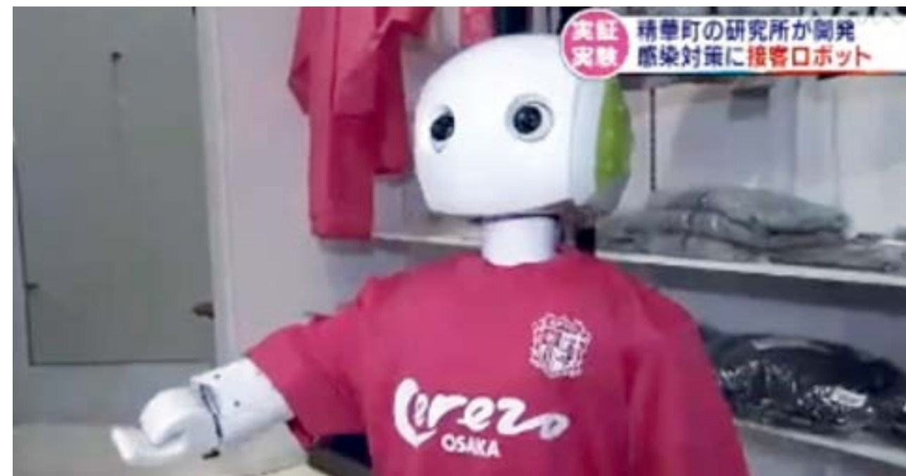
لندن - «القدس العربي»: