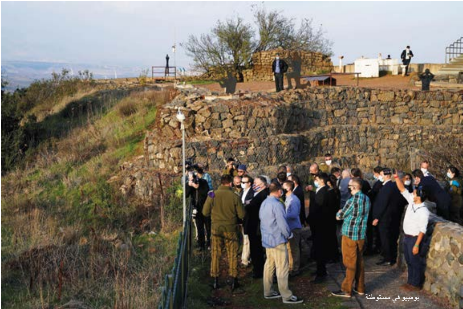
بومبيو في مستوطنة

الواضح أن طهران لن تتحول عن توجهها خلال الفترة القصيرة الباقية لدخول بايدن إلى البيت الأبيض. وبحسب تقرير لـ«نيويورك تايمز» أيضاً عمليات جس التنض التي قام بها ترامب لإمكان القيام بهجوم عسكري – نتنهاو قطعاً كان على علم به إن لم يكن أكثر من ذلك – انتهت برد ضعيف. هذا الأسبوع فهم نتنهاو أن الأمر قد حُسم، وترامب في الطريق إلى الخارج، ومخزون السيوارتيوم المخصب لدى الإيرانيين أكبر من ذلك الذي كان لديهم عند توقيع الاتفاق النووي الأصلي قبل 5 سنوات ولذلك سارع لهتئةً بايدين محددًا. في المقابل علّق محرر الشؤون العربية في القناة العبرية 13 على وضع محاولة خلية إيرانية زرع عبوات ناسفة، لاستهداف جنود إسرائيليين على الحدود السورية، إن «الإيرانيين أصبحوا أكثر جرأة، بعد إدراكهم بوجود إدارة أمريكية، ستمتحنهم تخفيضات، لذا فإنهم يهاجمون» داعياً بايدين للتصعيد.