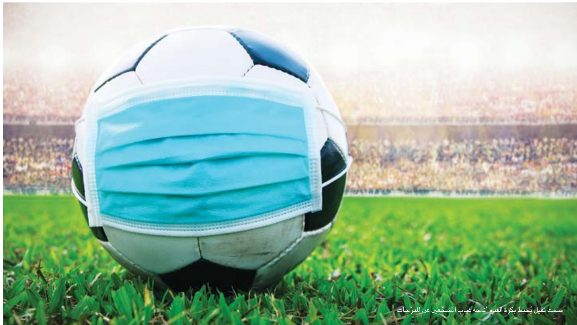
صمت ثقيل يُحيط بكرة القدم أتاحه غياب المشجعين عن المدرجات

تبدو مدرجات ملاعب كرة القدم المهجورة رغم استمرار المسابقات واحتدام البطولات وإتمام الصفقات والتعاقدات من أكثر ما يجسد المفارقة والتناقضات التي عشناها طيلة العام 2020 وإقاماته المتباينة. فمشاهدة المباريات عبر الشاشات ومتابعة النتائج والتعليقات عليها يعطيان الانطباع لوهلة أن الأمور طبيعية، وأن الزمن الناظم للأسبوع وفق جدول كروي لم يتبدل، ومثله البث المباشر وما تقف عليه من جهد وحركة وسرعة على أرض اللعب مضبوطة جميعها إلى ساعة حكم إعلان بداية ونهاية وأوقاتا مستقطعة. لكن مفاجأة سماع أصوات اللاعبين والمدربين والحكام إذ يتبادلون بعض العبارات أو التعليمات والاستفسارات أو يصرخون فرحا أو استياءً أو الما، يذكرنا أن صمتا