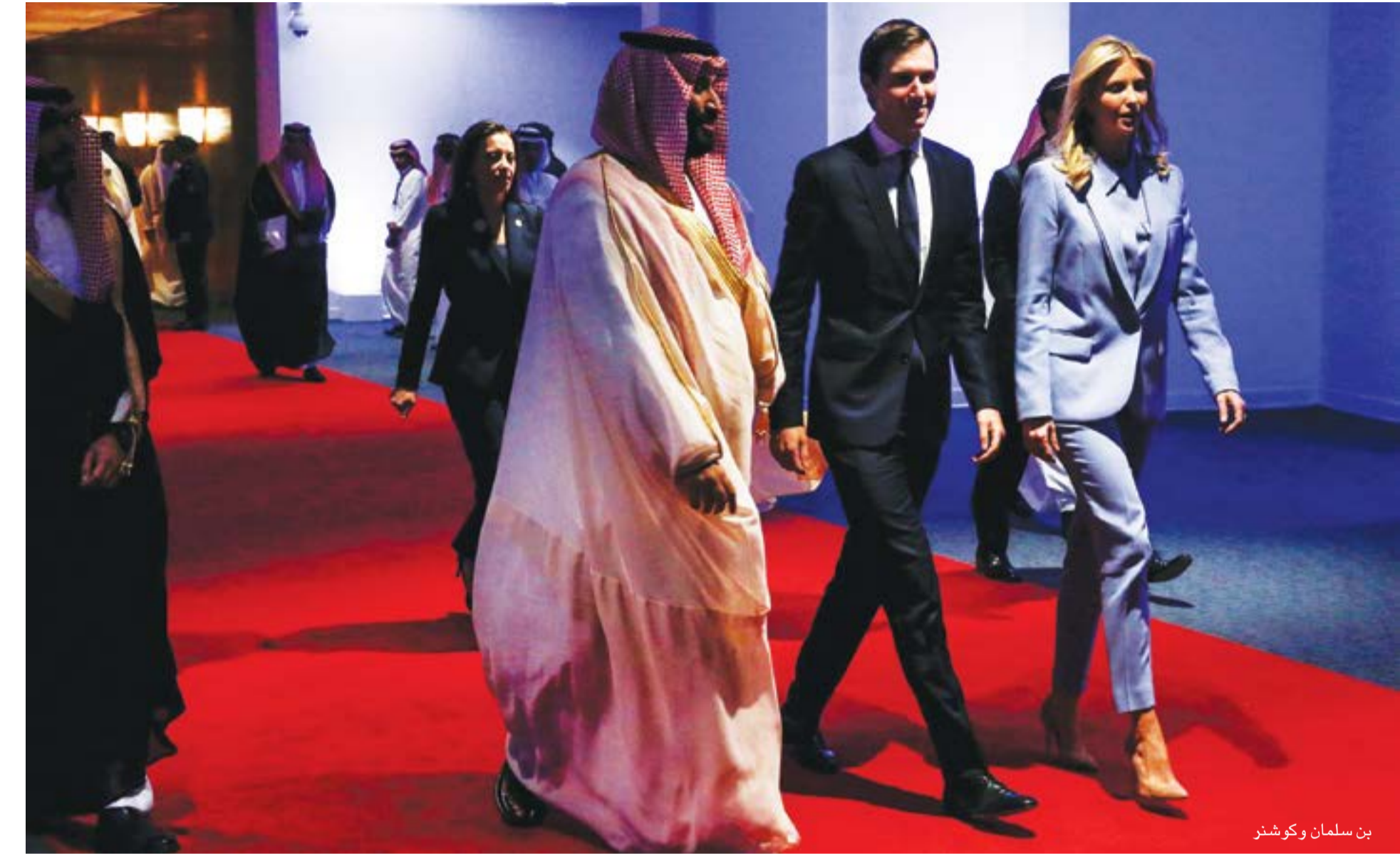
بن سلمان وكوشنر

الدفع قدماً في اتجاه تطبيع سعودي مع إسرائيل، بل أتى في سياق «ترتيب الأوراق» بعد خسارة ترامب، وإمكان خلق وقائع من شأنها أن تُعقّد التسوية مع إيران أمام بايدن. ورغم أن أياما عشرين تفصل الرئيس الأمريكي المنتخب عن تسلّم مقاليد الحكم، غير أن العالم يلتقط أنفاسه في هذه الفترة المتبقية من ولاية ترامب خوفاً من تويدي أي شرارة في المنطقة إلى حرب.