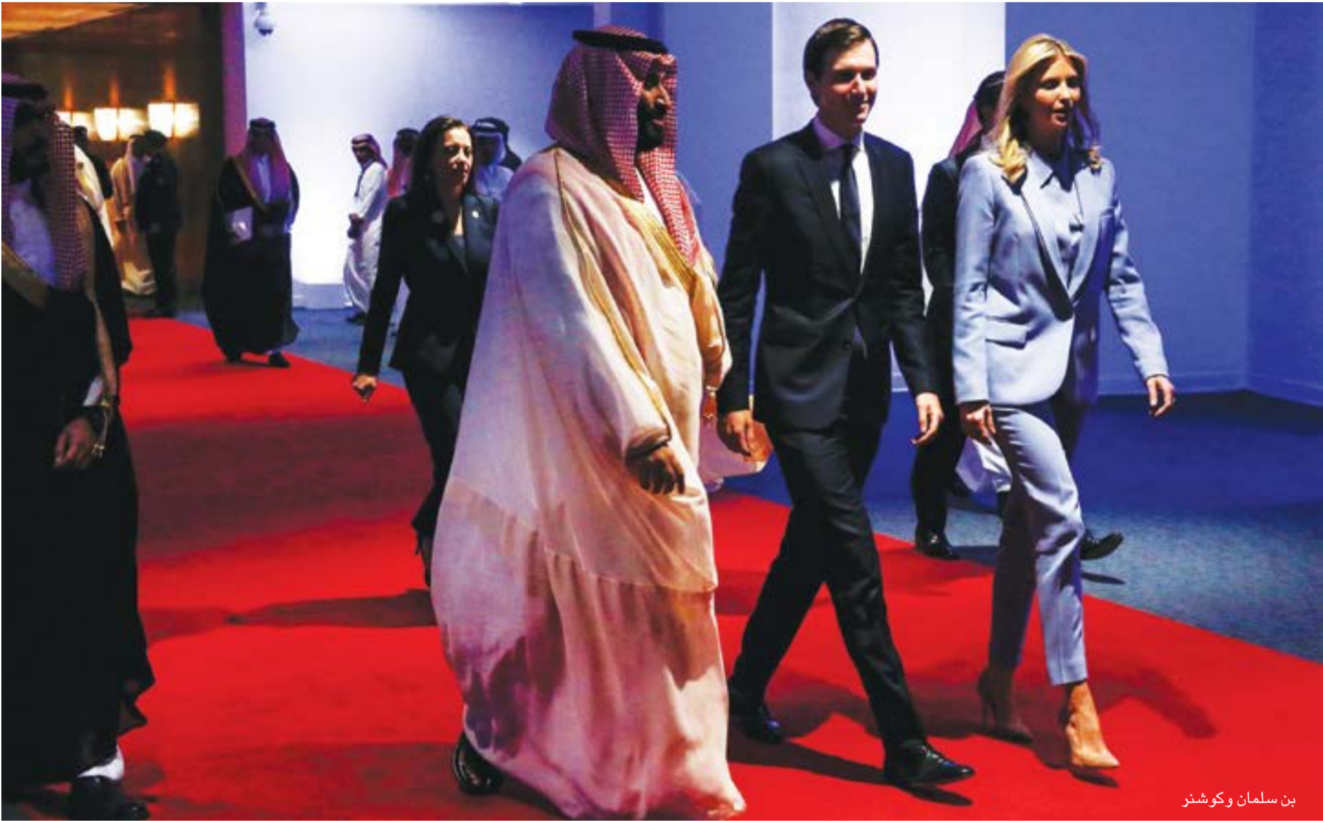
بن سلمان وكوشنر

النامية، وكيفية التعامل مع الاحتمالات الكبرى لتلك الدول النامية من التخلف عن سداد ديونها، في وقت وصلت الأرقام التي ضخّتها دول مجموعة العشرين لحماية الاقتصاد العالمي من تبعات الفيروس إلى 11 تريليون دولار.