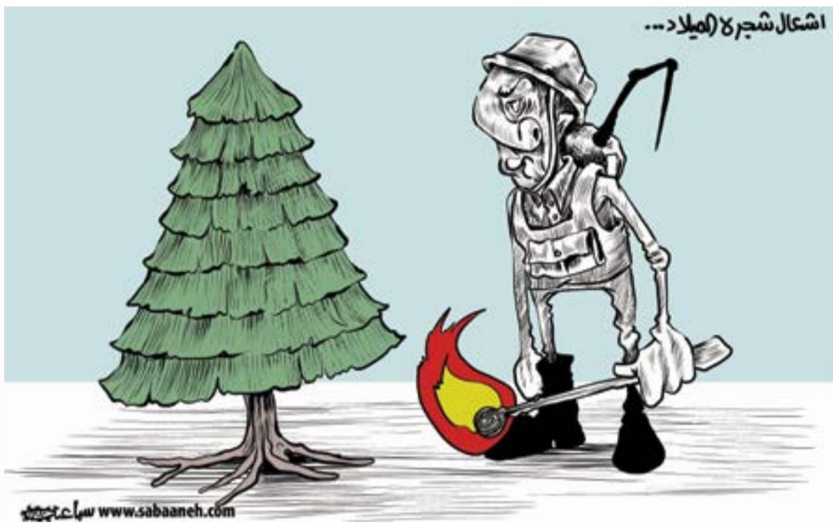
كاريكاتير: محمد سباعنة