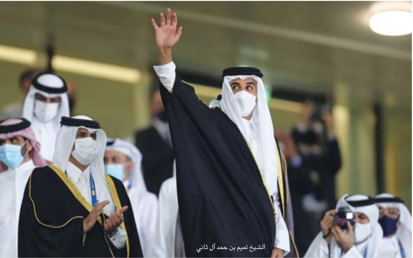
الشيخ تميم بن حمد آل ثاني

الإجمالي لقطر سينمو بنسبة 2.7 في المئة عام 2021 بعد انكماش بنسبة 2.5 في المئة شهده الناتج المحلي هذا العام. وقال الصندوق في بيانه إن استجابة السياسات القوية للسلطات القطرية أسهمت في التخفيف من التداعيات الصحية والاقتصادية لفيروس كورونا.