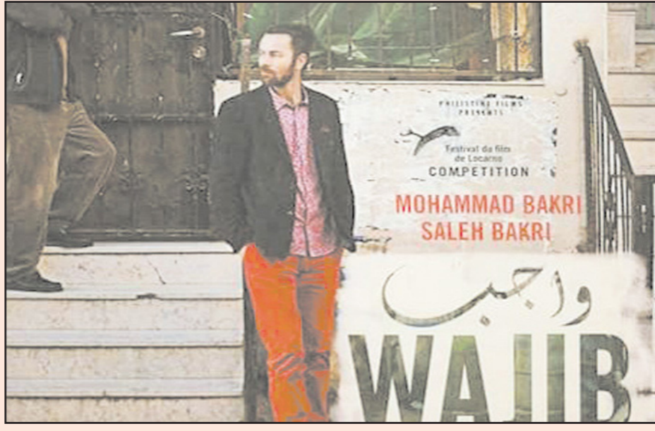
لقطة من الفيلم