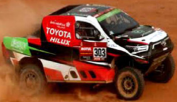
الراجحي يقطع صحراء نيوم بسيارة تويوتا بتشجيع بعض المتفرجين

أنت الى تراجعته بفارق كبير عن "سيد دكار" بيترهانسل: "كل شيء وارد غدا مع مرحلة طويلة لأكثر من 500 كيلومتر والملاحة فيها صعبة". وأضاف حامل اللقب 3 مرات: "سنحاول بذل قصارى قصارى جهدنا، وربما نستفيد من غلطة يرتكبها أو مشاكل ميكانيكية، لكن نتمنى للجميع الوصول بالسلامة". وعن استراتيجيته بيترهانسل (55 عاما)، بطل دكار 13 مرة في الدراجات والسيارات، عندما يكون متقدما وأمامه في المرحلة، فقال: "يحاول إبطاء السرعة وعدم المخاطرة، لاحظنا انه يقوم بالاسراع عندما تقترب منه، لكن الفارق كبير بين سيارة الدفع الرباعي (تويوتا) والدفع الخلفي (ميني)". وتقام المرحلة 11 الخميس بين العلا وينبع على مسافة 511 كلم وهي الاطول في هذه النسخة الـ43 من الرالي.