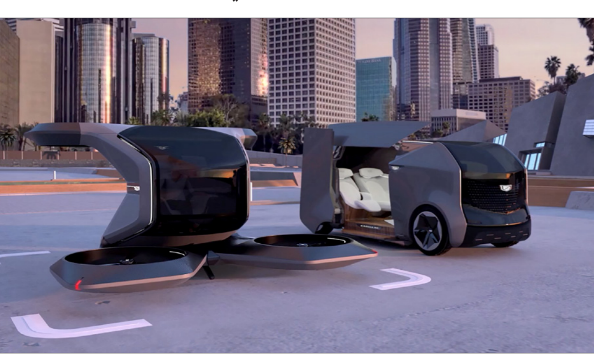
نموذجان تجريبيان لسيارة كاديلاك الطائرة المسيرة من إنتاج «جنرال موتورز» ووقفاً لشرطي فيديو عن نموذج أولي افتراضي لهذه السيارة، يتبين أن في إمكانها نقل راكب واحد من سطح مبنى إلى آخر، والإقلاع والهبوط عموديا، بسرعة 90 كيلومترا في الساعة.