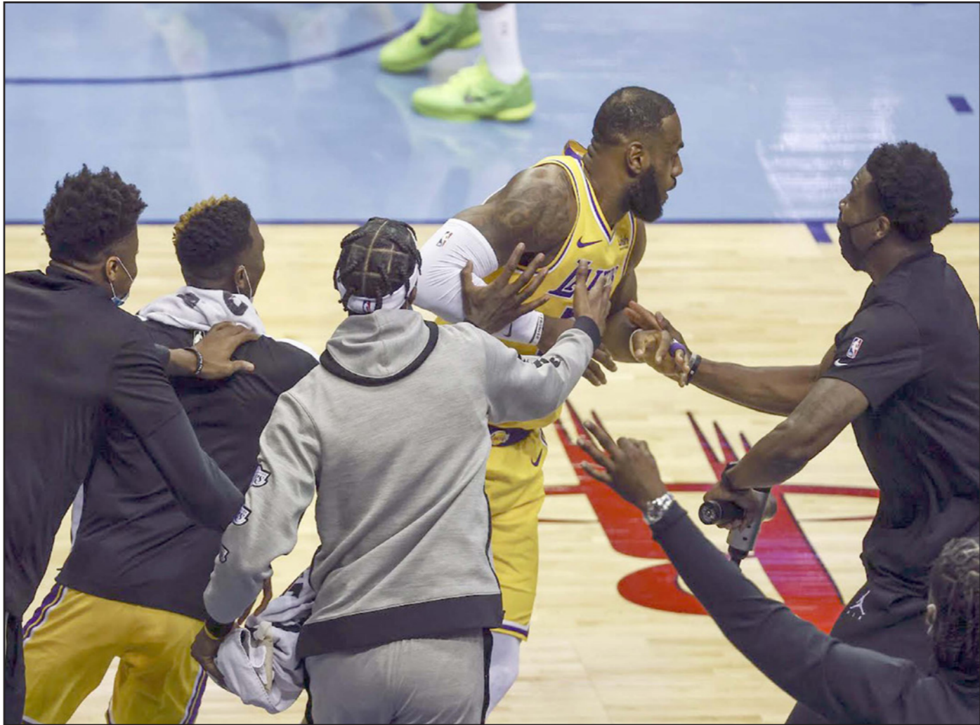
زملاء لبرون جيمس يتغفلون فرحا بعد تسجيله رمية الليكرز في سلة روكيتس وظهوره الى الملعب

لوس انجليس - آ ف ب: تفنّن الثلاثي كيفن دورانت وليبرون جيمس وجويل امبيد في دوري السلة الأمريكي للمحترفين، وقادوا انديتهم بروكلن نيتس ولوس انجليس ليكرز وفيلادلفيا سفيتس سيكسرز الى انتصارات لافتة.