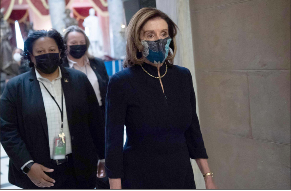
رئيسة مجلس النواب الأمريكي نانسي بيلوسي تغادر بعد التصويت على عزل ترامب

وسيتزك ترامب منصبه في غضون أسبوع واحد، ومن المرجح أن يواجه إجراء عزل ثانياً