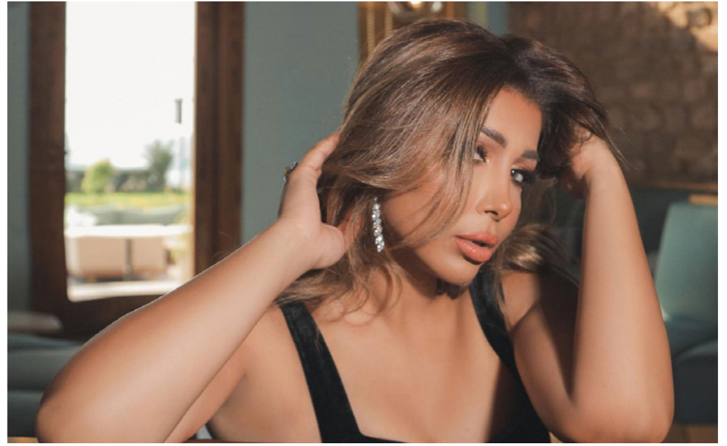
صنعاء - «القدس العربي»:

كشفت الفنانة اليمنية أروى إصابتها بفيروس كورونا. ونشرت عبر صفحتها الخاصة على موقع التواصل الاجتماعي مقطع فيديو أشارت فيه إلى أنها شعرت في البداية بالتهاب في الحلق، فقررت إجراء الفحص وكانت نتيجته «إيجابية». وأكدت أنه على الرغم