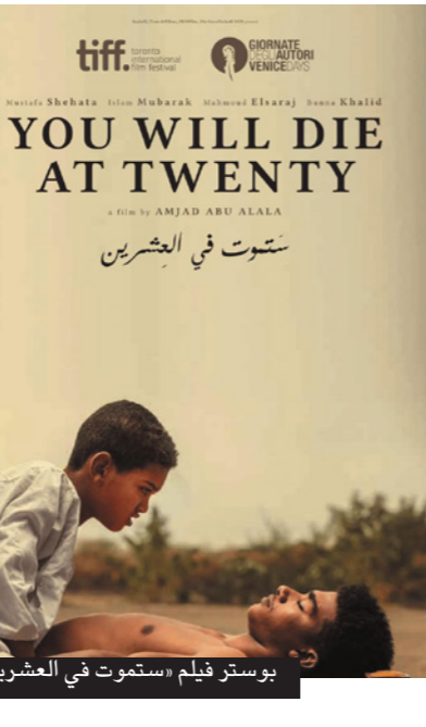
بوستر فيلم «ستموت في العشرين»

ويشدد علوان من جهته على حاجة السينما السودانية لدعم من النظام السياسي الجديد سواء على صعيد التشريعات أو تيسير البنية التحتية. مبدياً تخوفه من عدم نهائها بعيداً في حال عدم حصولها على هذا الدعم، إذ «إن لفة مهرجانات العالم على عرض أفلام سودانية لن تبقى إلى الأبد».