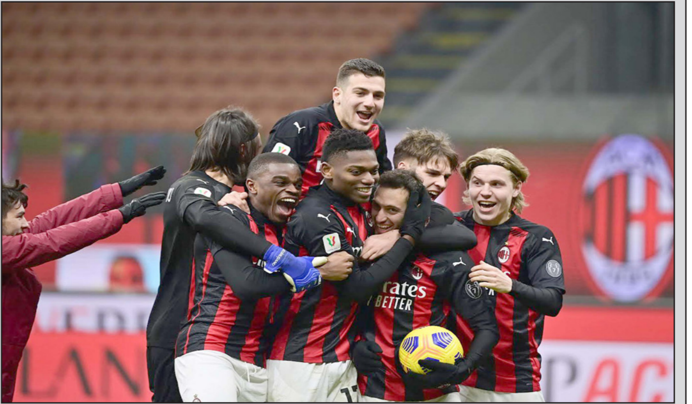
لاعبو ميلان يحتفلون عقب انتصارهم بركلات الترجيح على تورينو

تعرضه لإصابة في الكاحل. وانتهى الشوط الأول سلبيا، رغم أفضلية الاستحواذ ليلان ولكن بدون تأثير. فيما بدأ تورينو أكثر خطورة في الدقائق العشر الأخيرة ولكن بلا غلة. ومع بداية الشوط الثاني أجرى بيولي تغييرين دفعه واحدا بحثا عن الهدف، فدفع بييترو هوغ والتركي هاكنا جالهاين اوغلو بدلا من سامو كاستيتشو وإبراهيموفيتش. وأعقب ذلك محاولات متتالية لـ"زوروني" حيث حرم القائم الأيمن دافيد كالابريا من التسجيل بأحد تسديدة قوية (57). وبعد دقيقتين، ارتطمت تسديدة صاروخية للبرتغالي ديوجو دالوت بالقائم الأيسر (59). وفي الدقيقة 71، قاد رافايل لياوا أن يقتتح التسجيل بعد خطأ من الحارس، قبل أن يتمكن الأخير من إبعادهما باحتكاك مع لياوا آثار الجدل حيال