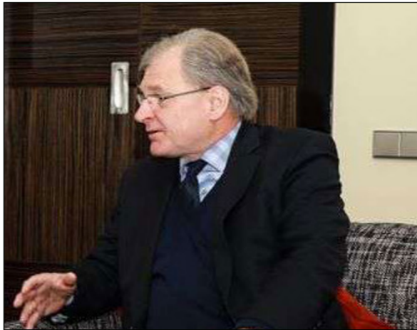
السكرير الأمريكي لدى ليبيا ريتشارد نورلاند

وتحدث قائد الجيش الجزائري عن «خريطة طريق واضحة المعالم» عمل «على ترسيخ معانيها في أذهان مختلف المسؤولين وقادة الوحدات، منذ توليه مهامه، وأكد أن «هذه الرؤية والشاملة التي يتعين على الجميع التقيد بروحها وهضم أفكارها والانخراط التام في أهدافها ومراميتها إلى غاية تحقيق جميع