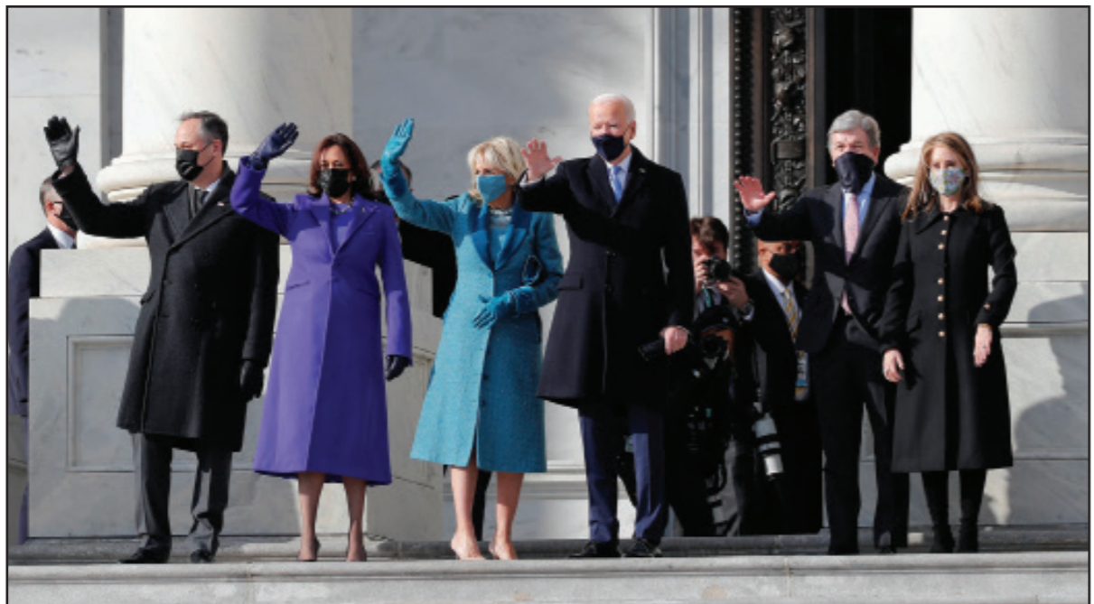
الرئيس الأمريكي جو بايدن مع نائبته كامالا هاريس ومسؤولين آخرين على عتبة البيت الأبيض أمس