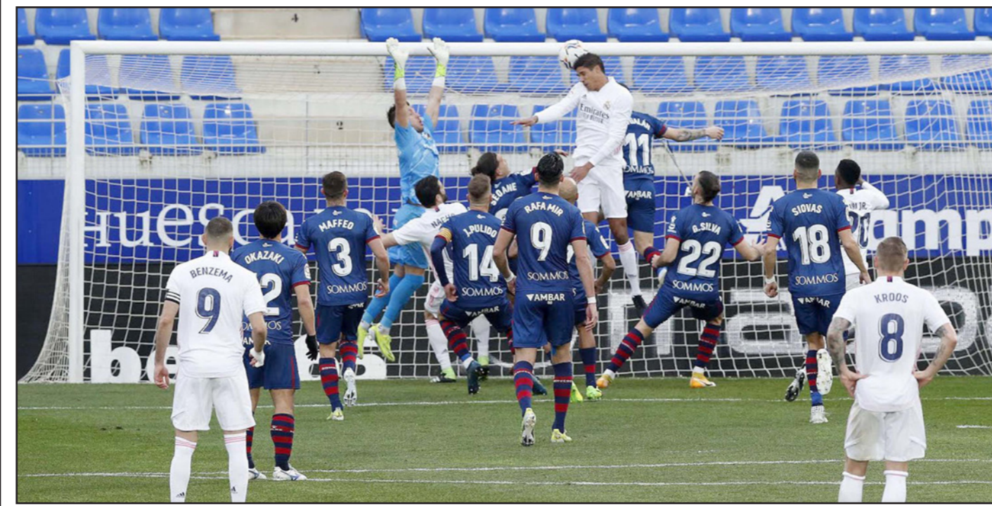
فاران يرتقي أعلى من الجميع ليسدد كرة رأسية جاء منها الهدف الأول لريال مدريد