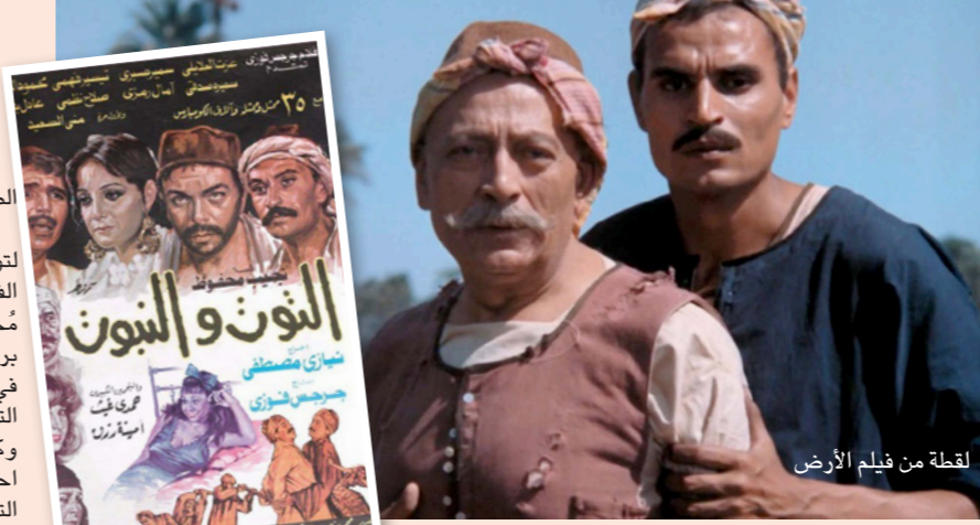
لقطة من فيلم الأرض