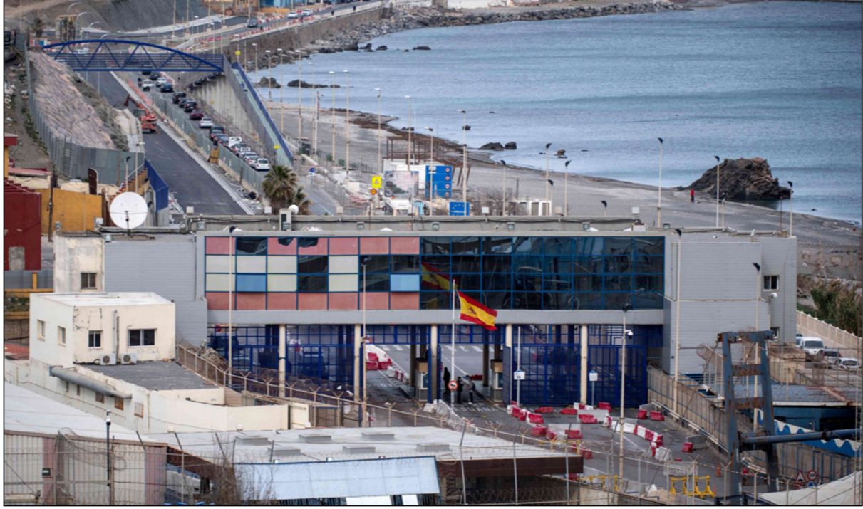
المنطقة الحدودية بين الفينديك المدينة المغربية وسبتة على الجانب الاسباني