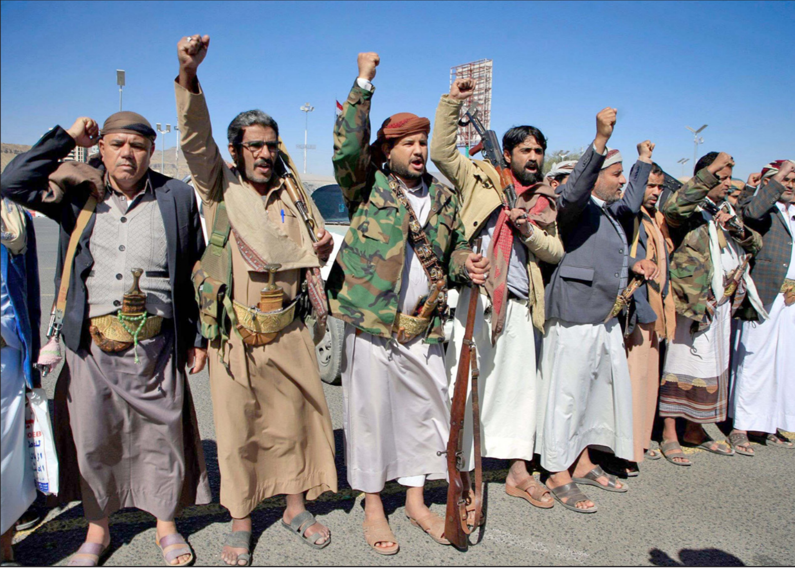
عناصر مؤيدة لجماعة الحوثي يحتفلون في صنعاء أمس بعد قرار الرئيس الأمريكي بإلغاء تصنيفهم منظمة إرهابية