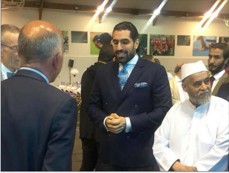
صورة غير مؤرخة للأمير سلمان بن عبد العزيز (وسط) وهو يحضر إفطاراً في المركز الإسلامي في العاصمة الفرنسية باريس

وعبر المظلون القانونيون لحمد بن نايف عن قلقهم على وضعه الصحي، حيث منع من زيارة الطبيب له ومن الاتصال بالخامين الذي يدافعون عنه. وانتشرت في العام الماضي شائعات عن دوره في مؤامرة له الدولة العميقة، في أمريكا للإطاحة بالنظام، وأحبطها طبعاً محمد بن سلمان. وشن الحملة أنصار ولي العهد، حيث اعتمادوا على رويوتات لتكبير حجم الأزمة المزعومة. وقال شخص على معرفة