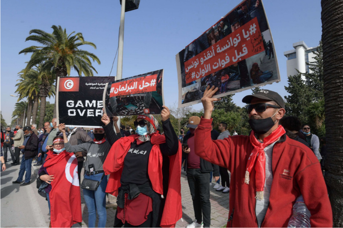
تونسيون يرفعون لافتات في العاصمة مناهضة لقمع الحكومة والشرطة للمظاهرات

فيسبوك: «لا توجد مسيرة محايدة اليوم، كلها رسائل سياسية، وكلها رهانات، وأن كانت الديمقراطية تسمح بمجال واسع، لكن ما معنى إسقاط النظام وجانب ممن يقود المسيرات اليوم هم أدوات «السيستيم» أو ممن لواحقه الوطنية، منهم من شاركه في تظاهرات سابقة، ومنهم من قطع له الطريق، ومنهم من انقلب على الاختيار الشعبي الحزب بعنوان الحوار الوطني، وشجعوا على قتل الآلاف في 2013 (عشرين ألفاً باعتبارهم) مقابل التخلص من جهات جاءت بها الانتخابات الحرة والديمقراطية. نحن في دولة ديمقراطية، يعرف فيها المسار الديمقراطي متعرجاً حاسماً، وتعرف فيه الدولة أرباباً غير مسبوقة واستهتافاً لمؤسساتها ونشراً لأسرار أمنها القومي على المباشر».