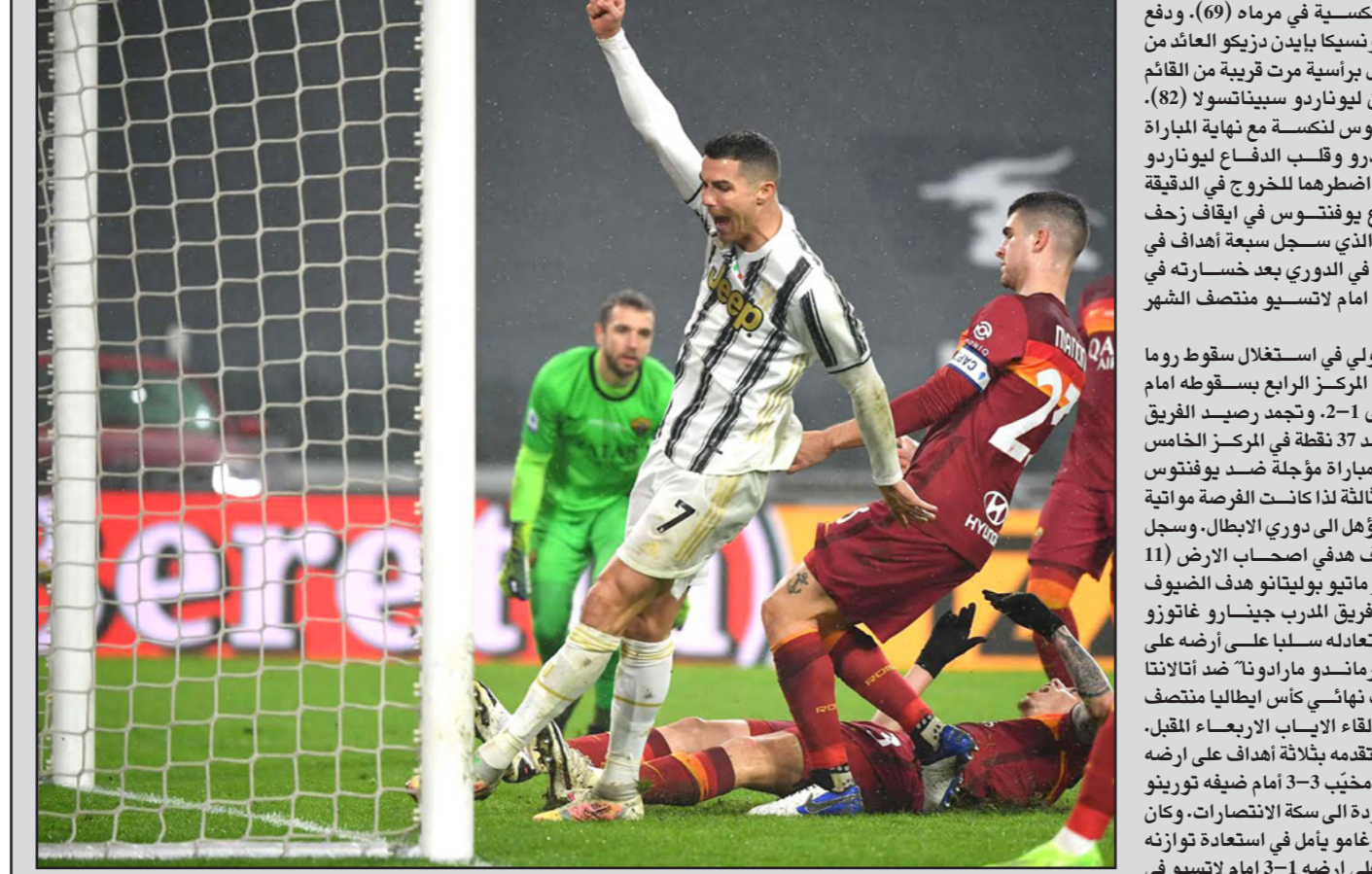
رونالدو يرفع يده محتفلاً بتسجيل الهدف الأول ليوفنتوس في مرمى روما