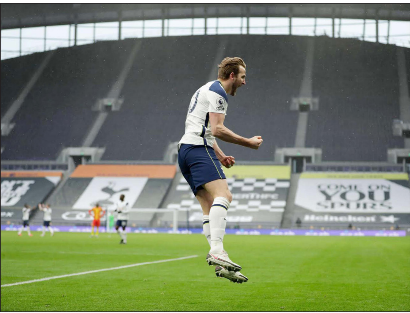
كاين يحتفل بتسجيل الهدف الأول لتوتنهام في مرمى البيون

■ لندن - أ ف ب: أعاد قائد المنتخب الإنجليزي هاري كاين توتنهام إلى سكة الانتصارات بقيادته إلى الفوز على ضيفه وست بروميتش البيون 2-0، في المرحلة الثالثة والعشرين للدوري الإنجليزي، فيما حرم إيفرتون مضيفة مانشستر يونايتد من إبقاء الضغط على جاره وغريمه السويدي المتصدر عندما فرض عليه تعادلاً قاتلاً ومثيراً 3-3 في الدقيقة الأخيرة من الوقت بدل الضائع. ومنح كاين، العائد إلى الملاعب بعد تعافيه من إصابة في كاحله، التقدم لتوتنهام في الدقيقة 54، وساهم في الهدف الثاني الذي سجله الكوري سون هيوغ من بين بعدها بأربع دقائق. وانفرد الثاني كاين وسون بالمرکز الثاني على لأكثر الأهداف برصيد 13 هدفاً لكل منهما، بفارق هدفين خلف مهاجم ليفربول محمد صلاح المتصدر. ومنحت عودة كاين نشاطاً كبيراً لخط هجوم المدرب جوزيه مورينيو، وكان قريباً من هز الشباك أكثر من مرة في الشوط الأول قبل أن يفعلها مطلع الثاني إثر تلقيه كرة داخل المنطقة فهاها بيسراه وسددها زاحفة بيميناه إلى يسار الحارس سام جونستون (54). وعزز سون تقدم توتنهام إثر هجمة مرتدة منسقة بدأها كاين الذي مرر كرة بيسراه إلى لوكاس مورا فأنطلق بسرعة وتلاعب بالدفاع حتى مشارف المنطقة قبل أن يمررها للكوري القادم من الخلف بدون مراقبة فسدها بيميناه في الزاوية اليمنى البعيدة للحارس (58). وصعد توتنهام إلى المركز السابع برصيد 36 نقطة بفارق الأهداف أمام تشلسي. وافتفى يونايتد الثاني بنقطة رافعا رصيده إلى 45 نقطة بفارق نقطتين عن السويدي المتصدر الذي يحل على ليفربول الرابع في قمة المرحلة. علماً أن السويدي يملك أيضاً مباراة مؤجلة، وبفارق