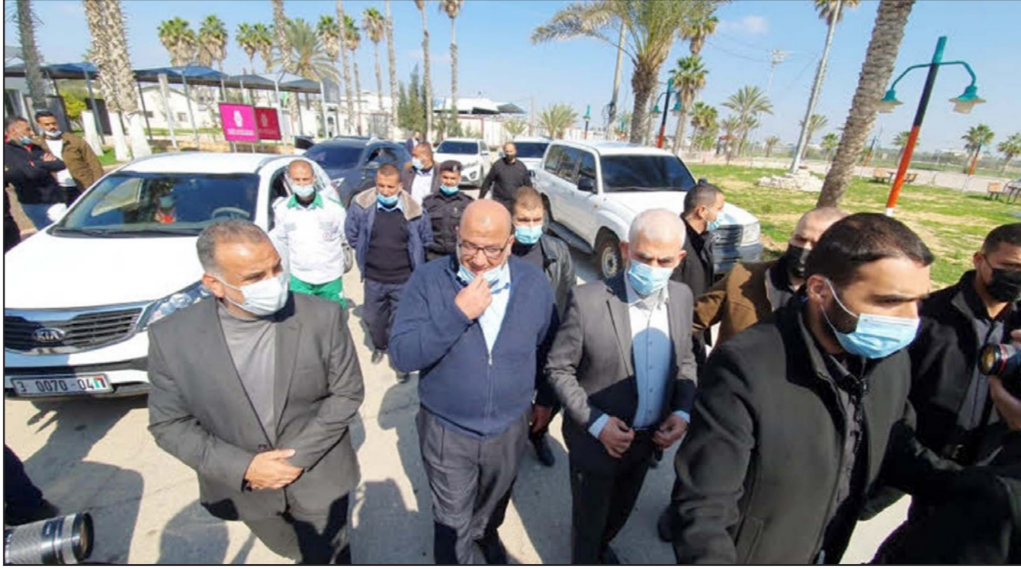
وفد حماس في طريقه الى القاهرة للمشاركة في الحوارات اليوم

وتعتبر ملفات القضاء والأمن من أكثر الملفات التي توجد حولها خلافات فصائلية، وستطرح بقوة للنقاش خلال حوارات القاهرة، حيث سيجري العمل على التوافق حول شكل «محكمة الانتخابات» التي ستبني في العلون والاعتراضات من قضاة من الضفة وغزة. وسيجري بحث ملف «أمن الانتخابات»، والجهة التي ستتولى الأمر، حيث ستطرح حركة فتح هذا الملف، خاصة في قطاع غزة، كونها لا تقرب بأجهزة الأمن المشكلة من حركة حماس، ومن شأن استمرار الخلاف حول هاتين المسألتين أن يفجر الخلاف، ويهدد مستقبل عملية الانتخابات، حيث يعمل الجميع على عدم الوصول لهذه النقطة.