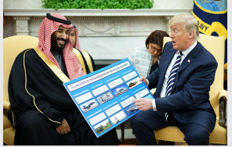
بايدن قد يقطع عن السعودية إمدادات الذخيرة بما في ذلك قرار اللحظة الأخيرة من إدارة ترامب لتدمير صفقة قنابل وقطع غيار