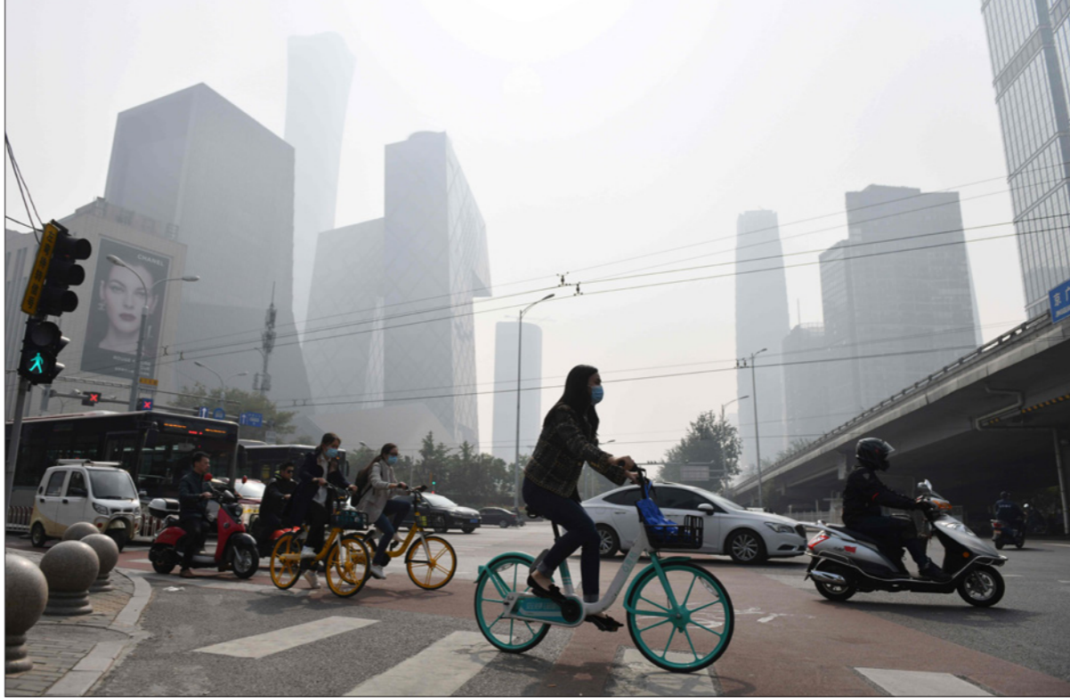
صينيون يعبرون الطريق في يوم ملوث في بكين

حسب مركز الدراسات الإستراتيجية الدولية في واشنطن. وأعلن أن «السيداريو الجديد مع التضاعف المتسارع للامكانات، يفتح طريقاً لا عودة فيه إلى الوراء، بحيث يتمكن من لعب دور متزايد الأهمية في الاقتصاد الوطني». ولتسهيل الأمور، أعلنت الحكومة أيضاً عن إنشاء مكتب لتقديم طلب للحصول على ترخيص في القطاع الخاص. وأكد رئيس الوزراء مانويل ماريو «من المهم أن تسير الأمور على ما يرام». ولكن هناك مطلب واحد معلقاً يتمثل في إمكانية إنشاء مؤسسات صغيرة ومؤسسات الحجم، ويتسامل الخبير الاقتصادي بيدرو مونريال على موقع تويتر عما إذا كان هذا الإصلاح «سيكون الخطوة الأولى» قبل الموافقة على إنشاء الشركات الصغيرة والمتوسطة، وهو أمر تدرسه الحكومة منذ 2016. وقال إن «الإصلاح يجب أن يعطي الأولوية للشركات الصغيرة والمتوسطة الخاصة لأنها توفر إمكانات إنتاجية أفضل للعمال».