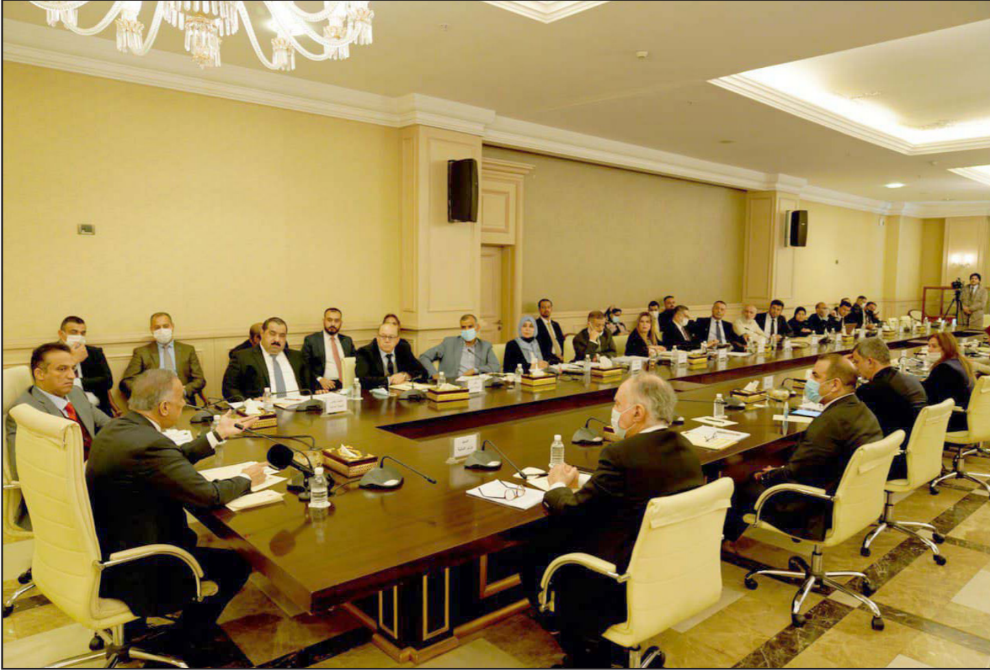
الكاظمي خلال اجتماعه مع أعضاء اللجنة المالية في البرلمان العراقي