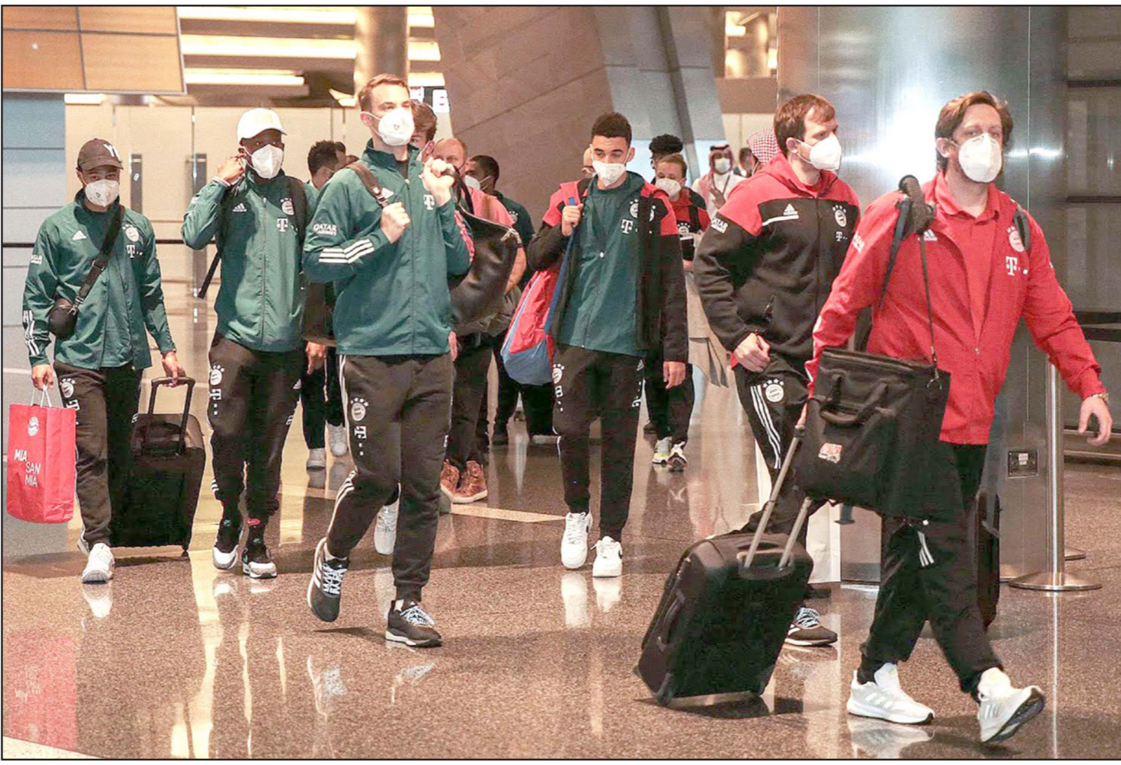
لاعبو بايرن ميونخ يصلون إلى مطار الدوحة بعد تأخير 7 ساعات

وبقي لقب موندنيال الأندية أوروبا منذ تتويج النادي البافاري عام 2013 على حساب الرجاء المغربي. ويعلم الأهلي أن يكرر انجاز مازيمبي الكونغولي وصيف 2010 والرجاء وصيف 2013، التاهلين الوحيدين من إفريقيا إلى النهائي. وقال مدرب الجنوب أفريقي بيتسو موسيماي: "ليس لدينا ما نخسره أمام فريق نجم البيايرن. بل اعتقد أن هناك الكثير من المكاسب ستتحقق من مواجهة بطل