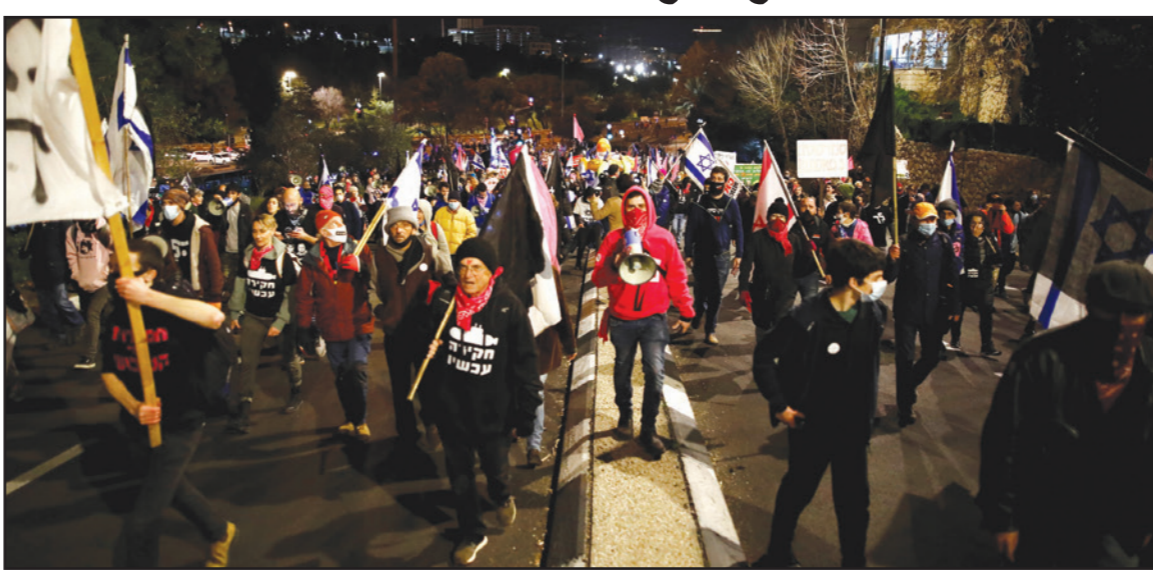
متظاهرون يحملون ملصقات وأعلاما للاحتجاج على فساد رئيس الوزراء الإسرائيلي بنيامين نتانياهو أمس

التطبيع مع دول خليجية، علما أنه تم تكريم عدد مماثل من النساء ومنحن شهدات امتياز قبل عام، وخلال الاحتفالية الخاصة قال رئيس الدولة «لا يوجد في قاموس الموساد كلمة مستحيل».