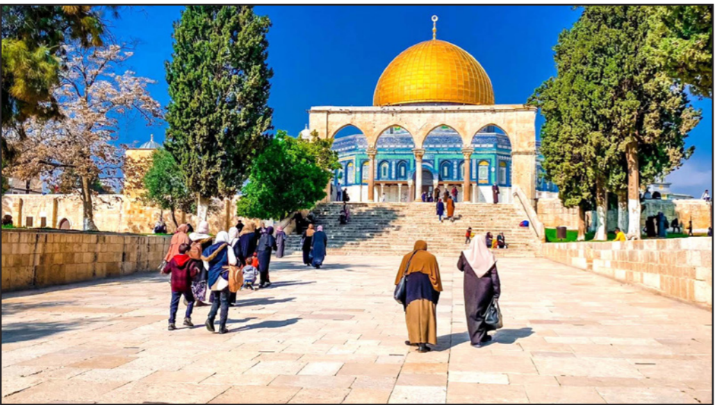
عودة الحياة تدريجيا للأقصى بعد إغلاق طويل بسبب كورونا

عقب اقتحام منزلها وتفتيشه في بلدة بيت حنينا، وأُرجح عنها في وقت لاحق. إلى ذلك اقتحم المستوطنون باحات المسجد الأقصى من جهة باب المغاربة وأجروا بحماية أمنية مشددة، جولات استفزازية استمعوا خلالها لشروحات حول «الهكل» المزعوم، كما اشتعل الاقتحام على التجول على مقربة من منطقة «مصلى باب الرمة» الذي يربد الاحتلال تحويله إلى «كنيس يهودي».