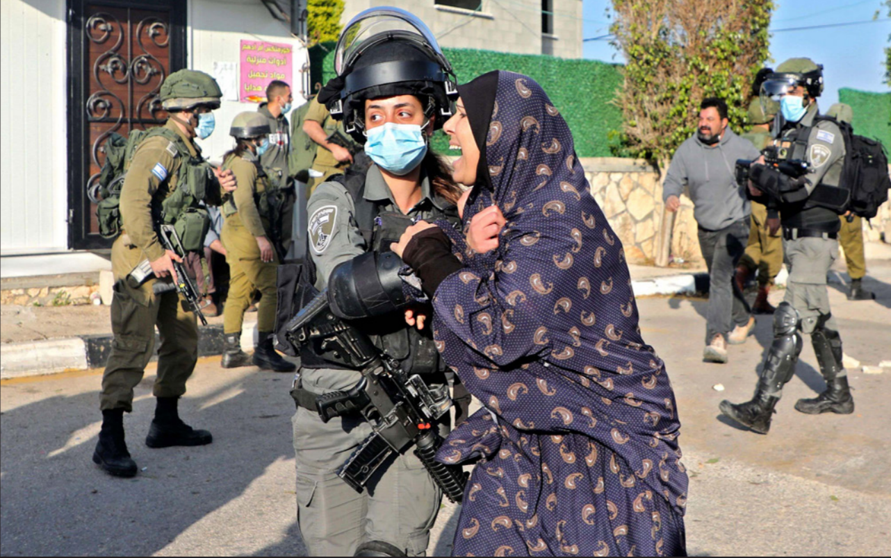
سيدة فلسطينية تشتبهك مع جندة إسرائيلية أثناء هدم منزلها في منطقة جنين شمال الضفة