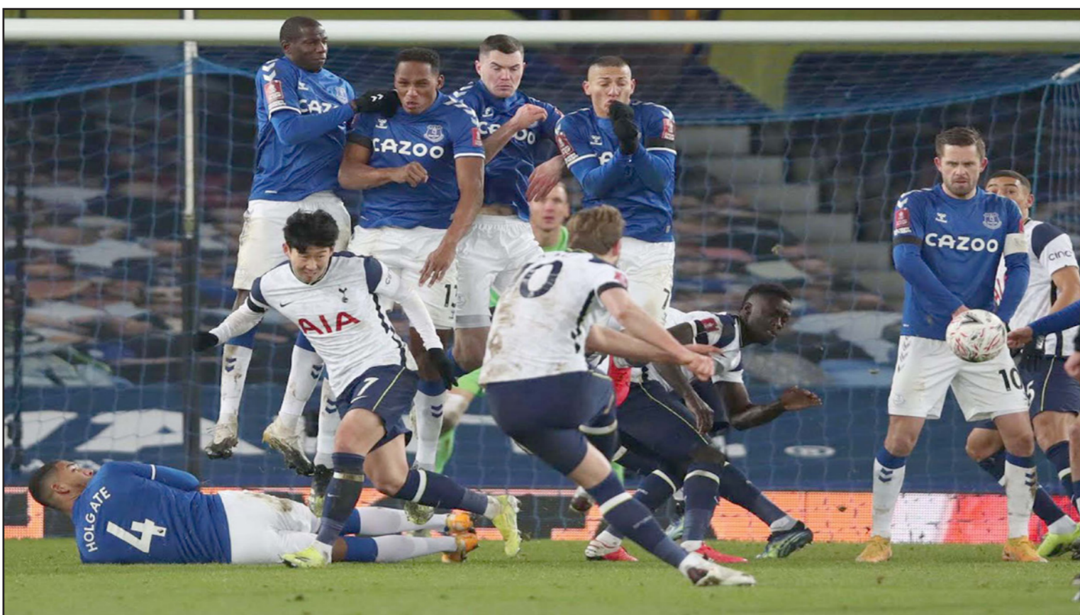
كاين يسدد كرة حرة بين حائط إيفرتون خلال المباراة المثيرة التي خسرها توتنهام

■ لندن - آ ف ب: لحقت أندية مانشستر سيتي وليستر وإيفرتون ومانشستر يونايتد إلى ربع نهائي كأس الاتحاد الإنكليزي بفوز الأول على سوانزي (درجة أولى) 3-1، والثاني على برايتون 1-صفر، والثالث على توتنهام 5-4 بعد التمديد في ثمن النهائي. في المباراة الأولى، سجل كایل ووكر (30) ورحيم ستيرلنج (47) وغابريال جيزوس (50) أهداف سيتي، ومورغان وايتكير (77) هدف سوانزي. وكان مانشستر يونايتد وبورنموث من (درجة أولى) أول المتأهلين إلى ربع النهائي بفوز الأول على وستهم 1-صفر بعد التمديد، والثاني على مضيغة بيرنلي 2-صفر في افتتاح مباريات ثمن النهائي. وهو الفوز الخامس عشر على التوالي للسيتي في مختلف المسابقات أكد به استعداده الجيد للقمم المرتفعة ضد توتنهام غدا وإيفرتون الأربعاء المقبل وأرسنال في 21 شباط/فبراير في المراحل 24 و25 و26 للدوري الذي يسعى إلى استعادته لقبه حيث يتصدر بفارق خمس نقاط أمام جار ه يونايتد مع مباراة مؤجلة، قبل أن يلحق ضيفا على بوروسيا مونشنغلادباخ الألماني في ذهاب ثمن نهائي دوري أبطال أوروبا. وضمن السيتي الذي بلغ المباراة النهائية لكأس الرابطة للعام الرابع على التوالي حيث سيلتقي في 25 نيسان/أبريل في سعيه للقب الرابع تواليا والثامن لمعادلة الرقم القياسي الموجود بحوزة ليفربول، باستعادة لقب كأس الاتحاد الذي فقدته الموسم الماضي بخسارته أمام أرسنال في نصف النهائي، وبالتالي تحقيق رقبة تاريخية (الدوري والكأس المحليان ودوري الإبطال). كما أنه الفوز رقم 200 لغوارديولا في 268 مباراة مع السيتي. وعلى المدرب بيب غوارديولا قائلا: "إنه أمر مذهل لنا، لا يمكننا أن ننكر مدى مساعدا وفخرنا بتخطيم هذا الرقم القياسي. فالسجلات موجودة لتهيئة لمخيمها، لكن يتعين عليهم القيام بعمل جيد (لتحطيمها)". مضيفا أنه