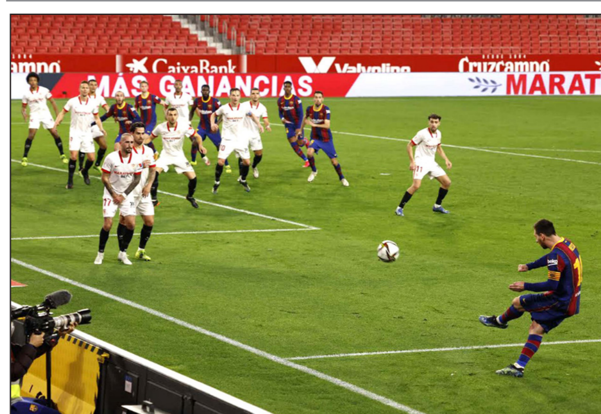
ميسي يرفع الكرة لزملائه خلال خسارة برشلونة أمام اشبيلية