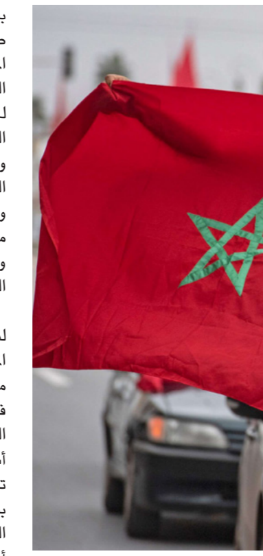
مغربيان يحتفلان باعتراف ترامب بمغربية الصحراء

بسيادة المغرب على الصحراء بحكم صفة الشريك التاريخي الذي يتمتع بها المغرب في أعين الأمريكيين، ويركز هذا الفريق على أن القرار قد يكون مديلا للاستقرار في المغرب العربي وحل هذا النزاع الذي دام أكثر من خمسة عقود، وبين معارض للقرار ووصفه بخرق القانون الدولي كما ذهب إلى ذلك وزير الخارجية الأسبق جيمس بيكر مستعرضا رؤيته في مقال بجريدة واشنطن بوست، ومطالباً بضرورة التراجع عنه. وقبل معالجة مجلس الأمن الدولي لنزاع الصحراء خلال نيسان/أبريل المقبل، ستكون واشنطن قد بلورت موقفاها في هذا الشأن بالاستمرار في الاعتراف بالسيادة المغربية على الصحراء من عدمه، وتفيد المعطيات التي أشارت إليها سابقا «القدس العربي» ترجيح الإبقاء على الموقف مع رطه بشروط واضحة تتعلق بضرورة التزام الرباط احترام حقوق الإنسان وتحديد أجددة واقعية وواضحة لتطبيق الحكم الذاتي في الصحراء، لكن تصريحات هذا الدبلوماسي تترك كل شيء معلقاً بعدما قال إن كل قرار سيكون بالتشاور مع الحلفاء والأمم المتحدة. وكانت هذه الأخيرة قد انتقدت قرار ترامب، بينما الدول الغربية لم تتسايره باتخاذ قرار مماثل.