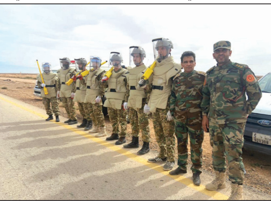
عناصر من الجيش الليبي بعد القيام بعملية تفجير لخلفات الحرب أمس