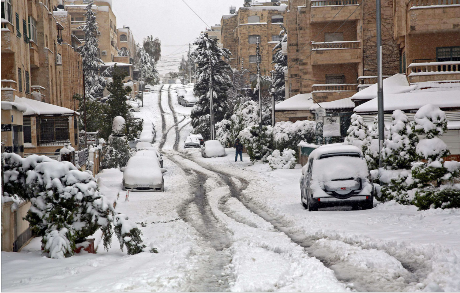
عمان - أ ف ب: غطت الثلوج مناطق الأردن كافة في ظل موجة صقيع حادة حيث ظهرت عمان في حلة بيضاء بينما تسببت الموجة في اقفال الطرقات والمدارس والمؤسسات والمحال التجارية لتزيد من عزلة الأردنيين وسط أزمة الوفاء المتواصلة منذ سنة.