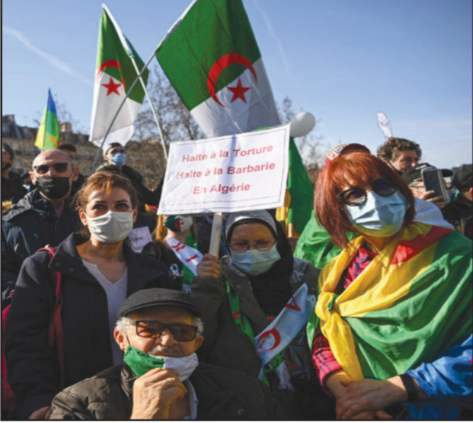
متظاهرون يحملون أعلاما وملصقات تطالب بوقف التعذيب في الجزائر أمس

الأمم المتحدة للبرلمان، تنفيذاً لقرار أعلنه فوزه في أولى انتخابات رئاسية عقب استقالة عبد العزيز بوتفليقة (1999-2019)، تحت ضغط احتجاجات شعبية مناهضة لحكمه ومطالبة ديستمبر/ كانون الأول 2019، إثر