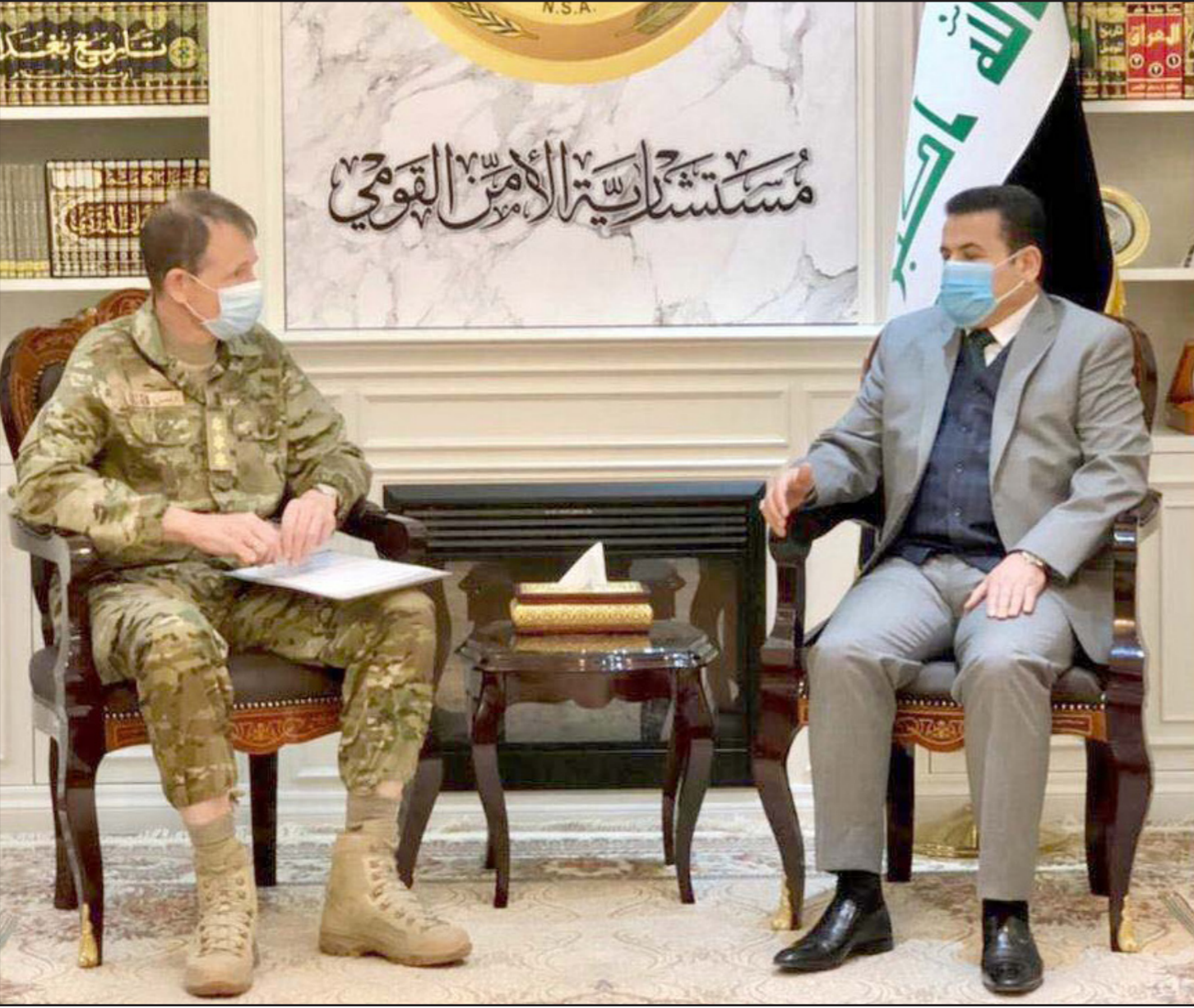
مستشار الأمن القومي العراقي قاسم الأعرجي مستقبلاً قائد بعثة الناتو ببيير أولسن

من مجلس النواب والقوى السياسية والشعب العراقي لخروجها من العراق، بالتالي فهي سعت من خلال مشروع زج حلف الناتو للتدخل بالشأن العراقي ولكن بصيغة أخرى».