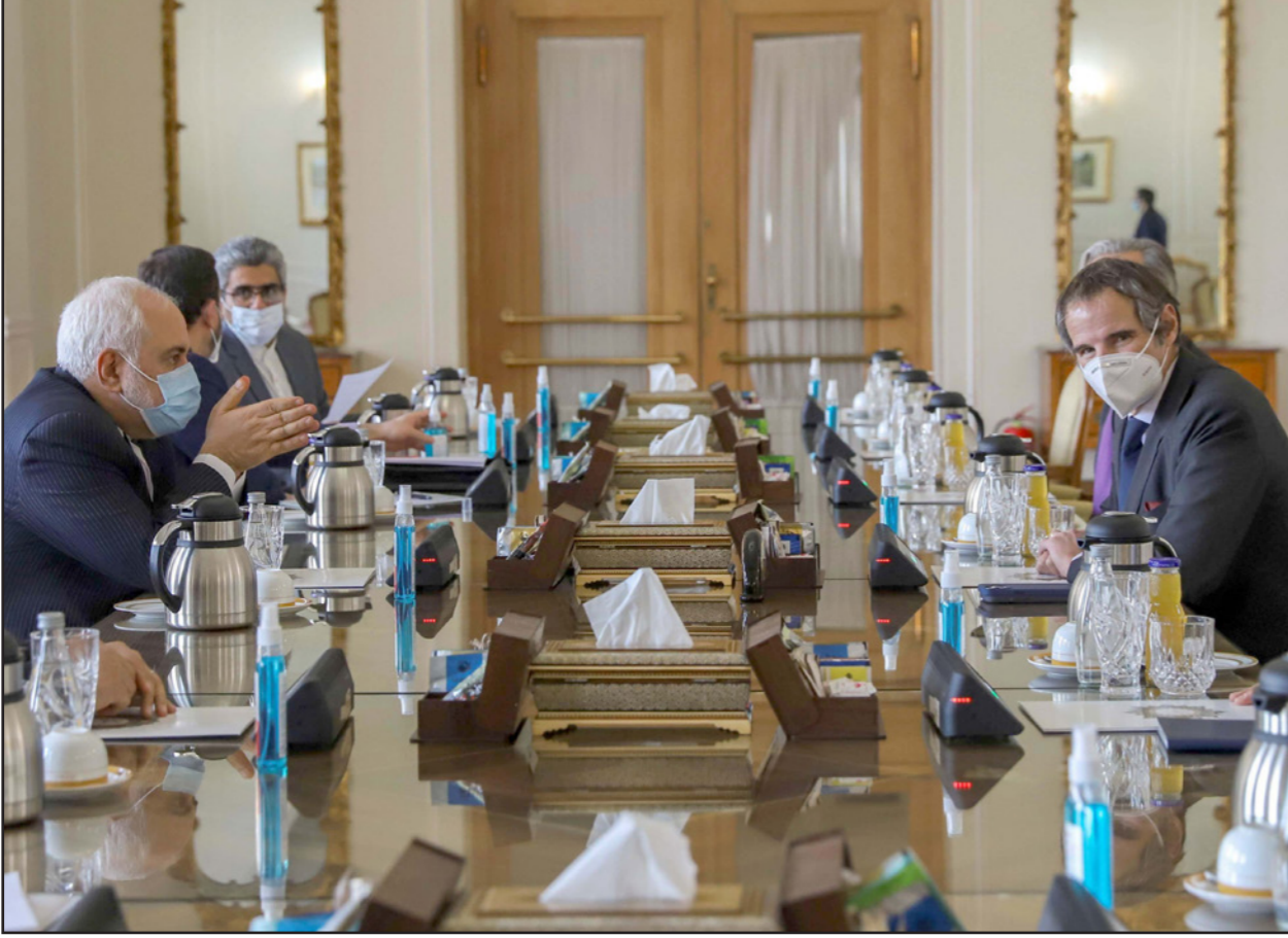
وزير الخارجية الإيراني محمد جواد ظريف خلال لقائه مدير الوكالة الدولية للطاقة الذرية رافاييل غروسي في طهران أمس

التي تعني تنفيذ قرار البرلمان (...) وفي الوقت نفسه، عدم الوصول إلى طريق مسدود لكي يتمكن من تنفيذ التزامات لإظهار أن برنامج إيران النووي يبقى سلمياً، وكان المدير العام أكد سابقاً أن زيارته هدفها إيجاد «حل مقبول من الطرفين (...) لتتمكن الوكالة الدولية للطاقة الذرية من مواصلة نشاطات التحقق الأساسية في إيران». استسحبت إدارة الرئيس الأمريكي السابق دونالد ترامب أحادياً من الاتفاق النووي العام 2018، وأعدت فرض عقوبات اقتصادية قاسية على طهران. وبعد عام من ذلك، بدأت إيران على التراجع تدريجياً عن العديد من الالتزامات الأساسية في الاتفاق المبرم في فيينا العام 2015 بينها وبين كل من الولايات المتحدة وفرنسا وبريطانيا وروسيا والصين وألمانيا. وبموجب قانون أقره مجلس الشورى الإيراني في كانون الأول/ديسمبر، يتعين على الحكومة الإيرانية تعليق التطبيق الطوعي للبروتوكول الإضافي الملحق بمعاهدة الحد من انتشار الأسلحة النووية، في حال عدم رفع واشنطن للعقوبات بحلول 21 شباط/فبراير، وسيقيد ذلك بعض جوانب نشاط مفتشي الوكالة التي تلغيت من طهران دخول الخطوة حيز التنفيذ في 23 منه. وأشار ظريف إلى أن من بين الإجراءات الجديدة «عدم تزويد (الوكالة) بتسجيلات الكاميرات»، في المنشآت، موضحاً أن التفاصيل التقنية ستبحث بين الوكالتين الدولية والإيرانية، وشدد على أن إجراءات بلاده لا تشكل خرقاً للاتفاق المعروف رسمياً باسم «خطة العمل الشاملة المشتركة»، وأوضح: «نحن لا نخرق خطة العمل الشاملة المشتركة، نحن نطبق خطوات تمويضية ملحوظة في خطة