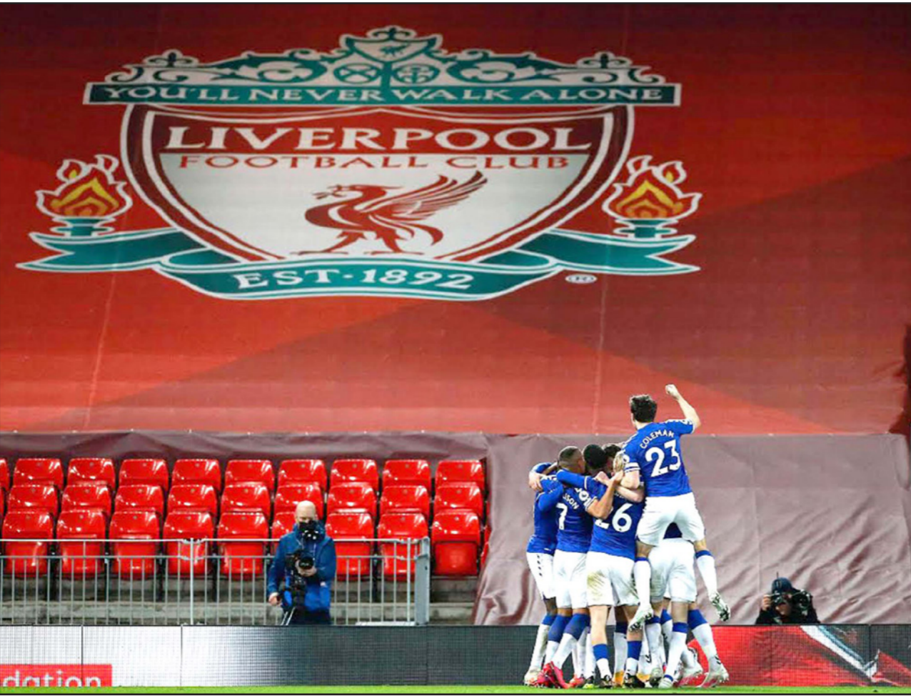
لاعبو ليفرتون يحتفلون بالفوز التاريخي في ملعب جارهم ليفربول «انفيلد»