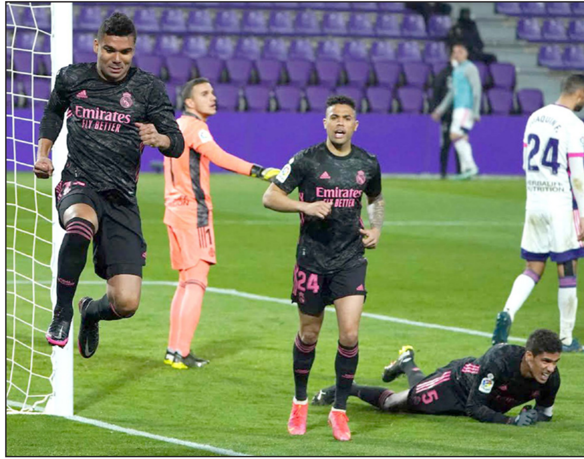
كاسيميرو يطير فرحاً بعد تسجيل هدف الفوز لريال مدريد في مرعى بلد الوليد