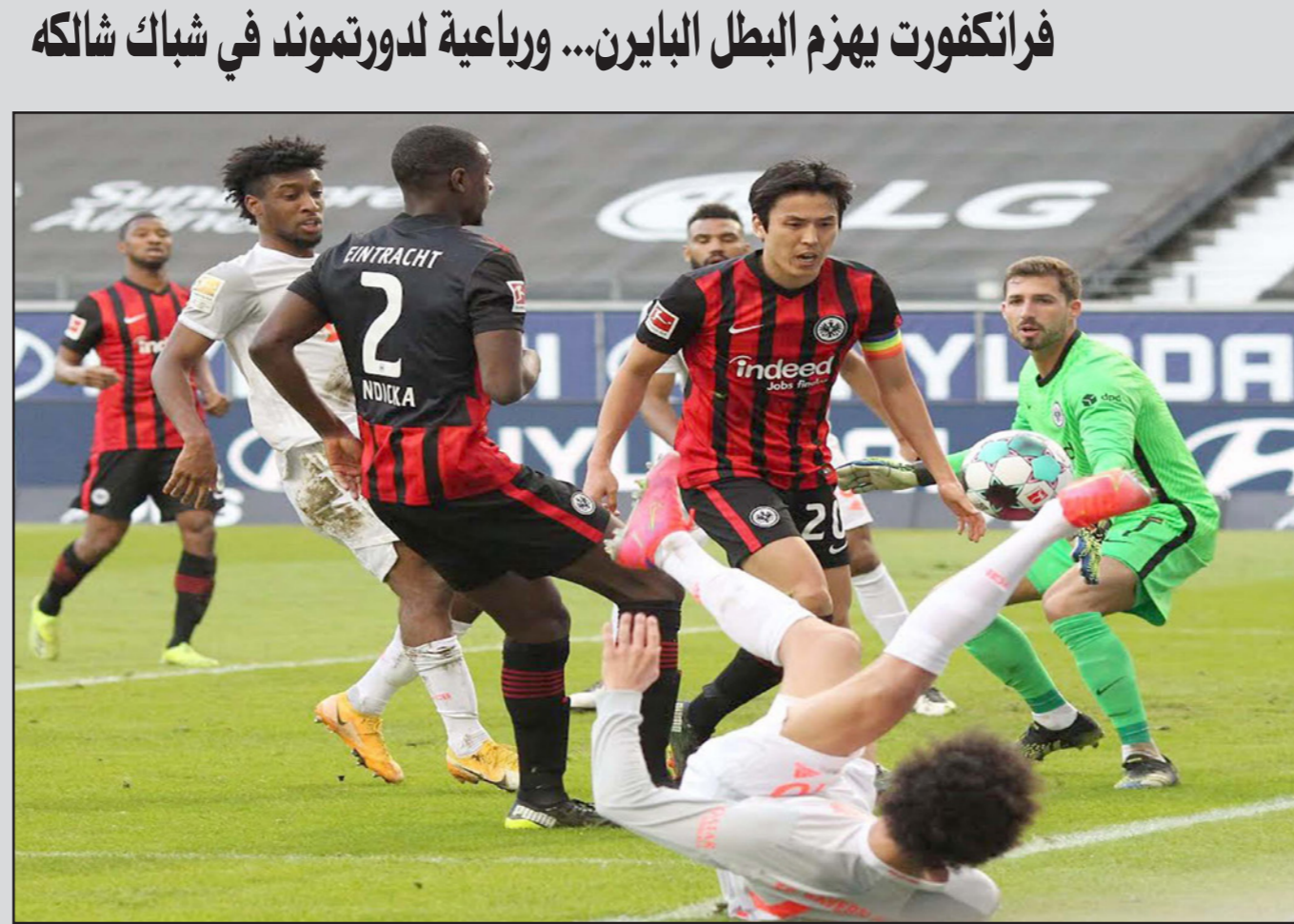
ليروي ساني نجم البايرن يحاول لعب الكرة وهو منبج على الأرض

فرانكفورت البرتغالي اندريه سيلفا صاحب 18 هدفا هذا الموسم لاصابة في ظهره ولم يشترك في المباراة. وسيطر فرانكفورت على مجريات الشوط الاول وسجل هدفيه عبر الياباني دايشي كامادا (12) عبر ثمن الدولي الالمني السابق واللبناني الاصل امين يونس بكرة لولبية رائعة سكنت شباك الحارس مانويل نوير (31). وانتقد نوير مرماه من هدف اكد في الثواني الاخيرة من الشوط الاول. وهاجم الفريق البايري بضراوة في الشوط الثاني ونجح روبرت ليفاندوسكي في تقليص الفارق بعد مجهود فردي رائع من الجناح ليروي ساني تلاعب به بمدافعين اثنين قبل ان يمر كرة متقنة داخل المنطقة تابعها الدولي البولندي بيمينه داخل الشباك (53) معززا صدارته في ترتيب الهدافين مع 26 هدفا. وطن الجميع ان البايرن كعادته سينتقد الموقف، لكن فرانكفورت عرف كيف يسد المنافذ المؤدية الى الحارس كيفن تراب حتى نهاية المباراة. والخسارة هي السادسة فقط لبايرن ميونيخ منذ تولى فليك الاشراف عليه في تشرين الثاني/نوفمبر 2019.