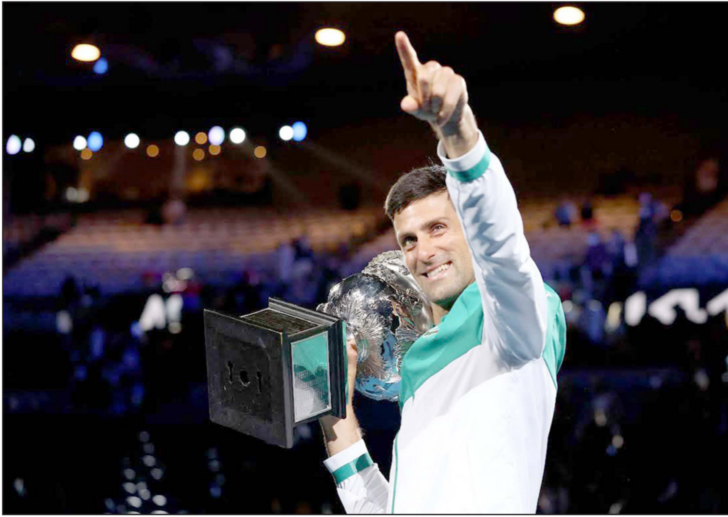
ديوكوفيتش يرفع كأس البطولة للمرة التاسعة في مسيرته

على المجموعة الثانية، وتمكن من كسر إرسال ميدفيديف المبارة بكسره لإرسال ميدفيديف لينهي المجموعة الثالثة 6-2 بعد مباراة استمرت ساعة و53 دقيقة، وعز هذا الفوز مكانة ديوكوفيتش باعتباره المصنف الأول عالميا، المباراة. لكن الإحصائيات تجعله نهائيا لا ينسى 2-6. وواصل ديوكوفيتش بعدها التفوق في المجموعة الثالثة، واستقل توثر خصمه وارتكبه أخطاء كثيرة، وكسب أشواط إرساله بسهولة، قبل أن يتمكن من حسم