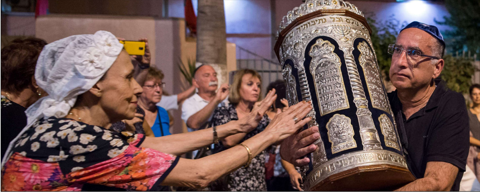
اليهود في المغرب