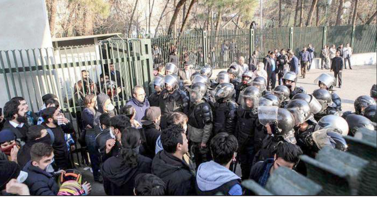
أرشيفية لمواجهات بين الشرطة وطلبة إيرانيين خارج إحدى الجامعات

■ باريس - أ ف ب بعدما قطعت إيران الشهر الماضي خدمة الإنترنت في محافظة سيستان - بلوشستان في جنوب شرق البلاد أيام الهدف التعميم على تظاهرات، يقيد ناشطون أن الحكومة تلجأ إلى هذا التكتيك بشكل متكرر عند حدوث احتجاجات. وحسب منظمات مدافعة عن حقوق الإنسان، قتل عشرة أشخاص على الأقل عندما فتحت قوات الأمن النار في 22 شباط/فبراير على ناقلات وقود قرب مدينة سراوان في محافظة سيستان - بلوشستان، ما أثار تظاهرات أطلقت خلالها قوات الأمن الرصاص الحي.