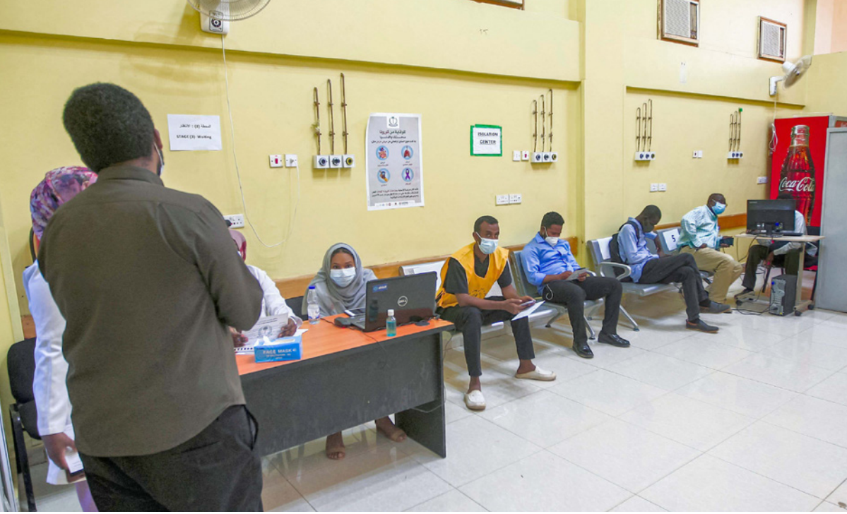
عاملون في القطاع الصحي السوداني يستعدون للتطعيم ضد فيروس كورونا

وزاد «النيل الرئيسي من الخرطوم إلى عطبرة سيتعرض هذا القطاع للتأثيرات نفسها وستقل كميات المياه وتتناقص المناسيب وستقل مساحة الجروف المزروعة والمراعي، وأوضح ضو البيت «يتوجب على جميع العيّن اتخاذ الاحتياطات اللازمة لتجاوز آثار الملء والتشغيل خلال الفترة من نيسان/ أبريل حتى أيلول/ سبتمبر 2021، وستعمل وزارة الري والموارد المائية على توفير تفاصيل أكثر حول برامج تفريغ وملء الخزانات المذكورة أولاً بأول».