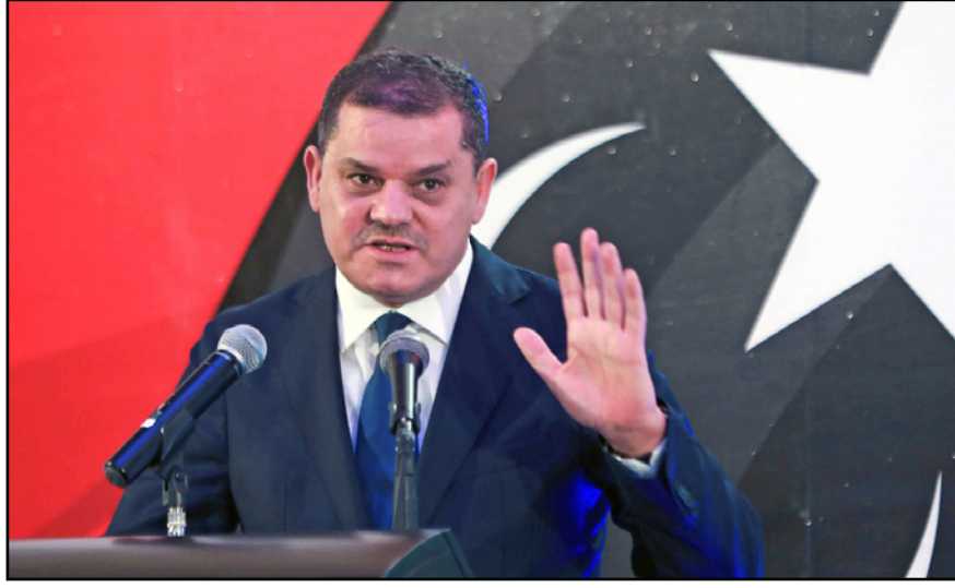
رئيس حكومة الوحدة الوطنية الليبية عبد الحميد الديبية

■ سرت - وكالات: استأنف البرلمان الليبي جلسته الاستثنائية المنعقدة في مدينة سرت أمس الثلاثاء لاستكمال النقاش والسماع لرئيس الحكومة بشرح خريطة طريق عمل حكومته، إلى جانب السرد على تساؤلات النواب. وأعلن رئيس حكومة الوحدة الوطنية الليبية، عبد الحميد الديبية، الثلاثاء، تشكيلته الوزارية، عقب كلمة ألقاها أمام مجلس النواب الليبي، وتشتمل الحكومة 26 وزرا، وستة وزراء دولة، مع ثمانية لرئيس الحكومة. وندد في كلمته بما وصفها بأنها «حملة شرسة» تهدف إلى «تدمير» البلاد، متزامنا مع شبهات الفساد التي تخيم على العملية السياسية التي أدت إلى تكليفه. ودعا الديبية في كلمته النواب إلى منح حكومته الثقة، قائلًا: «ليس أمامنا من خيار سوى أن نتفق... من أجل مستقبل أطفالنا (...)». هدد في الأول اختيار الأشخاص الذين يمكنهم العمل معهم، بغض النظر عن المكان الذي يأتون منه. وعن الحملة التي طالته بسبب مزاعم الفساد، قال إنه «مستعد لتلقي أي مسائلة... لا أعرف سوى العمل»، مؤكدا أهمية الإبعاد عن «عوائق التمثيل» في إشارة لتشكيلته الوزارية التي تعرضت للجدل ورفضها بعض النواب.