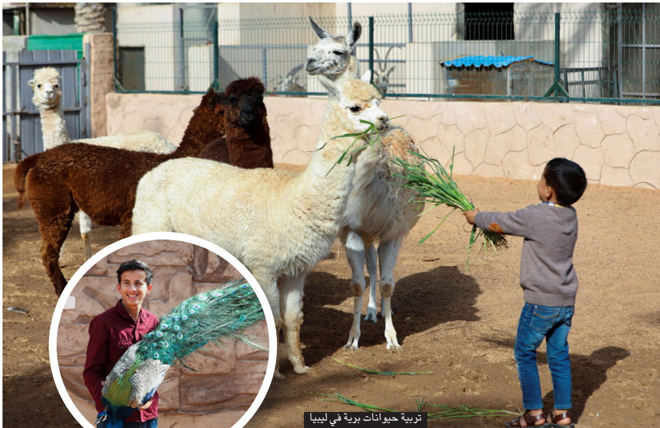
تربية حيوانات برية في ليبيا

وتلعت الكثير من الأنواع بالبنسبة للحيوانات، من أول ما وعيت على الدنيا وجددت الحيوانات قدامي، الغزال، النعام، الأيل، قعدت حافظهم واتعامل معهم بالطريقة الصحيحة، وكل شيء وطريقتهما في التعامل وأصبحت علاقات بهم الآن غرام وأعتاد عليهم أكثر وأكثر». وأضاف «عشقي للحيوان شعور لا يوصف، طبيعي كل صباح تأتي للحيوانات نغفرت ونوكل ونجلس جنبهم وأتابع حالتهم الطبيعية وأنظف الحيوان الذي يمرض أمته به واتصل بالطبيب لو لذي حيوان مريض، وفي الليل أبقى سهران معه شبيه للصبح والحمد لله لست مقصراً، أعطيهم حقيم وزيادة»، وأوضح دياب أن بعض الحيوانات عرضة لخطر الانقراض في ليبيا بسبب الصيد الجائر، وهي