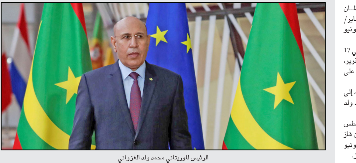
الرئيس الموريتاني محمد ولد الغزواني

■ نواكشوط - الأناضول: شددت الشرطة الموريتانية، الثلاثاء، من إجراءاتها الأمنية في محيط قصر العدل بالعاصمة نواكشوط، استعداداً لمثل عشرات المتهمين بملفات فساد أمام المحكمة، بينهم الرئيس السابق محمد ولد عبد العزيز. وطوقت الشرطة محيط قصر العدل في نواكشوط، خلال ساعات الصباح الأولى، حيث من المقرر أن تنطلق أول محاكمة لولد عبد العزيز وعدد من رموز حكمه في وقت لاحق الثلاثاء. كما فرضت الشرطة إجراءات أمنية مشددة أمام إدارة الأمن الوطني في نواكشوط، ومنعت الصحفيين من التصوير. وتضم إدارة الأمن الوطني مقر شرطة مكافحة الجرائم الاقتصادية، التي تولت خلال الأشهر الماضية التحقيقات في ملف القضية. ومن المقرر أن يتوافد المتهمون في القضية، الذين يزيد عددهم عن 100، إلى هذا المقر أولاً، قبل أن يتوجهوا منه إلى قصر العدل للمثول أمام المحاكمة. ومن أبرز المتهمين في القضية إضافة إلى ولد عبد العزيز، وزير المالية السابق ومدير الشركة الوطنية للصناعة والمناجم (حكومية)