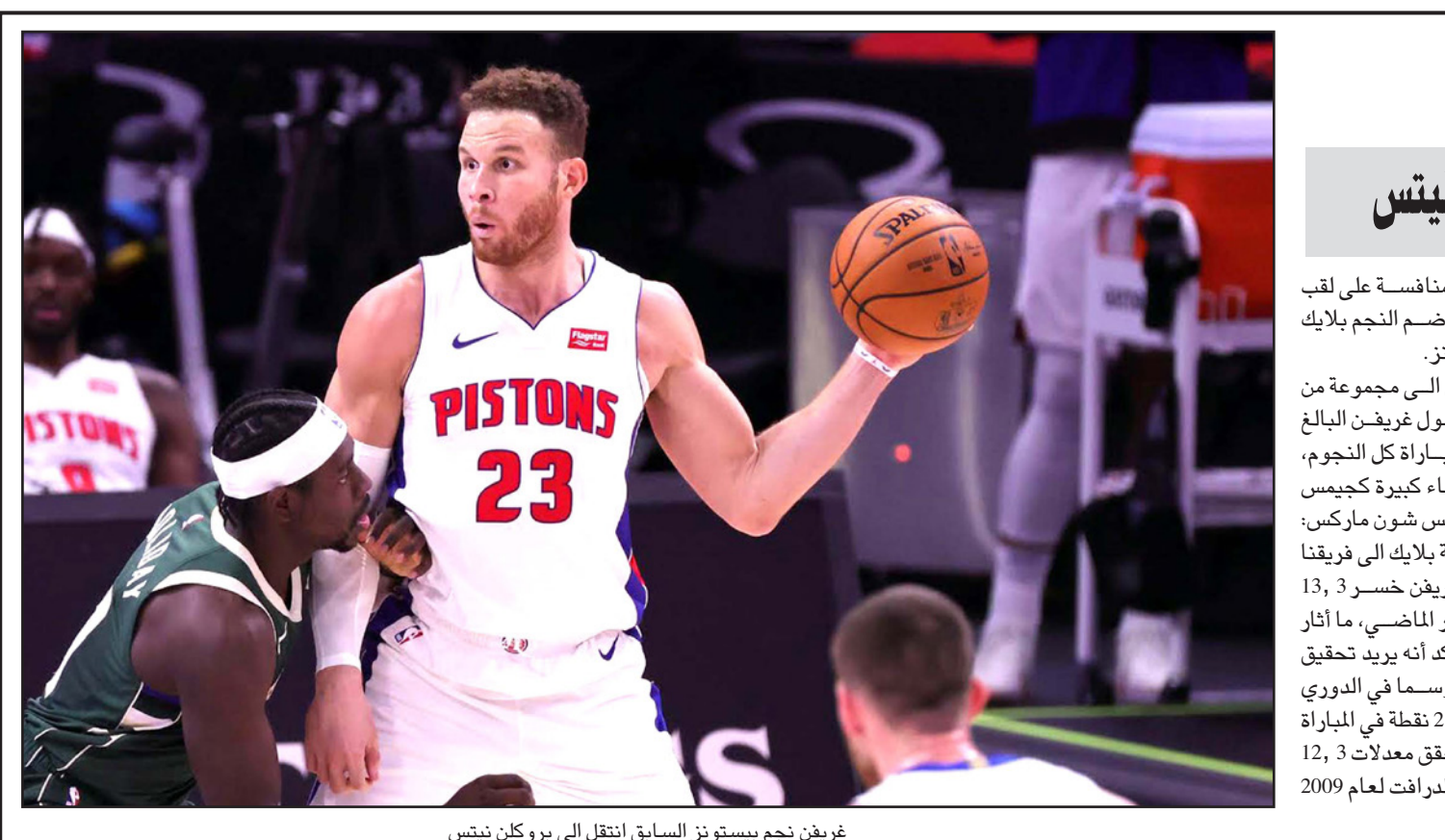
غريغن نجم بيستونز السابق انتقل إلى بروكلن نيتس

الدوحة - أ ف ب: مع انطلاق بطولة الكرة الطائرة الشاطئية في العاصمة القطرية، أعادت الدوحة التأكيد على ما أن أثر حيال قواعد اللباس الخاص بحظر البيكيني في هذا الحدث، ليس إلا "بروباغاندا لغايات أخرى"، فيما تواصل خطتها من أجل "عنابي السيدات". وواجهت قطر انتقادات من بعض الاعبات الشهر الماضي، بعدما قام الاتحاد الدولي بتحديث قواعد اللباس الرسمي ليطالب من السيدات ارتداء قمصان وسراويل طويلة، وأعلنت نجما اللعبة الألمانيتان كارل بورغر ويوليا سوده الشهر الماضي، إنهما ستسقطان البطولة التي تستضيفها قطر، لأنها تمنع الاعبات من ارتداء البيكيني. لكن الاتحاد القطري للعبة نفى لاحقاً مزاعمهما، كما ذكر الاتحاد الدولي لاحقاً أن المنظمين القطريين قدموا تأكيدات بأنه "لا توجد قيود على الاعبات اللواتي يرتدين الزي الرسمي"، وعلى هامش المباريات التي انطلقت الاثنين، وبمشاركة لاعبات