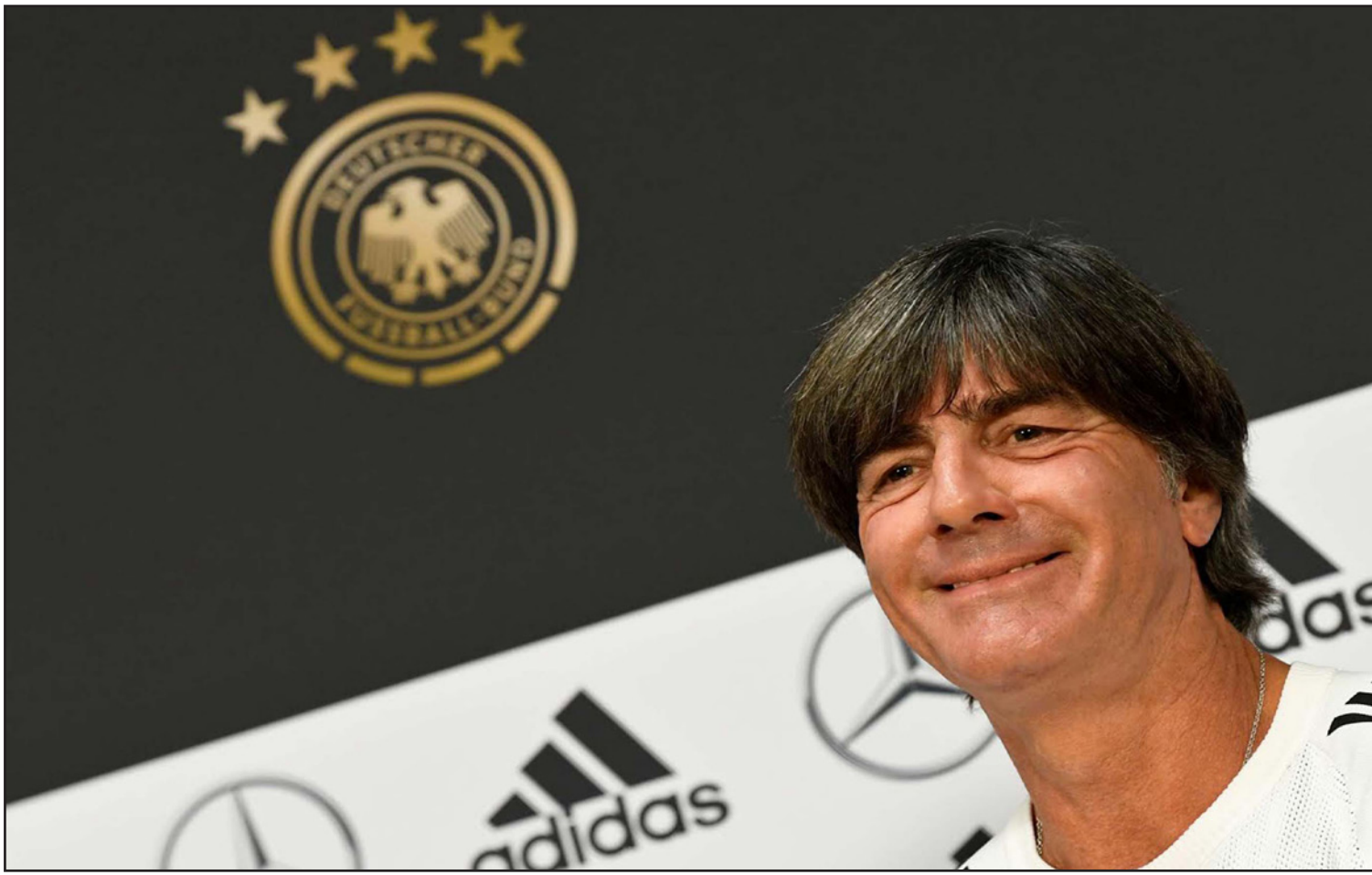
يوأكيوم لوف خاض رحلة مليئة بالإنجازات والإخفاقات مع المنتخب الألماني

نوفمبر الفائت ضمن دوري الامم الأوروبية، كانت الاقسي لبطل العالم ربيع مرات منذ 1931. إلا أن الاتحاد الألماني لم يرد حينها على تلك المطالبات وجدد ثقته بلوف حيث أصدر بياناً أكد فيه أن رئاسة الاتحاد الألماني قررت بالإجماع أن تواصل مع المدرب لوف الطريق الصعبة للتجديد التي بدأت في آذار/مارس 2019، وتضاعفت الدعوات الثلاثي من لوف في آذار/مارس 2019، وتضاعفت الدعوات