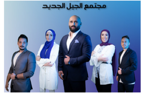
مجتمع الجيل الجديد