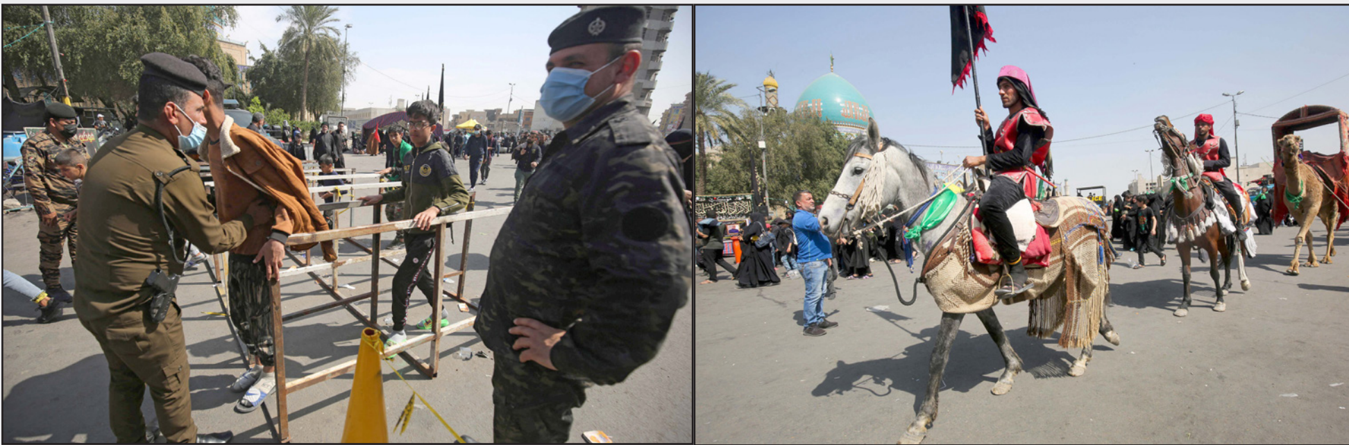
حجاج مسلمون شيعية يسبرون من وسط العاصمة العراقية بغداد في اتجاه حي الكاظمية الشمالي استعدادا لمراسم إحياء ذكرى وفاة الإمام الشيعي السابع موسى الكاظم في القرن الثامن الميلادي

هؤلاء المجرمين، وعدم الانشغال بالاحتفالات البروتوكولية وتبسيط الاحتراب الطائفي على حافة التفتاحات مزيفة جديدة ضد القتل والعملاء ليعبئوا بأمن الشعب ومصير الأمة»، قبيما، أذاع السفير التركي في العراق فاتح يلدين، أمس، الانفجار في «تغريدة» على «تويتر» قائلا: «أدين الاعتداء الذي وقع الليلة الماضية على جسر الأئمة على زوار الإمام موسى الكاظم. أمل النشفاء العاجل للجرحي، أدعو الله أن يحفظ وحدتنا». ويرتبط جسر الأئمة بوفاة نحو 1000 عراقي غرقا في عام 2005 بعد أن تسببت إشاعة بوجود متفجرات على الجسر بدفع آلاف الزائرين المتحمسين في الجسر إلى الماء أنفسهم في النهر، فيما مات عدد من الزائرين وأصيب آخرون بجروح نتيجة التدافع.