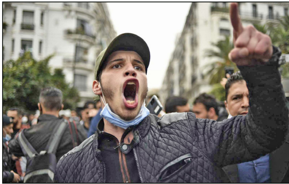
من مظاهرة للطلاب الجزائريين في العاصمة الأسبوع الماضي

الذكرى الثانية لبيادته سنة 2019، بعد انقطاع عام بسبب انتشار جائحة كورونا، وكان الرئيس تبون قد أكد في آخر لقاء مع وسائل إعلام محلية أن مطالب الحراك قد تحققت وأن من يخرجون للشوارع اليوم هدفهم التذكير بمطالب الحراك، بالإضافة إلى أن آخرين يخرجون لأغراض أخرى، حسب تعبيره.