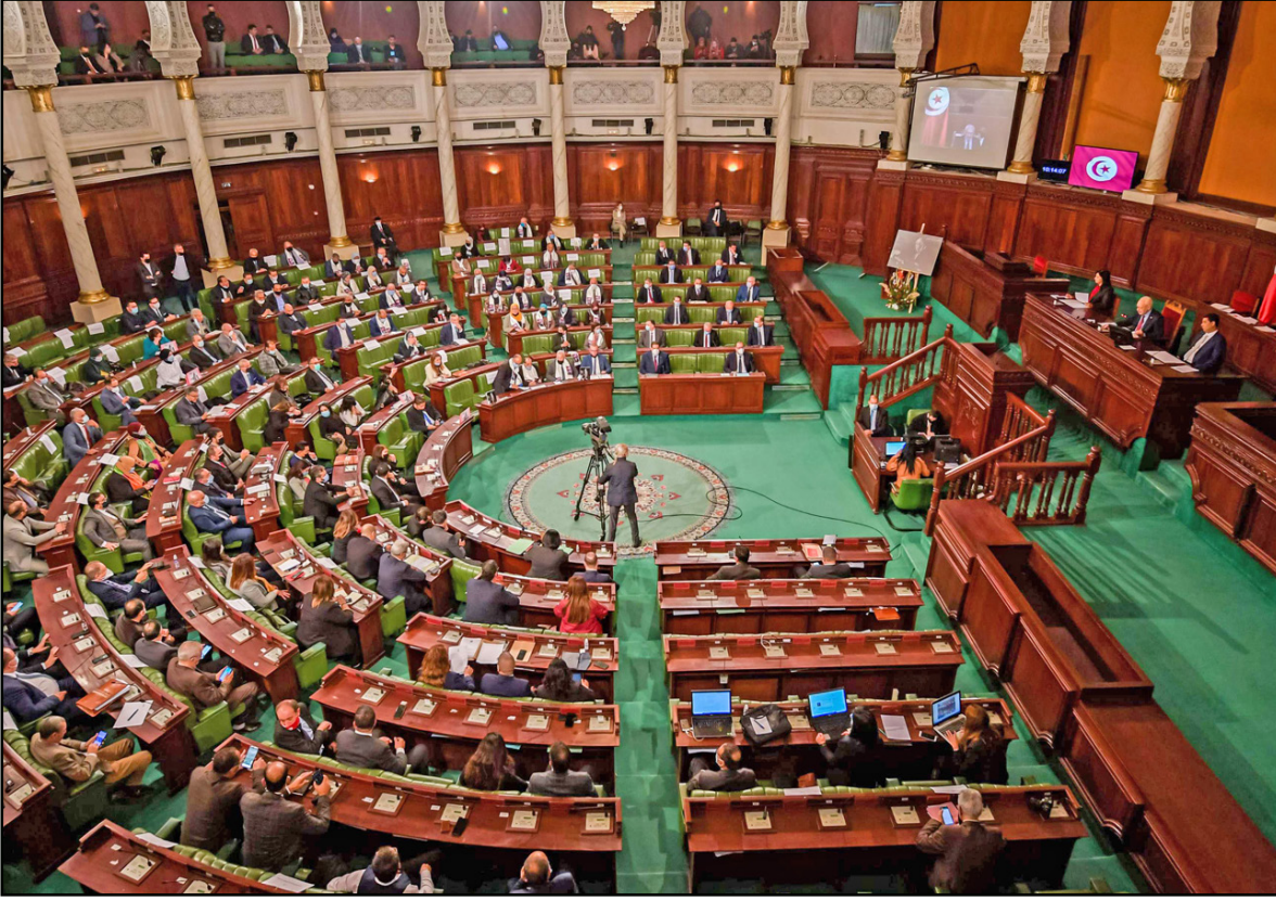
جلسة للبرلمان التونسي - أرشيفية