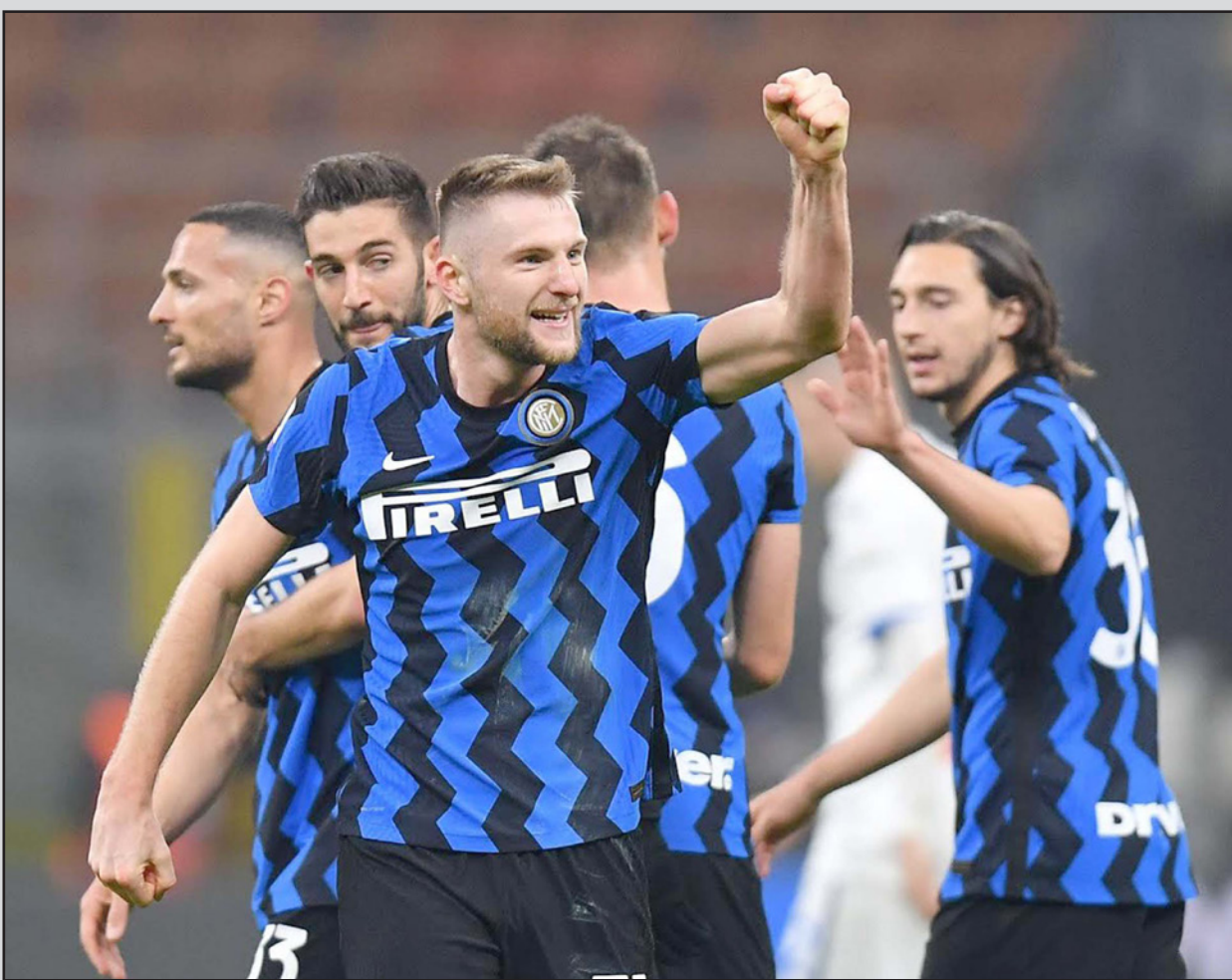
شكرينيار يحتفل بهدف الفوز الذي سجله لانتز في مرمى أتالانتا