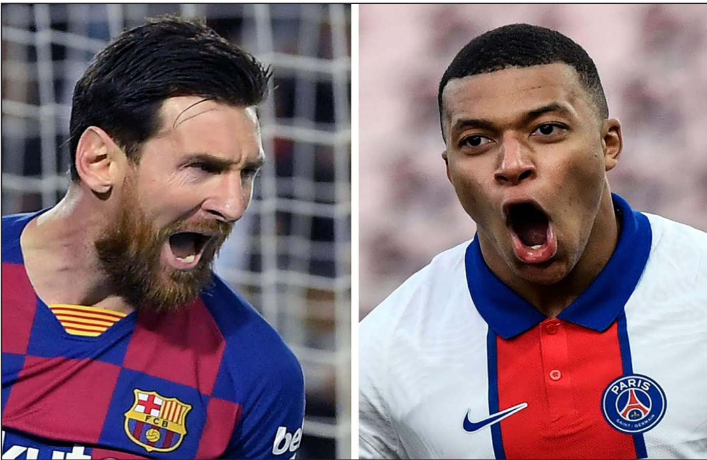
ميسي (يسار) يبعث عن الثار الليلية مع برشلونة من مبابي وسان جيرمان في باريس

باريس - أ ف ب: يدخل ليفربول وباريس سان جيرمان اياب ثمن نهائي دوري أبطال أوروبا اليوم، بعدما وضع كل منهما قدماً في ربع النهائي، إلا أن أي خطوة ناقصة أمام لايزيغ المتألق وبرشلونة المنتهني من عودة خوان لابورتا إلى الرئاسة ونتائج المحلية قد تغير المعادلة. الحق سان جيرمان خسارة مذلّة 4-1 ببرشلونة في عقر داره ذهاباً على ملعب "كامب نو" بقيادة نجمة الشاب كيليان مبابي صاحب الهاتريك، لذا يجد فريق المدرب ماوريسيو بوتشيتينو نفسه في موقع مؤات للعبور إلى ربع النهائي، إلا أن فريق العاصمة مني بانتكاسة محلية بعد التألق القاري عندما سقط بهدفين أمام موناكو في الدوري المحلي، لكن مذاك الحين عاد إلى السكة الصحيحة بانتصارين على ديجون وبوردو ويقتفي على بعد نقطتين من المتصدر ليل، قبل أن يعبر إلى ثمن نهائي الكأس على حساب بريست، إلا أن على الباريسيين التنبيه من ذكريات الريمونتا التاريخية في 2017 أمام المنافس ذاته وفي الدور ذاته، عندما فاز برباعية نظيفة ذهاباً قبل أن يسقط 6-1 في برشلونة، لكن المفارقة هذه المرة أن لقاء العودة سيقام في باريس، لكن تبقى كل السيناريوهات مفتوحة، خصوصاً مع تأكيد غياب نجم سان جيرمان نيمار لعدم جاهزيته وتعافيه من الإصابة، ورغم معاودة الترتيبات مؤخرًا، ويغيب أيضاً موز كين لصابته بكوفيد-19، وخوان بيرنات لإصابة في ركبته، أما ببرشلونة، ورغم إدراك النادي أن المهمة تتطلب معجزة كبيرة، يبقى الأمل موجوداً بعدما حقق "ريمونتا" أخرى بتعويض تأخره 2-صفر ذهاباً في نصف نهائي كأس إسبانيا أمام اشبيلية، إلى فوز 3-صفر أياباً بعد التمديد الأسبوع الفائت، وقال المدرب رونالد كومان: "العودة من تأخر 4-1 مهمة صعبة، إضافة إلى أنهم يمكنون فريقاً كبيراً، مستطرداً: خلال المباراة، سنزوي إذا