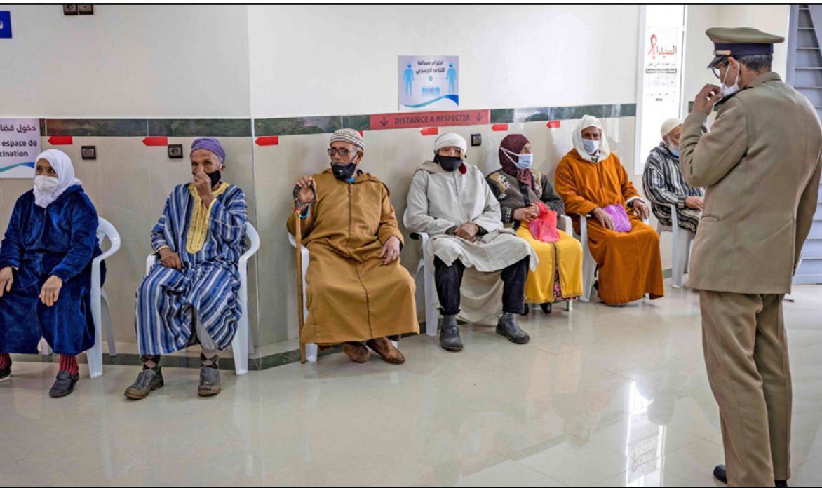
مغربيون في انتظار دورهم لتلقي لقاح كورونا

وكانت اللجنة التقنية المغربية اقترحت بعد تعثر ملف «سينوفارم ووهان» تنويع اللقاح، وبالتالي إبرام عقود هذه المرة لاستيراد لقاح «جونسون آند جونسون» الأمريكي، نظراً لكونه ناجحة واحدة ويناسب الظروف اللوجستية بالمغرب، حيث يتم تخزينه في درجة برودة تتراوح بين 2 و8 درجات لكنه أصبح من الصعب