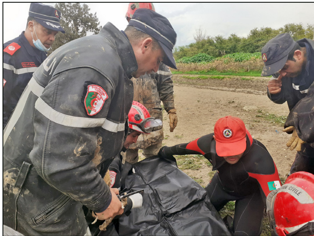
عناصر الدفاع المدني أثناء عمليات البحث

واستمرت فرق الإنقاذ القادمة من 10 محافظات، بالإضافة إلى قوات الأمن والمتطوعين، في عمليات البحث طيلة ليلة الاثنين إلى صبيحة أمس الثلاثاء تحت الأضواء الكاشفة. وشهدت محافظة الشلف، السبت، تساقطاً غزيراً للأمطار أدى إلى فيضان وادي مكناسة الواقع غرب المدينة، ما أدى إلى جرف ثلاث سيارات وبخروج المياه لبيوت مجاورة للوادي، كما عطلت مياه الأمطار حركة السير على مستوى الطريق السيار شرق غرب. وكانت مصالح الدفاع المدني قد أعلنت عن حصيلة مؤقتة السبت، تحدثت فيها عن وفاة ستة أشخاص، هم امرأتان ورجلان وطفلان، وتم العثور بعد على جثث ثلاثة أشخاص آخرين.