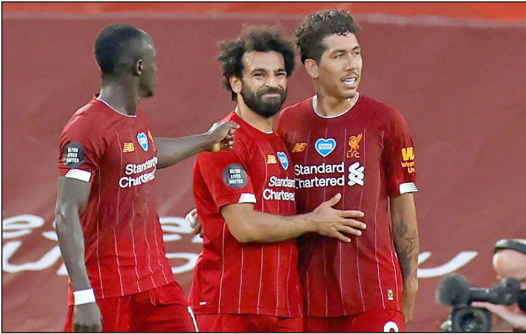
صلاح يتوسط فيرمينو (يمين) وماني ثلاثي ليفربول الذي أزعج الدفاعات الأوروبية

لندن - أ ف ب: بعدما كان ثلاثياً نارياً يهابه الجميع، انطفاة شرارة التهديد لدى محمد صلاح وساديو ماني وروبرتو فيرمينو في الآونة الأخيرة وكانت أحد أسباب تلقي ليفربول ست هزائم متوالياً على أرضه وهو ما لم يحصل للنادي منذ أبصر النور قبل 129 عاماً.