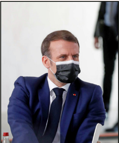
الرئيس الفرنسي إيمانويل ماكرون