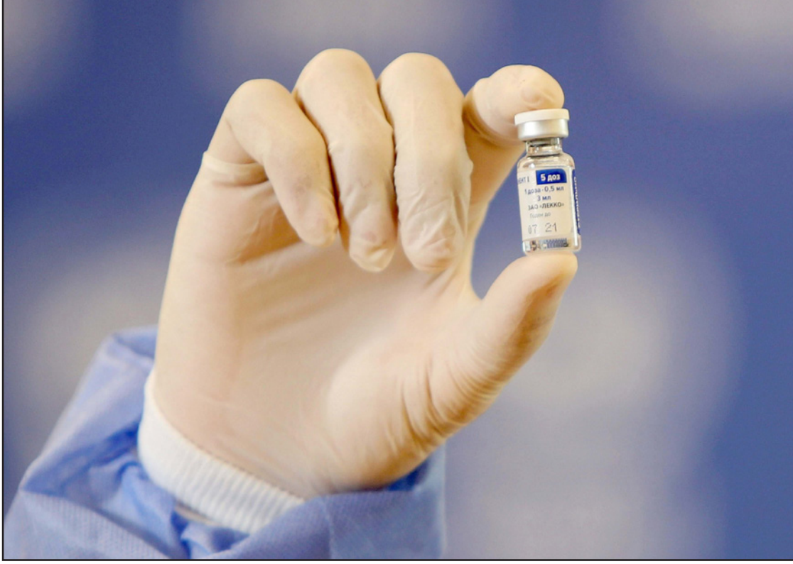
عامل طبي فلسطيني يعرض جرعة من لقاح سيوتيك الروسي

وأكدت وزيرة أن المشكلة في توفير اللقاحات ليست مالية، حيث تم اعتماد الموازنات اللازمة لشراؤها فيما تم تحويل دفعات مالية لبعض الشركات، وإنما لم توفر الشركات المصدرة، حيث نسعى بكل جهد