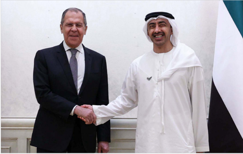
وزير الخارجية الإماراتي عبد الله بن زايد يصادف نظيره الروسي سيرغي لافروف أمس في أبو ظبي

الرسمية الروسية، في ظل تلاقي المصالح، على أن تتولى الإمارات حشد الدعم المالي وتوفير الغطاء العربي لهذا المتحرج، والهدف كبح النفوذ التركي في سوريا، فضلا عن محاولتها زيادة زيارتها الإقليمي، والتأثير على التفاعلات بين الدول الإقليمية في المنطقة.