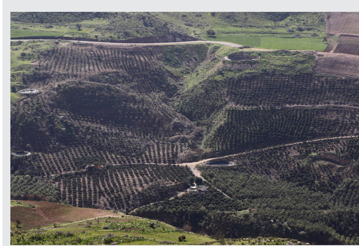
مشهد بانورامي لغابة كفرنجة

والتهم حريق في عجلون في أكتوبر/تشرين الأول 2020 نحو 500 دونم تضم أشجار زيتون وأخرى حرجية، كما أتى آخر في غابة في محافظة جرش (نحو 50 كيلومتراً شمال عمان) عام 2019 على 800 دونم مزروعة بمحاصيل مختلفة. ويؤكد قطيшат أهمية الغابات للتنوع الحيوي ومكافحة التصحر والتخفيف من الانبعاثات وآثار التغير المناخي، موضحاً أن البداية جاءت من كفرنجة في عجلون «لأنها تمثل رئة الأردن». ويشير إلى زراعة أشجار «محلية وطنية كالكنيا والسدر والخروب»، وهي أجناس لا تحتاج لكميات كبيرة من مياه الري إلا في أشهرها الأولى وفق أخصائيين محليين. ويعد داودية بأنه «خلال أربع إلى خمس سنوات، تصبح النتائج واضحة». وتتشكل الغابات أقل من واحد في المئة من مساحة الأردن البالغة 89 ألفاً و342 كيلومتراً مربعاً، وتضم البلاد 23 مليون شجرة ممتدة، نصفها تقريبا من أشجار الزيتون. وتشكل «غابة يرقش»، وغابة الشهيد وصفي التل» في محافظة البلقاء (غرب عمان) ومساحتها 7 آلاف دونم، أكبر غابات الأردن. ويقول داودية إن الأشجار المزروعة في إطار المشروع تراعي التنوع الذي يلائم البيئة هنا، وأيضا النحل المؤمل أن يرفدنا بكميات عسل إضافية تعزز الإنتاج الوطني. وينتج الأردن ما معدله 250 مليون طن فقط من