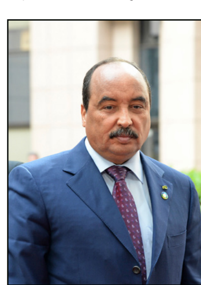
الرئيس الموريتاني السابق محمد ولد عبد العزيز

في بيان أمس، إن ما يجري هو محاولة للتشويش على دعوى تقدموا بها إلى قاضي الحريات ضد تقديح حريات موكلم منذ عدة أشهر «خارج القانون»، وهي الدعوى التي من المقرر أن يتم البت فيها الأربعاء. وفي حزيران/يونيو الماضي، أصدر البرلمان الموريتاني تقريراً تمت إحالته لفضاء تضمن اتهامات للرئيس السابق وعدد من وزرائه ومقربين منهم بـ«التورط في عمليات فساد». وأعدت هذا التقرير لجنة من البرلمان الموريتاني أجرت تحقيقاً استمر من يناير/كانون الثاني وحتى نهاية حزيران/يونيو 2020. وأوقفت السلطات ولد عبد العزيز في 17 آب/أغسطس الماضي، بناءً على هذا التقرير، قبل أن تفرج عنه بعد أسبوع من توقيفه على ذمة التحقيق. واستمرت اللجنة خلال الأشهر الماضية، إلى مسؤولين، بينهم وزراء سابقون في عهد ولد عبد العزيز، الذي حكم لولايتين رئاسيتين. ويحكم موريتانيا، منذ مطلع آب/أغسطس 2019، الرئيس محمد ولد الغزواني، بعد أن فاز في الانتخابات الرئاسية في 22 حزيران/يونيو من العام نفسه، بدعم سلفه ولد عبد العزيز.