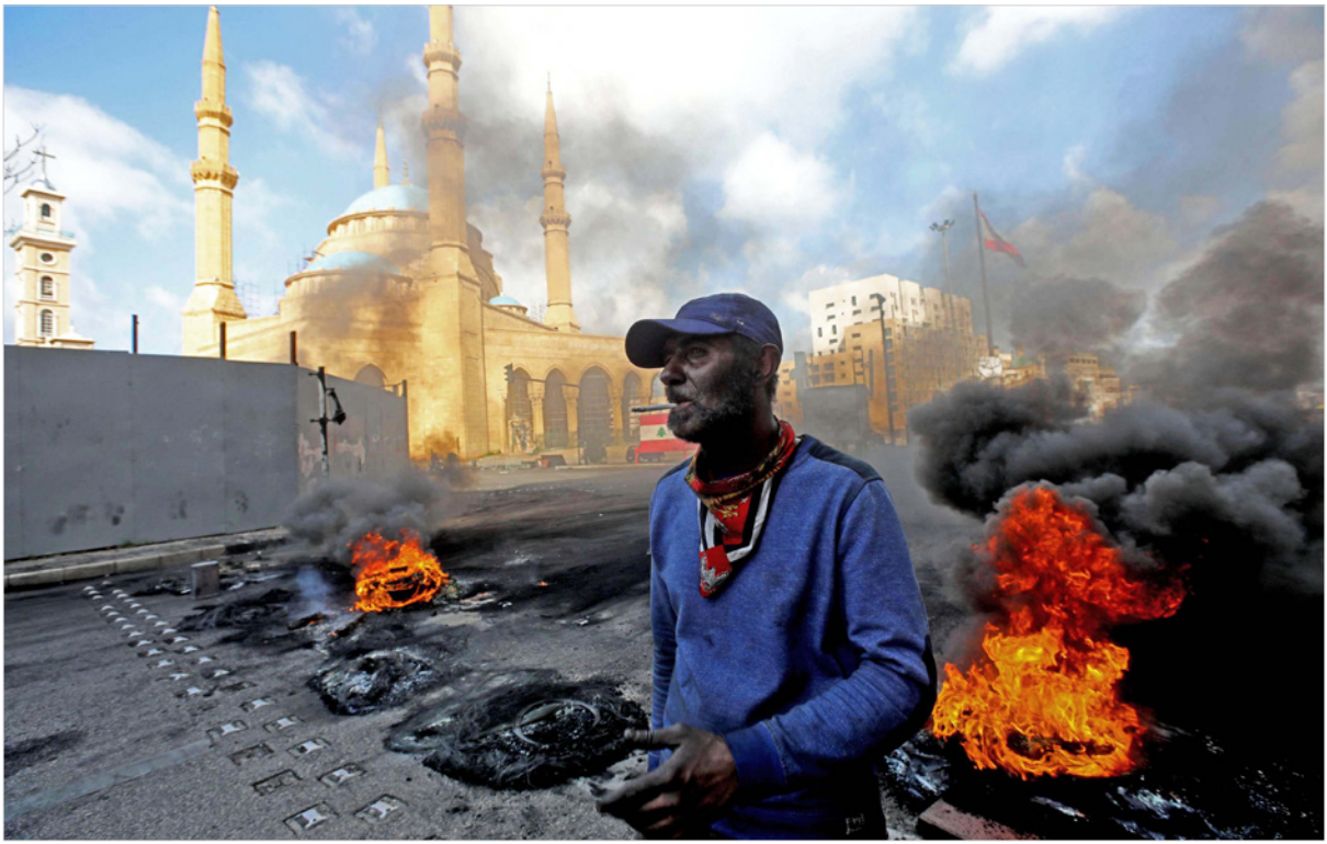
غضب الشارع متواصل وسط اعتكاف مجموعات من 17 تشرين بسبب تسييس الشعارات