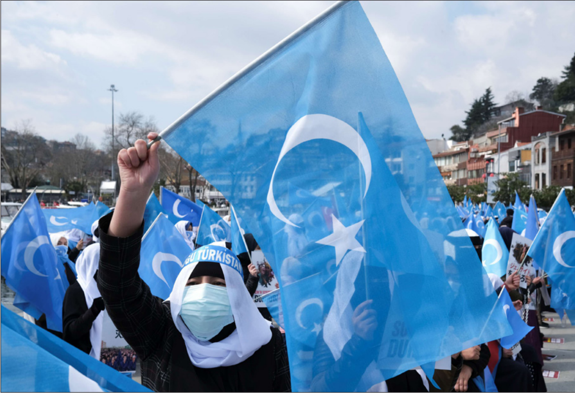
مظاهرون من الإيغور يحملون أعلام تركستان الشرقية في اسطنبول خلال تجمع بمناسبة يوم المرأة العالمي للاحتجاج على معاملة الصين لهم

وتم وضع حوالي مليوني مسلم من الإيغور وبقية الأقليات المسلمة في سجون منتشرة في