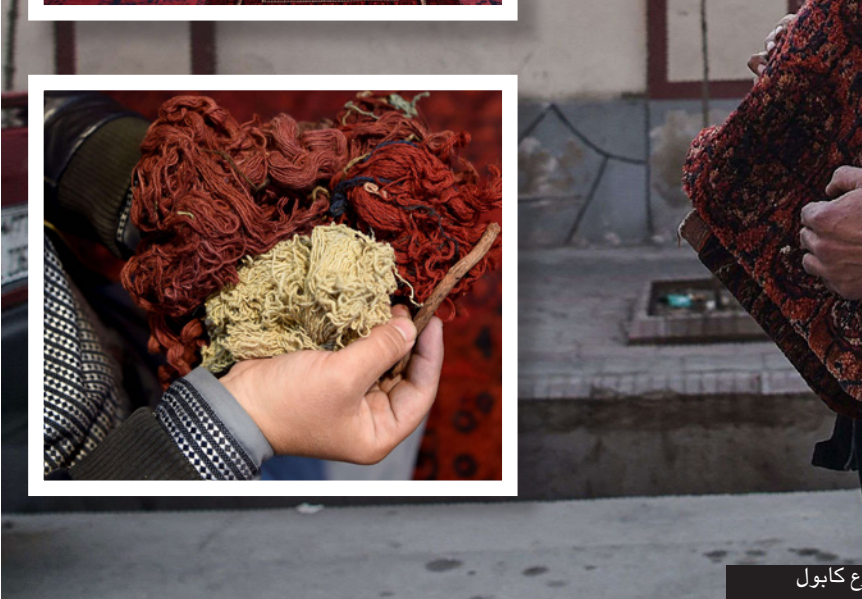
بيع السجاد في شوارع كابول

ويستغرق صنع السجادة ما بين ستة أشهر وستين، في نهاية المطاف، يمكن بيعها بألف الدولارات في السوق العالمية.