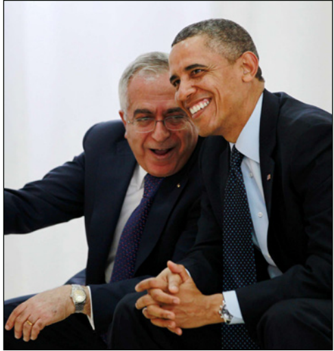
الرئيس الأمريكي الأسبق باراك أوباما (إلى اليمين) يشاهد حدثاً ثقافياً إلى جانب رئيس الوزراء الفلسطيني في رام الله في 21 آذار/ مارس 2013

سيديفك السياس إلى بانكنغهام ويندسور مثلما يزورون القصور في فرنسا، حتى دون أن يكون يسكن في أحد أقسامها ملوك وبناء ملوك يشعرون بأنهم سجناء في قفص من ذهب. لا توجد أي حاجة للإبقاء في العقد الثالث من القرن الواحد والعشرين على إطار يوفر الكثير جدا من الاحباطات، الاكتئاب والرغبة في الانتحار مما سيستبب للمشاهدين بانكسار قلب لا داع له.