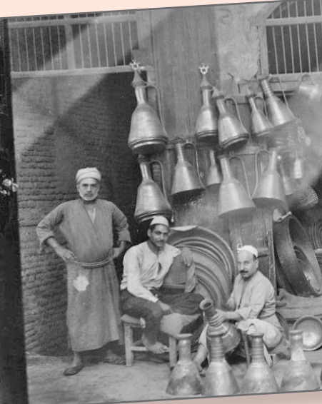
محل نحاس في أحد شوارع مدينة بغداد عام 1932

من خصائص قصائد هذه الحركة أنها استبدلت الكتابة الحداثية، وكان واردة أن يحشر حلاق نفسه وعدته في ركن ضيق بدون أن يكون له محل، ثم يقوم بعرض خدماته المختلفة للزبائن من قص شعره وخلق الأسنان وفقع الدامل.