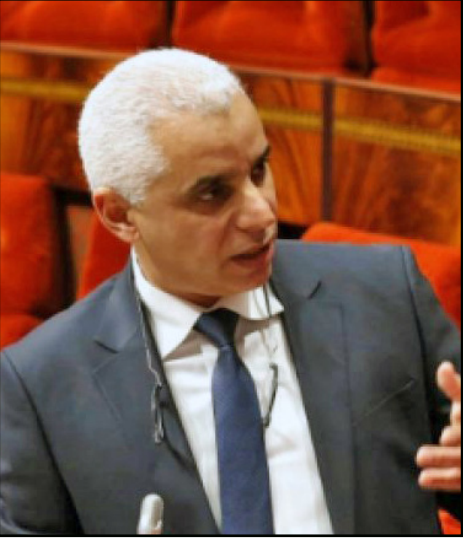
الوزير خالد أيت طالب

ملايين و130 ألفاً و606 أشخاص تلقوا الجرعة الأولى من اللقاح، فيما بلغ عدد المستفيدين من الجرعة الثانية من التطعيم 972 ألفاً و79 شخصاً.