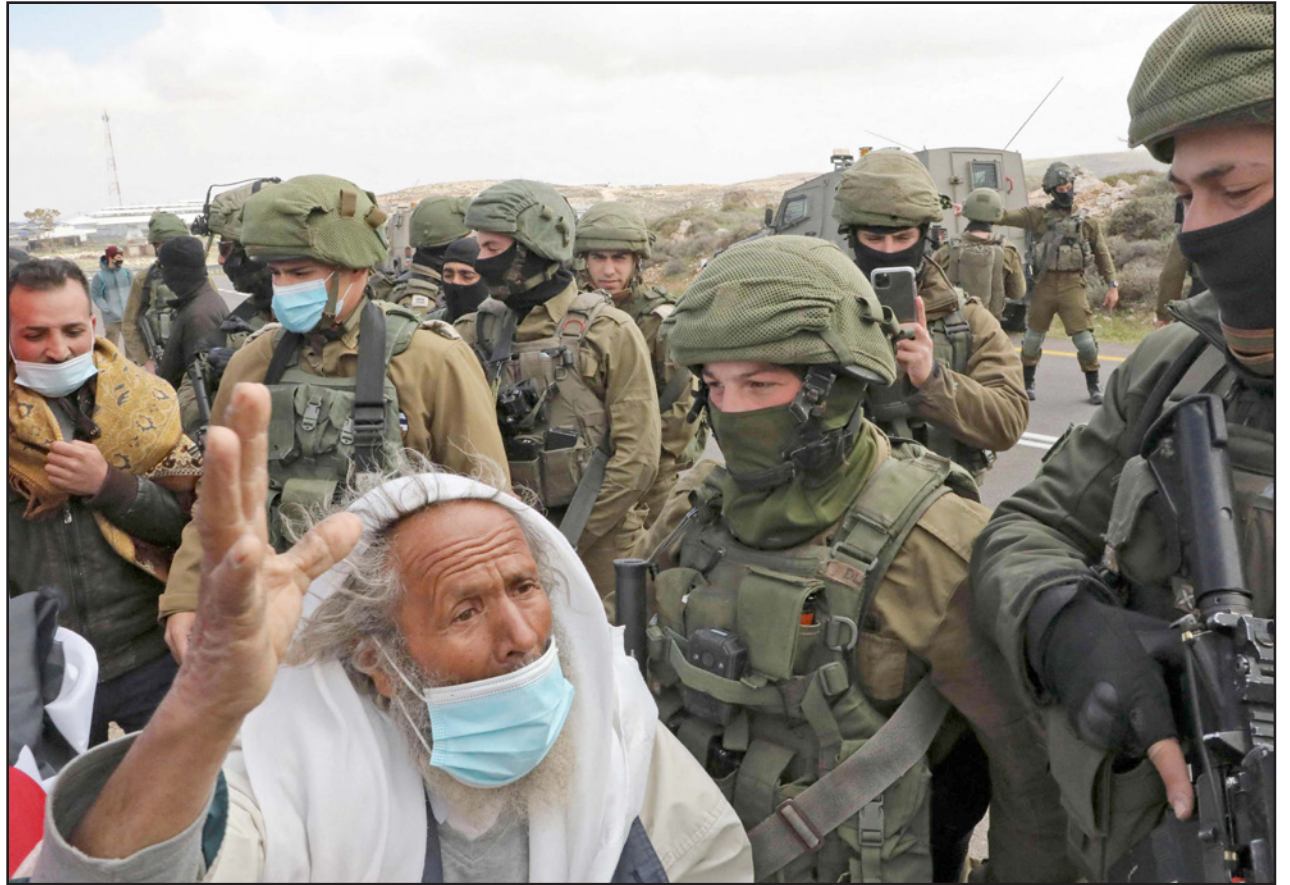
مواجهات مع جيش الاحتلال في مدينة نابلس

ونفت حملات دهم لعدة مناطق بالضفة، حيث اعتدت قوات الاحتلال ليل الخميس على الأهالي الموجودين في ساحة باب العامود، وسط مدينة القدس المحتلة، وقال شهود عيان إن عناصر الاحتلال الموجودين في المكان اعتدوا على عدد من المواطنين بالضرب والدفع، والقضاء قابل الصوت تجاه الشبان والأهالي وسط حالة من توتر الأجواء سادت في المكان. وسلمت سلطات الاحتلال ليل أول من أمس الخميس، محافظ القدس عدنان غيث، قراراً بمنعه من الاتصال والتواصل مع الرئيس محمود عباس و50 شخصية فلسطينية، ويشمل القرار كذلك منعه من التواصل مع عدد من أعضاء اللجنة المركزية وقيادات أمنية ووطنية فلسطينية. ويأتي هذا القرار تجديداً لقرارين سابقين يقضيان بتقييد حركة غيث وتواصله، والوجود في مدينة القدس، عدا عن مكان سكنه في بلدة سلوان. وقد علق المحافظ غيث على هذه القرارات بالقول "هذه القرارات لن تحول بيننا وبين واجبنا بالاستمرار في عمل كل ما أمكن مع باقي أبناء شعبنا للوصول إلى الحرية والاستقلال وإقامة الدولة الفلسطينية وعاصمتها القدس". ووصف القرارات بـ"الجانثة"، وأكد أنها تأتي "بالتزامن مع حصار وعزل المدينة واستهداف أبنائها وترجمة زمة من التشريعات التي تستهدف هويتنا وتاريخنا وتراثنا"، ونقل محافظ القدس تحياته إلى كل أبناء شعبنا وخاصة أولئك القاضين على الحجر من نشأى وحرائر العاصمة".