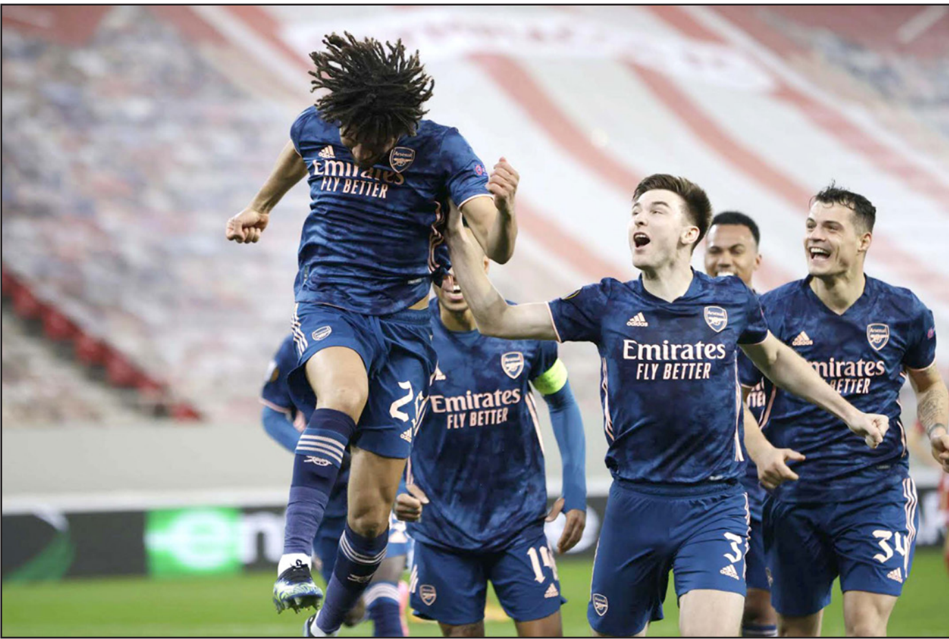
النجم المصري محمد النني يطير فرحاً أمام زملائه بعد تسجيله الهدف الثالث لأرسنال