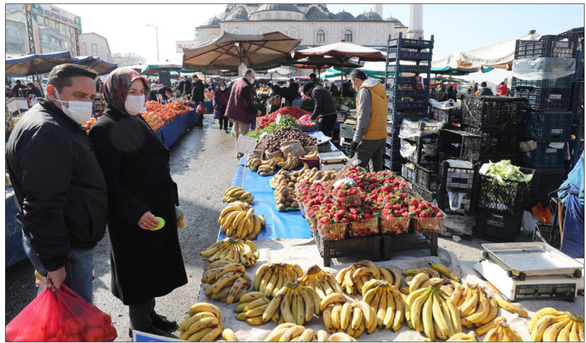
بضائع كثيرة ومشترون قلائل في سوق شعبي للخضار والفواكه وسط العاصمة التركية أنقرة

■ أنقرة – أ ف ب: تتردد غولاي أو صار بانتظام إلى هذا السوق في المدينة القديمة مع أنقرة للتعرف على أسعاره المقبولة أكثر من أماكن أخرى، لكن حتى هناك تواجه صعوبات مزمنة في التسوق على فراخ العديدين من الأتراك الذين يبات عليهم الآن التعامل مع ارتفاع الأسعار بوتيرة يومية أحياناً. تقول هذه المقاعدة البالغة من العمر 65 عاماً «هذه المرة الثالثة التي أتت فيها لشراء بعض الألبان وأعود خالية الوفاض بعد أن أرى الأسعار، كل شيء باهظ الآن».