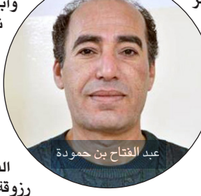
عبد الفتاح بن حمودة

أما أن تكون شاعرا كونيا فهذا بعيد الشؤ. عاشت تونس فراغا رهيبا بعد رحيل الشابي، إلى حين قدوم الشاعر منور صادق الذي لم تتوفر له الظروف فظلت تجربته محلية ومهملة، رغم محرم دينيتها التي لا تخفي على حدودها معروفة لدى النقاد والشعراء، فما أسسته هذه الحركة ظل فاعلا من خلال أعمال أبرز روادها في الشعر مثلا: فضيلة الشابي، التي نهبت إلى الحدأة شكلا ومضمونا وتجربتها متمثلة وتُدرس الآن على أنها تجربة لها ملامحها، والطاهر الهامي الذي ظلت تجربته كلاسيكية لم تطل على الحدأة إذا قارناها بتجربتي أنسي الحاج وسعدى يوسف، ولم يدخل الشعر التونسي حدثاته إلا مع فضيلة الشابي، وشعراء الثمانينيات وما تلاها، وتجربة منصف الوهايبسي (خاصة مع كتابه «مخطوط تيكيتو» و 1999 وما تلاه ورغم تفاوت قيمة بعض الأعمال) وتعاضدا تجارب أخرى مثل شعر محمد الغزي (خالد النجار وعلي اللواتي وعزوز الجملي، الذين توقفت تجاربهم فلم يراكموا شيئا تقريبا مقارنة بمنصف الوهايبسي الذي أطلقت عليه «المنشآت») ويوسف زروقة وحافظ محفوظ وأدم فتحي خاصة في كتابه «نافع الزجاج الأعمى» ونصر سامي الذي قدم تجربة خلقت قصيدة التفعيلة مذاقا خاصا مع تجارب منصف الوهايبسي وحافظ محفوظ وفتحي الحصري ومحمد الغزي ومحمد علي اليوسفي وعادل المعيزي ومحمد النجار وغيرهم.