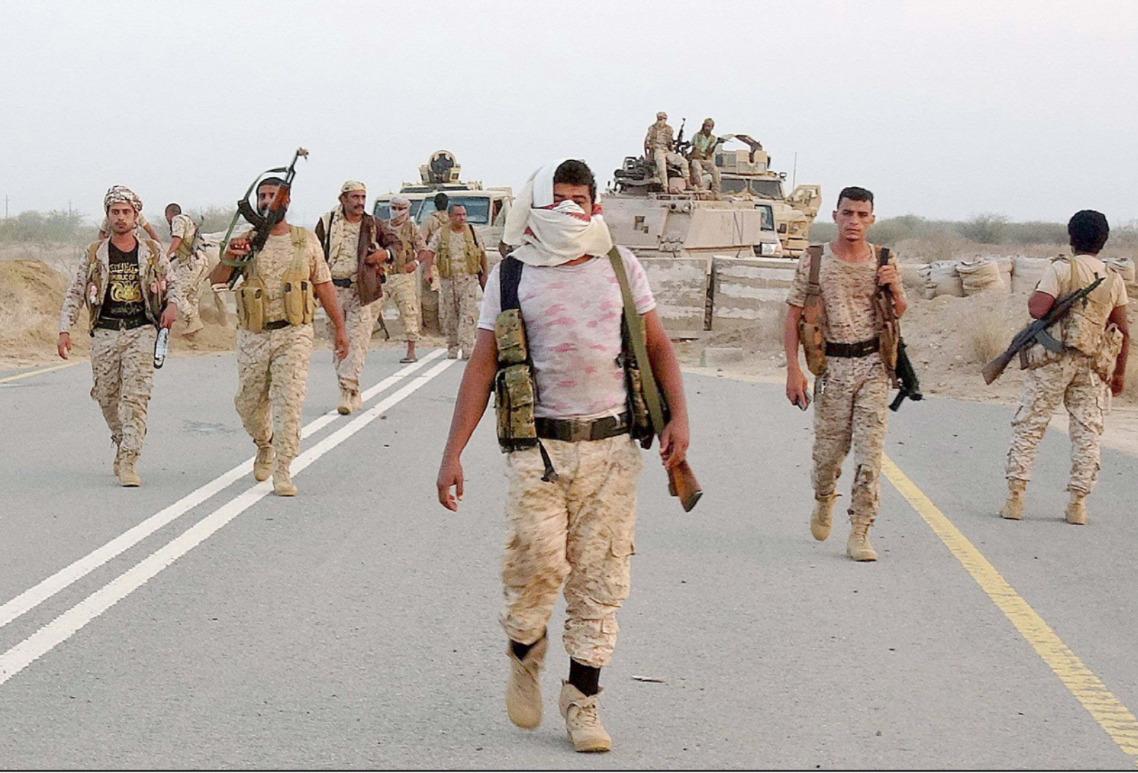
عناصر من الجيش اليمني خلال عملية عسكرية في حجة

عليها، كونها أهم معاقل الحكومة اليمنية والمقر الرئيس لوزارة الدفاع، إضافة إلى تمتعها بتروات النفط والغاز. ويشهد اليمن منذ 7 سنوات حرباً مستمرة بين القوات الموالية للحكومة ومسليحي «الحوثي» المسيطرين على عدة محافظات بينها العاصمة صنعاء منذ عام 2014.