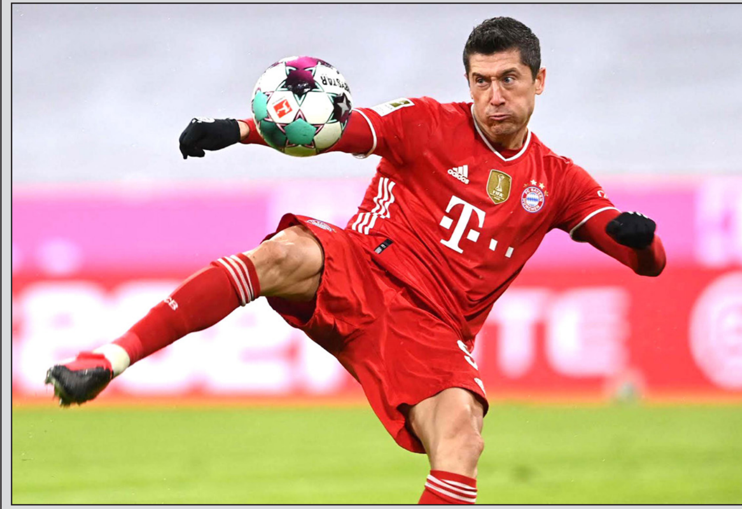
الهداف البولندي ليفاندوسكي يأمل بالاقتراب أكثر من الأرقام القياسية في عدد الأهداف

■ مدريد - أ ف ب: يأمل أتلتيكو مدريد "اللاهت" خلف لقبه الأول في الدوري الإسباني منذ 2014 في أن يتابع سلسلة انتصاراته عندما يحل ضيفا على خيتافي اليوم، فيما يسعى برشلونه "الجريح" أوروبا وريال مدريد مواصلة ضغفهما عندما يستضيف الأول هويسكا الأخير الإثنين، والثاني ايلتشي اليوم ضمن المرحلة الـ27، وخرج أتلتيكو من "صيدة" صيدته بلباو فائزا 2-1 في مباراته المؤجلة من المرحلة الـ18 الأربعة، ليعزز صدارته بـ26 نقطة ويتقدم بفارق 6 نقاط عن وصيفه برشلونه (56) و8 عن "جاره" اللدود الريال (54)، ويدين أتلتيكو بفوزه الـ19 هذا الموسم والثاني في مبارياته الثلاث الأخيرة بعد انتهاء "تربسي" العاصمة أمام الريال بالتعادل 1-1، إلى ماركوس يورنتي صاحب هدف التعادل قبل ثوان من نهاية الشوط الأول، فيما أطلق زميله لويس سواريز "رصاصة الرحمة" من ركبة جازء مع بداية الثانية، معزز جرة مركزه الثاني في ترتيب الهدافين بـ18 في 23 مباراة، وأطلق يورنتي مسيرته أوروبا الموسم الماضي بهدفه في مرمى ليفربول في دوري