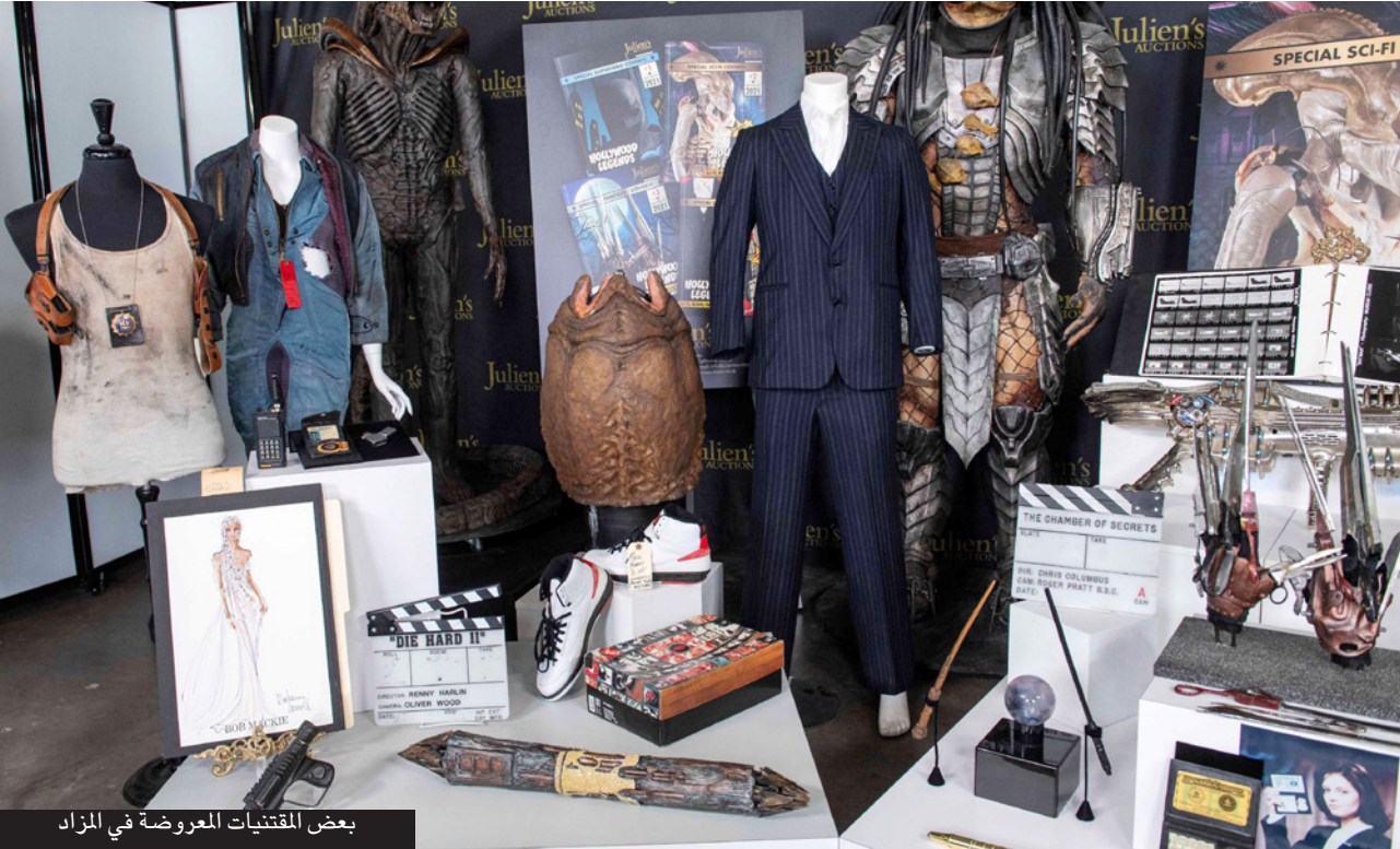
بعض المقتنيات المعروضة في المزاد

إلى 60 ألفاً) والبندقية الوهمية التي استخدمها أرنولد شوارزنبيرغ، في دور مستر فريز الشريك، وقناع ميشيل فايفر في دور «كاتومان» (المرأة القطة).