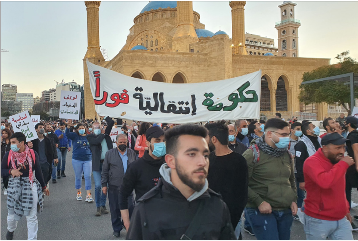
جانب من مسيرة اللبنانيين أمس في بيروت

وبلغت بهم الواقعة حد الاستمرار في سرقة اللبنانيين من خلال تخفيض قيمة الليرة، وترك الأسعار متقلبة من الرقابة، وتحقيق إرباح خيالية لأصحاب المصارف والاحتكارات عبر الاستفادة من تعدد أسعار صرف الدولار». وأكد ساد حزب الله خلافاً للمنتقذين الذين تطاهروا وقطعوا التبعية على الاستهتار بكرامة اللبنانيين ولقمة عيشهم»، وأضاف «توافق من توافقاً على تكليف الحريري تشكيل حكومة، وعلى حماية رياض سلامة ومنع المسّ به، كما على تميع التحقيق في جريمة تفجير الرمفا، وعلى تلافى إصدار التشريعات الإصلاحية الحقيقية، وحتى على منع إنفاذ ما سبق أن أقرّ النوار الأحرار»، «النتسدى الاجتماعي» حركة