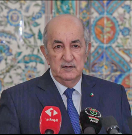
الرئيس الجزائري عبد المجيد تبون

وكان حمل هذا المجلس أحد مطالب الحراك الشعبي في الجزائر منذ انطلاقه في 22 شباط/فبراير 2019. تحديده موعد الانتخابات النيابية المبكرة يأتي في ظل عودة مسيرات الحراك الشعبي المطالبة بالتغيير الشامل، كل جمعة وثلاثاء، بعد قرابة السنة من التوقف بسبب تدابير للوقاية من فيروس كورونا.