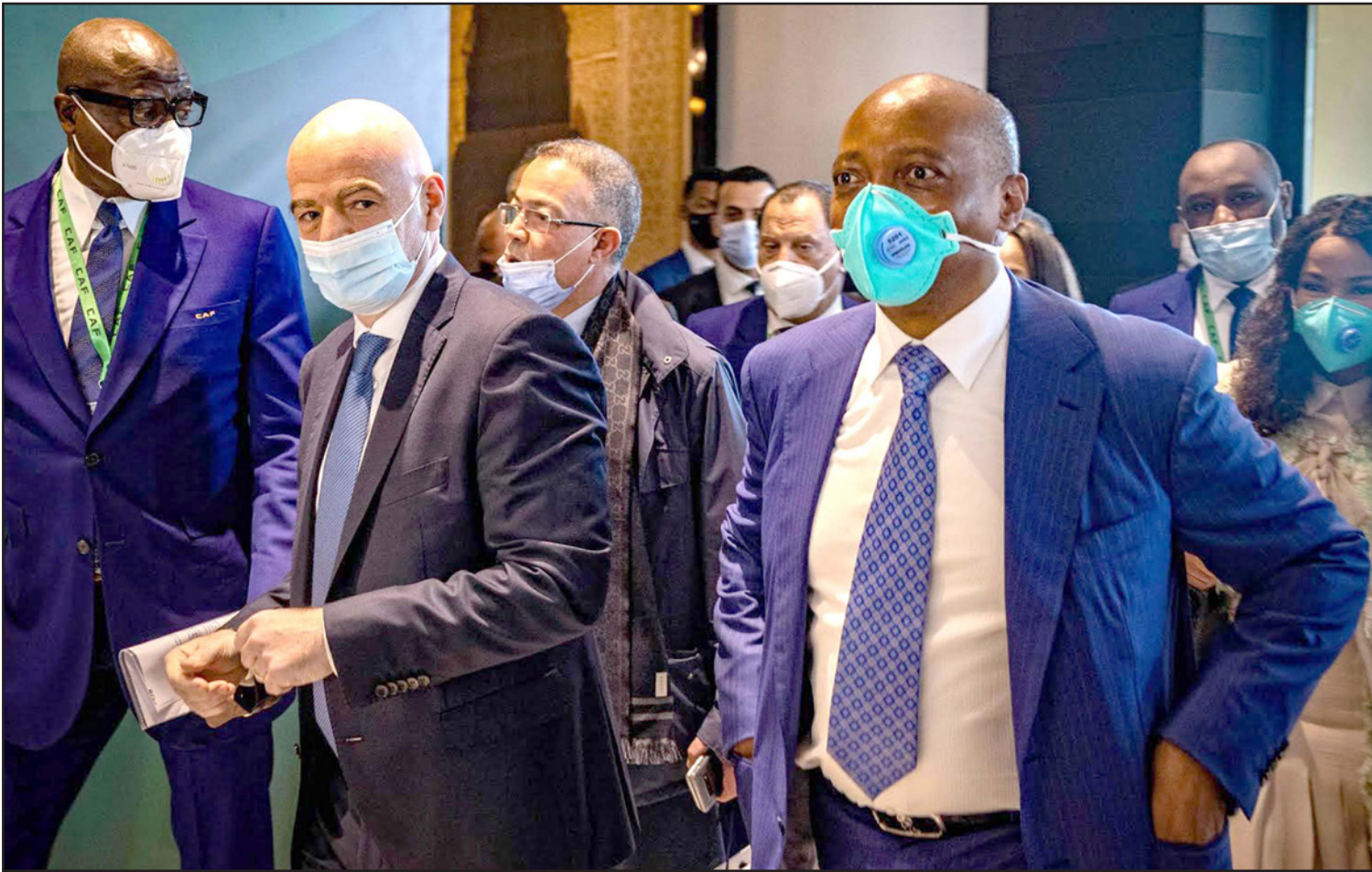
رئيس الكاف الجديد موتسيسي إلى جانب رئيس الفيفا إنفانتينو عقب إعلان فوزه

نفس الرؤية. الآن يجب رفع مستوى الكرة الإفريقية إلى العالمية بالتعاون مع الفيفا". وأردف: "عملنا الكثير معاً خلال السنوات الأخيرة، ضاعفنا خمس مرات استثمارنا في إطار التضامن، وطورنا أكثر من 300 مشروع خلال السنوات الخمس الأخيرة". وكان رئيس الفيفا أشاد في وقت سابق بالتوافق حول موتسيسي قائلاً: "أهني الرجال الأربعة هنا. هؤلاء الرجال المستحيل ممكناً. أظهروا أنه من الممكن العمل كفريق واحد وراء مشروع، برنامج، رؤية، وهي رؤية لمشروع دفع كرة القدم الإفريقية إلى القمة العالمية". وانتقد البعض التوافق الذي شارك برعايته رئيس الاتحاد المغربي لفتح انتقادات البعض، فشبهه