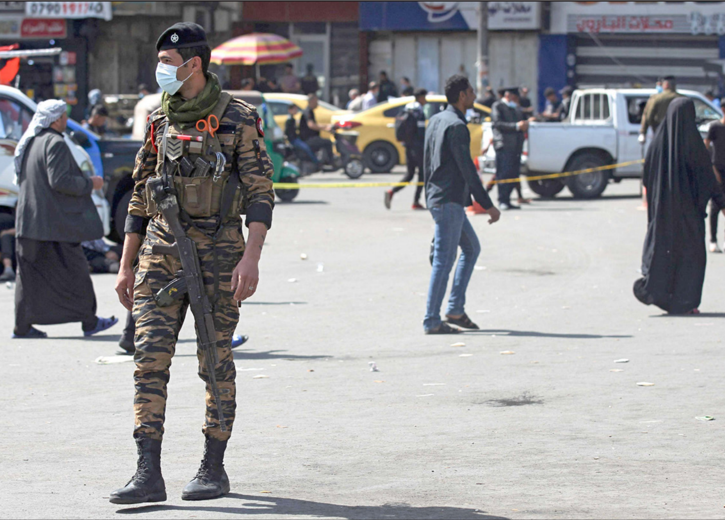
عنصر أمن عراقي في بغداد

وخبرة، عاداً ذلك الإجراء يتسبب بمزيد من الخسائر. وكتب في «تفريدة» بموقع «تويتر» أنه «لا يمكن القبول باستمرار الخروقات الأمنية التي تتسبب بإزهاق أرواح مواطنينا تحت أي مبرر...» وشدد على أن «على الأجهزة المختصة وضع خطط وتوفير إمكانيات مناسبة لإيقاف هذه القطعان السائبة عن (الاستهانة) بمزيد من دمائنا، وختم بقوله: «استبدال القيادات الأمنية بأخرى أقل كفاءة وخبرة يتسبب بمزيد من الخسائر، صلاح الدين نموذجاً».