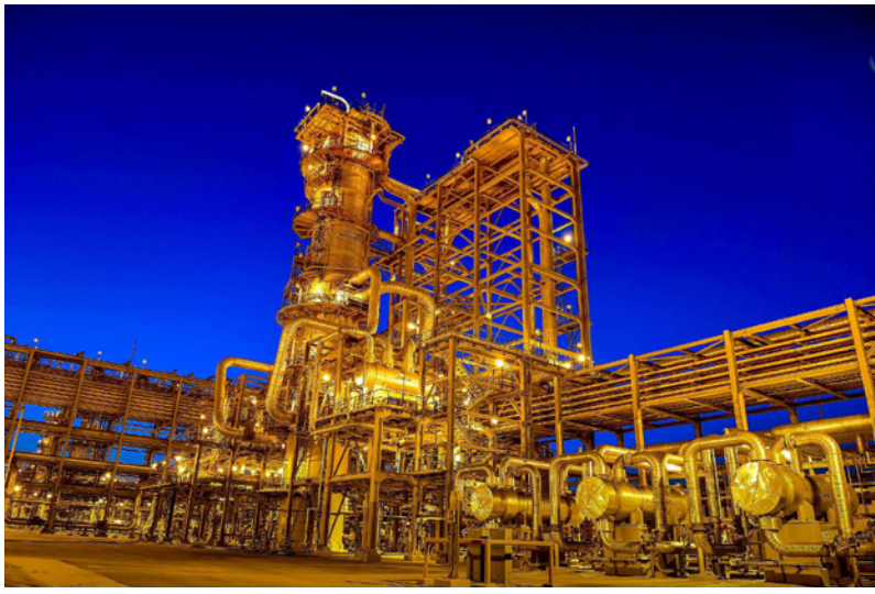
جانب من منشآت حقل مينيعة السعودي، أحداً كحقول النفط في العالم

إمداداتها لشهر أبريل/نيسان، وتعدت السعودية بمواصلة خفض طوعاً للإنتاج قدره مليون برميل يومياً للشهر الثالث في أبريل/نيسان، وقالت المصادر أن شركات توريد صينية واجهت خفضاً محدوداً في إمداداتها السعودية، بينما تراوح الخفض في الكميات للمشتريين في اليابان بين عشرة و15 في المئة، وقال أحد المصادر أن «رامكو السعودية» أدت أيضاً بتشغيل مصفاها في جازان البالغة طاقتها 400 ألف برميل يومياً مما قد يقلص صادراتها.