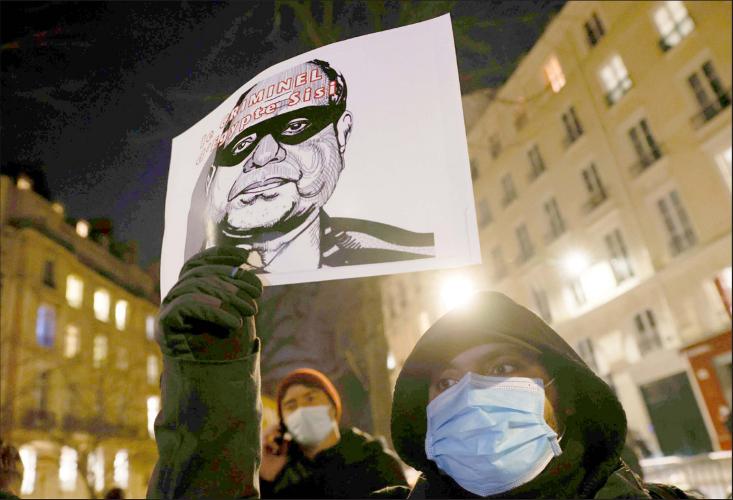
ناشطون يحتجون على أوضاع حقوق الإنسان في مصر خلال زيارة السيسي لفرنسا السنة الماضية

وأضاف البيان: الإعلان الذي جاء في إطار البند الرابع من جدول أعمال المجلس الخاص بإثارة المخاوف بشأن الانتهاكات الجسيمة والمنهجية لحقوق الإنسان، يعد خطوة مهمة يُفترض أن يتبعها تحرك ملموس يضمن تحقيق هدفها، لا سيما أن إخراج إعلان مشترك صدر عن الدول الأعضاء بالأمم