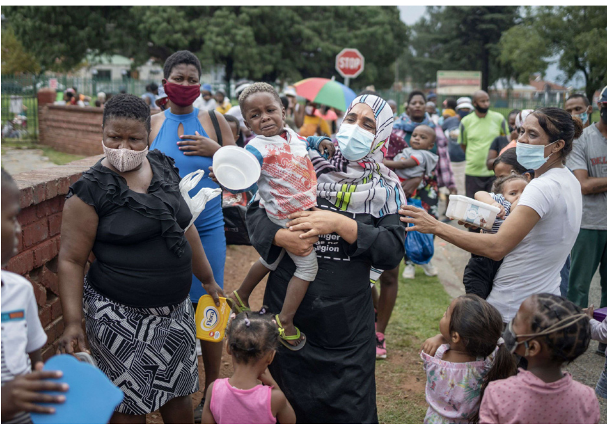
نساء بعضهن مع أطفالهن ينتظرن دورهن للحصول على وجبة غذائية مجانية من جمعية خيرية في جنوب أفريقيا

الأمم المتحدة - أف ب: حذر أمين عام الأمم المتحدة، أنطونيو غوتيريش، مجلس الأمن ليل الخميس/الجمعة من تعرض «ملايين الأشخاص» لمخاطر «المجاعات والموت» في حال عدم اتخاذ «خطوات فورية». وقال خلال اجتماع في مجلس الأمن الدولي حول العلاقة بين الجوع والأمن أن «التقلبات المناخية وجائحة كوفيد-19» تفاقم هذه المخاطر موضحة أنه في ثلاثين بلداً «بات أكثر من 30 مليون شخص قريبين من المجاعة». وأضاف «رسالتي بسيطة: في حال لم تؤمنوا الغذاء للناس، فانتقم توجع النزاعات» منتقدا مسؤولية الإنسان في التسبب بالمجاعة. وتابع القول «لقد تعد المجاعة والجوع مسألة نقص في الغذاء. باتت اليوم في جزء كبير من صنع الإنسان - واستخدم هذه الكلمة عمداً». وقال أيضا «من غير القبول أن يكون هناك مجاعة في القرن الواحد والعشرين». بدورها، روت السفيرة الأمريكية لدى الأمم المتحدة ليندا توماس غرينفيلد كيف شهدت في أوغندا عام 1993 وفاة طفلة تبلغ عامين من العمر جراء الجوع، وقالت «لا يوجد سبب لعدم توفير الموارد للأشخاص الذين يحتاجون إليها بشكل عاجل».