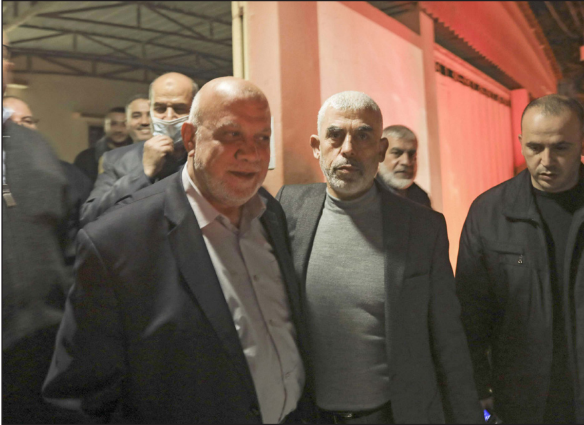
يحيى السنوار (وسط) يزور منافسه على رئاسة حماس في غزة نزار عوض الله (يسار) بعد فوزه

من مدينة الجدل. ولد 1962 وكان من أوائل جيل الشباب الذين انخرطوا بالعمل في حماس، وترأس كتلة الحركة الطلابية خلال الدراسة في الجامعة الإسلامية، واعتقل عام 1988 على أيدي قوات الاحتلال لنشاطه في كتاب القسام، وحكم مدى الحياة، قبل أن يخرج في صفقة تبادل الأسرى عام 2011. وقد أدرجه الولايات المتحدة، مع عدد من قادة حماس على لائحة «الإرهابيين الدوليين» عام 2015 وتضعه إسرائيل على قائمة الطلوع لديها.