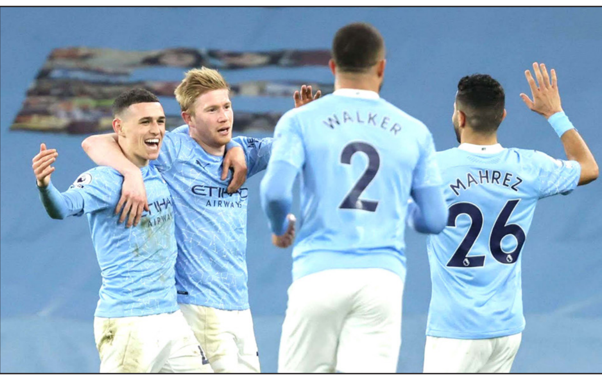
نجوم مانشستر سيتي يأملون بتحقيق الانتصار والاقتراب أكثر من اللقب

مخيين أمام ضيفه تشلسي وكريستال بالاس، عندما يستضيف وستهم بقيادة مدربه السابق ديفيد مويز في قمة ساحة كون الفارق بينهما ست نقاط فقط مع مباراة أقل للفريق اللندني، وأمضى موزين 10 شهور فقط على رأس الإدارة الفنية للشياطين الحمر خلفا لمواطنه الأسطوري أليكس