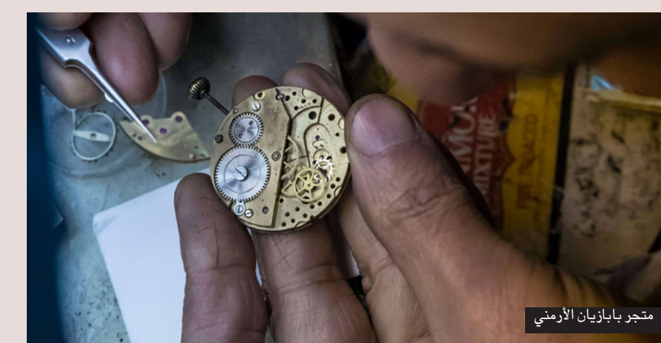
متجر بابازيان الأرمني

القرن التاسع عشر، لكن عددهم حالياً لا يتعدى بضعة آلاف، وفق تقديرات عدة، ولم يبد ولدا أشود حتى الآن اهتماماً بمواصلة مهنة الأسر، لكنه لا يستبعد أن يغيروا رأيهم لاحقاً، قائلًا: «لا أحد يعلم» ما قد يحصل.