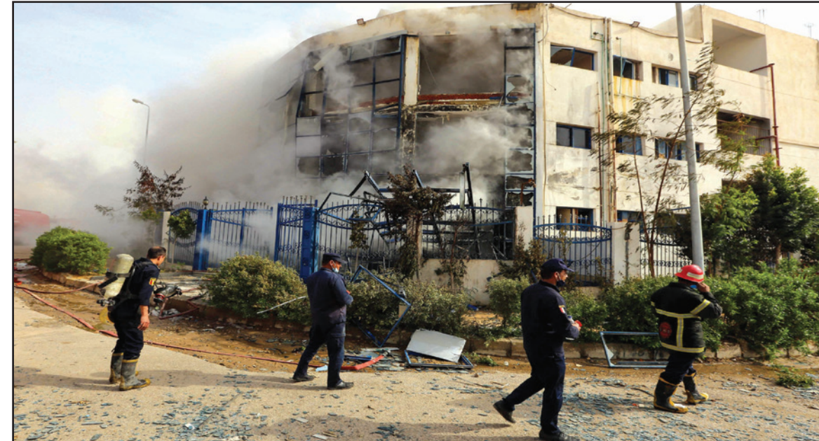
دخان يتصاعد من مشغل ثياب في ضواحي القاهرة أمس ورجال إطفاء يراقبون المكان

وقال المصدران في المخابرات المصرية إن مسؤولا أمنيا مصرياً تلقى اتصالا هاتفيا من مسؤول في المخابرات التركية الخميس يبيد فيه الرغبة بعقد اجتماع في القاهرة لبحث تسهيل التعاون على الأصدقاء الدبلوماسية والاقتصادية والسلمية.