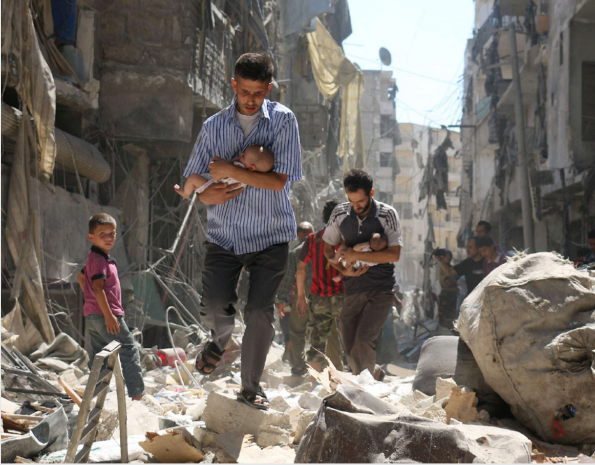
سوريون يتنقذون أطفالاً من بين انقاض مبانٍ دمرت عقب غارة للنظام على حي الصالحين في مدينة حلب (أرشيفية)