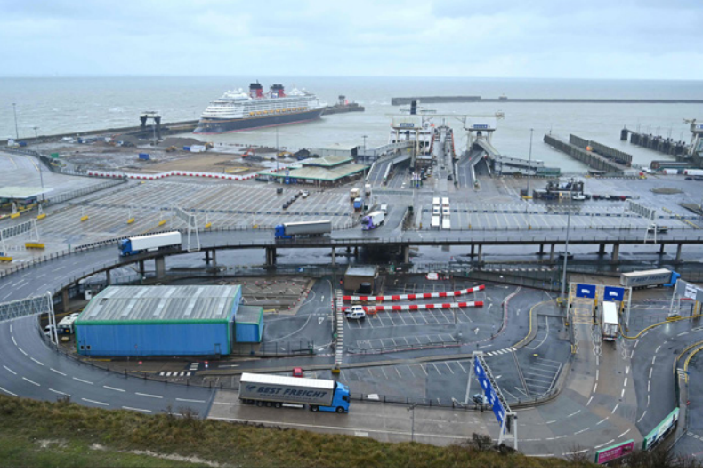
ساحة انتظار الشاحنات في ميناء دوفر البريطاني شبه خالية من الشاحنات التجارية العاملة بين المملكة المتحدة والبر الأوروبي

في بداية «الخروج من السوق الأوروبية الموحدة» لكن «من الواضح أن العملية الانتقالية لبريكست لم تكن سلسة»، وأضاف «سترقب الأسواق من كتب ما إذا كانت المشكلات الحالية ستتحول إلى تغييرات طويلة الأمد». وانتكش اقتصاد بريطانيا 1.7 في المئة في ثلاثة أشهر حتى يناير/كانون الثاني، وهو مستوى أقوى من متوسط التوقعات بانكماش 2.5 في المئة في استطلاع أجرته رويترز. وقال مكتب الإحصاءات أن حجم الاقتصاد في يناير/كانون الثاني 2021 كان أقل بنسبة 9.2 في المئة مما كان عليه في الشهر المقابل من العام الماضي.