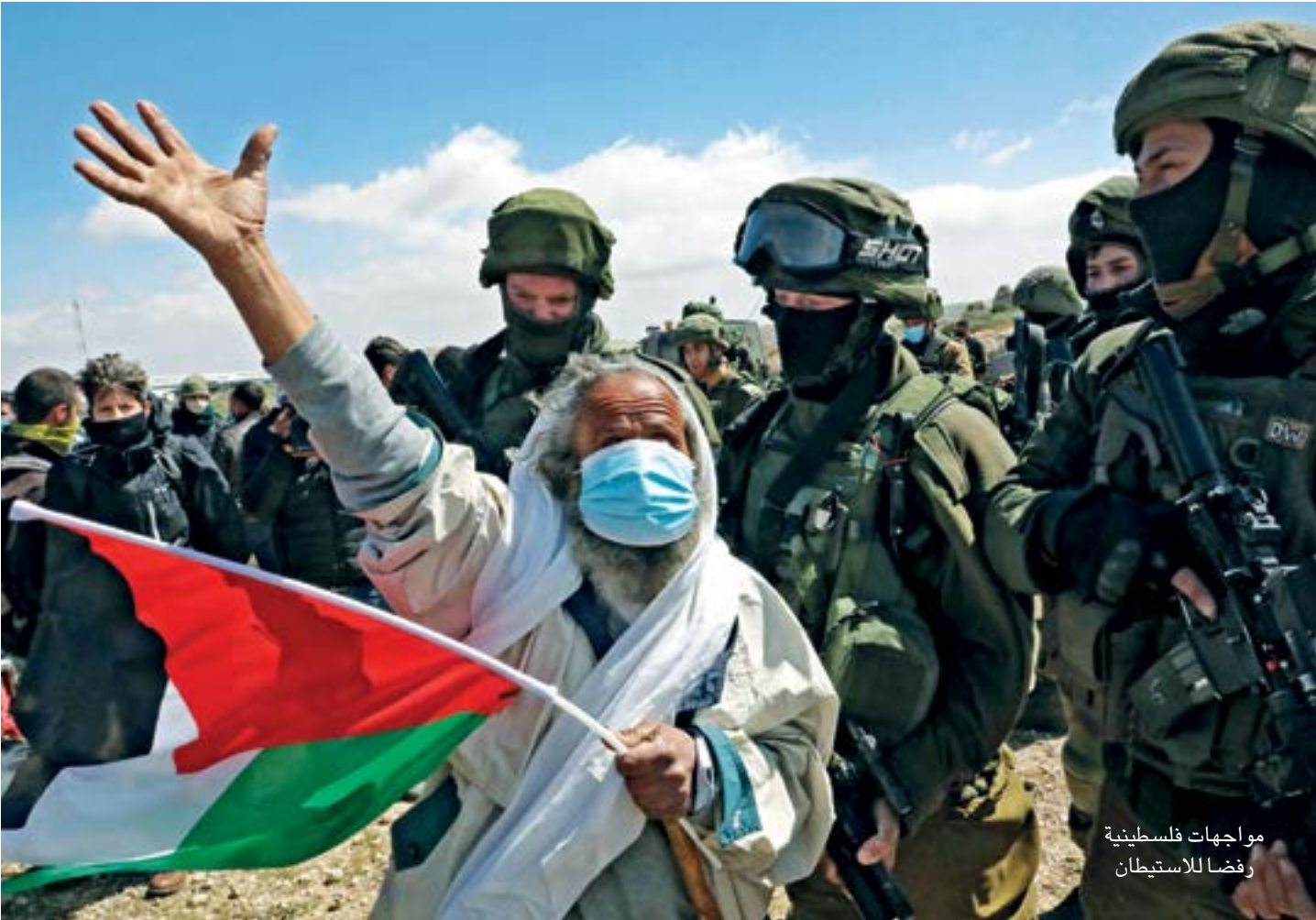
مواجهات فلسطينية رفضاً للاستيطان

محكمة الصلح بإحلالهم، وأمهلت المحكمة، عائلات حماد وداوودي والدجاني حتى شهر آب/اغسطس المقبل لإخلاء منازلها، كما أصدرت المحكمة المركزية منتصف الشهر الماضي قرارا مشابها ضد 4 عائلات فلسطينية أخرى في الحي نفسه، وهي (الجاعوني، القاسم، اسكافي والكرد) وأكدت على قرار الإخلاء ومنحتهم مهلة لمطلع أيار/مايو المقبل لإخلاء منازلهم. وفي مدينة الخليل، صادقت حكومة الاحتلال، من أجل كسب ود اليمين المتطرف في الانتخابات، على رخصة بناء لإقامة مصعد للمستوطنين في المسجد الإبراهيمي وما يترتب عليها من الاستيلاء على ما يقرب 300 متر مربع من ساحاته ومراقفه لغرض إقامة هذا المصعد حسب الخرائط والمخططات، واعتبرت منظمة التحرير الفلسطينية أن هذه الأعمال تأتي ضمن سياسة سلطات الاحتلال الهادفة لتهود المسجد الإبراهيمي والاستيلاء على أكبر مساحة ممكنة من ساحاته ومراقفه، وتغيير ملامحه التاريخية والحضارية.