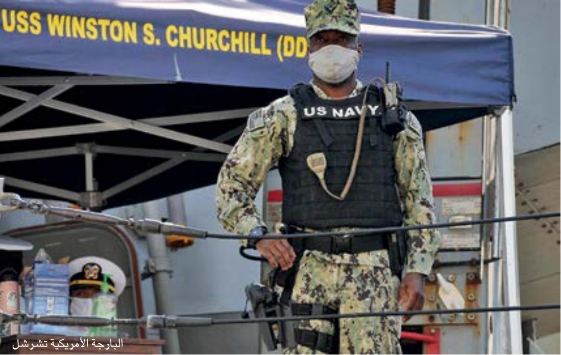
البارجة الأمريكية تشرشل

إن «بعض المقاتلين على الأقل يريدون قطع الطريق المؤدية إلى سد النهضة».