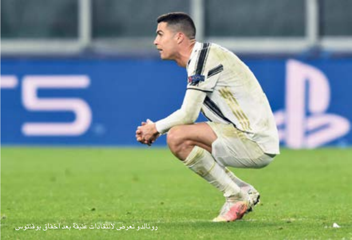
رونالدو تعرض لانتقادات عنيفة بعد أخفاق يوفنتوس

الثابتة، التي قتلت حلم العودة في الأوقات الإضافية، حتى رابيو الذي سجل هدف ماء الوجه الثالث في الدقيقة 117، كان يتفتّن في التصرف بشكل خاطئ وكارثي بالكرة، آخرها اعتماده على نفسه، بتسديد الكرة إلى المدرجات في اللحظات الأخيرة، بينما كانت أمامه فرصة لإرسال عرضية لأكثر من 4 زملاء داخل مربع العمليات.