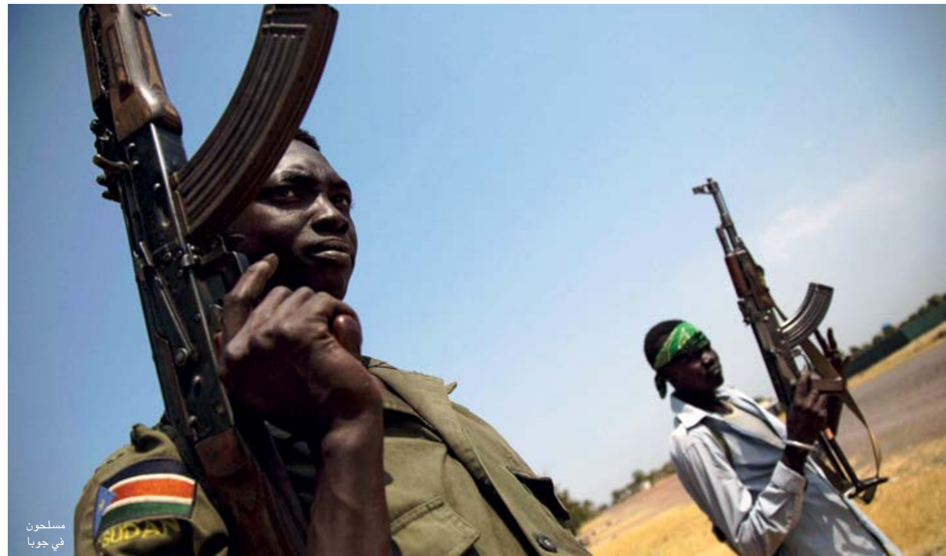
مسلحون في جوبا