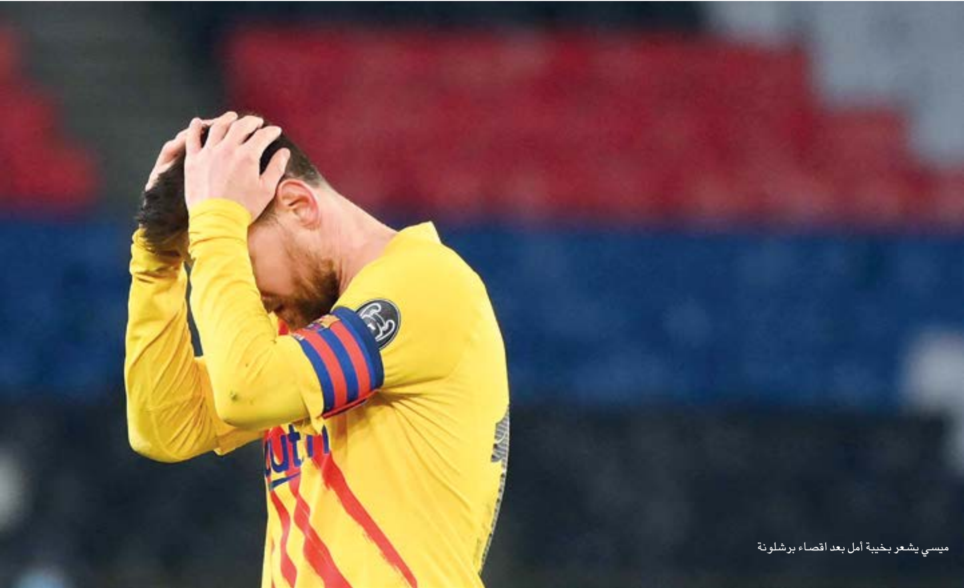
ميسي يشعو بخيبة أمل بعد اقضاء برشلونة