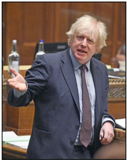
رئيس الحكومة البريطانية بوريس جونسون أثناء تقديمه المراجعة الاستراتيجية أمام مجلس النواب

ستزيد مخزونها من الأسلحة النووية. وأضاف: «نعتقد إيران، على النقيض من المملكة المتحدة، بأن الأسلحة النووية وجميع أسلحة الدمار الشامل وحشية ويجب القضاء عليها».