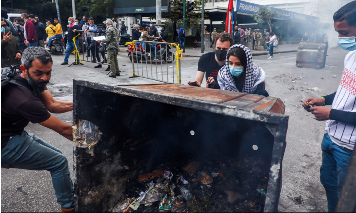
من اعتصامات اللبنانيين أمس وسط بيروت