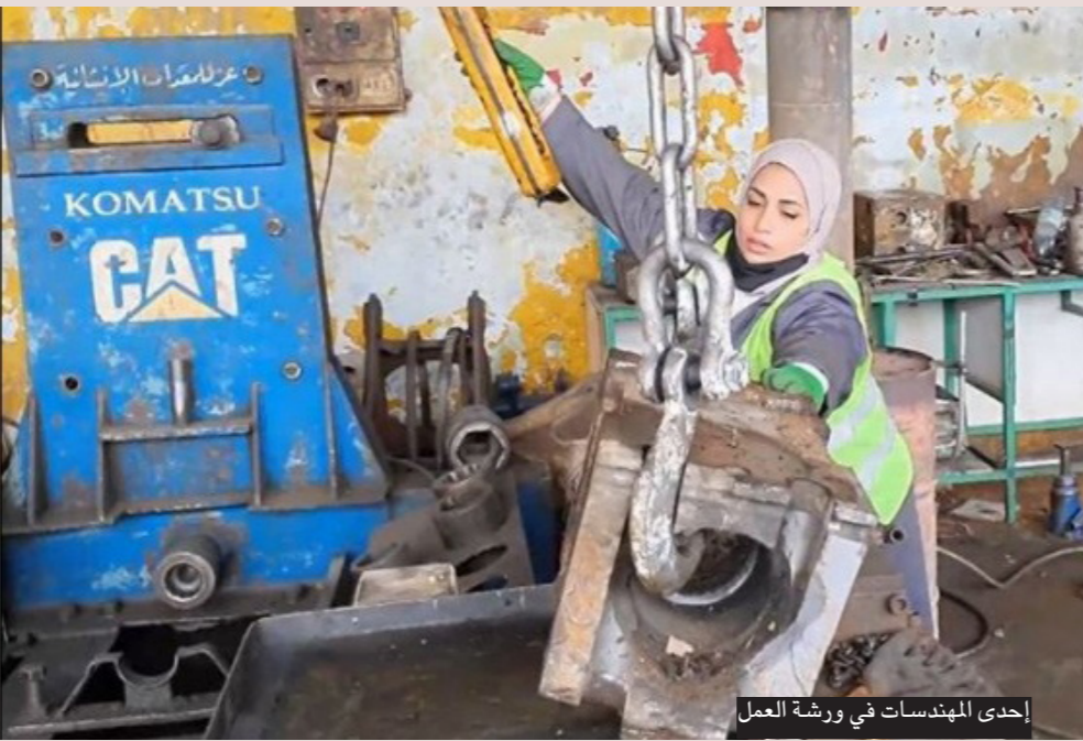
إحدى المهندسات في ورشة العمل