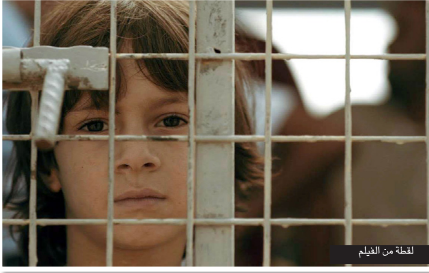
لقطة من الفيلم

القاهرة - أف ب: بعد ماى ست سنوات تتبع المخرج المصري علي العربي خطوات شبانين سوريين فزا من القصف في مدينة درعا في جنوب سوريا في 2013 إلى مخيم الزعتري في الأردن، ووجدلما بأن يصبحا نجمين في كرة القدم. وأخرج العربي (33 عاما) فيلمه التسجيلي «كباتن الزعتري» من رشح معاناة الشبانين، ليعرض لأول مرة ضمن المسابقة الدولية لمهرجان «سندانس» السنوي في الولايات المتحدة، والتي أقيمت هذه السنة بين 28 كانون الثاني/يناير والثالث من شباط/فبراير.