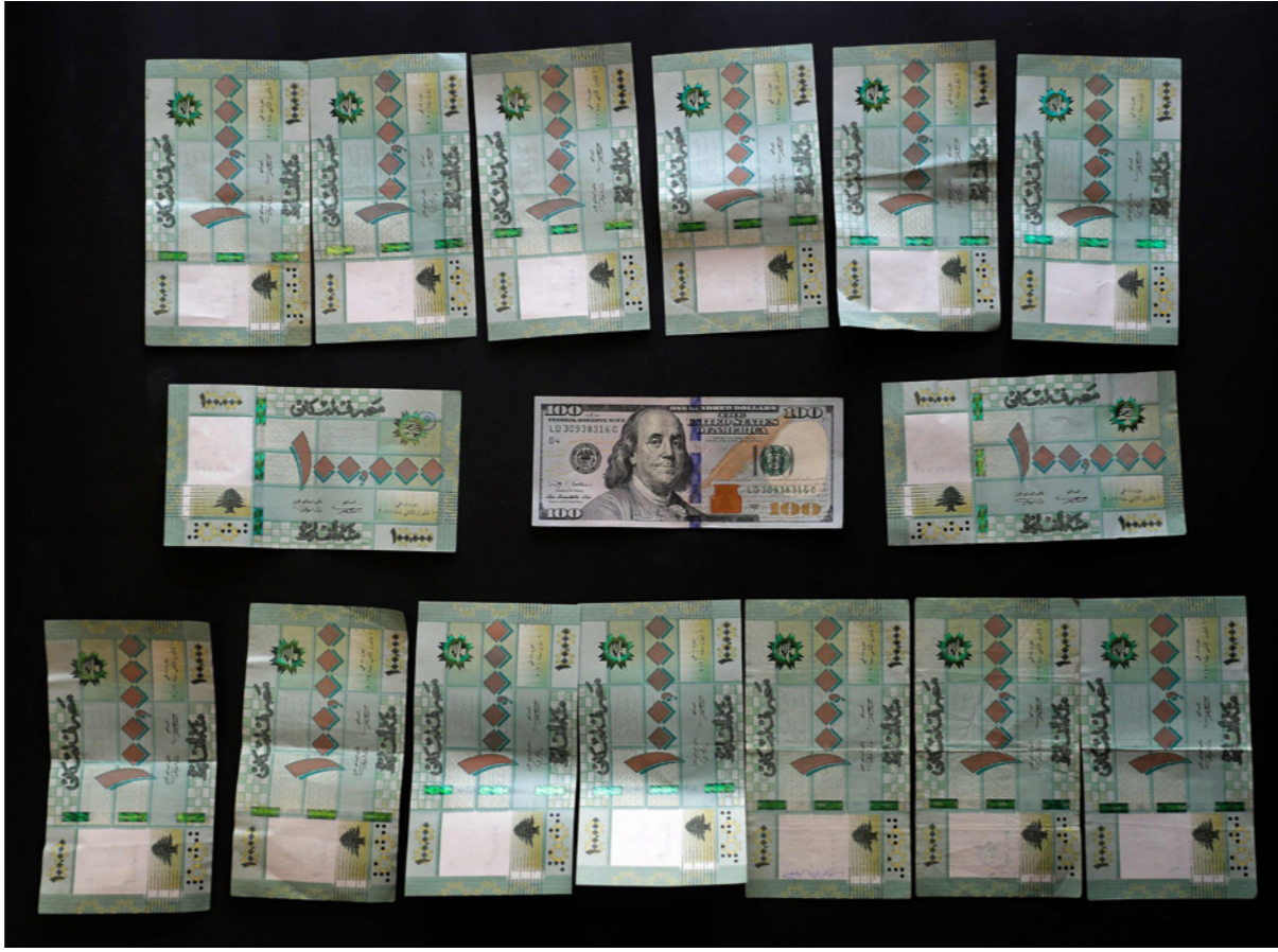
ورقة المئة دولار محاطة بأوراق ما يساويها من الليرات اللبنانية (1.5 مليون)

ومع توقف تدفقات الدولار، يعتمد مصرف لبنان المركزي على الاحتياطات الأجنبية لدعم ثلاث سلع رئيسية هي القمح والوقود والدواء، فضلاً عن بعض السلع الأساسية الأخرى. وسبق لدياب أن قال إن البلاد قد تستخدم الاحتياطات المتبقية للدعم لفترة ستة أشهر. وقال أمس، كمتسا قد تحوفاً وحذرنا مسبقاً من أن استمرار زيف الدولار على الاحتياطي، ولهذا قمنا بإرسال عدة رسائلها لترشيد الدعم على البنوك اللبنانية في ديسمبر الماضي» وتابع قاتلاً «لم يتم اتخاذ قرار حتى الآن».