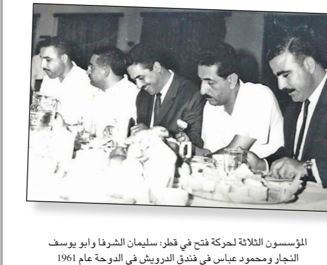
المؤسسون الثلاثة لحركة فتح في قطر: سليمان الشرفا و أبو يوسف النجار ومحمود عباس في فندق الدرويش في الدوحة عام 1961