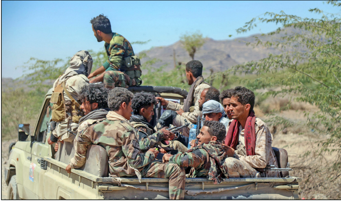
مقاتلو الجيش اليمني متجهين نحو المعارك ضد الحوثيين في محافظة تعز

وقال: «تم تذكير العالم بمحنة المهاجرين الأسبوع الماضي عندما اندلع حريق غير عادي و مروغ في مركز احتجاز في صنعا يضم مهاجرين معظمهم إثيوبيون». فيما قالت منظمة «هيومن رايتس ووتش» في بيان إن