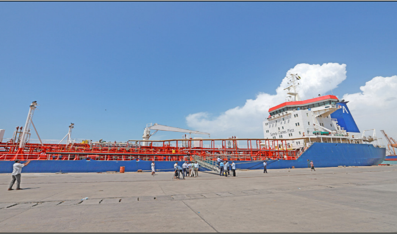
إحدى سفن الوقود التي وصلت أمس إلى ميناء الحديدة