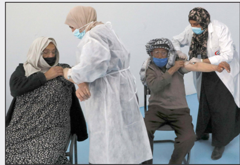
علامات في وزارة الصحة الفلسطينية يقمن بتطعيم مواطنين ضد كورونا