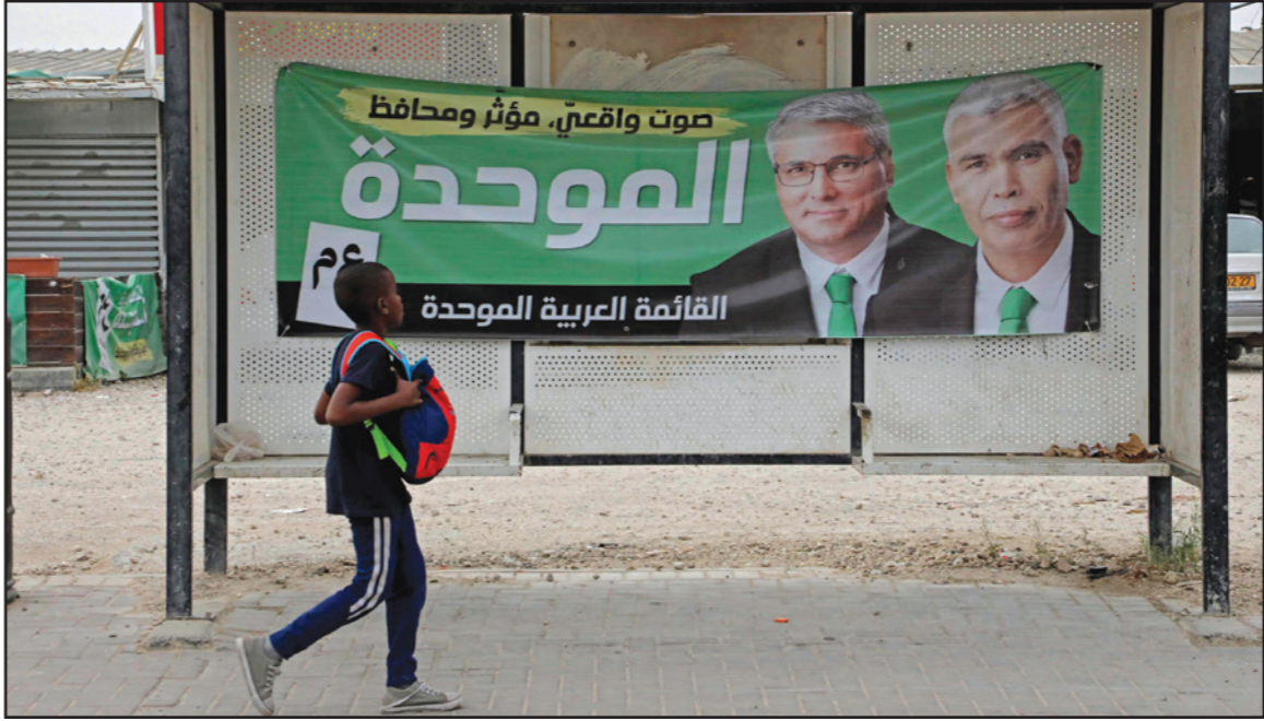
صبي يمر أمام ملصق انتخابي للـ القائمة الموحدة، أمس