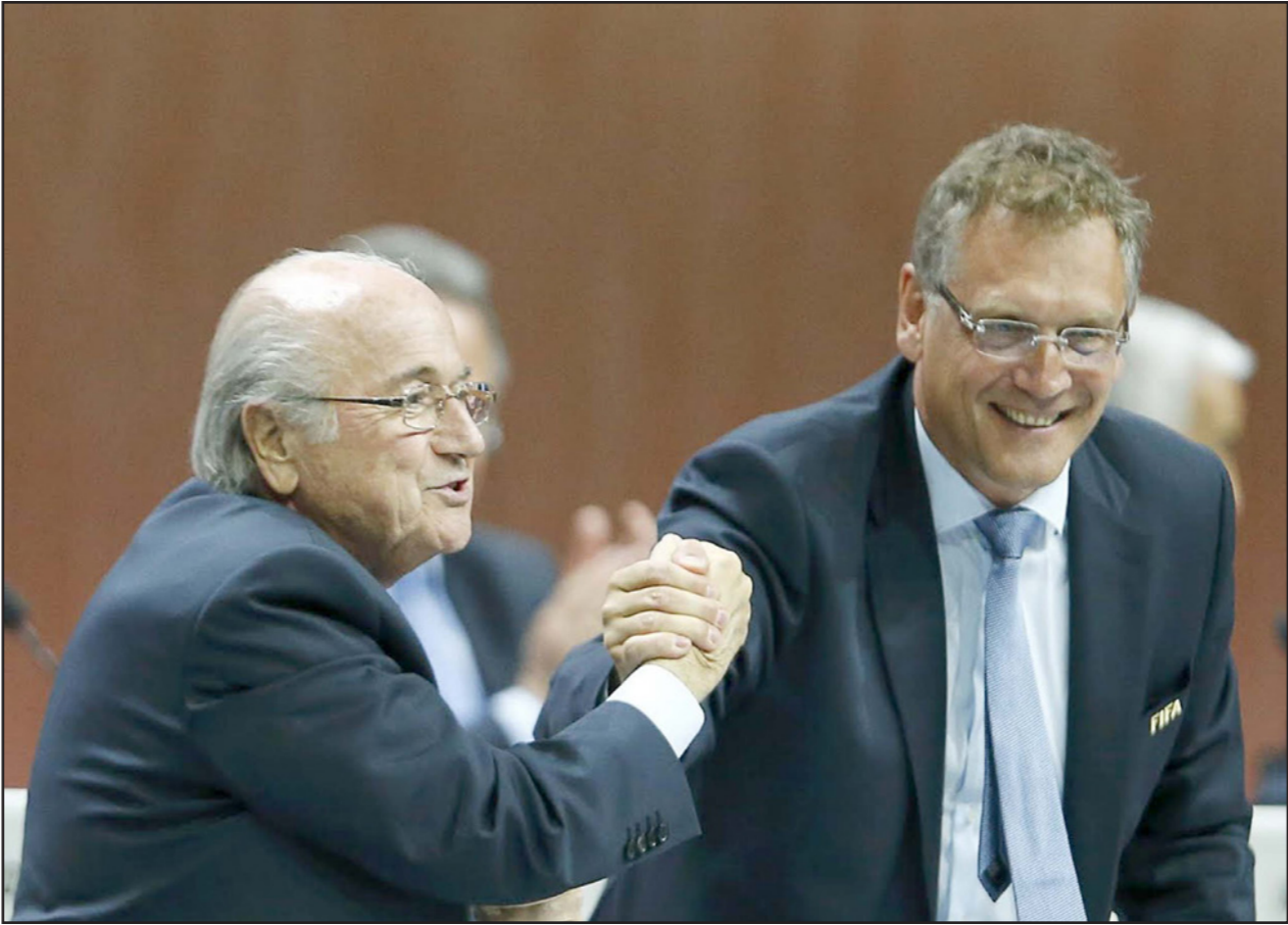
رئيس الفيفا السابق بلاتر (يسار) وأمينه العام السابق فالكه في صورة تعود إلى 2015