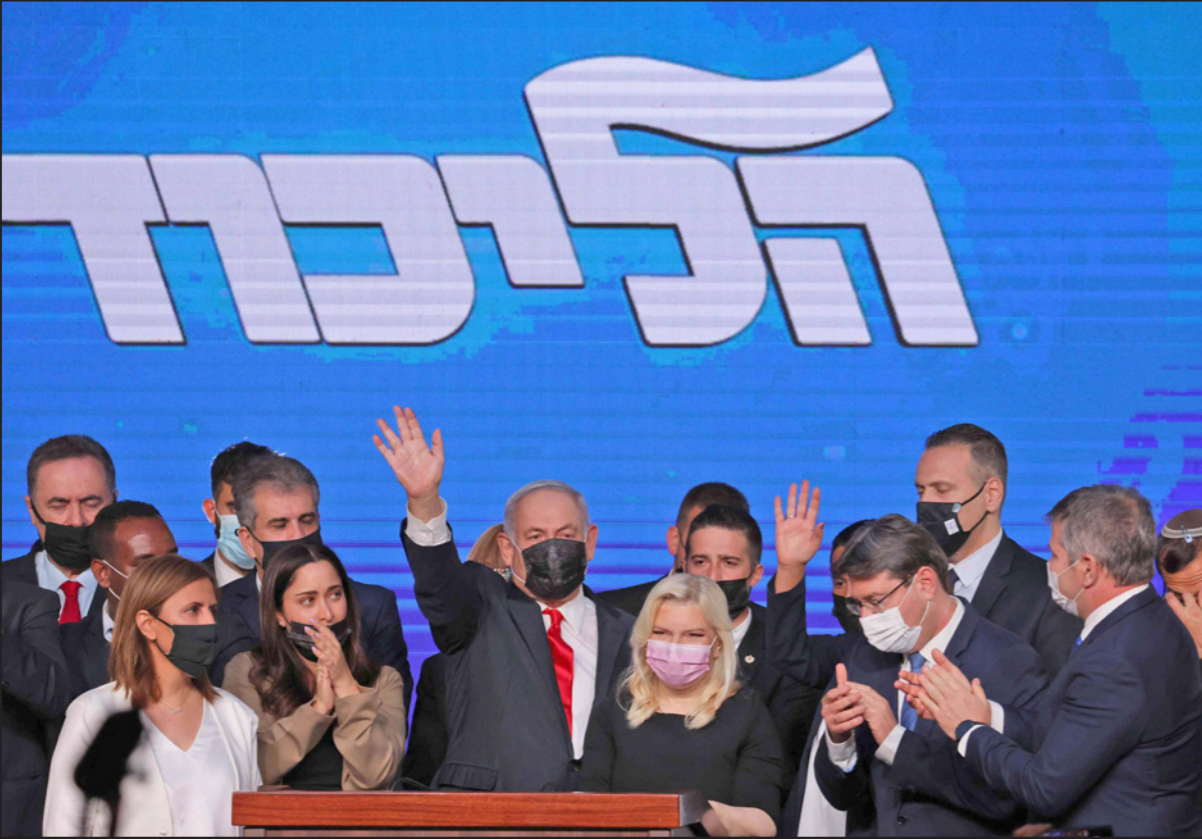
نتنياهو يعلن انتصاره المبكر في الانتخابات