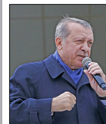
الرئيس التركي رجب طيب اردوغان

إلى ذلك، أعرب رئيس المجلس الأعلى للمصالحة الوطنية الأفغانية، عبد الله عبد الله، عن أمله لإحراز «تقدم ملموس» خلال «مؤتمر إسطنبول»، وجاء ذلك خلال حديثه مع وكالة «الأنصول» التركية. وأوضح عبد الله أنه «كانت هناك الكثير من المناقشات بين الجانبين في الأشهر القليلة الماضية في الدوحة، وستستمر الفترة الجارية». وأشار أنه سيقبّل ذلك انعقاد مؤتمر إسطنبول للسلام من أجل تسريع عملية التفاوض بين الأفغان، والترقب أن يشارك فيه كبار قادة الحكومة وحركة طالبان. وشدد على ضرورة الاستفادة من وجود عناصر القرار خلال اجتماع إسطنبول، لدفع عملية