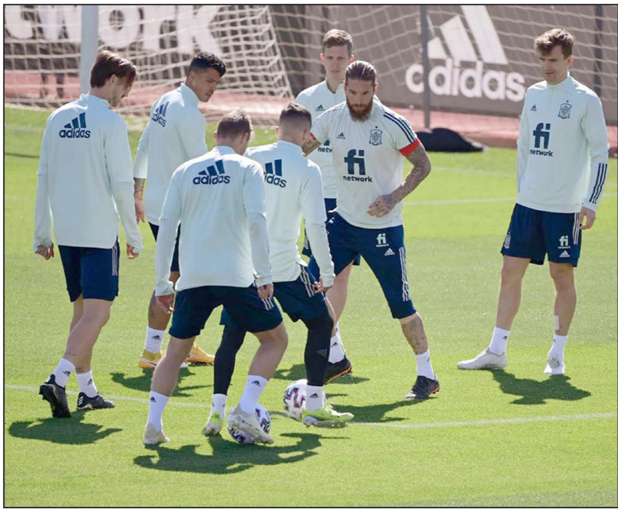
الخضرم راموس (المتحى) يتدرب مع نجوم اسبانيا من الشبان

مدريد - أ ف ب: قد يكون على مشارف الـ35 عاماً وعاشداً للثلاثين في ركبته اليسرى، لكن سيرخيو راموس لا يزال المرجح الدفاعي الرئيسي في تشكيلة المنتخب الإسباني والحرس القديم الذي لا غنى عنه وسط جيل من الشبان في تشكيلة المنتخب. ورغم قرار المدرب لويس إنريكي صخّ دعاء جديدة في المنتخب منذ عودته إلى منصبه في خريف 2019، بقي القائد راموس صامداً في وجه جميع التعديلات التي أدخلت على المنتخب، خلافاً لصديقه الأندلسي خيسوس نافاس، ابن الـ34 عاماً الذي أبعد عن التشكيلة. ومع عودة خوردي ألبا (31 عاماً) وزميله في دفاع برشلونة سيرخيو بوسكيتس (32 عاماً) إلى تشكيلة المنتخب لخوض مباراته الأولى في تصفيات مونديال 2022، أولها اليوم في غرناطة ضد اليونان ضمن المجموعة الأولى، يشكّل قائد ريال مدريد مع غريميه الفيلق القديم الذي يعول عليه إنريكي لنقل خبرته إلى الجيل الجديد. ويدخل راموس الذي لم يجدد عقده حتى الآن مع ريال وسط تقارير عن إمكانية انتهاء مغامرته مع اللقب الأبيض في حزيران/يونيو المقبل، الجولة الأولى من مباريات التصفيات وهو أمام فرصة تعزيز مركزه كأكثر اللاعبين الأوروبيين مشاركة مع منتخبات بلادهم وتقليص الفارق الذي يفصله عن الرقم القياسي المطلق والسجل باسم المصري أحمد حسن، وخاض راموس حتى الآن 178 مباراة دولية، ويتخلف بفارق ست مباريات عن رقم حسن، وفي حال مشاركته في تصفيات مونديال 2022، ضده اليونان وجورجيا الأحد وكوسوفو الأربعاء المقبل، سيصبح على بعد ثلاث مباريات من العجم المصري. ورغم تقدمه في العمر، لا يزال راموس أحد أفضل المدافعين في العالم وأكثرهم تأثيراً، وأبرز