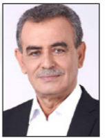
د. جمال زحالق*

جاءت النتائج الأولية للانتخابات الإسرائيلية بنتيجة تعادل متراجح بين داعي ومعارضني بقاء بنيامين نتنياهو في السلطة، وقد تحمل النتائج النهائية بعض التغييرات الطفيفة، لكن المهمة، لصالح حزب الليكود أو ضد. لقد توقع الملحن حدوث مفاجأة، وحصول معسكر نتنياهو على أغلبية مطلقة، وكانت المفاجأة أنه لم تحدث مفاجأة، ويبدو أن الأزمة السياسية مستمرة، وسيكون من الصعب جدًا تشكيل حكومة ائتلافية.