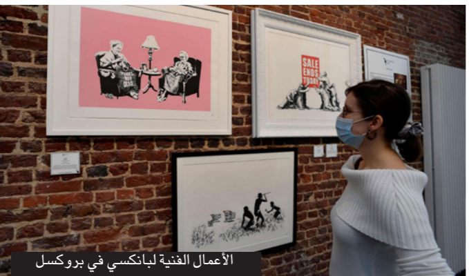
الأعمال الفنية لبانكسي في بروكسل

وتحمل اللوحة الرسومة بالأبيض والأسود عنوان «غاييم تشاينجر» (تغيير العادة) وهي تمثل فتى صغيراً يلعب بدمية على شكل ممرضة تضغ كمامة بعدما رمى في القمامة مجسمات «بانمان» و«سوبرمان».