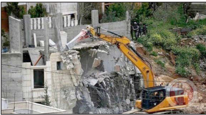
جرافات الاحتلال تهدم منازل (صورة أرشيفية)

إلى ذلك استمرت الاعتداءات الاستيطانية الرامية لطردهم الفلسطينيين خاصة المقدسين من منازلهم، وهدمت جرافسات الاحتلال صباح أمس جرافسات الاحتلال ثلاثة دونمات في قرية كيسان شرق بيت لحم، ونقلت وكالة الأنباء