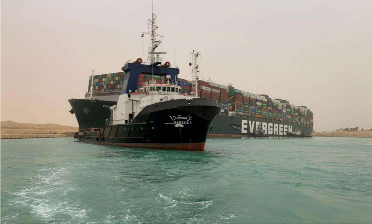
قارب يقر السفينة الجانحة التي عطلت المرور بالقناة

القاهرة - وكالات الأنباء: ذكرت شركة وكالة الخليج مصر الحدودية للملاحة «جي.إيه.سي» أمس الأربعاء أن سفينة الحاويات العملاقة التي تسد قناة السويس منذ أكثر من يوم أعيد تعويمها جزئياً، ومن المتوقع استئناف حركة المرور قريباً في أسرع طريق للشحن من أوروبا إلى آسيا.