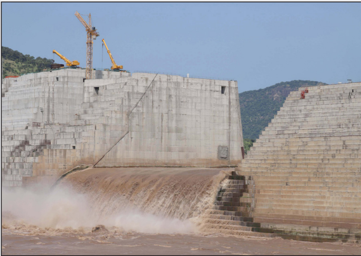
سد النهضة في إثيوبيا

ودخلت الدول الثلاث مصر والسودان وإثيوبيا في مفاوضات شاقة طوال 9 سنوات فشلت خلالها في الوصول لاتفاق بشأن ملء وتشغيل السد.