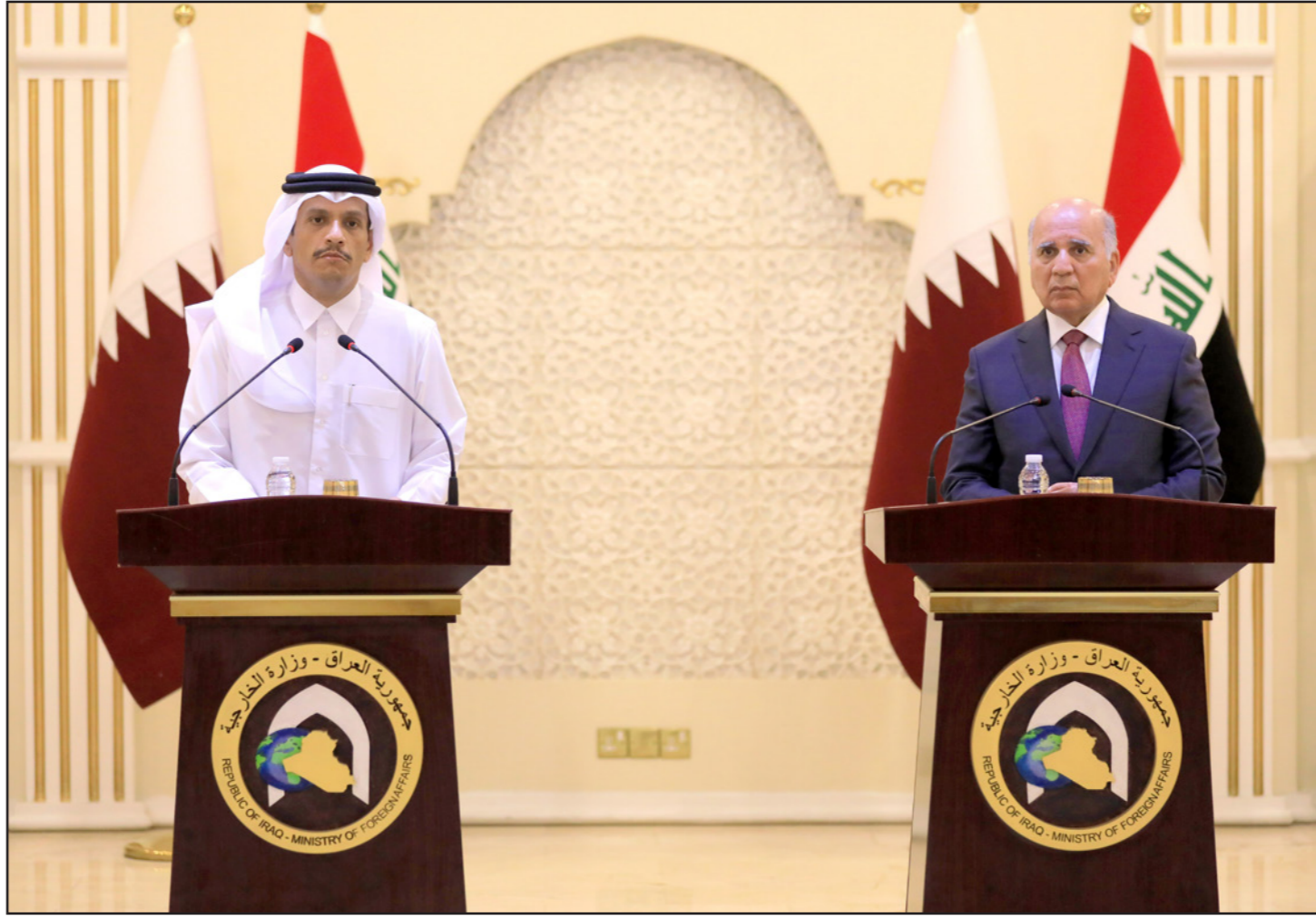
وزير الخارجية القطري محمد بن عبد الرحمن آل ثاني (يسار) خلال مؤتمر صحفي مع نظيره العراقي فؤاد حسين