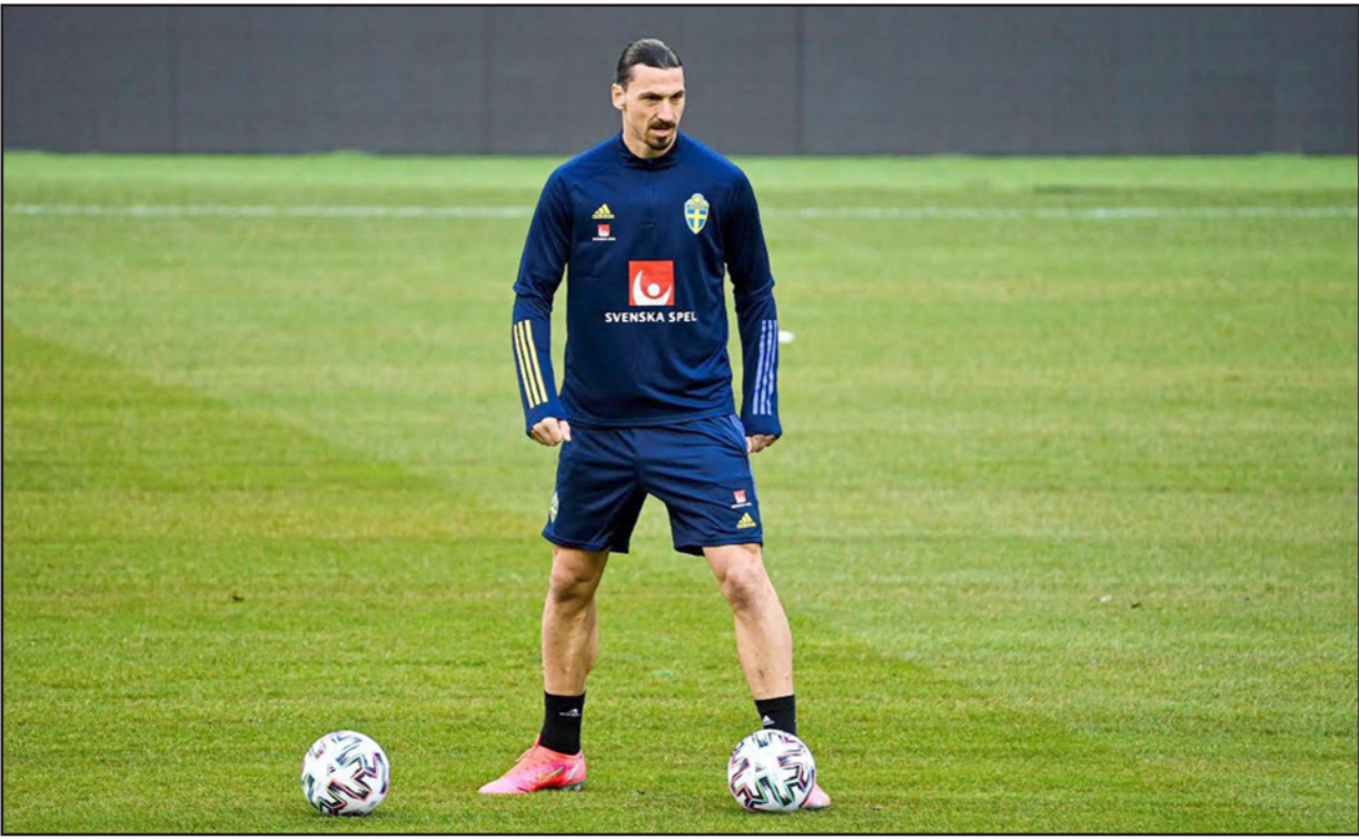
الأنظار ستصب على عودة النجم المخضرم زلاتان الى صفوف المنتخب السويدي اليوم

لكن المنتخب خرج من مشاركة مخيبة في دوري الأمم (فوز واحد وخمس هزائم)، وهبط إلى المستوى الثاني. ويسعى منتخب ألمانيا إلى رفض غبار خسارته التاريخية أمام إسبانيا بسداسية نظيفة في تشرين الثاني/نوفمبر الماضي ومصالحة جماهيره، عندما يستضيف نظيره الأيسلندي في دويسبيرغ، ضمن المجموعة العاشرة. وقال المدرب يواكيم لوف الذي سيترك منصبه في نهاية كأس أوروبا المقررة من 11 حزيران/يونيو إلى 11 تموز/يوليو: "نريد أن نبدا العام الذي يشهد إقامة كأس أوروبا بترك بصمة وإسعاد جماهيرنا مجدداً. ويحتاج لوف إلى تحقيق انتصارات مقنعة أمام منتخبات في متناول فريقه لاستعادة ثقة الجماهير التي تلقت صدمة كبيرة عندما خسر المنتخب في دوري الأمم أمام إسبانيا صفر-6 في أقسى خسارته له منذ 1931. بعدها، أظهر استطلاع للرأي أن 89% من الجمهور الألماني يشعرون بأن لوف فشل في إعادة بناء المنتخب بعد الخروج المذل من الدور الأول في مونديال 2018. ومن جهته، سيكون منتخب إسبانيا حاضراً لمواجهة اليونان في المجموعة الثانية أيضاً، معتمداً