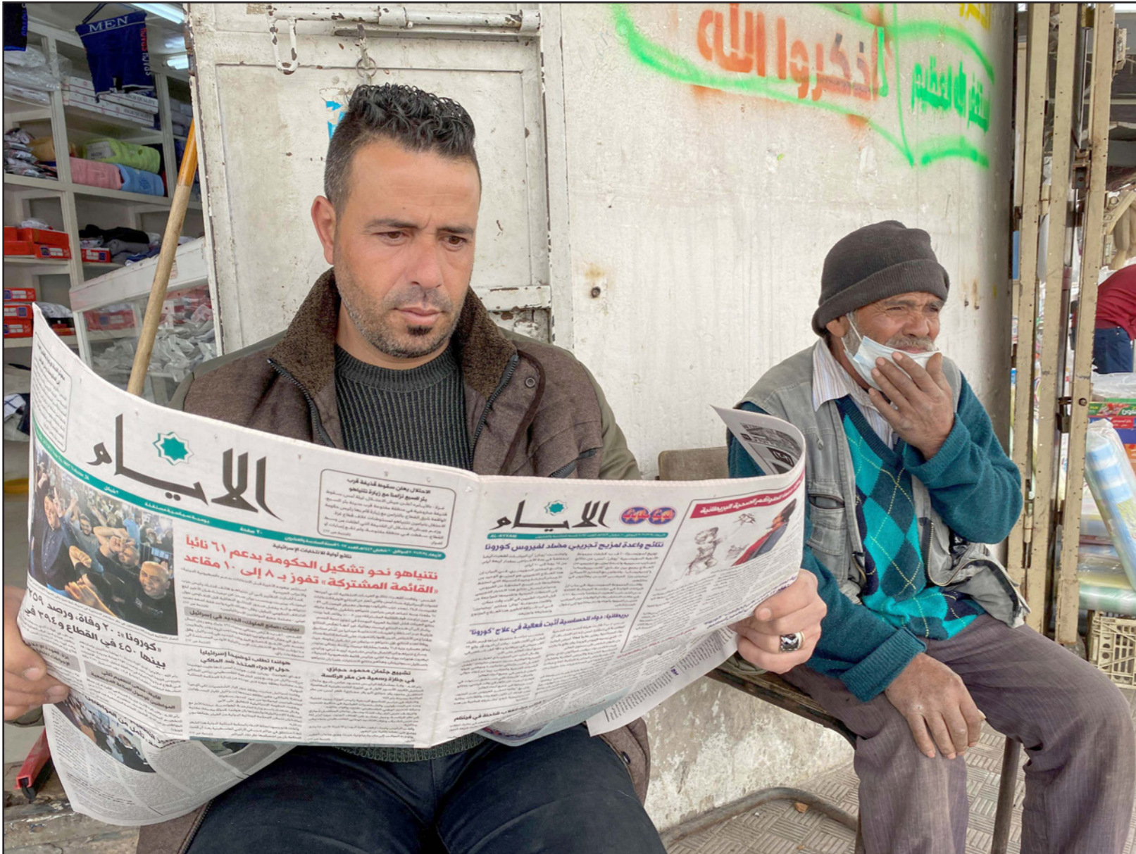
فلسطيني يتابع أخبار الانتخابات الإسرائيلية

رغم الأنباء التي تفيد بصعوبة قدرة الأخيرة على تشكيل القائمة في الوقت المتبقي، بسبب الخلاف على حجم التمثيل وترتيب الأسماء. كما يستبعد أن يصار إلى دخول حركتي فتح وحماس في قائمة انتخابية واحدة.