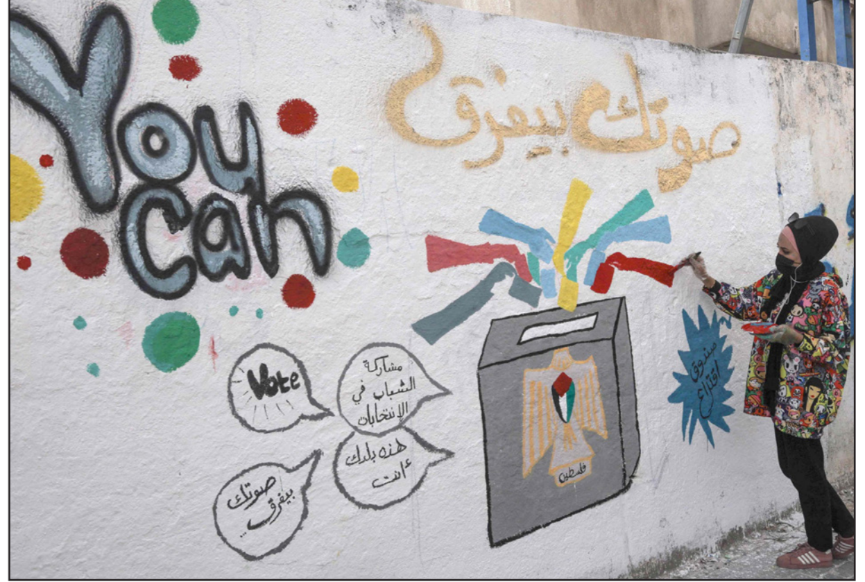
فنانة فلسطينية ترسم جدارية تؤكد فيها أهمية التصويت في الانتخابات