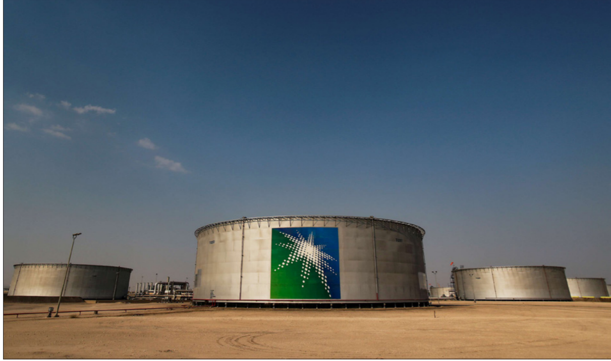
خزانات نفط تابعة لشركة «أرامكو» السعودية في أبقيق

■ دبي - رويترز: قالت ثلاثة مصادر أن «أرامكو السعودية» أرسلت طلب من البنوك لتقديم عروضها لتمويل ترغيب في احتاجته لمستثمرين يتطلعون لاستئجار خطوط أنابيب تملكها، في مؤشر على أن شركة النفط العملاقة تمضي قدماً في خططها لاستخلاص القيمة من أصولها. وقال مصدران أن الشركة العملاقة، التي تتلقى المشورة من «بنك جيه بي مورغان» الأمريكي ومجموعة «ميتسوبيشي يو.إف.جي» المالية اليابانية بخصوص التمويل، أرسلت الطلب خلال الأسابيع القليلة الماضية إلى بنوك سبق أن اقترنت بالشركة بالفعل. واشترطت المصدر عدم كشف هويتها نظراً لاعتبارات سرية المعلومات. وأضاف المصدران أن الشركة تطلب من المقرضين تقديم التزامات قد تصل إلى عشرة مليارات دولار. لم ترد «أرامكو» و«جيه بي مورغان» بعد على طلبات التعليق، وأجمت «ميتسوبيشي يو.إف.جي» عن التعليق. وكانت مصادر قد قالت في السابق أن صفقة خطوط الأنابيب المزمعة ستكون على غرار صفقات البنية التحتية التي وقعت خلال العامين الماضيين شركة بترول أبوظبي الوطنية «دنوك»، التي جمعت مليارات الدولارات من تأجير أصول خطوط أنابيب النفط والغاز إلى مستثمرين. وتجهز «أرامكو» بذلك حزمة تمويل يمكن للمشتريين استخدامها لدعم الصفقة. وقال أحد المصدران الشروط المقدمة من الشركة صارمة من حيث التسعير ومدة القرض، وقال مصدر ثان أن الشروط تتسجم مع أوضاع