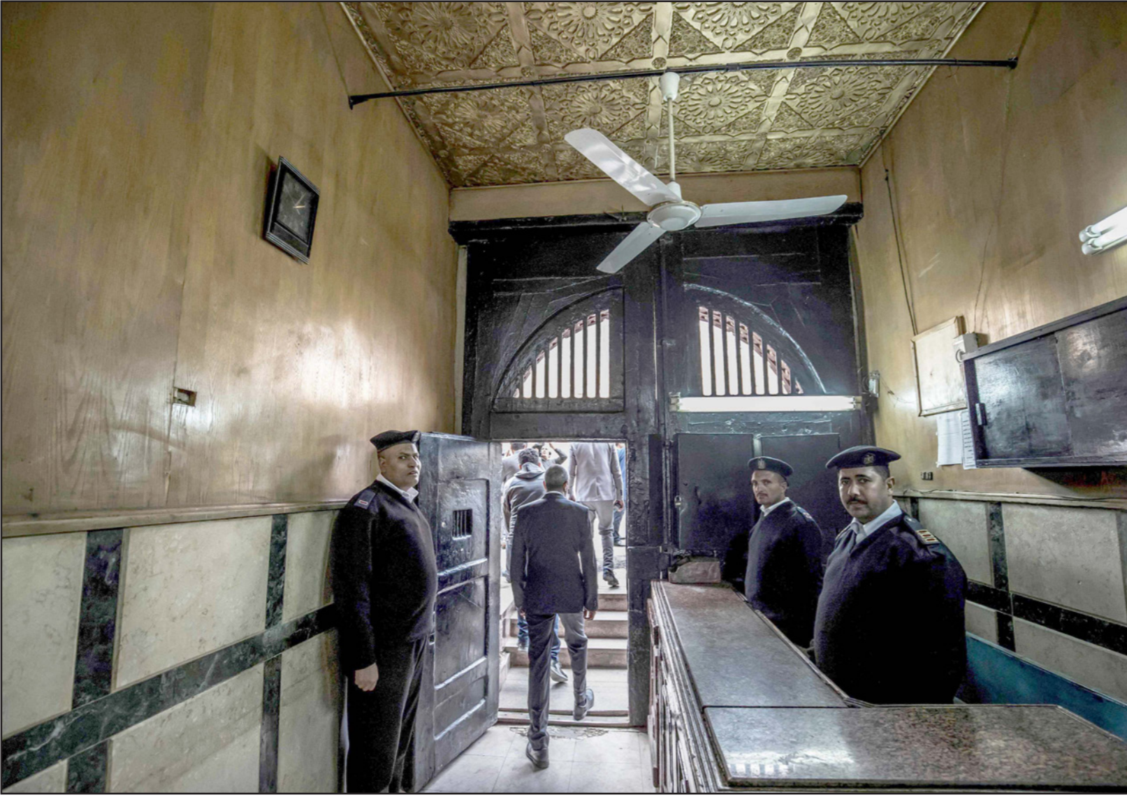
عناصر أمن عند مدخل سجن طره في القاهرة

أداء امتحانات السنة الأخيرة في الكلية. وحسب التقرير: الأمر نفسه تكرر مع عمرو ربيع، طالب بكلية هندسة تم القبض عليه في مارس/ آذار 2014 بتهمة «الانضمام لتنظيم بيت القدس» وإيداعه سجن طرة، وكانت إدارة السجن قد امتنعت عن استلام الكتب والأوراق التي يحتاج إليها عمرو للاستعداد لامتحانات.