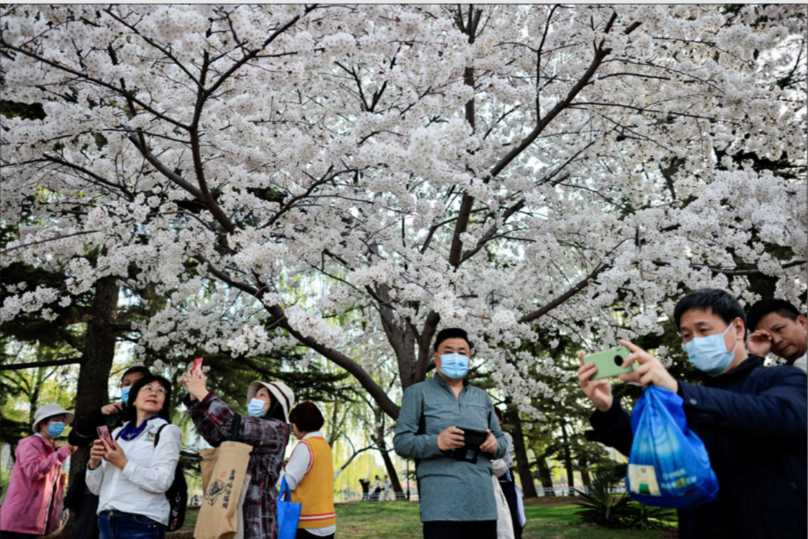
صينيون يلتقطون صوراً بجوار أشجار الكرز المزهرة في عادات الحياة في بلادهم إلى طبيعتها

وأضاف الدكتور داسزاك أنه لم يتم تقيد الفريق في مقابلاته مع العلماء الذين كانوا على الأرض في بداية الوباء. ولقد اتهم هو نفسه بوجود تضارب في المصالح بسبب أبحاثه السابقة حول فيروسات كورونا مع معهد وهان لعلم الفيروسات، وهو، كما قال، ما يجب أن يفعله عالم بيئة المرض. وأضاف داسزاك: