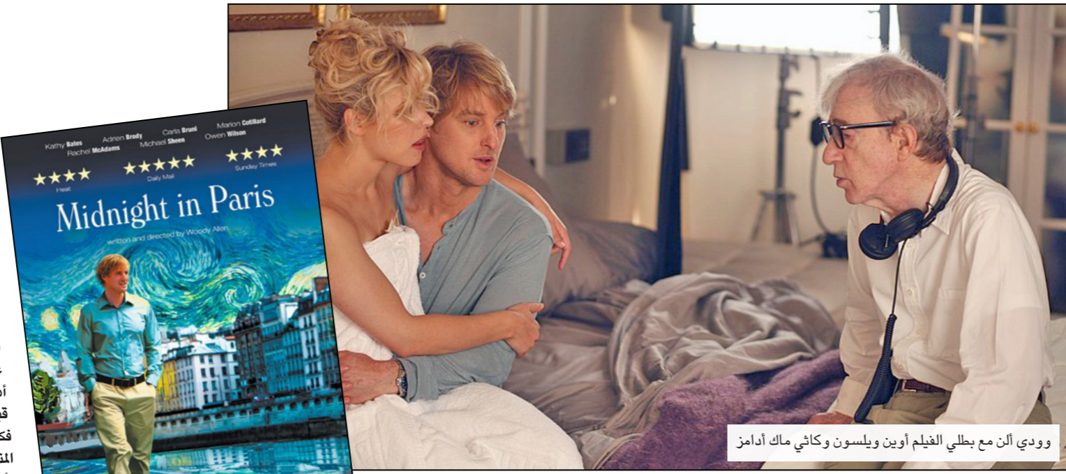
وودي آلن مع بطلي الفيلم أوين ويلسون وكاتي ماك أدامز