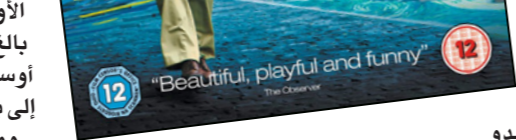
تبدو تلك الفترة أجمل بكثير

من الحقيقة، فملا كانت جميع الشخصيات التي التقى بها «جيل» مثل هنغواي، ودالي، وبيكاسو، والأخريين مختلفين عما رآه «جيل» لأنهم لم يكونوا على الإطلاق لطفاء في تصرفاتهم مع الآخرين، وكان كل من ظهر في تلك الفترات الخيالية سعيدا ومستمتعا في وقته، وبين الفيلم كذلك أن تفسير مفهوم «الزمن الجميل» لا يشترك فيه الجميع، إذ لكل فرد مفهومه الخاص حول الزمن الجميل، لكن أفضل «جيل» فضل فترة عشرينيات القرن العشرين، بينما يلاحظ المرء أن واقعها ليس في الحقيقة بذلك السوء، وأنه بالإمكان التعايش معه إن حاول بجدية.