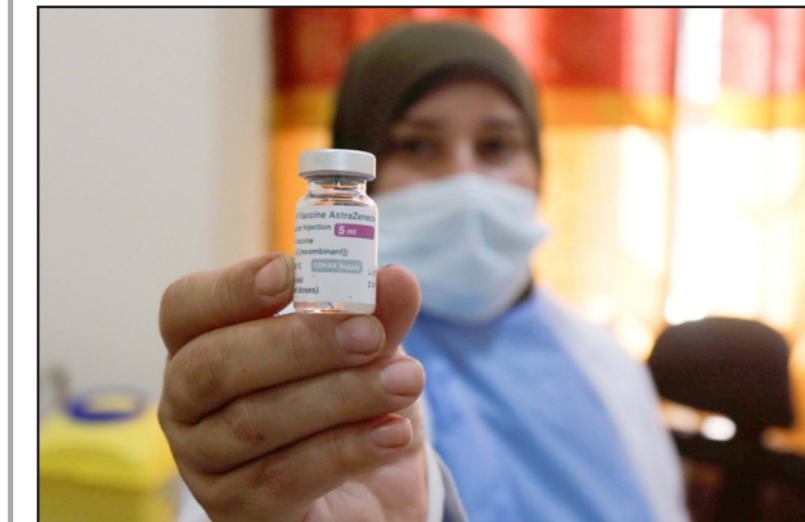
عاملة في القطاع الصحي تحمل جرعة من لقاح كورونا