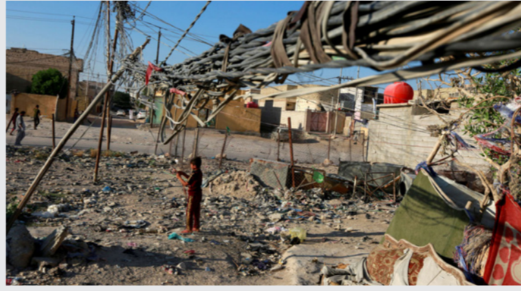
تهديات عشوائية لأسلاك الكهرباء في حي في بغداد

بغداد - أف ب: وافقت الولايات المتحدة على تمديد إعفاء العراق من العقوبات على إيران في استيراده للطاقة، لمدة أربعة أشهر، على ما أفاد مسؤول أمس الأربعاء. ظل إدارة جو بايدن ولأطول مدة يسمح بها القانون، ويأتي قبل أيام من «حوار إستراتيجي» بين البلدين. وعلى الرغم من أن العراق بلد نفطي، إلا أنه يعتمد بشدة على إيران في مجال الطاقة، إذ يستورد منها ثلث احتياجاته الاستهلاكية من الغاز والكهرباء وذلك بسبب بُنيته التحتية المتهاكلة التي تجعله غير قادر على تحقيق اكتفاء ذاتي لتأمين احتياجات سكانه البالغ عددهم 40 مليون نسمة. وانسحبت الإدارة الأمريكية السابقة برئاسة دونالد ترامب من الاتفاق النووي مع إيران وأعدت في نهاية 2018 فرض عقوبات عليها، ما يحول دون تعامل الكثير من الدول والشركات العالمية مع الحكومة أو مع شركات إيرانية خوفاً من أن تطالهم العقوبات. لكن الإدارة الأمريكية واصلت منح إعفاءات للعراق إلى حين أن يعثر على موردين آخرين، وكان آخرها في يناير/كانون الثاني لمدة ثلاثة أشهر. وبموجب الإعفاء الجديد الذي أعطته