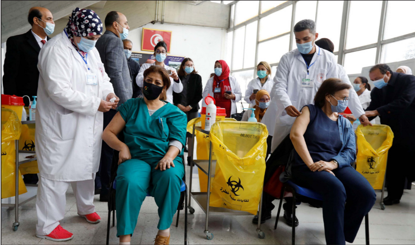
تونسيون يتلقون اللقاح في أحد مراكز العاصمة

ودعت المنظمة وزارة الصحة إلى «احترام الأولويات الواردة بالاستراتيجية الوطنية للتطعيم ضمانا لتكافؤ الفرص وتعزيز ثقة المواطنين في عملية التطعيم، والعمل