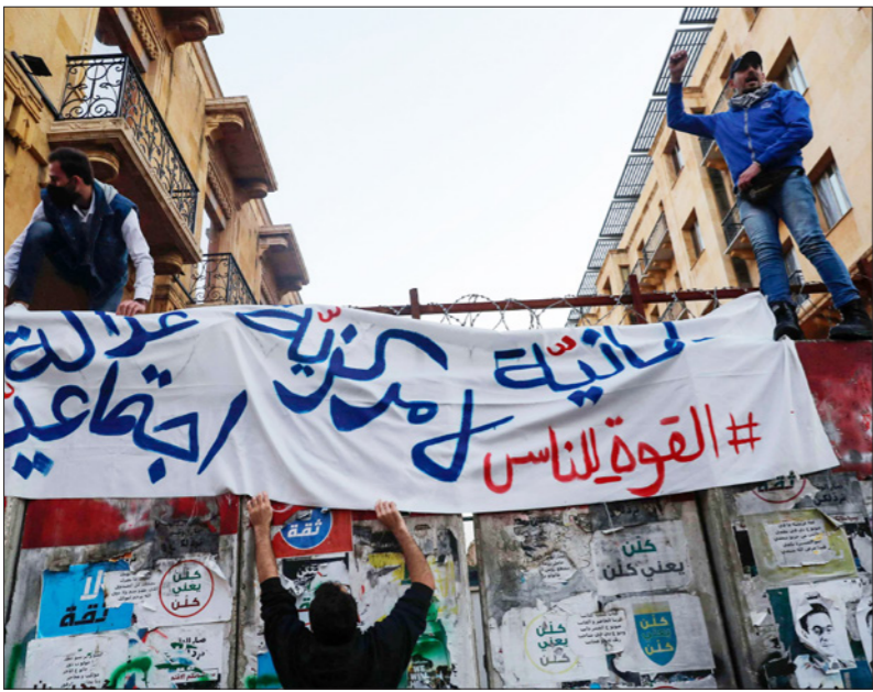
هوة كبيرة بين مطالب اللبنانيين وهمومهم وبين زعمائهم

عام 2005، ويتأثر عون بصهره الدولفين جبران باسيل الذي فرضت الولايات المتحدة عقوبات عليه بسبب الفساد وعلاقاته مع حزب الله ويصر على حكومة غير عملية وليست تكنوقراط. ويرفض عرابو السلطة في لبنان التعاون بجدية مع خطط الإنقاذ التي عرضها عليهم صندوق النقد الدولي، وعبرت الدول المنحة بقيادة فرنسا والولايات المتحدة وبريطانيا عن استعدها لتقديم الدعم لحكومة تلتزم الإصلاح، إلا أن الطبقة السياسية ترفض تشكيل وحدة، خوفاً من فسخ اختلاسها العامة، ويريد حزب الله شراء الوقت وانتظار ماذا سيحدث بين إدارة جوزيف بايدين وإيران فيما يتعلق بملف الأخيرة النووي، وهو لا يريد تعرض تحالفه المسيحي للخطر أو يخاطر بسلطته.