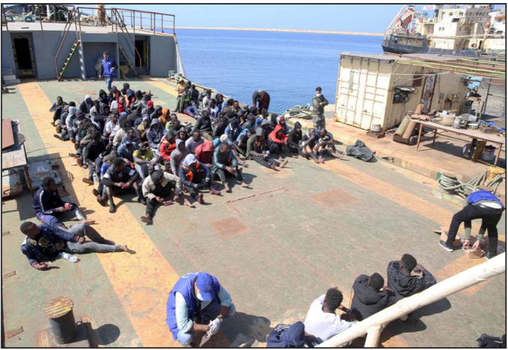
مهاجرون أفرقة تم انقاذهم قبالة سواحل الليبية

■ طرابلس - الأناضول: أعلنت السلطات الليبية إنقاذ 163 طالب لجوء، ليل الثلاثاء - الأربعاء، كانوا في طريقهم إلى الشواطئ الأوروبية. جاء ذلك عبر عمليتي إنقاذ منفصلتين، وفق بيان نشرته رئاسة أركان القوات البحرية الليبية، عبر صفحتها على «فيسبوك».