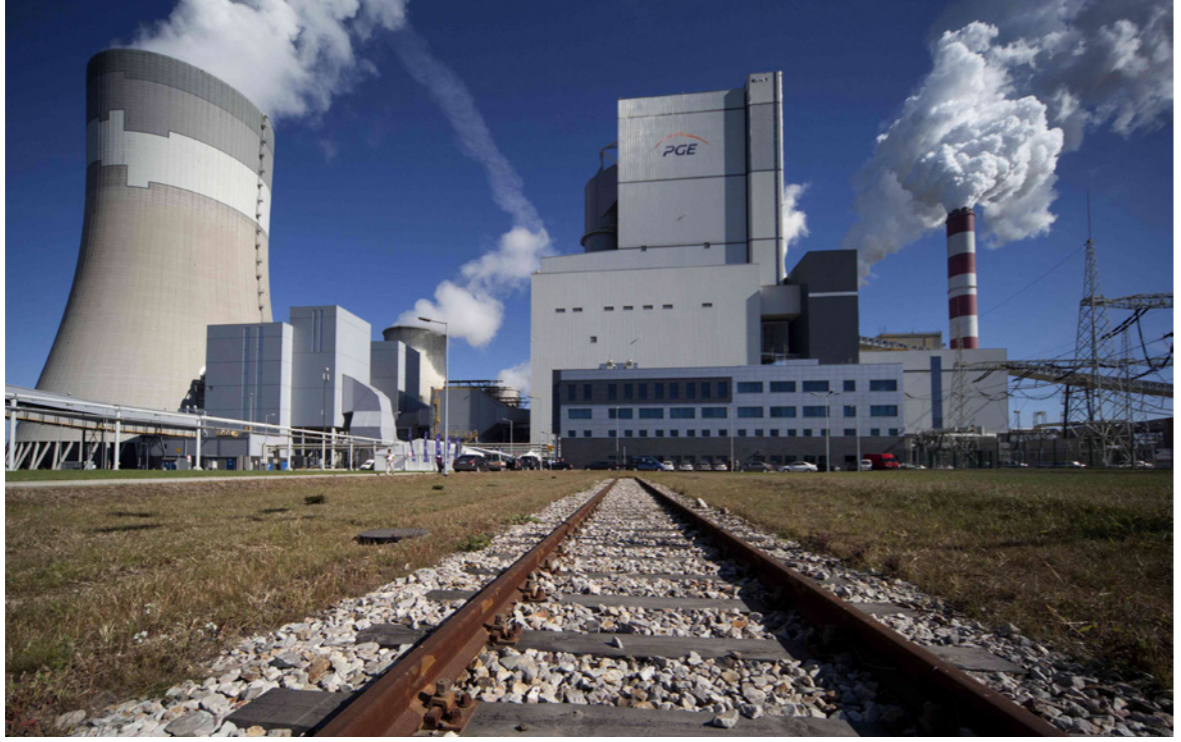
انبعاثات دخان كثيفة من محطة كهرباء بولندية وقودها الفحم

باريس - أف ب: تمهيداً لؤتمر المناخ «كوب26»، في نهاية السنة، عقد قطاع الطاقة العالمي أمس الأربعاء قمة افتراضية لمناقشة وسائل الحد من الانبعاثات الغازية المسببة للاحتباس الحراري والتي يُتَجر «ارتفاعها بشكل كبير» مخاوف هذه السنة مع الانتعاش الاقتصادي. وتنظم «وكالة الطاقة الدولية» والرئاسة البريطانية لؤتمر «كوب26» المرتقب في نوفمبر/ تشرين الثاني في غلاسكو، القمة التي بدأت أمس عن بعد والتي أطلق عليه اسم «قمة حيادية» الكربون. على جدول أعمال هذه الحوارات التي تتركز على قطاع الطاقة، المصدر الرئيسي لانبعاثات ثاني أكسيد الكربون، سبل المساهمة في تحويل مفاوضات حياد الكربون إلى حقيقة واقعة، والتي حدثتها العديد من الدول منتصف القرن. وأعلن عن مشاركة مسؤولين في قطاعي الطاقة والمناخ من أربعين دولة مثل المبعوث الأمريكي جون كيري والصيني شني زيهووا ونائب رئيس المفوضية الأوروبية فرانسوا تيرمانس أو وزير الطاقة الهندي راج كومار سينغ. كما تشارك الدول الناشئة الكبيرة مثل إندونيسيا وجنوب إفريقيا والبرازيل، وكذلك أستراليا وإيطاليا واليابان وفرنسا أو ألمانيا بالإضافة إلى منظمات غير حكومية ومؤسسات وشركات دولية.