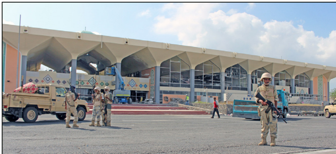
مطار عدن الدولي

ويبدو النزاع في اليمن بين الحكومة الحوثيين الذين يسيطرون على قسم كبير من شمال البلاد بما يشمل العاصمة التاريخية صنعاء منذ 2014. وتتلقى القوات الموالية للسلطة دعماً منذ 2015 من تحالف عسكري تقوده السعودية. وبعد ست سنوات من الاقتتال على السلطة في نزاع حصد أرواح الآلاف، يشهد اليمن انهياراً في قطاعات الصحة والاقتصاد والتعليم وغيرها، فيما يعيش أكثر من 3.3 ملايين نازح في مدارس ومخيمات حيث تتفشى الأمراض كالكليليا بفعل شح المياه النظيفة. وأصدر النزاع منذ 2014 عن مقتل عشرات الآلاف ونزوح الملايين، حسب منظمات دولية، بينما بات ما يقرب من 80% من سكان اليمن البالغ عددهم 29 مليوناً يعتمدون على المساعدات في إطار أكبر أزمة إنسانية على مستوى العالم.