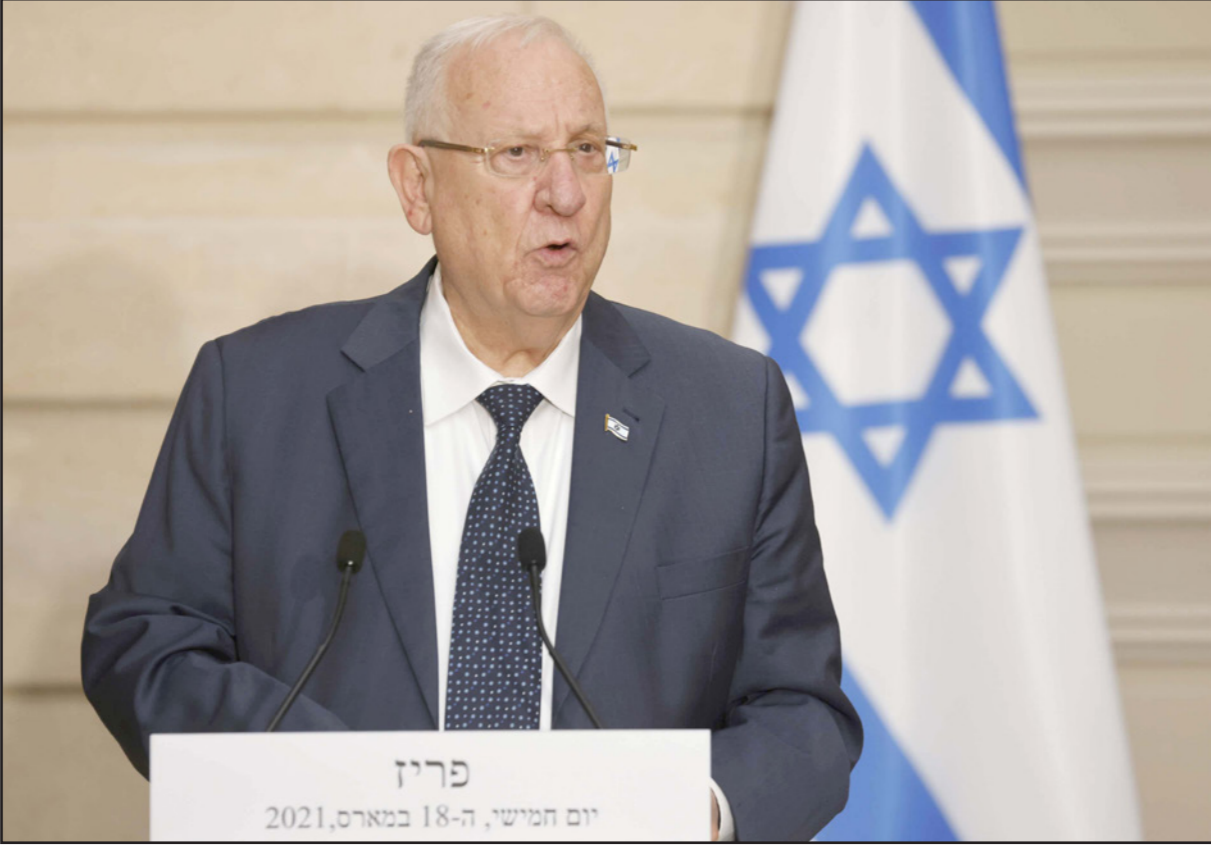
الرئيس الإسرائيلي رؤوفين ريفلين

نازي صغير تعقبها على مشاركة بن غفير في المظاهرات المنددة بإسحق رابين التي شبهته كضابط نازي وعبّات الأجواء لاغتياله. دانكنر كسب القضية في البداية، لكن بن غفير واصل الاستئناف حتى كسب القضية وحصل على تعويض رمزي. يبدو أن حرص بن غفير على دخول عالم السياسة دفعه للتخفيف من غلوائه وتطرفه الملحن على الأقل، فقد تخلص من صورة الطبيب القاتل باروخ غولدشتاين التي كان يعقلها في غرفة جلوسه، وبيات بيدي مزيدا من الاعتدال في مقابلاته فأعلن أنه لا يكره جميع العرب بل يعادي أحزابهم المتطرفة والإرهابيين منهم، لكنه ظل يدافع عن قاتل رابين بزعم أن الحكومة أفرجت عن إرهابيين قتلة (يقصد الفلسطينيين) ومن باب أولى أن يتم الإفراج عن يغثال عمير. ورغم كل ذلك يبدو أن هناك خيارا بأن تدعم السياسة العربية الموحدة (الحركة الإسلامية) حكومة يشكها نتنياهو مع «ميمنا» برئاسة نفتالي بينيت و«الصهيونية اليهودية»، لكن مثل هذه الحكومة مرشحة للسقوط مبكرا لأن جمهور الحركة الإسلامية لن يقبل استمرار حكومة الاحتلال بانتهاك حرمة الحرم القدسي الشريف أو شن عدوان جديد على غزة مع بقاء دعم الموحدة لها بأي شكل من الأشكال.