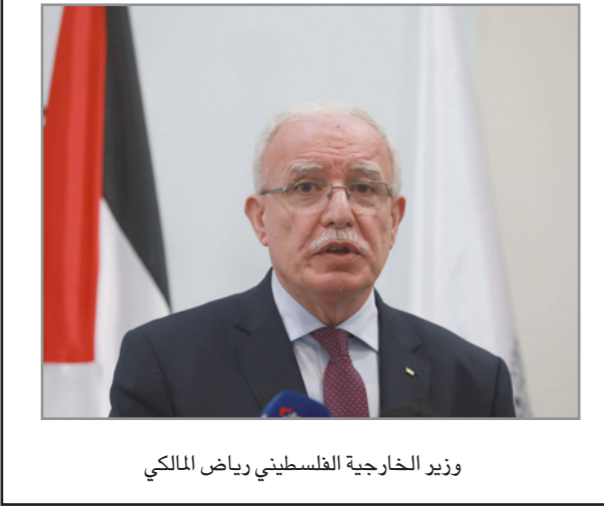
وزير الخارجية الفلسطيني رياض المالكي