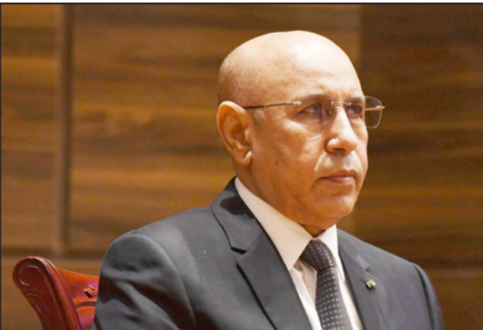
الرئيس الموريتاني محمد ولد الغزواني

وتابعت أن تسريبات من دائرة التحريات كشفت أن سبب الغصبية الملكية يعود إلى سوء تسيير ورش الطاقة الشمسية، نجم عنه تأخر في إنجاز مشاريع برمجة، ومناطل في أداء مستحقات شركاتها، ما أدى إلى إفلاس بعضها. وأضافت نقلا عن مصادرهما، وجود خروقات في برنامج «مسالك الطرق الجوية» الممول من قبل جهة البيضاء - سطات، والذي يترجم في إظهار التوجهات الملكية، الرامية إلى تمكين سكان المراكز القروية من استعمال مسالك مجيزة، لتسهيل عملية النقل في ظروف مقبولة ومراعية لكرامة المواطنين على مدار السنة.