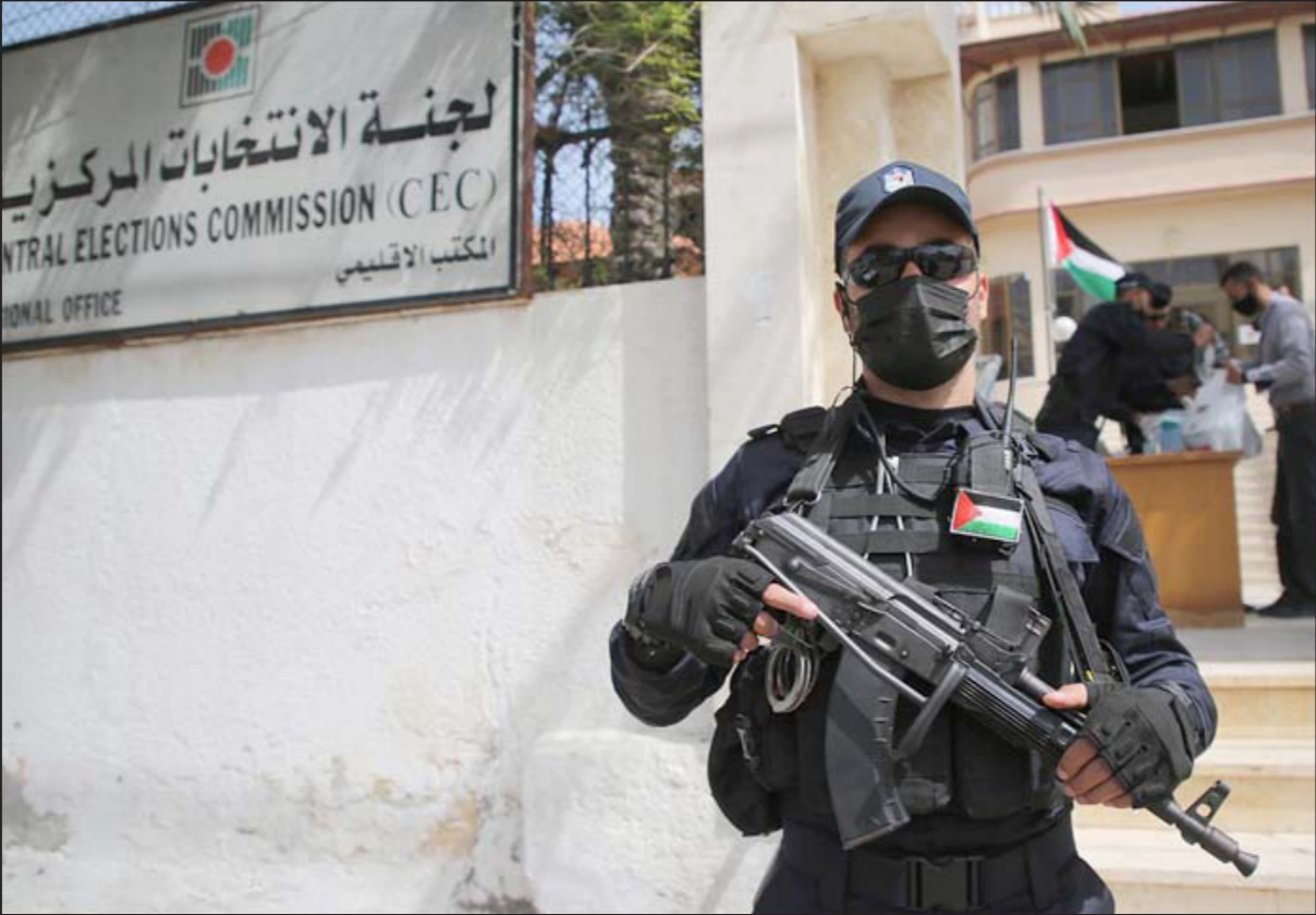
شرطي فلسطيني في حراسة لجنة الانتخابات المركزية

على تشييت العديد من الأصوات بين تلك القوائم وقتها على مقعدين. إلى ذلك، أقرت حركة فتح في اجتماع دام حتى ساعة متأخرة من ليل أول من أمس الثلاثاء، بعض الاستثناءات للترشح، وتحديدًا بعد إقرار قائمتها التي تشارك في الانتخابات البرلمانية، وإبلاغ من وقع عليهم الاختيار بذلك وتحديد أرقامهم في القائمة. وشملت الاستثناءات الموافقة على مشاركة خمسة من أعضاء من اللجنة المركزية لحركة فتح، وآخرين من المجلس الثوري، وعدد من المحافظين، بعد أن كانت الحركة قد أقرت في وقت سابق عدم ترشح أعضاء المركزية والثوري والوزراء، وأعيد من جديد ترتيب الأسماء على القائمة بعد هذا القرار.