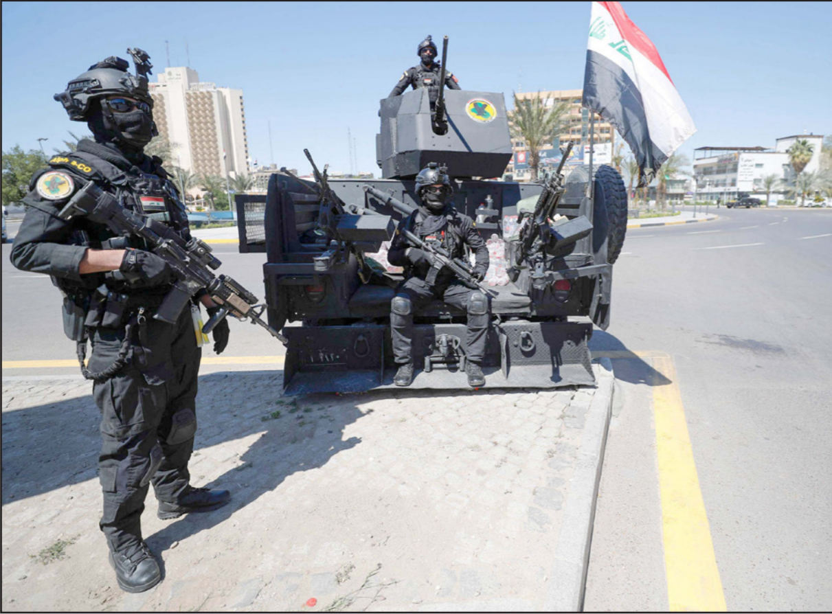
قوات أمن عراقية

مواجهة هجمات التنظيم المتطرف، وكشف اللواء يحيى رسول، الناطق باسم القائد العام للقوات المسلحة، عن قيام «التحالف الدولي» بتسليم مجموعة جديدة من أبراج المراقبة إلى القوات الأمنية العراقية. وذكر في «تدوينة» له، أن «في قاعدة عين الأسد الجوية (غرب العراق) القوات الأمنية العراقية تتسلم مجموعة جديدة من أبراج المراقبة من التحالف الدولي».