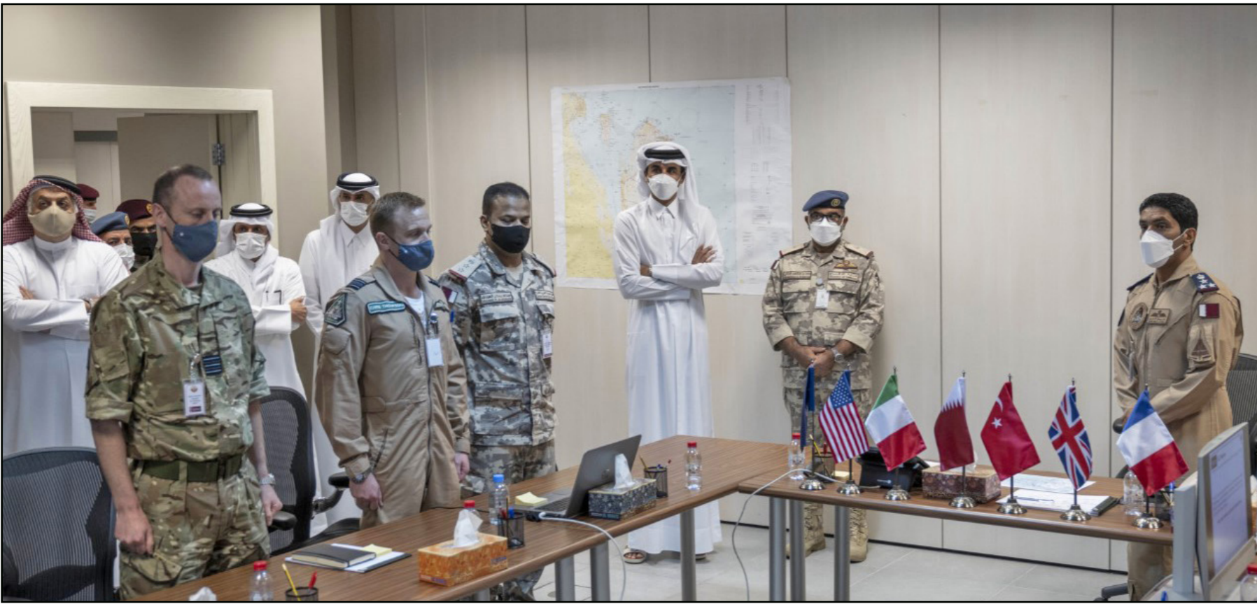
أمير قطر يتفقد مركز درع الوطن الأمني والاستعدادات لتأمين كأس العالم