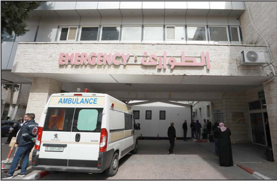
انخفاض طفيف في أعداد الوفيات بكورونا في المستشفيات الفلسطينية

وتوماس فريدمان، المحلل الكبير في صحيفة «نيويورك تايمز» اعتبر مؤخرا أن «هاتين الدولتين تقفان تحت الحوف من أمريكا، وفي هذه الأثناء، وكأنها تتناحرا بذلك، أعلنت الصين عن اتفاق استراتيجي لـ25 سنة مع إيران. وللتنكير، في موضوع كوريا الشمالية أيضا هناك فضل بتعاقلهم مع السياسة الأمريكية»، ومع ذلك، يقول شوفال إن إدارة بايدن واصلت بل شددت العقوبات تجاه الصين وروسيا، ضمن أمور أخرى بدعوى خرق حقوق الإنسان. لكن يبدو أن هذه الحجة لا تنطبق على إيران، إذ إن «موظف في الإدارة» أعلن أن أمريكا لن تصر بعد الآن على مطلب أن تتخذ طهران الخطوة الأولى في المفاوضات قبيل استئناف الاتفاق النووي ووافق هذه مسبقا على أن يتضمن مواضيع أخرى. ويتابع السفير الإسرائيلي الأسبق «إلى جانب الشخصيات المركزية في الإدارة والكونغرس المعروفين بتعاقبهم مع إسرائيل وبتفهمهم لاحتياجاتها الأمنية، بما في ذلك في الجانب الديمقراطي، توجد أيضا محافل، خاصة في وزارة الخارجية، تنظر بعين السوء إلى العلاقات الخاصة بين الولايات المتحدة وإسرائيل وتتخذ مواقف غير مريحة من ناحيتها في الموضوع الفلسطيني أيضا. وهناك ميول مناهضة لدولة الاحتلال، سواء في الموضوع الفلسطيني أم الإيراني، وجدت مؤخرا تعبيرا في مقال في «نيويورك تايمز» عكس النقد السلبي للجناح اليساري في الحزب الديمقراطي للسياسة الخارجية للرئيس بايندن حتى الآن وتضامن الطائفة بالاستئناف دون تحفظ للافتق النووي مع إيران وممارسة الضغوط على السعودية