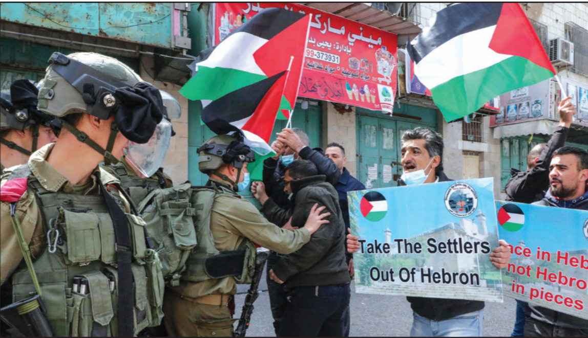
مواجهات بين متظاهرين فلسطينيين وقوات الاحتلال في مدينة الخليل

القائمة التي سيؤديها عدد مرشحين على 60 مرشحا. وأشار إلى أن اللجنة المركزية لفتح حددت بفصل أي من عناصرها ومسؤوليها مهما علا شأنهم، في حال ترشحوا بقوائم منفصلة أو وردت أسماؤهم في قوائم منفصلة، وكل من له صلة بالقوائم المنفصلة أو يعمل لخدمتها. وفي سياق ذي صلة كشفت قنصة «كان» العبرية مساء أمس الأربعاء عن تفاصيل جديدة حول اللقاء بين الرئيس محمود عباس ورئيس جهاز أمن الشاباك نضال أرغمان، مختلفة عما جاء في التسريبات الأولى. ووفق القنصة فإنه عندما هدد أرغمان أسماؤهم في قوائم منفصلة، وكل من له صلة بالقوائم المنفصلة أو يعمل لخدمتها. وفي سياق ذي صلة كشفت قنصة «كان»