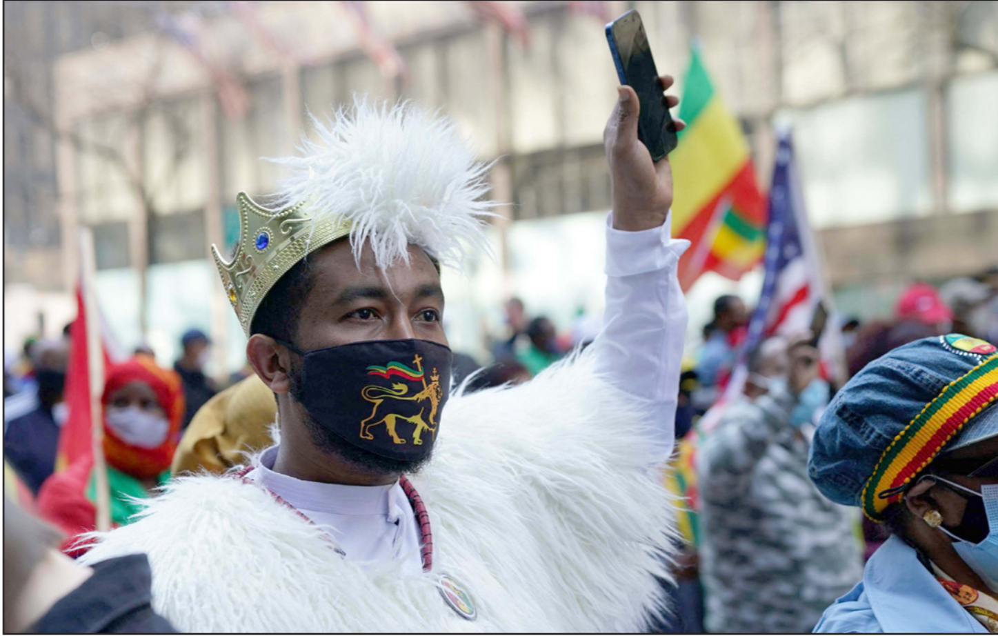
إثيوبي يشارك في تظاهرة داعمة لبناء سد النهضة في نيويورك

وحرس الإمارات على استمرار الحوار الدبلوماسي البناء والمفاوضات المتفرجة لتجاوز أية خلافات حول سد النهضة بين مصر وإثيوبيا والسودان. كما شددت الإمارات على «أهمية العمل من خلال القوانين والمعايير الدولية للوصول إلى حل يقبله الجميع، ويؤمن الحقوق المائية للسودان الثلاث، بما يحقق الأمن والاستقرار والتنمية المستدامة والتعاون بين جميع دول المنطقة»، وأيضا أكدت منظمة التعاون الإسلامي، التي تضم في عضويتها 57 دولة مسلمة، ضرورة الحفاظ على الأمن المائي لمصر والسودان. وقالت منظمة التعاون الإسلامي التي تتخذ من جدة غرب السعودية مقرا لها في بيان لها الأربعاء إنها «تتابع باهتمام بالغ الجهود الإقليمية والدولية المبذولة لإيجاد حل لسلسلة سد النهضة الإثيوبي».