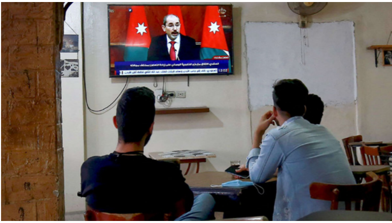
الأردنيون عبروا عن صدمتهم وكآوا وقلقهم خلف ملكهم

عبد الله الثاني بن الحسين، ودعمها الثابت لكل من شأنه ضمان أمن الأردن الشقيق وسيادته واستقراره».