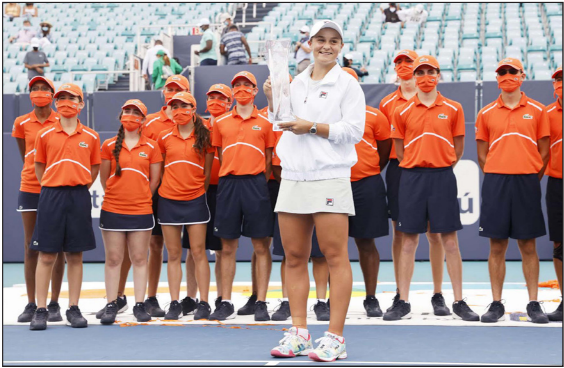
بارتي ترفع لقب دورة ميامي بعد انسحاب أندرييسكو للإصابة

■ عواصم - أ ف ب: لحق الأهلي المصري حامل اللقب بركب المتأهلين في ربع نهائي دوري أبطال أفريقيا، بتعادل شناق مع مضيعة المريخ السوداني 2-2، فيما انعش وصيفه ومواطنه الزمالك حظوظه بحسم "الدوري العربي" أمام مولودية الجزائر 2-صفر، في الجولة الخامسة قبل الأخيرة من دور المجموعات. وأجبا الزمالك أماله بتغلبه على مضيعة مولودية الجزائر 2-صفر ضمن المجموعة الرابعة، ودخل المولودية اللقاء وهو يحتاج إلى تعادل على الأقل ليضمن وجوده في دور الثمانية، بينما لم يكن أمام الفريق المصري بديلاً عن الفوز، وافتتح شمس الدين حراق فرص اللقاء عندما سدد كرة قوية من ركلة حرة انقذها الحارس محمد جنش (5)، وقاد المرشد المتألق فرجاني ساسي ومرر إلى الهدف الثاني على الجهة اليسرى فاقدم منقطة جزاء الخصم ومرر كرة عرضية تابعها "أوباما" في الشباك المتسربة (6)، وعزز "شكيبابا" تقدم "القلعة البيضاء" بعدما تلقى كرة من ساسي وسقط بين مدافعيه وسدد كرة زاغفة إلى بين الحارس فريد شعل (34)، وفي المجموعة عينها، تلقى المضيعة التونسي المتوج أربع مرات، هزيمة الأولى أمام مضيعة تونيزيا 2-1 مفاجأة مدوية في دكا، وهذا الفوز الأول في تاريخ توغيتش في البطولة، وبقي الزمالك ثالثاً بخمس نقاط، خلف الترجي المتصدر بعشر نقاط والمولودية الذي تجمد رصيده عند