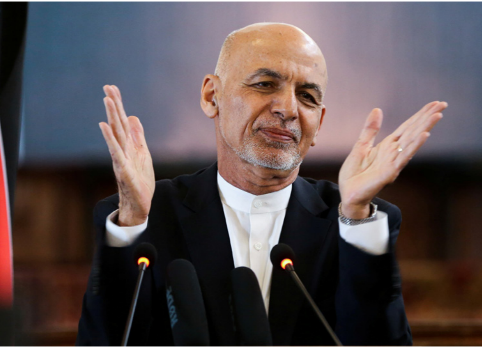
الرئيس الأفغاني أشرف غني

الإرهاب. وسبق أن قال وزير الخارجية الأفغاني، حنيف أتمار، الأسبوع الماضي، خلال مؤتمر صحفي عقده في العاصمة الهندية نيودلهي، إن الحكومة مستعدة للدعوة إلى انتخابات مبكرة من أجل عملية السلام. وأوضح أن الانتخابات يمكن إجراؤها في حضور مراقبين دوليين. وشدد على أن طالبان سيتبعن عليها قبول الانتخابات كوسيلة مشروعة لانتقال السلطة والتوصل إلى تسوية سياسية. ونكرت صحيفة «إطلاعات روز» المحلية البومية، أن من المرجح أن يطرح غني فكرة إجراء انتخابات مبكرة خلال مؤتمر إسطنبول» للسلام المزمع عقده في أبريل/نيسان الجاري، وهو جزء من الجهود الدولية الرامية لتسريع عملية السلام المتوقفة. وقال الرئيس الأمريكي جو بايدن، هذا الشهر، إنه سيكون «من الصعب» سحب كل القوات الأمريكية الباقية في أفغانستان بحلول الأول من مايو/أيار «لأسباب تكتيكية فقط، لكنه قال إنه لا يتصور بقاءها هناك حتى العام المقبل. كما أشار مسؤول حكومي كبير إن طالبان على استعداد لتسديد الموعد النهائي ولن تستأنف الهجمات على القوات الأجنبية مقابل الإفراج عن آلاف من أسراها لدى سلطات كابول. لكن محمد نعيم، وهو متحدت باسم طالبان في قطر، قال إن الحركة لم تطرح مثل هذا العرض.