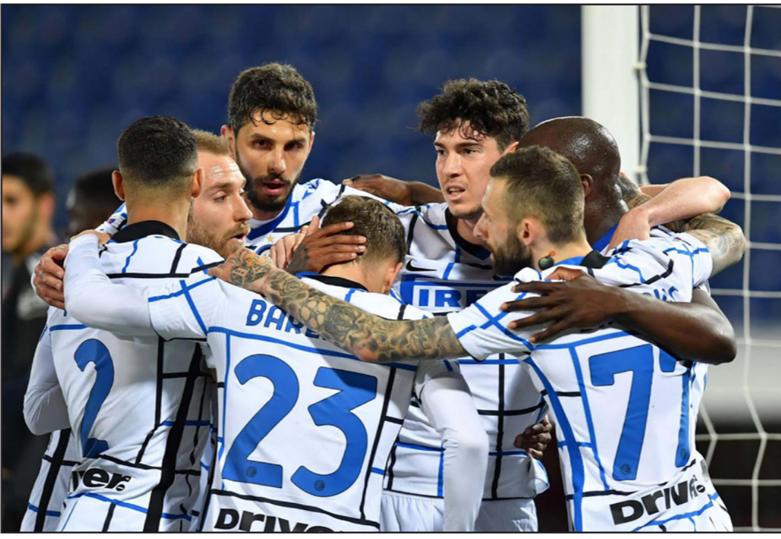
لاعبو الإنتر يحتفلون بانتصار جديد يقرب الفريق إلى لقب الدوري الإيطالي

بيرييرا (45) وسترايغر لاسرن (71)، فيما خرج نابولي منتصرًا من مواجهة صعبة مع كروتوني بصعوبة 4-3 وارفتي رابعًا، وضيق أتلانتا الثالث برصيد 58 نقطة، ونابولي الرابع وله مباراة مؤجلة أمام يوفنتوس في الأربعاء مع 56، الخناق على ميلان الثاني مع 60 نقطة، وحقق أتالانتا فوزه السابع في آخر ثماني مباريات له، بفضل ثلاثية كولومبية من لويس موريل (19، 43)، ودوفان زاباتا (61)، فيما أحرز هدفه أودينيزي روبرتو