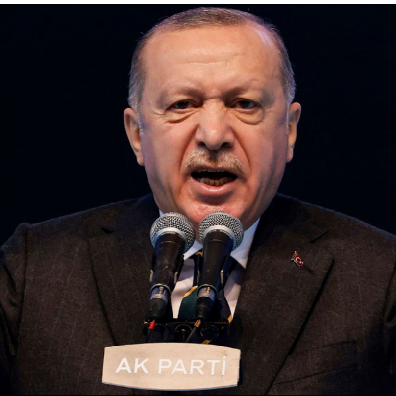
رجب طيب أردوغان

رجب طيب أردوغان. وفيما يتعلق باتفاقية مونترو، جاء في بيان وزارة الدفاع التركية: «القوات المسلحة تتمتع بالخبرة والإدراك إزاء مكاسب وخسائر الاتفاقيات الدولية، ولا يمكن استخدامها كأداة لتحقيق الغايات والأطماع والأمال الشخصية لمن ليس لديهم أي مهمة أو مسؤولية» مضيفة: «يعمل الجيش التركي بنجاح على حماية سيادتنا واستقلالنا ووجودنا وكذلك حقوقنا