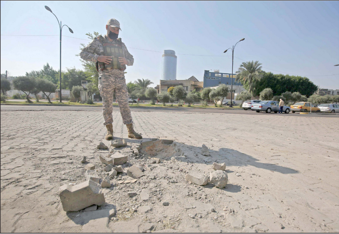
أرشيفية لجندي عراقي يتفقد آثار صاروخ سقط في المنطقة الخضراء

عن أنفه عندما كان عددهم يزيد عن 150 ألف جندي مقاتل، وكانت قواعدهم ومعسكراتهم منتشرة في كل أرض العراق، نحن الآن ندعم أبناء شعبنا قاربون وأكثر قدرة وإمكانية على إخراج المحتل»، على إثر ذلك، أكد التحالف الدولي - بقيادة واشنطن، أول أمس، احترام السيادة العراقية. وقال المتحدث الرسمي لقوة المهام المشتركة في التحالف الدولي العقيد واين موراثو، وفقا للوكالة الحكومية، إن «قوة المهام المشتركة في العراق تتواجد بدعوة من الحكومة العراقية وتعمل بالتنسيق وثيق معها مع الاحترام الكامل لسيادة العراق».