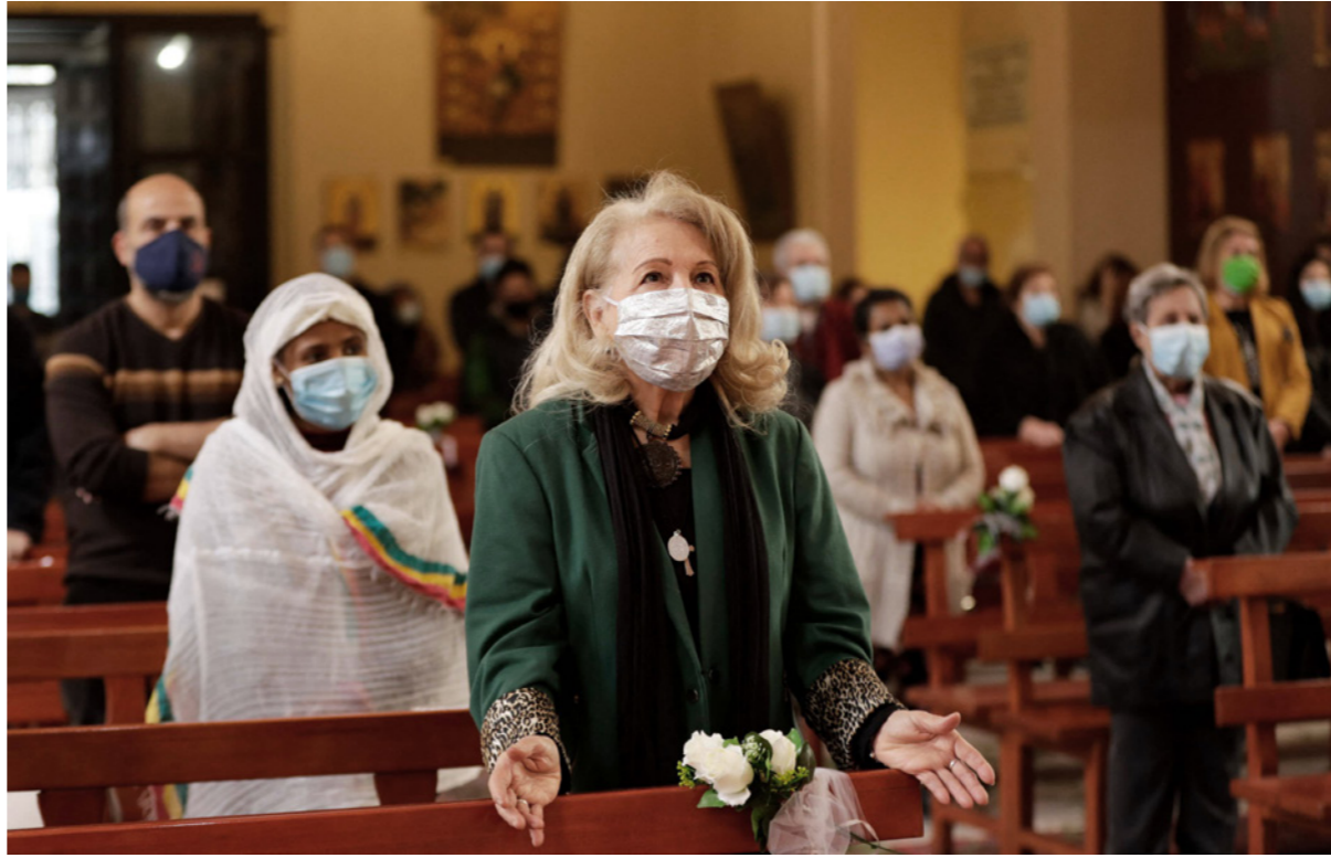
احتفل اللبنانيون أمس بعيد الفصح الغربي وسط تفشي الوباء وأزمة اقتصادية خانقة

■ بيروت – الأناضول: حذر البطريرك الماروني بشارة بطرس الراعي، مساء السبت، من تغيير نظام الحكم في لبنان، مؤكداً حاجة البلاد إلى حكومة غير حزبية، جاء ذلك في كلمة القاها الراعي في الصرح البطريركي، في العاصمة بيروت، بمناسبة عيد الفصح الذي يوافق 4 أبريل / نيسان الجاري.