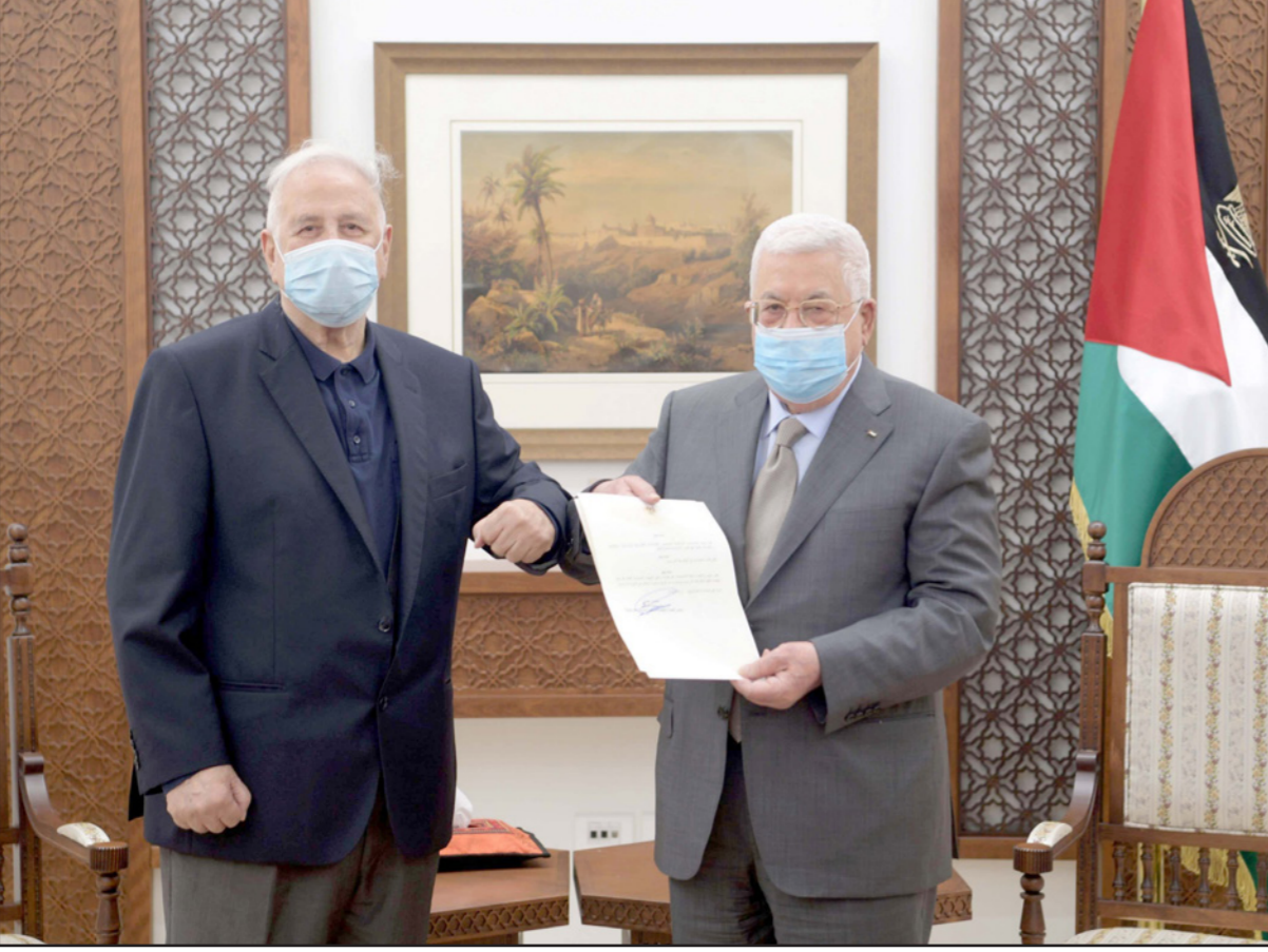
الرئيس عباس يستقبل رئيس لجنة الانتخابات المركزية الفلسطينية

عن تأييد المشاركين ترشح فتح وحماس في قائمة انتخابية موحدة، فقد أعرب 49% من المستطلعين عن تأييدهم لمثل هذه القائمة، وكان هناك فرق ملحوظ بالتأييد بين غزة (34%) والضفة (59%). ويوجب الرسوم الرئاسية ستجري الانتخابات التشريعية بتاريخ 22 مايو/ أيار المقبل، والرئاسية بتاريخ 31 يوليو/ تموز المقبل، على أن تعتبر نتائج انتخابات المجلس التشريعي المرحلة الأولى في تشكيل المجلس الوطني الفلسطيني. وأكد المرسوم أنه سيتم استكمال المجلس الوطني في 31 أغسطس/ آب المقبل وفق النظام الأساسي لمنظمة التحرير الفلسطينية والقوانين الوطنية، بحيث تجرى انتخابات المجلس الوطني حينها.