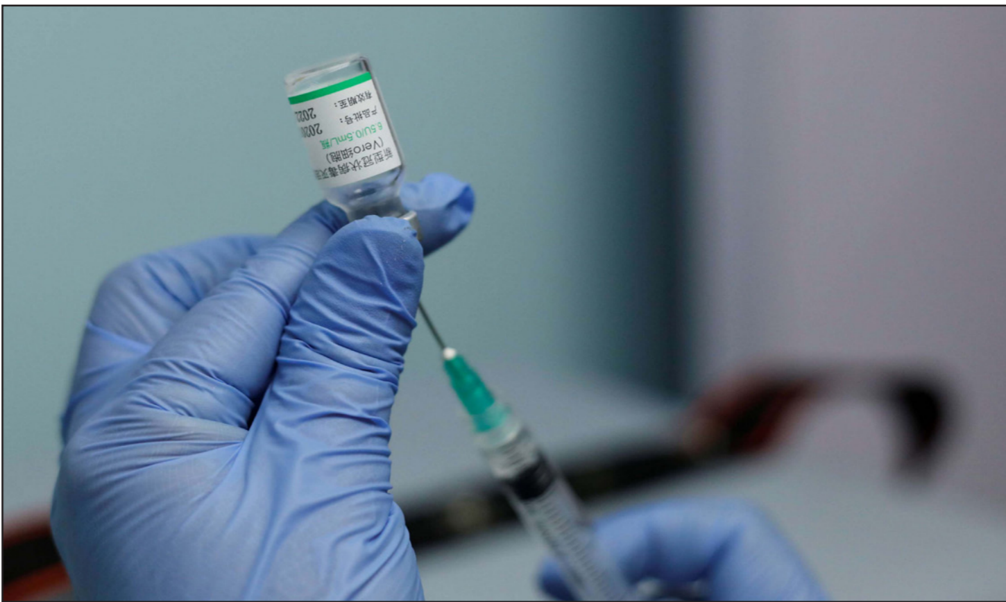
لقاح «سينوفارم» الصيني

ويبلغ عدد الحالات الخطيرة أو الحرجة الجديدة بأقسام الإنعاش والعناية المركزة المسجلة خلال 24 ساعة، ليصل العدد الإجمالي لهذه الحالات إلى 419 حالة. أما معدل ملء أسرة الإنعاش المخصصة لـ(كوفيد-19) فقد بلغ 13,3 في المئة.