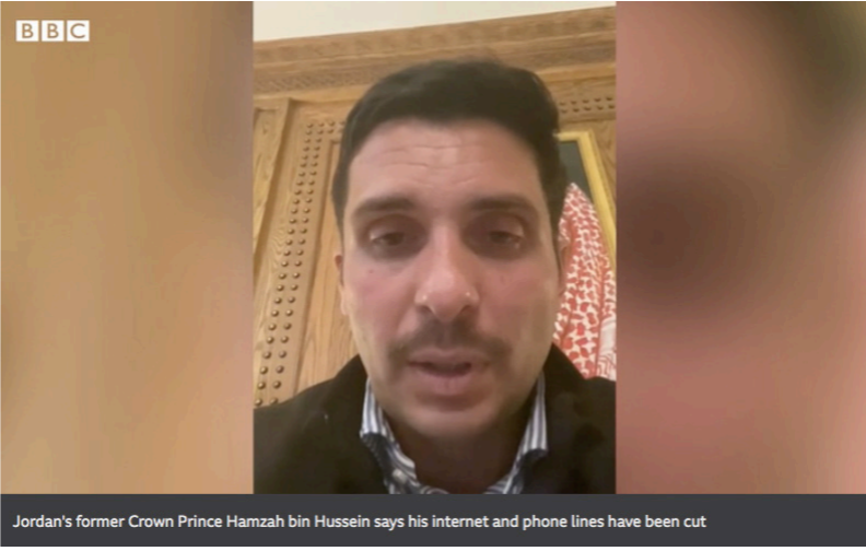
صورة ضوئية للفيديو الذي وزعته قناة «بي بي سي» البريطانية للأمير حمزة يشرح فيه ظروف إيقاظه تحت الإقامة الجبرية