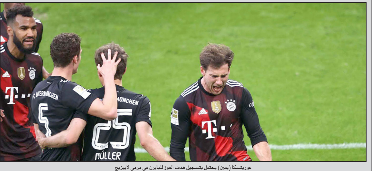
غوريتسكا (يمين) يحتفل بتسجيل هدف الفوز للبائرن في مرعى لايزيغ

■ برلين - أ ف ب: سحب بايرن ميونخ بساط المنافسة من تحت أقدام لايزيغ وضيفه منافسه على صدارة الدوري الألماني عندما تغلب عليه بهدف في المرحلة السابعة والعشرين، في حين سقط بوروسيا دورتموند أيضًا على أرضه أمام إنترراخت فرانكفورت 2-1. وخطا البائرن خطوة كبيرة في طريقه للاحتفاظ بلقبه للموسم التاسع تواليًا بهدف ليون غوريتسكا في الدقيقة 38، ليبتعد بالصدارة بـ6 نقطة، بفارق 7 نقاط عن لايزيغ الثاني، ويعد الفوز تحضيرًا ممتازًا للمواجهة المرتقبة بين العملاق البايفاري وباريس سان جيرمان في ربع نهائي دوري الأبطال، ونجح البائرن في تسجيل هدف