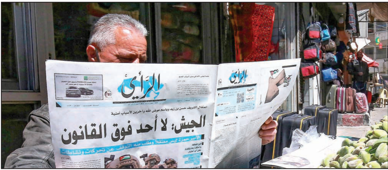
بائع خضروات في العاصمة الأردنية عمان يقرأ صحيفة «الراي» الرسمية التي تصدرها عنوان «الجيش: لا أحد فوق القانون»

عبر النصات وبعض وسائل الإعلام معلومات غير رسمية بعد عن «ضابط موساد إسرائيلي» تواصل مع عوض الله وزوجة الأمير، الأمر الذي لم يصدر في أي تصريح رسمي قطعي حتى الآن. وقد تردت أنباء عن المزيد من الاعتقالات، ومن بينها جنرال سابق كان الملك عبد الله الثاني قد انتدبه علنا مع مجموعة «تسغين» لوظائفهم، في الوقت الذي يتوقع فيه أن تكشف تحقيقات ما بعد الاعتقالات السبب المزيد من أسرار «تغذية» المعارضة الخارجية اليومية بالمعلومات والدساتير، وأجابتا بالوثائق، حيث تتحدث مصادر خاصة لـ «القدس العربي» عن عملية أمنية مشتركة مستمرة ويختلها تنظيف بيروقراطي غير مسبق، والكشف عن المزيد من الأنفاس.