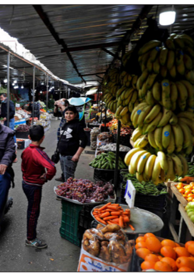
سوق خضار وفواكه في طرابلس شبه خال من المتسوقين بسبب غلاء الأسعار لأنها غير مدعومة

يأتي التقرير بينما أكدت وكالة التصنيفات الائتمانية «ستاندرد