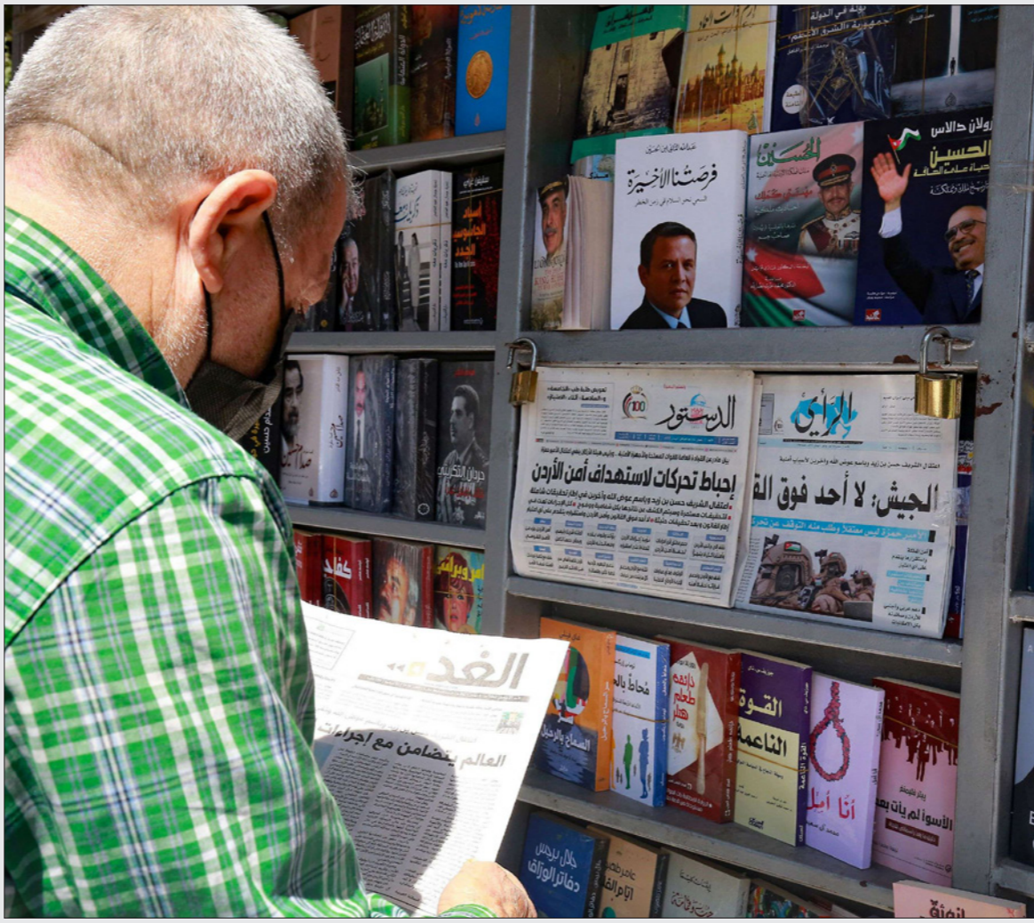
أردني يتابع الصحف المحلية التي عنونت على صفحاتها الأولى عن الأحداث الأخيرة في البلاد

الكشف عن هويته، أنه لم تكن هناك محاولة انقلابية، وأن الإعلام بالغ في الحديث عن مخططات الوضع. واعتزفوا في الوقت نفسه باعتقالات.