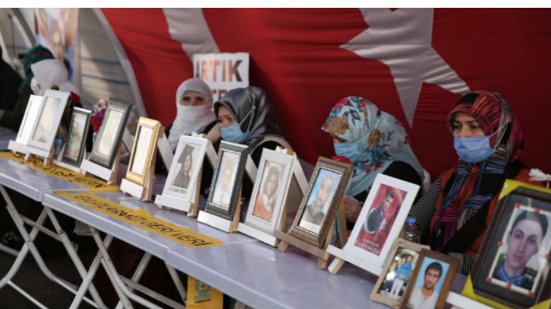
أمهات «ديار بكر» يعرضن لاسترداد أبنائهن

بطريقة غير نظامية، وأفيد أن قوات الأمن التركية، أوقفت سيارة على الطريق السريع في الولاية يقودها «بي كا كا» سوري الجنسية برفقته 5 أشخاص بينهم امرأة. وأضاف أن الأشخاص الـ 5 يحملون الجنسية السورية أيضاً، ودخلوا البلاد بصورة غير نظامية وأنهم دفعوا مبلغ ألف دولار عن كل شخص نظمي عملية التهريب. وأشار إلى اعتقال سائق السيارة واحتجاز مركبته، فيما تم نقل الخمسة إلى مديرية الهجرة في الولاية للقيام بالإجراءات اللازمة بحقهم.