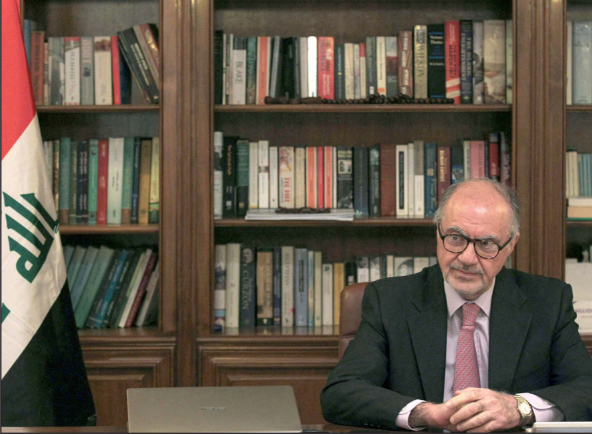
وزير المالية العراقي علي علاوي

بما يقارب 90 مليار دينار وضعت في الموازنة للوقف السنوي لتسوية النزاعات العشائرية بين المناطق التي تم تدميرها من قبل داعش». وأثار مقترح وزير المالية موجة من ردود الأفعال السياسية الراقصة، من بينها ما صرحت به النائب عن «ائتلاف دولة القانون»، عالية، نصيف.