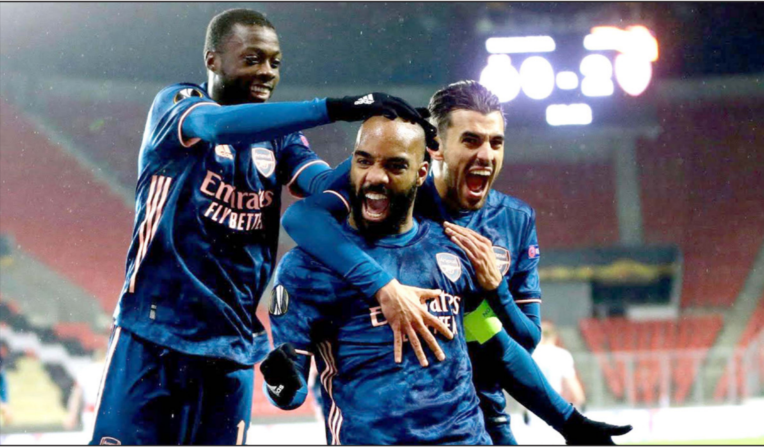
لاعب أرسنال يحتفلون بتسجيل الهدف الرابع في مرمى سلافيا براغ

عاصم - أ ف ب: ضرب مانشستر يونايتد وروما موعداً في نصف نهائي الدوري الأوروبي، بعدما تخليا عقبة ربع النهائي، فبيما يلتقي في نصف النهائي الآخر فياريال ومدريه أوناي إييري مع فريقه السابق أرسنال، ويلعب يونايتد نصف النهائي بعدما جدد فوزه على غرناطة 2-0 صفر أياها، ليبقى على أماله بتحقيق لقب أول منذ 2017 حين توج بطلا لهذه المسابقة بالذات، وسجل الأوروغواياني اديسون كافاني (6) وخبوسوس فايبوخو (4+90) خطاً في مرماه هدي أصحاب الأرض. وكان يونايتد فزاً فاز 2-0 صفر في الاندلس ليتهي المغامرة القارية الأولى على الإطلاق لغرناطة، وضمن يونايتد عودته إلى حد كبير لدوري الأبطال الموسم المقبل من خلال مركزه الثاني في الدوري خلف جاره مانشستر سيتي، لكن الفوز بـ"يوروبا ليغ" سيمنحه فرصة تجنب إنهاء الموسم خالي الوفاض بما أن مشواره في الكأس الانكليزية انتهى عند ربع النهائي على يد ليدستر، ودخل "الشياطين الحمر" اللقاء بمعنويات عالية بعد فوزه على توتنهام 3-1 في النوري الاحد المنصرم، وخاض اللقاء بفغياب الثلاثي هاري ماغوير ولوك شو وسكوت ماکتوميني بسبب الإيقاف، ولو حظ تغيير لسون اليطالطة الموضوع على مقاعد ملعب "أولد ترافورد"، من اللون الاحمر الى الاسود بعدما قال المدرب اولي غونار سولشاير ان اللاعبين كانوا يعانون لرؤية زملائهم بسبب تداول لون القميص الاحمر مع الخلفية، إضافة الى أنها تزامنت مع الحملة ضد العنصرية. وعبر روما، آخر سفراء إيطاليا في البطولات الأوروبية، إلى نصف النهائي بعد تعادله 1-1 مع ضيفه أياكس بعدما حقق انتصاراً ذهاباً 2-1 في هولندا، وتقدم أياكس عن طريق براين بروبي (49)، قبل ان يدرك إيدن ديجكو التعادل لروما في الدقيقة 72، وفي ظل معاناته محلياً حيث يحتل روما المركز السابع بفارق