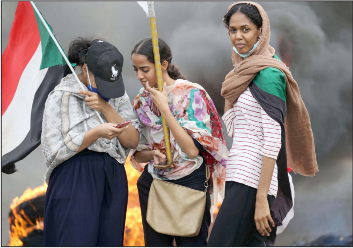
أرشيفية لسودانيات يتظاهرن في الخرطوم