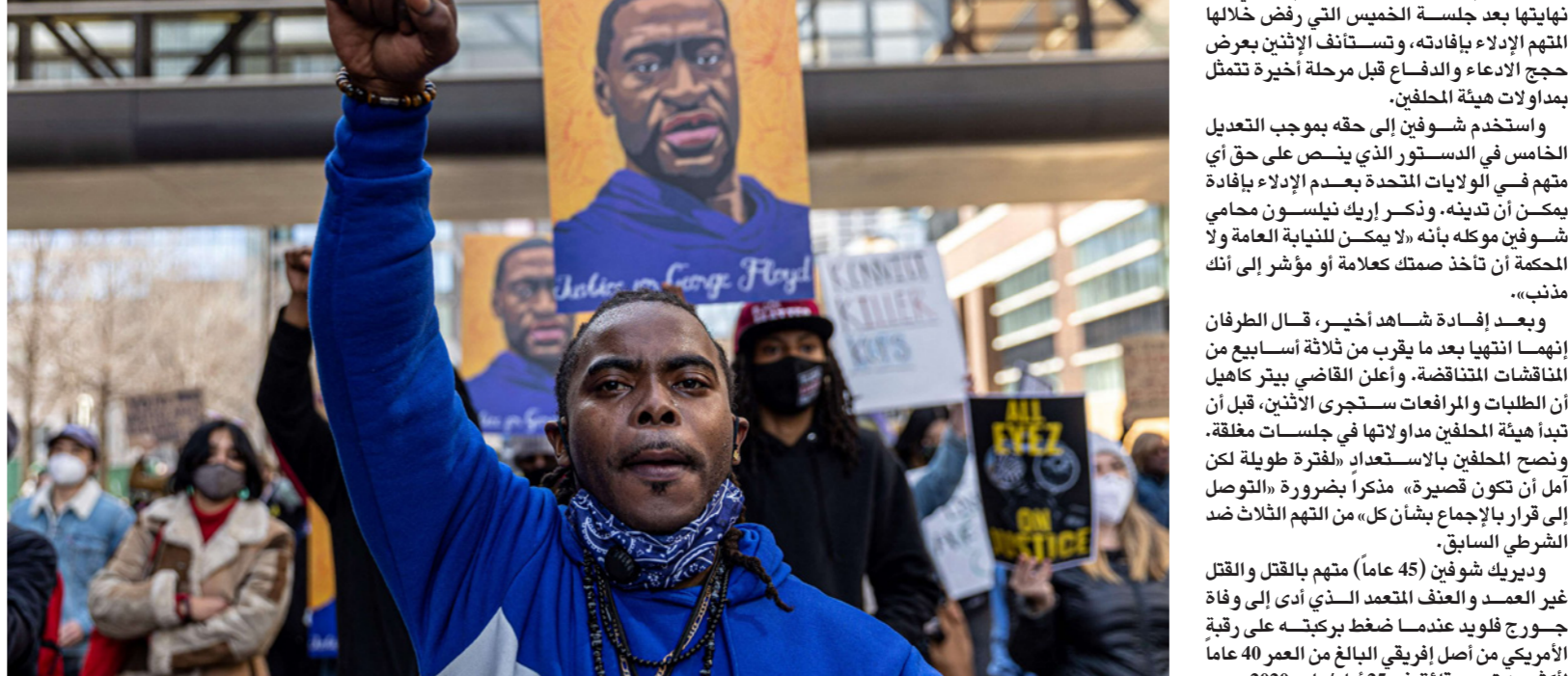
متظاهرون يحملون لافتات تكريماً لفلويد وضحايا العنصرية الآخرين في منيابوليس