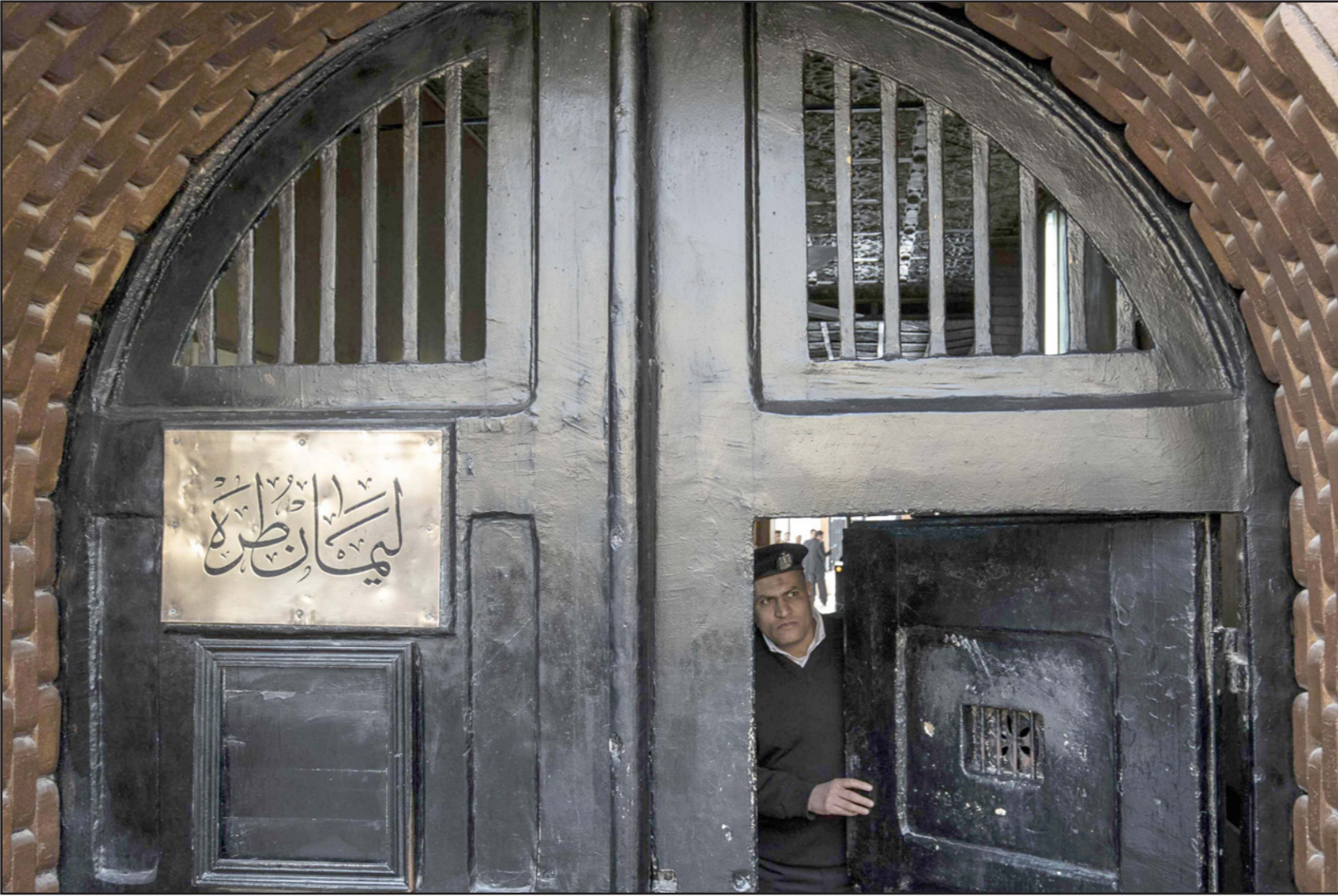
رجل أمن عند بوابة سجن طره في القاهرة