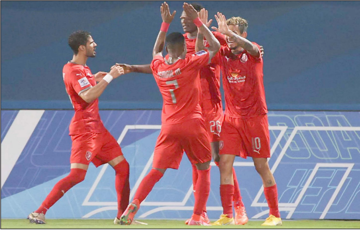
لاعبو الدحيل القطري يحتفلون بتسجيل الهدف الأول في مرمى الشرطة العراقي