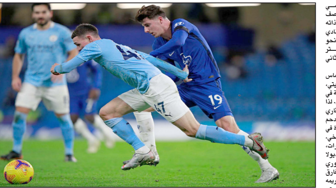
صراع السيتي وتشلسي يتجدد اليوم في نصف نهائي كأس إنكلترا

لندن - أ ف ب: يلتقي تشلسي ومانشستر سيتي، ممثلاً إنكلترا في نصف نهائي دوري أبطال أوروبا، في الدور ذاته للكأس المحلية اليوم حيث يأمل النادي اللندني بإفساد مسعى منافسه نحو رباعية تاريخية، في حين يلتقي ليدستر وساوثهامبتون في نصف النهائي الثاني امام حضور جماهيري. ويمك تشلسي بقيادة مديره توماس توشيل فرصتين لتعكير طموح السيتي، إحداها قائمة اليوم والثانية محتملة في حال بلوغهما نهائي دوري الأبطال. لذا قد تشكل المباراة "بروفة" لنهاية قاري محتمل بينهما، ورغم جدولهما المزدحم حيث يخوض كل منهما 12 مباراة في ستة أسابيع، إلا أنه ما من وقت للتراخي، ويسير السيتي بطل المسابقة ست مرات، آخرها عام 2019، يشارف بيب غوارديولا بحسبى ثابتة نحو لقب ثالث في الدوري في أربعة مواسم في ظل ابتعاده بفارق 11 نقطة في الصدارة عن جواره وغريمه يونائيد، وستكون الفرصة سانحة للسيتي لرفع أولى كؤوسه هذا الموسم عندما يلتقي توتنهام في نهائي كأس الابطال الذي لازمه في دوري الابطال منذ وصوله الى السيتي عام 2016 حيث نجح في تحفي عقبة ربع النهائي للمرة الاولى، إلا ان المهمة لن تكون سهلة أمام تشلسي الذي أعاد بناء صفوفه بعد تعيين توشيل في كانون الثاني/يناير الفائت خلفاً لفرايز لاملبارد، ومنى "البلوز" بخسارتين فقط في 18 مباراة تحت إشراف توشيل في جميع المبارقات، أو لنها مفاجئة