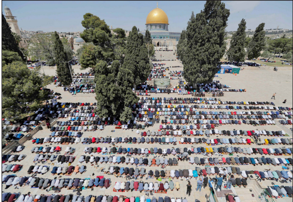
الآلاف يؤدون صلاة الجمعة في الأقصى رغم اعتداءات الاحتلال