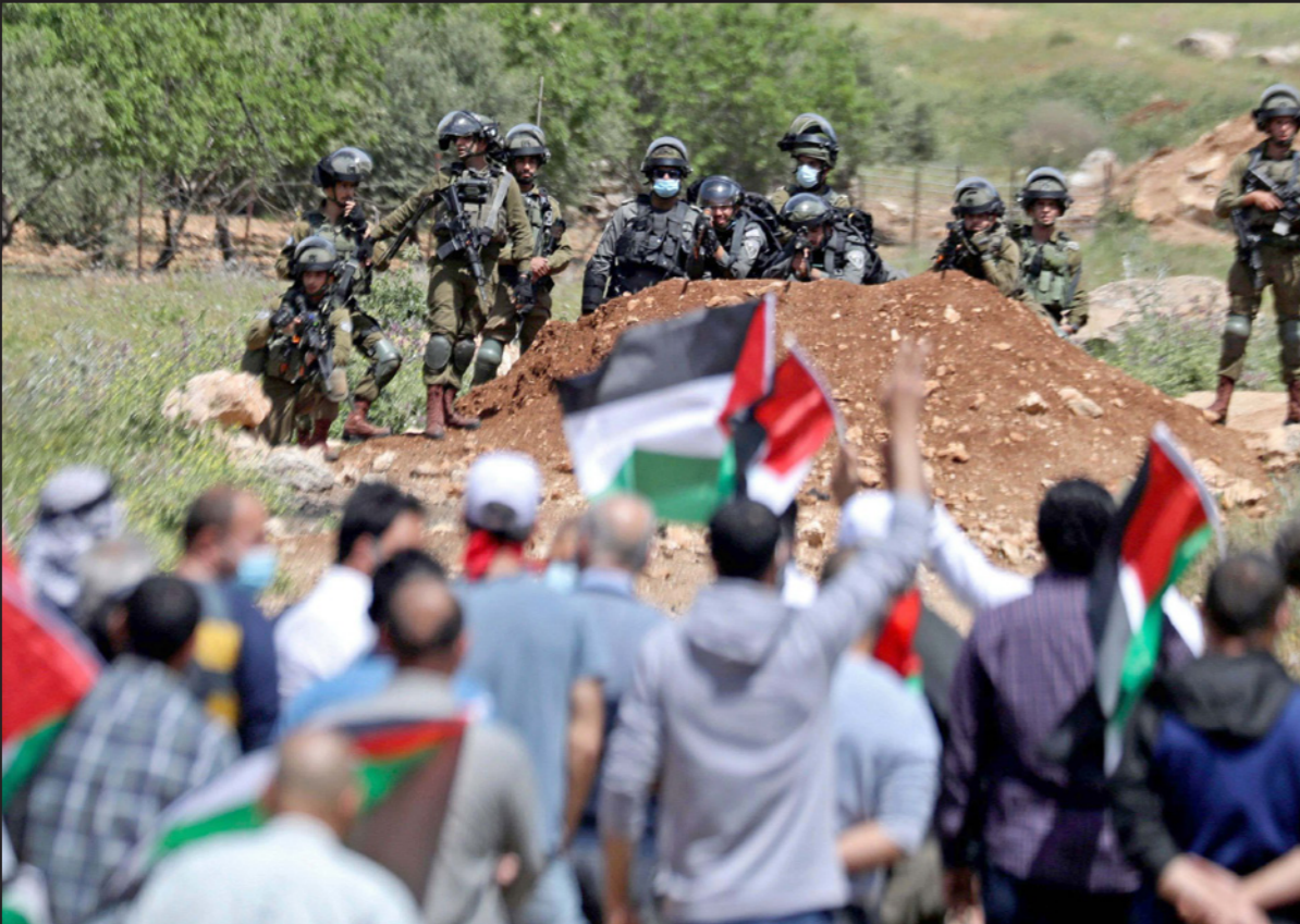
مواجهات في بيت دجن في منطقة نابلس