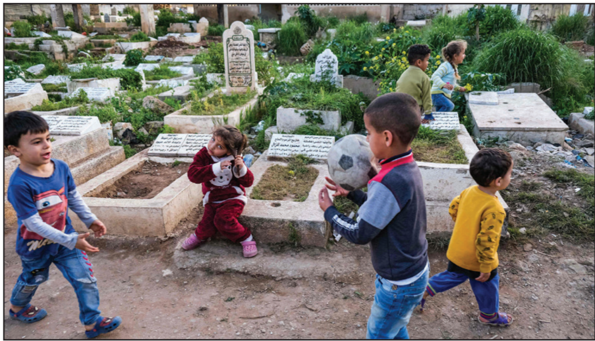
أطفال يلعبون في مقبرة الغرباء في مدينة طرابلس شمال لبنان أمس

القمامة بحثاً عن الطعام، ومن شأن خطة حزب الله أن تساعد على حماية مجتمعاته واحتواء أي اضطراب في قاعدة حزب الله الأساسية، وفيما لم يرد من حزب الله على طلب التعليق، قال أحد المصادر وهو مسؤول كبير إن الاستعدادات بدأت للمرحلة المقبلة... إنها بالفعل خطة معركة اقتصادية، وأضاف أن حزب الله يسعى لإيجاد