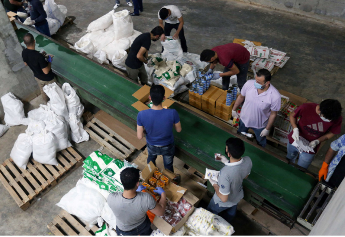
متطوعون، في بيروت، يعلبون مواد غذائية لتوزيعها على العائلات الأشد فقراً خلال شهر رمضان

الغني إلى فقير والفقير إلى معدوم... وأضاف، لذلك، يقدم صندوق الزكاة مختلف العطاء للمحتاجين ومن ضمنها زكاة الفطر التي ارتفعت إلى 20 ألفاً فديراً، أو ما يعادل 2.5 كيلو ونصف الكيلو من الفصح، وقال أيضاً «الكفارة وصلت إلى 22 ألف ليرة، وهي فدية الفطر بعذر والذي لا يمكنه أن يصوم، لذلك أصدرت دائرة الفتوى أن يدفع المبلغ للمحتاجين..»