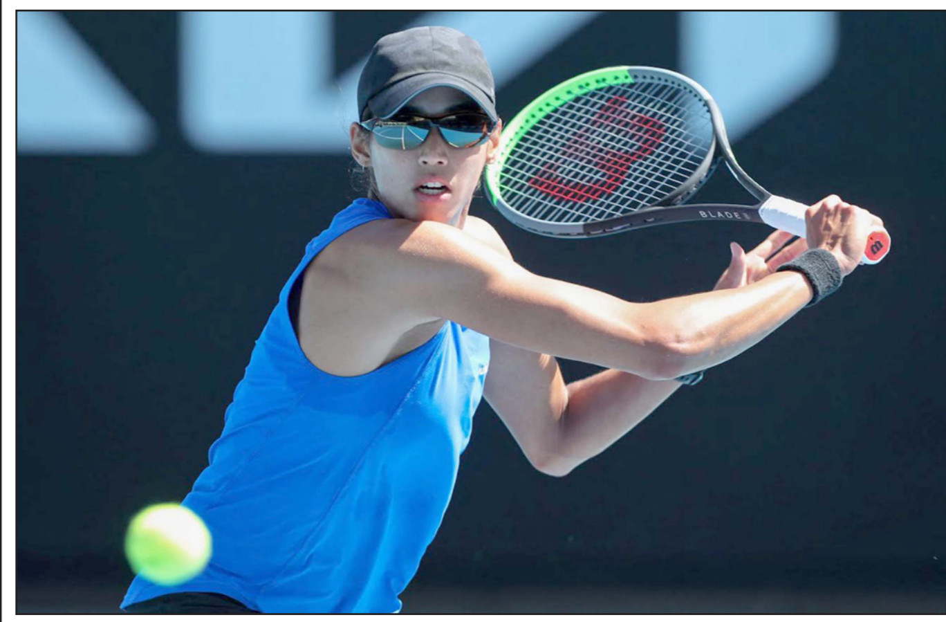
الاسترالية شارما تفوقت على التونسية أنس جابر في المباراة النهائية