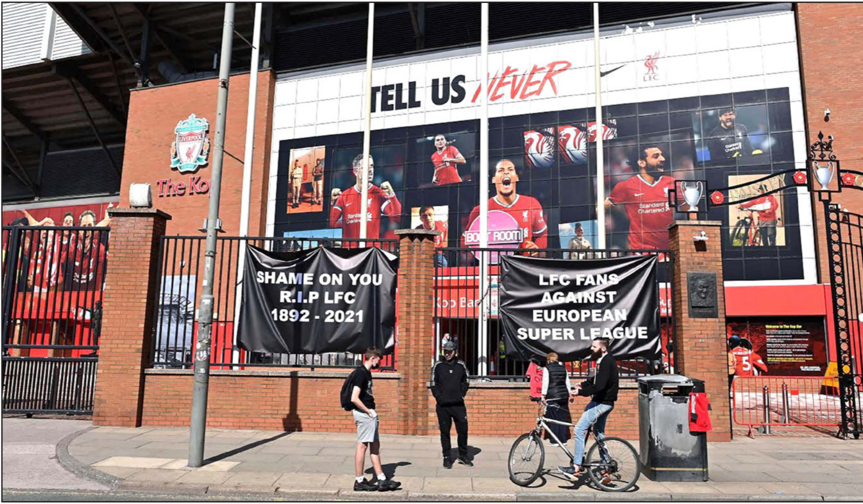
«العار عليكم» لافتات وضعت خارج أسوار نادي ليفربول من مشجعي النادي صباح أمس