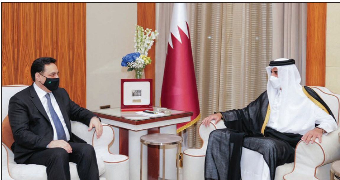
استقبل الشيخ تميم بن حمد آل ثاني أمير قطر الدكتور حسان دياب رئيس حكومة تصريف الأعمال اللبنانية، في مكتبه في قصر البحر، وجدد وقوف بلاده مع لبنان، ودعم الشعب اللبناني، داعياً في الوقت نفسه الفراق إلى الإسراع بتشكيل الحكومة

وصلت حالة التفكك والصراع في لبنان إلى ساحة القضاء، بين شارع مؤيد للقاضي المتزودة غادة عون المحسوبة على رئيس الجمهورية والتيار الوطني الحر، وشارع آخر مؤيد للمدعي العام التمييزي القاضي غسان عويدات القريب من «تيار المستقبل». حيث خيم التوتر في محيط قصر العدل في بيروت بالترامع مع اجتماع مجلس القضاء الأعلى بحضور كامل أعضائه الذي نظرا في مخالفة القاضي عون قرار عويدات بفتح نظر عن عدد من الملفات الهامة، ولا سيما المالية وقيامها بعملية دهم وخلق وعكس في مكاتب «شركة مكتف للصيرفة» بموازرة من مناصري التيار العوني بحثا عما تشبته به بوجود ملفات فساد وتهريب دولارات.