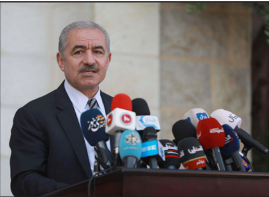
رئيس الوزراء الفلسطيني محمد اشتية

في مدينة القدس، وفق ذات الآليات التي جرت فيها انتخابات 1996 و2005 و2006، وأكد ما يمكن لإنجاح العملية الديمقراطية والانتخابات.