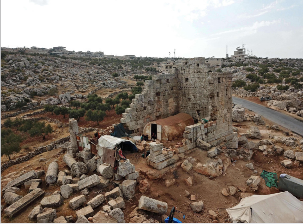
عائلة سورية نازحة تحتمي بين الآثار البيزنطية في منطقة باقرا الحربية من الحدود التركية

تستمر المراقبة وعملية جمع المعطيات حتى في شهر شباط من العام