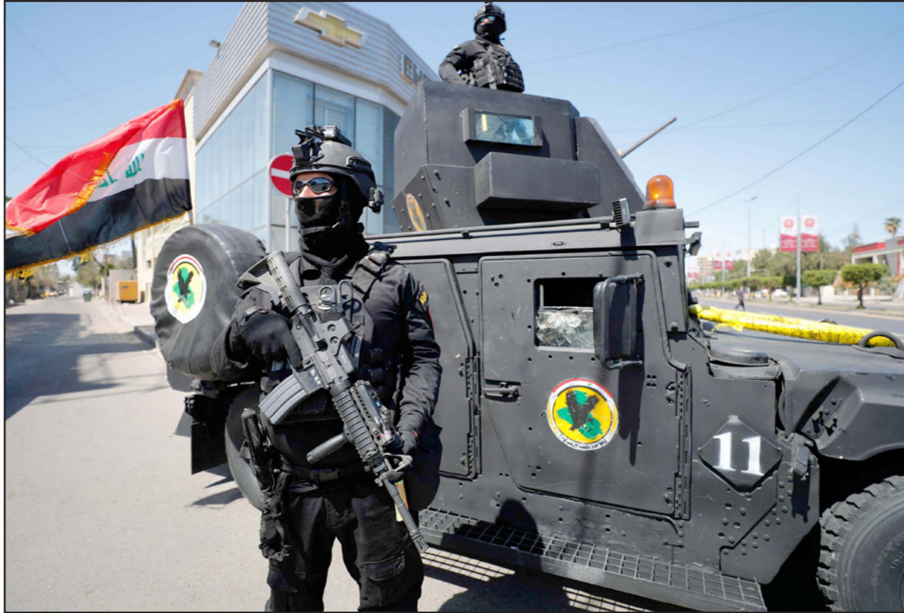
عناصر من مكافحة الإرهاب في بغداد