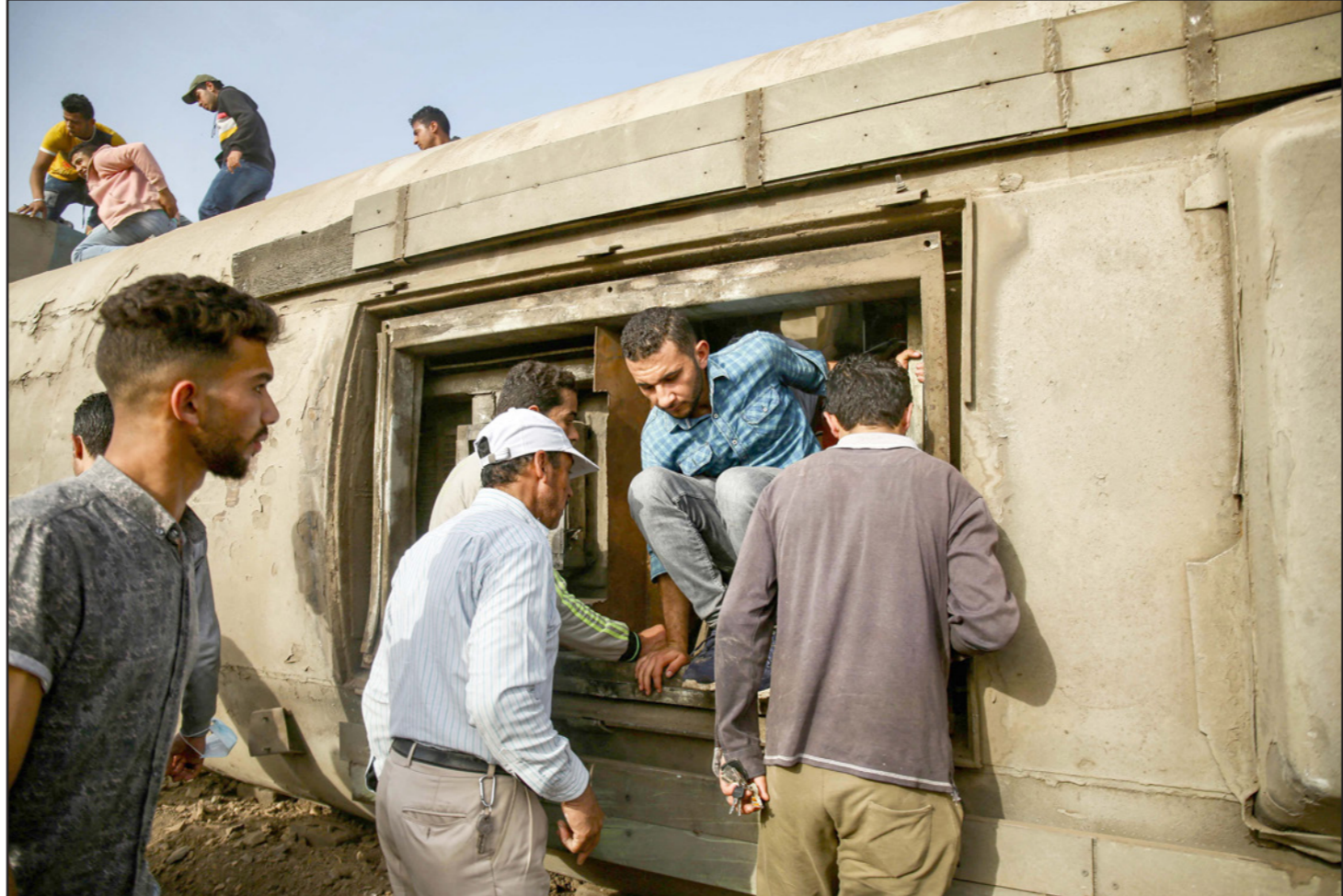
راكب يخرج من فتحة عربة ركاب مقلوبة في موقع حادث قطار طوح

وقالت في بيانها: «هل من المفترض أن نعد بيانا مسبقا تحسبا لحوادث أخرى، إن كتابة البيان للمرسة الثالثة في الشهر نفسه، بخصوص حوادث القطارات أشبه بكتابة تعزية