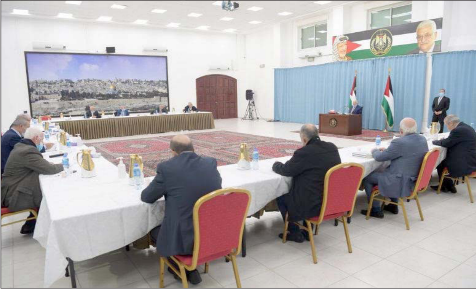
اجتماع اللجنة التنفيذية لنظام التحرير الفلسطينية

يقوم بها والقيادة مع أطراف المجتمع الدولي حول الأوضاع في فلسطين، وما يتعلق بإجراء الانتخابات العامة في فلسطين وفي مقدمتها الانتخابات التشريعية، وأكد أنه لن يكون هناك تغيير ولا تبديل في موعد الانتخابات.