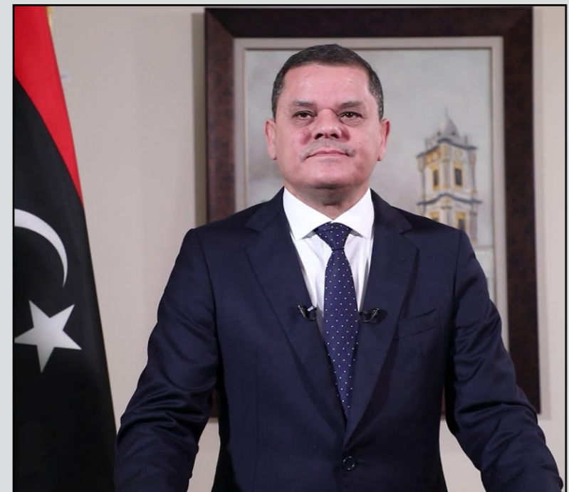
رئيس الوزراء الليبي عبد الحميد الديبية