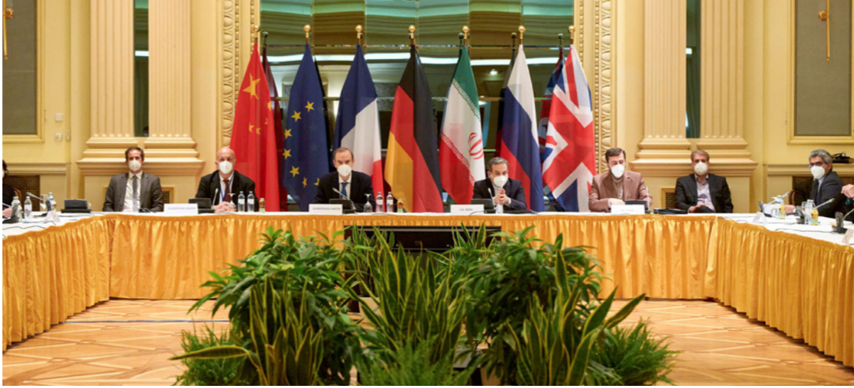
جانب من اجتماعات إيران بالقوى العالمية في فيينا