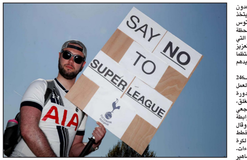
مشجع لنادي توتنهام الإنكليزي يعرب عن رفضه لانضمام ناديه للدوري السوبر

مدرّب أتلتيكو مدريد: «نحن المدرب، مستعدون للتدريب الأندية، لا شك لدي أن النادي سيستخذ قرار الأفضل لمستقبله». وقال مالك يوفنتوس أندريا أنييلي: «وصلنا سوياً إلى هذه اللحظة الحرجة، لتحويل الكرة الأوروبية واللعبة التي نحب باستخدام مستقلة طويل الأمد، تعزيز الضمان ومنح المشجعين واللاعبين تدفقاً منتظماً لمباريات قوية ستعزّي شعفهم باللعب مع ترويضهم ببناء جيد يهنا». نادي أرسنال في أوروبا الزاماً الملحن بالعلم التي تتدأ في 2024 وان الدوري السوبر الإنجليزي ستعترضه الرابطة بشدة. وقالت رابطة مشجعي الإنكليزية: «يقولون توقعوا غير المتوقع، لكن رابطة مشجعي تشلسي اخترت اليوم «الخيانة»، وقال رئيس وزراء بريطانيا بوريس جونسون: «خطط الدوري السوبر الأوروبي ستكون مؤذية جدا لكرة القدم وتدعم السلطات الكروية لاتخاذ الإجراءات. سنبصر قلب اللعبة الحالية ويقفون الجماهير في كافة أنحاء البلاد، يجب على الأندية المشاركة الاستجابة لمشجعيها ومجتمع كرة القدم الأوسع قبل اتخاذ أي خطوات أخرى». وقال القص الرئيسي الفرنسي: «يرحب رئيس الجمهورية (إيمانويل ماكرون) بموقف الأندية الفرنسية الرافض للمشاركة في مشروع الدوري السوبر الأوروبي الذي يهدد مبدأ الضامن والجدارة الرياضي». وقال النمساوي رالف هازنهوتل مدير سارنهاميوتون الإنكليزي: «بالنسبة لي من غير القبول ما يحصل وراء الكواليس. لا أحد يريد، ولا حتى جماهير تلك الأندية المشاركة». وقالت رابطة مشجعي ليفربول «سببتي أوف شاكلتي»، «مخرج، لأننا كعملي الجماهير نشعر بالخوف ونعارض تماماً القرار. تجاهل أس جي (مالك ليفربول) مشجعيهم لسعيهم الدؤوب وجشعهم للحصول على المال. كرة القدم لن تدوم».