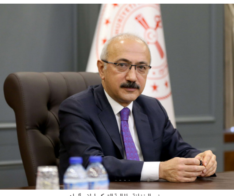
وزير الخزانة والمالية التركي لطفي ألوان

أنقرة - الأناضول: توقع وزير الخزانة والمالية التركي، لطفي ألوان، نمو اقتصاد بلاده بمعدل 5 في المئة في الربع الأول من العام الجاري، ويرقم مكون من خاتين في الربع الثاني، جاء ذلك في مقابلة أجراها الوزير التركي أمس الإثنين مع قناة «إن.تي.في» حول آخر التطورات الاقتصادية في البلاد.