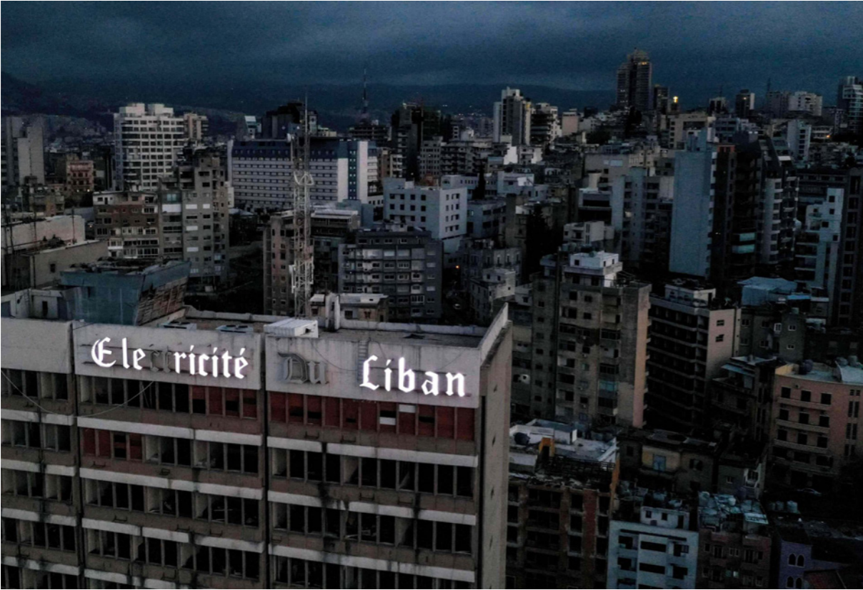
قطط علامة كهرباء لبنان مضمينة ومتكسرة بينما المبني وبيروت يربحان تحت الغلام