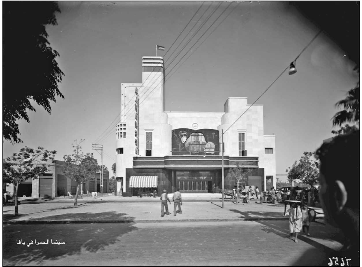
سينما الحمراء في يافا

هذا الانقطاع جعل للفلسطيني شخصية ثقافية معاصرة، أهم مؤسسيها أسماء معروفة عاشت وأنتجت وأسست، منذ ما بعد منتصف القرن الماضي، حتى اليوم، في الأدب والسينما والنقد والفنون بشتى أشكالها. لكنها، جميعها، تعود إلى ما بعد النكبة، ما جعلني أستهل هذه الأسطر بالقول، إن الشخصية الفلسطينية اليوم، تشكلت (أو تأثرت) بما لحق النكبة، تأسست على أيدي من لحق نتاجهم النكبة، بالتالي، ما تأثر بها، فكانت في نتاجهم ماس وبطولات.