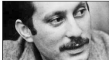
من الأعلى: غسان كنفاني - ناجي العلي