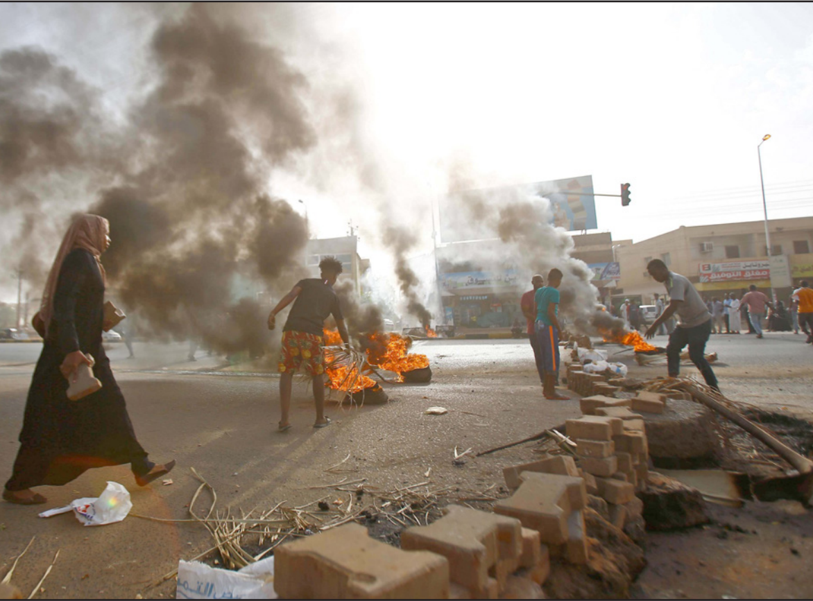
أرشيفية لأحداث فض الاعتصام في الخرطوم

يتطلبان المزيد من الصبر حتى تفصل الأجهزة العدلية في البلاد في كافة القضايا وفق الإجراءات المتبعة فيها، مشيراً إلى «إنجازات ثورة ديسمبر الجديدة التي أودت برموز النشر والإجرام من قيادات النظام البائد في السجون، وأعرب عن «ثقة في استكمال مسار الثورة الجديدة وتحقيق العدالة بمعاقبة الجناة والقتلة». كما عبر عدد من ممثلي أسر الضحايا في ولاية نهر النيل عن تطعاتهم لتحقيق العدالة بجانب إصرارهم وتمسكهم بأهداف الثورة الجديدة».