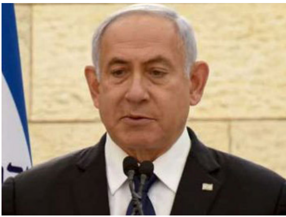
فسيكون حتماً «ميناً».

■ عمل رئيس الوزراء نتنياهو على تفكيك حكومة الطرف الأخر أكثر مما يعمل على تشكيل حكومة. بعد يومين من تلقي التكليف، أوضح بتسلييل سموتريتش أنه لن يوافق بأي حال على الجلوس في ائتلاف يستند إلى دعم «راع». وكانت هذه هي اللحظة التي خرج منه. بعد بضع محاولات أخرى لإقناع سموتريتش من جهة، ودعوة ساعر للعودة إلى الليكود من جهة أخرى، ولاصطياح بضعة فارين من أحزاب مختلفة على الطريق. انتقل جهاد نتنياهو كي يضمن بأن لا يكون بعده إلا الطوفان – إما هو أو انتخابات. ولا توجد إمكانية أخرى. ■ حين خسرت اللجنة التنظيمية في الكنيست، رأى أن السيناريو الأسوأ تجسد أمام ناظرية. فمثلما قامت كل القوى المعنية بالإطاحة به كي تحرم من قوته البرلمانية، فيأمنانهم أيضاً أن يتحدوا معاً كي يجرموه من رئاسة الوزراء بعد أسبوعين. وقد فعلوا هذا حتى بدون بينيت، الذي انضم هو (نتنياهو) إليه في اللحظة الأخيرة. إذا انضم «ميناً» إلى الـ 61 نائباً الذين اتحدوا معاً يوم الاثنين، سيداز معسكر التغيير أو الكراهية في الكنيست الحالية إلى 68 نائباً. وهي قوة يحظر تجاهلها. ■ إن هدف الهجوم الذي تم اختياره هو نفتالسي بينيت، الذي يعتبره نتنياهو هدفاً استراتيجياً. وذلك لأنه إذا كان هناك حزب كفلين بأن يحل «حرام» حكومة اليمين – اليسار – العرب البديلة،