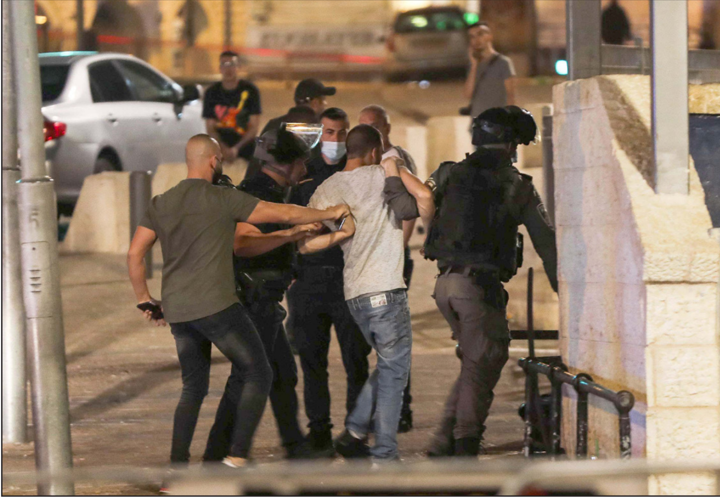
مواجهات في منطقة باب العمود في البلدة القديمة بين الشباب الفلسطيني وشرطة الاحتلال

وفي السياق، قال الشيخ عكرمة صبري خطيب المسجد