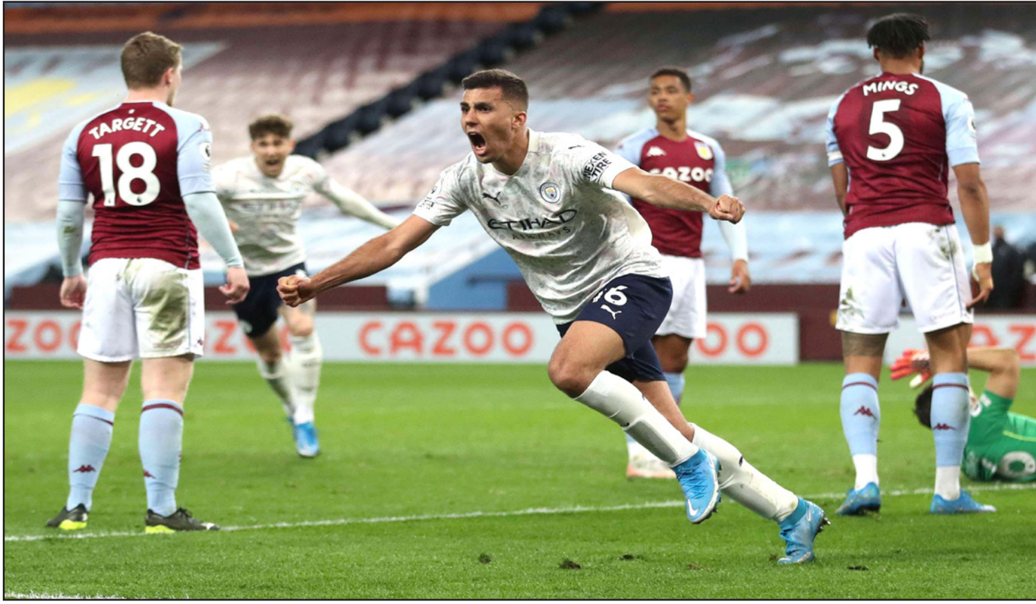
رودري لاعب وسط السيتي يحتفل بتسجيل الهدف الثاني في مرمى فيلا