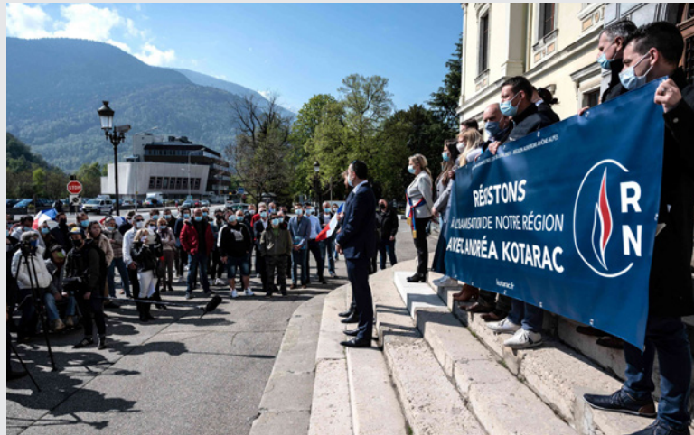
معتصمون فرنسيون من اليمين المتطرف في وقعة احتجاجية، منتصف الشهر الحالي، أمام بلدية البرتغيل اعتراضاً على افتتاح مدرسة للمسلمين في منطقتهم

وكجزء من التزامهم بلدهم الجديد وارتباطهم به، كان يُطلب من المتقدمين للجواز الذهبي استثمار 1.15 مليون يورو في البلد بما في ذلك استثمار في العقارات، إما بشراء بيت بقيمة 350 ألف يورو، أو استثمار بيت بعقد لمدة خمسة أعوام بقيمة 80 ألف يورو. وبعض البيوت التي تم استثمارها صغرة الحجم مقارنة بحجم العائلة لو قررت الإقامة فيها. وفي إحدى الحالات، استاجر صيني شقة من غرفتين بـ150 ألف يورو مع أنه تقدم بطلب