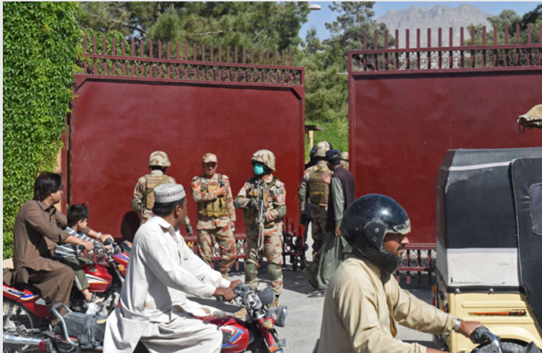
عناصر من الجيش الباكستاني يقفون في حراسة فندق سيرينا، في كويتا، الذي كان يستضيف السفير الصيني

قبل عشر دقائق من موعد عودة السفير إلى الفندق.