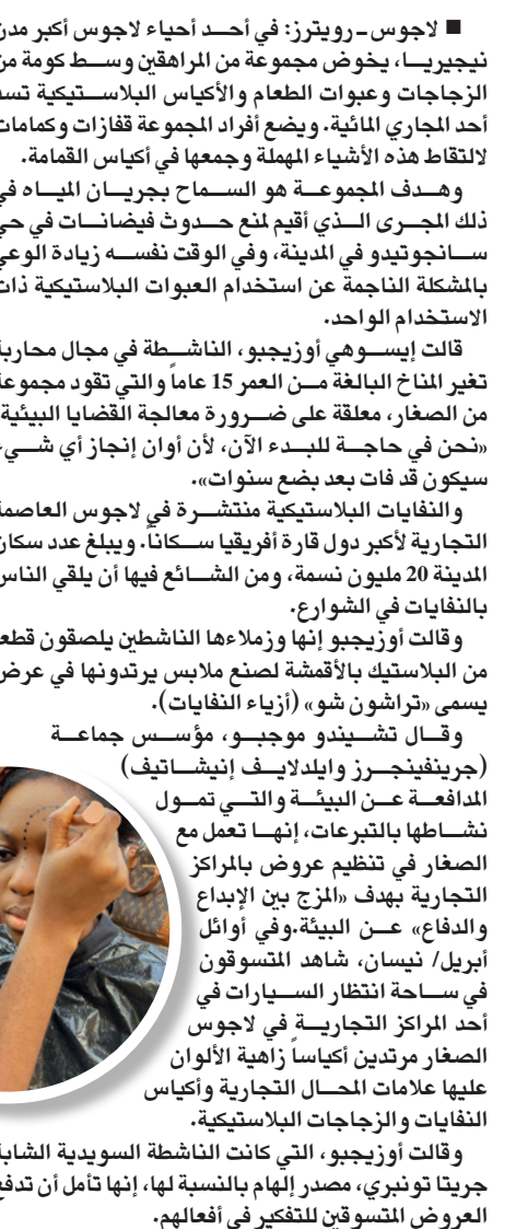
تجهيزات لعرض الأزياء

وقالت أوزيجيو، التي كانت الناشطة السويدية الشابة جريتا تونيري، مصدر الإلهام بالنسبة لها، إنها تأمل أن تدفع العروض المتسوقين للتفكير في أفعالهم.