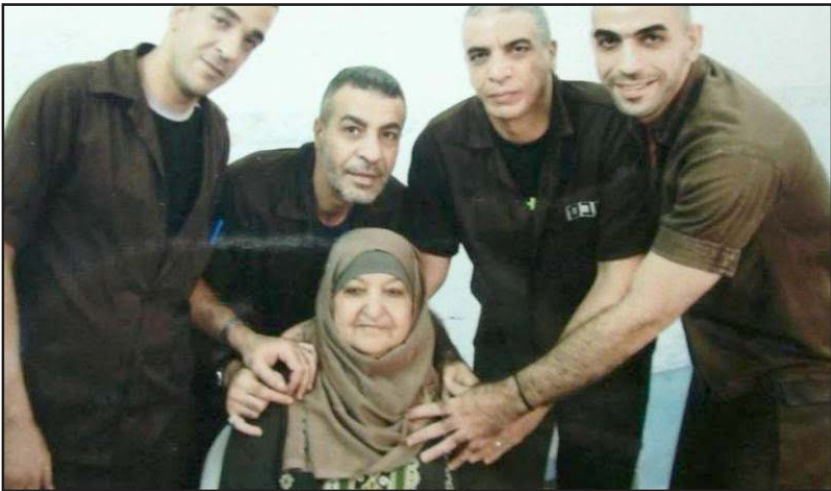
أم ناصر مع أربعة من أولادها الذين أصبحوا أسرى

يشار إلى أن هناك العديد من الأشقاء الذين تعتقلهم سلطات الاحتلال في سجونها، كما أن هناك آباء وأبنائهم لا يزالون معتقلين أيضا في سجون الاحتلال، ضمن سياسات منتهجة تستهدف الأسر الفلسطينية.