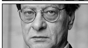
أدوارد سعيد - محمود درويش