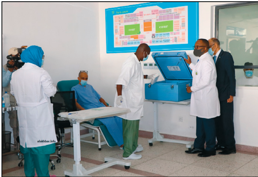
من أحد مراكز التطعيم ضد فيروس كورونا في موريتانيا