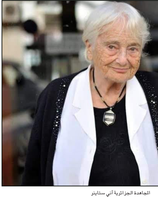
المجاهدة الجزائرية آني ستاينز

الجزائر – «القدس العربي»: من رضا شونوف: رحلت المجاهدة الجزائرية آني ستاينز، مساء الأربعاء، في الجزائر العاصمة عن عمر يناهز 93 عاماً، بعد أن تبنت القضية الجزائرية إبان الثورة التحريرية، واختارت الجنسية الجزائرية بعد الاستقلال. ولدت آني ستاينز عام 1928 في جحوط (مارينغو سابقاً) في محافظة تياره، من عائلة فرنسية من الأقدام السوداء (وهي العوائل الأوروبية والفرنسية تحديداً، التي أقامت في الجزائر خلال ثلاثة أجيال) التزمت لصالح القضية الوطنية غداة اندلاع الثورة الجزائرية، بعد أن عاشت عن قرب اضطهاد وظلم الاستعمار الفرنسي تجاه الشعب الجزائري. درست القانون في الجامعة، والتحقّت بفروع «جبهة التحرير الوطني» في العاصمة الجزائر. كانت بمنزلة رفيقة زوجها وأصدقائه العائلة لما أعلن عن اندلاع الثورة في الفاتح من تشرين الثاني/نوفمبر 1954، فقامت بالتصفيق بدون أن تتسهر. وبعد فترة وجيزة تواصلت مع مجاهدي الثورة، وتم قبول عضويتها في جبهة التحرير، وتروي أنهم عندما سألوها خلال التحقيق معها «إلى أي مدى أنت مستعدة للعمل مع جبهة التحرير الوطني؟»، أجابت: «أنا ملتزمة بشكل كامل».