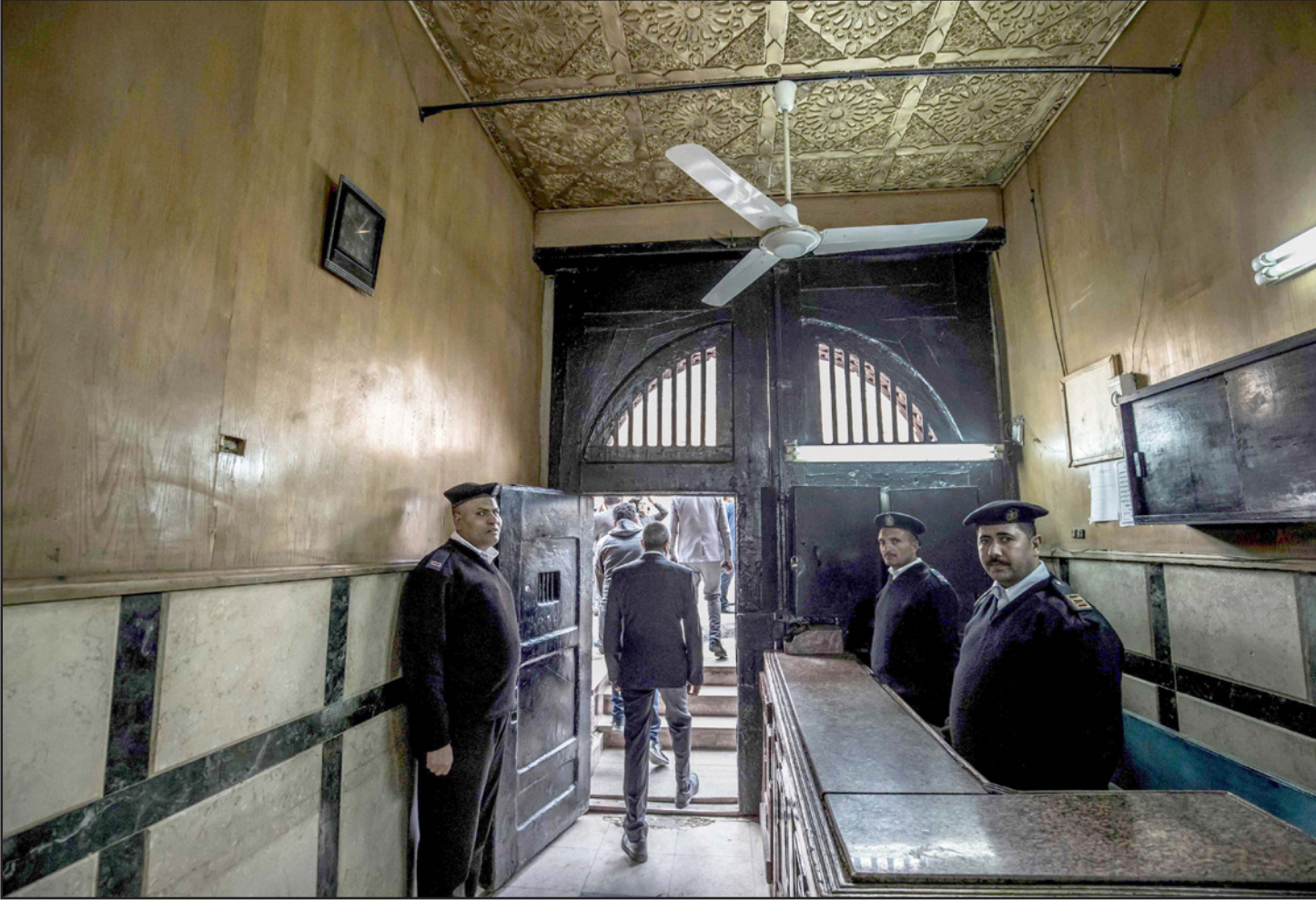
عناصر شرطة مصريين عند مدخل سجن طره في القاهرة