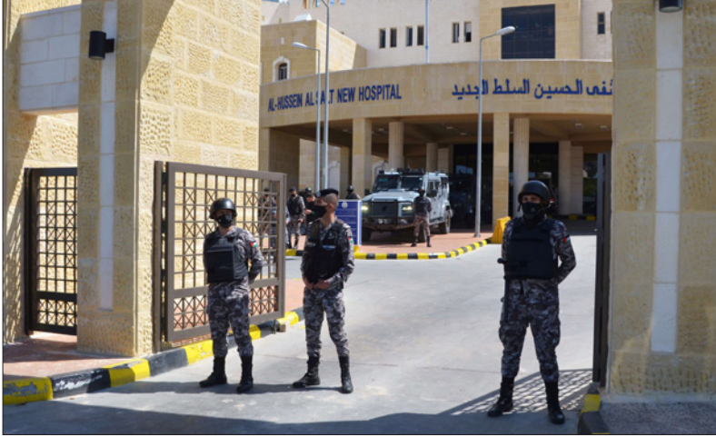
حراسة مشددة على مستشفى السلط عقب الأحداث الدراماتيكية التي أدت إلى وفاة 7 مواطنين الشهر الماضي

بالنسبة لنائب رئيس مجلس النواب أحمد الصغدني، ووفقاً لما فهمته «القدس