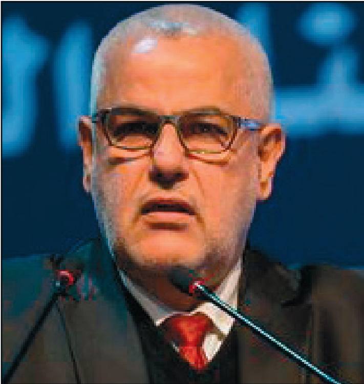
عبد الإله بن كيران

الدستور، وقال لشكر إن المذكرة التي كان حزبه قد أعدها حول القوائم الانتخابية أسست «القاسم الانتخابي» بناء على المصوتين لا المسجلين. وتابع قائلاً: يقينا طلبة المفاوضات ندافع عن هذه القاعدة، هناك من الأحزاب من كان معنا، وهناك من كان محافظاً متشبهاً بالنظام السابق الذي كان فيه نوع من الربيع لفائدة بعض الأحزاب. وأشار إلى أن حزبه نهب خلال انتخابات 2015 إلى «القطبية المصطنعة».