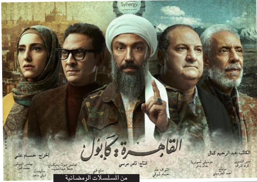
من المسلسلات الرمضانية

بعد «أوسكارز سو وايت»، برزت حركات تطالب بتعزيز التمييز لدور المرأة في كل المهن السينمائية، أمام الكاميرا وخلفها، ووفر لها ما كشفت قضية هارفي وايسن. ولا حظت مؤسسة موقع «أورورد دايلي» المتخصصة في الجوائز السينمائية منذ العام 1999