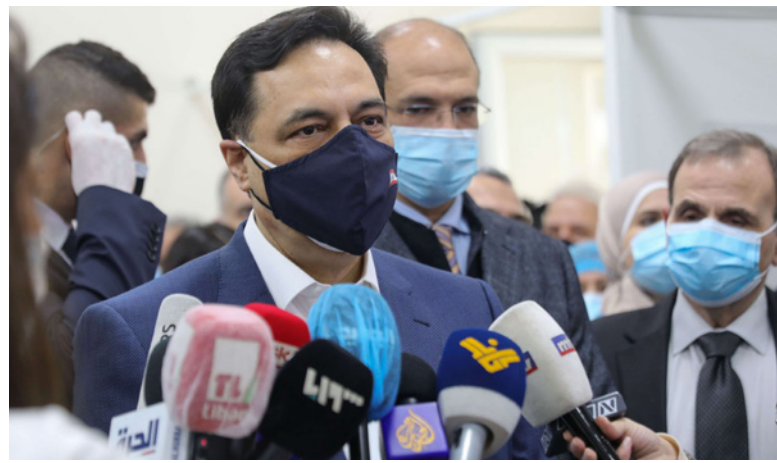
رئيس حكومة تصريف الأعمال اللبنانية حسان دياب

احتياطات النقد الأجنبي للبلاد. وفي الثاني من الشهر الجاري، قال وزير المالية اللبناني غازي وزني أن مخصصات تمويل الحرب الأهلية عام 1990، وادت الأزمة الاقتصادية منذ انتهاء الواردات من السلع الأساسية سينفذ بحلول