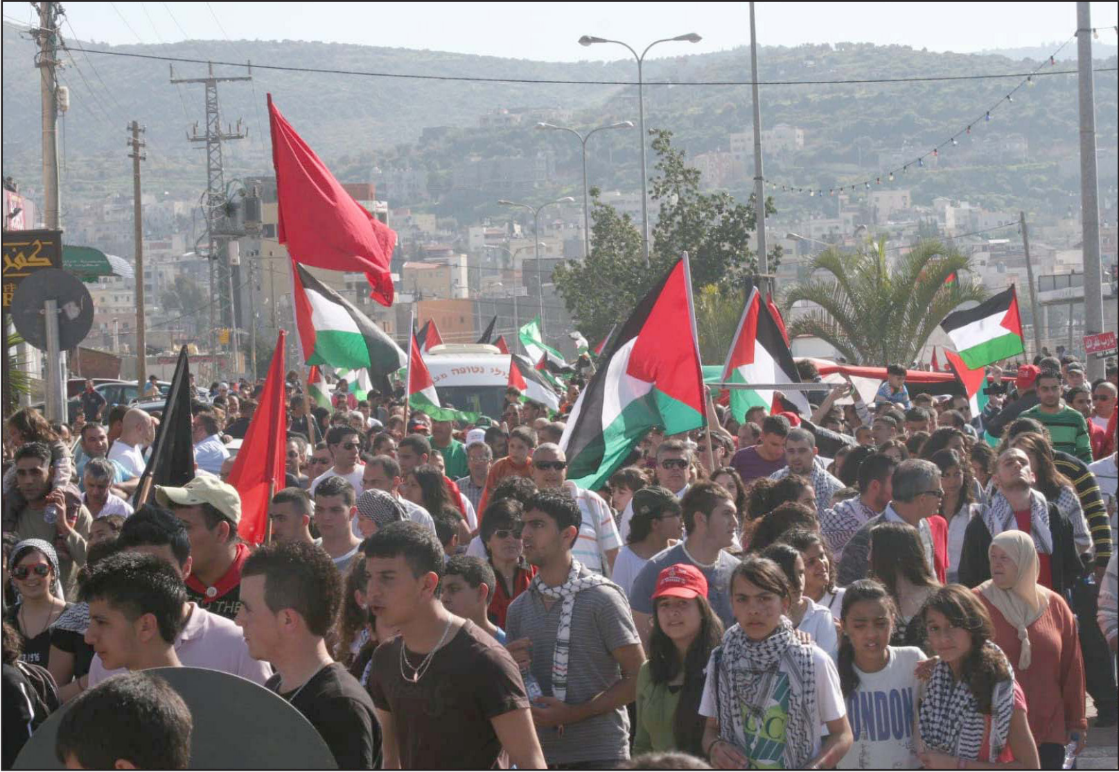
مظاهرة في مناطق 48 احتجاجا على العنف ضد المرأة

جميع المعطيات المتعلقة بقتل النساء، وتبويها وفقاً لمعطيات النساء من ناحية الهوية والجبل، والقومية والحالة الاجتماعية، وبناء آلية تواصل للشرطة وتبوية عالية مع كل امرأة صدر بحققها أمر حماية من قبل المحكمة، تبني وسيلة الأضداد الإلكترونية التي تبني الشرطة من اقتراب المعتدي على المرأة المحمية.