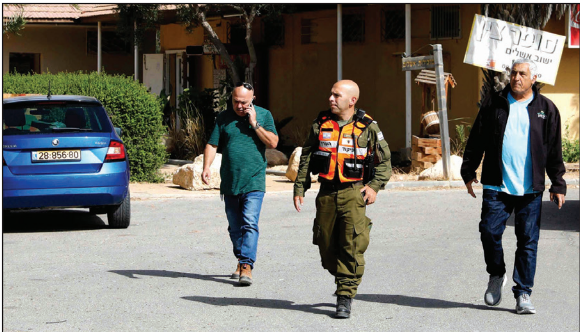
مسؤولون إسرائيليون يتجهون إلى موقع سقوط الصاروخ قرب مفاعل ديمونة النووي أمس

في تصعيد جديد وبما يبني بتغيير قواعد الاشتباك في سوريا بين إسرائيل وإيران، سقط في الساعات الأولى من فجر أمس صاروخ في محيط مفاعل ديمونة النووي الإسرائيلي في النقب في فلسطين المحتلة، وتزامن مع إطلاق قوات الاحتلال صفارات الإنذار. وجاء الرد الإسرائيلي سريعاً عبر تنفيذ 11 غارة على الأق، فجر أمس على قاعدة للدفاع الجوي في منطقة الضمير شرقي مطار دمشق الدولي.