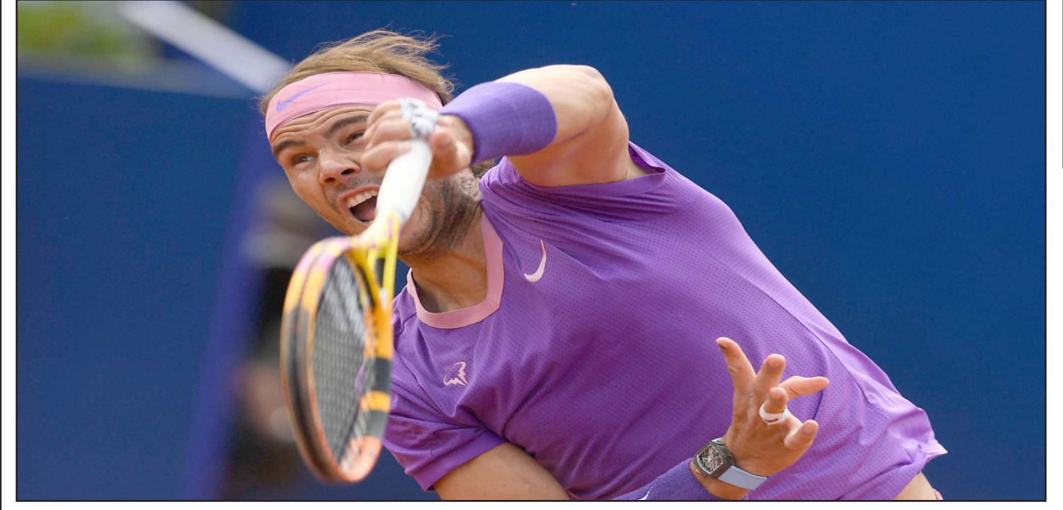
نادال يطلق إرسالاً خلال انتصاره الصعب على إيفانكا

المقبل، علماً أنه خاض تجربة غير ناجحة في مونتي كارلو الأسبوع الماضي بخروجه من ثمن النهائي أمام البريطاني المغرور دانيال إيمانز، في خسارته الأولى لهذا العام، ويسعى ديوكوفيتش (33 عاماً)، الذي أحرز لقبه الكبير الثامن عشر عندما توج بطلا لاستراليا كرون نجح في كسر إرسال ديوكوفيتش عندما كان الأخير يرسل للفوز بالمباراة، ليرد الصربي سريعاً بكسر إرسال الكوري ليخز بالجولة الثانية ثم بالمباراة، ويستعد الصربي لخوض عام بطولة رولان غاروس الفرنسية، والتي تنطلق في 30 أيار/مايو