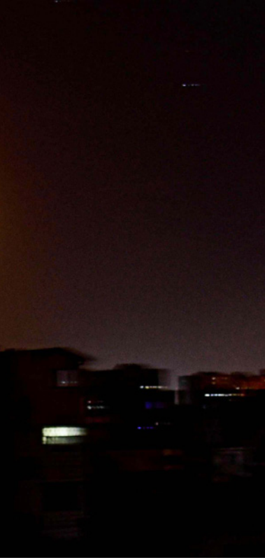
صاروخ إسرائيلي في سماء العاصمة دمشق، وفي الإطار أحد الأبنية المتضررة من الهجوم

وقالت اللعلوسات تغيد بأن الصاروخ الذي سقط هو صاروخ أرض – أرض وليس أرض – جو. مبينة أن المعلومات تزيف بأن الصاروخ من نوع فاتح 110 قادر على حمل رؤوس متفجرة.