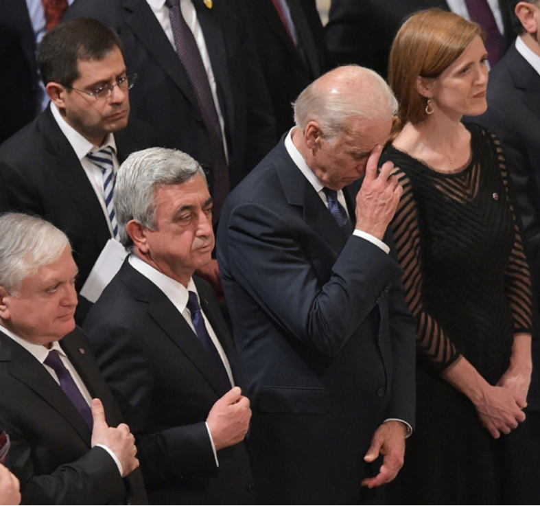
الرئيس الأمريكي السابق سرج سركسيان يقف إلى يمين جو بايدن (عندما كان نائباً لأوباما) خلال إحياء الذكرى المئوية للإبادة الجماعية للأرمن في الكاتدرائية الوطنية في واشنطن عام 2015

الأولي من مشروع الطائرة المقاتلة من دون طيار محلية الصنع عام 2023. واعتبر بيرقدار أن المنصة المحلية التي سيطورونها ستكون تكاليف توريدها وتشغيلها وصيانتها واستمراريتها أقل من تكاليف مقاتلات إف 35 وأن «أي نظام طيران سيتم شراءه من خارج تركيا سيجعلهم معرضين لقيود خطيرة من حيث الاستخدام المستقل.. هذه الأنظمة تحتوي على العشرات من الحواسيب المسؤولة عن المهام والرحلات والكترونيات الطيران، التي لا يستطيعون الإحاطة بها بشكل كامل، وإذا وضعنا في الحسبان قيود الاستخدام المحتملة مع مثل هذه الأنظمة، فإن منصة المقاتلة المحلية ستوفر لنا الاستخدام المستقل».