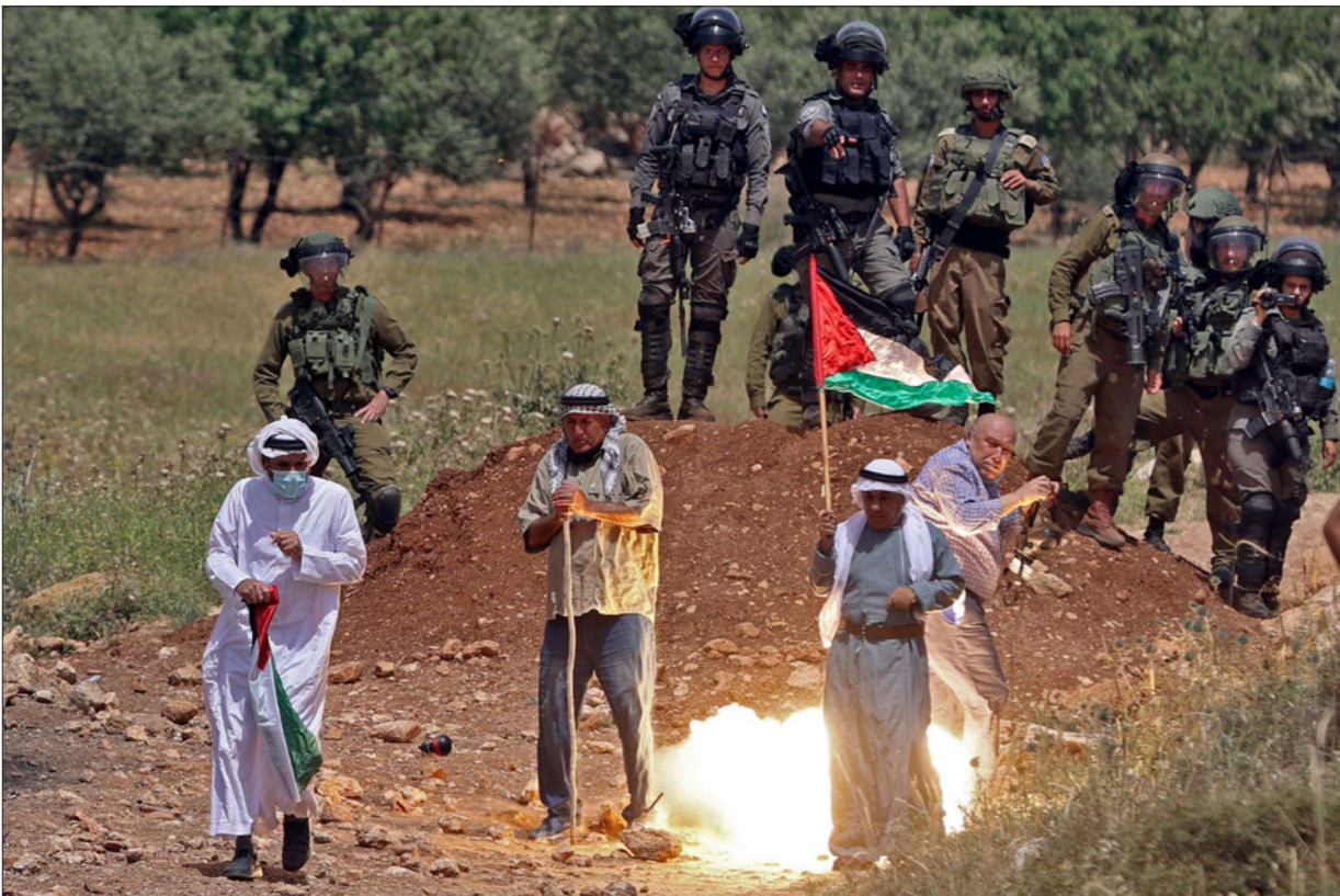
... وإصابة محتج في قدمه خلال احتجاجات على مصادرة أراض في بيت دجن قرب نابلس