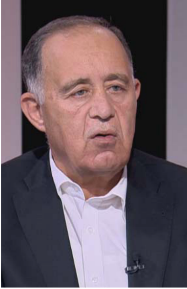
وزير المياه محمد النجار

لا يوجد بعد إشارات مباشرة إلى أن حاجة الأردن إلى المياه قد تدفعه في اتجاه تغيير قواعد اللعب السياسي مع نظام