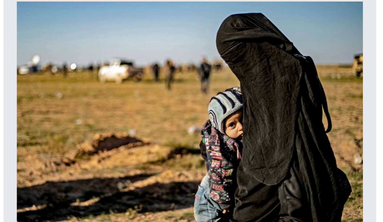
يقبع آلاف النساء والأطفال الأجنبي من عائلات أفراد تنظيم «الدولة» في مخيمي الهول وروج في محافظة الحسكة شمال شرق سوريا