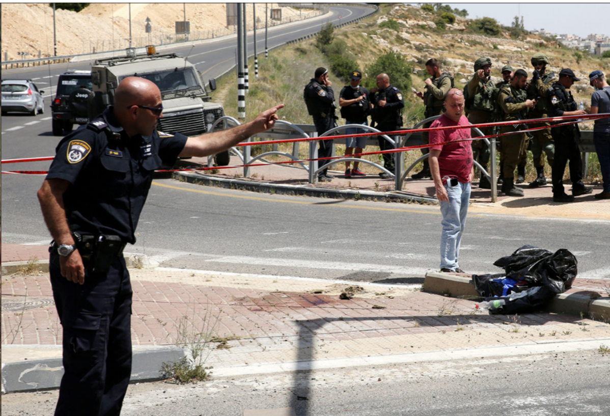
إصابة شاب في منطقة بيت لحم بحجة محاولة طعن جنود