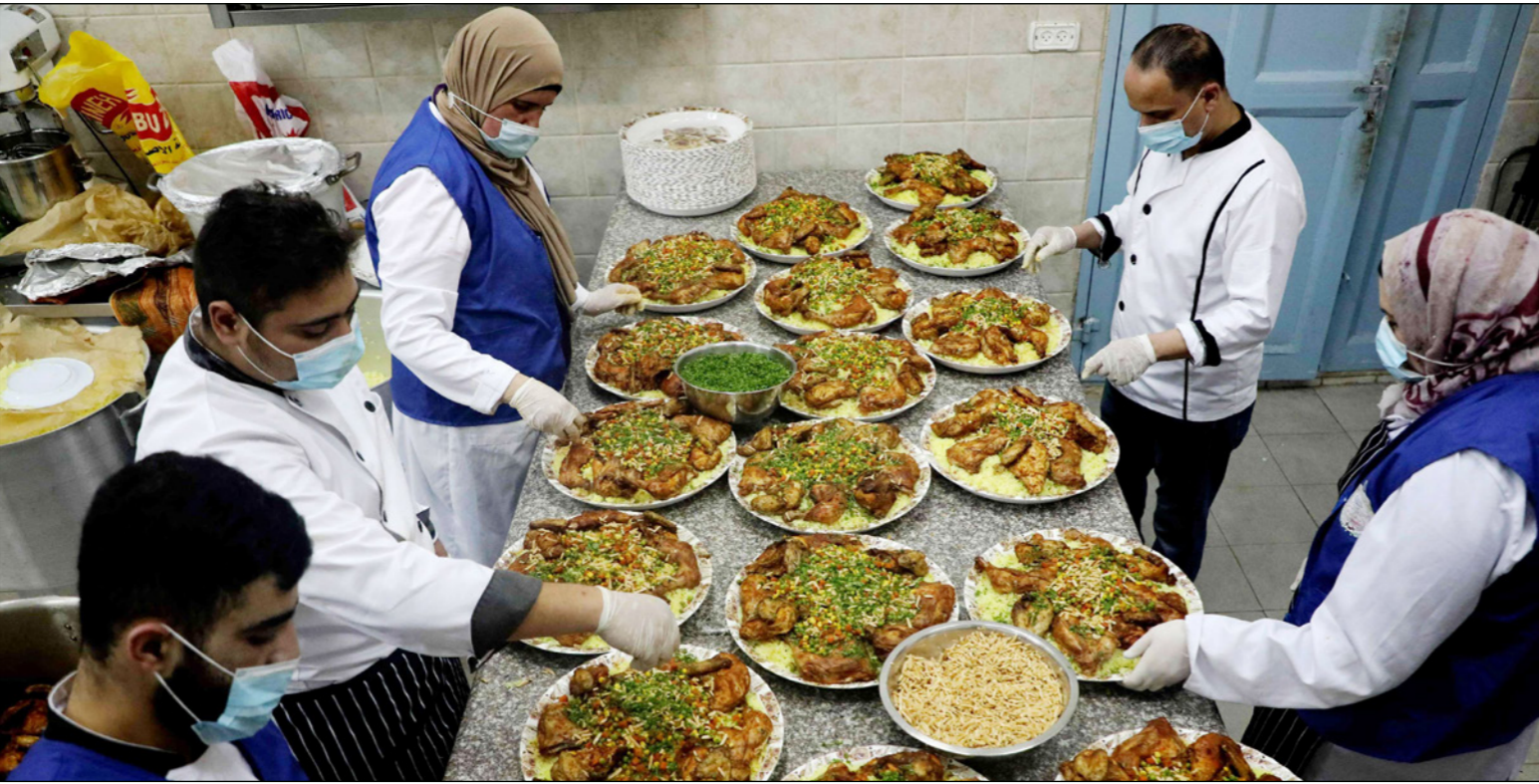
إحدى التكيات في الخليل التي تقدم الطعام للمحتاجين في الخليل

وفي البلدة القديمة من مدينة القدس ومن يأتي من المناطق القريبة من البلدة القديمة خاصة من المدن والختيمات المجاورة». وتابع «تعمد التكية حالياً في دخلها على بعض المحسنين ودائرة الأوقاف الإسلامية ووزارة الأوقاف في الأردن»، وتقدم الوجبات الساخنة لنحو 100 عائلة في الأيام العادية، أما في شهر رمضان فإن هذا العدد يرتفع إلى أكثر من 250 عائلة. وفي داخل التكية كان 9 من موظفي دائرة الأوقاف الإسلامية في القدس، يعملون على إعداد وجبات ساخنة تحتوي على الأرز واللحوم والخضراوات.