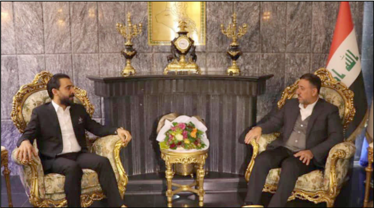
أرشيفية للقاء الحلبوسي والخنجر

الثائب الأول لرئيس مجلس النواب والسادة أعضاء مجلس النواب المرحة أسماؤهم في أدناه، وتتولى متابعة كافة الإجراءات المتعلقة باجتثاث البعث وتفعيل القوانين النافذة بهذا هو أساس أية انتخابات نزيهة وعادلة". وأصدر الحلبوسي، أمرا نيابيا بتغيير اسم لجنة المصالحة والبعث إلى لجنة "اجتثاث البعث"، وجاء في الأمر النيابي الذي حمل توقيع الحلبوسي: "عملا لأحكام المادة (135/ أول) من الدستور والمادة (104) من النظام الداخلي، تقرر تعديل تسمية لجنة (المصالحة والبعث والنيابية) إلى لجنة (اجتثاث البعث النيابية) على أن يضاف في عضويتها كل من السيد الإئتلاف رقم (1).