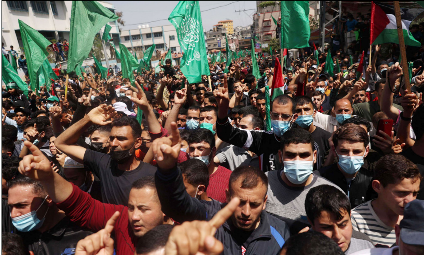
احتجاجات في غزة ضد تأجيل الانتخابات

وقال عضو اللجنة المركزية لحركة فتح عباس زكي «إن القرار الذي اتخذته القيادة بتأجيل الانتخابات لحين ضمان إجرائها في القدس جاء على ضوء المشاورات والاتصالات والنقاشات المتصلة بإجراء الانتخابات في القدس ورفض إسرائيل إجراءها بها، مؤكداً أن حركة فتح كانت جاهزة وعلى أهبة الاستعداد لخص الانتخابات» «لأنها وجدت أن لا قيمة ولا وجهة لأي ميراث للذهاب إلى الانتخابات دون القدس».