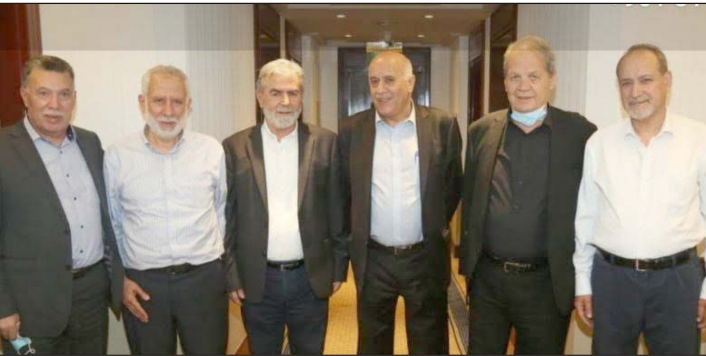
الوفد الفلسطيني المشارك في جولة الحوار في القاهرة

ولفتا إلى أن المجتمعين توافقوا على استمرار الاتصالات واللقاءات وتذليل العقبات التي تعترض طريق المصالحة الداخلية، «التي أكدنا على ضرورة إنجازها وفق أسس صحيحة وواضحة». وتأمل القاهرة بأن لا يطول الخلاف بين الطرفين كثيرا، حتى لا يؤثر ذلك على الجهود التي تبذل حاليا من أجل إعمار قطاع غزة، وخشية من أن يزيد ذلك من مسافات الانقسام. ووعد الوسيط المصري خلال اللقاءات خاصة مع حماس، بالاستمرار في الضغط على الجانب الإسرائيلي لإعادة الأمور إلى ما كانت عليه قبل العدوان الأخير، من خلال فتح المعبور واستئناف التصدير من غزة، وتوسعة رقعة الصيد، لضمان استمرار الهدوء. جاء ذلك في وقت تعهد فيه وزير الجيش الإسرائيلي بيني غانتس بالمحافظة على حالة الهدوء مع غزة، ونقلت تقارير عبرية عنه القول «سنهتزم بالواقع الأمني في الجنوب «قطاع غزة» ومن الجنوب، وأضاف «ما كان ليس ما سيكون».