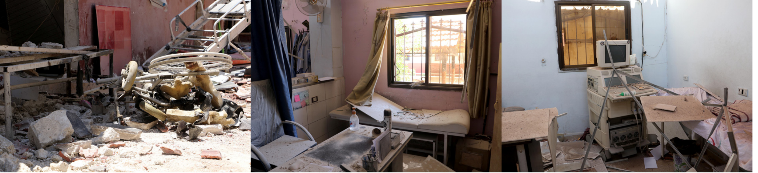
مجزرة مستشفى عفرين السوري... توقف العمل في المركز عقب استهداف الوحدات الكردية له حسب وكالة الاناثول

موجة نزوح هي الأكبر منذ 10 سنوات... توتر ميداني وقصف واسع في إدلب