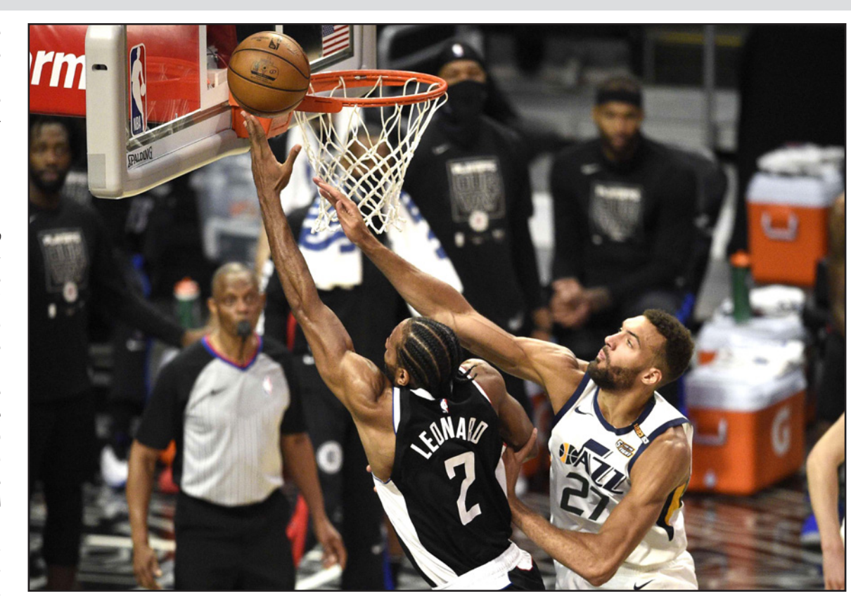
لينارد نجم كليبرز التآلق بهم بالتسجيل في سلة جاز رغم محاولة غويير لئعه

بخير. أردت العودة لكن لا داعي للمخاطرة بذلك لأننا كنا متأخرين بفارق 16 أو 18 نقطة وقتها. ساكون بخير". وسجل جو إنغلز 19 نقطة لـجاز، وأضاف جوردان كلاركسون 14 نقطة والفرنسي رودي غويير 12 نقطة و10 متابعات، ورويس أونيل 12 نقطة. وكان يوتا متأخراً 106-95 بعد ثلاثية من كلاركسون قبل 7 دقائق و18 ثانية من النهاية. ومع خروج ميتشل من المباراة، رأى كليبرز في ذلك فرصة للانقضاض على منافسه، وسجل عشر نقاط متتالية بينها ثلاثيات للينارد وياتوم ليعززا تقدم أصحاب الأرض 116-95 قبل نحو خمس دقائق من النهاية. وقال جورج: "أشعلوا ناراً محتناً، وكان علينا حماية أرضنا". من جهة أخرى، أعلن فريق بروكلن نيتس أن نجمه جيمس هاردن الذي ما زال يعاني من إصابة في أوتار الركبة اليمنى، سيغيب عن مبارياته الثالثة. وافقد نيتس في الدوري أمام ميلووكي باكس. ويقدم نيتس في سلسلة مباريات نصف النهائي للمنطقة الشرقية 1-2 على باكس، بعدما انتزع التقدم 2-صفر في أول مباراتين على أرضه، رغم غياب هاردن الذي لعب 43 ثانية فقط من المباراة الافتتاحية وغاب عن المباريات الثانية والثالثة. وافقد نيتس لجهود هاردن بسبب إصابة في أوتار الركبة تعرض لها في الدقيقة الأولى من المباراة الأولى التي فاز فيها نيتس أمام باكس 115-107. وأعلن فيلادلفيا سفينتي سيكسرز، الذي يتقدم أيضاً 2-1 في سلسلة أمام أتلانتا هوكس 1-1، أن لاعبه داني غرين سيغيب لمدة أسبوعين على الأقل بسبب إصابة عضلية.