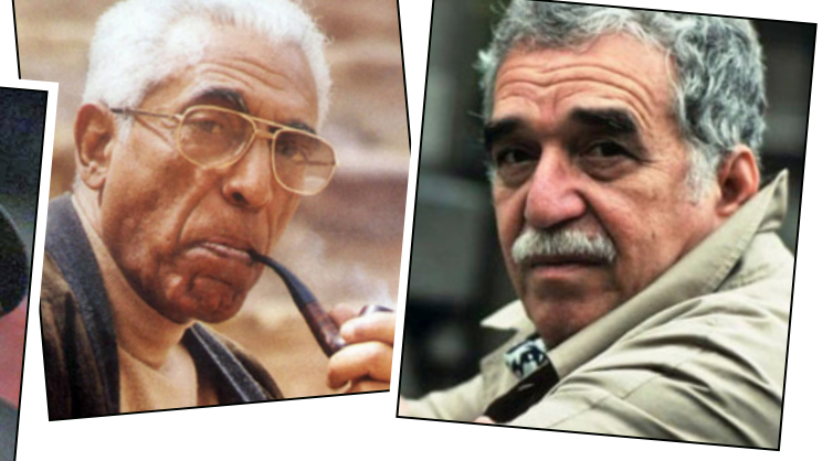
غابرييل غارسيا ماركيز – عبد الرحمن منيف – واسيني الأعرج – جرجي زيدان

وفي إطار ما يدور في ذهننا من أسئلة فإن الحديث عن هذه العلاقة سوف لا يستقيم إذا لم نتطرق إلى ما أنتجته مخيلة السارد العربي، وفي هذه الحالة لن يخضع بحثنا إلى تقصي مضمّن للكشف عما خلفه كُتابنا من عناوين في سجل العلاقة ما بين التاريخ والسرد، وبهذا المحور التاريخي، من السهل أن يبرز اسم الكاتب جرجي زيدان (1861 – 1941) الذي يعد أبرز الرواد الذين اقتحموا عالم السرد، وبانت في كتاباته هذه العلاقة، إذ شكل التاريخ منطلقاً أساسياً في نتاجه الإبداعي، فتجربته السردية تشير إلى سيطرة التاريخ في رواياته، بل يمكن القول إنه وظف الرواية لخدمة التاريخ، وليس العكس، كما أفضت إليه في ما بعد نتاجات ما بعد الحداثة، ومثالنا على ذلك الروائي الكولومبي غابرييل غارسيا ماركيز (1927 – 2014) الذي قرأ الآلاف الوثائق قبل أن يكتب روايته الموسومة «الجنرال في مائة»، فكانت النتيجة رواية حافلة بتفاصيل متخيلة عن الشهرين الأخيرين من حياة الجنرال بوليفار، محرر مناطق شاسعة من أمريكا اللاتينية في القرن الثامن عشر.