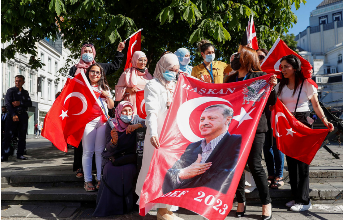
انصار الرئيس التركي رجب طيب اردوغان يحملون الاعلام ولافة أثناء تجمعهم أمام فندقه في بروكسل أمس

قبول كبيراً من قبل الحلف، إلا أن انقرة وضعت شروطاً كثيرة تتعلق بتوفير دعم واسع لها في هذه المهمة، حيث يرى مراقبون أن التوافق داخل الحلف على طرح التركي سوف يساهم في إعادة تعزيز الثقة بين الجانبين بدرجة كبيرة. وتولي تركيا أهمية كبيرة لإنجاح هذه الساعي وبشكل خاص تجنب أي تصعيد مع الإدارة الأمريكية، بل وتقديم بعض التنازلات في سبيل تحسين العلاقات من أجل تحقيق دفعة للعلاقات الاقتصادية، ما يساهم في دعم رؤية الحكومة لإعادة ترميم الاقتصاد بعد الأضرار الاقتصادية الكبيرة التي لحقت بالاقتصاد التركي بسبب انتشار فيروس كورونا وتسبب بمقاييس اقتصادية صعبة على المواطنين.