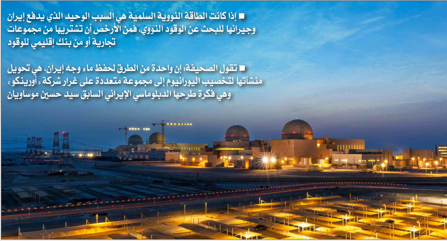
محطة بركة الطاقة النووية في أبو ظبي

■ تتقول الصحيفة: إن واحدة من الطرق لحفظ ماء وجه إيران، هي تحويل منشآتها لتخصيب اليورانيوم إلى مجموعة متعددة على غرار شركة «أورينكو» وهي فكرة طرحها الدبلوماسي الإيراني السابق سيد حسين موساويان