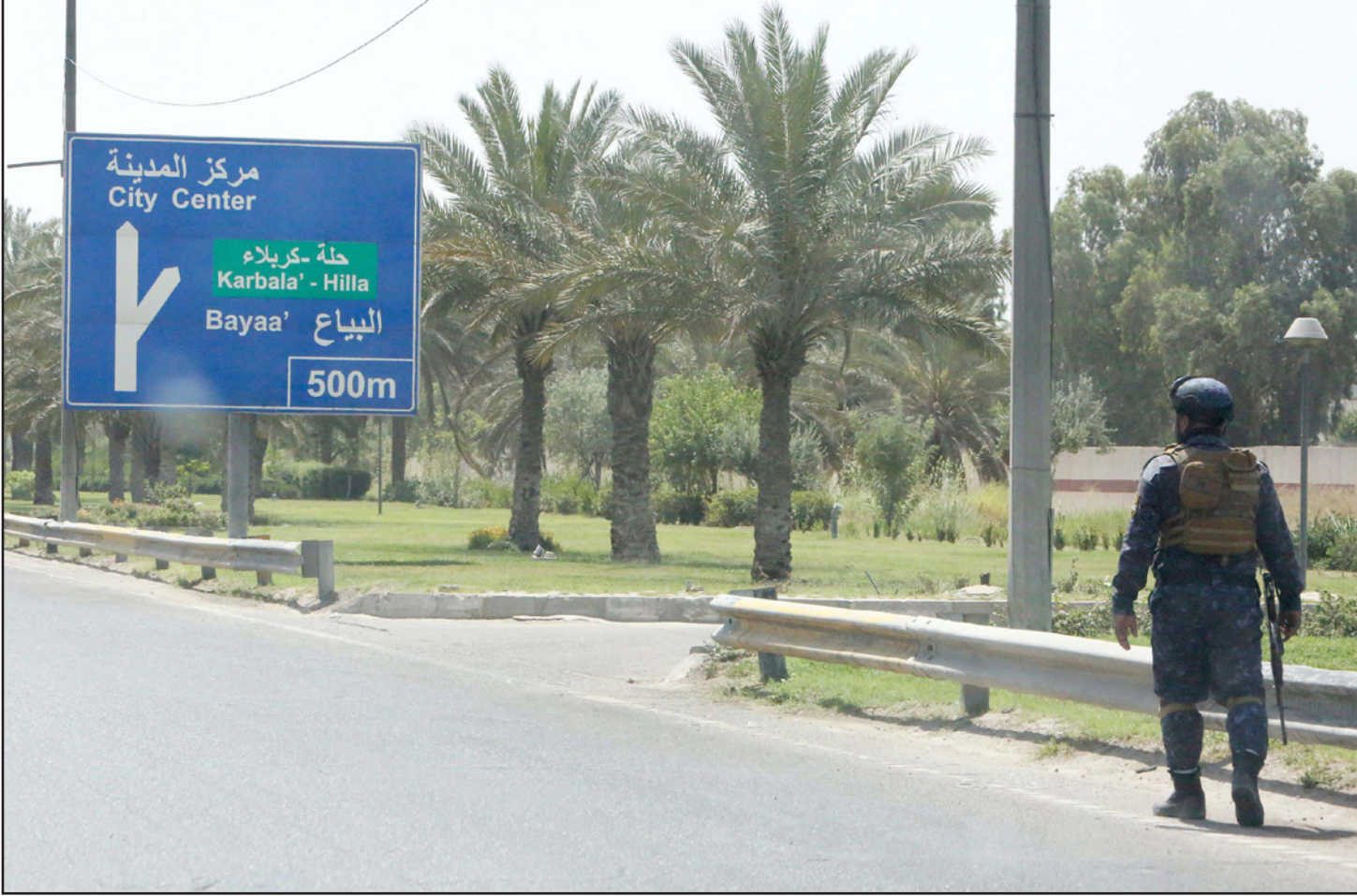
عناصر أمن عراقي يقف على طريق رئيسي قرب مطار بغداد

بغداد - «القدس العربي» من مشرق ريسان: أفادت مصادر أمنية، أمس الأحد، بانفجار عبوة ناسفة استهدفت دورية للأمن الوطني في محافظة نينوى العراقية، من دون تسجيل إصابات بشرية، فيما أطلقت كتلة سياسية في البرلمان، مبادرة من 10 نقاط للحد من «الخروقات الأمنية» ونشاط تنظيم «الدولة الإسلامية»، في عموم مدن البلاد. ونقلت مواقع إخبارية محلية عن مصادر أمنية قولها، إن عبوة ناسفة انفجرت، أمس، مستهدفة دورية للأمن الوطني، في ناحية النمرود في محافظة نينوى الشمالية. ووفقاً للمصادر، فإن الدورية كانت متجهة إلى موقع تفجير عبوات ناسفة استهدفت أبراج لنقل الطاقة الكهربائية في المنطقة ذاتها، تسببت بسقوط بروجين.