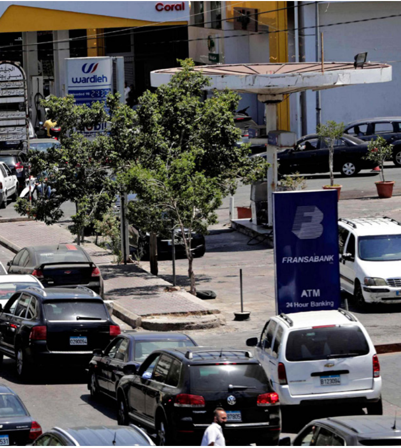
يقف اللبنانيون ساعات لتعبئة كمية قليلة من الوقود

وقال في إشارة ضمنية إلى عون وبإسلاف إن «هذا البيض غارق في «الأناب» وفي ترحسباتهم الوهمية، وكان الأخطار التي تحدى بسبقية الوطن لا تعينهم من قريب أو بعيد. إنهم يرفضون حتى أن يمسدوا أيديهم إلى الأيدي الممدودة من وراء الحدود لإقناعهم من أنفسهم، ومن الغرق في دوامة القوض والانهيار، وتشدّ المجلس على أنه «لا يمكن السماح بلباسٍ بمصالحيات رئيس