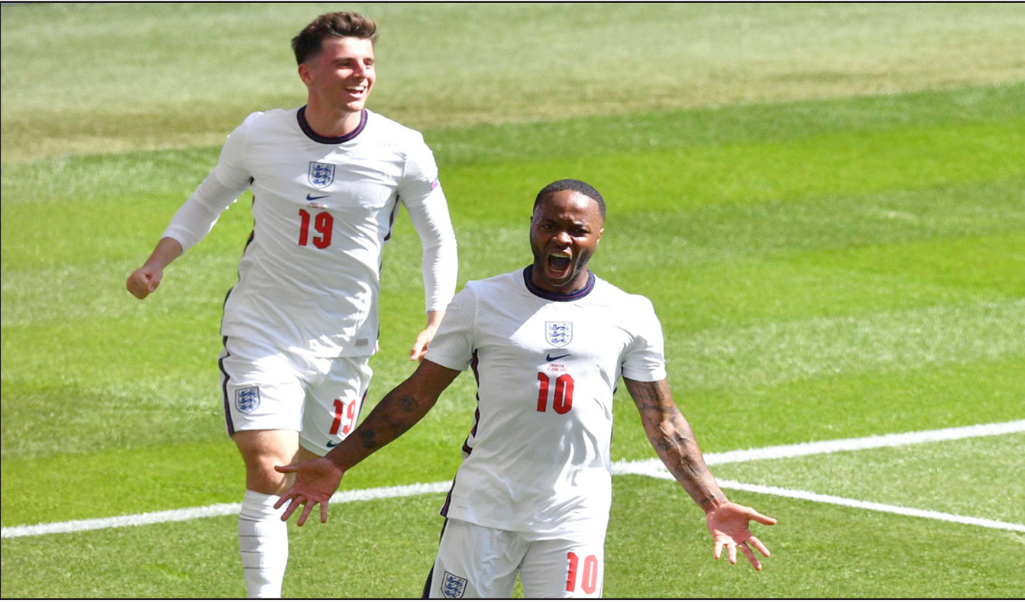
ستيرلنغ يحتفل بتسجيل هدف الفوز لإنكلترا وخلفه زميله ماونت

وبدا رجال المدرب غاريت ساوثغيت اللقاء بقوة وكانوا قريبين من افتتاح التسجيل منذ الدقيقة السادسة لكن الحظ عاند فل فون بعدما ارتدت تسديده من القائم. واستمر رجال ساوثغيت بضغظهم وتدخل الحارس الكرواتي دومينيك ليفاكوفيتش هذه المرة للوقوف في وجه تسديدة كالفن فيليبس (9)، وبعدها عرف كيف يمتص فورة الإنكليز، بدأ المنتخب الكرواتي انطلاقاً نحو مرمى جوردان بيكفورد لكن بدون خطورة، حتى نهاية الشوط الأول الذي خلا من أي إثارة حقيقية باستثناء دقائقه الأولى، ولم يختلف الوضع في مستهل الشوط الثاني حيث بدأ المنتخبين عاجزين تماماً عن الوصول إلى الشباك الكرواتية بفضل تمريرة مثقنة من فيليبس الذي كان أفضل لاعبي بلاده والمباراة، وترجم ذلك في النهاية بالتمريرة الحاسمة، ورفع مهاجم مانشستر سيتي رصيده إلى 13 هدفاً في مبارياته الـ17 الأخيرة مع إنكلترا، إضافة إلى ست تمريرات حاسمة خلال هذه السلسلة، وكان الهدف كافياً كي تخرج إنكلترا منتصرة من مباراتها الأولى بعدما عجزت كرواتيا عن العودة، حتى أنها فشلت في تهديد مرمى بيكفورد رغم جهود القائد لوكا مودريتش والتدريبات التي أجراها المدرب زلاتكو داليتش، لتصبح بالتالي مطالبة بالتعويض في مباراتها الثانية الجمعة ضد تشيكية في غلاسغو، وكانت المباراة تاريخية للإنكليز جودي بيلنغهام الذي دخل في الدقيقة 82 بدلاً من القائد هاري كاين، إذ بات عن 17 عاماً و349 يوماً أصغر لاعب يشارك في النهائيات القارية على الإطلاق، والأصغر في تاريخ إنكلترا على صعيد كاس أوروبا وكاس العالم، وتفوق لاعب بروسيا دورتوموند على الهولندي يترو فيلمز الذي كان يبلغ 18 عاماً و71 يوماً حين شارك في مباراته الأولى في كاس أوروبا 2012 ضد الدنمارك.