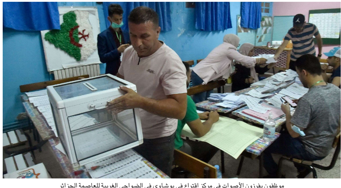
موظفون يفرزون الأصوات في مركز اقتراع في بوشاوي في الضواحي الغربية للعاصمة الجزائرية

لندن - «القدس العربي» : نشرت صحيفة «واشنطن بوست» تقريراً لشيوخ أوغويدي قالت فيه إن الانتخابات التشريعية الجزائرية شهدت نسبة إقبالاً متدنية رغم أنها الأولى منذ موجة الاحتجاج في 2019. وقالت إن امرأة شابة قررت في الفترة الأخيرة أن التصويت هو الطريق الأفضل لتغيير الجزائر، فيما سخر رجل كبير في العمر من فكرة الاقتراع واصفاً الحكومة بالفساد والشعب به «المختنق». وأضافت أن الآراء المتباينة كانت واضحة يوم السبت وأثناء أول انتخابات تشريعية تعقد منذ الإطاحة بالرئيس عبد العزيز بوتفليقة والذي حاول الترشح لفترة خامسة رغم غيابه المستمر عن الحياة العامة بعد إصابته بجلطة دماغية عام 2013، وقاطع آخرون العملية برمتها ووصفوا الانتخابات بأنها لا تعدو عن حفلة تذكيرية لن تغيير الحرس القديم الذي يحكم البلاد أو تعالج المصاعب الاقتصادية النابعة من تراجع موارد الطاقة. وهناك آخرون شعروا بالخيبة بدرجة منتهمة عن الاقتراع حيث تحسروا على عدم حدوث تغيرات منذ ظهور حركة الحراك التي أنهت 20 عاماً من حكم بوتفليقة. وقال محلل سياسي جزائري رفض الكشف عن هويته «هناك لا مبالاة» و«لا يؤمن الجزائريون كثيراً بهذه الانتخابات، وينظرون للبرلمان على أنه عديم الفائدة».