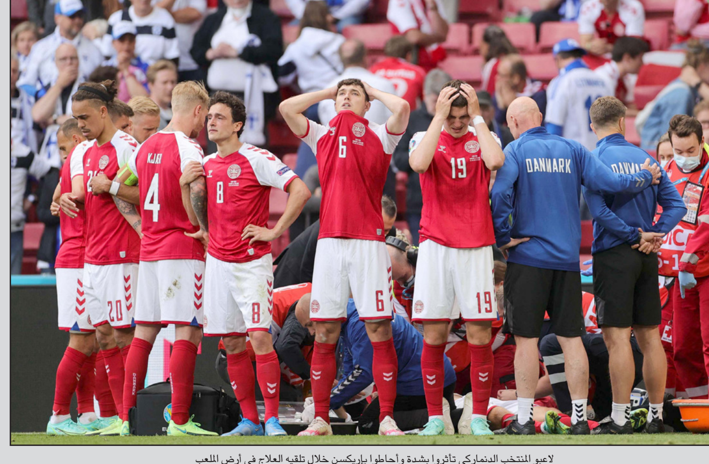
لاعبو المنتخب الدنماركي تأثروا بشدة وأحاطوا بإريكسن خلال تلقيه العلاج في أرض الملعب

■ كوبنهاغن - د ب أ: أكد كاسبر هيولاند مدرب المنتخب الدنماركي أن لاعبي فريقه بذلوا جهوداً مضاعفة لإكمال المباراة أمام فنلندا بعد تعرض نجم الفريق كريستيان إريكسن لانهايار وسقوطه مغشياً عليه. وقال منتخب فنلندا على صفحته التويترية في 14 يونيو 2020، وقال هيولاند: "ما قام به اللاعبون أمرًا لا يصدق، لا يمكن أن أكون أكثر فخرًا، للاعبين تعرضوا للاستنزاف الجسدي والعاطفي". وأوضح: "كان لدينا خياران، أن نكسر المباراة اليوم أو نلعبها مساء غد الأحد، الجميع أراد اللعب اليوم، اللاعبون أيقنوا أنهم لن يستطيعوا التواءنا أو أنه من الأفضل إنجاز الأمور الآن". وأشار هيولاند إلى أنه تحدث إلى إريكسن وعائلته، مضيفاً: "لقد تذكرنا جميعاً أن أهم شيء في الحياة هي الصحة، أن تلفت الناس القريبة حولك، كل قلوبنا مع كريستيان وعائلته". وانهار إريكسن نجم إنتر ميلان الإيطالي داخل الملعب قبل دقيقتين من نهاية الشوط الأول، دون أي تدخل من أي لاعب آخر، وحاول الجهاز الطبي لمنتخب الدنمارك علاج اللاعب على مدار عشر دقائق قبل أن يقرر الحكم إيقاف المباراة، والتف لاعبو الدنمارك حول إريكسن، وسقط حالة صدمة لجميع من تواجد داخل الملعب. وبكى بعض لاعبي الدنمارك بعد سقوط إريكسن على الأرض في الدقيقة 43. وتوجه لاعبو المنتخب الفنلندي إلى غرف خلع الملابس في الوقت الذي نقل فيه إريكسن إلى خارج الملعب على محفة مع وضع قطعتين كيريتين من القماش حول جسده وسط التفاف زملائه من حوله، وحاول سيمون كابر قائد المنتخب الدنماركي والحارس كاسبر شمائيك احتواء سابرينا رفيقة إريكسن داخل الملعب.