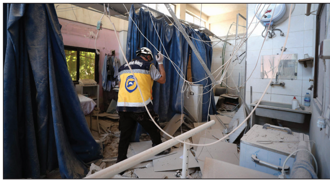
عنصر من الخوذ البيضاء يتفقد الأضرار في مشفى الشفاء أمس بعد قصف للنظام على مدينة عفرين

لصف صاروخى مصدره المناطق التي يسيطر عليها نظام الأسد وقوات سوريا الديمقراطية في ريف حلب الشمالي، ما أدى لقتل 15 مدنيا بينهم 4 نساء، وطفل، وإن يتم تبينهم ثثان من الكوادر الطبية واثان من العمال الإنسانيين.