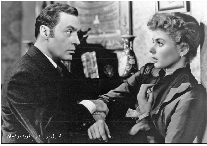
شارل بوابيه وأنغريد برغمان

المزمل، ويقراها «براين» ويبلغها أن المدعو «باور» كان قد عمل عازقاً لدى خالتها وأخفى مياشرة بعد مقتلها، كما أنه في الحقيقة متزوج من امرأة في براغ، وما أن يغادر «براين» المنزل حتى يدخله الزوج سعيداً، حيث وجد المهورات الثمينة بعد أن قضى كل تلك الفترة باحثاً عنها، لكنه يكتشف أن «براين» قد قتل الزوج في الحقيقة «باور» الذي قتل قبل أن يؤدي «بولا» يدخل «براين» مع الشرطة ويلقي القبض على الزوج. إذ فهم «براين» كل شيء، فقد كان الزوج في الحقيقة «باور» الذي قتل المغنية طمعا بالمجوهرات، إلا أنه لم يجد حينذاك. وتحقق «بولا» بزوجها المكشفت أمامها وتنجح في الانتقام منه بظواهرها بمحاولة طعنه وهو العاجز عن الدفاع عن نفسه، وتأخذ الشرطة زوجها وينتهي الفيلم.