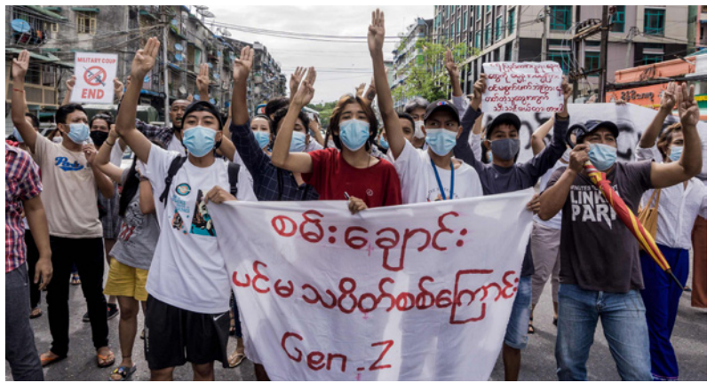
محتجون، أمس في يانغون، يشاركون في مظاهرة ضد الانقلاب العسكري

لمروهينجا: القصة غير المروية»، وذكر التقرير أنه تم حرق أكثر من 34 ألف مسلم من الروهينجا، وتعرض أكثر من 114 ألفاً للضرب، واغتصب ما لا يقل عن 18 امرأة وبنيت من قبل قوات جيش وشركة ميانمار، كما تم حرق أكثر من 115 ألف بيت، وتخريب 113 ألف منزل.