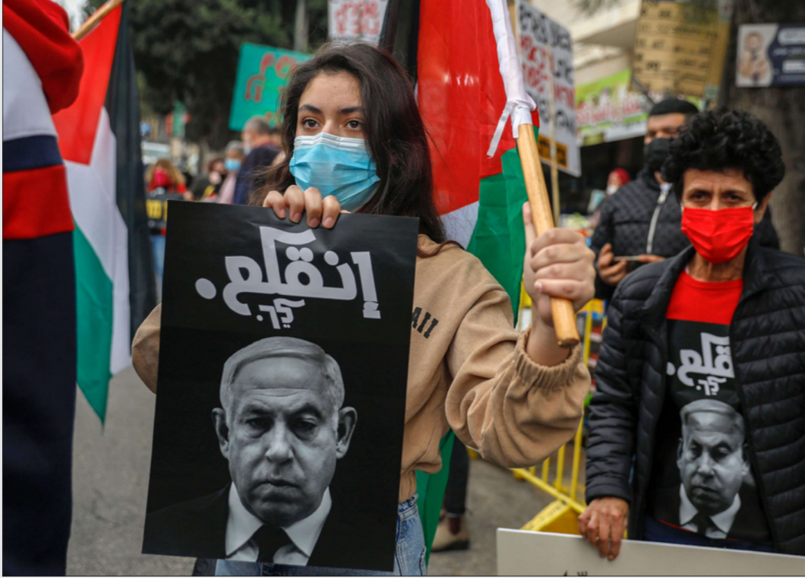
استخدم نتناهو لغة تحريضية ونارية ضد المواطنين العرب في إسرائيل لإخافة اليمين المتطرف ... لكنها شهادة على اليعد الانقسامى في شخصيته الذي أدت لسقوطه