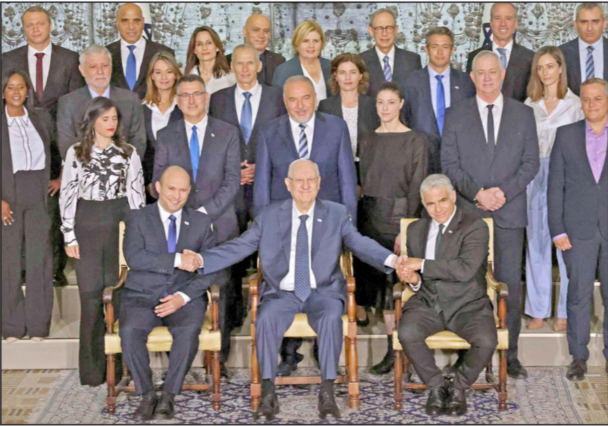
الرئيس الإسرائيلي بين رئيس الوزراء الجديد نفتالي بينيت وبديله يائير لابيد

وسبق لبينيت في إحدى المقابلات التي أدلى بها عام 2017 أن قال إن ما يقف في صلب تطلعاته هو تحويل الحزب الذي يقف على رأسه إلى حزب ذي مظلة واسعة للغاية تكون أكثر صهيونية، ويوسعها أن تكون سقفا للجمع. ورداً على سؤال عما يختلف هذا الحزب الذي يسعى إليه عن حزب الليكود قال بينيت إن الليكود لا ينفك يرفع لواء الأمن فقط والأمن. وتابع «في حال الائتزام بهذا اللواء وحسب، ستعمل إسرائيل حتماً إلى أماكن ليست جيدة وغير مُحمّدة من طرفه، مثل الانفصال عن قطاع غزة، وخطاب بار إيلان، وما شابه ذلك. لكن عندما تستند إلى الأساس اليهودي، فستكون في مكان آخر على الإطلاق، وستسعى قوة صمودها أمام الضغوط، ذات جذور أعمق بكثير، وهذا الأمر سيستع على كل شيء»، وتخصس أقوال بينيت هذه إصرار الصهيونية الدينية على إعادة تصميم المجتمع الإسرائيلي وفقاً لصورة الصهيونية الحالية خليط من العنصر القومي والدينية. يشار إلى أن الحزب الحليف «أمل جديد» برئاسة جدعون ساعر، الذي انفصل عن حزب الليكود، كان من الملتفت أن أكثر ما يهيمه أيضاً هو إبراز حقيقة أنه إلى يمين ننتياهو، لا فيما يحيل إلى المستقبل فحسب، إنما أيضاً في كل ما يتعلق بمسيرته السياسية حتى الآن والتي بدأها كناشط في صفوف حزب «متحيا - تحالف أمناء أرض إسرائيل» الذي تأسس في إثر اتفاقية السلام بين مصر وإسرائيل على خلفية أن هذه الاتفاقية انحطت على الانحساب من شبه جزيرة سيناء. وبعد ذلك، في عام 1999 عُين ساعر سكرتيراً للحكومة، وفي إطار وظيفته هذه ترأس وفد إسرائيل إلى الأمم المتحدة لإحياء مساعي إقامة لجنة تحقيق دولية لتقصي قائع ما ارتكبه قوات الجيش الإسرائيلي في مخيم جنين للاجئين الفلسطينيين إبان الانتفاضة الفلسطينية الثانية.