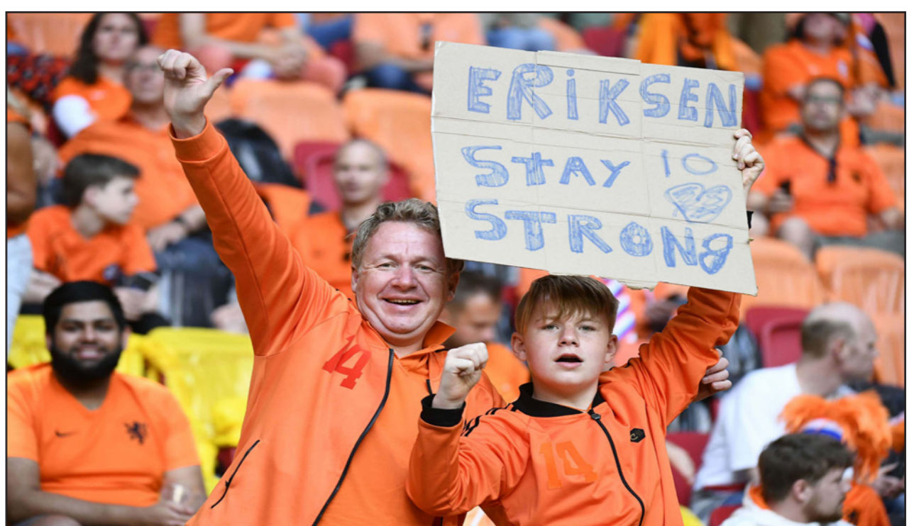
مشجعان للمنتخب الهولندي يساندان النجم الدنماركي إريكسن

لذا كان الامر سريعاً، وسقط إريكسن المتوجع على الأرض في جافة على الأرض عندما كان يستقبل الكرة من رمية تماس قريبة قبل انصاف المباراة في كوينهاغن، وشكل مزلاًو دائرة حوله لحمائته من الكاميرات بعد تدخل فريق الإسعاف طبي محاولاً إبعاشه. وبعد نحو 15 دقيقة من سقوطه، عندما كانت النتيجة تشير إلى تعادل سلبي، تم اخراج اللاعب على حمالة، برفقة جهاز طبي ولا عيبى التنمركز الدنمارك الذين بدا عليهم التأثر بشكل كبير، فيما قامت الجماهير المحلية بالتصفيق. وقال وكيله إن "الرسائل وصلت من كل أنحاء العالم، تأثر كثيراً بذلك التي وصلت من الإنترنت، ليس فقط من زملائه بل ايضاً المشجعين".