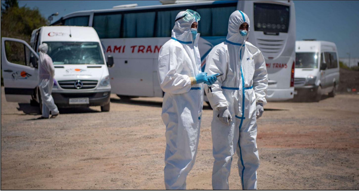
أرشيفية لفريق طبي مغربي ينتظر الحالات الذين تم اختبارها لفيروس كورونا في موقف للسيارات في مدينة مولاي بوسلمام

وعزا الباحث ذلك إلى تباطؤ اللقاح عالمياً، وزيادة الضغط على اللقاحات من طرف الدول الغنية التي شرعت، بالإضافة