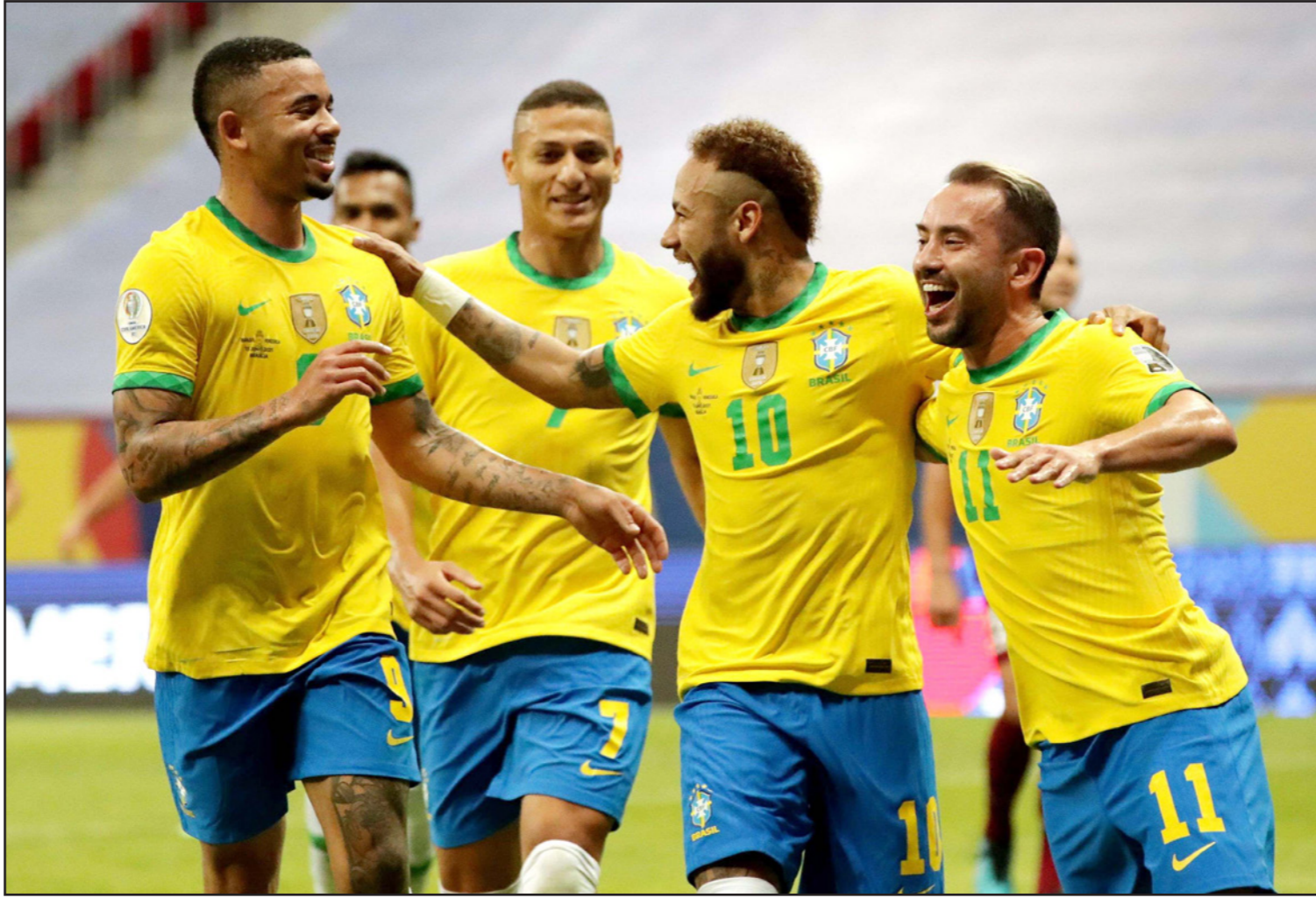
نيمار (10) يحتفل مع زملائه بعد تسجيله الهدف الثاني للمنتخب البرازيلي

■ برازيليا - أ ف ب: سجّل النجم نيمار من نقطة الجزاء ولعب تمريرة حاسمة ليقود البرازيل حاملة اللقب إلى فوز على فنزويلا الغارقة بإصابات كورونا 3-0 صفر، في بطولة كوبا أمريكا في برازيليا، فيما فازت كولومبيا على الاكوادور 1-صفر.