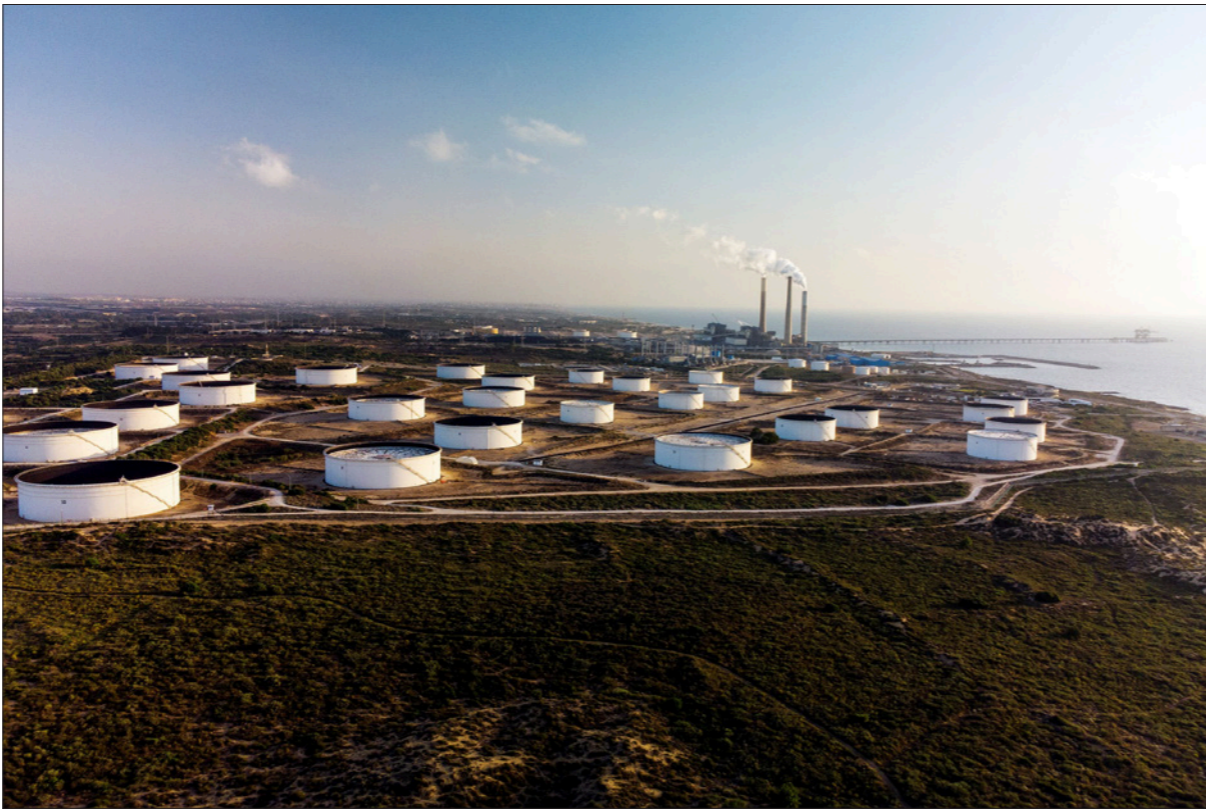
صورة جوية لخزانات النفط التابعة لشركة «إي.إيه.بي.سي» الإسرائيلية في ميناء عسقلان

■ القدس – رويترز: استقبلت سفن البضائع الأولى الآتية من دبي عندما رست العام الماضي في ميناء حيفا على البحر المتوسط بالاحتفالات في إسرائيل. وارتفعت الأعلام مررقة وتجمع الصحافيون وسار رئيس الوزراء السابق بنيامين نتنياهو على رصيف الميناء وألقى كلمة عن «شمار السلام».