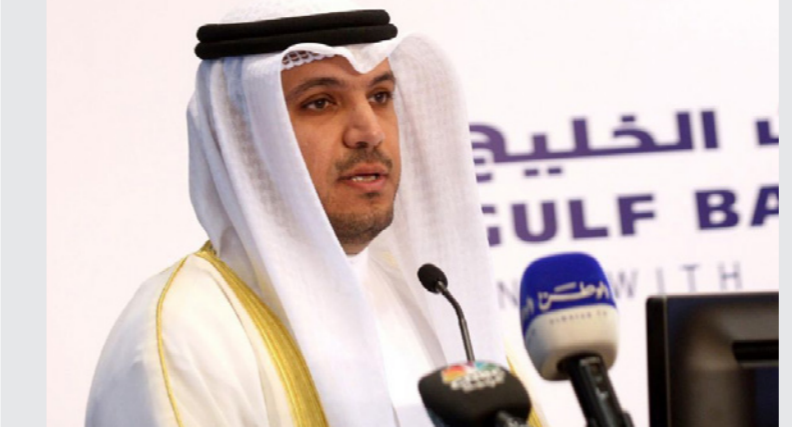
محافظ البنك المركزي محمد الهاشل

المتاحه لديه لتقليل آثار الوباء. وأوضح أن التقديرات والإحصاءات الأولية أشارت أيضاً إلى أن التضخم زاد إلى نحو 2.1 في المئة في العام الماضي مقارنة بنسبة 1.1 في عام 2019.