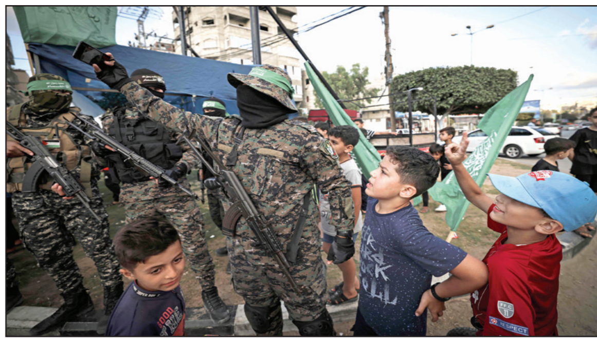
أطفال يلتقطون صورة مع مقاتلين من «كتائب القسام» خلال فعالية للتسجيل في معسكر صيفي للتدريب

التعاون والشراعة بين البلدين. وبعثت ولي عهد البحرين بريقة تهنئة إلى نفتالي بينيت وياثير لايد بمناسبة تشكيل الحكومة الإسرائيلية، أعرب فيها عن خالص تمنياته لها بالتوفيق في مهامها.