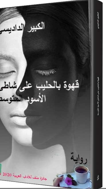
جزء من كتاب رواية «قهوة بالحليب على شاطئ الأسود المتوسط»

ازعجتني... بشرة سوداء لن يكون تحتها إلا لاقب أسود يعشق الانتقام، يجيد الاحتيال والخديعة، لو أتاحت له فرصة لاقتصرني شره للتطبيق خلال عدة أشهر، لكن يبقى السؤال المهم في هذا الصدد حول مواصفات المسرح المتنقل، وحجم الاستعدادات التي يقوم عليها، وطبيعة النصوص التي يتناولها، والنجوم الذين يتم التعاقد معهم للعمل بالتجربة وإنتاجها. هذا السؤال العريض الذي تندرج تحته عدة أسئلة تفصيلية لا بد من الإجابة عليه قبل الإعلان المسبق والحماسي عن التجربة، مع التأكيد الكامل على وجهة