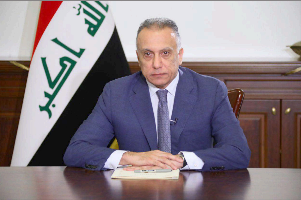
رئيس الوزراء العراقي مصطفى الكاظمي

وبين أن عمليته فتح المقابر لم تكن سهلة لأنها