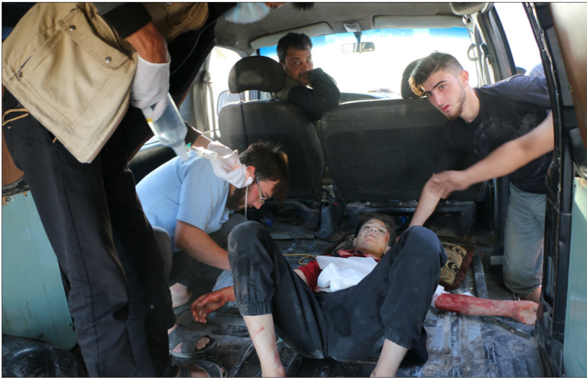
محاولة إسعاف أحد الأطفال الجرحى في قصف للنظام شمال غربي سوريا

تنظيم الدولة الإسلامية «داعش» في سورية، كما أن مجلس القبايل والعشائر السورية، الهجوم الإرهابي لتنظيم «ي ب ك/بي كا كا» على مستشفى في مدينة «عفرين» التابعة لحكومة الأسد في شمال سوريا. وأفاد في بيان صادر عنه، الأحد، أن تنظيم «ي ب ك/بي كا كا»، الذراع السوري لنظمة «بي كا كا» الإرهابية، مسؤول عن هذه «الجريمة»، كما حصل المجلس الأطراف الداعمة للتنظيم الإرهابي، شريكة في «الجزء»، التي يرتكباها «ي ب ك/بي كا كا»، وطلب الأطراف الداعمة للتنظيم، بوقف دعمهم لفعاليات «ي ب ك/بي كا كا» التي تؤدي إلى مقتل المدنيين.