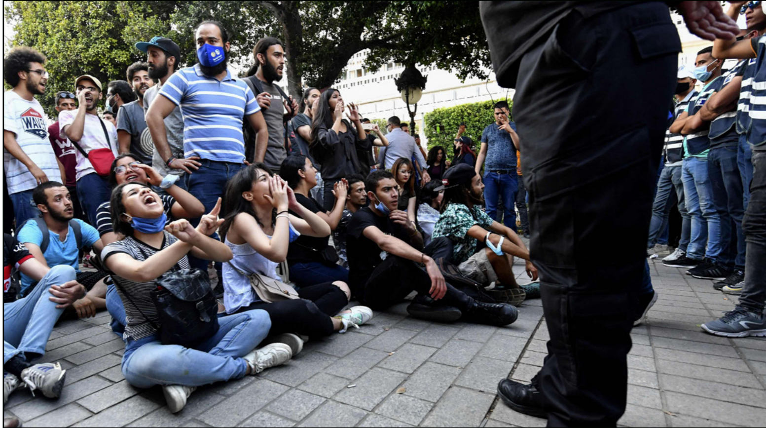
التظاهرون التونسيون يلوحون أثناء احتجاجهم على عنف الشرطة في شارع الحبيب بورقيبة في العاصمة تونس