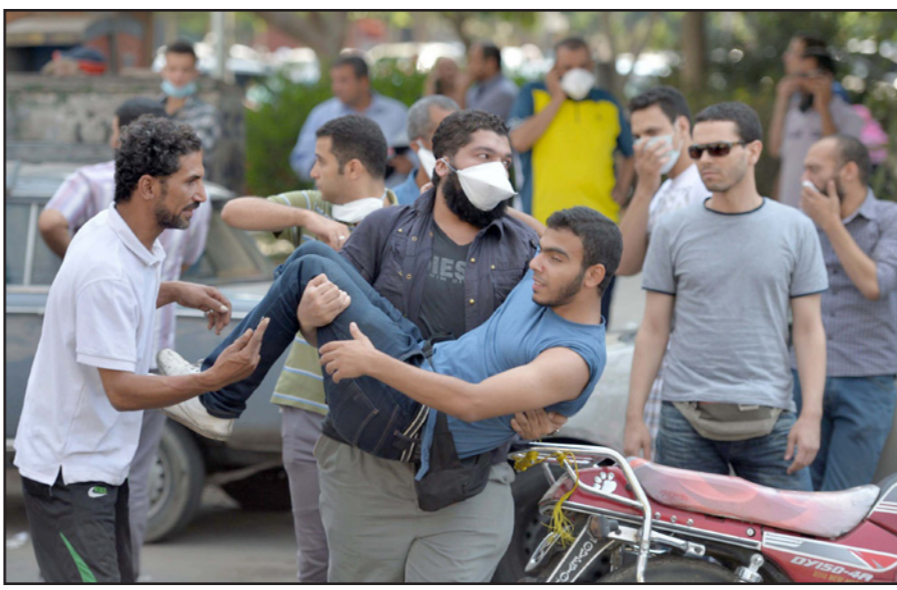
أرضية لعمليات الأمن المصري خلال فض اغتصاب رابعة