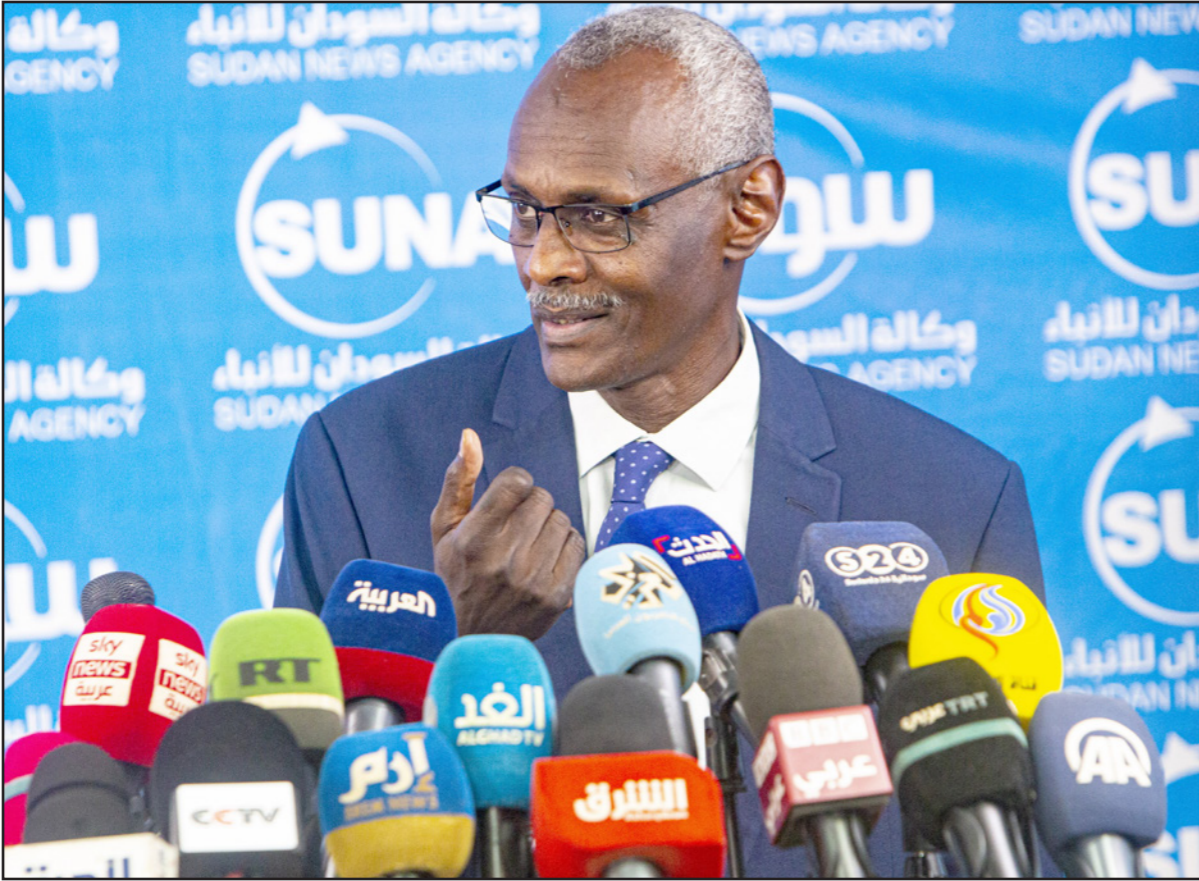
وزير الري السوداني ياسر عباس خلال مؤتمر صحفي أمس