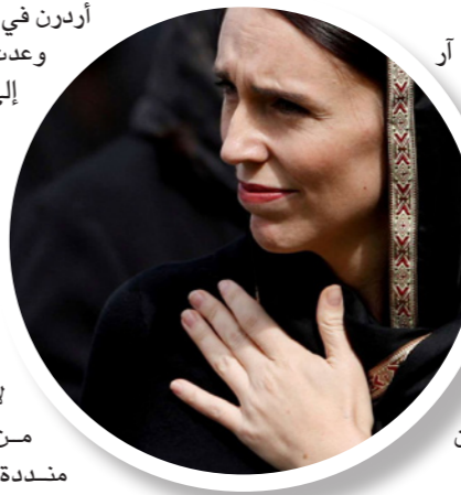
رئيسة وزراء نيوزيلندا جاسيندا أردن.

وحكم على الفاعل بريتنون تارنت بالسجن مدى الحياة بدون إمكان الإفراج المشروط عنه، وهي سابقة في نيوزيلندا.