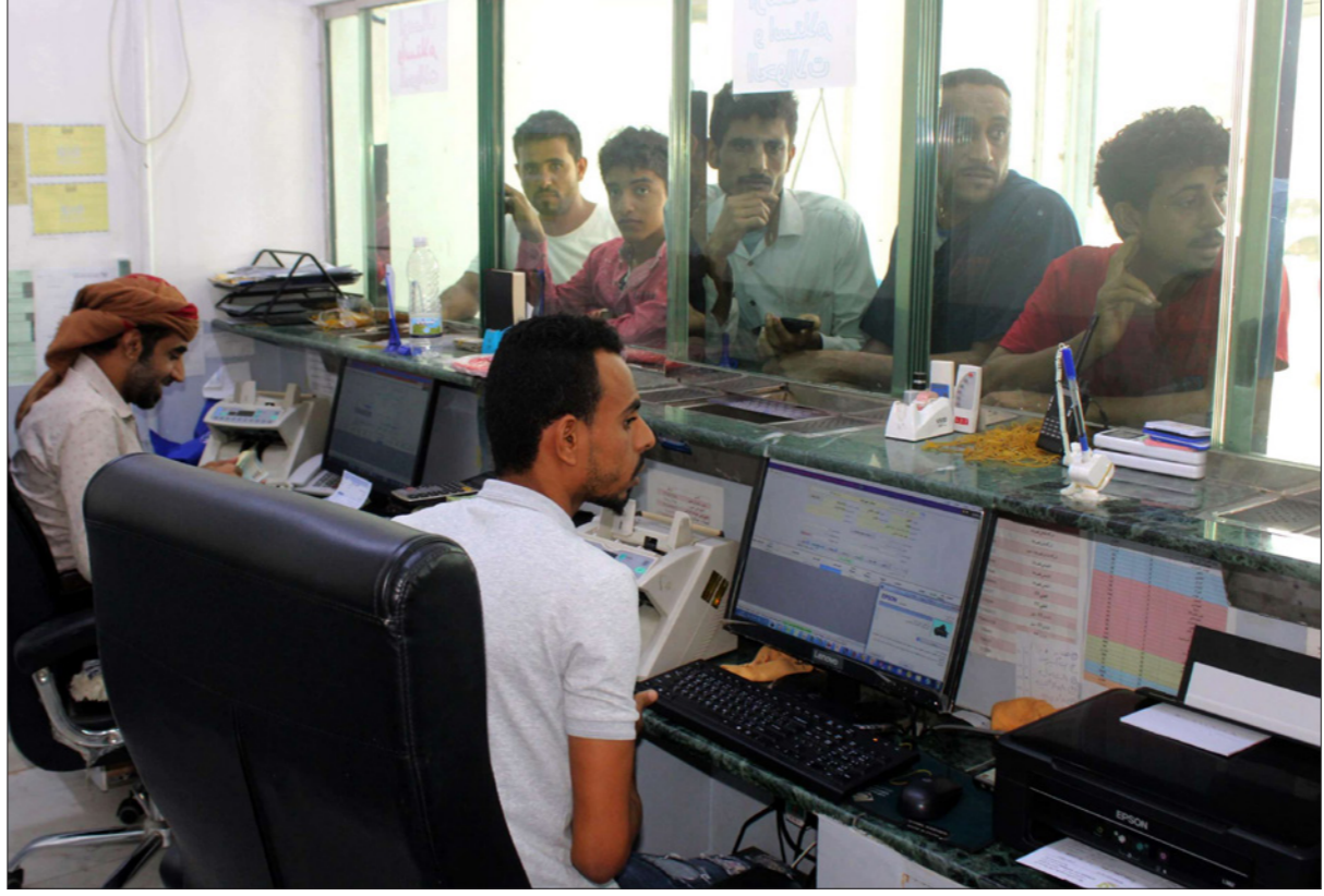
يمنيون في العاصمة المؤقتة عدن عند نافذة تغيير العملات لأحد البنوك المحلية

■ الأوساق الاستهلاكية، وأدت الحرب المستمرة في اليمن، والتي بدأتها السعودية، منذ سنوات إلى جعل الملايين على حافة الجوع، فيما قرابة 80 في المئة من السكان باتوا في حاجة إلى مساعدات إنسانية، وفق تقارير الأمم المتحدة. ونذكر «برنامج الغذاء العالمي» التابع للأمم المتحدة، في تقرير صدره مؤخراً، أن الأسعار ارتفعت بنسبة 200 في المئة منذ بدء الحرب في اليمن. ويرى الباحث الاقتصادي اليمني محمد الحريبي أن انهيار الريال يفاقم من رداءة الوضع الإنساني في بلد يحتاج فيه معظم السكان إلى المساعدات الطارئة». ويضيف «التخفيض المستمر في سعر العملة له تأثيرات مباشرة على قدرة الناس على شراء المواد الأساسية ومطالباتهم في مواجهة أعباء الحياة»، ويتابع القول «باتت انهيار العملة في ظل عدم وجود أية إجراءات في الحفاظ على استقرارها وإيقاف انهيارها المستمر».