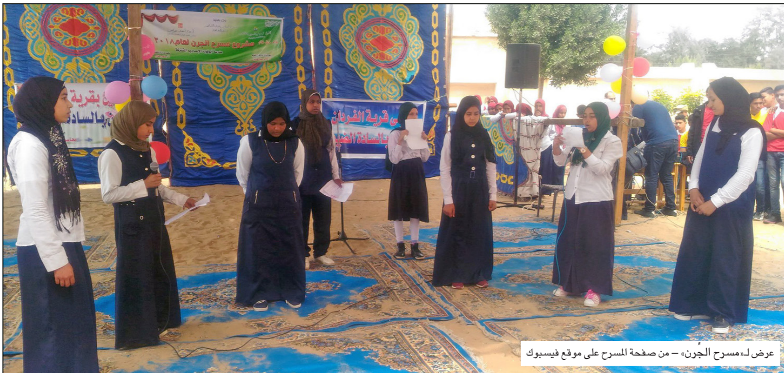
عرض لمسرح الجرن

الفكرة وشمولها من الناحية الفنية، فهي إذا ما نحت ستؤدي إلى حل أزمة المسرح، وتشغيل عدد كبير من المسرحيين والفنيين والعمال العاطلين عن العمل منذ فترة طويلة، بسبب الوباء الكوروني، ومخاوف الإصابة بالمرض القاتل. كما أن الوزارة في تصريحها وكلامها المؤيد لشروع المسرح المتنقل، لم تحدد المناطق المعنية بالنشاط، ولم تُفصّل ما إذا كانت الأقلام مُمرجة في الخطة المسرحية؟ أم أن المشروع الثقافي سيقتصر فقط على القاهرة والمدن الكبرى، كالإسكندرية باعتبارها