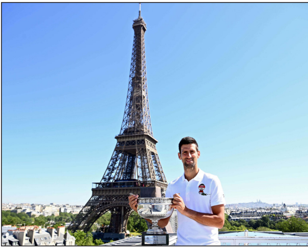
ديوكوفيتش يرفع كأس البطولة أمام برج إيفل رمز العاصمة الفرنسية باريس

■ الرباط - د ب أ: فاز الوداد على مضيفه حسنية أغادير 3/5 في الجولة التاسعة عشرة للدوري المغربي، وسجل أهداف الوداد وليد الكرتي في الدقيقة 38 ومؤيد اللافي في الدقيقة 59 وأشرف داري في الدقيقة 74 وسايون موسوفا في الدقيقة 87 وأبول الكعبي في الدقيقة الخامسة من الوقت بدل الضائع من ركلة جزاء، فيما سجل أهداف حسنية أغادير أشرف داري، لاعب الوداد، بالخطأ في مرماه في الدقيقة الرابعة ويوسف الفخلي في الدقيقة 56 من ركلة جزاء وأيوب الموي في الدقيقة 62. ورفع الوداد رصيده إلى 47 نقطة في صدارة الترتيب، وتوقف صيد حسنية أغادير بعد 28 نقطة في المركز الثامن.