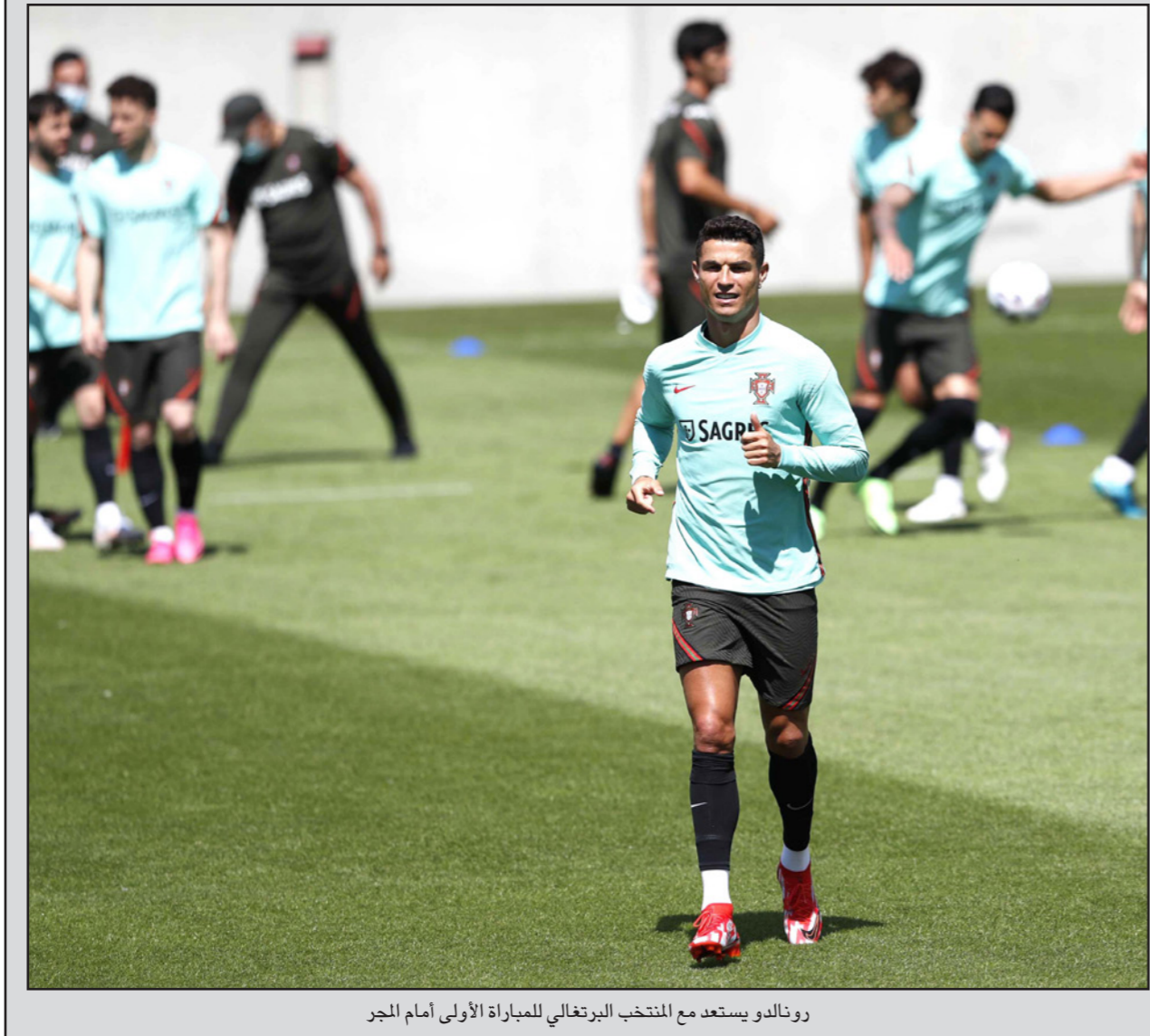
رونالدو يستعد مع المنتخب البرتغالي للمباراة الأولى أمام المجر