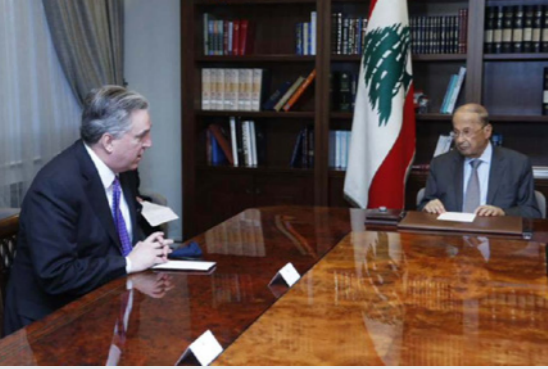
عون مجتمعاً بدوروشيه أمس في قصر بعثدا

عاد ملف ترسيم الحدود البحرية الجنوبية بين لبنان وإسرائيل إلى الضوء بعد وصول رئيس الوفد الأمريكي الراعي لمفاوضات الناقورة السفير جون دوروشيه إلى بيروت للقاء رئيس الجمهورية ميشال عون ورئيس وأعضاء الوفد اللبناني المفاوض في مقر قيادة الجيش في البرزة. وقد أبلغ الرئيس عون الوسيط الأمريكي لعملية التفاوض «رغبة لبنان في استئناف المفاوضات غير المباشرة في الناقورة بوساطة أميركية واستضافة دولية، وذلك بهدف الوصول إلى تفاهم حول ترسيم الحدود البحرية، على نحو يحفظ حقوق الأطراف المعنيين بالاستناد إلى القوانين الدولية»، وطلب الرئيس عون من الوسيط الأمريكي «أن يمارس دوره للدفع نحو مفاوضات عادلة ونزيهة، ومن دون شروط مسبقة لأن ذلك يضمن قيام مفاوضات حقيقية مستندة إلى الحق الذي يسعى لبنان إلى استرجاعه».