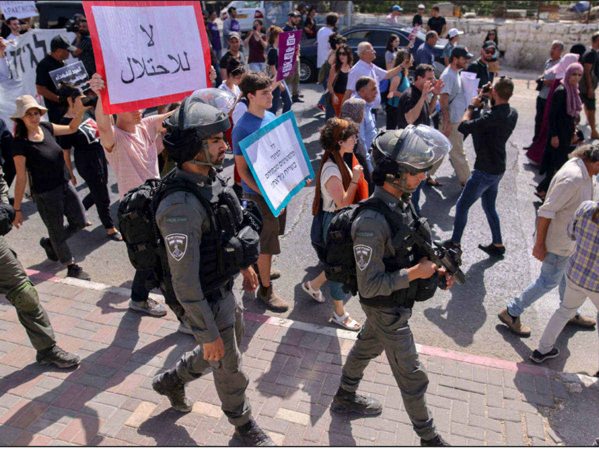
مسيرة احتجاجية ضد الاستيطان في القدس

على وسمي «أنقذوا حي الشيخ جراح» و«أنقذوا سلوان».. وفي السياق، دعا حراك في مدينة أم الفحم، وتحت عنوان «القدس راينج» للمشاركة في الجولة القدسية من باب العمود مروراً بأزقة البلدة القديمة وصولاً إلى المسجد الأقصى، وإقامة الصلاة رداً على «مسيرة الأعلام»، وقد حدد القاطنون عليها الساعة 2 بعد الظهر ل انطلاق الحفلات نحو المكان.