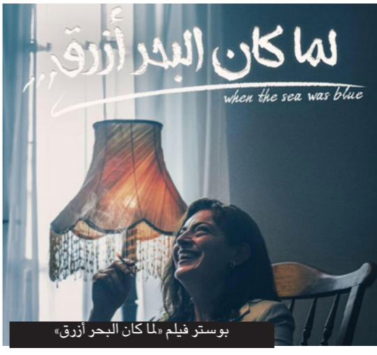
بوستر فيلم «لما كان البحر أزرق»