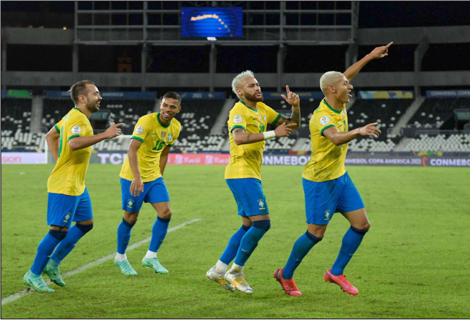
لاعبو المنتخب البرازيلي يحتفلون بالانتصار الكبير على بيرو