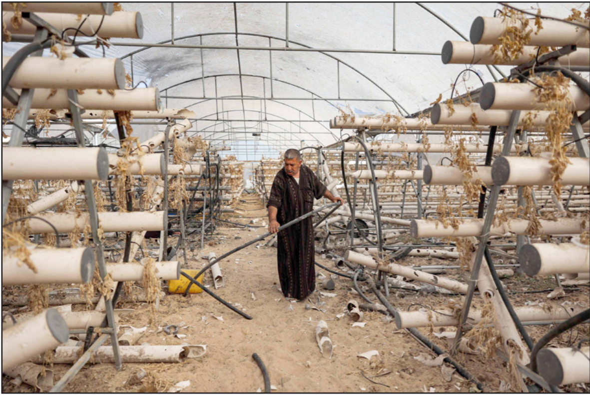
مزارع فلسطيني في غزة فقد محصوله في دفيئة