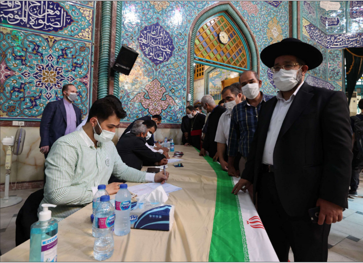
إيراني يهودي يسجل اسمه في مركز اقتراع في مسجد وسط العاصمة طهران خلال الانتخابات الرئاسية أمس

وقال عزيز 68 عاما ومدير شركة خاصة «قبل الانتخابات يناشد السياسيون الناس التصويت من أجل إيران. وفي اليوم التالي للانتخابات يقولون إن المشاركة هي انتصار للثورة الإسلامية» و«لن أشارك في تغذية تلك الدعاية مرة أخرى». وحذر خامنئي يوم الأربعاء الإيرانيين من الضغط الأجنبي على