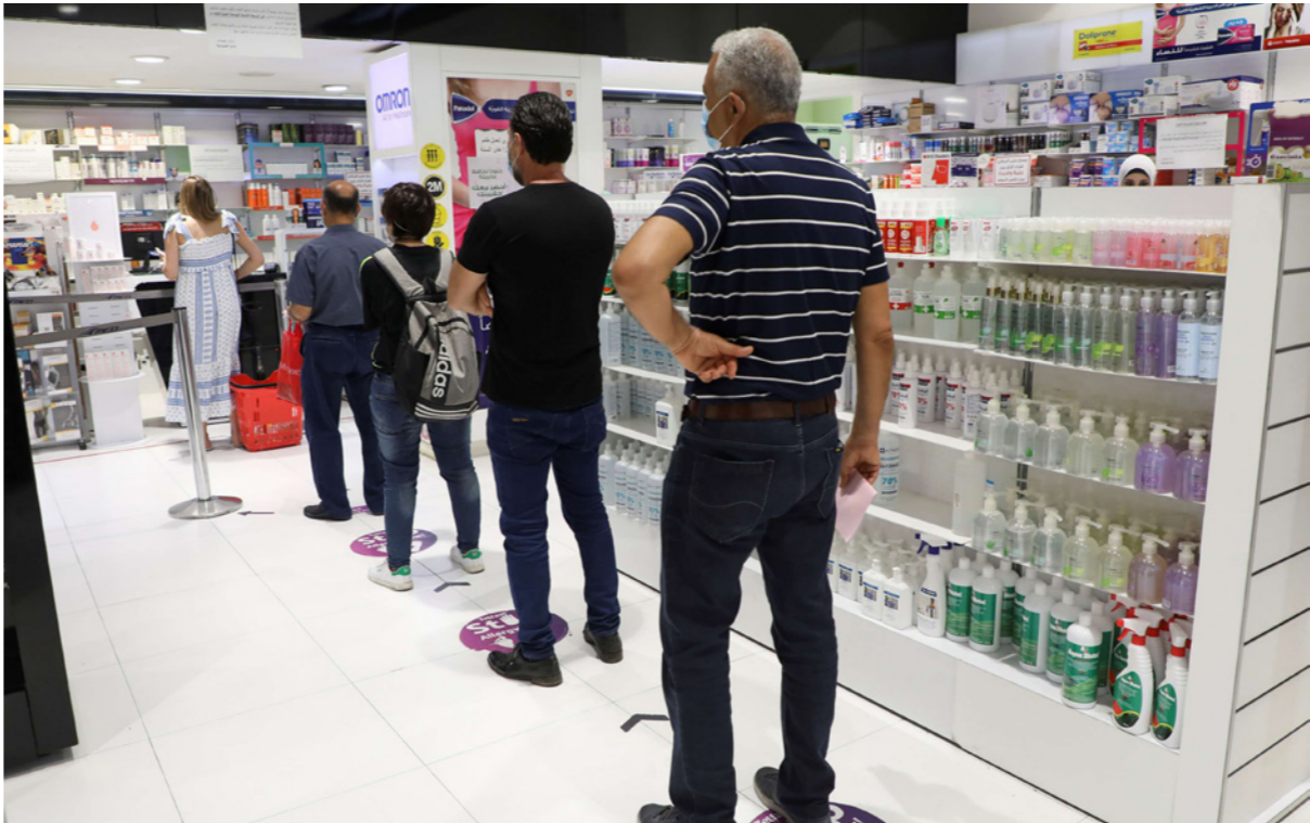
زبائن يصطفون في طابور داخل صيدلية في بيروت

إجراء التحقيقات اللازمة»، وقال حاكم مصرف لبنان إن سعر الدولار عبر منصة سيبقى عند 12 ألف ليرة للدولار الواحد.