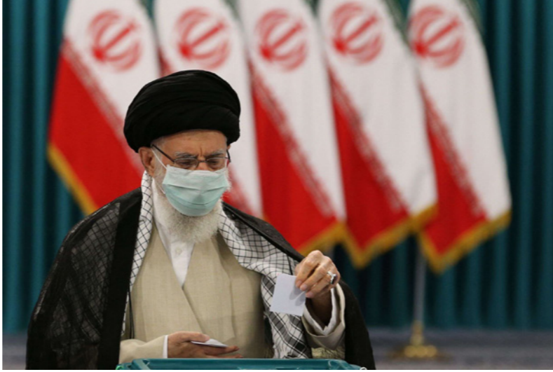
المرشد الأعلى آية الله خامنئي يبدلي بصوته أمس في طهران

يتولاه منذ عام 2019. ومنح مجلس صيانة الدستور الأهلية لخمسة مرشحين من المحافظين المتشددين واثنين من الإصلاحيين. وانسحب ثلاثة من هؤلاء، الأربعة، ويواجه رئيسي، رجل الدين الذي يعد مقرباً من خامنئي، المحافظين محسن رضائي القائد السابق للحرس الثوري، والنائب أمير حسين قاضي زاده هاشمي، والإصلاحية عبد الناصر همتي، حاكم المصرف المركزي منذ 2018 حتى ترشحه. وحصد رئيسي 38% من الأصوات في انتخابات عام 2017، وتولى مناصب عدة على مدى عقود، خصوصاً في السلطة القضائية، وكان مسانداً للعبئة الرضوية في مسقطه مدينة مشهد المقدسة (شمال شرق). وأثار المجلس انتقادات باستيعاده مرشحين بارزين مثل الرئيس السابق لمجلس الشورى علي لاريجاني، ونائب رئيس الجمهورية إسحاق جهانغوري، والرئيس السابق محمود أحمدي