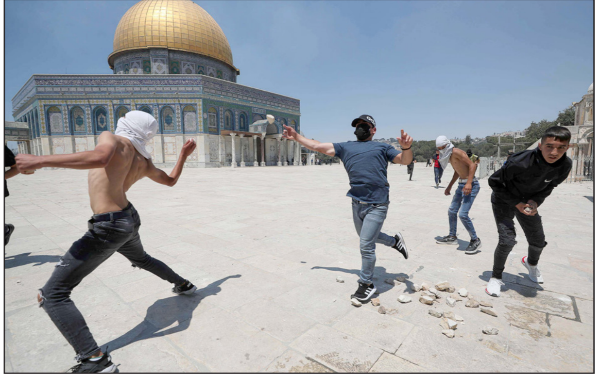
جانب من المواجهات بين الفلسطينيين وقوات الاحتلال في القدس أمس

على الأوضاع الاقتصادية في القطاع، كما لم تقم بإدخال أموال المنحة القطرية التي توزع على الأسر الفقيرة. وتزامن القصف مع محادثات تجري بين المسؤولين المصريين والإسرائيليين حول ملفات غزة، بما فيها التهذبة وصفقة تبادل الأسرى. ويعمل الوسطاء المصريون على منع انهيار وقف إطلاق النار، والذهاب نحو خطوات تعزز الهدوء، وتضمن السير في باقي الملفات. جاء ذلك في وقت كشفت فيه تقارير عبرية أنه تم التوصل لآلية تضمن نقل الأموال القطرية عبر الأمم المتحدة، وتشمل توزيع هذه المنحة القطرية عبر الأمم المتحدة وليس بإدخالها بقطاع، إذ يتوقع أن يتم إدخال المنحة إلى غزة خلال الأسبوع المقبل، فيما ذكرت تقارير غير مؤكدة أنه ربما يتم الذهاب إلى فتح معابر غزة كما كان الوضع سابقاً. لكن لم يصدر أي تعقيب على هذه الأنباء من منظمة الأمم المتحدة، أو من دولة قطر التي تقدم هذه الأموال كتبرعات لأسر غزة الفقيرة..