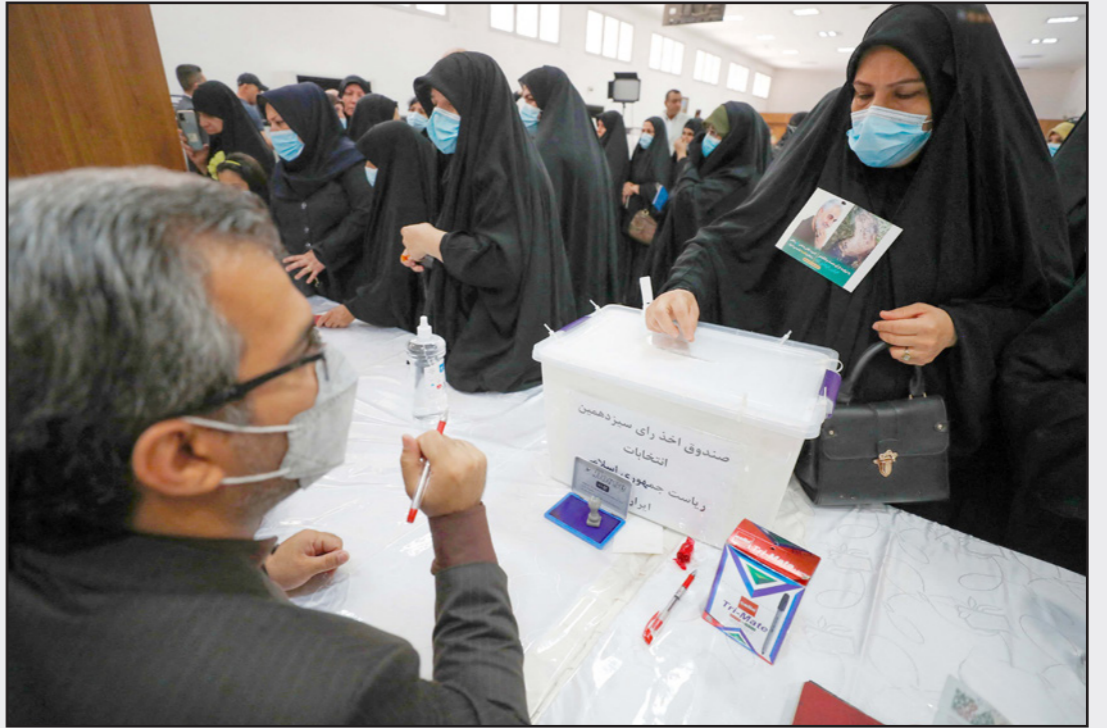
إيرانية تدلي بصوتها في مركز انتخابي في بغداد