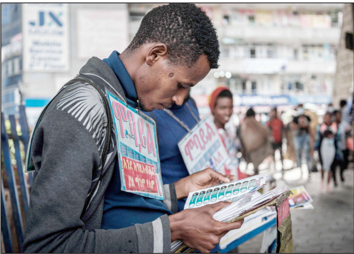
إثيوبي يقرأ قائمة الأحزاب المشاركة في الانتخابات

وسيجتار الناخبون ممثلهم في البرلمان الوطني والبرلمانات الإقليمية، وينتخب نواب البرلمان الوطني رئيس الوزراء، وهو رئيس السلطة التنفيذية، وكذلك الرئيس، وهو منصب شرفي إلى حد كبير.