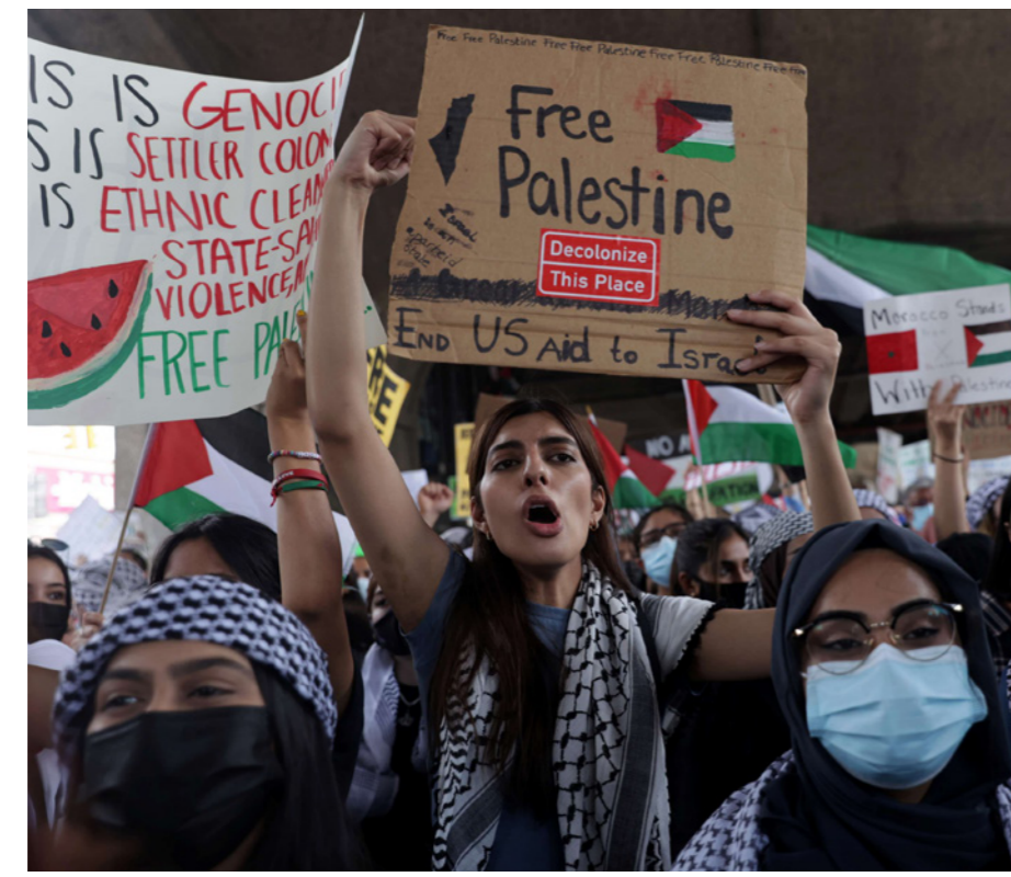
فلسطينيات في مظاهرة الشهر الماضي في حي كوينز في مدينة نيويورك عقب تصاعد العنف الإسرائيلي على غزة

نشرت صحيفة «الغارديان» تقريرا أعدته نينا روبريس عن الدعم الذي يقدمه أصحاب المتاجر والأعمال الفلسطينية - الأمريكية لجزءة، وقالت إن أصحاب المتاجر والأعمال ظلوا مترددين بالتعبير عن مواقف سياسية خشية أن يهدوا عنهم الزبائن، لكن الأمور قد تغيرت. وأضافت أن معظم الفلسطينيين الذين يملكون متاجر في الولايات المتحدة كانوا يلمحون عن ثقافتهم في محلاتهم مثل التطريز الفلسطيني التقليدي، الكوفية أو العود الذي يزين المطاعم. وفي منصات التواصل الاجتماعي يتم التعبير عن الهوية من خلال الصور القديمة والخراطة للفلسطينيين قبل عام 1948. ولكن التغيير عن السياسات الحالية والتاريخية لفلسطين - إسرائيل قد يكون أمرا مثيرا للإشكال. إلا أن الحرب الأخيرة في غزة وإسرائيل الشهر الماضي والتي خلفت 248 قتيل فلسطينيا و12 إسرائيليا دفعت أصحاب المحلات التجارية الفلسطينيين في الولايات المتحدة لإعادة النظر بما يمكن أن يعبروا عنه علنا عن النزاع. ففي الوقت الذي اهتمت الأخبار بالحكومة الإسرائيلية الجديدة واختيار رئيس الوزراء نفتالي