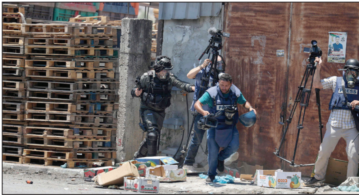
جندي إسرائيلي يدفع صحافيين لنعهم من تغذية احتجاجات فلسطينية في قرية بيتا جنوب نابلس أمس