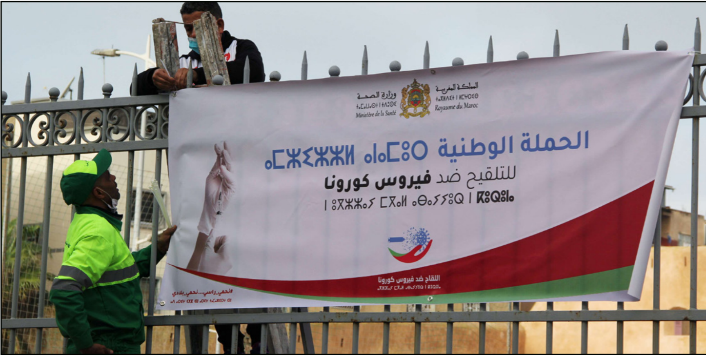
عمال يعلقون لافتة للحملة الوطنية للتطعيم ضد فيروس كورونا في مدينة سلا

على صعيد آخر، أعلنت وزارة الصحة المغربية، مساء أول الخميس، عن تسجيل 498 حالة إصابة جديدة مؤكدة بفيروس كورونا المستجد، و390 حالة شفاء، وأربع وفيات جديدة خلال 24 ساعة.