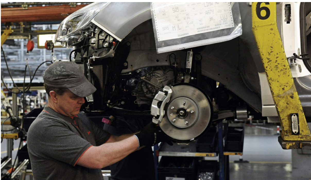
عامل يركب أجزاء سيارة على خط الإنتاج في مصنع شركة «فوكسهول» للسيارات في مدينة إلسمير بورت البريطانية والذي بدأ بزيادة إنتاجه مؤخراً

استبعدا سابقاً تحركاً قبل عام 2023. وناتى هذه التغييرات في أعقاب زيادة غير متوقعة في التضخم أكبر من الـ 2٪ التي يستهدفها البنك المركزي للمرة الأولى منذ نحو عامين، وتسارع النمو الاقتصادي الذي يوفر المزيد من فرص العمل. وتعكس التوقعات نقلاً عن مزايديا بأن بريطانيا