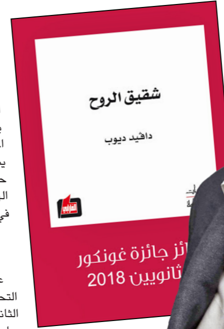
أثر جائزة غونكور 2018

من البداية تصادفنا شخصية «الفا ندياي» هذا المقاتل