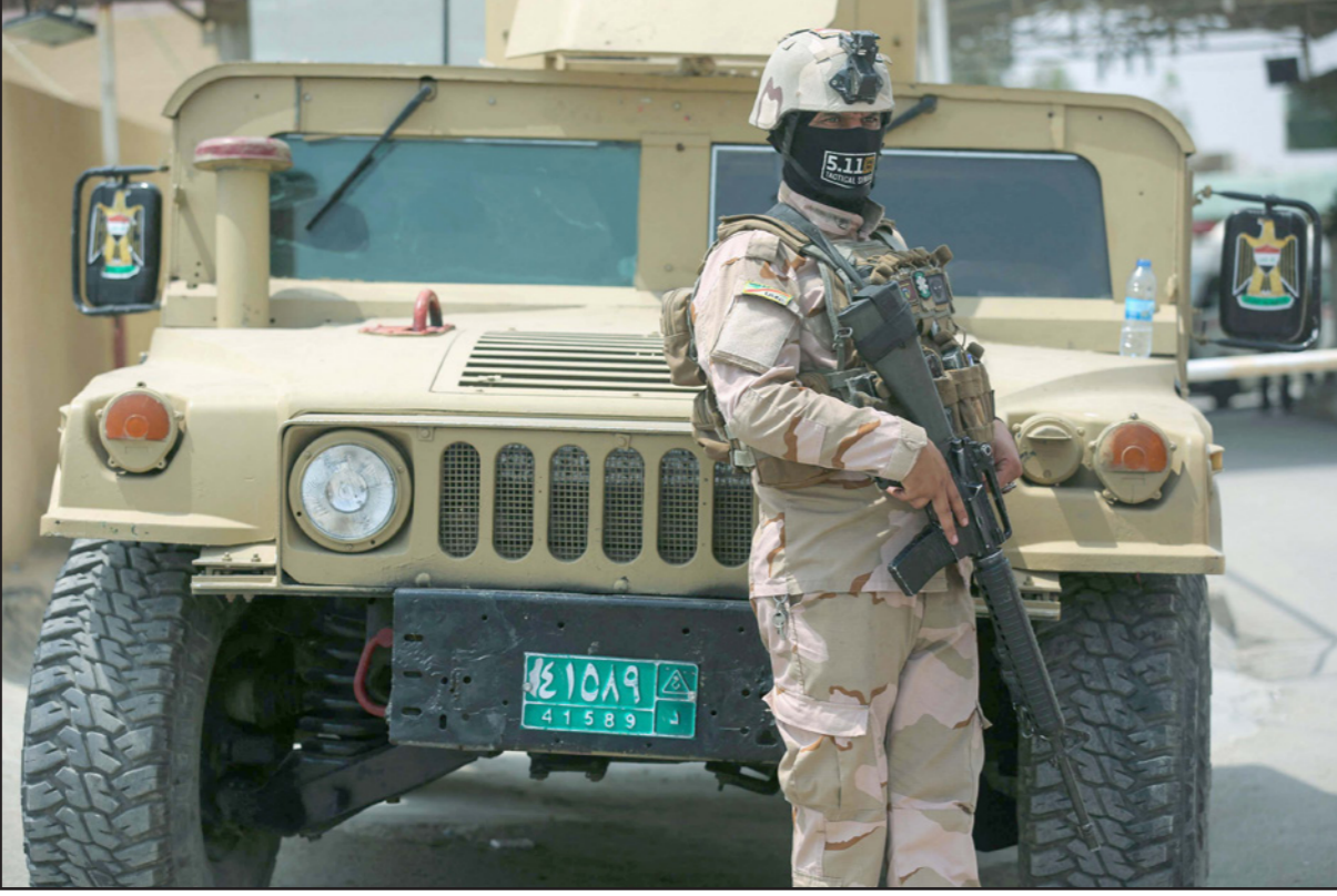
عنصر أمن عراقي في بغداد

وتابع أنه «تم التعامل معها من قبل مفارز الجهد الهندسي». أعلن الناطق باسم القائد العام للقوات المسلحة اللواء يحيى رسول، والمقروفات الحربية في ثلاث مناطق في الأنبار. وقال في بيان إن «قوة من قيادتي عمليات الأنبار والجزيرة معززة بمفازز الاستخبارات العسكرية، نفذت واجباً للبحث والتفتيش في مناطق الكرمة والرماضي وصرحاء كيبسة تم خلاله ضبط 163 عبوة ناسفة و39 قنبلة هاون و34 مقذوف مدفع و3 مساطر تفجير حيث قامت المفازز الهندسية بتفجير المضبوطات تحت السيطرة». كذلك، تمكنت قوة تابعة للاستخبارات العسكرية، من إلقاء القبض على اثنين من المسلحين غربي نينوى قادمين من سوريا. وذكرت خلية الإعلام الأمني في بيان، أن «تأكيداً لمهامها بالمشاركة في ضبط الحدود وإجهاض عمليات التسلل، ويتساء على معلومات استخبارية دقيقة لأحد مفاصل مديريةية الاستخبارات العسكرية في وزارة الدفاع - قسم استخبارات قيادة عمليات غرب