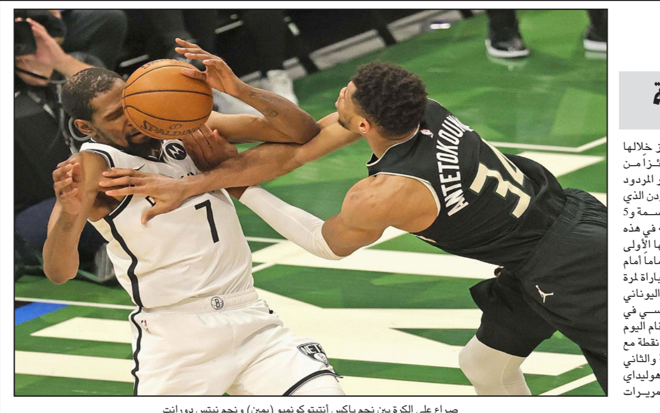
صراع على الكرة بين نجم باكس أنتيتوكومبو (يمين) ونجم نيتس دورانت

■ باريس - أ ف ب: أوقفت وحدة النزاهة في الاتحاد الدولي لألعاب القوى الجنوب إفريقي لوفو مانينوغا حامل فضية الوثب الطويل في أولمبياد ريو 2016، أربع سنوات لخرقه قوانين الكشف عن المنشطات، بحسب ما أعلنت الهيئة، واتهمت وحدة النزاهة مانينوغا بالتغيب عن اختيار مفاجئ للمنشطات في 29 تشرين الثاني/نوفمبر 2019، ولم يكن دقيقاً في تحديد موقعه مرتين عام 2020، علماً أن القوانين تقضي بوقف أي رياضي يتغيب عن الاختبارات المفاجئة ثلاث مرات تواليها في غضون عام واحد، وكانت اللجنة أوقفت مانينوغا بطل العالم في اختصاصه أيضاً عام 2017، مؤقتاً في كانون الثاني/يناير الماضي، قبل أن تؤكد أسس ليغيب بالتالي عن دورة الألعاب الأولمبية المقررة في طوكيو الشهر المقبل. ويخضع رياضيي النخبة في كل مسابقات ألعاب القوى إلى واجبات صارمة لتحديد أماكن تواجدهم (العنوان، العسكرة، التدريبات، المناسبات)، مع ضرورة وضع جدول زمني لتحديد الساعة والمكان من أجل الخضوع لفحص مفاجئ عن المنشطات.