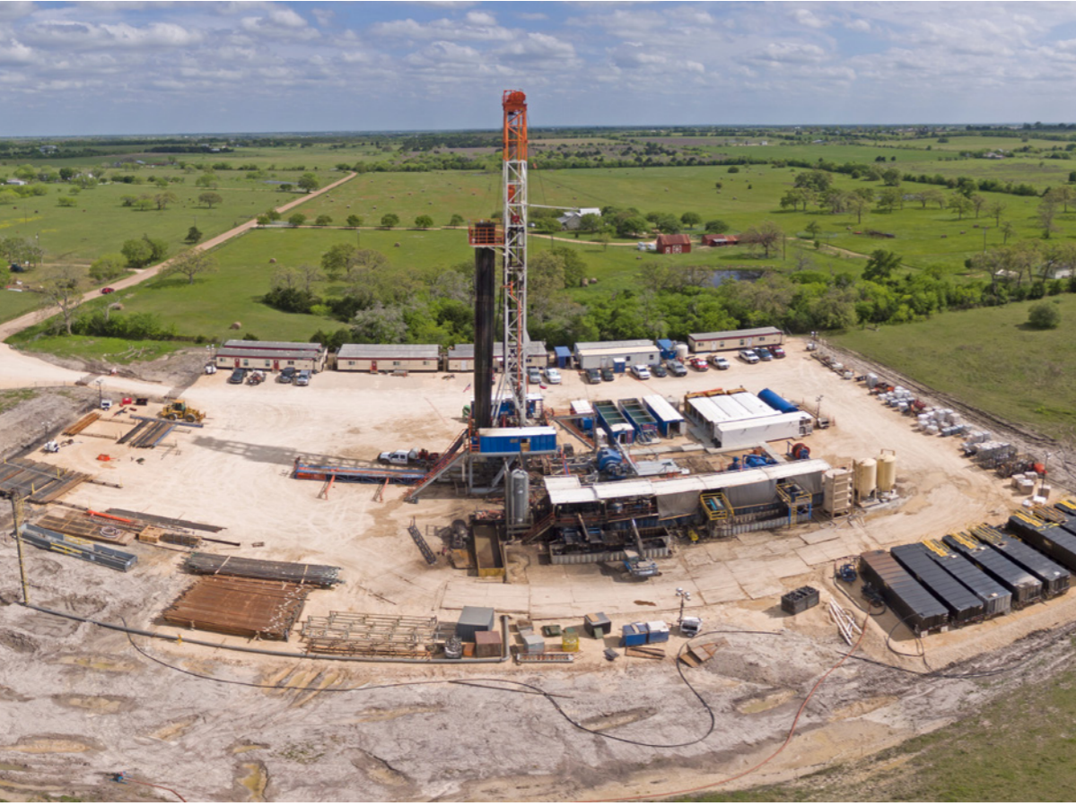
حقل للنفط والغاز الصخريين قيد التطوير في ولاية نورث داكوتا الأمريكية

■ عواصم - رويترز: نزلت أسعار النفط للجلسة الثانية على التوالي أمس الجمعة إذ صعد الدولار الأمريكي بفضل احتمال زيادة أسعار الفائدة في الولايات المتحدة، لكن الخام يضي على مسار اختتام الأسبوع دون تغيير يذكر، وعند ما يقل قليلاً فحسب عن أعلى مستوياته في عدة سنوات.