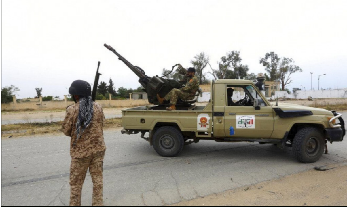
أرشيفية لقوات اللواء المتقاعد خليفة حفر

تنصل جديد يحاول حفر أن يصنعه أمام المراقبين على المستوى