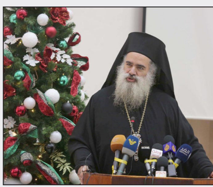
المطران عطا الله حنا