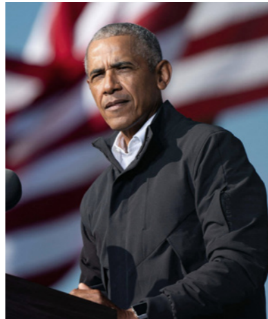
الرئيس الأمريكي الأسبق باراك أوباما

مزات عديدة لإلغائه سواء عبر الكونغرس أو في المحاكم. ورحب نواب ديمقراطيون بقرار المحكمة، وقالت رئيسة مجلس النواب الديمقراطية نانسي بيلوسي «يفضل دفاع الأمريكيين في