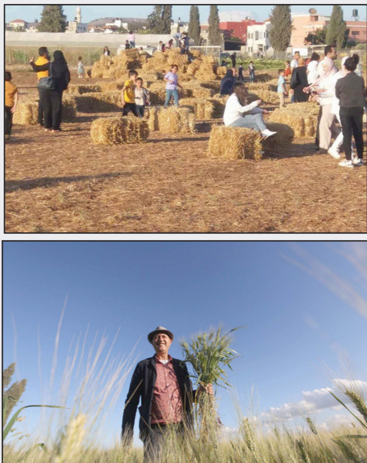
صورتان من مهرجان القمح في جنين

من: الهيتي السمرة، والبركة، وناب الجمل من أجل التذكير، والسبب في ذلك الاختيار كونها أنواع تحقق جدوى زراعية واقتصادية».