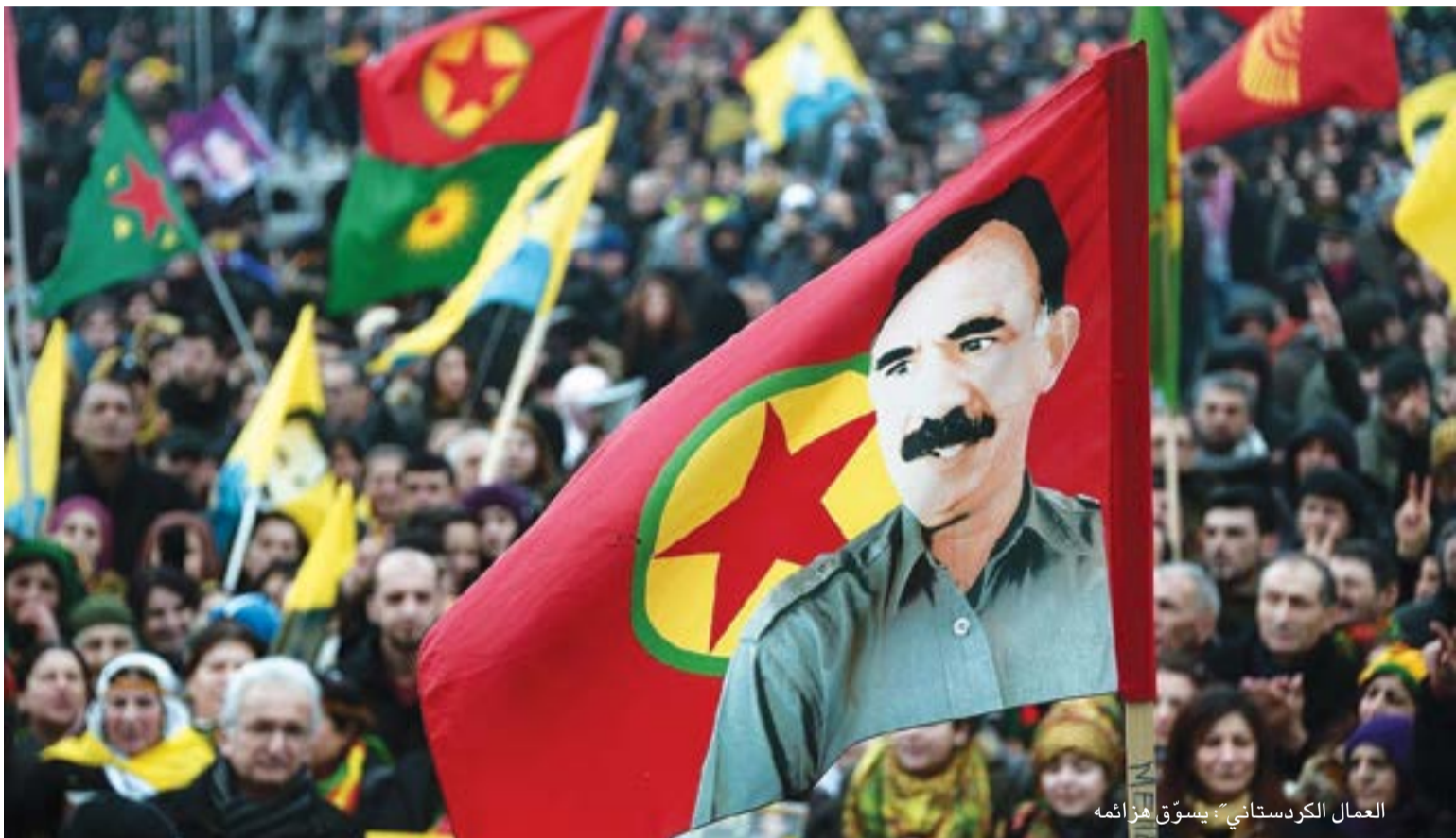
العمال الكردستاني؛ يسوقُ هُزائمَهُ

أثار الهجوم الذي نفذته قوات حزب العمال الكردستاني «PKK» على مجموعة من البيشمركة في منطقة العمادية/ أمدي، وأسفر عن ضحايا وجرحى، العديد من التساؤلات حول طبيعة ما جرى، ويجري، بين «PKK» والحزب الديمقراطي الكردستاني «KDP» في إقليم كردستان العراق. فهذا الهجوم لم يكن الأول، وعلى الأغلب لن يكون الأخير، وذلك إذا ما استمر «PKK» على توجهاته الحالية، وظل محافظاً على التزاماته الإقليمية مع النظام الإيراني.