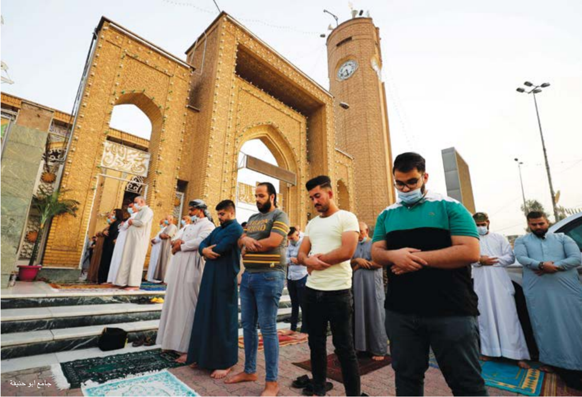
جامع أبو حنيفة

وضمن السياق لم تكن مصادفة، إعلان السلطات الأمنية عن كشف مقبرة جماعية جديدة تضم رفات 123 ضحية قرب سجن بادوش في الموصل من ضحايا «داعش» والادعاء بأنهم من الشيعة فقط، رغم ان الضحايا من مكونات مختلفة، كما لم تكن مناطق حزام بغداد (السنية) كالتطارية وأبو غريب، في منأى عن محاولات قوى ولائية، لإحداث التغيير الديموغرافي فيها، عبر الاستيلاء على أراضيهم الزراعية، بحجة «استثمار أراضي مطار بغداد» وفق تصريحات السياسيين السنة.