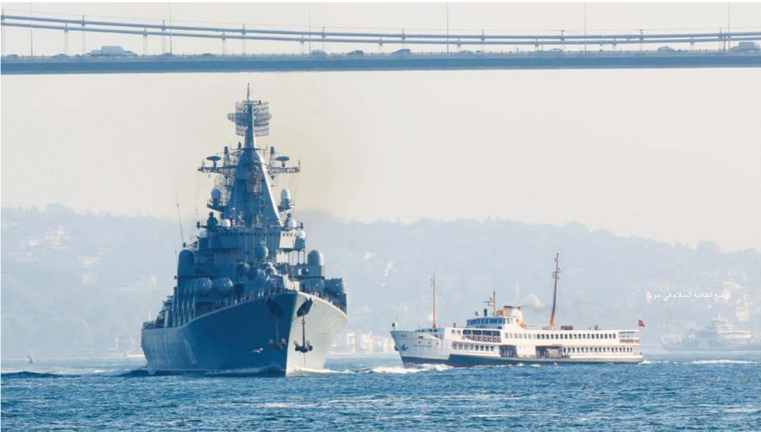
توقيع اتفاقية السلام في جوبا

مصدر الخطر الرئيسي هو الصين مستقبلاً؛ وشكل اللقاء بين بوتين وبايدن في جنيف السويسرية هذا الأسبوع فرصة للحديث عن منها اتفاقيات واقعية وهي الحد المفترض من الأسلحة النووية أو في شيء أشمل.