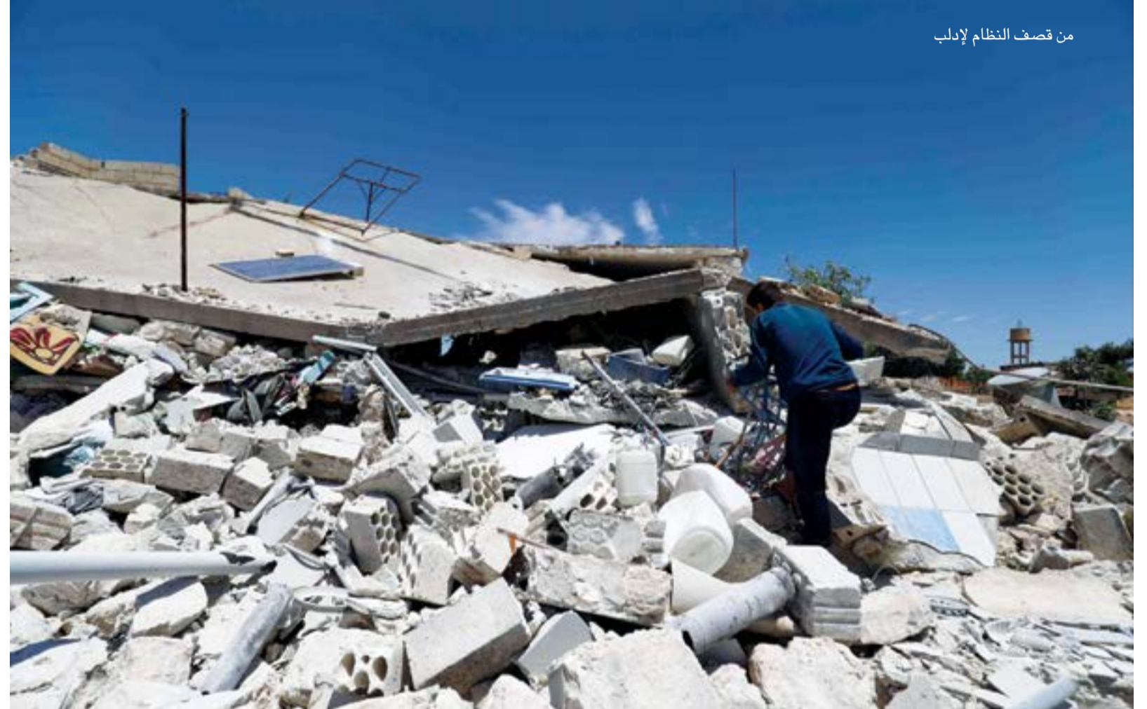
من قصف النظام لإدلب

تعزيزات عسكرية ومئات المقاتلين وصلوا إلى المدينة الصحراوية، أغلبهم من الدفاع الوطني والحرس الجمهوري، تجمعوا في المطار العسكري للبلدة التي تسيطر عليها القوات الروسية قبل ان تعيد القوات الروسية نشرهم على طريق تدمر- دير الزور. كما نقلت إسران عناصر الحرس الثوري من مطار التففور (مطار تياس الحربي) إلى محطة الضخ الثالثة للمشاركة بعمليات التمشيط الجديدة واتخاذ نقاط متقدمة قرب الحقول النفطية لمنع مهاجمتها من قبل مقاتلي التنظيم. ومن المرجح، ان تؤجل العمليات الروسية في البادية ضد تنظيم «الدولة الإسلامية» أي هجوم محتمل على إدلب في الوقت الحالي، في حال استمرار هجمات التنظيم وضربه لقواعد النظام العسكرية وشنه هجمات على قوافل النفط الخام وتفجيرها. ويزيد من التحدي الروسي الهجمات التي تستهدف حقول النفط والغاز والفوسفات التي جنت موسكو عقوبها عبر شركات مقربة من الكرملين والرئيس فلاديمير بوتين، وهو ما يشكل أكبر العوائق في وجه روسيا منذ تدخلها في الحرب السورية بعد انتصاراتها العسكرية في أغلب المناطق السورية ومساعدة النظام على استعادة 70 في المئة من الجغرافيا السورية. تقف عاجزة عن جني أرباح هذا التدخل اقتصادياً.