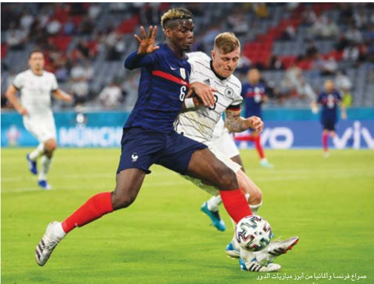
صراع فرنسا وألمانيا من أبرز مباريات الدور

بعد الاستشفاء من صدمة الغياب عن كأس العالم، فلا يوجد ما يمنح اللاعبين من مواصلة اللعب بنفس الطريقة، بلا ضغوط أو قيود، أملا في تحقيق ما يفوق توقعات أكثر المتفائلين، ولا تنسى عزيزي القارئ، أن الأرقام والإحصائيات تؤكد أن المنتخب الإيطالي لن يكون خصما في المتناول لأي منتخب، بحفاظه على شباكه نظيفة في آخر 10 مباريات، حيث يرجع تاريخ آخر هدف استقبلته شباك المنتخب مانشيني إلى الحادي عشر من أكتوبر/ تشرين الأول العام الماضي، وكان في مباراة التعادل مع هولندا ضمن بطولة دوري الأمم الأوروبية، في المقابل سجل لاعبو إيطاليا 31 هدفا في هذه المباريات، فهل يواصل مانشيني ورجاله البناء على هذه الأرقام وتكون سببا في حصولهم على تأشيرة السفر إلى لندن للقتال في نصف النهائي ولم لا النهائي؟ هذا ما ستجيب عنه أقدام اللاعبين داخل الملعب في الأدوار القادمة بعد التأهل المبكر لدور الـ16.