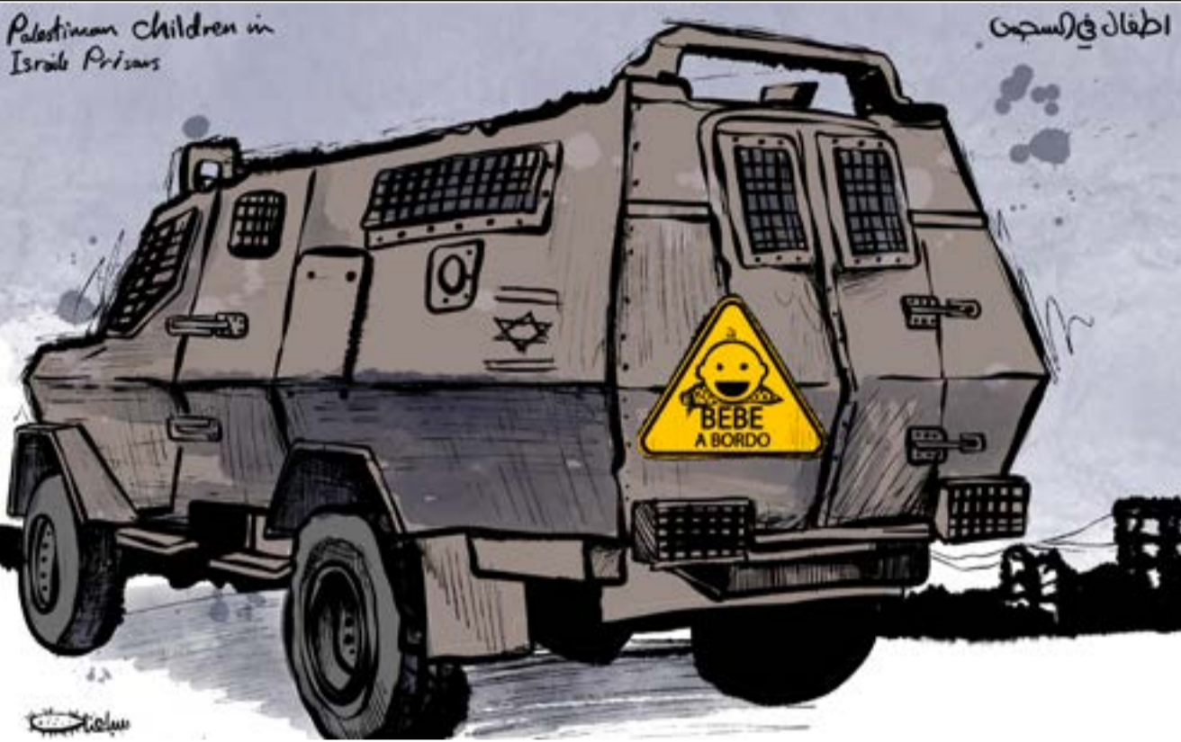
كاريكاتير: محمد سباعنة

وبعد حصول ما حصل، بدأ يتغنى بانتصاراته الوهمية التضليلية؛ ويخوّن كل من لا يوافق على أفعاله التي تثير الكثير الكثير من الشبهات والتساؤلات. من الواضح أن الحزب المعني مارس ويمارس السياسة عينها في إقليم كردستان، يستفز تركيا لتدخل قواتها إلى مناطق الإقليم، ومن ثم يمارس حملة دعائية تضليلية منظمة ضد الحزب الديمقراطي الكردستاني،