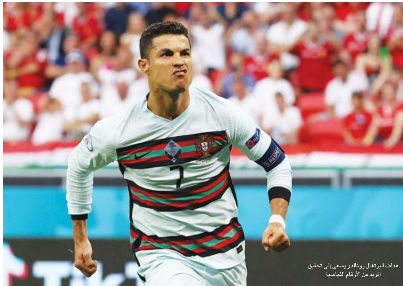
هداف البرتغال رونالدو يسعى إلى تحقيق المزيد من الأرقام القياسية