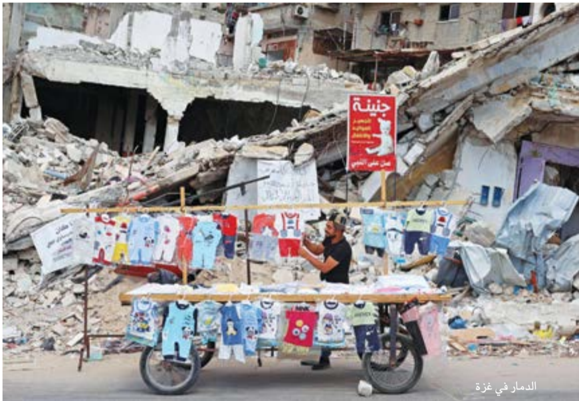
الدمار في غزة