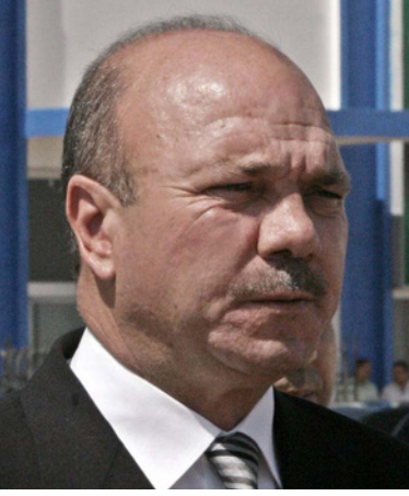
رئيس مجلس الأعيان الأردني فيصل الفايز

أكد خان أن مصالح بلاده وأمريكا واحدة في أفغانستان: «نريد القواض على الإصلاح لا الحرب الأهلية، ونريد الاستقرار ونهاية الإرهاب الوجه ضدها، ونندعم اتفاقية تحافظ على المكاسب التي تحققت في أفغانستان خلال العدين الماضيين. ونريد تنمية اقتصادية ومزيداً من الترابط التجاري في وسط آسيا لتطور اقتصادنا.