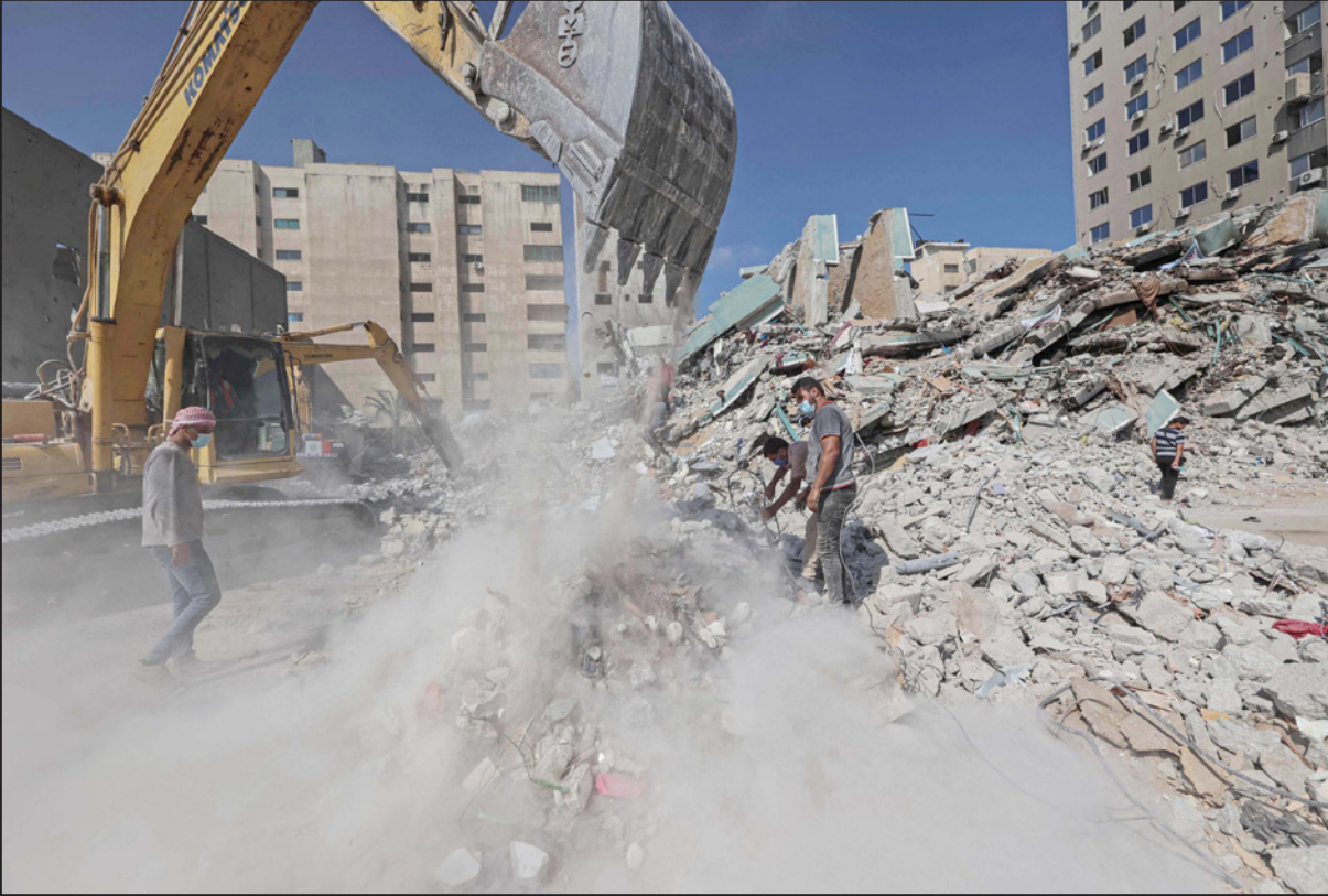
جرافات تقوم بأعمال إزالة ركاب أحد الأبراج التي دمرتها طائرات الاحتلال في غزة

موضحاً أنه سيتم تدارس الوسائل الشعبية للضغط على الاحتلال. وأشار إلى أنه جرى خلال اللقاء نقاش القضايا التي سببت انفجار الأحداث، وتحديد عدم التزام الاحتلال بالقانون الدولي، وانتهاكاته الصاخبة. وأضاف «أوصحنا لننسيق الأمم المتحدة أنه لا بد من حل جذور المشكلة ونزع صواعق الانفجار» وتابع «أخبرنا ممثلي الأمم المتحدة أننا لن نقبل باستمرار الأزمة الإنسانية بغزة، لافتاً إلى أن الاحتلال يعاقب كل الفلسطينيين في غزة. وجدير بالذكر أن وزير الجيش الإسرائيلي بيني غانتس أتقى على شرط على عملية إعادة إعمار قطاع غزة، بأن يتم إنجاز صفقة تبادل أسرى، وقال مؤعداً «إذا لم تفهم حماس ذلك فسنتعلم يفهمون».