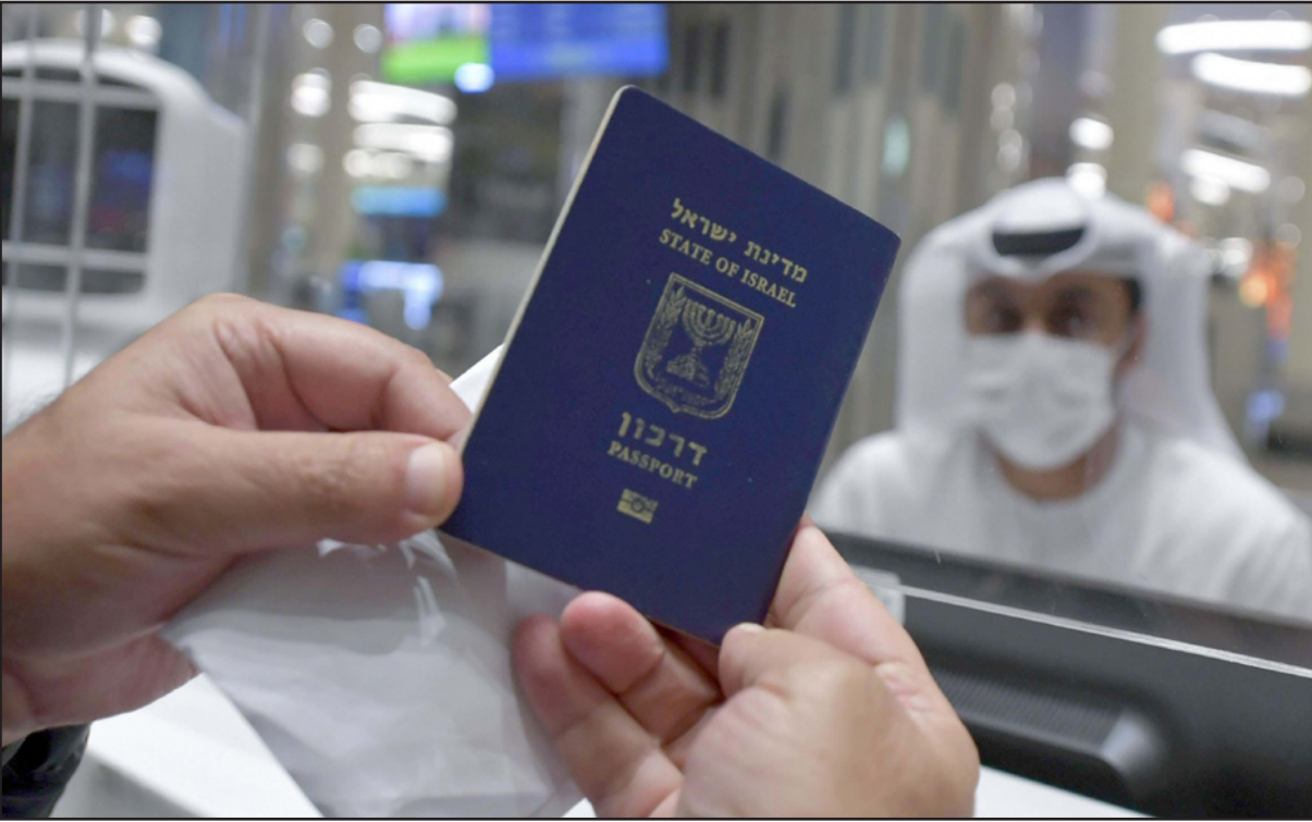
إسرائيلي يعرض جواز سفره قبل أن يسلمه لمسؤول الجوازات في مطار دبي

يجب عمل كل شيء لمنع حصول إيران على قدرات نووية عسكرية». وكانت وزارة الخارجية الإسرائيلية قد أعلنت أن الوزير يائير لابيد سيقيم زيارة رسمية إلى الإمارات العربية المتحدة الأسبوع المقبل، لافتتاح القنصلية الإسرائيلية في دبي بشكل رسمي. وقالت في بيان لها إن لابيد سيقيم زيارة رسمية إلى دبي يوم الثلاثاء المقبل لافتتاح القنصلية الإسرائيلية في دبي بشكل رسمي، وأشارت إلى أن هذه الزيارة «تعتبر أول زيارة رسمية لوزير خارجية إسرائيلي لدولة الإمارات العربية المتحدة»، وأضاف البيان أن «لابيد سيحلب ضيفا على وزير الخارجية عبد الله بن زايد، وسيفتتح خلال الزيارة مقاري سفارة إسرائيل في أبو ظبي والقنصلية في دبي». وقالت في البيان أيضا إن «لابيد سيحلب ضيفا على وزير الخارجية عبد الله بن زايد، وسيفتتح خلال الزيارة مقاري سفارة إسرائيل في أبو ظبي والقنصلية في دبي». وقالت في البيان أيضا إن «لابيد سيحلب ضيفا على وزير الخارجية عبد الله بن زايد، وسيفتتح خلال الزيارة مقاري سفارة إسرائيل في أبو ظبي والقنصلية في دبي». وقالت في البيان أيضا إن «لابيد سيحلب ضيفا على وزير الخارجية عبد الله بن زايد، وسيفتتح خلال الزيارة مقاري سفارة إسرائيل في أبو ظبي والقنصلية في دبي».