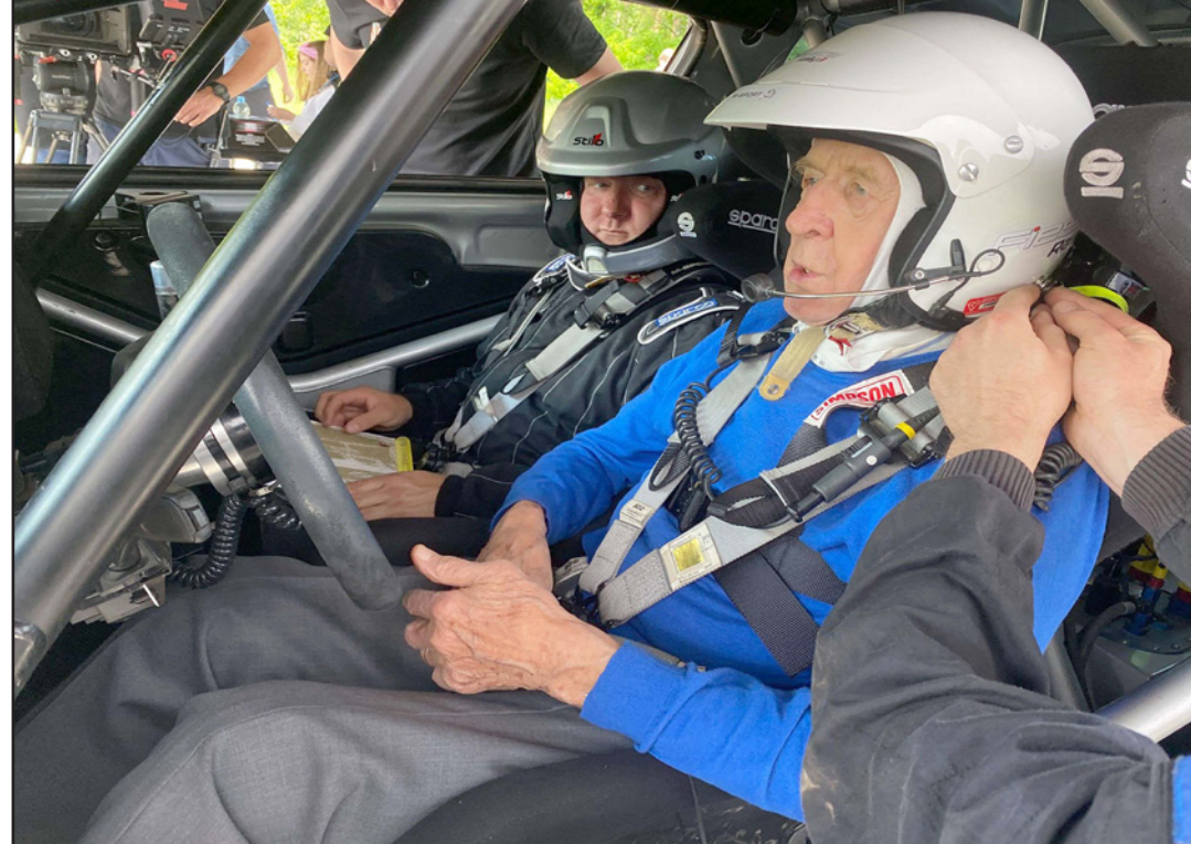
التسعين زاسادا يستعد لتجربة سيارته في رالي كينيا

طرقات الحصى في المرحلة الثالثة، سمعت فجأة زجتي تصرخ: حبي، يجب الصمود". وكشفت: "اعتقدت أنها كانت تتحدث معي لأنها كنا متعبين، لكن لا، كانت تتحدث إلى السيارة". لكن زوجته أربعة متابعيها بصحبتها في عودته إلى الطرق الكينية، بل سيتولى المهمة توماش بورييسلافسكي. بعد سقوط الشيبوية في 1989، أصبح زاسادا رجل أعمال يعمل شركات سيارات مثل مرسيدس وفولكسفاغن في بولندا. ولا يزال عضوا في مجلس الإشراف على إدارة شركته والتي تقوم بكل شيء من بيع السيارات إلى تطوير العقارات وإنتاج الملابس الرياضية. كما قام بتأليف العديد من الكتب والكتيبات الفنية الخاصة بالقيادة، واحتل المرتبة الأولى على قائمة مجلة "فوربس" لأغنى الشخصيات في بولندا. وبعدها ابتعد بعض الشيء عن القيادة، انتقل إلى الإبحار وفاز في 2001 بسباق بالما دي مايوركا كاربيرا، ثم بسباق عبر الأطلسي عام 2005 بين أوروبا وجزيرة سانت لوسيا في البحر الكاريبي. وبينما يستعد للعودة إلى رالي كينيا مجددا، أقر البطل السابق إن "كل شيء قد تغير" ودرجات الحرارة في إفريقيا. واستذكر أنه في 1997 خاض الرالي مرتديا سراولا قصيرا وقميصا من دون أكمام، أما الآن، يجب على جميع السائقين ارتداء بدلات السباق وهناك الكثير من أنظمة السلامة، لكن ما يقلق زاسادا أكثر من أي شيء آخر هو "تعلم الدخول إلى السيارة". ولا يبدو أن الرالي الكيني سيكون التجربة الأخيرة له، بل ساشترك في رالي آخر عندما يبلغ المئة.