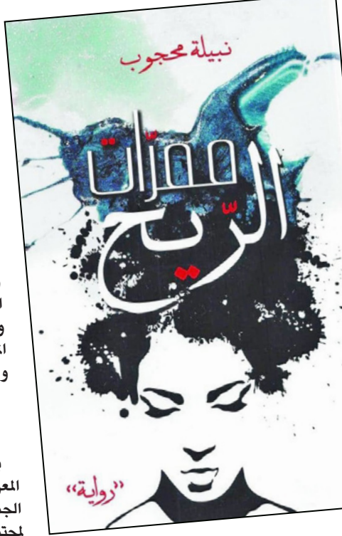
نساءً في مهب الريح

الذكريات المتعلقة ببعض الأحداث، تستمر لفترة طويلة بعد رحيل الأشخاص الذين اختبروها في الأصل. يشير هالوباكس إلى أن السبب خلف ذلك، أن المجتمعات تستخدم طرائق مختلفة لتنظيم معرفتها المرتبطة بالماضي، وذلك من أجل الحفاظ على ذكرايتها المتعلقة بهذا. وبناء على ذلك، يناقش أن ذاكرة السيرة الذاتية مكملة بواسطة الذكرة الجماعية والذاكرة التاريخية. وهذا ما يجعل رواية «ممرات الريح» تحثني بمواقع الذكرة والإرثين الديني والاجتماعي لسكان البيت الحرام، من خلال ما يفعله الرواة والشخصيات عبر استدعاء حياتهم الشخصية، وقاطعهم في المكان الحي الذي جمعهم في جبل الساكن، الذي لم يستطيع أن يمنع الريح من أن تعصف بهم. وكان للنساء النصيب الأكبر من عبث الريح بهن.