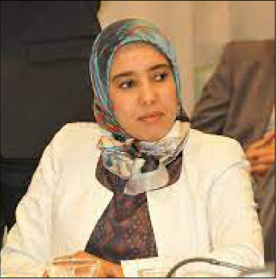
أمانة ماء العيين

العدل والإحسان، وتابع: "قد يفقد حزب العدالة والتنمية في الانتخابات المقبلة أصوات المتعاطفين، لكنه لن يفقد أصوات المنتسبين إليه والتابعين لحركة التوحيد والإصلاح. وإذا كانت نسبة المشاركة ضعيفة، وهذا متوقع، فلحزب المذكور سيستفيد من كتلة الانتخابية الثابتة".