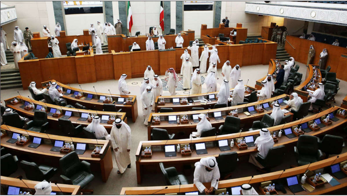
فوضى خلال التصويت في البرلمان الكويتي على الميزانية أمس

الحمد الصباح، رئيس مجلس الوزراء، حول دستورية قرار جرى تمريره في مارس/آذار الماضي لتأجيل أي استجواب له حتى نهاية عام 2022، إلى جانب قضايا أخرى مثل الفساد. ونعرت ثلاثة مصادر أن الجمود امتد على ما يبدو لهيئة الاستعمار الكويتية، وهي صندوق التروية السيادي البالغ حجمه 850 مليار دولار، الذي لم يتم تعيين مجلس إدارة جديد لها منذ انتهاء ولاية المجلس السابق في إبريل/نيسان. وقال مصدر أن التأجيل يعود غالباً إلى خلاف سياسي حول التعيينات. ولم ترد الهيئة على طلب للتعبير، وهي تدير «صندوق احتياطي الأجيال القادمة» الذي تم تأسيسه لتمويل نشاطات الحكومة حين ينفذ النفط. كما تدير الهيئة «صندوق الاحتياطي العام» وهو صندوق حكومي أصغر يستخدم في سد العجز. وقال مصدر حكومي «الموضوع قد يؤثر على شراء صندوق احتياطي الأجيال القادمة لأصول صندوق الاحتياطي العام، وبالتالي قد تتوقف هذه الآلية لتمويل الميزانية». وقدمت هذه الآلية لمباركات النيارات في العام الماضي لتغطية العجز المالي. وقال مصدر قريب من الصندوق أن استثمارات هيئة الاستثمار الكويتية قد تتأثر أيضاً.