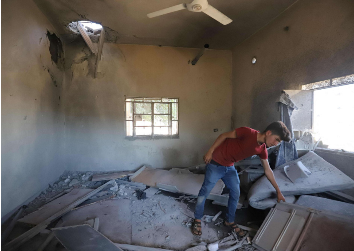
سوري يتفقد منزله الذي دمر بقصف النظام محافظة إدلب أمس

وحسب سليلج فإن الأسلحة التي يقصف بها المدنيون هي قذائف مدفعية موجهة بالليزر من نوع (كراسنوبول) و«هذا ما يؤكد أن القصف ممنهج بهدف إيقاع أكبر عدد ممكن من الضحايا، حيث وثقت فريق الدفاع المدني استخدام هذا النوع في قصف مشفى الأتارب في 21 آذار/مارس الماضي ومعبر باب الهوى، وفي