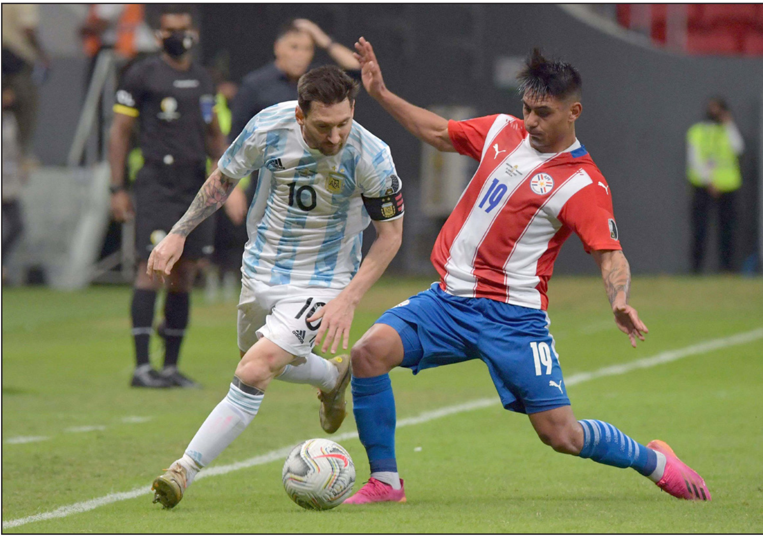
ميسي يتخطى مدافع باراغواي أزميرالدو خلال انتصار الأرجنتين

البروتوكول الصحي، في حين أن البرازيل المضيف هي ثاني دولة تعاني من تداعيات "كوفيد-19" مع قرابة نصف مليون حالة وفاة بسبب الوباء. ولا يسمح للمنتخبات المشاركة في المسابقة القارية الاحتكاك مع أشخاص آخرين، في حين أكد "كومينبول" أنه سيتم فرض عقوبة مالية تصل إلى 30 ألف دولار على المخالفين.