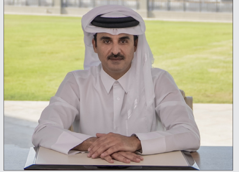
أمير قطر تميم بن حمد آل ثاني

الدوحة - الأناضول: أكد أمير قطر تميم بن حمد آل ثاني، أن بلاده تستهدف رفع إنتاجها من الغاز الطبيعي المسال بنسبة 40 في المئة بحلول العام 2026. جاء ذلك في كلمة أمس الأول القاها الأمير في الجلسة الافتتاحية لمنتدى قطر الاقتصادي الأول المنعقد عن بُعد والذي يشارك فيه رؤساء دول وحكومات وخبراء من مختلف دول العالم. وقال الأمير «استعدادا للمرحلة المقبلة، حرصنا على انتاج سياسة اقتصادية متوازنة عبر مواصلة توسعة مشروع الغاز في حقل الشمال». وأضاف «يهدف المشروع إلى زيادة إنتاجنا من الغاز الطبيعي المسال بنسبة 40٪ بحلول عام 2026، وستستخدم هذه الزيادة في تعزيز استثماراتنا لصالح الأجيال القادمة». ويقع حقل الشمال قبالة الساحل الشمالي الشرقي لقطر، واكتشف في عام 1971، وتقدر احتياطياته بنحو 900 تريليون قدم مكعب، بما يعادل 10 في المئة من الاحتياطيات العالمية المكتشفة من الغاز. ويبلغ إنتاج قطر من الغاز المسال حالياً 77 مليون طن سنوياً، وتستهدف رفعه إلى 110 ملايين طن سنوياً بحلول العام 2026. كما استعرض أمير قطر تجربة بلاده في إدارة أزمة كورونا، وقال «وجهنا باتخاذ جميع الإجراءات اللازمة للحد من التبعات الاقتصادية للجائحة، وتقديم دعم للقطاع الخاص المتضرر قدره 75 مليار ريال (حوالي 20 مليار دولار)». وناقش المشاركون في المنتدى الذي ينتهي أمس الأربعاء 6 محاور رئيسية، أهمها التكنولوجيا المتقدمة، والتنمية المستدامة، والأسواق والاستثمار، وتدقات الطاقة.