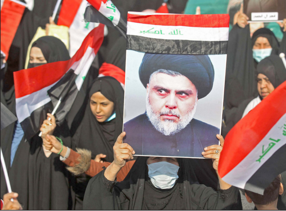
مناسرات للتيار الصدري يتظاهرون دعماً له وسط بغداد

وسايدته، وخصوصاً إن التقارب بين الطرفين سيفيق على عراقنا بالأثر الإيجابي لا محالة»، ورأى الصدر أن «وصول السيد إبراهيم رئيسي» إلى سدة الحكم في الجمهورية الإيرانية يجب أن لا يقضي على المنطقة بالتشدد وتضاعف الصراعات. فنحن نأمل منه أن يحكم العقل والشرع والحوار لإنهاء الصراعات السياسية والطائفية في المنطقة، فإن ذلك فيه قوة الإسلام والتشيع والعروبة وضعف للعدو المشترك عموماً وإسرائيل على وجه الخصوص والتي استغللت الصراعات تلك لد خيوطها العنكبوتية. وإن أو هن البيوت لبنت العنكبوت».