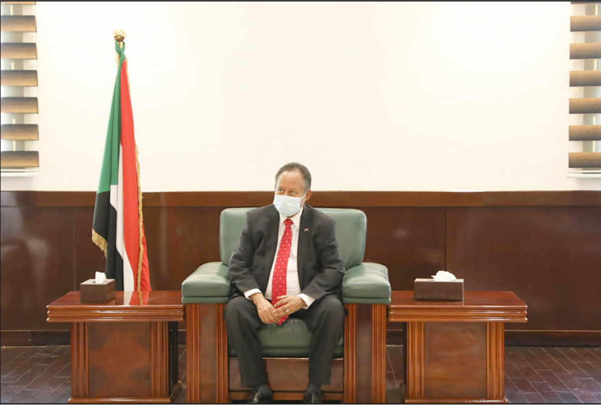
رئيس الوزراء السوداني عبد الله حمدوك

وسد الطريق أمام المغامرين سواء من المدنيين أو العسكريين أو الاثنين معاً، وتحويلها إلى برنامج عمل يومي، ليس هناك من طريق آخر لتحقيق التحول الديمقراطي إلا عبر هذه المبادرات، المماثلة أخذت من الفترة الانتقالية ما أخذت، وعملية الانتقال مسؤولة الجميع ومن كل القطاعات، والأهم من ذلك إحكام العزلة على عناصر النظام البائد، واتمنى أن يتم التراء النقاش حولها هنا بشكل موضوعي».