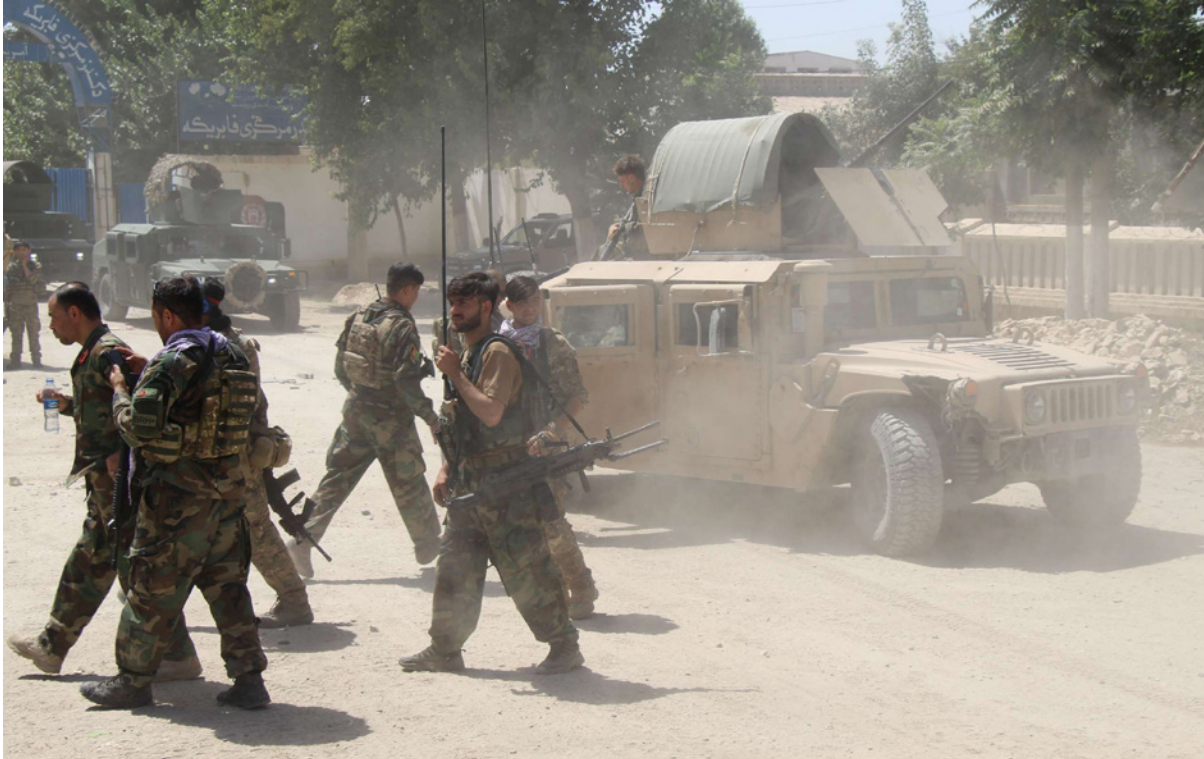
قوات من الكوماندوز الأفغانية في موقع ساحة معركة حيث اشتبكت مع متمري طالبان في ولاية قندوز

وحثت مبعوثة الأمين العام لسلام المتحدة الخاصة بأفغانستان، ديبورا لويوز، مجلس الأمن الدولي على القيام بكل ما في وسعه لدفع الطرفين للعودة إلى طاولة التفاوض، وقالت: «تزايد حدة الصراع في أفغانستان تعني زيادة اعتماد الأمن بالنسبة للعديد من الدول الأخرى القريبة والبعيدة»، وتابعت لويوز لمجلس الأمن التابع للأمم المتحدة: «هذه المناطق التي تمت السيطرة عليها تقع حول عواصم أقاليم، مما يشير إلى أن