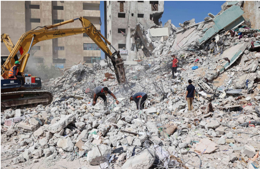
فلسطينيون يجمعون انقاض برج الجلاء الذي دمر خلال غارة جوية إسرائيلية عنيفة الشهر الماضي

دعم إسرائيل و24٪ دعماً للفلسطينيين. ويقول إن الرأي العام يشكل من خلال عوامل عدة، وليس العلاقة بين القنابل الملقاة والنسب المؤية للاستطلاعات. ولم تكن تتغير النسب لو قررت إسرائيل تبني موقف منضبط.