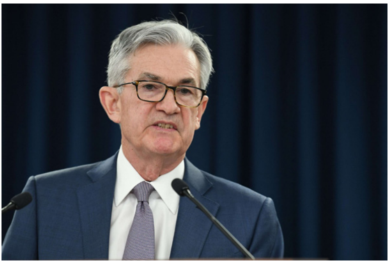
جيرمي باول محافظ البنك المركزي الأمريكي

تونس - الأناضول: تُحدّق مجموعة تحديات بمزارعي الحبوب في تونس، التي بدأ فيها موسم الحصاد وسط توقعات بزيادة حصة الزراعة من الناتج المحلي الإجمالي. في منطقة بقة في ولاية باجة (شمال غرب) وعلى مدى البصر، تنتشر زراعة القمح اللين والصلب إلى جانب الشعير، حيث تشتهر الولاية بزراعة أحد أنواع القمح عالي الجودة. يقول عبد الحافظ بوعقة، المهندس الرئيس في ديوان الأراضي الدولية (حكومي) أن بلاده «رفعت أسعار شراء الحاصلين من المزارعين هذا الموسم، بعد عروف آخرين في مناطق عديدة عن زراعة الحبوب والتوجه للأشجار المثمرة، بحثاً عن العائد المالي المرتفع». وحددت وزارة الزراعة منتصف الشهر الماضي سعر شراء القنطار (100 كغم) من القمح الصلب بـ87 ديناراً (31.18 دولار) بزيادة 5 دنانير في القنطار (كغم) من العام الماضي، بينما كان يبلغ سعر قنطار القمح اللين 67 ديناراً (24 دولاراً) بزيادة 8 دنانير، وسعر شراء قنطار الشعير 56 ديناراً (20 دولاراً) بزيادة 3 دنانير عن العام الماضي.