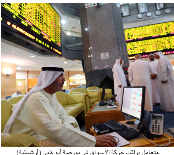
متعامل يراقب حركة الأسواق في بورصة أبو ظبي (أرشيفية)

■ أبوظبي 0.5 في المئة إلى 6651 نقطة، بينما انقصر ارتفاع بورصة دبي على 0.3 في المئة إلى 2856 نقطة.