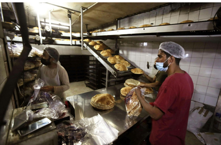
إنهاء دعم السكر رفع سعر الخبز هذا العام للمرة الخامسة

بيروت - الأناضول: أعلنت وزارة الاقتصاد اللبنانية، أمس الثلاثاء، رفع سعر الخبز المدعم للمرة الخامسة خلال العام الجاري، وسط أزمة اقتصادية خانقة تمر بها البلاد، وقالت الوزارة في بيان، إن سبب الزيادة في الأسعار أمس، إنهاء مصرف لبنان المركزي دعم السكر (الذي يدخل في صناعة الخبز) مما يرفع تكلفة إنتاج الخبز. وتحدد وزارة الاقتصاد اللبنانية أسبوعياً سعر الخبز، بناء على كلفة التصنيع والتوزيع، واستناداً إلى سعر القمح عالمياً وارتفاع سعر صرف الدولار وأسعار المواد، وحسب جدول أسعار الأسبوع الأخير الصادر عن الوزارة أمس، يبلغ سعر «بطة الخبز» بوزن 910 غرامات 3.250 ليرة (2.25 دولار وفق سعر الصرف الرسمي).