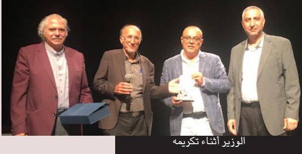
رام الله - «القدس العربي»:

كرم مجلس إدارة المسرح الوطني الفلسطيني (الحكواتي) في مدينة رام الله، وزير الثقافة د. عاطف أبو سيف، تقديراً لدور الوزارة في دعم المسرح والمؤسسات الثقافية الفلسطينية في القدس.