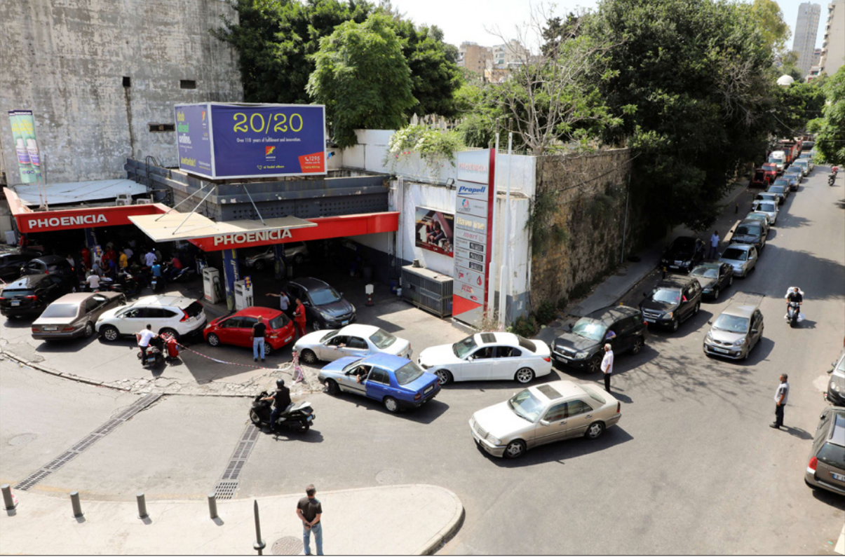
لبنانيون في سياراتهم ينتظرون دورهم للحصول على الوقود من إحدى المحطات في بيروت

والخطرة التي يعيشها لبنان بسبب تعثر الدولة عن دفع ديونها.