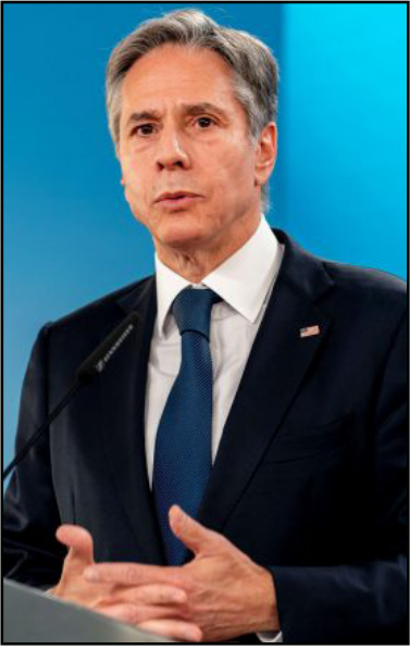
أنتوني بلينكن وزير الخارجية الأمريكي

انتهت جولة المحادثات الخامسة في فيينا، وعادت الوفود إلى بلدانها وإلى المشاورات الأخيرة. والجولة السادسة كغالبية بان تكون الحاسمة والأخيرة قبل التوقيع.