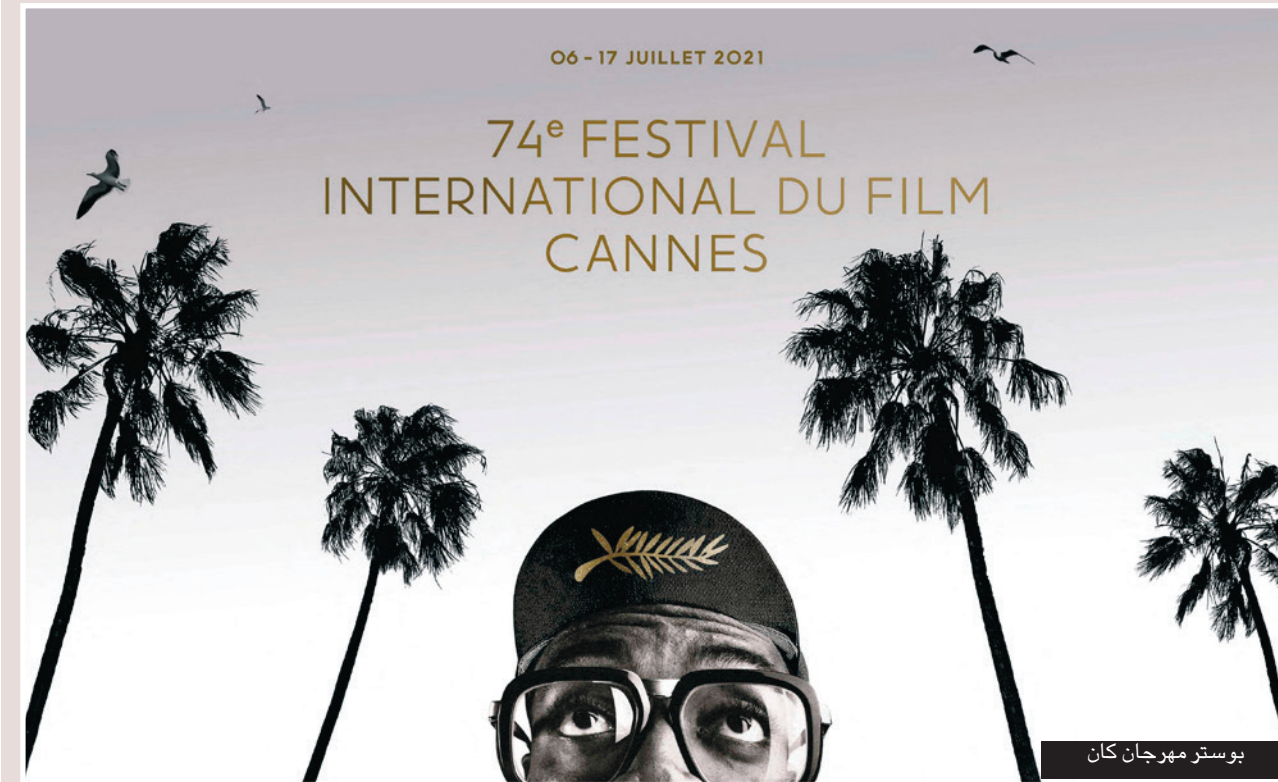
بوستر مهرجان كان

على ارتباط "بعالم الصورة والسينما الذي لطالما سحرها، وخصوصاً من خلال أغنياتها المصوّرة.