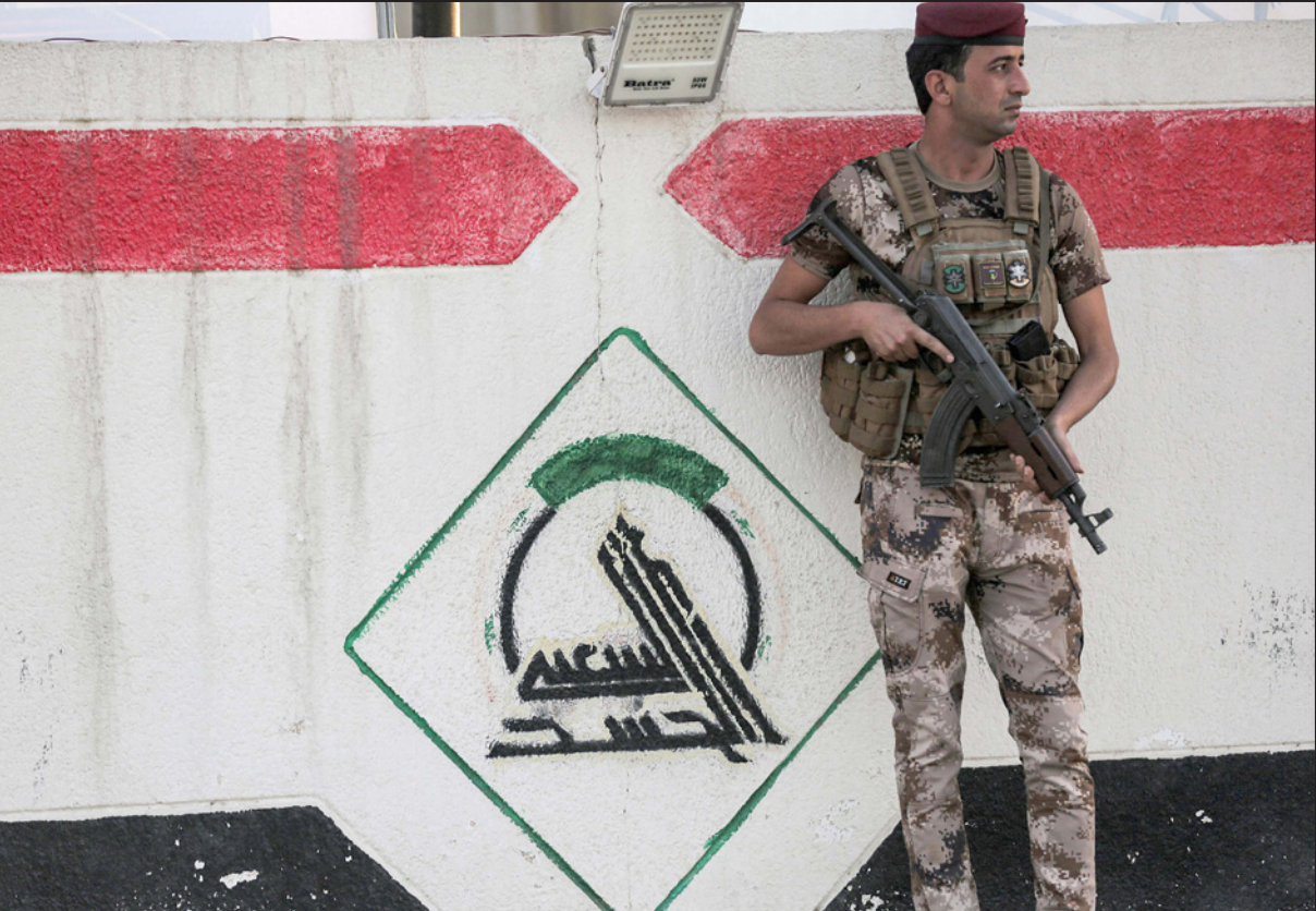
عنصر من الحشد الشعبي

أنه «يؤكد القرصنة الأمريكية في الاستحواذ والتصدي لإعلام الحر»، وقالت نقابة الصحفيين العراقيين، في بيان صحافي أن «ما قامت به حكومة الولايات المتحدة في خطوتها غير القانونية يؤكد من جديد زيف شعارات حرية التعبير وكل الغفارين الأخرى التي تروج لها»، وأشارت إلى أنها «في الوقت الذي تدين فيه تلك الممارسات فإنها تدعو إلى عدم تكرارها، والتي تقيد حرية الإعلام والتعبير وما تنتهجه وسائل الإعلام عبر العالم في ممارسة عملها الإعلامي بكل حرية ودون أي ضغوط أو تهديد، وهو ما يتنافى مع حرية الإعلام والممارسات الديمقراطية التي تؤكد عليها الاتفاقات الدولية المعنية». وأعلنت وزارة العدل الأمريكية، أول أمس، رسمياً «مصادرة» مواقع إخبارية، قالت إنها إيرانية ومواقع أخرى تابعة للحوثيين، إضافة إلى مواقع عراقية.