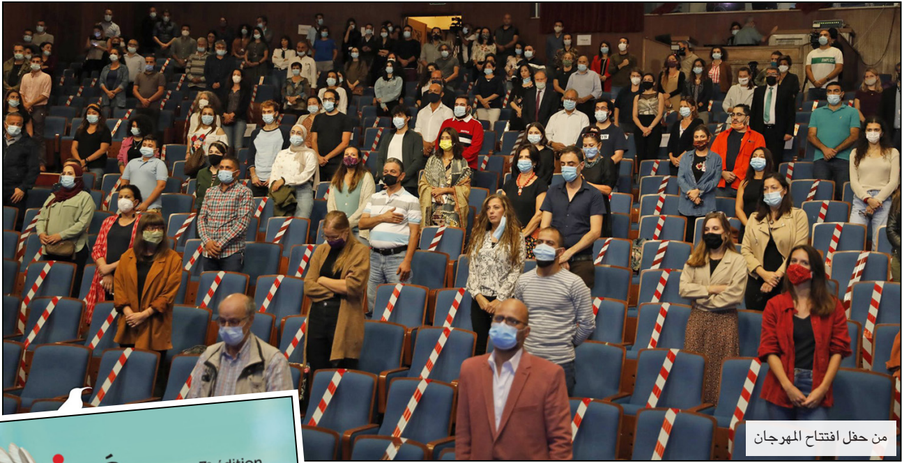
من حفل افتتاح المهرجان