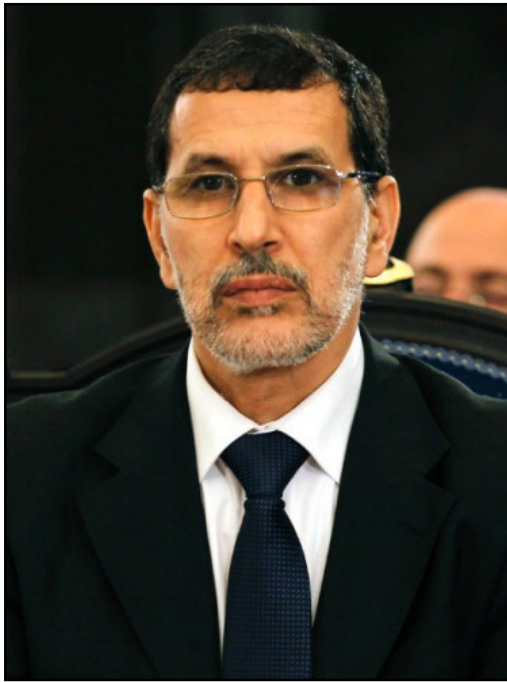
سعد الدين العثماني

من أجل إسقاط الحكومة، قبل أن تفشل في ذلك وتراجع عنه بسبب انقسامات برزت بين مكوناتها، الذي كان يتحدث أمس في برنامج "لقاء مع الصحافة" بث على أمواج الإذاعة الوطنية. ودعا خصوم حزبه إلى العمل على انتقاده بشكل بناء، استناداً إلى أحكام ومعلومات صحيحة ودقيقة، مطمئناً للخصوم ذاتهم بأن الوضع الداخلي لحزبه سليمة، نافياً حصول انشقاقات داخله بسبب وجود ديمقراطية تسمح للجميع بالتعبير عن آرائهم، كما نفى تأثير الاستقالات على الحزب والتي تبقى نسبيتها ضئيلة، قائلا: "نحن لسنا حزبا ستالينياً، لهم الحرية في التعبير عن آرائهم"، مشدداً على أن انتماء أي عضو بالحزب هو فعل طوعي، كما أن تغيير الانتماء والانسحاب منه هو أيضاً امر عادي. وقال إن حزب العدالة والتنمية حقق وعوده، وهو الأمر الذي جعل المواطنين يمنحونه الرتبة الأولى في تاريخ المغرب في الانتخابات السابقة، على الرغم من عدم رضا المغاربة عن قرارات "غير شعبية" كما يقال، ورغم ذلك جددوا ثقتهم بالحزب، قبل أن يتوقع العثماني بأن حزبه سينجح مرة أخرى في الانتخابات القادمة، مشدداً بقوله: "إذا أراد المواطنون أن يحاسبوا حزبا، عليهم أن يمنحوه الأغلبية المطلقة". ووجه انتقاداً لانعدام المعارضة التي وصفها بـ"المرتجة"، "وبدليل ذلك - وفق تعبيره - قول بعضهم إن تصويت فريق العدالة والتنمية بالرفض على مشروع قانون الهندي سيدفع بهم إلى التمسك بالطلب سحب الثقة من الحكومة، لكن لم يفعلوا، كما قالوا إنهم سيدعون رئيس الحكومة لتقديم حصيلة الحكومة بالبرلمان، لكن لم يفعلوا أيضاً".