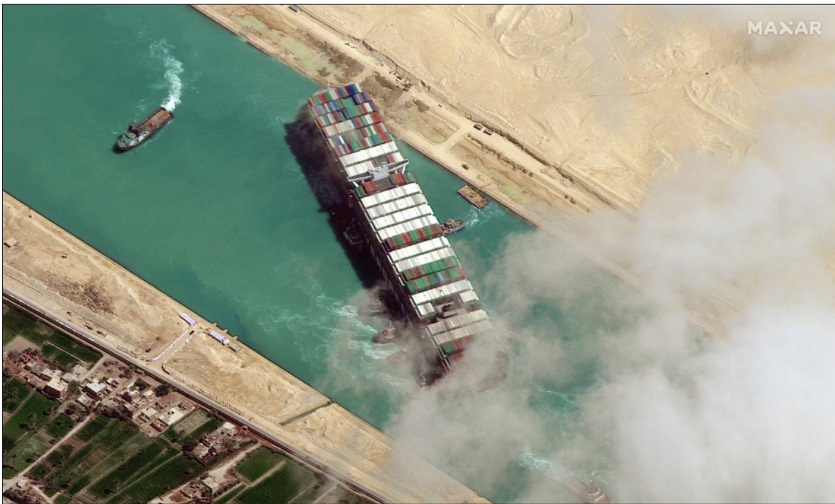
زورقاً قطر يحاولان تعديل اتجاه سفينة «إيفر غيفن» بعد جنوحها وتعطيل الملاحة في قناة السويس

وفي الحادي عشر من الشهر الماضي، وافق الرئيس المصري عبد الفتاح السيسي على مشروع لتطوير قناة السويس يشمل توسعة وتعبيق الجزء الجنوبي للقناة حيث جنحت السفينة العملاقة.