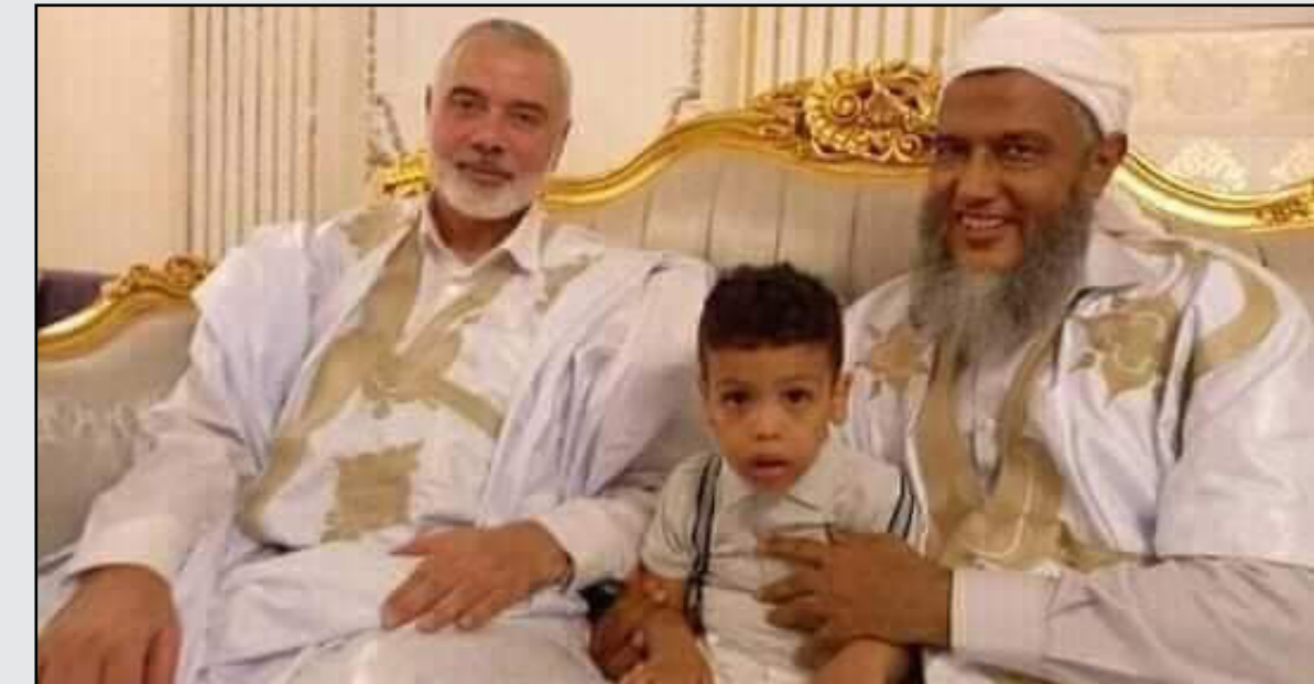
رئيس المكتب السياسي لحركة حماس إسماعيل هنية يرتدي الزي الموريتاني

الناصريين والإخوان حول ملكية المنظمة التي تولت تاطير وتنظيم زيارة وفد حماس لنواكشوط، وهي الرباط الوطنية لنصرة الشعب الفلسطيني والمنير الذي أسسه المسلمون والناصريون قديماً خلال فترة صفاء، لكن رئاسته بقيت للإسلاميين، كما احتفظوا بتخطيط وتنظيم نشاطاته. وأثارت عبارة سخط وتآفف وجهها للقيمة العربية الشيخ ولد أبواه، وهو قيادي إسلامي، في قصيدة ترحيب بوفد حماس، سخط الصحابيين الذين بادروا للتذكير بأنهم من مؤسسي الرباط وأنهم يستغربون استخدام منابره ضد قوميتهم. واعتذر الرباط في بيان وزعه أمس عن كل تصريح عبر المنصة لا يمثل سياسة المنظمة القائمة على أنها واحة للعمل الفلسطيني والذي يمتزج فيه كل القوى والشرائح ممثلة للشعب الموريتاني بدون تدخل في البعد الأيديولوجي والخيارات السياسية. وأضاف: "فالرباط الوطني لنصرة الشعب الفلسطيني ساحة مختلف التيارات وقد ظل حضور التيار القومي في الرباط مشهوداً ومؤثراً ويخدم القضية ويدفع لنصرة الشعب نذكر ذلك".