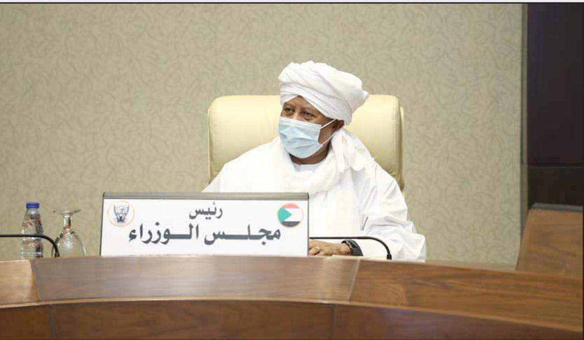
حمدوك خلال اجتماع حكومي

والجبهة الثورية» لـ«القدس العربي» «نحن نتعامل بجدية كبيرة مع مبادرة حمدوك ونرحب بها ترحيباً حاراً، وسيصدر رأينا في قريبا».