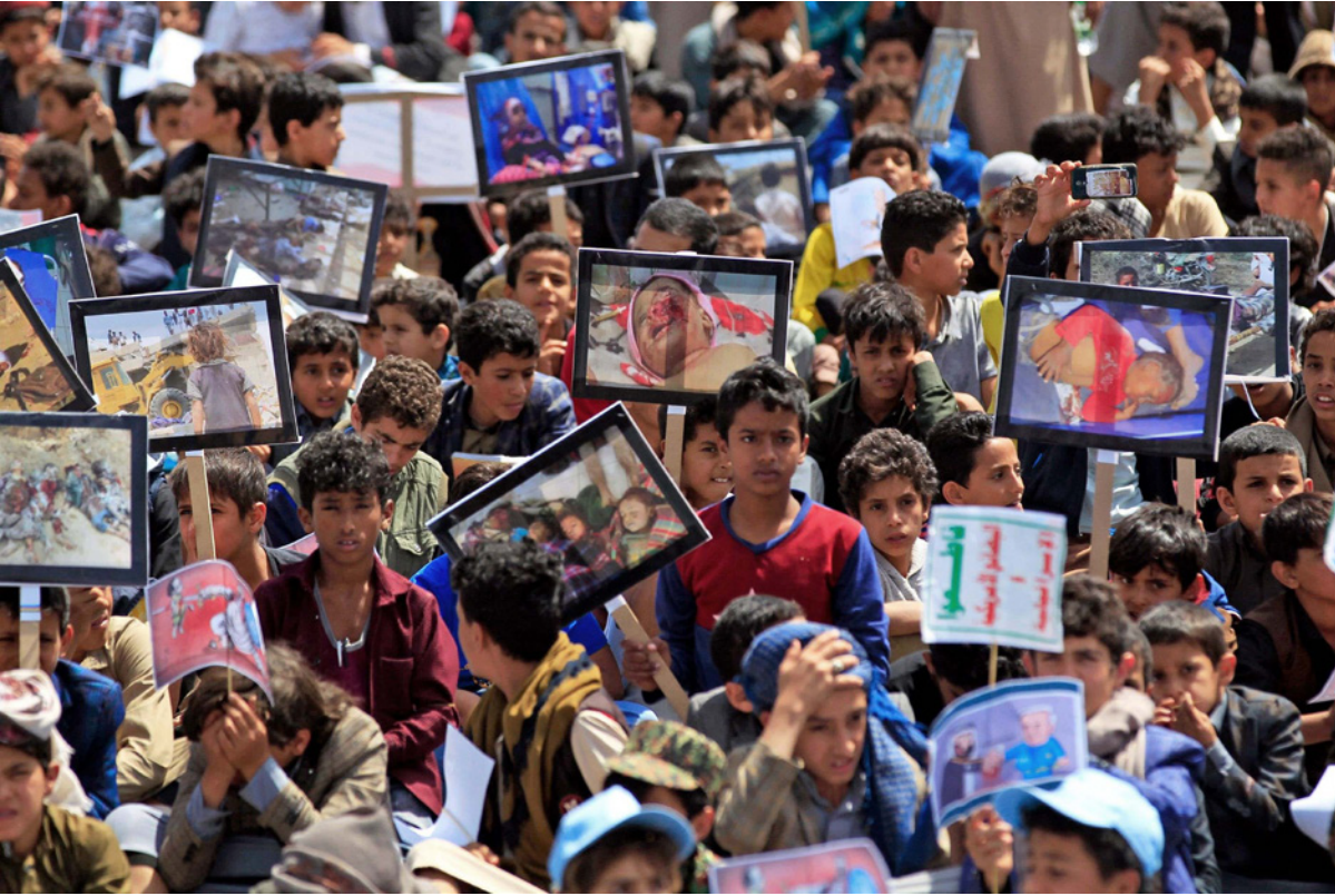
أطفال يمنيون يحتجون على قرار الأمين العام للأمم المتحدة بإسقاط التحالف بقيادة السعودية من «قائمة العار»