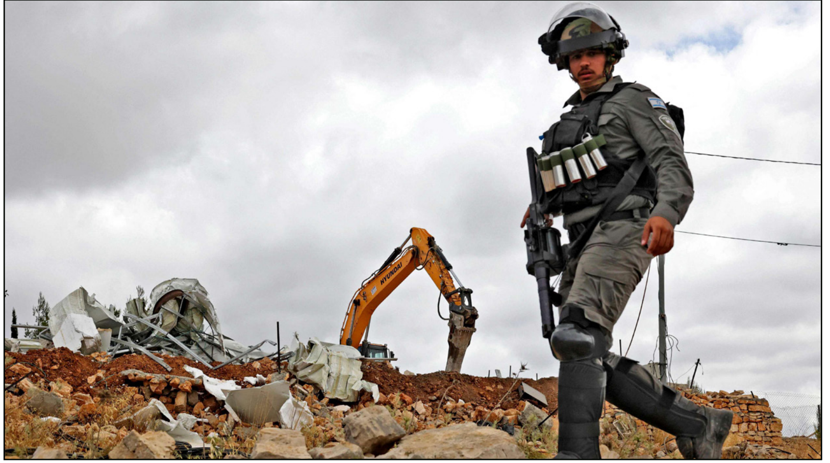
أرضية لأحد حرس الحدود الإسرائيلي يسير بينما تهدم الأليات منزل فلسطينياً في الضفة الغربية المحتلة

محافل مطلعة في إسرائيل تتجهت لتابعة سير مفاوضات فيينا من كتب، وتشارك في التقدير بشأن معظم المواضيع الاقتصادية قد اتفق عليها الآن بين الطرفين، والعقوبات التي سترفع ترتبط في معظمها بصناعة النفط. ويتبين من التقارير التي تصل من إيران بأن الإيرانيين ضاعفوا في الأشهر الأخيرة إنتاجهم من النفط، وأن العديد من الناقلات حملت وتنتظر الضوء الأخضر في تنطلق على السرب، والراجح الأول من الاتفاق، بعد الجمهورية الإسلامية نفسها، ستكون الصين، التي تحصل على النفط بأسعار دون، يفصل اتفاق المساعده الدنية والعسكرية الذي وقعته من إيران بقيمة 400 مليار دولار لـ 25 سنة.