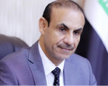
وزير العمل العراقي عادل الركابي

■ بغداد - الأناضول: أعلنت الحكومة العراقية أمس الخميس عن قيامها بترحيل آلاف العمال الأجانب، وإحالة 400 شركة قطاع خاص إلى القضاء لعدم التزامها بقرار تشغيل نسبة من عمالة المحلية. وقال وزير العمل العراقي، عادل الركابي، في تصريح لوكالة الأنباء الرسمية «واع» أنه تم ترحيل آلاف العمالة الأجانب كانت إقامتهم غير شرعية، وأُخروا بشكل سلبي على فرص الشباب العراقي بالتوظيف». وأضاف أنه «تمت إحالة 400 شركة في القطاع الخاص إلى محكمة العمال خلال 2021، لعدم التزامها بنسبة تشغيل العمالة العراقية، وعدم تطبيقها للدقيق لقانون التقاعد والضمان الاجتماعي». وأقرت الحكومة العراقية قبل سنوات قانوناً يلزم الشركات كافة بتشغيل 50 في المئة على الأقل من العمالة العراقية. لكن شركات القطاع الخاص تلجأ إلى تشغيل العمالة الأجنبية بدلاً من العراقية، بسبب تدني الأجور، إلى جانب ساعات العمل الطويلة. وقال الوزير العراقي «تم توجيه الإنذار إلى