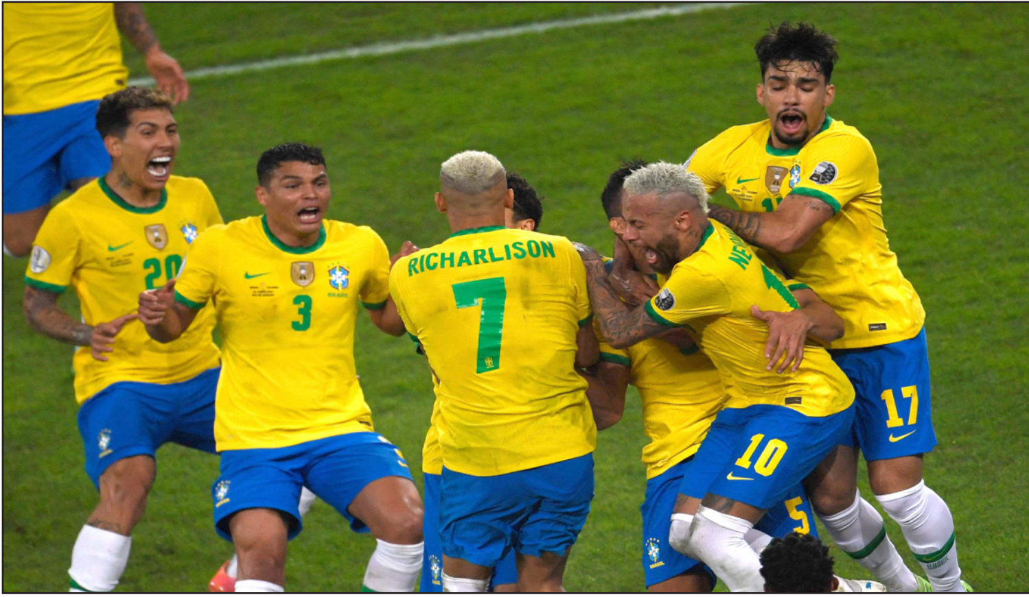
لاعبو المنتخب البرازيلي يحتفلون بصخب بهدف الفوز في مرمى المنتخب الكولومبي

وخلافا لمبارياته الأخيرة مع "سيليبيساو"، لم يسجل النجم نيمار، لكنه أصاب القائم (65) ووجد رأس كازيميرو في الحركة الأخيرة من ركنية، وقام المدرب تيتي الذي يستفيد من هذه البطولة لاعاد فريخ جيد لوندال 2022، بتبديلات عدة ودفع بخمسة لاعبين جدد مقارنة بالمباراة الأخيرة مع البيرو، وعاد ماركينوس إلى قلب الدفاع ليلعب بجانب زميله السابق في باريس سان جيرمان المخضرم تياغو سيلفا. واستحوذت البرازيل على الكرة مطلع المباراة، قبل ان تصد من الهجمة الكولومبية الأولى بكرة دياش الرائعة في مرمى الحارس ويفرتون اثر عرضية من خوان كوارادو (10). وفيما أطبق الكولومبيون على التحرك، تحرر ريشارليسون الذي اختبر الحارس دافيد أوسبينيا (20) وسدد مرة ثانية في الدفاع (41)، وأظهرت البرازيل، بطلة العالم خمس مرات، وجهها أفضل بعد الاستراحة. فبعد دخول فيرمينو بين الشوطين، عادل النتيجة بعد عرضية من البديل الآخر ريتان لودي (78). لكن الكرة وصلت لودي بعدما ارتدت من الحكم بيتانا مطلع