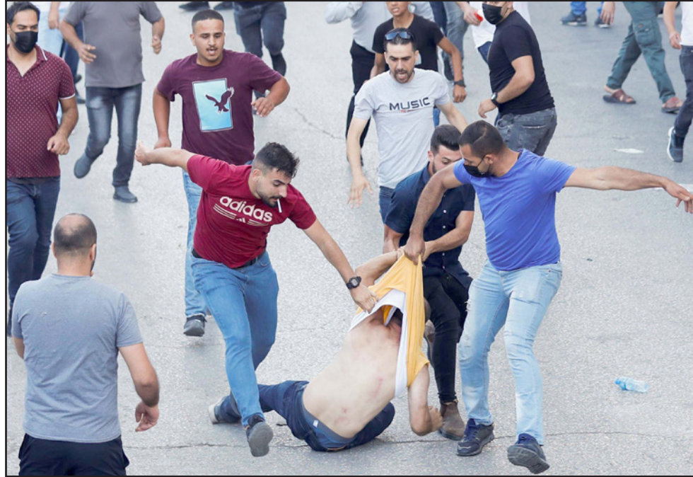
رجال أمن بزي مدني يتكلمون بأحد المحتجين في رام الله