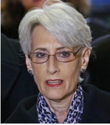
نائب وزير الخارجية الأمريكية ويندي شيرمان

كل المترشحين الأحزاب في الانتخابات الماضية، واستحقاق ثوري قانوني ودستوري (لا يكتمل الدستور إلا بإرسائها) وليس مطلباً أجنبياً أو خارجياً.