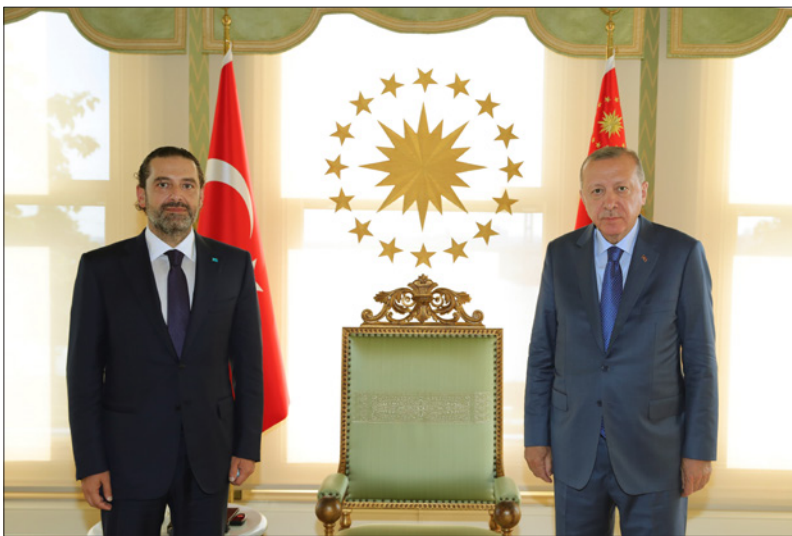
اردوغان لدى لقائه الحريري

وأضاف: «غريب أمر هذه الجماعة السياسية التي تحمل نفسها مذ اليد إلى أموال الشعب، وتحزرم على نفسها تاليف حكومة للشعب» سائلاً: «هل صار كل شيء ممكناً ما عدا تاليف حكومة؟» معتبراً أن جميع التدابير البديلة التي تلجأ إليها السلطة هي نتيجة الامتناع عن تشكيل حكومة إنقاذ تقوم بالإصلاحات الضرورية فتتأهب لتساعات من الدول الشقيقة والصديقة ومن المؤسسات الدولية» وختّم «الوقوف أمام المسؤولين حكومة ودعوة أموال الناس للناس».