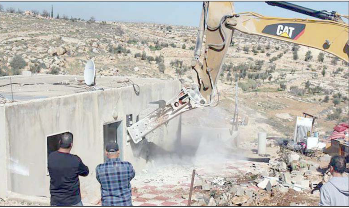
هدم منازل الفلسطينيين سياسة إسرائيلية متواصلة

وأكد أن «موقف الاتحاد الأوروبي لا يمكن أن يقبل بتهجير الفلسطينيين باعتبار هذا الحي قاطنا على أرض فلسطينية محتلة، وبالتالي حكومة الاحتلال وفق القانون الدولي ملزمة بحمايتهم وليس تهجيرهم».