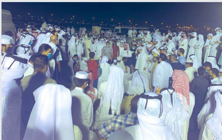
دفن الناشطة الإماراتية في قطر

الجزن على القبرة، طيلة مراسم الدفن، وذرقت أعين بعض الحاضرين، وارتفعت الدعوات لأخذ حق الفقيدة، وعبر كثيرون عن حسرتهم كون آلاء ماتت، وما تزال صدى كلماتها وهي تدافع عن حق والده تردد، والاستشهاد بأقوالها، وما ووتته عن معاناة عائلتها، وما لحق بها. وانتشرت في مختلف منصات التواصل الاجتماعي، عدد من التغريدات، حول رمزية استقبال جثمان الناشطة، ودفنها في قطر، وتحقيق أمنية أهلها، واستحسن كثيرون هذه البادرة من السلطات القطرية. كما أعاد كثيرون نشر مقطع فيديو سابق للشيخ محمد بن عبد الرحمن آل ثاني نائب رئيس مجلس الوزراء وزير الخارجية القطري الذي أكد أن بلاده رفضت تلبية طلب خاص