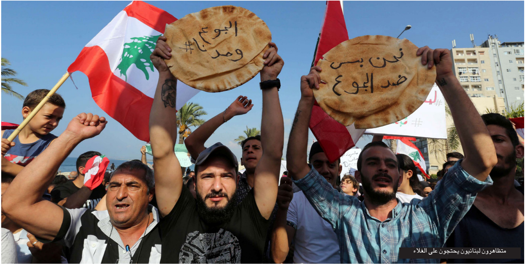
متظاهرون لبنانيون يحتجون على الغلاء