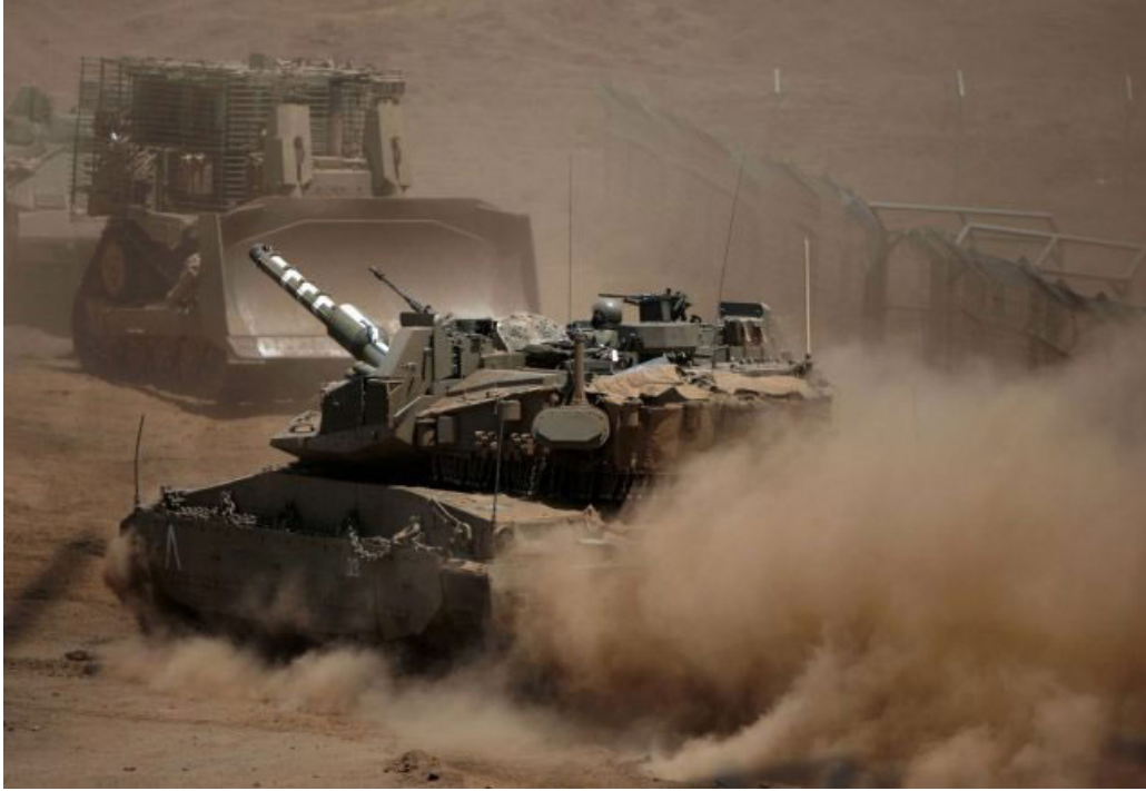
إسرائيل اليوم 2021/6/27

إن عدم اليقين وتأخر رد إيران، التي انتظرت ساعة قبل إعطاء ردها، يطرح تساؤلات حول نواياها. وتدل تصريحات الشخصيات الرفيعة الإيرانية على وجود خلافات سياسية شديدة بين الرئيس حسن روحاني وحكومته وبين البرلمان،