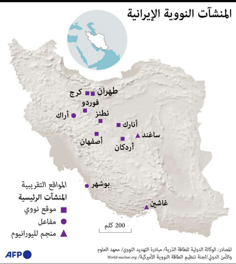
المنشآت النووية الإيرانية

من باريس، إن «خلافات جوهرية لا تزال قائمة حول الاتفاق النووي». وأكد أن بلاده «لن تتوصل لصفقة تعيد إحياء الاتفاق التهاوي، منذ انسحاب الإدارة الأمريكية، إلا إذا أوفت السلطات الإيرانية بالتزاماتها النووية». واعتبر بليكن أن هذا الاتفاق «ستكون صعبة للغاية إذا طالت الحوادث أكثر من اللازم».