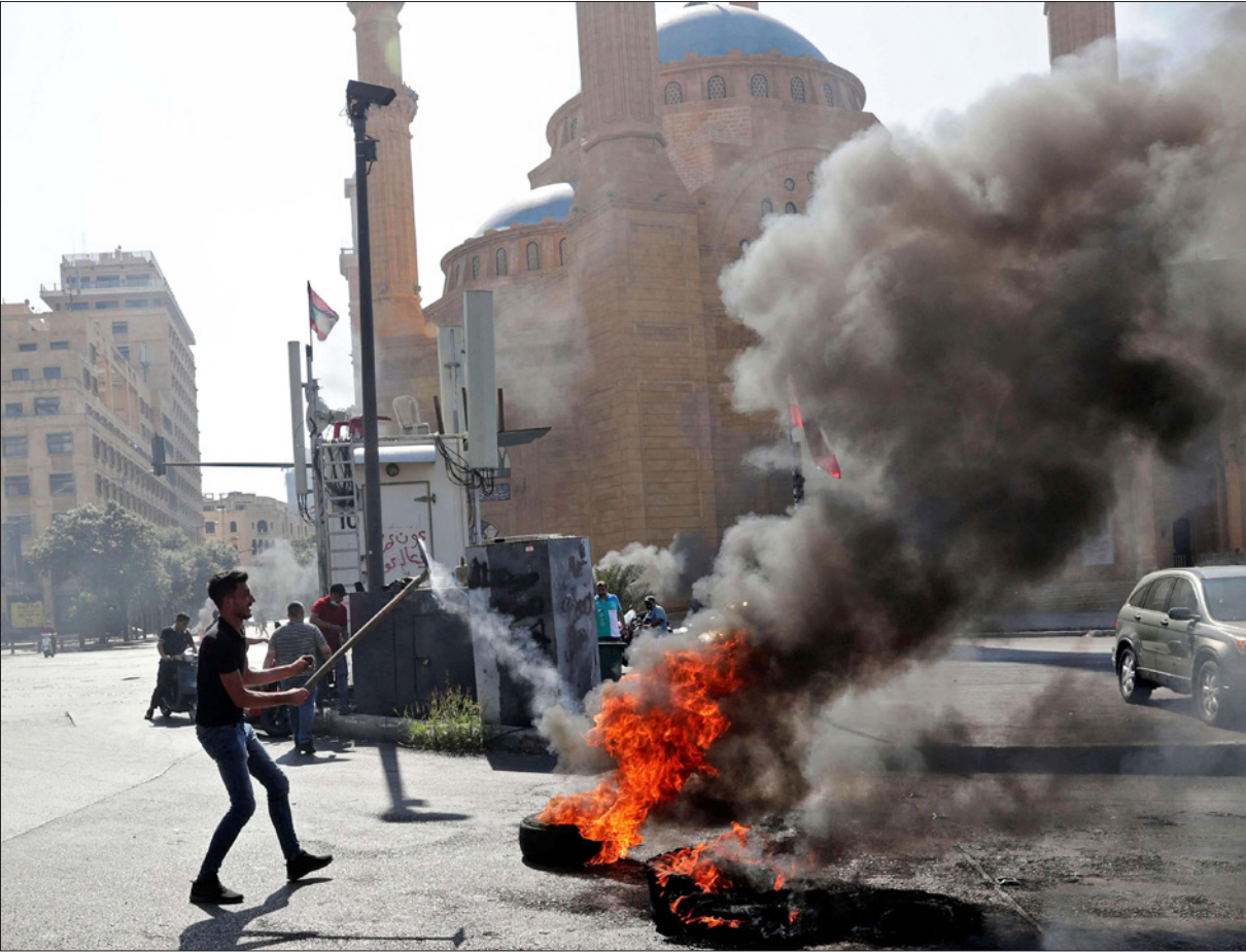
جانب من مظاهرات أمس

10 جرحى من الجيش لدى تنفيذ مهمة حفظ الأمن... والحريري طار إلى تركيا