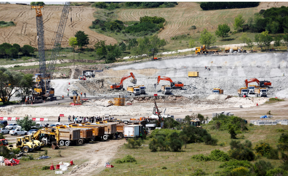
حفارات وآليات في أول مواقع إرساء أساسات الجسر الجديد الذي سيكون فوق «قناة إسطنبول»

أوغلو، إقامة الاحتفال الذي ترأسه اردوغان ووصفه بأنه حيلة لحفظ ماء الوجه لمشروع كان بطيئا في تحقيقه، ويرجع ذلك جزئيا إلى الصعوبات الاقتصادية. وقال أن الجسر الذي بدأت عملية وضع أساساته جزء من مشروع طريق سريع لا علاقة له بالقناة. وجدد مشروع كوشك شناهين، كبير مستشاري رئيس البلدية معارضة إمام أوغلو لنسق القناة، وقال أن «هذا المشروع يتطلب التنقيب لسنوات في مساحة تقدر بـ 2.1 مليار متر مربع من البحر الأسود، وصولا إلى مضيق الدردنيل الذي يربط بحر إيجه بمرمرة، فضلا عن التنقيب في مناطق برية سيستخدم فيها 10 آلاف شاحنة يوميا لمدة 6 أو 5 سنوات على الأقل لإخراج الرمل منها، وإلقائه على شواطئ كارايورون ومرمره، وهذا ما سيؤدي لاختلال بيئي كبير يرقعه إمام أوغلو، خاصة أن الأمر سيحتاج لنتفحات نتيجة وجود أرض صلبة».