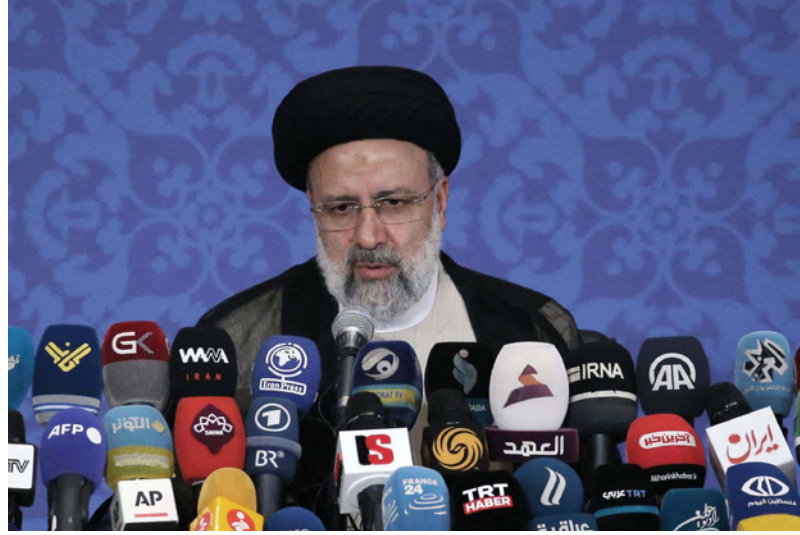
الرئيس الإيراني الجديد إبراهيم رئيسي

إبرام اتفاق نووي جديد يتجاوز مجرد العودة إلى شروط 2015، نمو الناتج المحلي الإجمالي الحقيقي 4.3 في المئة هذا العام، ثم 5.9 في المئة و 5.8 في المئة في 2022 و 2023 على الترتيب. وفي إطار ذلك التصور، قد ترتفع الاحتياطات الرسمية لأكثر من مئليها بنهاية 2023 من 70 مليار دولار في مايو/ أيار الماضي، وقد يساعد الاستثمار الأجنبي المباشر في خلق الوظائف وستحقق إيران فائضا ماليا بحلول 2023.