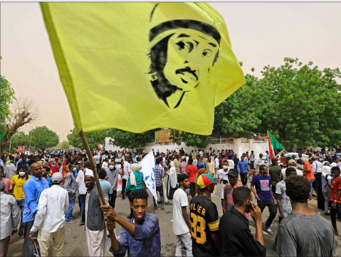
سودانيون في مسيرة للمطالبة بالعدالة للمتظاهرين الذين قتلوا خلال مظاهرات مناهضة للحكومة قبل عامين

وسيسل المحققون الذين أرسلتهم وكالة التنمية الدولية الأمريكية إلى السودان الشهر المقبل، من أجل إجراء تقييم أولي للموقع. وقال المتحدث باسم الوكالة إن الولايات المتحدة تدعم عملية العدالة الانتقالية في السودان بما في ذلك «توفير خبرات متخصصة عند الطلب وبما يتماشى مع المعايير الدولية»، وفي أيار/ مايو، استقال المدعي العام تاج السر الحبر، حيث قال إن هناك على ما يبدو فصائل داخل قوات الأمن تحاول إخفاء أدلة عن مكتبه الذي يقوم بالتحقيق في القتل. وقال: «لدينا ما نعتقده أن هذا مرتبط بعملية الاعتصام. لكننا نشعر بالتحقيق قاموا بتجميع الأدلة وإجراء مقابلات مع الناس الذين يعيشون قرب المقبرة لتحديد وقت وصول الجثث، وكيف وصلت العرابت التي استخدمت في نقلها، مضيفاً: «لدينا شهود مهمون قدموا شهادتهم» وتعتبر العدالة في هذه الحالة مهمة