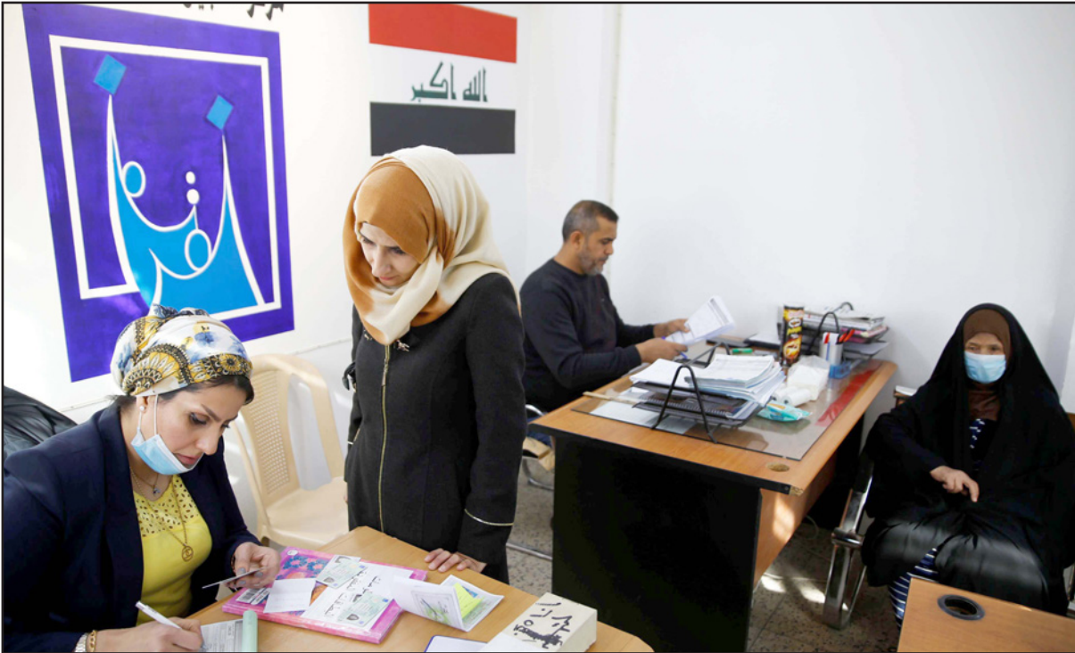
عراقية تتسلم بطاقتها الانتخابية من مركز للمفوضية في بغداد

العراق (رسمية) أمس، أن مليون و500 ألف ناخب عراقي ممنوعون من المشاركة بالانتخابات العامة المقبلة، وقال عضو المفوضية فاضل الغراوي، في بيان إن «حقوق الناخبين من حق دستوري يجب على الحكومة حمايته وتبنيته كافة السبل لممارسته من قبل الناخبين»، مبيّناً «أن مليون وخمسمائة ألف ناخب من موليد 2001 و2002 و2003 لن يستطيعوا المشاركة بالانتخابات بسبب عدم وجود أسمائهم حتى الآن في سجل الناخبين وعدم حصولهم على بطاقات بايومترية أو بطاقات قصيرة الأمد»، وطالب الغراوي، مفوضية الانتخابات «باتخاذ إجراءات عاجلة لتشمل هذه الشرائح وتزويدهم بالبطاقة القصيرة الأمد وإدراجهم في سجل الناخبين بغية المحافظة على حقهم الدستوري بالانتخاب».