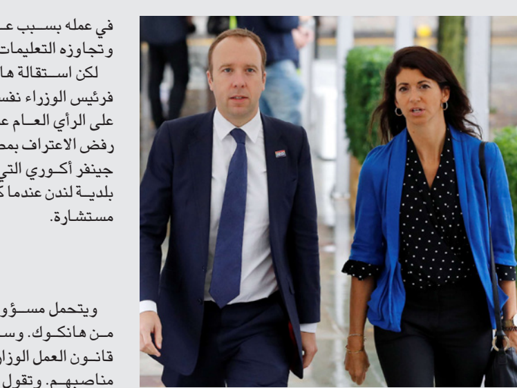
مات هانوك ومساعدته جينا كولادانجيلو

في عمله بسبب عدم كفاءته وتقويضه للرد الحكومي الطارئ وتجاوزته التعليمات وخرقه للتعليم الوزارية. لكن استقالة هانوك لن تحل مشكلة النزاهة في الحكومة. فريثس الوزراء نفسه مرقّ قانون الشرف السياسي، وكذب على الرأي العام عندما رأى أن هذا في مصلحته. ومثل هانوك رفض الاعتراف بمصلحه الشخصية وعلاقته مع سيدة الأعمال جينيفر أكوري التي حصلت شركتها على آلاف الجنيهات من بلدية لندن عندما كان عمدها، وكذا تعيينه أما لوحد من أولاده مستشاراً.