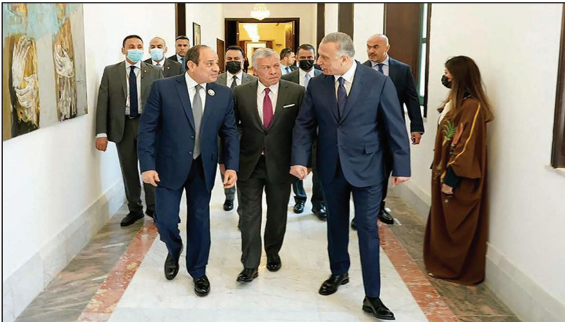
رئيس الوزراء العراقي مصطفى الكاظمي مستقبلاً الملك الأردني عبد الله الثاني والرئيس المصري عبد الفتاح السيسي في بغداد أمس