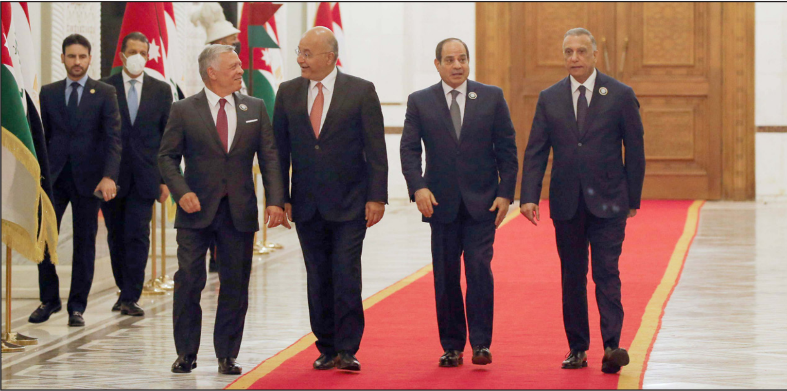
الكاظمي والسيسي وبرهم صالح وعبد الله الثاني

وتناول اللقاء «تطورات الأوضاع في المنطقة والإشارة إلى الدور المحوري لجمهورية مصر العربية في المنطقة العربية والإقليمية، والتأكيد على أن العراق الأمن والسفيرة والسيادة والتأيد دوره العربي والإقليمي، هو عنصر مهم في ترسيخ الأمن والاستقرار والتنمية في كل المنطقة، والإشارة إلى وجوب التنسيق الثلاثي المشترك