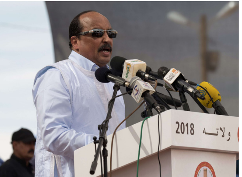
الرئيس السابق محمد ولد عبد العزيز

وأضاف: «يدخله السجن، يفقد ولد عبد العزيز موقع «ريم أفريكا» الإخباري الموريتاني المستقل في تحليله «أن الخيارات لا تبدو كثيرة أمام السلطة ولا القضاء ولا المتهم الرئيس محمد ولد عبد العزيز، ويبدو خيار إغلاق الملف أبعد الخيارات المتوقعة، بسبب ضريبة ذلك سياسياً وإعلامياً، خصوصاً أن الملف يتداول بين يدي