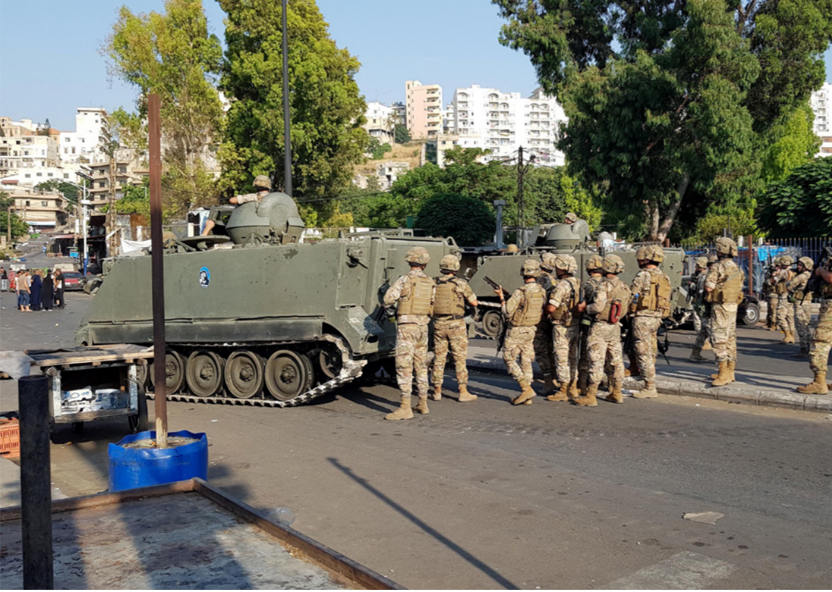
مدرعات الجيش اللبنانية انتشرت أمس في أماكن المواجهات في طرابلس شمال لبنان

بأنها بعزقت 30 مليار دولار»، ومشككاً «بكام النظمه المشاركة في الفساد»، سائلاً «هل يشكل كلامها ضماناً؟». وكان الرئيس بري تلا في خلال مناقشة البطاقة التمولية تعهداً من رئيس حكومة تصريف الاعمال حسان دياب بتنفيذ برنامج ترشيد الدعم للسند إلى اقرار اللجان النيابة المشتركة بمعدل بطاقة تمويلية بمبلغ قيمته الوسطية 93.3 دولار وحداً أقصى 126 دولاراً. وكشف بري ان صندوق النقد الدولي قرّر بشكل عام وتجاه البلدان التي لديها تأميمات في الصندوق أن يعيدها لأصحابها ولبنان حصته من هذا الموضوع (900 مليون دولار) وقد تبليغ وزير المالية ذلك حسب معلوماتنا.. وطالب رئيس لجنة المال والموازنة النائب ابراهيم الحكومه «ببدء المسار الرسمي لاستبدال عدد من قروض البنك الدولي التي اقراها المجلس النيابي ولم تنفذ لتمويل ترشيد الدعم والبطاقة التمولية بدل استعمال الاحتياطي الاضرائي». تجدد الاشارة إلى ان الجلسة التشريعية لمجلس النواب إنتخب القاضي ميشال طرزي عضواً للمجلس الدستوري بأكثرية 52 صوتاً مقابل 37 صوتاً لوزير العدل السابق البرت سرحان و3 أوراق بيضاء، بعد جولتي اقتراع. وقال بري، رداً على النائب أسامة سعد «المجلس الدستوري ينقصه 3 أعضاء، عضوان ينتخبهما مجلس الوزراء وعضو مجلس النواب مكان القاضي الراحل انطوان بريدي، والمجلس الدستوري اى يلا نصاب، وإذا انتخبنا هذا العضو نعيد احياء مؤسسة من مؤسسات الدولة ويكتفينا الخراب القائم في البلد».