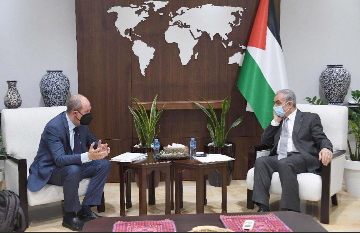
رئيس الوزراء الفلسطيني محمد اشتية خلال لقائه المبعوث الأمريكي هادي عمرو في رام الله