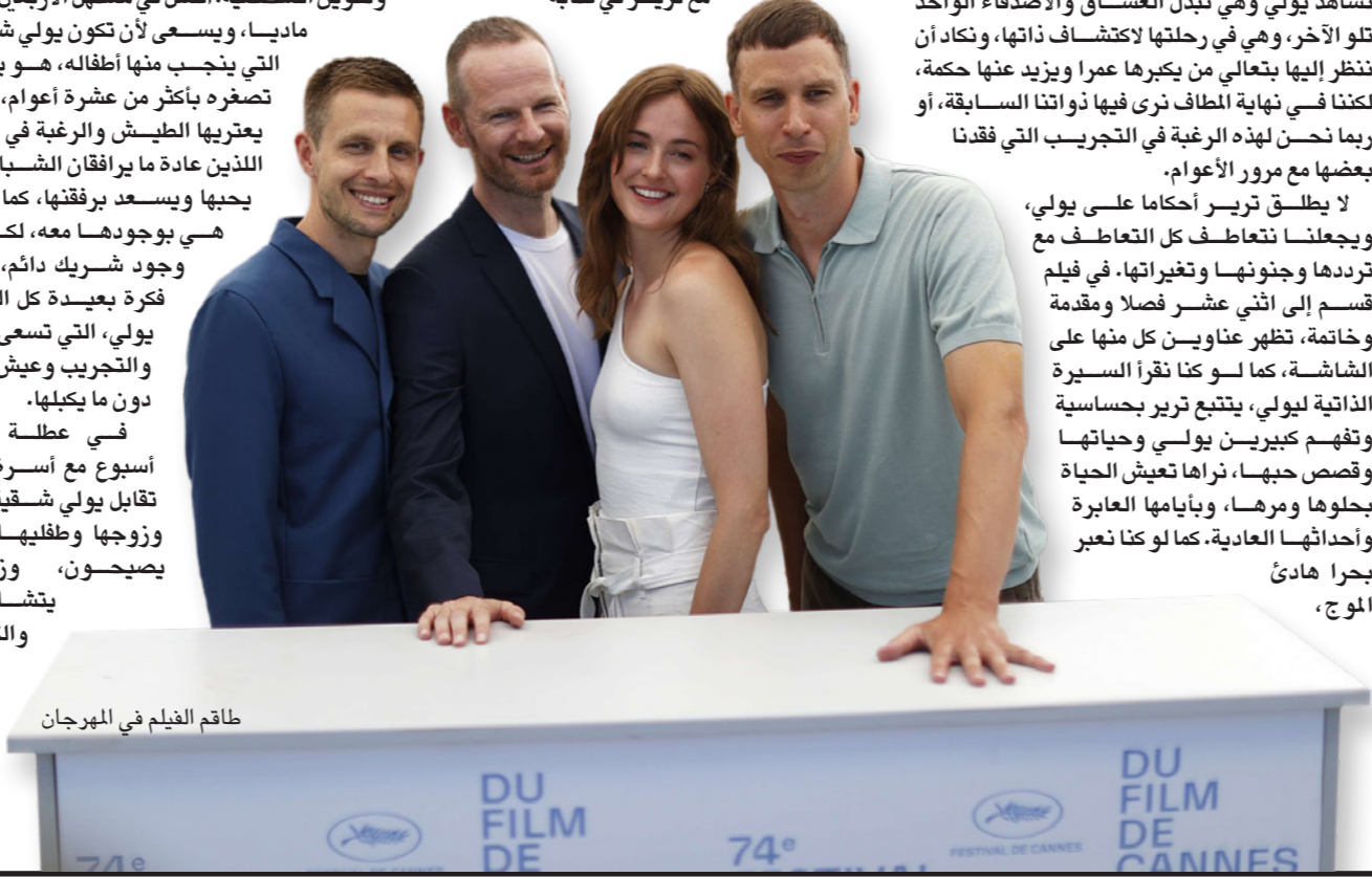
طاقم الفيلم في المهرجان

لا يطلق تريير أحكاما على يولي، ويجعلنا نتعاطف كل التعاطف مع يولي وتردها وجنونها وتغيراتها. في فيلم قسم إلى اثني عشر فصلا ومقدمة وخاتمة، تظهر عناوين كل منها على الشاشة، كما لو كنا نقرأ السيرة الذاتية ليولي، يتتبع تريير بحساسية وتقهم كبيرين يولي وحياتها وقصص حبها، تراها تعيش الحياة جلودها ومرها، وبأيامها العابرة وأحداثها العادية. كما لو كنا نعبّر بحرا هائئ الموج،