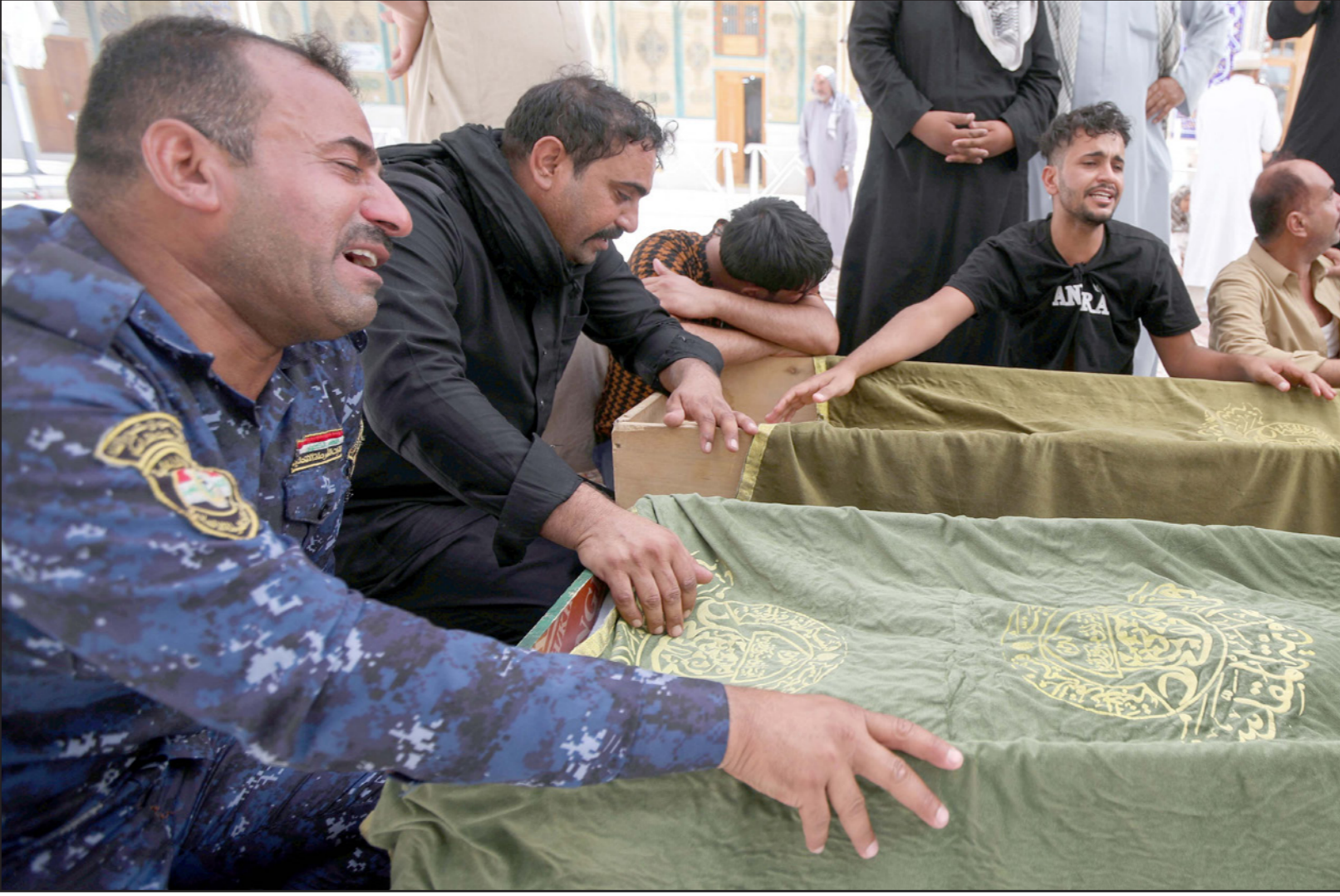
تشريح ضحايا سقطوا في حادثه حريق مستشفى الحسين