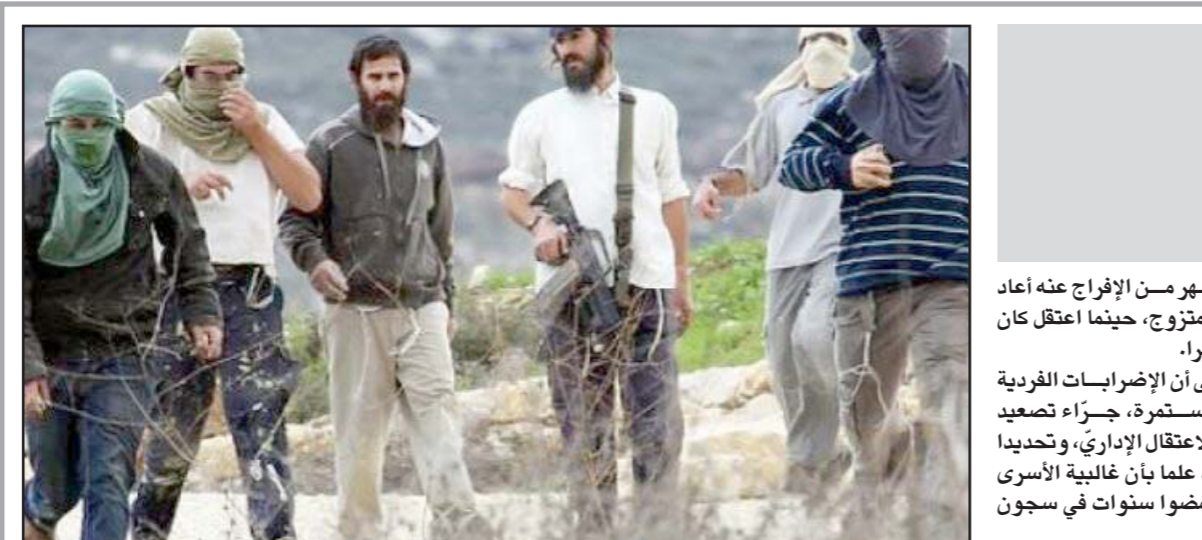
أرشيفية لمستوطنين يحرقون أشجار الزيتون

وافتتاح سفارة أبو ظبي في تل أبيب والرؤية المستقبلية لحل الصراع وبما يشير إلى ذلك، كانت تقارير عبرية قد زعمت أن الرئيس عباس هو من توسط في إجراء اتصال هاتفي بين الرئيس التركي رجب طيب أردوغان، والرئيس الإسرائيلي هرتسوغ، وأنه أبلغ الأخير بأن نظيره التركي يريد مهاجته قريباً. جاء ذلك بعد اللقاء الذي جمع عباس وأردوغان خلال زيارة الأول لتركيا قبل أيام، حيث كان الرئيس الفلسطيني قد أجرى اتصالاً بالبر الرئيسي الإسرائيلي من هناك، تلاه اتصالاً مع الرئيس الإسرائيلي هادي عمرو في رام الله. ووفق ما كشفه فإن الوزراء الذين تحفظوا على القرار هم وزير الجيش بيني غانتس، ووزيرة المواصلات، ميراف ميخائيلي، ووزير الصحة، نيتسان هوروفيتس، يضاف إليهم منسق أعمال حكومة الاحتلال في المناطق الفلسطينية، وبرر الوزراء تحفظهم في الفترة الحالية بسبب الوضع الحالي الصعب في السلطة الفلسطينية واقترحوا تأجيل التجديد. وحسب ما نشره فإن غانتس أيد توصية المنسق، وقال إن التوقيت ليس ناجحاً والمنح إلى حزب تاجيل القرار بتجميد الأموال. وانضم هوروفيتس وميخائيلي إلى أقوال غانتس، وقال أنها ستضعف السلطة خلافاً للصحة الإسرائيلية، فيما أيد وزير القضاء غديعون ساعر، القرار، وكذلك رئيس الحكومة نفتالي بينيت. يشار إلى أن قرار الاحتلال الجديد بتجميد أموال السلطة، سيدخل حيز التنفيذ مطلع شهر أغسطس/ آب المقبل، وسيتم خصم 50 مليون شيكل شهرياً من أموال الضرائب والجمارك التي تجبيها إسرائيل لصالح السلطة الفلسطينية، من المبالغ التي تمر عبر الموانئ الإسرائيلية للمناطق الفلسطينية، وذلك حسب اتفاق باريس الاقتصادي. ومن الواضح أن هذه المواقف الجديدة جاءت