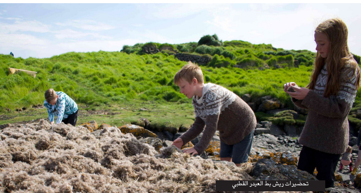
تحضيرات ريش بط العيدر القطبي

ففي حين لا تزال البصمة الكربونية المرتبطة بالنقل أقل من مستويات ما قبل الجائحة، فإن تلك المرتبطة بالطاقة يُتوقع أن تنتعش بشكل كبير.