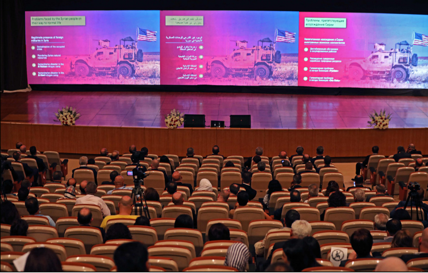
اجتماع سوري - روسي في دمشق من أجل عودة النازحين واللاجئين السوريين

التسوية تجنّباً للعمليات العسكرية. أما السيناريو الثاني فهو الخيار العسكري، فحاج إته من المحتفل أن يلجأ النظام السوري إلى الخيار الذي ينتشر فيها المقاتلون المحليون، وذلك في حال تعثر عملية الوصول إلى تسوية جديدة ورفض المقاتلين المحليين انتشار قوات النظام السوري بدون مواجهات. وفي حال اتجهت روسيا والنظام السوري للخيار العسكري، فمن غير المتوقع وفق المتحدث أن تكون المواجهات طويلة المدى بسبب عدم توفر مقومات المواجهة لدى المقاتلين المحليين، وغياب المساندة الإقليمية التي توفر الدعم اللوجستي، لكن ستتبعه حملات اعتقالات وتصفيات ضد المناضلين للنظام السوري، مع غياب أي هوامش للمقاتلين المحليين حتى على صعيد المشاركة في الجهاز الأمني.