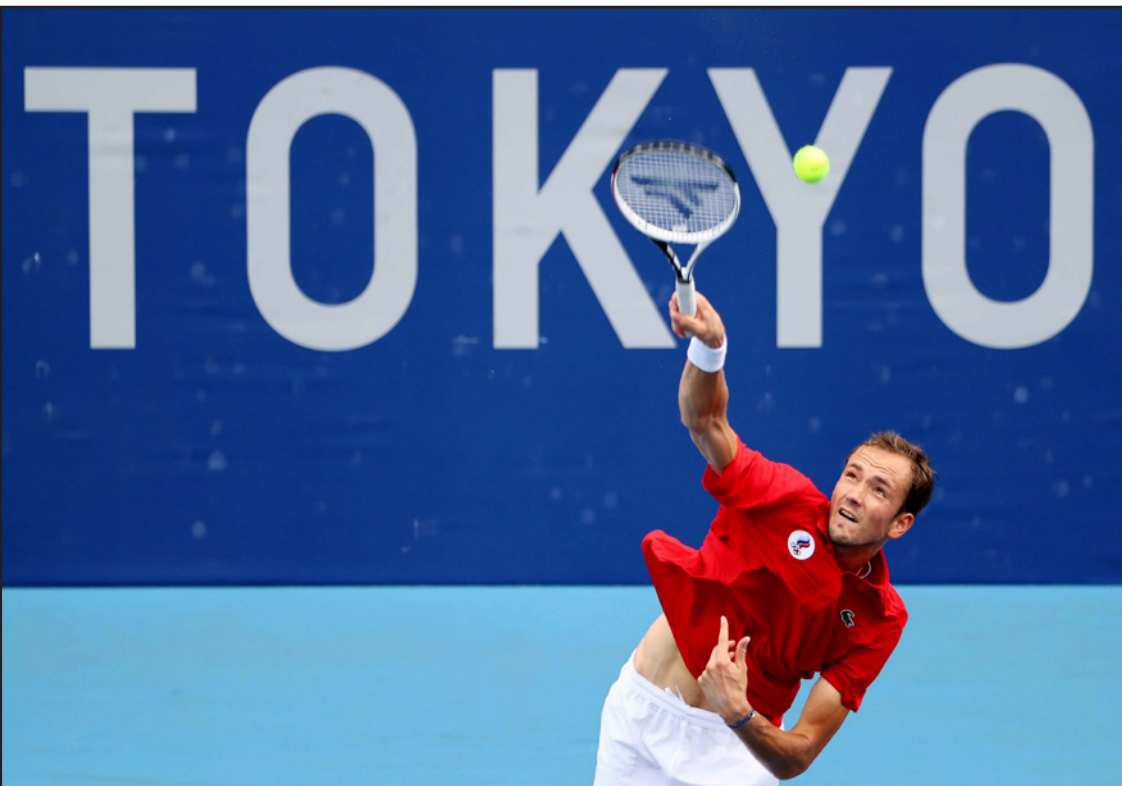
الروسي دانييل مدفيديف

في نصف النهائي صاحب الأرض الياباني كي نيشيكوري حامل برونزية ريو 2016 الفائز على البيلا روسي إييا إيفاشكا 6-7 (7/9)، 6-0، وأطاح الفرنسي أوغو أومبير بتسيستيباس معوضاً تأخره بمجموعة الـ 2-6، 6-7 (4)، 6-2. وكان تسيستيباس وصيف رولان غاروس طلب وقتاً مستقطعاً طيباً لإصابة في قدمه اليمنى مع نهاية المجموعة الثانية قبل أن يتدهور مستواه في الحاسمة.