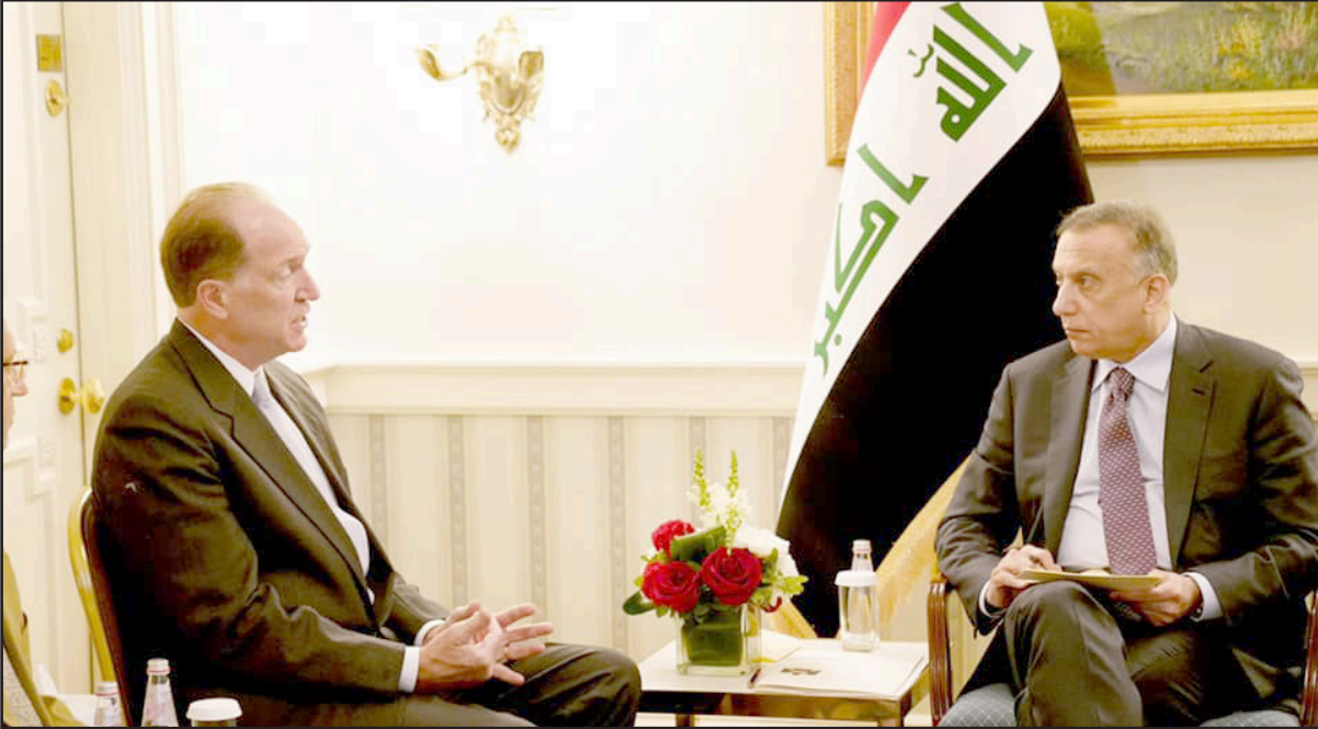
رئيس الحكومة العراقية مصطفى الكاظمي خلال لقاء رئيس مجموعة البنك الدولي ديفيد مالباس

إلى ذلك، يواصل الكاظمي والوفد العراقي المرافق له، عقد سلسلة لقاءات واجتماعات مع المسؤولين الأمريكيين في العاصمة واشنطن، إذ بحث الكاظمي، أخيراً، مع رئيس مجموعة البنك الدولي، ديفيد مالباس، والوفد المرافق له، إسناد جهود الحكومة العراقية في الإصلاح الإداري ومكافحة الفساد. وتكر المكتب الإعلامي لرئاسة مجلس الوزراء في بيان صحفي، مساء أول أمس، أن «جرى خلال اللقاء بحث التعاون المشترك في مختلف المجالات، وإسناد جهود الحكومة العراقية في الإصلاح الإداري ومكافحة الفساد، ودعم بناء القدرات للمؤسسات العراقية، وإصلاح القطاع العام، و جهود إصلاح القطاع المصرفي».