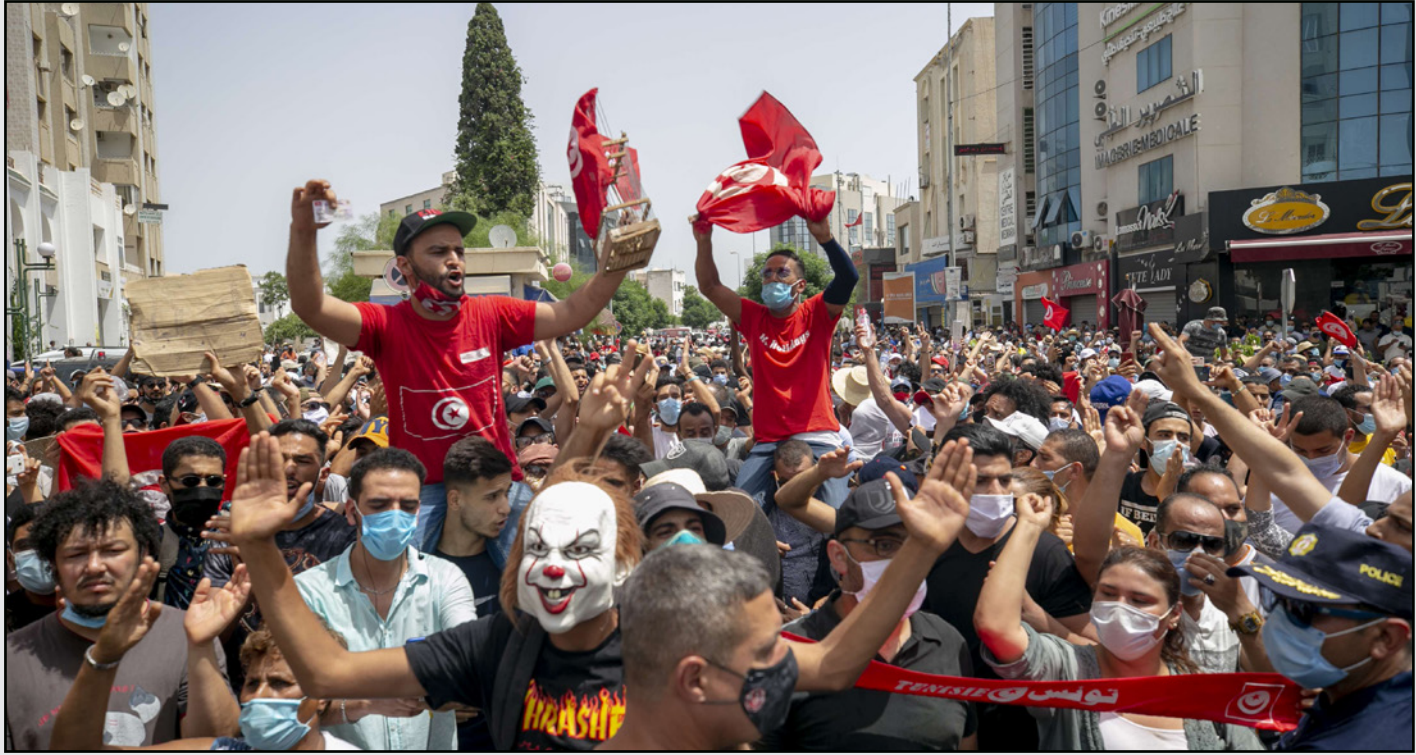
تجمع مئات التونسيين في أحد الشوارع القريبة من مقر البرلمان في العاصمة

في السنوات الماضية. ووسط أزمات اقتصادية وانتشار الحركة تصاعدت الدعوات لحل البرلمان التي يترجمها زعيم الحركة راشد الغنوشي، وقالت الصحفية إن تحرك سعيد لتجميد البرلمان وعزل رئيس الوزراء بعد احتجاجات يوم الأحد التي كانت موجهة ضد حركة النهضة تحديداً، وأظهرت لقطات فيديو المتظاهرين وهم يخربون مقرات الحزب المحلية، وخرج أنصار سعيد إلى الشوارع للاحتفال بقراراته. لكن النهضة اعتبرت في بيان لها يوم الثلاثاء، قرارات سعيد بالانقلاب، وطلب الغنوشي حوار أكبر ودعا سعيد للتراجع عن قراراته، ونقل موقع «مدى مصر» عن مسؤول لم تكشف عن هويته قوله إن مصر ترى في قرارات سعيد موجهة ضد النهضة والحد من تأثيرها السياسي الذي تأمل أن تكون نهاية الديمقراطية