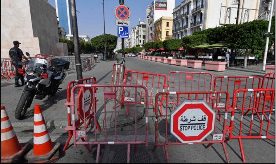
شارع الحبيب بورقيبة

وجاءت قرارات سعيد الأحد بعد نهار خلخلته تظاهرات واسعة في مدن عدة، مناهضة للحكومة