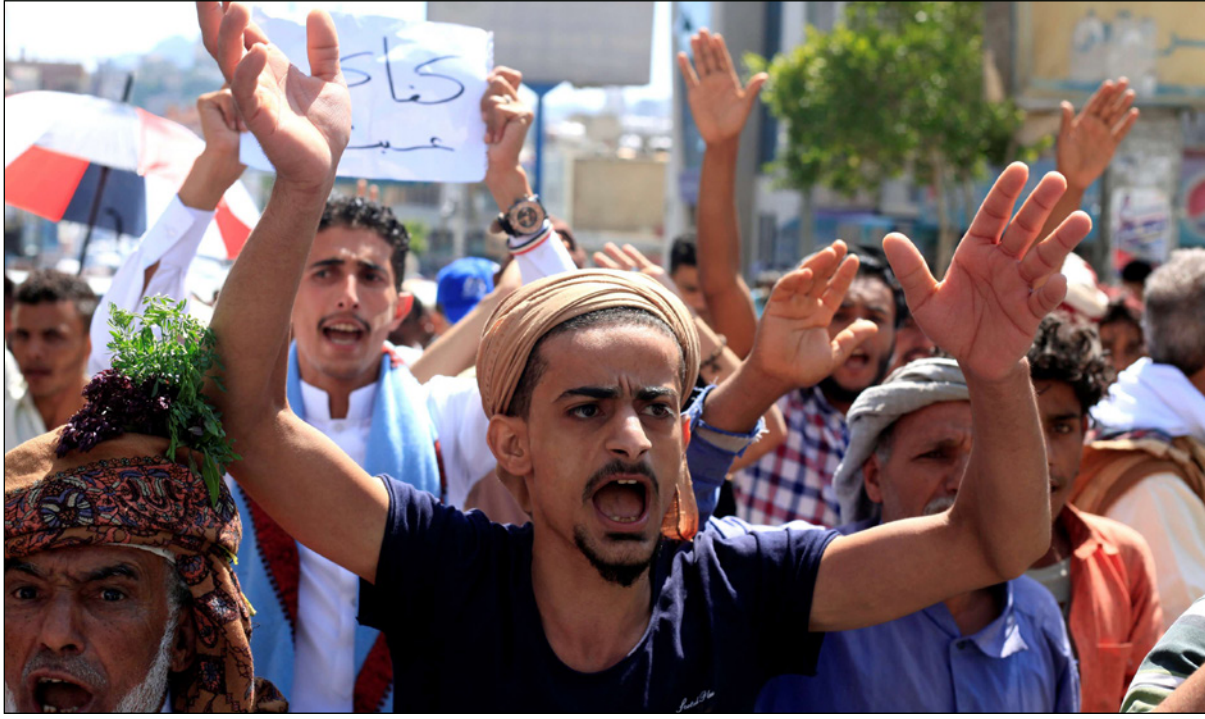
صورة من الأرشيف لاحتجاجات في اليمن بسبب تردّي الأوضاع الاقتصادية وتراجع قيمة العملة

تواجه المملكة العربية السعودية موجة استياء عارمة في اليمن جراء اتخاذها قراراً بطرد المغتربين اليمنيين من محافظاتها الجنوبية، من بينهم 106 أستاذة جامعيين، والذي سيتسبب في خلق كارثة معيشية على العمالة اليمنية هناك، وعلى أسرهم في اليمن الذين يدعمونهم مادياً، جراء انقطاع مصادر السعودية دوراً رئيسياً فيها. وعلمت «القدس العربي» من بعض المغتربين اليمنيين في الجنوب السعودي أن «جميع أفراد العمالة اليمنية الذين يعملون بشكل رسمي في مناطق عسير والباحة ونجران وجيزان في السعودية، تلقوا إشعارات من السلطات السعودية بإنهاء التعاقد معهم بدون سابق إنذار، وضرورة إنهاء أعمالهم خلال ثلاثة أشهر، ويتضمن ذلك إلغاء عقود مسالكهم المستأجرين فيها، وترحيل من لم يستطع الحصول على عقد عمل في مناطق أخرى بعيداً عن هذه المناطق الجنوبية».