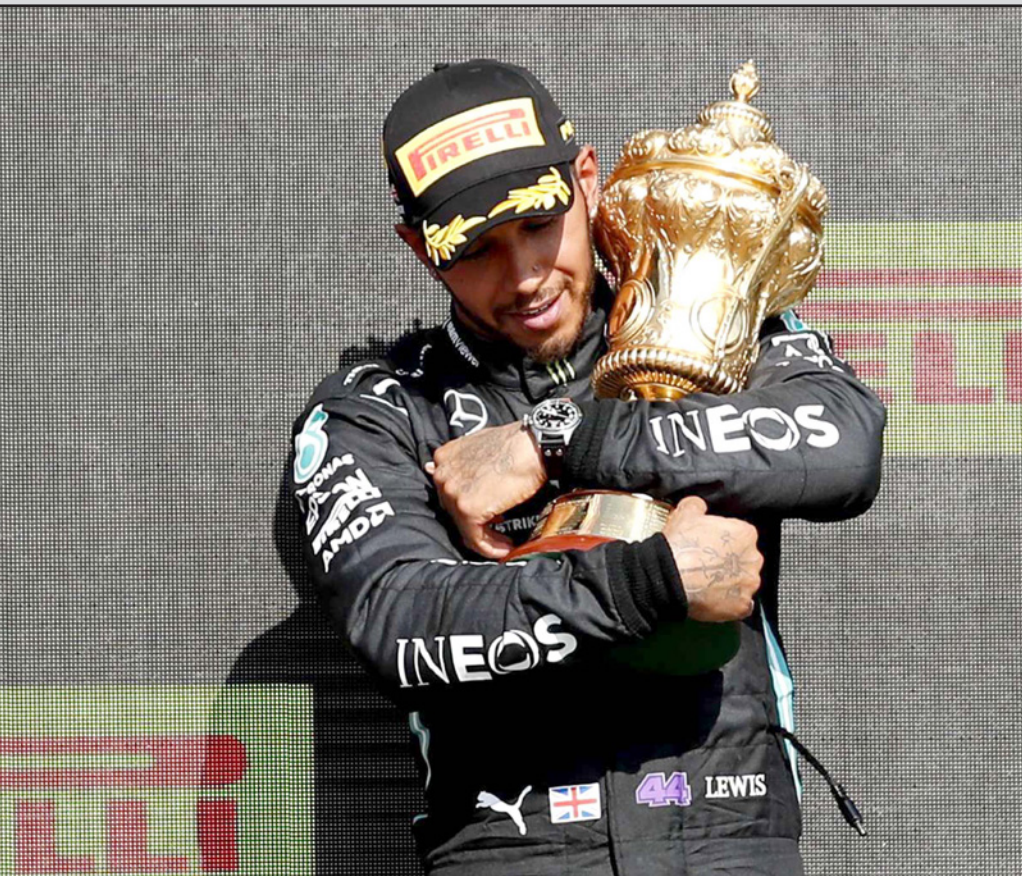
لويس هاميلتون يعانق كأس جائزة بريطانيا الكبرى