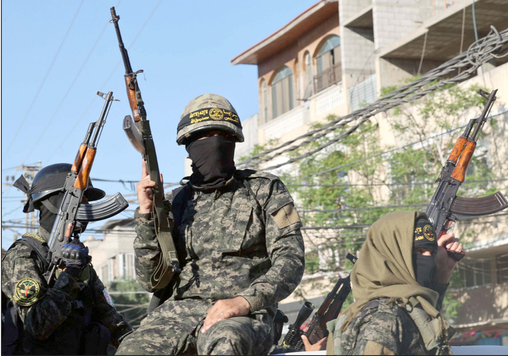
مسلحون فلسطينيون في رام الله