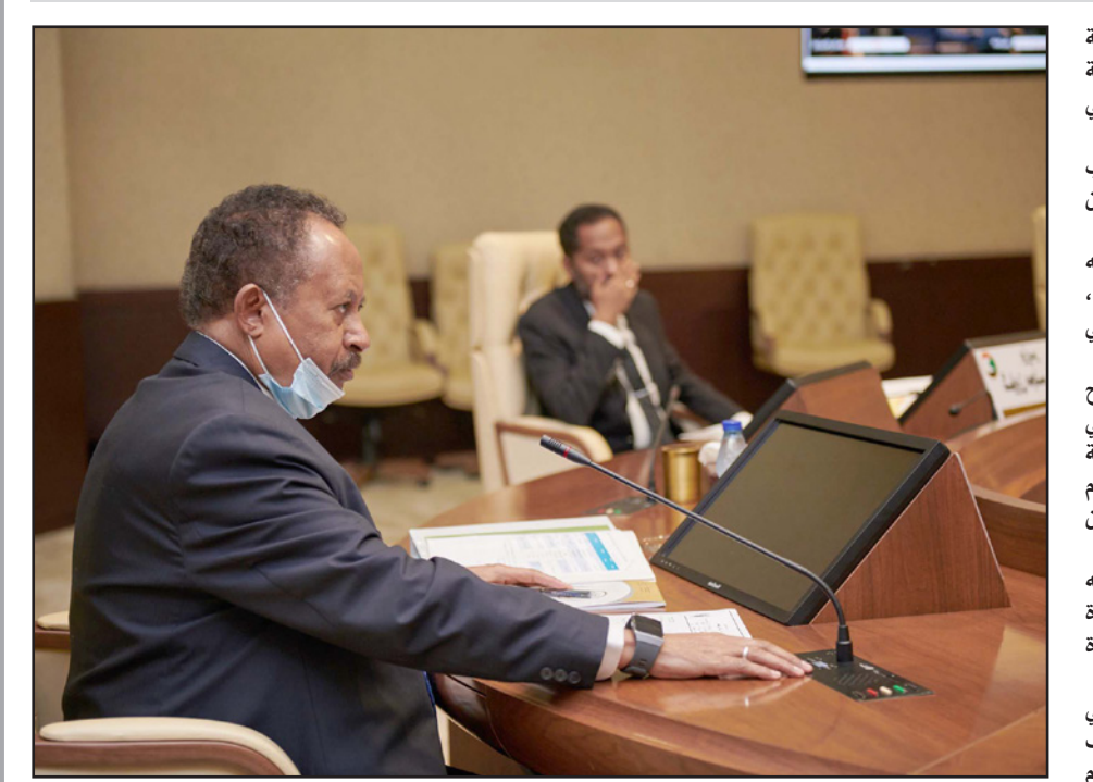
حمدوك خلال اجتماع مجلس الوزراء السوداني

الورطة لأن العمل جار لعقد مؤتمر الحكم والإدارة، لإجازة قوانين تفصل في العلاقة بين الأقاليم والمركز في السودان بشكل عام بما فيها دارفور نفسها، وهو عمل شارف على الانتهاء حسب علمي ولا أرى سببا للتعجيل لإجازة قانون مؤقت ونقوم بإجازته والغاء القديم». أقرب وقت ممكن». وأعلن حاكم إقليم دارفور أنه بصدد التحرك إلى الإقليم من أجل ممارسة مهامه. صدر سياسي رفيع من تحالف «الحرية والتغيير» قال لـ«القدس العربي»: «هذه مسألة مرتبكة تصل مستوى