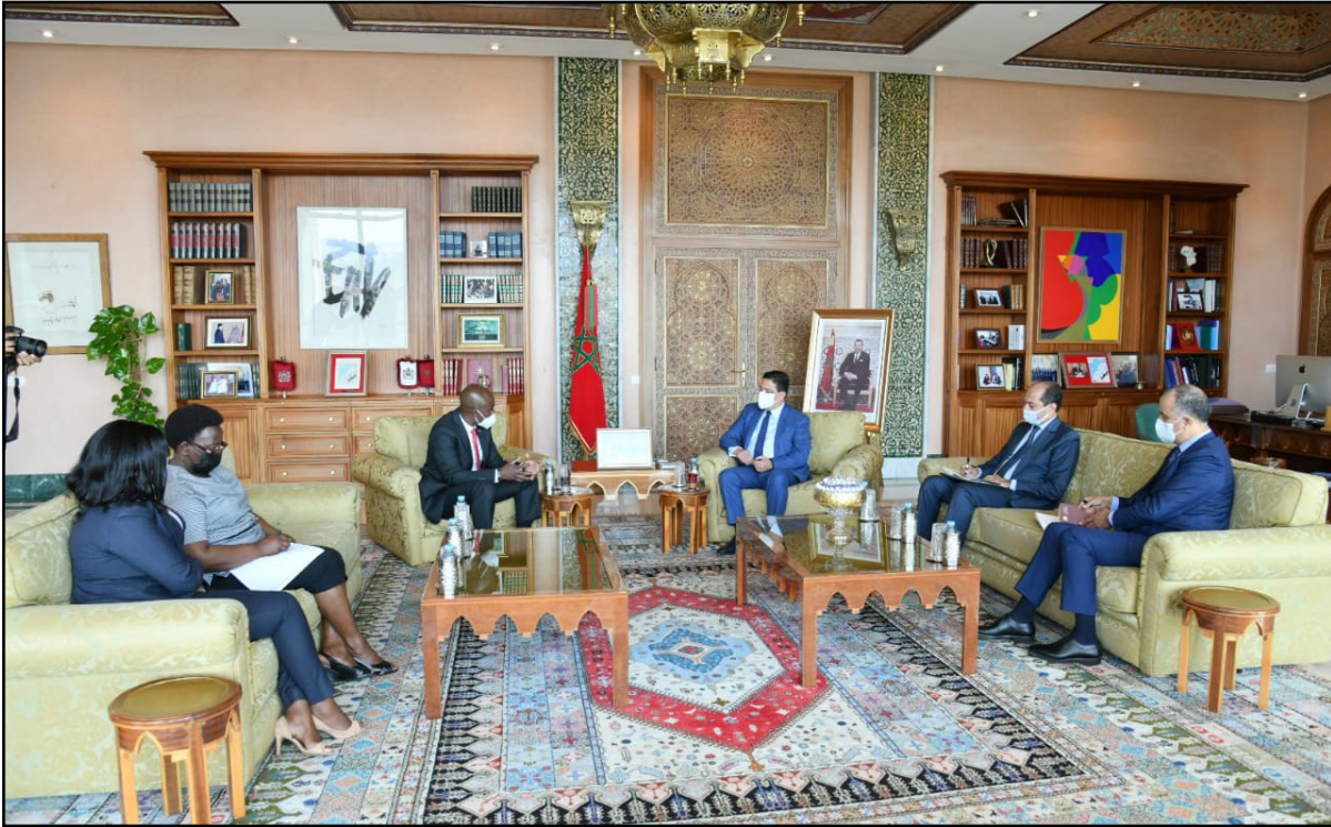
لقاء جمع وزير الخارجية المغربي ناصر بوريطة ومساعد وزير الخارجية الأمريكية لشؤون الشرق الأوسط جوي هود

ولدى منظومة «كورال» للحرب الإلكترونية القدرة على تشويش وخداع بل وتوقيف الرادارات المعادية عن العمل، إن يبلغ نطاق تشغيل منظومة كورال للحرب الإلكترونية حوالي 200 كم.