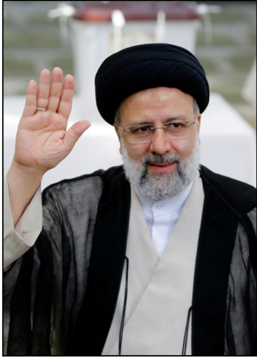
الرئيس الإيراني الجديد إبراهيم رئيسي

قال محرر الشؤون الدبلوماسية في صحيفة "التايمز" البريطانية روجر بويز في مقال له تحت عنوان "نجز الرئيس الإيراني الجديد عليه حراسة نفسه" في الصحيفة إن الرئيس الإيراني الجديد إبراهيم رئيسي يريد أن يفعل كل شيء بشكل مختلف عن سلفه، حسن روحاني، البراغمانتي الذي تابع تعليماً جامعياً في مدينة غلاسكو الأسكتلندية، والذي اعتقد أن بإمكانه استخدام الدبلوماسية لإرباك الغرب. وشدد الكاتب على أن الرئيس الجديد الذي برز بشكل لافت في إيران عليه ترسيخ قوته داخلياً وخارجياً لإرضاء الحرس الثوري، ولذلك سيتعين عليه أن يكون حذراً. وأشار إلى أن رئيسي الذي كان عضواً في لجنة الإعدامات، التي أصدرت أحكاماً بالإعدام في منتقدي النظام عام 1988، فاز في انتخابات يونيو/ حزيران الماضي "المزورة"، كما وصفها، باعتباره المرشح المفضل لدى المرشد الأعلى المريض آية الله علي خامنئي، وأن الاثنين يتفان معاً على أن جميع الاحتجاجات الكثيرة التي تصف بايران منها المتعلقة بأزمة نقص المياه، مرجعها إلى سوء الإدارة وانهايار الثقة بين القيادة والشعب.