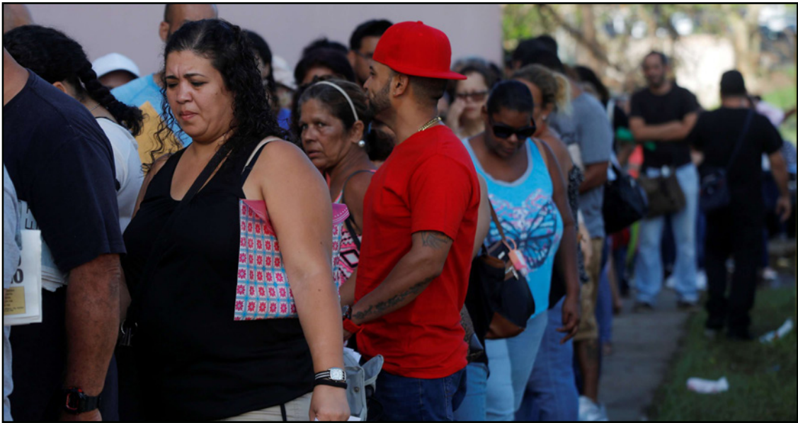
عاطلون عن العمل غالبيتهم من السود الأمريكيين وذوي الأصول اللاتينية ينتظرون دورهم للتقدم بطلبات توظيف