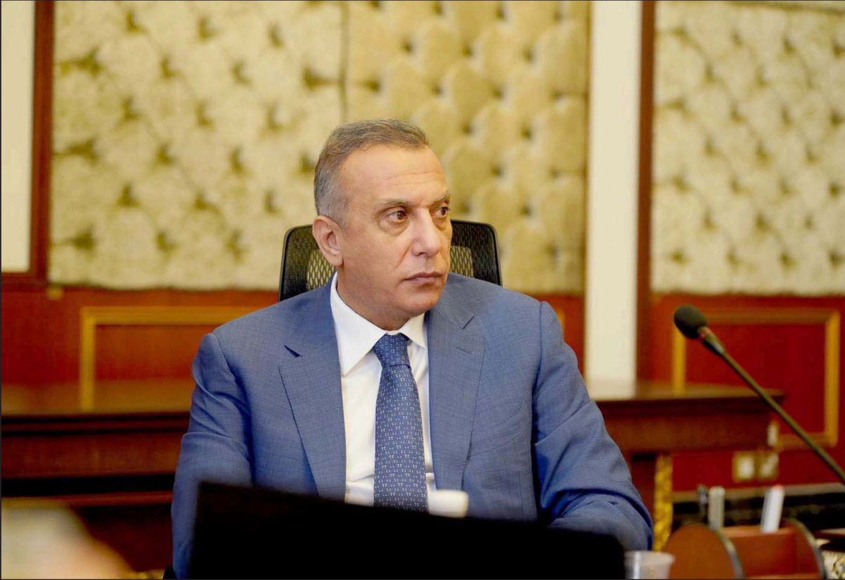
الكاظمي خلال اجتماع مجلس الوزراء للامن الوطني أمس

في سياق آخر يتعلق بالانتخابات، كشف الكاظمي، عن وجود استغلال لموارد الدولة في الحملات الانتخابية، فيما أشار إلى فتح تحقيق في هذا الموضوع. وقال الكاظمي، خلال جلسة مجلس الوزراء، والتي انعقدت مساء أول أمس، إن «هناك شكاوى عن وجود استغلال لموارد الدولة في الحملات الانتخابية من قبل وزراء مرشحين أو من قبل مسؤولين لديهم نفوذ في الدولة»، مشدداً على ضرورة أن «لا يكون هناك تدخل في المسؤولية التنفيذية في هذه الحكومة، التي تؤكد دوماً أنها حكومة خدمات وافعال، وتعدنا أن نكون محايدين مع الجميع».