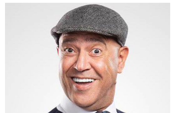
القاهرة - «القدس العربي»