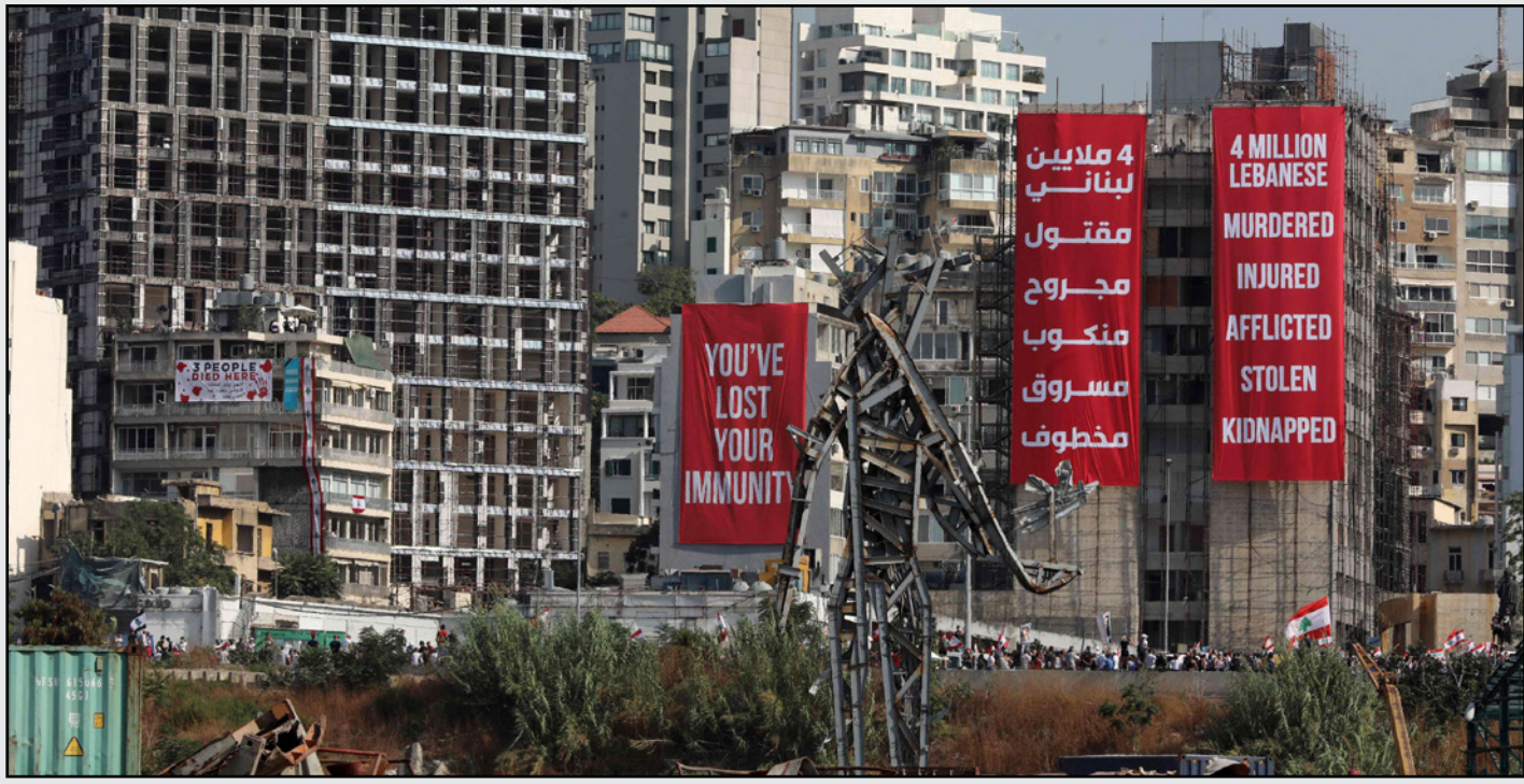
إفلات معلقة على مبنى تضرر خلال انفجار مرفأ بيروت العام الماضي