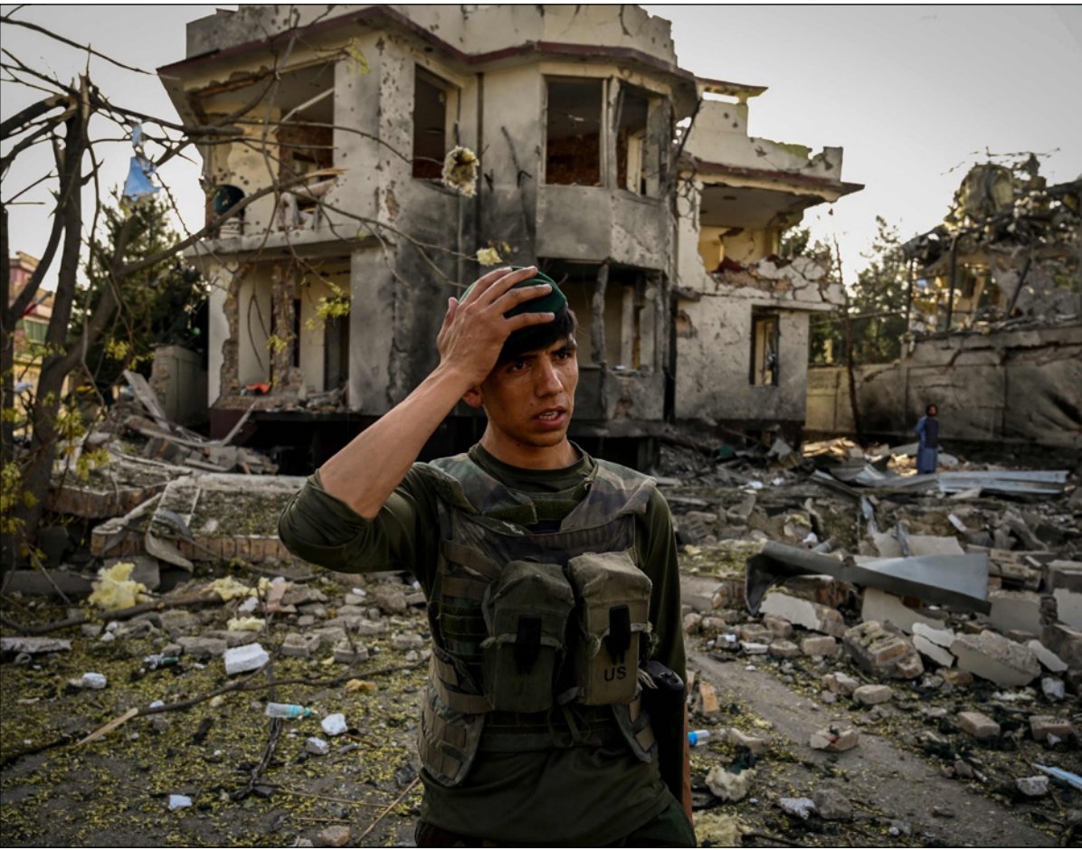
رجل من أفغاني يقف في موقع انفجار السيارة المفخخة في كابول والذي أعلنت طالبان مسؤوليتها عنه

جميع الأطراف التزاماتها بموجب القانون الإنساني الدولي في جميع الظروف، بما في ذلك تلك المتعلقة بحماية المدنيين». واستولت حركة طالبان في الأشهر الثلاثة الأخيرة على مناطق ريفية شاسعة ومعابر حدودية رئيسية خلال هجوم حافظ بشرته مع بدء انسحاب القوات الأجنبية الذي ينبغي