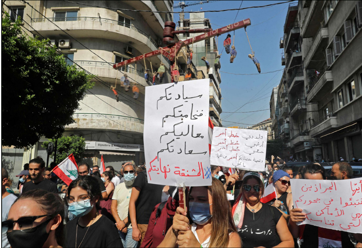
مظاهرة الذكرى الأولى للانفجار الذي عصفت بالمناء وبيروت أمس

وكانت وحدات الجيش اللبناني قد أوقفت عددا من الشبان في وقت سابق أمس أثناء توجيههم للمشاركة في الذكرى السنوية الأولى لانفجار مرفأ بيروت وبحوزتهم أسلحة وذخائر. وأقدم عدد من الناشطين التوجهين إلى بيروت للمشاركة في الذكرى السنوية لانفجار مرفأ بيروت على إقبال أوتوستراد زوق مصيبح في جبل لبنان، احتجاجاً على توقيف القوى الأمنية أحد الناشطين، بعد تفتيش سيارته والعثور فيها على مواد ممنوعة قبل أن يعيد الجيش فتح الأوتوستراد. وقد حصلت «القدس العربي» على برنامج مسيرات وتحركات