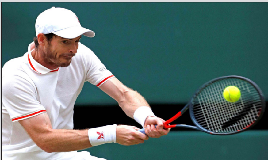
البريطاني أندي موراي

■ برلين - د ب أ: قال منظمو في وقت متأخر مساء الثلاثاء، إن لاعبة التنس اليابانية، ناومي أوساكا، المصنفة الثانية عالميا، لن تشارك في بطولة مونتريال للتنس والتي تنطلق الأسبوع المقبل، وذلك عقب عودتها للمشاركة في البطولات من خلال منافسات دورة الألعاب الأولمبية طوكيو 2020. وقالت أوساكا: "أشعر بالأسف للغاية عن بطولة مونتريال هذا العام، خالص تمنياتي للجماهير هناك وللبطولة والمسؤولين، أتمنى أن أراكم جميعا في كندا العام المقبل". وكانت أوساكا/ 23 عاما/ انسحبت من بطولة فرنسا المفتوحة رولان جاروس وغابت عن بطولة ويمبلدون، وذلك من أجل صحتها الذهنية، لكنها أشعلت المرسل الأولمبي في حفل افتتاح دورة طوكيو قبل العودة للمنافسات مرة