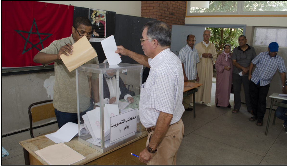
انتخابات الغرف المهنية في المغرب (أرشيفي)

وسعى إلى تطوير القدرات الخاصة بالمنتمين في الغرف المهنية، يسعى كل طرف حزبي للفرز بأقصى عدد من المقاعد لكل فئة من الغرف، وهكذا، يدخل