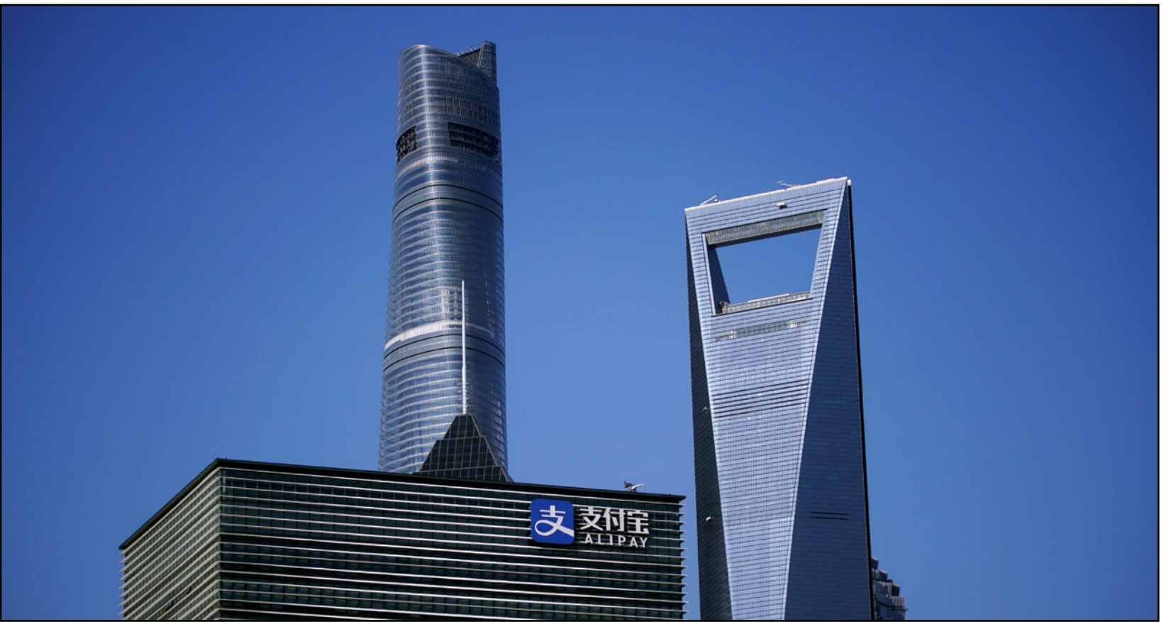
مقر مجموعة «علي بابا» الصينية في مدينة شنغهاي

■ شنغهاي - أ ف ب: أعلنت مجموعة «علي بابا» الصينية الرائدة في مجال التجارة الإلكترونية عن تسجيل أرباح أقل، لكن مع الحفاظ على نمو العائدات، ما يشير إلى أن التدابير الصارمة التي تفرضها الحكومة على كبرى الشركات الصينية، ليس لها تأثير يذكر على الأعمال الأساسية للمجموعة. وقالت المجموعة إن صافي إيراداتها في الفترة الممتدة بين نيسان/أبريل وحزيران/يونيو بلغ 45.1 مليار يوان (سبعة مليارات دولار)، أي بانخفاض بنسبة 5 في المئة على أساس سنوي. وكانت «علي بابا» ومقرها هانغتشو أول عمالقة التكنولوجيا في الصين، ممن طالتهن حملة شنتها حكومة باتت تخشى نموهم السريع وأمن البيانات. في نيسان/أبريل، فرضت سلطات مكافحة الاحتكار غرامة قياسية على «علي بابا» قدرها 2.78 مليار دولار، ما كبدها خسائر تشغيلية قلما تحدث، في الفترة من كانون الثاني/يناير إلى آذار/مارس. وهذا، اتخذت الحكومة عدداً من التدابير في حق شركات رقمية صينية عملاقة، ما تسبب بتدهور أسعار أسهمها. وتأتي إيرادات «علي بابا» في غالبيتها من منصات تجارتها