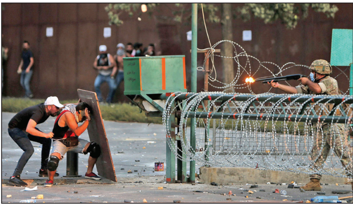
جندي لبناني يطلق النار فيما يحتمي متظاهران من المطلقات خلال اشتباكات في العاصمة بيروت أمس

وفي المناسبة، ترأس الطيريرك الماروني مار بشارة بطرس الراعي قداساً في مرافئ بيروت شارك فيه فقط اهالي الضحايا، في وقت كانت مجموعات المجتمع المدني تتجمع في محيط المرفأ عند تمثال الغزير وفي ساحة العازارية حيث حاولوا الدخول بمحاولة اقتحام مبنى المجلس النيابي مستخدمين الأدوات الحادة، ولدى تصدى القوى الأمنية لهم بجرايطم المياه والقبائل المسيلة للدموع رشقوها بالحجارة التي طالت محيط البرلمان، ونتاج عن المواجهات سقوط عدد من الجرحى، في وقت توجه محتجون إلى مبنى العازارية حيث حاولوا الدخول إلى مبنى وزارتي الاقتصاد والبيئة، وقد طلبت قوى الأمن الداخلي من المظاهرين السلميين الخروج فوراً من الأماكن التي تحصل فيها الاعتداءات حفاظاً على سلامتهم.