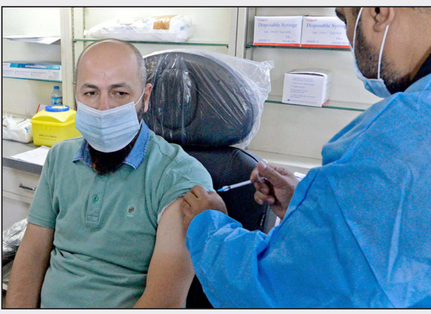
عراقي يتلقى لقاح كورونا في مستشفى في الموصل

وتابعت أن «الزيادة تعرض البلاد للدخول في موجة رابعة أشد وأخطر من سابقتها». إلى ذلك، أعلنت وزارة الصحة والبيئة، تقديم توصية إلى اللجنة الوطنية للصحة والسلامة الوطنية، بفرض حظر شامل يستمر أسبوعين بسبب الضغط الهائل لأعداد المصابين في المستشفيات والحالات الحرجة. وقال مدير الصحة العامة، رياض الحلفي، إن