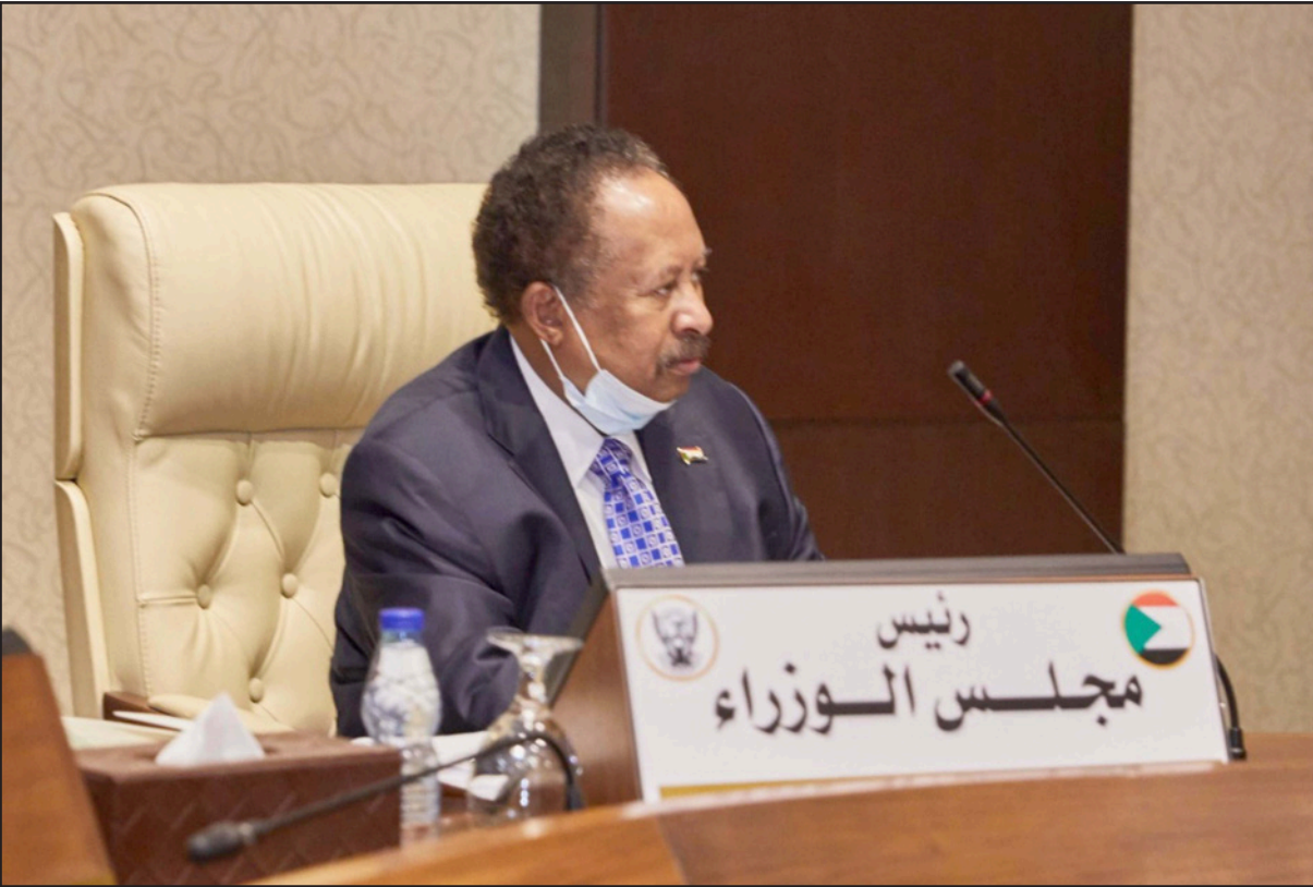
حمدوك خلال اجتماع الحكومة أول أمس

الأخيرة للسودان في يونيو الماضي. ووقعت 43 دولة أفريقية على اتفاقية روما، فيما صادقت عليها 34 دولة، وهو ما يجعل أفريقيا المنطقة الأكثر تميزاً في تشكيل المحكمة، حسب مسؤوليها، ومنذ إنشائها وجهت المحكمة الجنايات لثلاثين شخصاً، جميعهم أفارقة، جبرائيل وقعت في ثمانين دول أفريقية هي الكونغو الديمقراطية وجمهورية أفريقيا الوسطى وأوغندا والسودان (دارفور) وكينيا وليبيا وساحل العاج وغانا. وكانت المحكمة الجنائية الدولية اقترت اعتماد التهم الموجهة إلى أحد أبرز قادة الميليشيات في دارفور، وهو علي محمد علي عبد الرحمن، والمعروف بـ «علي كوشيب» ارتكاب جرائم حرب وجرائم ضد الإنسانية، وإحالة إلى المحاكمة أمام دائرة ابتدائية، لواجه 31 اتهاماً.