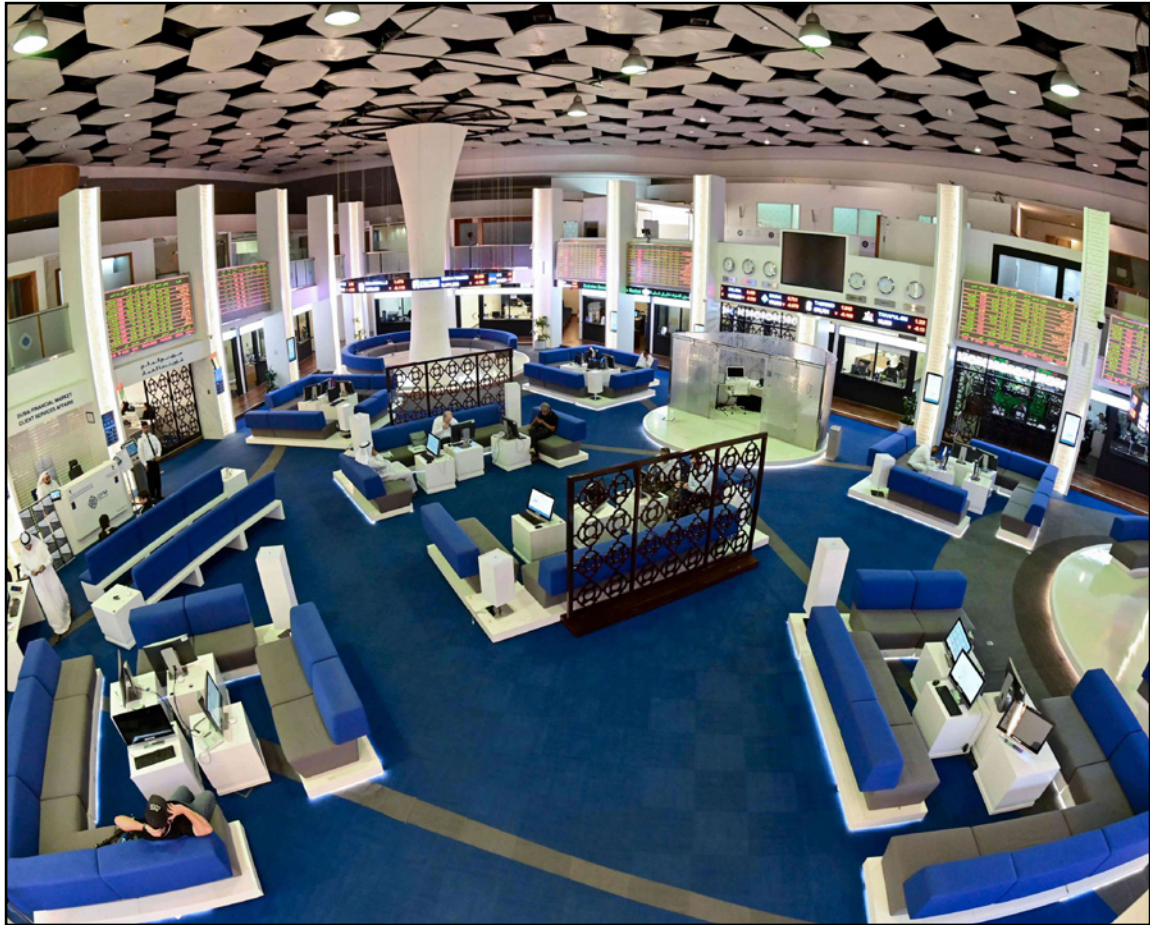
قاعة المعاملات في بورصة دبي (أرشيفية)

من جهة ثانية أعلن "بيت التمويل الكويتي" أمس أن صافي الربح زاد إلى 52 مليون دينار (173.37 مليون دولار) في الفترة المنتهية في 30 يونيو/حزيران من 12.6 مليون قبل عام.