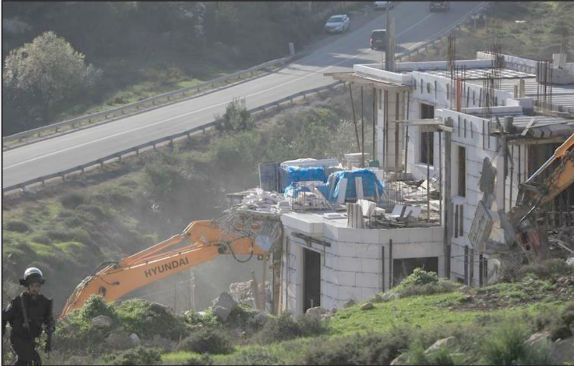
قوات الاحتلال تهدم منشآت في الأغوار الشمالي