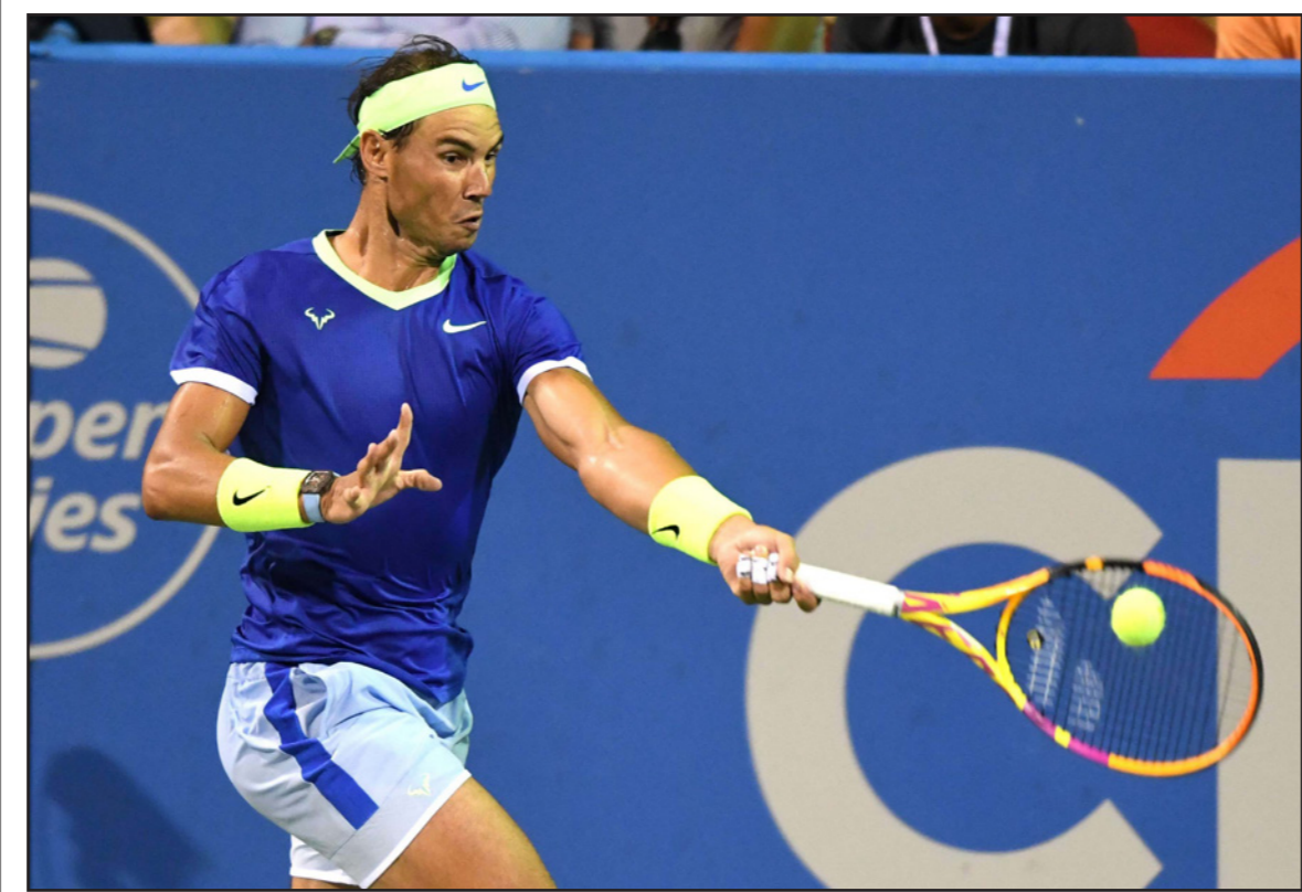
الاسباني رايفيل نادال

■ لندن - د ب أ: أعلن الاتحاد الأوروبي لكرة القدم (يويفا) أمس الخميس عن تطبيق تقنية حكم الفيديو المساعد (فار) خلال مباريات تصفيات أوروبا المؤهلة لنهائيات كأس العالم 2022 المقرر إقامتها في قطر، وذلك ابتداء من الشهر المقبل. ونكرت وكالة الأنباء البريطانية (بي بي إيه) ميديا) أنه بعد الإشادة واسعة النطاق التي حظي بها (فار) في منافسات أمم أوروبا (يورو 2020)، فإن (يويفا) يأمل في الحفاظ على تلك المعايير في تصفيات المؤهلة، في الوقت الذي تنتهي فيه مرحلة المجموعات في شهر تشرين ثان / نوفمبر المقبل.