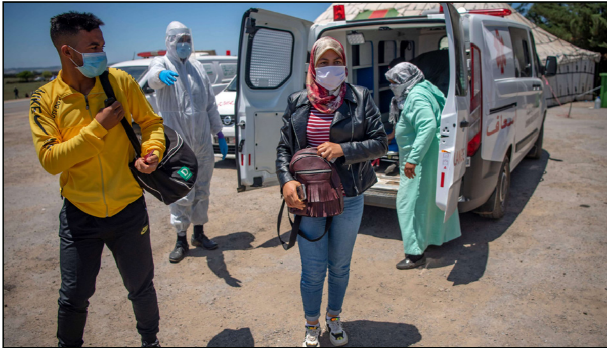
سيارة إسعاف مغربية تقوم بنقل مصابين بفيروس كورونا

تكدت صحيفة "الأخبار" أن وزارة الصحة أعلنت حالة استنفار قصوى لجميع مصالحها، بسبب ظهور مؤشرات خطيرة حول تدهور الوضع الوبائي، خلال الأسابيع المقبلة، وكشفت مصادر مطلعة أن الوزارة ستستعين بإقامة مستشفيات ميدانية في المدن الكبرى التي تعرف