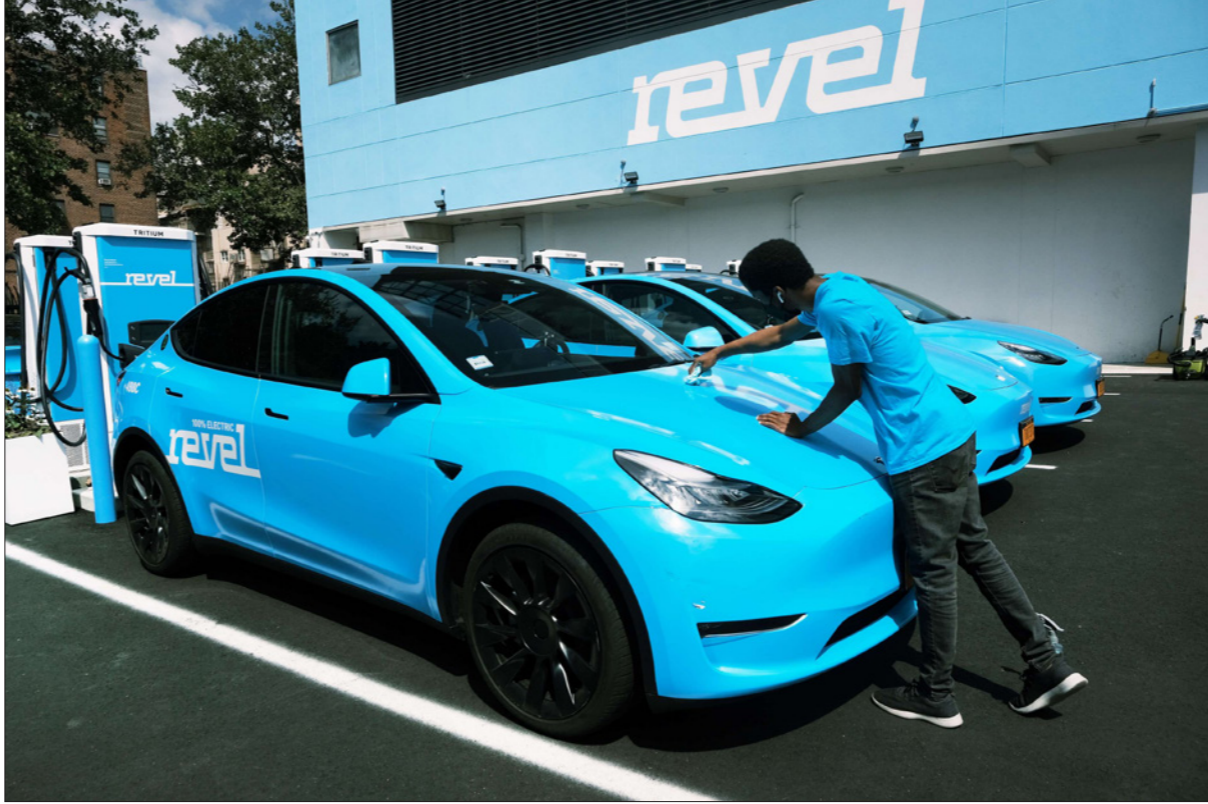
سيارة تسلا تزود بالتيار الكهربائي في محطة شحن في نيويورك

■ واشنطن - أف ب: كشف الرئيس الأمريكي أسس الخميس خطته لجعل صناعة السيارات الأمريكية أكثر مراعاة للبيئة في مواجهة منافسين صينيين وأوروبيين شرسين، مع زيادة مبيعات السيارات الكهربائية وتشديد الضوابط البيئية التي خففها سلفه دونالد ترامب. ويهدف جو بايدن أن يكون نصف السيارات التي تباع في الولايات المتحدة بحلول 2030 م بدون الانبعاثات الكربونية، ما يشمل السيارات الكهربائية والسيارات الهجينة (هايبريد) التي تعمل بالبطاريات الكهربائية أو الهيدروجين، وفق وثيقة كشفها البيت الأبيض.. وحسب الوثيقة يعزّم «وضع أمريكا في موقع يمكنها من قيادة مستقبل السيارات الكهربائية، وتحظى الصين، التي تستثمر في هذا النوع من السيارات وتنتج وتبيع منها بشكل مكثف، وفي الوقت نفسه «مواجهة الأزمة المناخية»، من جهتها، أكدت الشركات الأمريكية الثلاث الكبرى للسيارات، وهي «فورد» و«جي إم» وستيلانتيس» للملكة علامة «كرايزلر» التاريخية، في بيان مشترك «طموحا المشترك في التوصل بحلول 2030 إلى ما بين 40 و50 في المئة، من مبيعات السيارات في الولايات المتحدة من هذه الفئة.