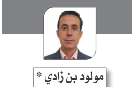
مولود بن زادي *

إضافة إلى كل الأحداث والشهادات، يعد تقرير اللجنة الطبية الرسمية خير دليل على ما كانت تعانيه مي من مشاكل عقلية. فبعدما ساء وضعها، مثلما ذكر كامل الشناوي «رأى أهلها أن يعرضوها بالقوة على «كونسلتوره» من الأطباء الإخصائين، وقرّر الأطباء وجوب إقامتها في مستشفى للأمراض العصبية واختاروا لها مستشفى العصفورية في لبنان». وفي المستشفى، لم يفحص مي زيادة طبيب واحد حتى نشك في نزاهته، وإنما فرق من الأطباء أجمعوا على وجوب مكوثها في المستشفى لعلاجها. تقرير اللجنة الطبية المستقلة لا يدع مجالاً للشك في معاناتها، ولا يقلل الجدل لأنه صادر عن فريق من المختصين، وتضمن الطبيب مارتان، والدكتور كلميت، والدكتور جورج ملر. استخلصت اللجنة في تقريرها بعد فحص تفصيلي للسجلات والأعراض البادية على المريضة، ومراجعة تاريخ المرض، والإطلاع على تقارير الأطباء الذين عالجوها، أن «مي زيادة أصيبت بنوبة من نوع المالبوليا المتواصل، مع رفض الطعام واضطراب ذهني وفقدان الإرادة مع ملازمة فكرة الاضطهاد لها، فكان من الطبيعي أن