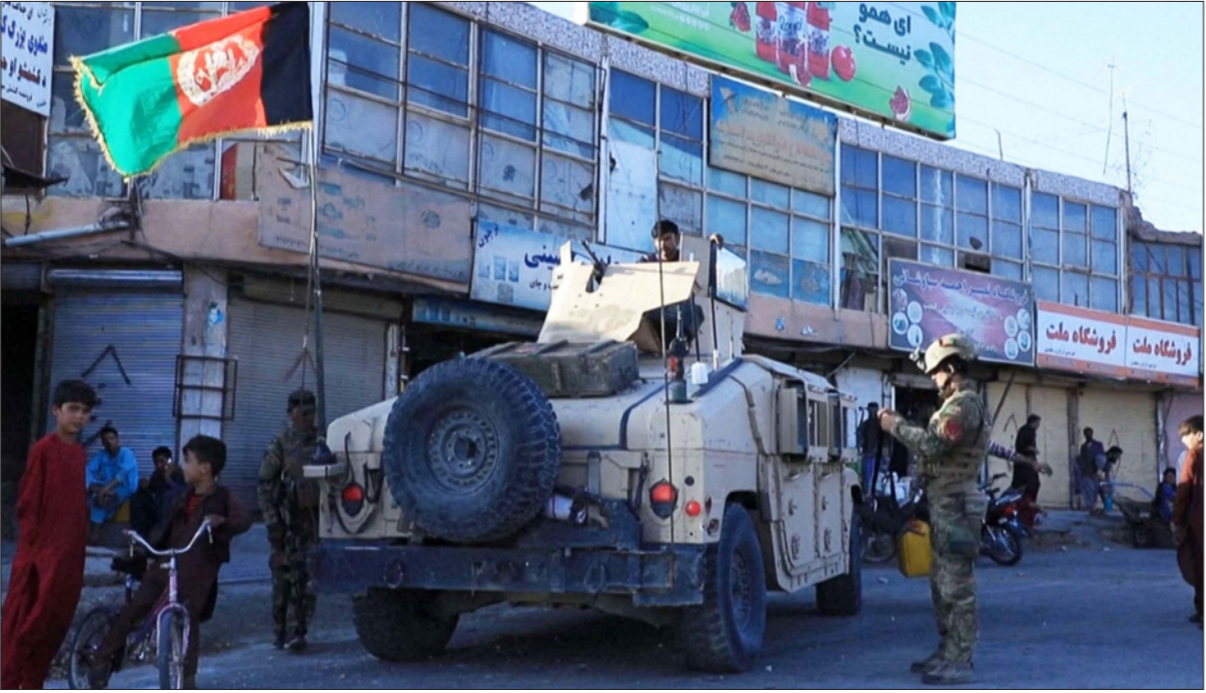
مقطع من فيديو يظهر عناصر من القوات الأفغانية الخاصة وهي تقوم بدوريات في شوارع مدينة هرات

وفي السياق الميداني، أعلنت طالبان في بيان، الخميس، سيطرتها على مقر مديرية كُغ بولاية نيمروز في غرب البلاد، بينما