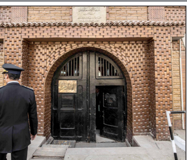
ضابط شرطة مصري أمام مدخل سجن طره في القاهرة

وسبق لمنظمة «العضو الدولية»، أن دعت السلطات المصرية للسماح بالزيارات العائلية لجميع المعتقلين، بمن فيهم المدافعون عن حقوق الإنسان والنشطاء السياسيين.