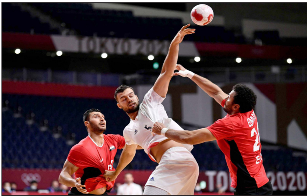
نديم رميلي نجم منتخب فرنسا (وسط) يحاول التسديد في مرمى مصر

■ طوكيو - د ب أ: أهدر المنتخب المصري فرصة جيدة لبلوغ النهائي في مسابقة كرة اليد (رجال) بدورة الألعاب وخسر أمام نظيره الفرنسي 23/ 27 أمس الخميس في الدور قبل النهائي للمسابقة. وتأهل المنتخب الفرنسي إلى المباراة النهائية التي يلتقي فيها غدا السبت مع الفائز من المباراة الأخرى في الربع الذهبي والتي تجمع بين منتخبي إسبانيا والندسارك. وبذلك، يخوض المنتخب الفرنسي المباراة النهائية في الأولمبياد للدورة الأولمبية الرابعة على التوالي حيث سبق له الفوز بالذهب في أولمبياد 2008 بكين 2012 وبلندن فيما حمل ثانيا وفاز بالميدالية الفضية في أولمبياد ريو دي جانيرو 2016. وفي المقابل، ما زالت الفرصة سانحة أمام المنتخب المصري (أحفاد الفرانعة) لحصد أول ميدالية أولمبية في تاريخه عندما يخوض مباراة تحديد المركز الثالث على الميدالية البرونزية غدا السبت. وخاض الفرانعة اليوم فعاليات المربع الذهبي في الأولمبياد للمرة الأولى في تاريخهم. وقدم الفريقان أداء متكافئا منذ الدقيقة الأولى في المباراة وإن عاند الحظ المنتخب المصري في أكثر من كرة ليحصى الدرع وعلي زين وأحمد الدفاع الفرنسي رقابته على لاعب الدائرة المصري هاشم ممدوح كما تألق حارس الرمي الفرنسي نفسان جيرار في التصدي للعديد من الكرات. ورغم التقدم الواضح للفرانعة في بداية الشوط، انتهى هذا الشوط بالتعادل 13/ 13.