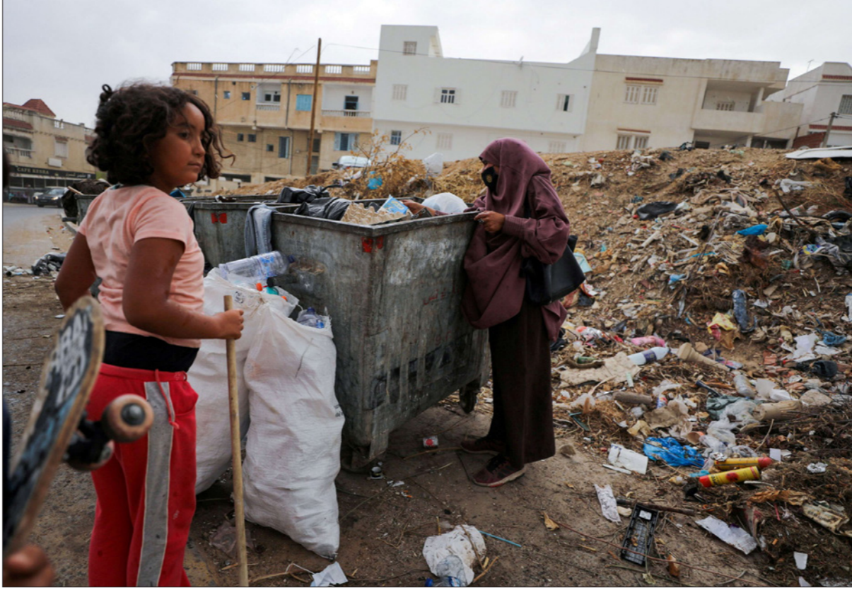
أم تونسية وابنتها تبحثان في مكب نفايات عن أشياء بلاستيكية ليبيعهن لتأمين قوت العائلة

الأول 2021، مع استمرار الضغوط الناتجة عن جائحة كورونا، ويطء عمليات التلقيح محلياً، واستمرار غلق مرافق حيوية كالمساحة.