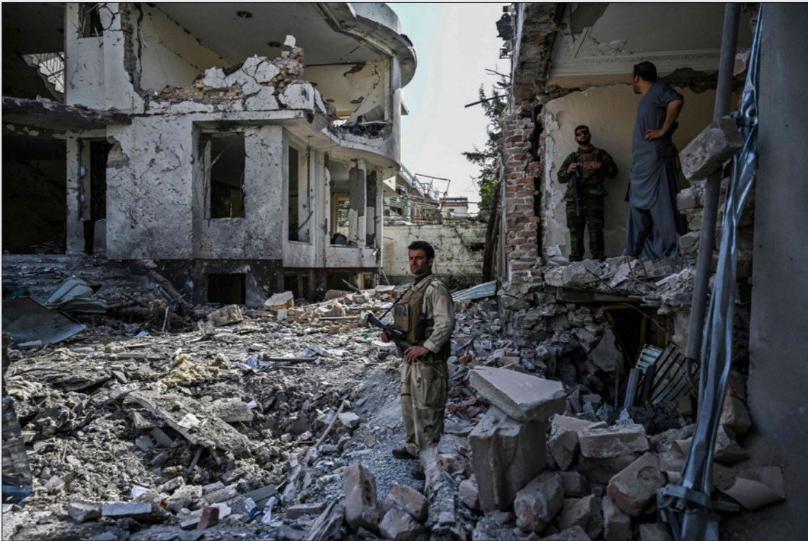
أفراد من الأمن الأفغاني يتفقدون موقع انفجار السيارة المفخخة في كابول أمس الأول

هذه القضية، فهو الذي تنازل عن كل شيء -أو تقريباً- لطالبان من أجل التمكن من التفاوض على الانسحاب من أفغانستان، بسرعة قبل الانتخابات الأمريكية، محاولاً أن يوضح أن الحركة قد تغيرت، وشكلاً قوة يمكن للمرء أن يتفاوض معها. لكن الصحيفة الفرنسية أوضحت أن