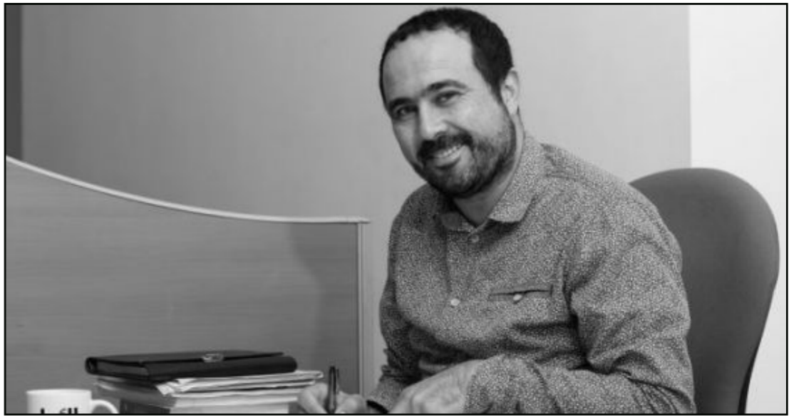
الصحافي المعتقل سليمان الريسوني