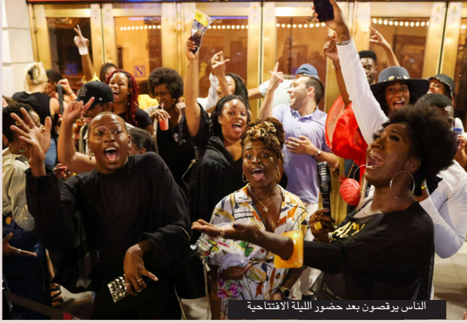
الناس يرقصون بعد حضور الليلة الافتتاحية

■ نيويورك- رويترز: افتتح مساء الأربعاء أول عرض مسرحي في برودواي منذ أن أغلقت جائحة كورونا العام الماضي المسارح في مدينة نيويورك، فيما تعين على الجمهور الحصول على التطعيم ووضع الكمامات من أجل الحضور. وبيعت جميع تذاكر العرض الأول لمسرحية «باس أوفر» وهي معالجة عصرية لمسرحية «وايتنج فور جودو» (في انتظار جودو) على مسرح أوجست ويلسون في مانهاتن. وتحكي المسرحية، التي كتبها أنطونيت تشيوني ونو اندو، قصة شابين من السود يقفان لساعات في زاوية شارع يدعوان أن تحدث لهما معجزة. وتلزم القواعد التي أعلنتها مسارح برودواي الأسبوع الماضي الجمهور والممثلين والعاملين في المسرح بالحصول على تطعيم كامل وكذلك بوضع الكمامات طوال فترة العرض، وتسمح القواعد للمسارح باستقبال طاقاتها القصوى من الجمهور. وقالت المخرجة دانيا تيمور «الأجواء مذهلة، أجرينيا بروفة أمس وكان لدينا نحو 500 شخص هنا، الفرحة المموس وامتنان الجمهور جعلاني أبكي». وسيلعب العرض الأول لمسرحية «باس أوفر» حفل مجاني في الشارع خارج المسرح. وقالت تيمور إن الممثلين وطاقم العمل اتبعوا بروتوكولات السلامة بصرامة. وأضافت «لكن جميعاً نضع كمامات، والجمهور نفس الشيء، لا إذا كان الوضع آمن تماماً فيما يتعلق بكوفيد-19، ومن المقرر معاودة افتتاح معظم عروض برودواي، ومنها مسرحيات موسيقية كبيرة مثل