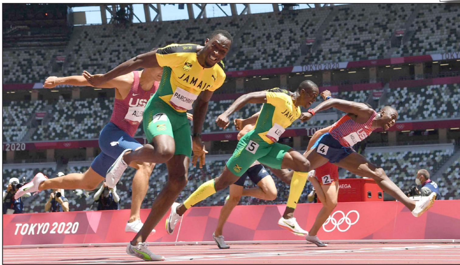
الجامايكي هانسل بارتشمنت (يسار) حقق أكبر مفاجآت الأولمبياد

■ طوكيو - رويترز: حقق الجامايكي هانسل بارتشمنت واحدة من أكبر مفاجآت ألعاب القوى في أولمبياد طوكيو بتفوقه على بطل العالم جرانث هولواي في نهائي سباق 110 أمتار حواجز أس الخميس.