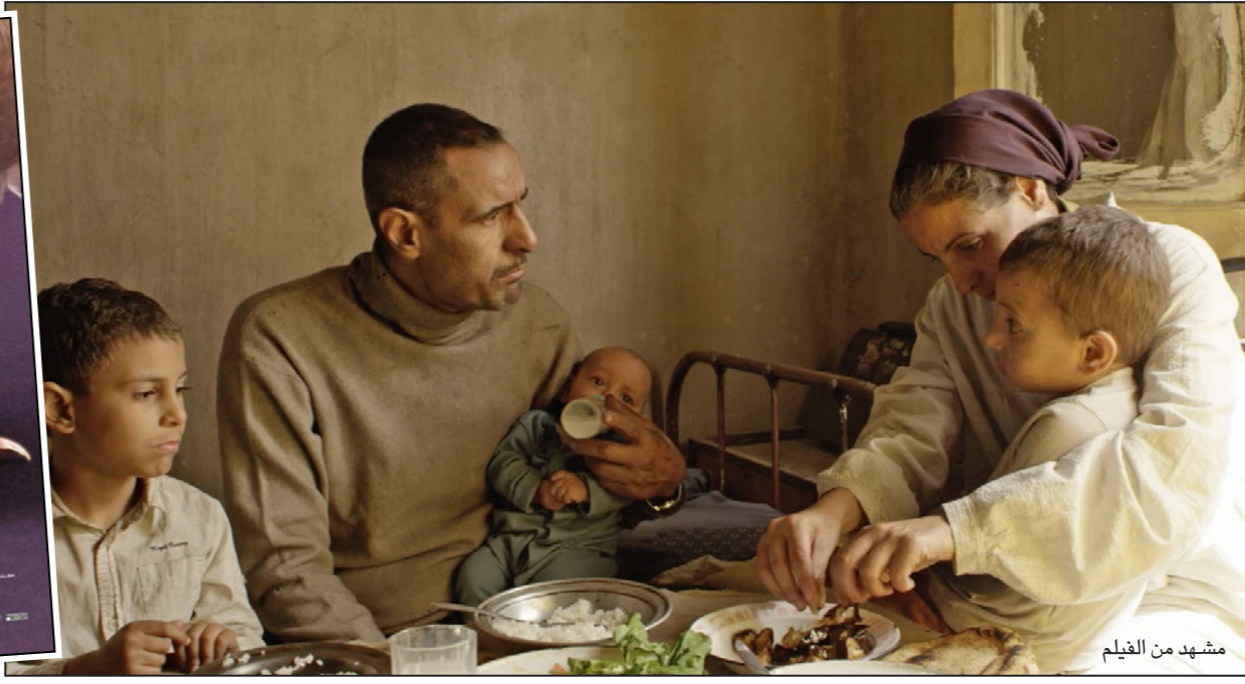
مشهد من الفيلم

هذا الزوج والأب المصري إذن هو سقط المتاع، هو ما لا يجدي وما لا ينفذ.. هو أب وزوج فقير يحتفظ بجنيته القليلة في صندوق عتيق يحتفظ ببقاها، وبين على زوجته بقرود معدودة تشتري بها ما يسد أقواه الصغار، ويقرب هذا الأب، الذي يعيش هو وأسرتهم في منطقة صناعية فقيرة،