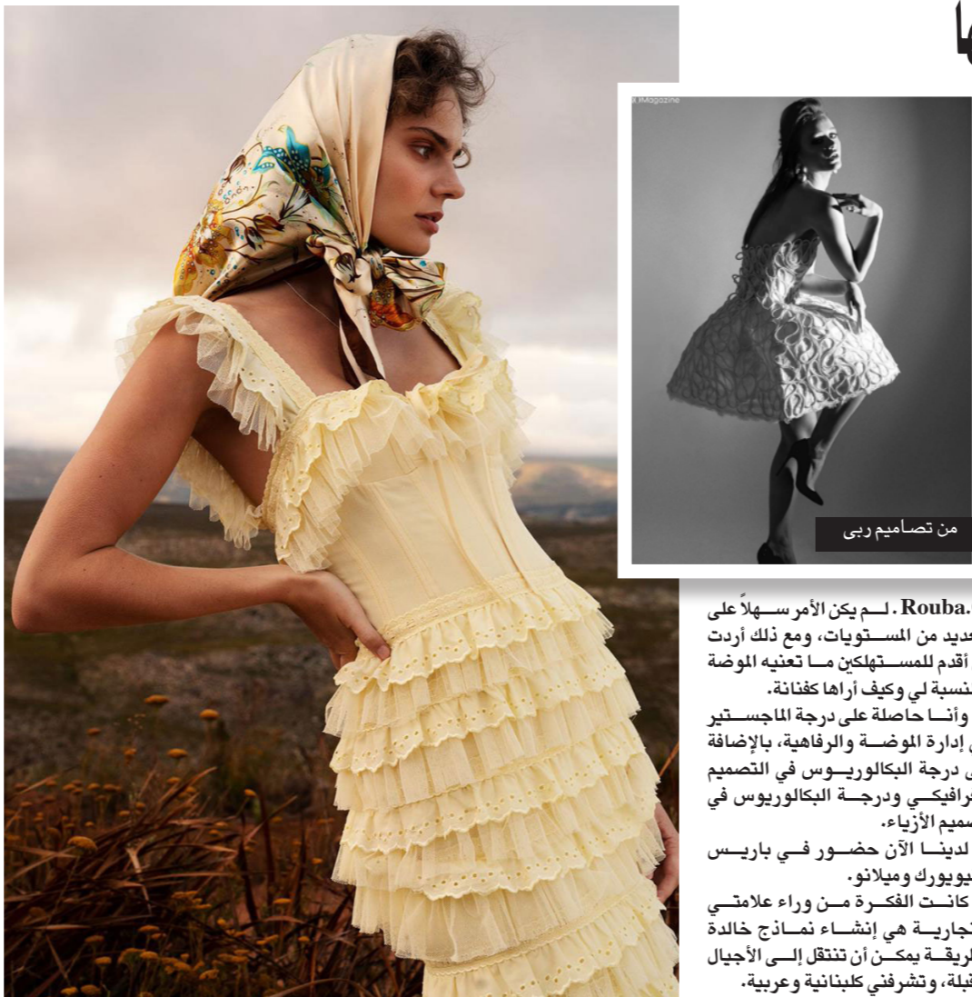
من تصاميم ربي

لـم يكن الأمر سهلاً على العديد من المستويات، ومع ذلك أردت أن أقدم للمستهلكين ما تعنيه الموضة بالنسبة لي وكيف أراها كفاتنة. وأنا حاصلة على درجة الماجستير في إدارة الموضة والرفاهية، بالإضافة إلى درجة البكالوريوس في التصميم الفرافيكي ودرجة البكالوريوس في تصميم الأزياء.