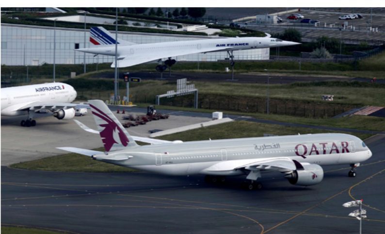
طائرة من طراز «إيرباص إيه 350» تابعة للقطرية رابضة على مدرج شارل ديغول في مطار باريس

وقالت أمس أنها أعادت طائرات «إيه350» إلى الخدمة لتعويض طاقة مفقودة وإنها «تبحث أيضاً عن حلول أخرى». والخطوط القطرية هي أكبر طائرة «إيه350»، واستلمت 53 طائرة منها من أصل 76 طلبية.