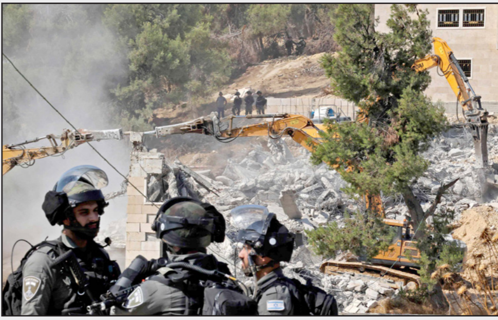
قوات الاحتلال الإسرائيلي تهدم منازل فلسطينيين في بلدة سعير شمال شرق مدينة الخليل