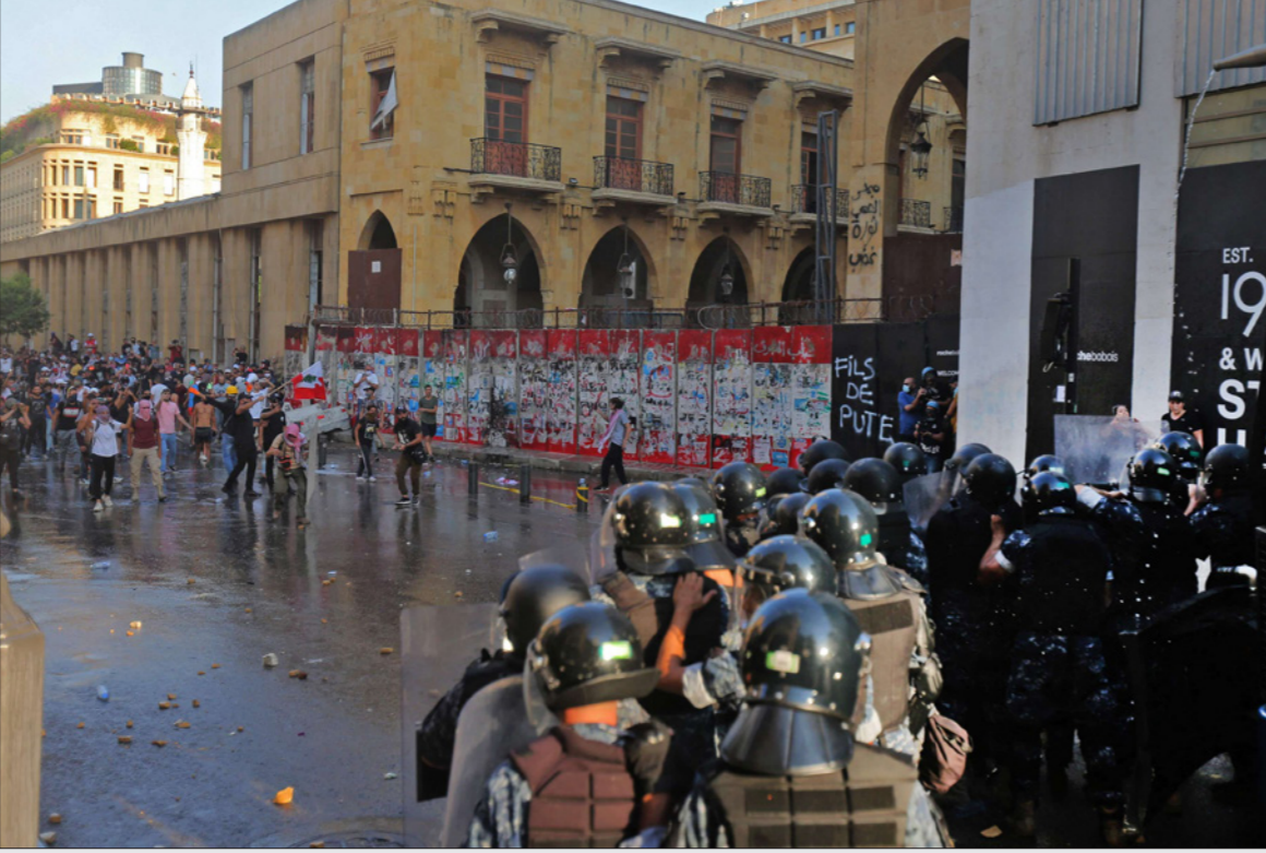
لبنانيون خلال مواجهات مع الجيش في محيط مجلس النواب في بيروت أمس