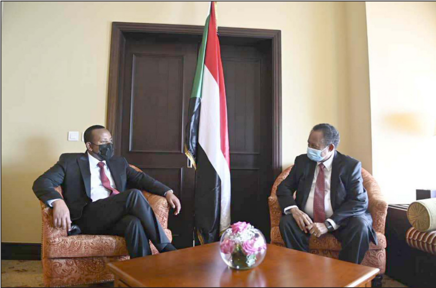
أرشيفية للقاء بين حمدوك وأبي أحمد

المفروض على الإقليم، وأن يسمح بوصول المساعدات الإنسانية إلى تيغراي. ثانياً، وقف عمليات اضطهاد التيغرايين في أديس أبابا. ثالثاً، إطلاق سراح السجناء السياسيين. وعلى التأكيد هنا أن الدعوة إلى إطلاق سراح السجناء السياسيين لا تقتصر فقط على الآلاف المضطهدين في تيغراي الذين كانوا يعملون في الجيش، وإنما تشمل كافة السياسيين الآخرين من الشخصيات الرئيسية الفاعلة في المشهد السياسي الإثيوبي. وبمجرد التوصل إلى اتفاق ووقف إطلاق النار، يجب أن يتعدى بعدها مباشرة حوار سياسي جامع يشمل كافة القوى السياسية الرئيسية في إثيوبيا. ومن ثم الاتفاق على صيغة حكم انتقالي تتيح التباحث في مستقبل إثيوبيا السياسي». وزاد: «لم نقل إننا سنقرر بفردنا مستقبل إثيوبيا، وإنما قلنا سنكون شركاء في تقرير المستقبل السياسي لإثيوبيا».