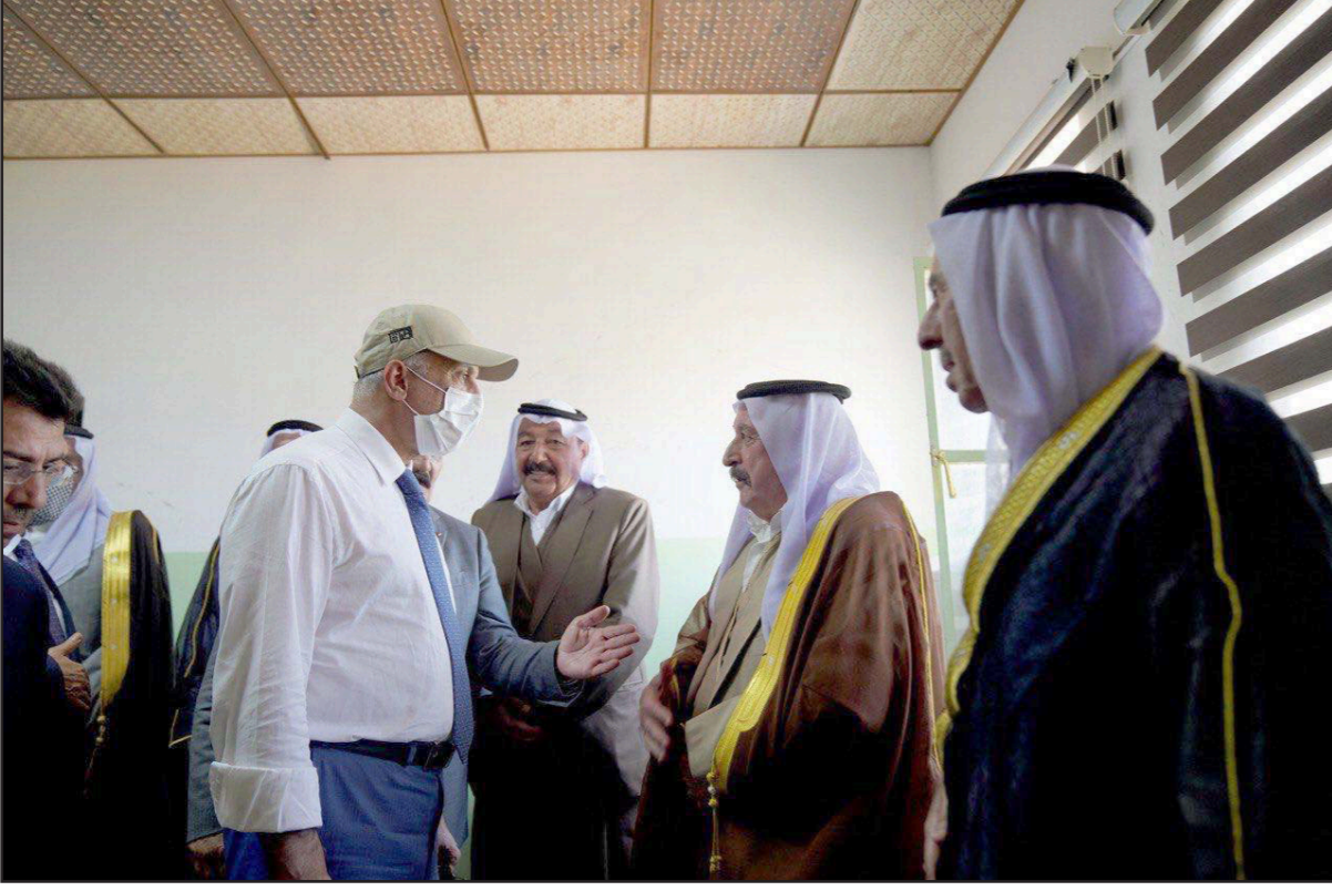
الكاظمي يتبادل الحديث مع وجهاء في نينوى خلال زيارته للمحافظة أمس

مفصلاً عن السد، وأهميته، والأعمال المنجزة لإدامته، وجرت أيضاً معاينة أعمال التحشيشة من أعلى السد». وأكد الكاظمي «أهمية سد الموصل، وضرورة قيام الملاكات العاملة فيه بعمليات الإدارة المستمرة، ومراقبة عمليات التحشيشة التي