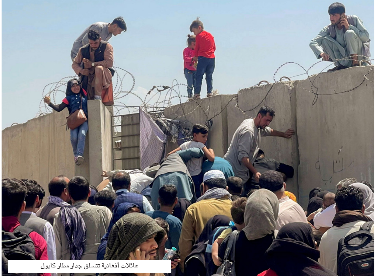
عائلات أفغانية تتسلق جدار مطار كابول