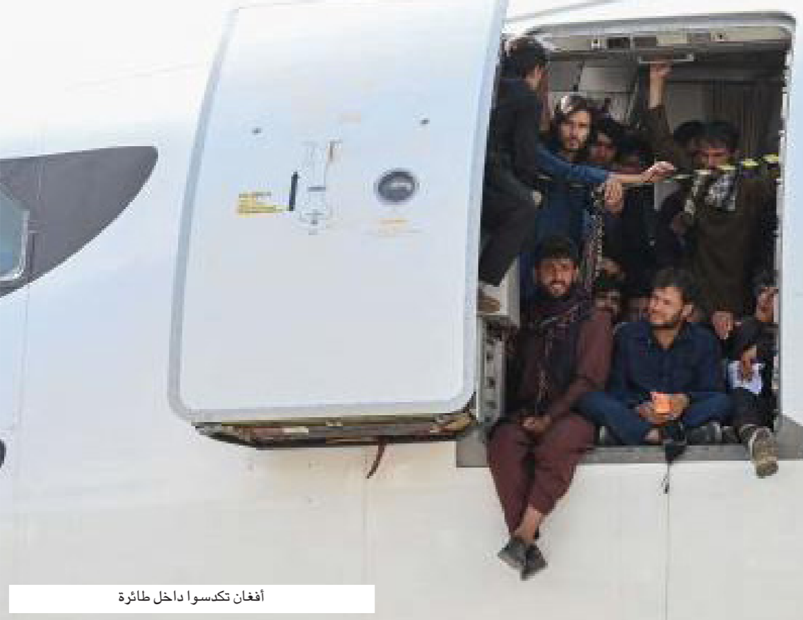
أفغان تكسوا داخل طائرة