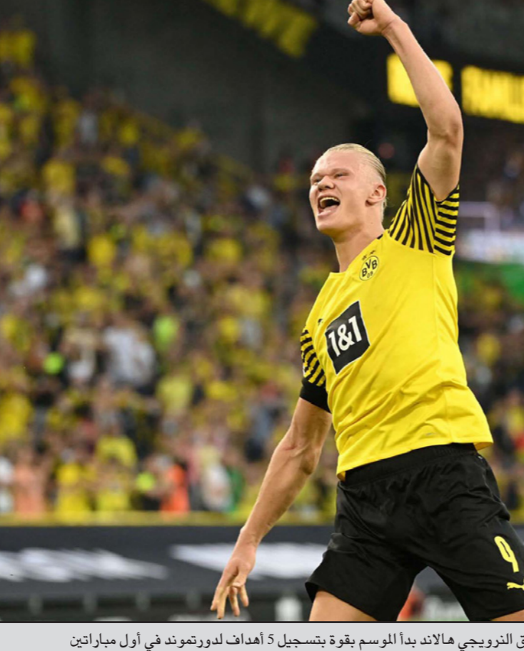
العقلاق النرويجي هالاند بدأ الموسم بقوة بتسجيل 5 أهداف لدورتموند في أول مباراتين

دورتموند من أبرز المرشحين لمناقسة البايرن على اللقب... ورغم كل هذا الغناء، يلهث دورتموند خلف الوقت للفوز بلقب مع هالاند، حيث تشير وسائل إعلام أن الأخير يملك بندا في عقده للرحيل في 2022 مقابل 175 مليون يورو. كما أشارت أن تشلسي وضع على الطاولة مبلغ 175 مليون يورو للتعاقد مع هالاند، الذي ردى على هذا الخيار قائلًا: "أمل بأن تكون مجرد أخبار، لأنه مبلغ كبير لشخص واحد". لكن، بعد الأداء الذي قدمه في أول مباراتين رسميتين هذا الموسم، سلطت الضوء على الأندية الأضواء عليه رغبة منها لجلبه إلى صفوفها، ومنها المنافس الأيدي بايرن ميونخ، وقال المدير الرياضي للنادي البارقي حسن ميخيزيتش: "ستكون هواة لو لا نفل ذلك". وسيكون عملاق بافاريا أمام تحدي إيقاف خطورة العقلاق النرويجي الفراع الطول (1.94م)، عندما يواجه الأخير بدوره أهداف البايرن وورث ليفاندوسكي (33 عاماً) والذي حقق رقماً قياسياً في الدوري الموسم الماضي بتسجيله 41 هدفاً في 29 مباراة، محطمًا الرقم السابق للراحل مؤخرًا ومُدفعي "البايرن السابق غنريد مولر، كما حفر ليفاندوسكي اسمه أكثر في سجلات "البوندسليغا" إذ بات بتسجيله هدف التعادل في مرمرى مونشنغلاذباخ، أول لاعب يسجل على الأقل هدفاً في المرحلة الأولى في سبعة مواسم تواليًا. ووقعت الصحافة الألمانية بگرام هالاند لدرجة الهذيان، فوصفته صحيفة "بيلد" بـ"اللاعب الذي يتسبب باقتلاح حفته الجماهير المنافسة لدورتموند من مقاعدها". وستكون المواجهة الحالية بين الفريقين "بروفة" مسبقة لما ينتظرهما قبل اللقاء الأول بينهما في الدوري في كانون الأول/ديسمبر المقبل، علماً أن البايرن أحرز السوبر 8 مرات آخرها العام الماضي، مقابل 6 مرات لدورتموند 2019، عام 2019.