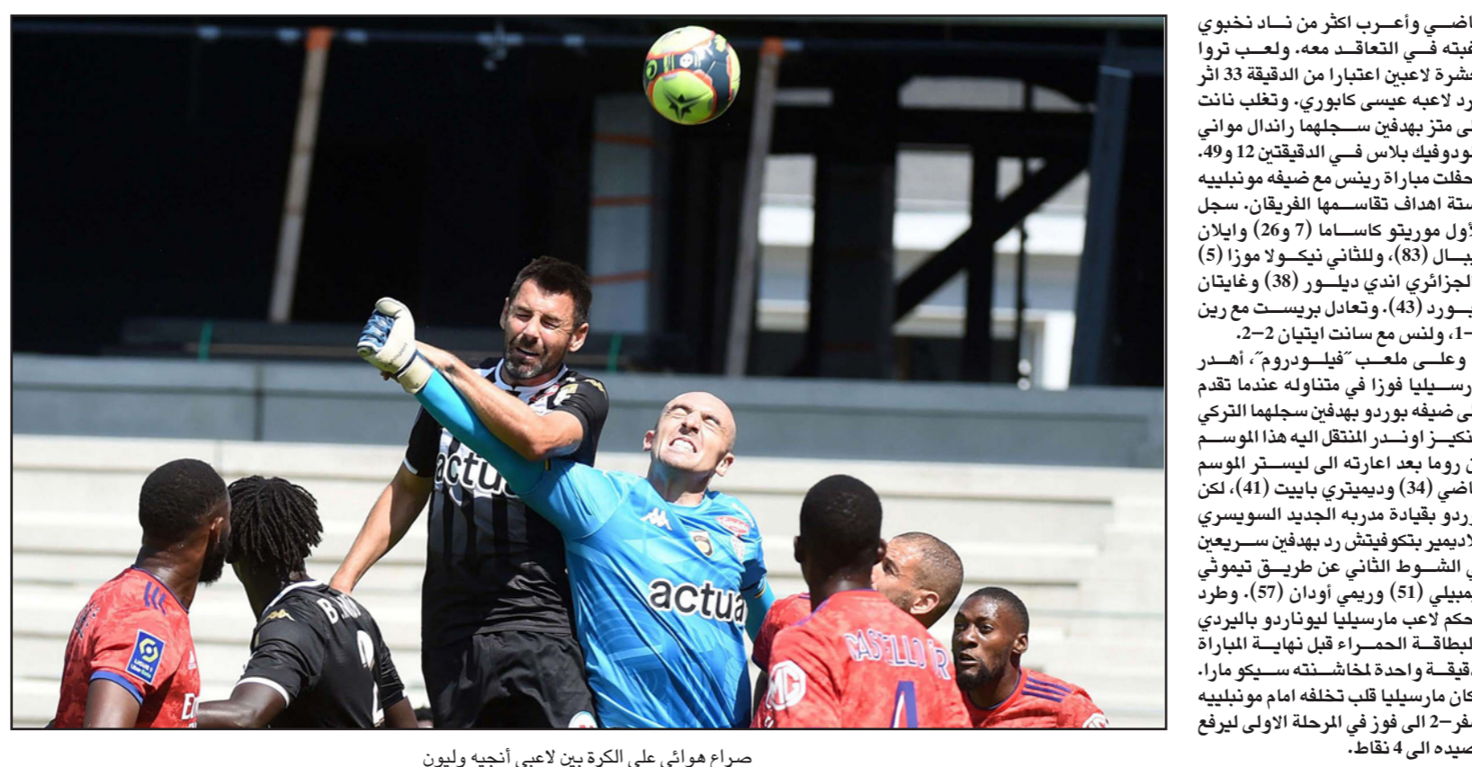
صراع هوائي على الكرة بين لاعبي أنجييه وليون