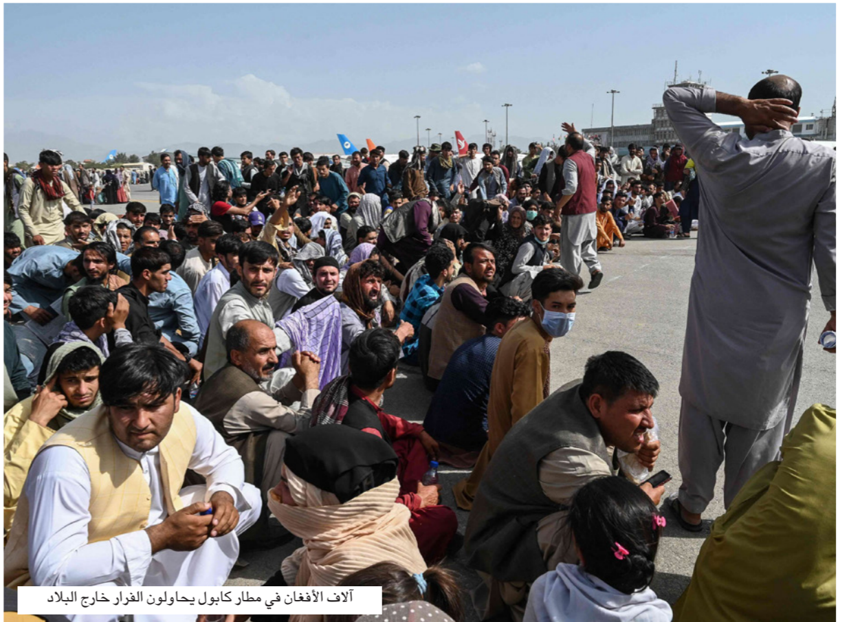
آلاف الأفغان في مطار كابول يحاولون الفرار خارج البلاد