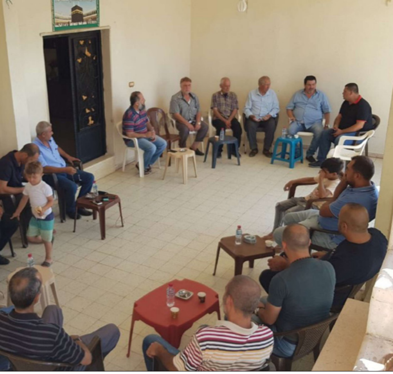
جانب من مراسم التعزية في وفاة أحد الضحايا أمس في عكار شمال لبنان

وفي محاولة لاحتواء التوتر في عكار بعد كلام رئيس الجمهورية ميشال عون ورئيس التيار الوطني الحر جبران باسيل عن خروج المنطقة عن سيطرة الدولة ووجود جماعات متشددة فيها، دعا بطيريك الماروني مار بشارة بطرس الراعي والسلطة السياسية والاجهزة الأمنية والقضائية الى تحمّل مسؤولياتها لضبط الاوضاع وإحقاق الحق» مشدداً على ضرورة احترام ارواح الشهداء وإبعاد هذه الحادثة الاليمية عن أي توظيف طائفي أو بازار سياسي، وهي أبعد ما يكون عن ذلك، وسأل الجميع الوعي والتروي