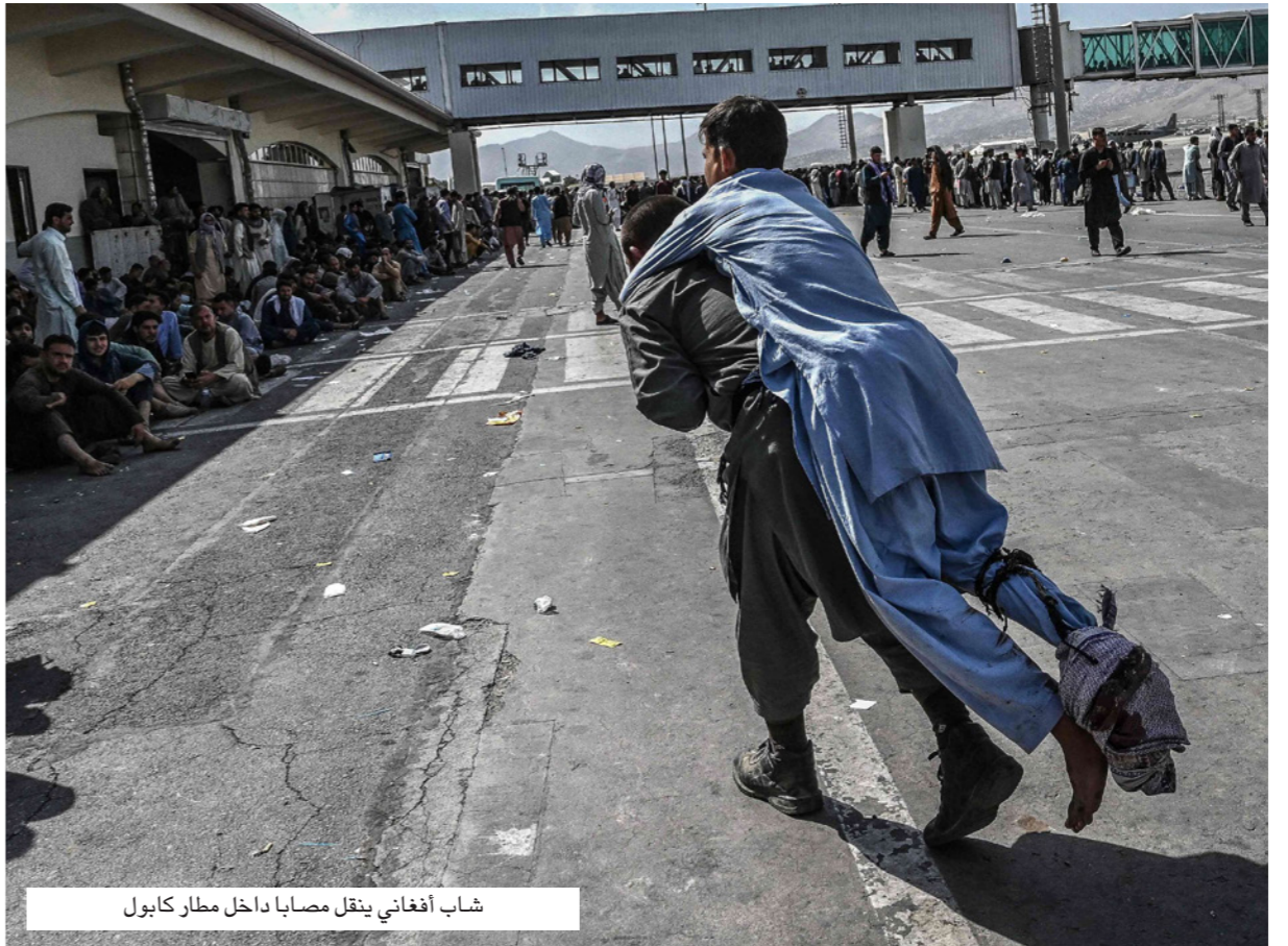
شاب أفغاني ينقل مصابيا داخل مطار كابول