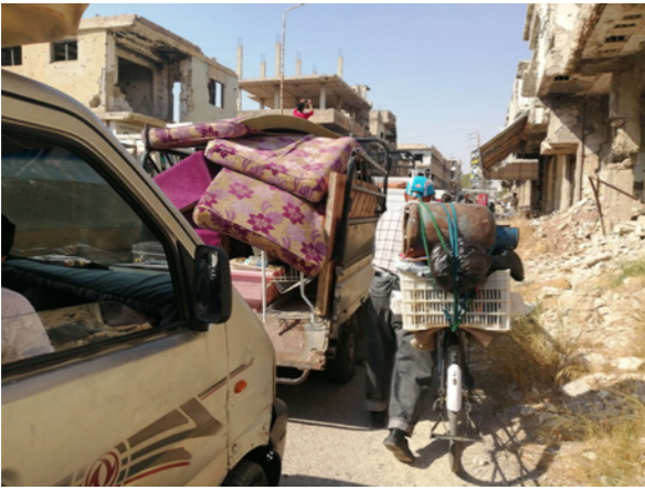
نزوح حوالي 80% من أهالي درعا جراء قصف النظام العنيف للمدينة

كبير، فالجانب الروسي فرض اتفاق تموز 2018 وأوهم الأهالي بقرب الإفراج عن أبنائهم من معتقلات النظام، وعودة الجيش إلى كتفاته العسكرية، ووقف كامل للعمليات العسكرية في المنطقة، وكانت نتائج الاتفاق اعتقال نحو 2400 من أبناء المحافظة، وعمليات اغتيال فاقت 750 عملية كثير منها استهدفت كل من يرفض الوجود الإيراني في المنطقة سراً أو جهراً، فلما عن تسهيل خروج الآلاف من الشبان إلى الشمال المحرر وتركيا، ولاحقاً إلى لبنان وليبيا..