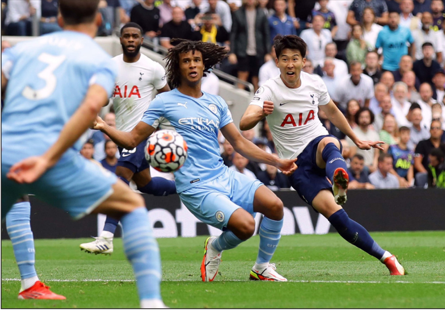
التالاق سون (يمين) يسدد كرة جاء منها هدف فوز توتنهام على السيتي

■ لندن - أ ف ب: منى مانشستر سيتي بالخسارة صفر-1 أمام توتنهام الذي لعب في غياب هدافه هاري كاين، في مستهل حملة الدفاع عن لقبه بطلا لبطولة انكلترا في ختام المرحلة الأولى.