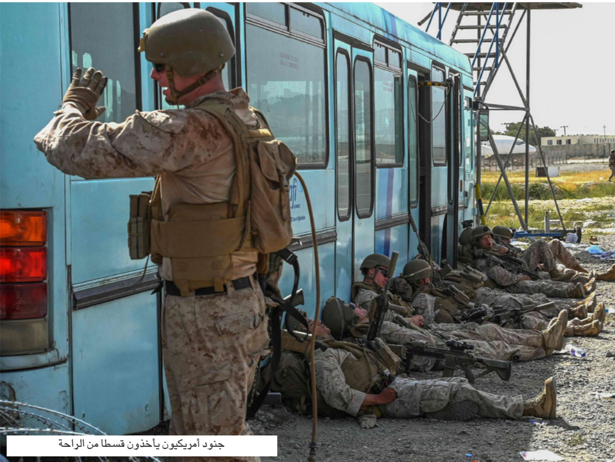
جنود أمريكيون يأخذون قسطا من الراحة