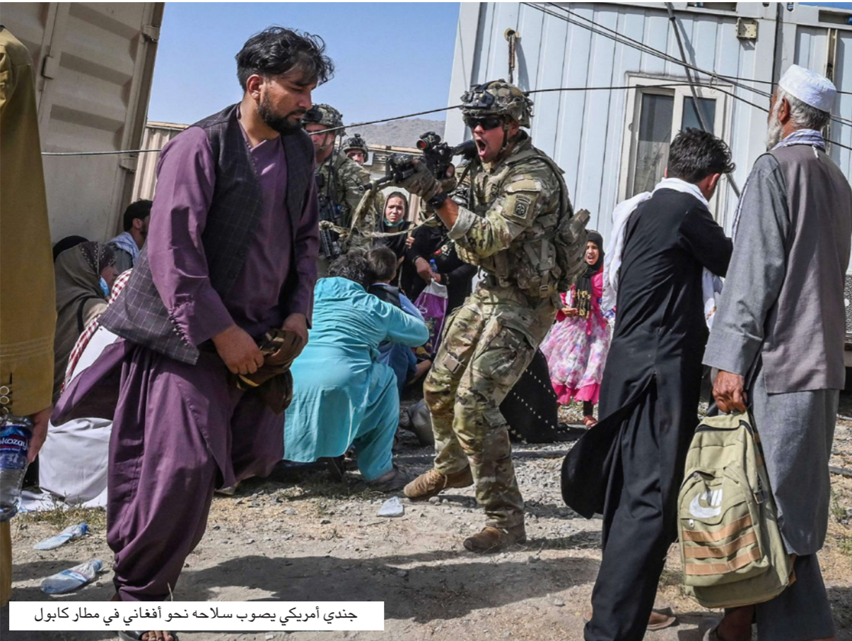
جندي أمريكي يصوب سلاحه نحو أفغاني في مطار كابول