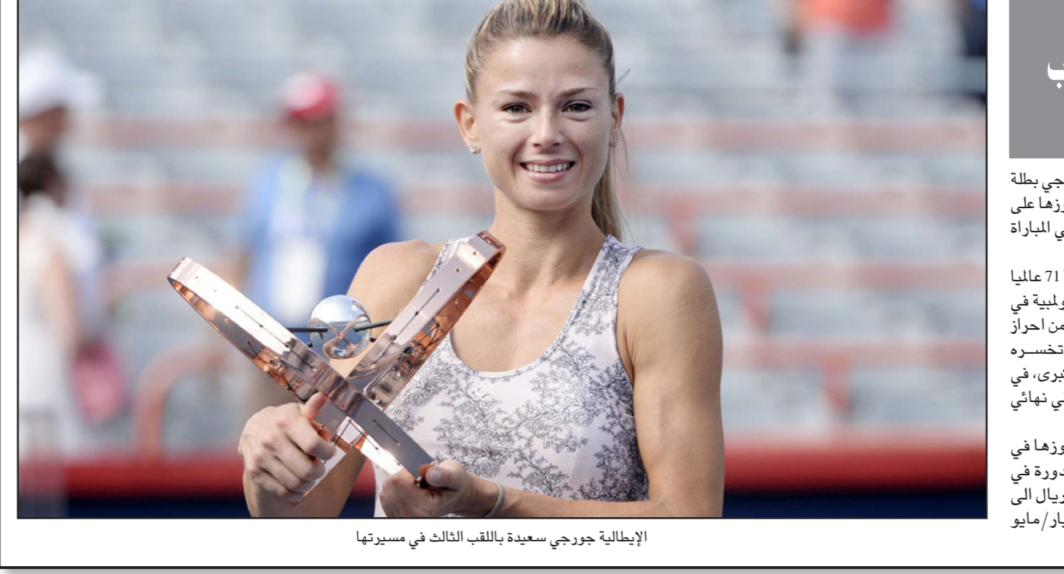
الإيطالية جورجي سعيدة باللقب الثالث في مسيرتها

■ بغداد - أ ف ب: أعلن القوة الجوية العراقية بطل الدوري وكأس الموسم الماضي، تعيين البرازيلي جورفان فييرا مدرباً، خلفاً لمواطنه أيوب اوديشو الذي اعتذر عن عدم مواصلة مشواره لأسباب صحية، ويحظى فييرا بشعبية كبيرة لدى الجمهور العراقي بعدما قاد منتخب "أسود الرافدين" إلى لقب كأس 2007 عندما تعادق معه الاتحاد العراقي حينها لمدة شهرين فقط، وعمل فييرا (69 عاماً) مدرباً للعديد من الأندية في المنطقة، بينها الشارقة وبنين ياس في الامارات والطائي السعودي والقادسية الكويتي وغيرها من الفرق، ونقلت وسائل اعلام عن فييرا في اول رد فعل على عودته للعراق مدرباً للقوة الجوية: "أنا مسرور للعودة إلى العراق للعمل مع فريق كبير ينتظر استحقاقاً مهما في دوري ابطال آسيا".