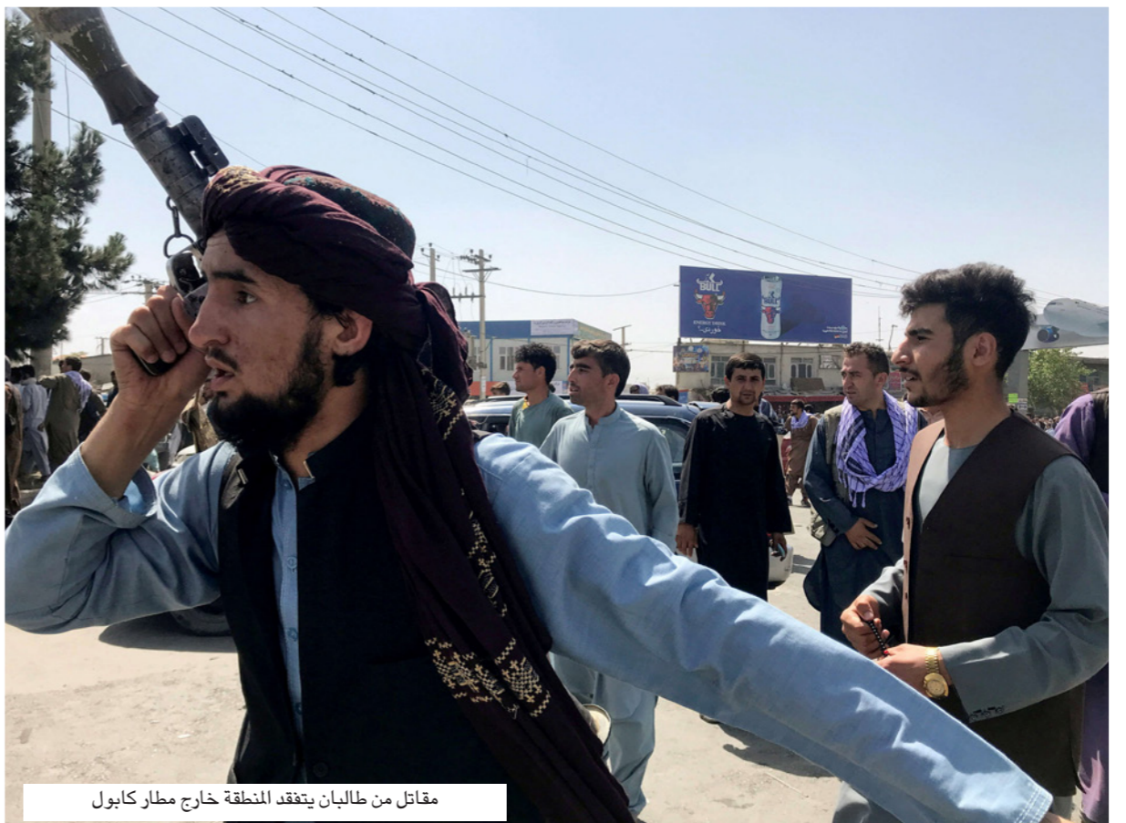
مقاتل من طالبان يتفقد المنطقة خارج مطار كابول