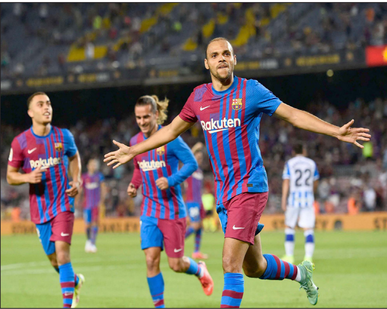
بريويث يحتفل بتسجيل الهدف الثاني في أول مباراة لبرشلونة في غياب ميسي

■ مدريد - أ ف ب: استهل أتلتيكو مدريد حملة الدفاع عن اللقب بأفضل طريقة من خلال الفوز خارج قواعده على سيلتا فيغو 1-2 في المرحلة الأولى للدوري الإسباني، التي شهدت انتصارا كبيرا لبرشلونة على ريال سوسيداد 4-2 في أول اختيار في حقبة ما بعد النجم ليونيل ميسي المنقلب إلى باريس سان جيرمان. ويدين فريق المدرب دييغو سيميوني الذي بدأ اللقاء بإبقاء الهدف الأوروغواني لويس سواريز على مقاعد البدلاء، بفوزه في مستهل الموسم لأنخيل كوريا الذي سجل الهدفين. وافتتح كوريا التسجيل في الدقيقة 23 بتسديدة بعيدة بعدما استفاد من مجهود مميز وتمريضة لتوماس ليمار. ورغم الفرص العديدة التي حصل عليها فريق العاصمة في الدقائق المتبقية من الشوط الأول، أبرزها راسية لماريو هيريموزو أبعدها الدفاع التشيلي ريناتو تابيا عن خط المرمى (38) ومحاولات لينيك كاراسكو بعد تمريرة من ليمار لم تجد طريقها إلى الشباك (41)، بقيت النتيجة على حالها، ومع بداية الشوط الثاني، وجد نادي العاصمة نفسه على المسافة ذاتها من مضيفه بعد حصول الأخير على ركلة جزاء نتيجة لسة داخل المنطقة الحرة على ماركوس يورتي، فانبرى لها إايغو أساسياس بنجاح في مرمرى الحارس السلوفيني يان أوبلاك (59). لكن كوريا أعاد أتلتيكو إلى المقدمة مجددا في الدقيقة 63 عندما وصلته الكرة من سناؤول نيغيز المنقلم على الجهة اليسرى مما أفاد ببعثه أرضية على يمين مواطنه ماتياس ديوتورو. ورفع كوريا رصيده إلى سبعة أهداف في مبارياته التسع الأخيرة في الدوري، أي أكثر بهدف من عدد الأهداف التي سجلها على امتداد 49 مباراة قبل هذه السلسلة، وترك كوريا لمحب المباراة