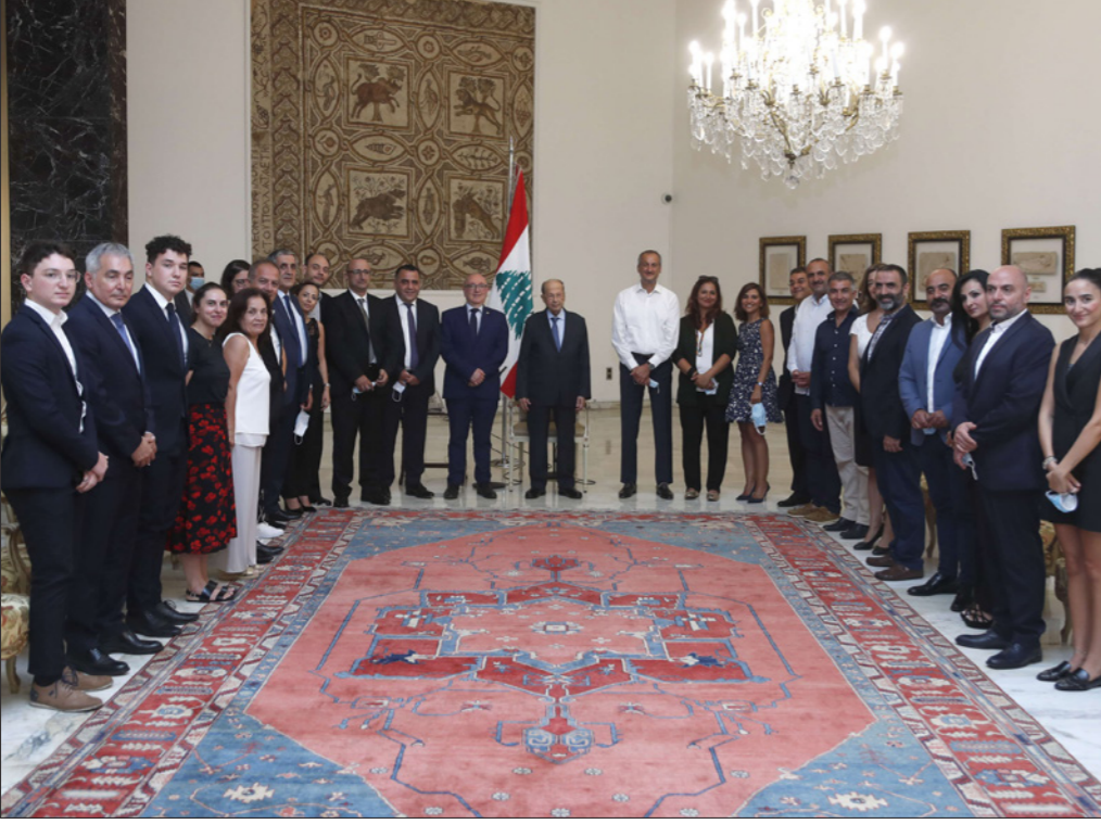
ميشال عون لدى لقائه أمس في قصر بعبدا وقد الجلس الوطني للجمع من أجل لبنان في فرنسا

دولار (في الشهر) من المحروقات ولا نرى لا مازوت ولا بنزين ولا كهرباء». وأضاف أن هدف المصرف المركزي بتوفير الأموال للاستيراد، دعم «لبنان وليس بلداً آخر». منذ عشرات السنين، تنشط عمليات التهريب بين لبنان وسوريا خصوصاً من منطقتي عكار والبقاع (شرقاً) وتشمل بضائع مختلفة. وفي رد فعل غاضب على انفجار الأحد، قصد سكان بعد وقت قصير على المساء الأرض التي كان البنزين مخزناً فيها في بلدة التليل وأضرموا النار في منزل صاحبه تحت أنظار عناصر لفتح محطات بنزين أو مستودعات تخزين وقوداً بالوقود. وكان الخزان الذي انفجر في الشمال جزءاً من هذه الحملة، إذ عثر الجيش فيه على كمية من البنزين، فصادرها لتوزيعها على المواطنين. وعندما هرع الأهالي إلى المكان للحصول على بعض البنزين، ترك عناصر الجيش لهم ثلاثة آلاف لتر، وفق ما قال شهود. وحصلت فوضى في المكان، ثم وقع الانفجار الذي لم تعرف أسبابه بعد، وقد أدى إلى مقتل 28 شخصاً على الأقل وعشرات المصابين معظمهم بحروق خطيرة. ولا تزال هناك أشلاء لم يتم التعرف على أصحابها بسبب تعقدها. وحسرى نقل عدد من المصابين إلى مستشفيات في تركيا والكويت.