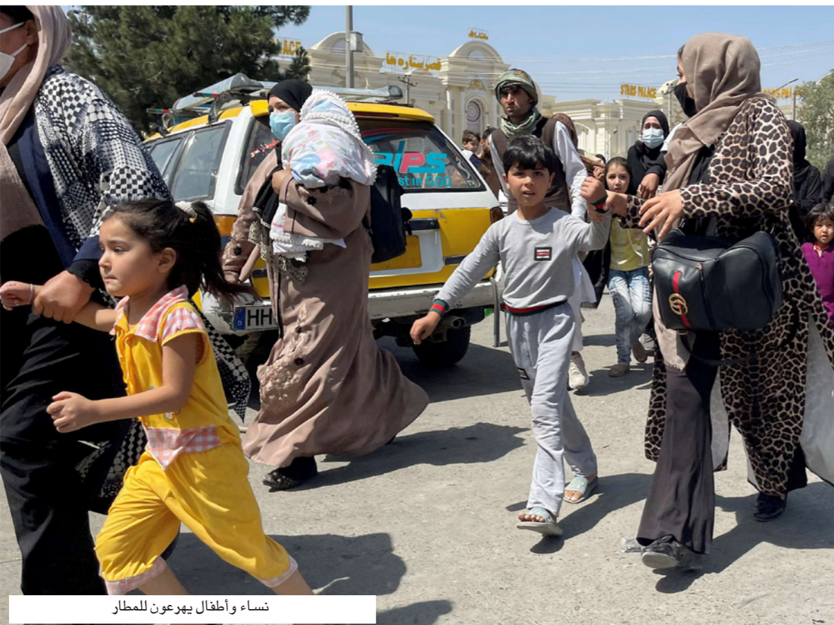
نساء وأطفال يهربون للمطار