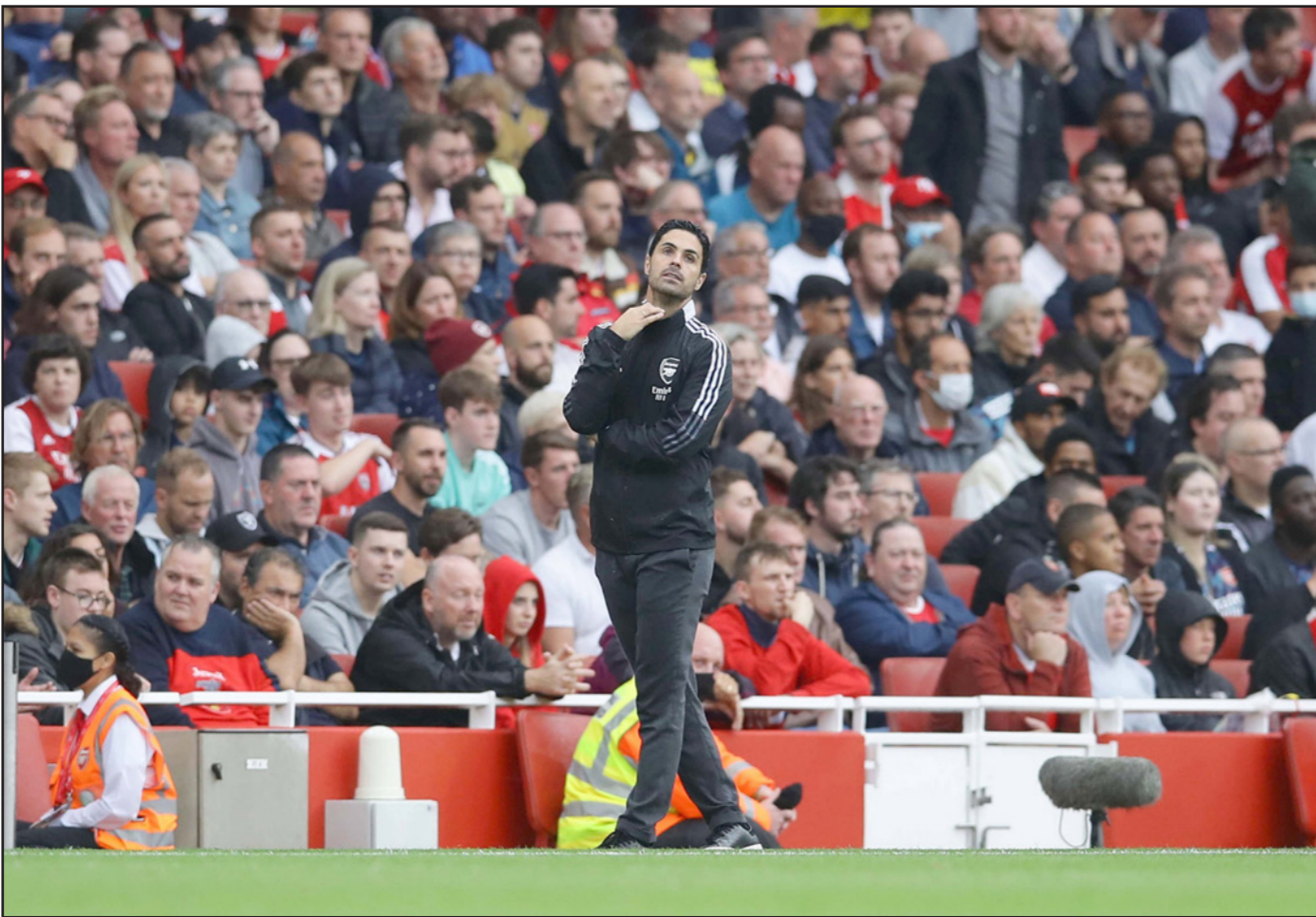
مدرب أرسنال أرتيتا يشعر بحرارة وضعه الحرج

يطالبه منهم أرتيتا، وتابع: "لا أعرف ما هي التكتيكات. بالنسبة لي فإن الأمور مخيفة جداً". وقال سوسول كامل الفائز بالدوري وكأس إنكلترا مرتين تحت قيادة فينغر، إن أرتيتا في أمان حتى اللحظة، لأن النادي استثمر وقتاً وجهداً كبيرين لاستقدامه، إلا أن المدافع السابق لا يخفي خيبة من نقص الصلاة في الدفاع والوسط، الامر الذي استغته تشلسي على اكل وجهه، وقال: "بني أرسنال على أساس هذا النوع من كرة القدم، أي الهجري والصلب. أريد أن أرى المزيد من ذلك، إن أرى شخصية أقوى". وأضاف: "سعى أرسنال لمدى طويل جداً من أجل أرتيتا، اعتقد أنهم سينظرون ما سيحققه، لكن لا شك أن المهلة الزمنية دائماً محدودة". ويضع نجم مانشستر يونايتد سيسك أباتشي في قائمة المرشحين في الفريق، وقال: "أشجع أرتيتا المزيد من الوقت، يجب أن تمنح المدرب وقتاً أطول، يملك أرسنال العديد من اللاعبين الشباب الذين يملكون إمكانيات، لكنهم لا يزالون إمكانيات وحسب"، أي أنهم لم يتخرجوا هذه الإمكانيات في أرض الملعب، وأشار إلى أن "أرسنال لا يملك لاعبين مخضرمين بارزين ومهاريين يستطيعون التصرف على نحو جيد ومساعدة اللاعبين الشباب". وتابع: "هناك لاعبون في أرسنال تشلسي والطريقة التي أذى فيها (المهاجم البلجيكي وميلو) لوكاكو، فإذا أن لاعبي أرسنال ليسوا مستعدين، أو أنهم لا يستطيعون تأدية ما مريحة".