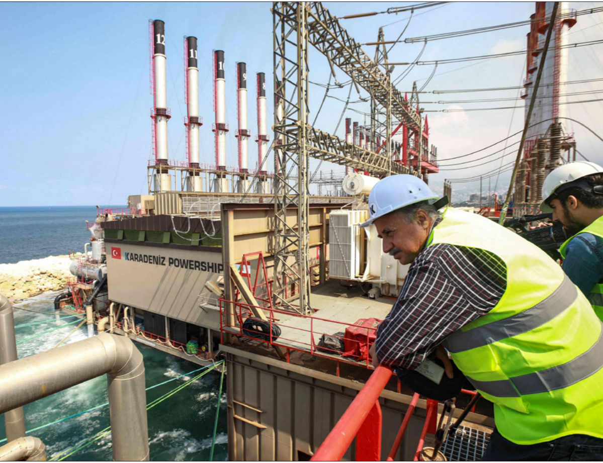
مستخدمان في محطة توليد تركية عاتمة كانت تزود لبنان بالكهرباء