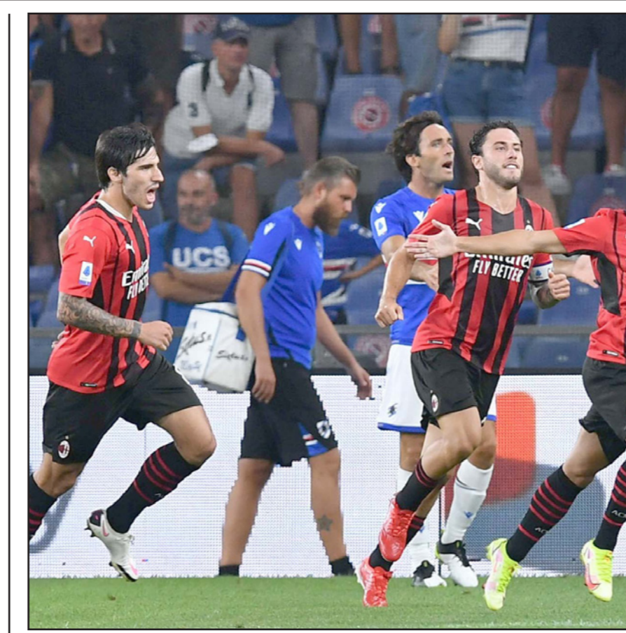
دياز (يمين) يحتفل بتسجيل هدف الفوز لميلان على سامبدوريا

مدريد - أ ف ب: ضرب الوافد الجديد الأرجنتيني إريك لامبلا مجدداً وقاد إشبيلية لفوزه الثاني تالياً، وهذه المرة بهدف قاتل كان الوحيد في اللقاء الذي جمع النادي الأندلسي بمضيفه خيتافي في المرحلة الثانية للدوري الإسباني.