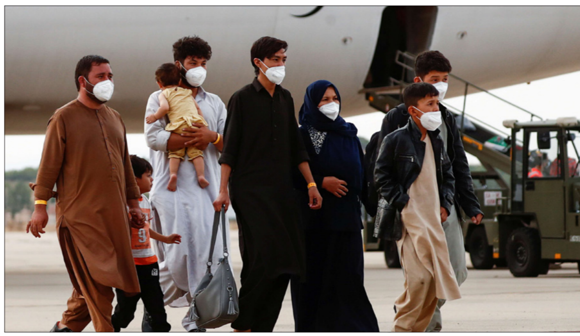
أفغان تم نقلهم من بلادهم إلى أسبانيا

المذكورة في كلمته أمام مجلس حقوق الإنسان، لكنها حثت المجلس التابع للأمم المتحدة على وضع آلية لمراقبة أفعال طالبان عن كثب.