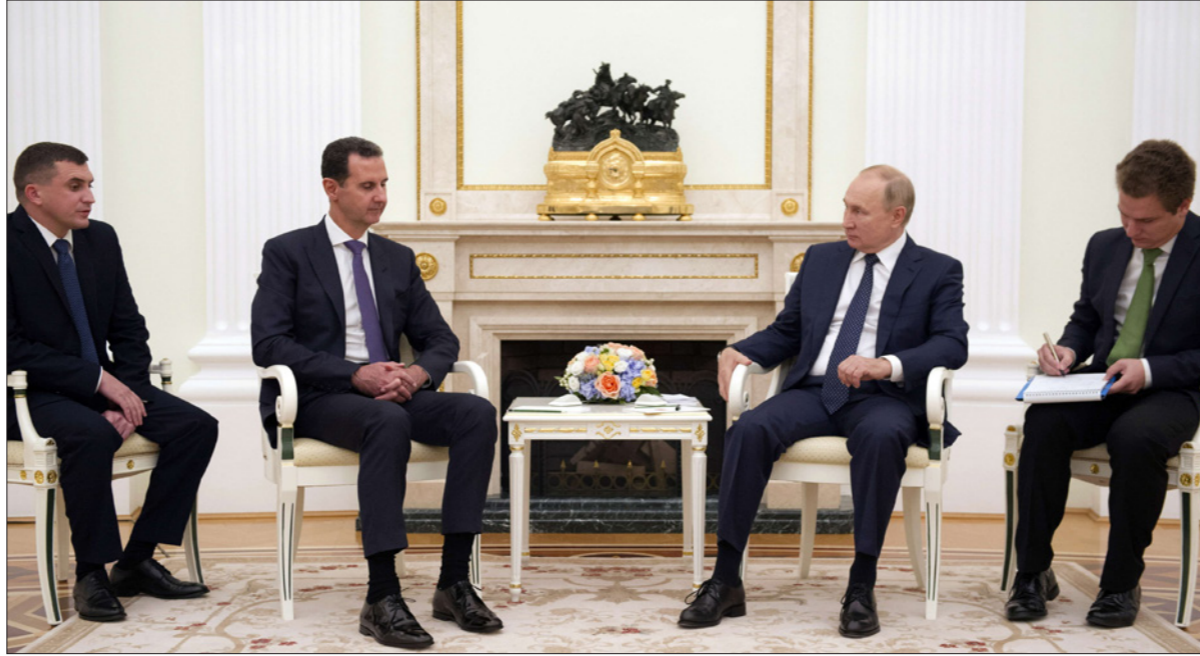
لقاء بوتين والأسد في موسكو أمس

ونكرت وكالة أنباء النظام الرسمية «سانا»، أن اللقاء، الذي عُقد الاثنين بين بوتين والأسد، بدأ باجتماع ثنائي مطول ثم انضم إليهما لاحقاً وزير خارجية النظام، فيصل المقداد، ووزير الدفاع الروسي سيرغي شويغو. وأضاف أن الجانبين بحثا «التعاون المشترك بين جيشي البلدين في عملية مكافحة الإرهاب، واستكمال