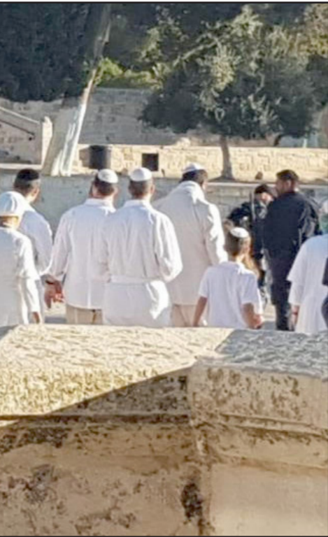
مجموعة من المستوطنين يقتحمون باحات المسجد الأقصى

يتزايد فعل الاستهداف الخاص بالمسجد الأقصى مع بدء موسم «الأعياد اليهودية» الذي يطل جذا، وفيه حسب الباحث جمال عمر تتنافس وتتنساق 28 منظمة صهيونية على اظهار نفسها الأفضل والأقوى والأكثر خدمة للمشروع الصهيوني ومحقة لأحلام اليهود حول العالم عمر مزيد من