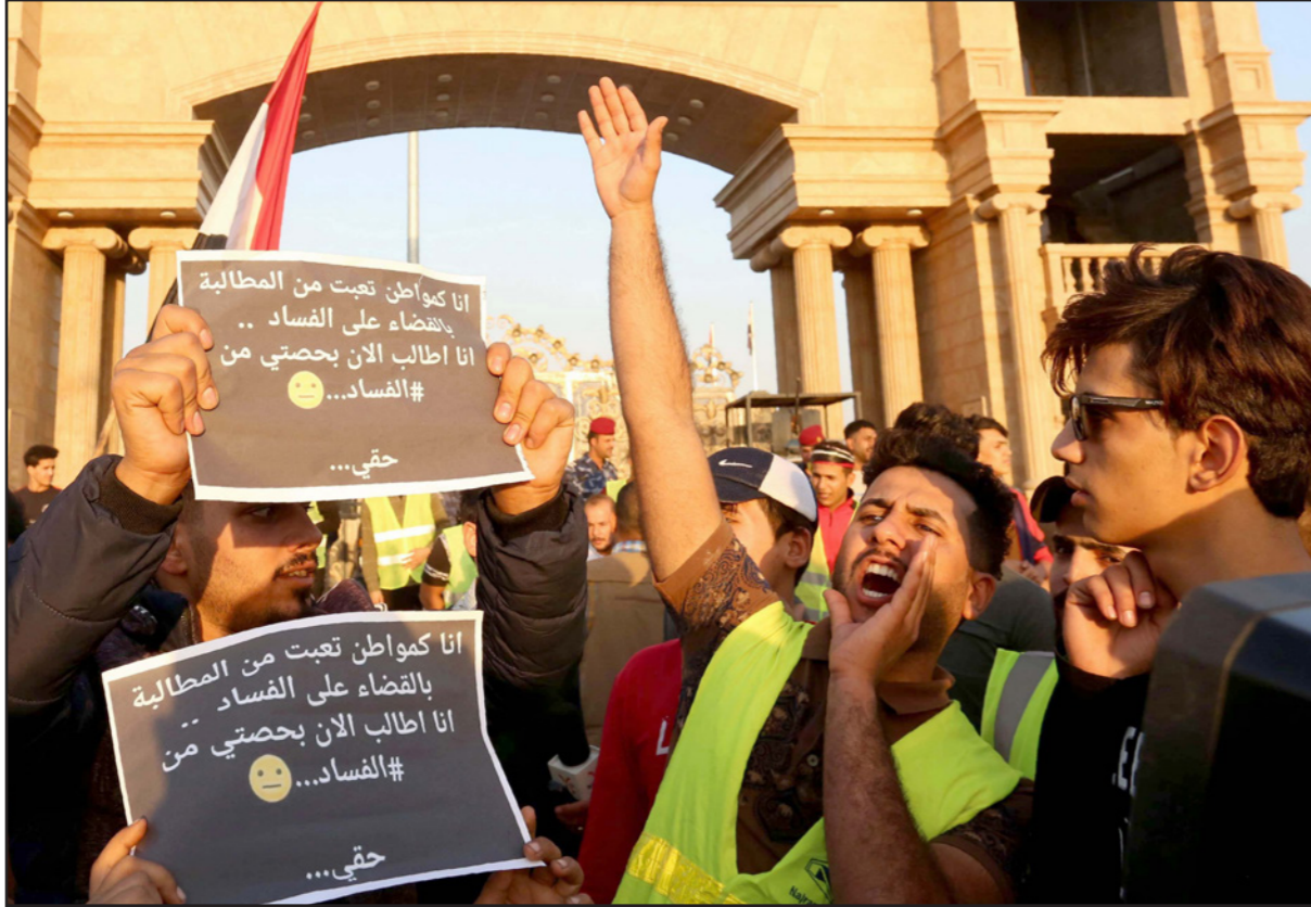
أرشيفية لمتظاهرين عراقين يطالبون بحاربة الفساد

إعلامه بذلك، وإيضاح الزيادة التي وقفت عليها استناداً لنص المادة (17/ سادساً)، مؤكداً، في حال عدم افتتاح دائرة الرقابة بالميزرات المقدمة من قبل المكلف بشأن الزيادة في أمواله تتم إحالة المكلف إلى دائرة التحقيقات، للعرض الموضوع أمام القضاء؛ لاتخاذ القرار المناسب بشأنه.