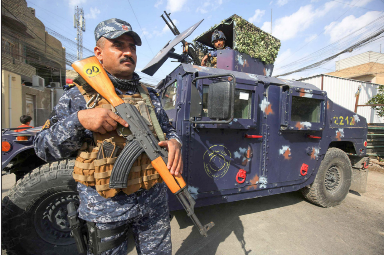
عصران من الشرطة الاتحاديّة عند نقطة تفتيش في بغداد

أفغانستان يحتاج إلى أن يكون هناك توجه للسامية في حركة طالبان من أجل أن يقرنوا أفعالهم بالأفعال، عند ذلك تنضم الصورة، أما أن يقال أن الإرهاب من سوريا والعراق واليمن، فقيه الكثير من المغالطات الخطيرة». وتابع: «القيادة القادسة لحزبة الإرهاب بعد انسحاب القوات الأمريكية نهاية العام ستكون بيد القوات العراقيّة بالتعاون مع البشمرجة، وهذا هو الحاصل أصلاً، لافتاً إلى أن «التعاون المثمر بين القوات الاتحاديّة والبشمرجة أدى إلى نتائج باهرة في القضاء على داعش بالسرعة الممتدة والتنسيق بين