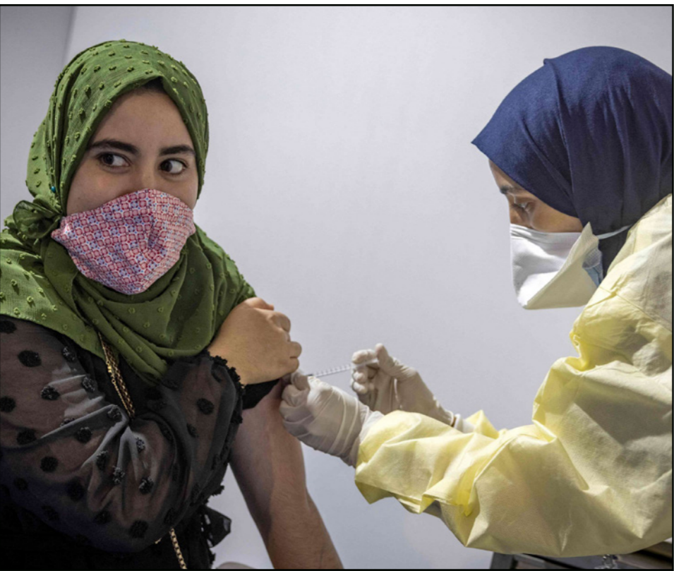
مغربية تتلقى جرعة من التطعيم ضد فيروس كورونا

وأظهرت عدة بحوث حول متغير دلنا الجديد، أن الشخص الذي تم تطعيمه أقل عدوى بأربع مرات من