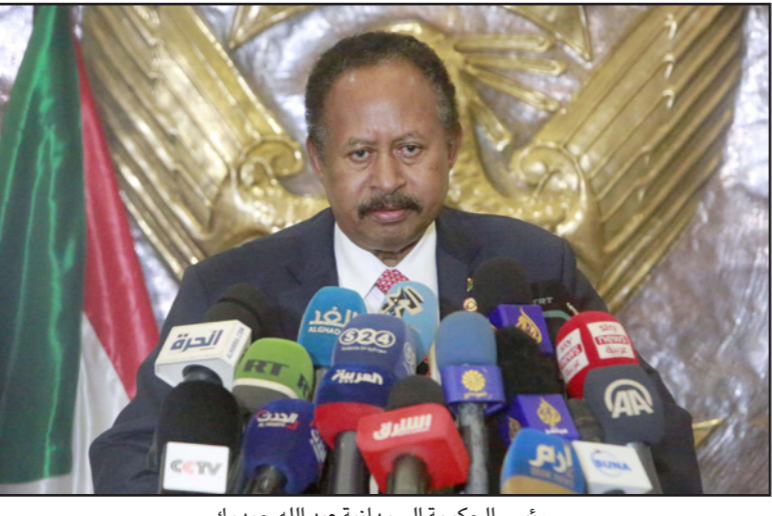
رئيس الحكومة السودانية عبد الله حمدوك

وتابع: «هم يدبرون بليل ونهار تحضيراً لمشهد الانقضاء على الثورة بخلق الشروط المواتية للثورة المضادة، والتي تمثل فيما حدث في شارع الشهيد مطر في بحري، وظل يتكرر خلال الفترة الماضية، والمنسوب لجماعات ما يُسمى (النيفرغز) وهي عبارة وفق برامج تسيطر عليها أجهزة تابعة للفلول عنصرية بالناشئة، فهذه الجماعات تعمل وفق برامج تسيطر عليها أجهزة تابعة للفلول لخلق انقلات أمني ووضع الجماهير أمام خيار مر وحيد، الأمن أولى من الثورة مع