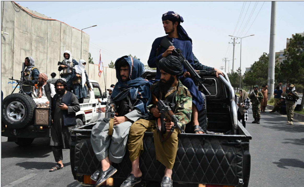
عناصر من حركة «طالبان» خلال دورية في أحد شوارع العاصمة كابل

وقال: «أفغانستان هي هزة أرضية هزة أرضية مدمرة وستظل لمدة طويلاً جداً جداً». وعلق أن الحادثة تمثل تحولاً عن عقيدة كارتر التي عفا عليها الزمن، وتقضي بقيام الولايات المتحدة التي تعتمد على النفط باستخدام القوة العسكرية للدفاع عن مصالحها في منطقة الخليج. وتساءل «هل يمكننا الاعتماد على المظلة الأمنية الأمريكية في العشرين عاماً المقبلة؟» وأعتقد أن هذا سؤال إشكالي في الوقت الحالي». واقترح أن 20 عاماً من الحرب التي كان من المفترض أنها ضد من «اختطفوا الإسلام» لم تترك أي أثر في أفغانستان. وتوقع أن يؤدي انتصار طالبان إلى قلق بين دول غرب أفريقيا والساحل بيشان