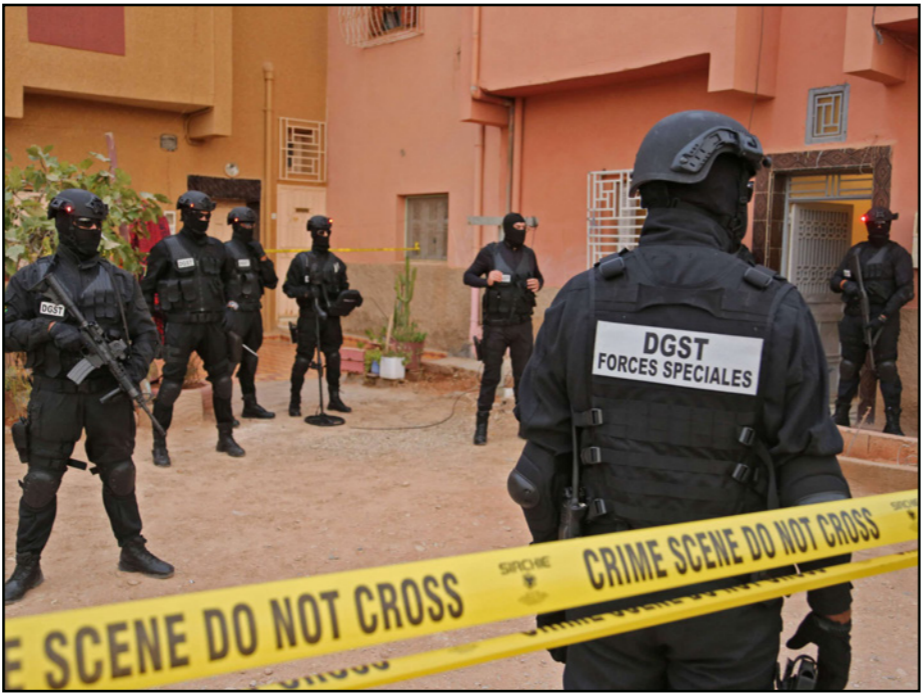
السلطات المغربية تقوم بتفكيك خلية تابعة لتنظيم «الدولة الإسلامية» أمس

وأضاف المصدر ذاته أن التدخلات المتزامنة التي باشرتها عناصر القوة الخاصة، التابعة للمديرية العامة لمراقبة التراب الوطني، أسفرت عن توقيف المشتبه فيه الرئيسي، وهو «الأمير» المزعوم لهذه الخلية الإرهابية، كما تم أيضا توقيف اثنين من أعضاء هذه الخلية، بينما تمكنت عمليات التفتيش المنجزة بمنزل المشتبه فيهم ومحل تجاري ملوك لأحد من حجز معدات معلوماتية وذاكرتي تخزين وهاوث محمولة، وملابس شبيه عسكري، ومخطوطات عديدة مكتوبة بخط اليد وأخرى مطبوعة من الإنترنت تحرض وتمجد العمليات الإرهابية، فضلا