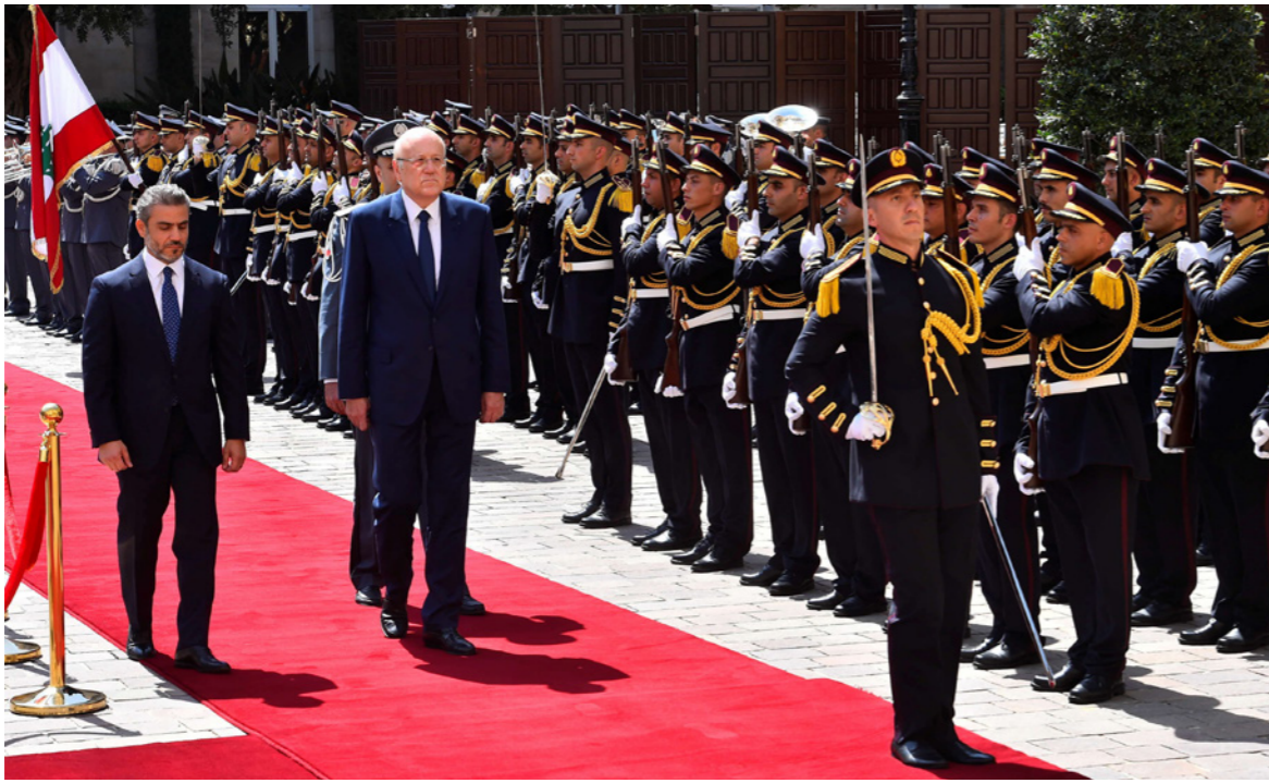
رئيس الوزراء اللبناني الجديد نجيب ميقاتي يستعرض حرس الشرف خلال احتفال رسمي بمناسبة توليه مهامه في قصر الحكومة في بيروت

«حزب الله» يحضر في بعلبك لاستقبال قافلة النفط الإيراني