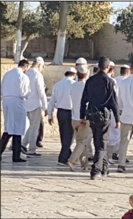
مجموعة من المستوطنين يقتحمون باحات المسجد الأقصى