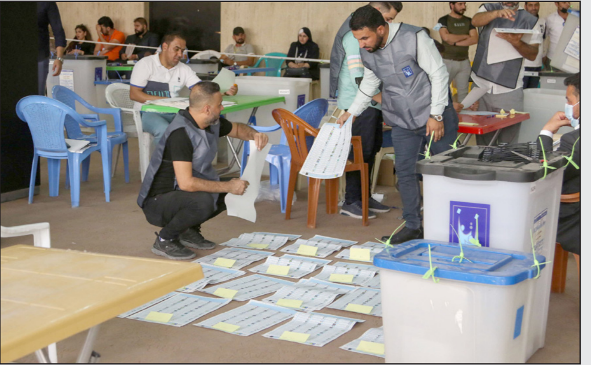
عمليات فرز للأصوات في مركز في بغداد