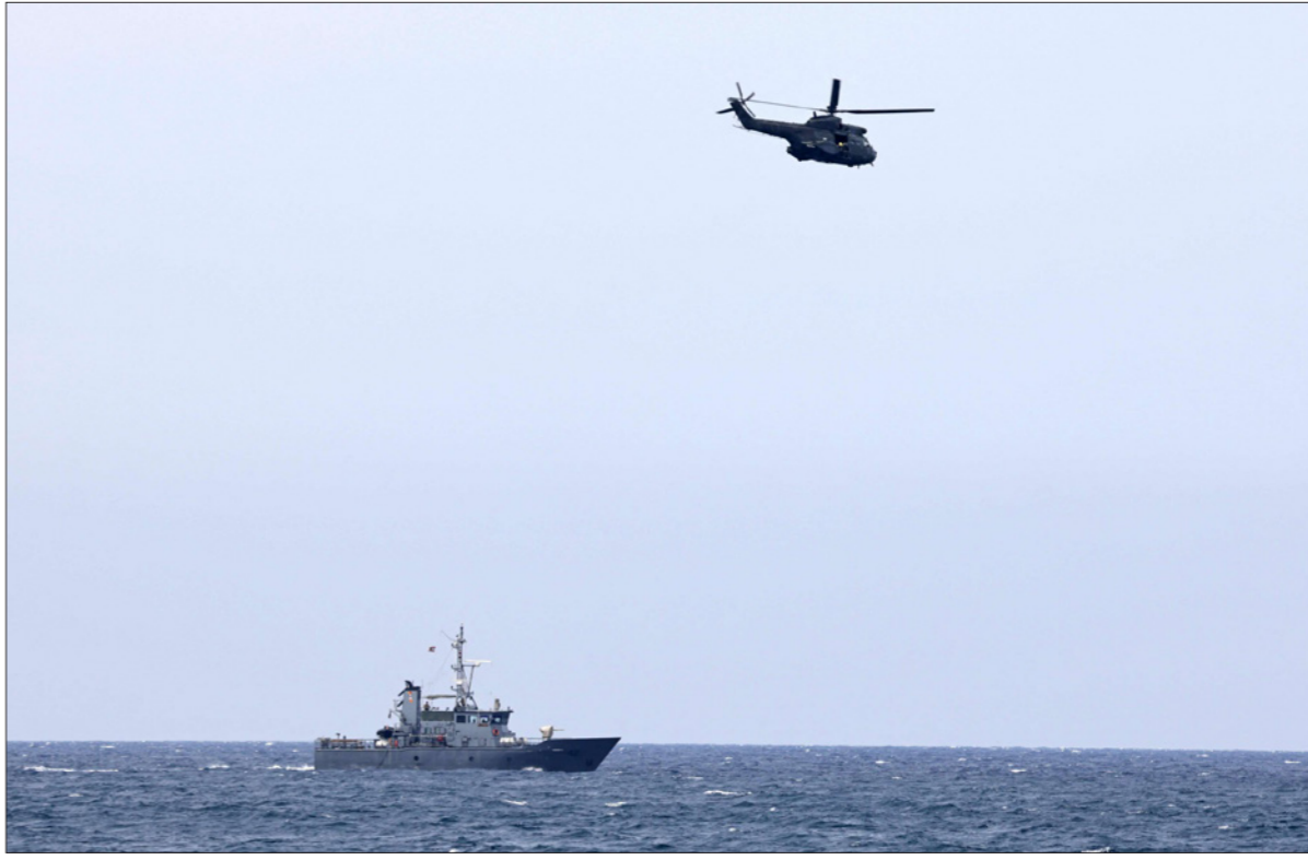
مروحية تابعة للجيش اللبناني تبحث عن الطائرة التي تحطمت قبالة سواحل بلدة حالات شمال العاصمة بيروت

الجهود للبحث عن الطائرة والراكبين الذين كانا على متنها، كما أجرى رئيس الحكومة نجيب ميقاتي اتصالاً بقيادة الجيش وطلب ارسال طوافة المساعدة في عملية البحث عن الطائرة، كما طلب استنقاذ القوات البحرية في مهمة البحث والاقتاد، وتوجه وزير الداخلية والبلديات بسام مولوي إلى المكان، وأعلن بعد معاينته مكان سقوط الطائرة: «استنقذنا كل أجهزة الدولة لوضع كل القدرات والخبرات واليات في عمليات الإنقاذ وقد عاينت موقع سقوط الطائرة من الجو ومن البحر».