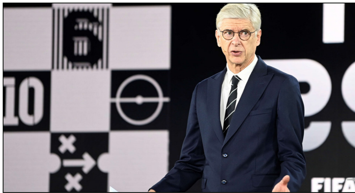
فينغر خلال حديثه عن الأساليب المستخدمة في التكنولوجيا الجديدة

وبحال فوزها في المباراة، ستزحف البرازيل رصيدها إلى 31 نقطة،