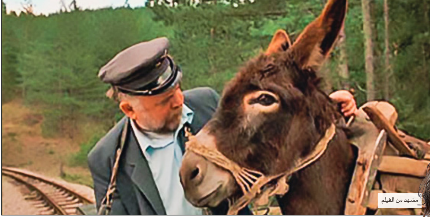
مشهد من الفيلم

العنيفة يُبدي دائماً سخرته من كل شيء، ويرى أن أهم ما يستحق الاحترام في هذا العالم هو «الحمار» ذلك الحيوان المتهم دائماً بالغباء، بينما هو في واقع الحال يُمثل قصة الحكمة والوداعة، ويدلل المخرج على وجهة نظر البطل بالعديد من المشاهد التي من شأنها إنصاف الحمار، وتغيير وجهة نظر البشر فيه، فمن دلائل تعزيز الرأي الإيجابي في الحمار أنه الوحيد المغلوب على أمره والصابر على كرامة الإنسان وعدوانيته، فهو يوقف قطار الحرب عنوة بثباته على قضبان السكة الحديد دون حراك في مشهد دلالي بالغ الأهمية في سياق الرقص للحرب العنيفة والسخرية منها.