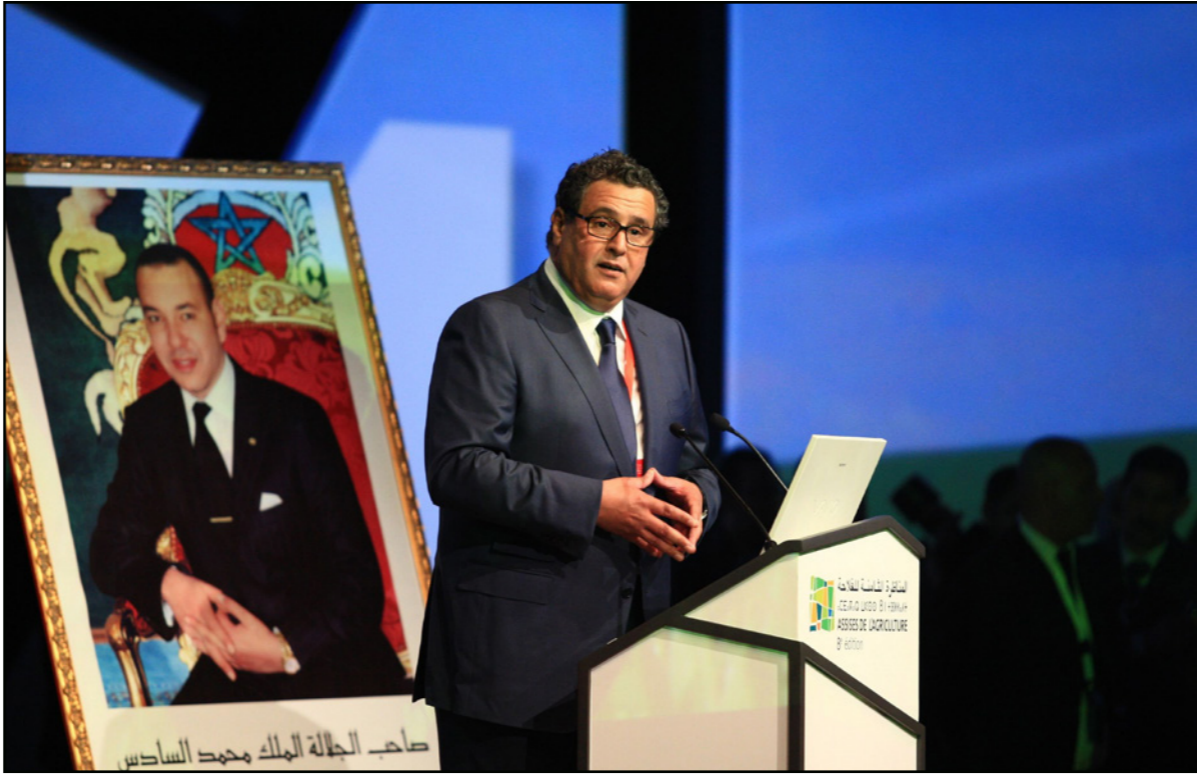
عزيز أخنوش رئيس الحكومة المغربية

وذكرت أن وتيرة النمو الاقتصادي التي وعدت بها الحكومة في برنامجها الخماسي والمتمتلة في معدل نمو متوسط يتأخر 4 في المئة تطرح إشكالية في حد ذاتها، على اعتبار أن هذه الوتيرة تبقى ضئيفة بالمقارنة مع التزام الحكومة بإحداث أكثر من 1 مليون منصب عمل، كما أن معدل 4 في المئة كمتوسط نمو خلال السنوات الخمس، يدخل في حساباته 5,5 في المئة التي يرتقب أن يحققها الاقتصاد المغربي هذا العام، ما يعني -حسب المصدر نفسه- أن الحكومة تقر ضمناً ومنذ البداية بأنها عاجزة عن الحفاظ على هذه الوتيرة طيلة ولايتها، علماً بأن طموح تحقيق 4 في المئة هو الآخر، سيظل كالعادة مرتبطاً بعدد من المتغيرات الداخلية (الفلاحة وتساقيات الأمطار) والمتغيرات الخارجية المتوقعة في سعر النفط في الأسواق العالمية، وقلبات الاقتصاد العالمي وخاصة الأسواق الشريكة، وتساؤلات: «الاتحاد الاشتراكي» عن جدوى النموذج التنموي الجديد إذا لم تتمكن الحكومة من تنفيذ نموذج اقتصادي جديد، ينتج نمواً مرتفعاً ومستقراً ومحصراً من تقلبات