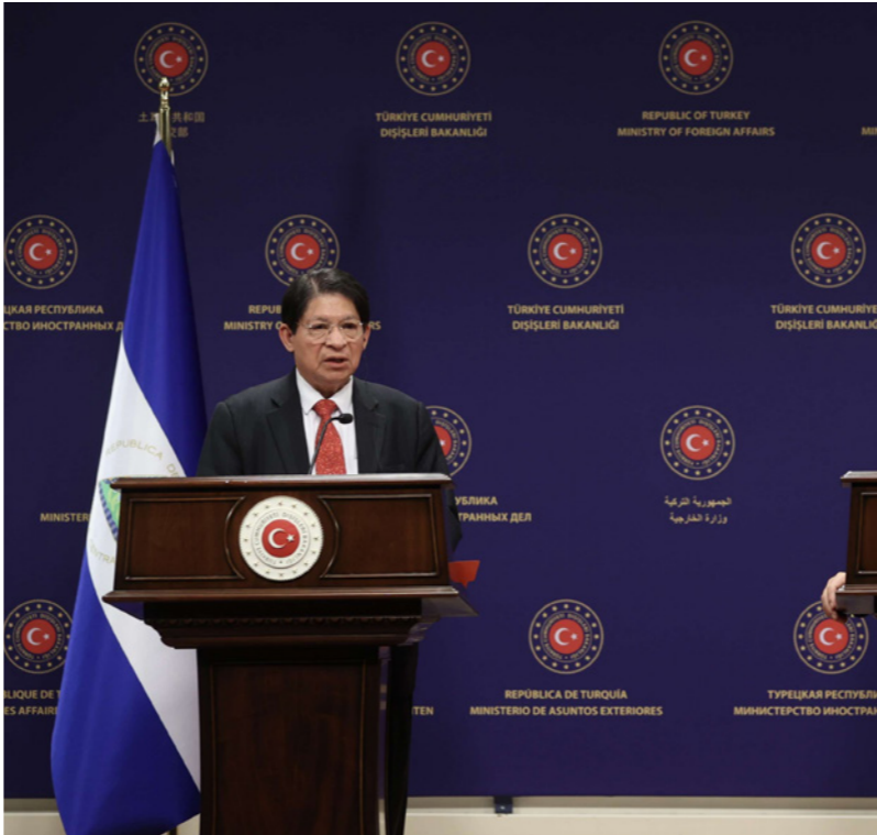
جاويش أوغلو مهدياً الأكراد في مؤتمر صحفي مشترك مع نظيره من نيكاراغوا دينيس مونكادا كوليندرس، عقب لقاؤهما في العاصمة أنقرة، أمس

داخل الأراضي التركية. وذكر جاويش أوغلو بالاتفاقيات المنفصلة التي توصلت إليها تركيا مع أمريكا وروسيا عقب عملية «نبع السلام» التي نفذها الجيش التركي في منطقتي رأس العين وثل أبيض عام 2019، مشيراً إلى أن البلدين لم يلتزمان بتعهداتهما بسحب