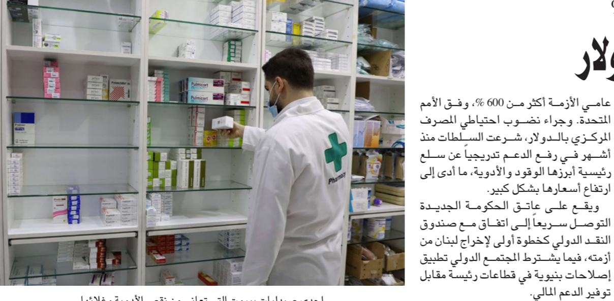
إحدى صيدليات بيروت التي تعاني من نقص الأدوية وغلائها

وكان مجلس الوزراء السوري وافق أمس خلال جلسته الأسبوعية على استكمال إجراءات التعاقد لإنشاء المحطة في منطقة وديان الربيع