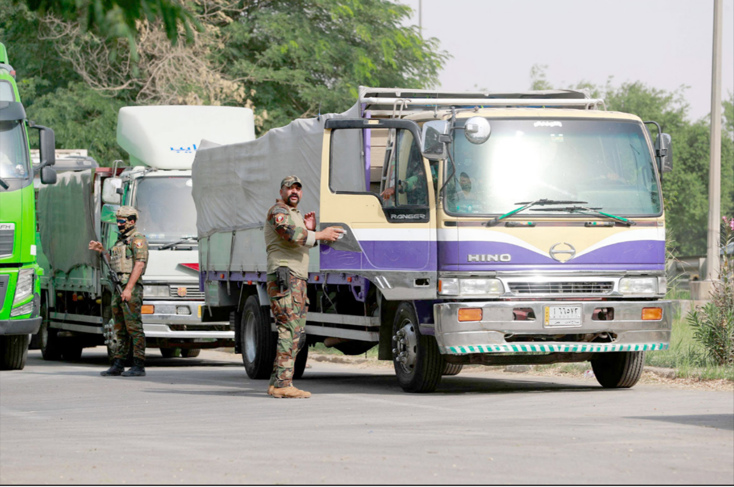
قوات أمن عراقية ترافق شاحنات محملة بصناديق الاقتراع وصلت أمس لبغداد

مفوضية الانتخابات الحالية، ويطالن ما تم إصداره من نتائج.. ولفت البيان إلى أن «المقاومة التي نذرت نفسها للعراق وسيادته، لا يمكن أن تتأخر مع المشاريع الخبيثة التي تسعى إلى دمج أو إلغاء الحشد الشعبي، والتي لا تصب إلا في خدمة الاحتلال الأمريكي، وهذا ما حذر وأقن بجرمته مراجعنا العظام دامت توفيقاتهم..» وتابع أن «مواجهة تلك المشاريع بما تحمله من مصادرة للحريات الشخصية، وقمع حرية التعبير عن الرأي، وإبدال القضاء بما يسمى بـ (الحاكم الشرعي) السنيعة الصيت، يستوجب وقوف الأحرار من أبناء شعبنا الأبي للحيلولة دون تحقيق تلك المآرب الخبيثة..» وفي تطور ميداني، أفاد مصدر أمّني، أمس، أن انفجاراً استهدف رتل دعم لـ«التحالف الدولي» بقيادة الولايات المتحدة أقصى جنوبي العراق. ونقلت مواقع إخبارية محلية، عن المصدر قوله إن «عبوة ناسفة انفجرت، ظهر اليوم (أمس) مستهدفة رتل دعم لوجستي تابع للتحالف الدولي أثناء مروره ضمن حدود محافظة البصرة..» وأوضح المصدر، أن الانفجار لم يسفر عن أي إصابات.