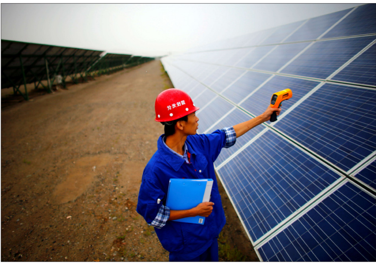
انتقادات جهات في الاتحاد الأوروبي تعزو ارتفاع أسعار الطاقة إلى زيادة تكاليف التحول إلى مصادر الطاقة النظيفة

انبعاثات الكربون الذي وضعه الاتحاد الأوروبي ارتفعت منذ تباطؤ العام الماضي وياتت متاحة تمويل التدابير قصيرة الأمد الرامية لتخفيف من حدة أزمة الطاقة.