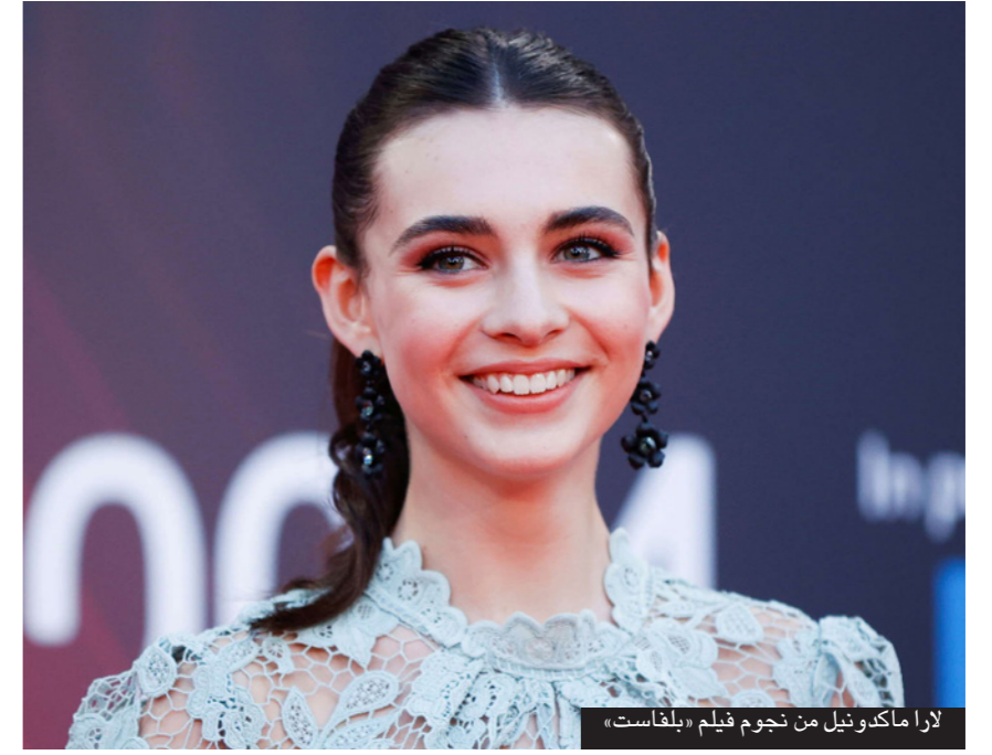
لارا ماكو نيل من نجوم فيلم «بلفاست»

وأضاف «هم شيء أن يشاهد الناس الفيلم ويعجبوا به... وأي شيء أكثر من ذلك فهو أمر جيد غير متوقع... وسيبدأ عرض فيلم «بلفاست» في دور السينما الأمريكية في 12 نوفمبر/ تشرين الثاني المقبل.