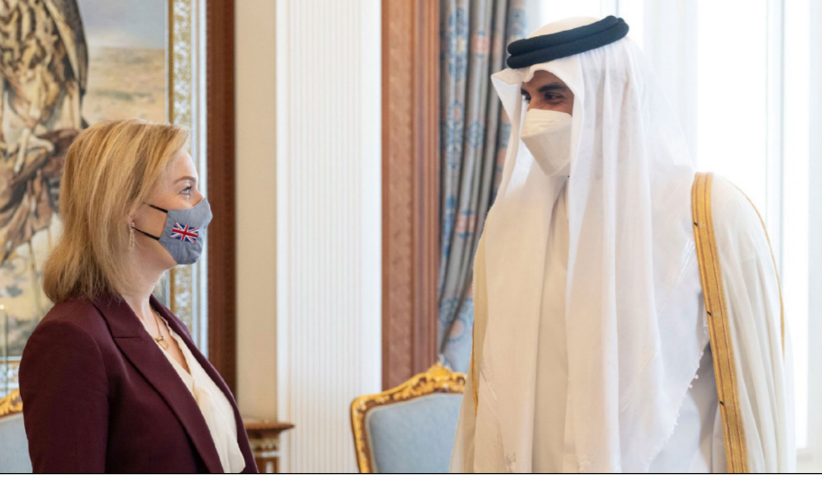
أمير قطر يستقبل وزيرة الخارجية البريطانية