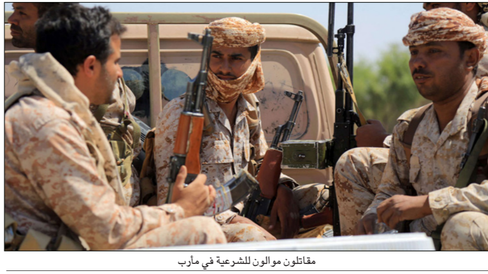
مقاتلون موالون للشرعية في مارب

المسلحة على محافظة مارب، التي تشهد تصعيداً عسكرياً كبيراً من قبل الحوثيين في محاولة منها لاجتياحها والسيطرة عليها. وأكدت الدول الأعضاء في مجلس الأمن في بيان لها، على «ضرورةوقف الفوري لإطلاق النار في جميع أنحاء اليمن»، وفي مقدمتها «هجمات الحوثيين العابرة للحدود ضد السعودية»، وأوضح البيان التزام مجلس الأمن بوحدة وسيادة واستقلال اليمن وسلامة أراضيه. وأشارت إلى الكارثة الإنسانية التي تعصف باليمن جراء المواجهات المسلحة هناك بين الميليشيا الحوثية والقوات الحكومية، معرباً عن قلقه إزاء «الحالة الإنسانية المتردية في اليمن، بما فيها الجوع وتزايد خطر حدوث مجاعة واسعة النطاق»، وشدد، مجلس الأمن، في بيانه، على «ضرورة امتثال جميع الأطراف للالتزامات بموجب القانون الإنساني الدولي، بما في ذلك تلك المتعلقة بوصول المساعدات الإنسانية وحماية المدنيين»، مطالبا بضرورة «ممان المساءلة عن انتهاكات وتجاوزات حقوق الإنسان وانتهاكات القانون الإنساني الدولي، وتجنب أي أعمال يمكن أن تسبب معاناة للسكان المدنيين». وفي الوقت الذي أعرب فيه عن القلق العميق إزاء انهيار سعر صرف الريال اليمني مقابل الدولار في جنوب اليمن، طالب الحكومة اليمنية وشركاء اليمن (بمجلس التحالف العربي) بالنظر في جميع الإجراءات الممكنة لتعزيز الاقتصاد، بما في ذلك ضخ المزيد من العملات الأجنبية في البنك المركزي اليمني، مشيراً إلى تقديم المجلس «الدعم الثابت لمبعوث الأمم المتحدة الخاص إلى اليمن، هانس غروندبرغ».