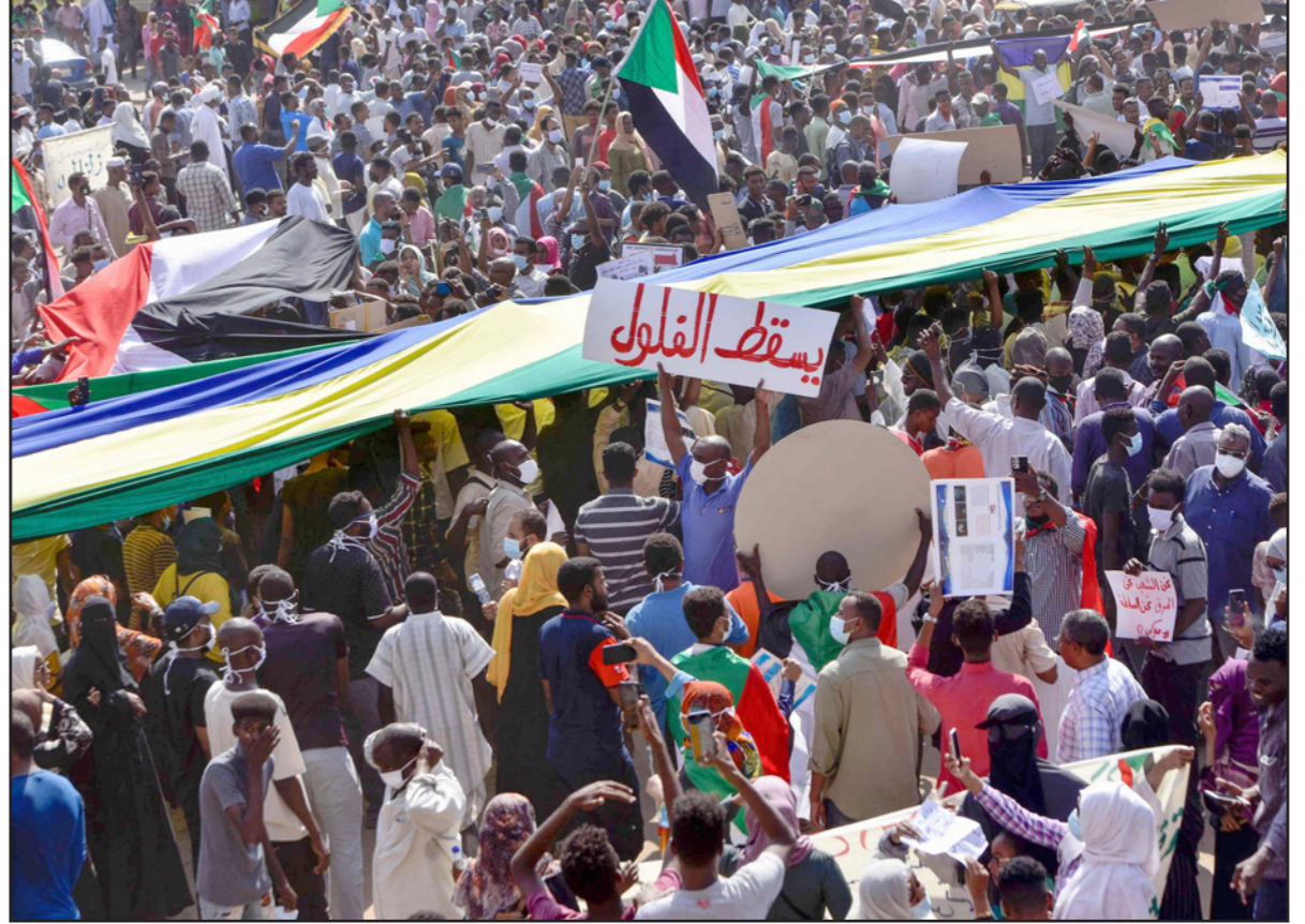
من تظاهرات الأسس في السودان