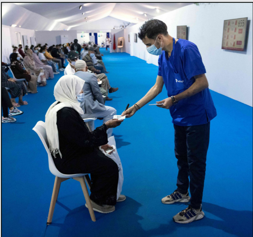
مغاربة ينتظرون دورهم خارج مركز التطعيم ضد فيروس كورونا في مدينة سلا

الرباط - أ ف ب: بدأ المغرب، أمس الخميس، العمل بـ«جواز التطعيم» ضد كوفيد-19 شرطاً حصرياً للإعفاء من القيود الاحترازية المفروضة بسبب الجائحة، مثل التنقل بين المدن والسفر إلى الخارج ودخول الإدارات العمومية والمقاهي والفضاءات المغلقة.