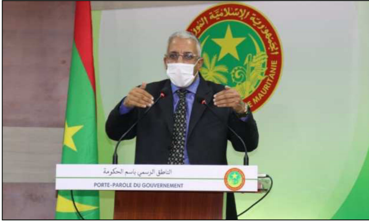
وزير الثقافة المختار ولد دا هي

ولم يتوقف الجدل عند هذا الحد، بل بادرت منظمة "نجدة العبيد" الحقوقية لتوضيح في بيان لها أمس، ما وصفته بـ"تجدد