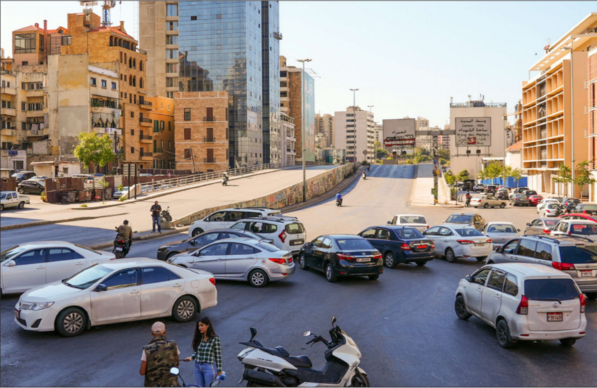
سيارات الأجرة تغلق الطرقات أمس في بيروت احتجاجا على زيادة أسعار الوقود في لبنان