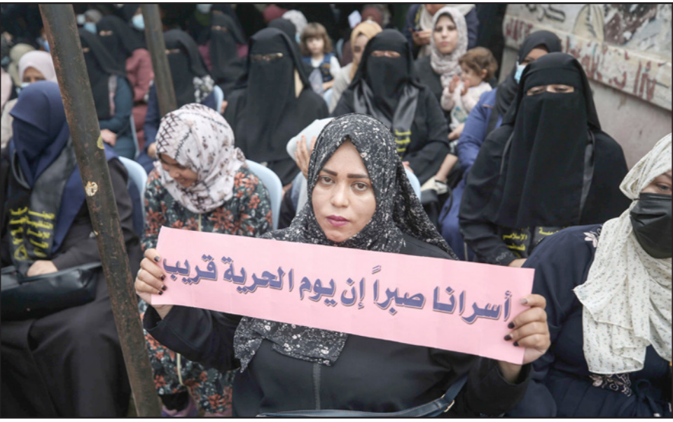
سيدات يشاركن في مؤتمر في غزة دعما للأسرى في سجون الاحتلال