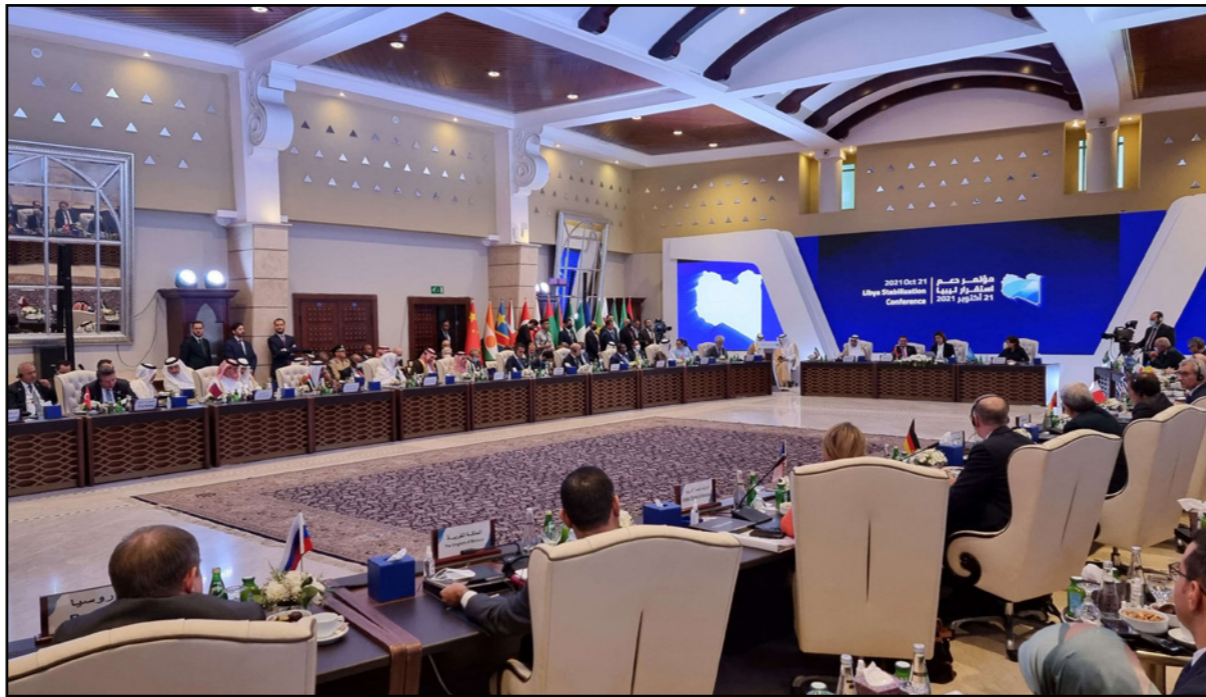
من مؤتمر دعم الاستقرار في ليبيا أمس

كما شدد على ضرورة خروج كافة القوات الأجنبية والمقاتلين الأجانب والمرتبقة في ليبيا بما يضمن عودة ليبيا إلى الليبيين ويحقق استقرارها وسيادتها ممتحناً جهود رئيس المجلس الرئاسي ونائبه في ملف المصالحة الوطنية. وفي كلمة له في المؤتمر، قال شكري، الخفيس، إنه لا مجال للحديث عن تحقيق استقرار ليبيا بصدق وجدية إلا بانسحاب جميع القوات الأجنبية والمرتبقة والمقاتلين الأجانب دون استثناء أو تفرقة. وعلى هامش الفعاليات، عقد رئيس وأعضاء المجلس الرئاسي عدة لقاءات أخرى مع عدة وفود أحدها جمع نائب رئيس المجلس الرئاسي محمد المنفي مع وزير الدولة للشؤون الخارجية القطري سلطان بن سعد المريخي والذي بحث دعم مسارات الحل السلمي للأزمة الليبية وآخر تطورات المشهد السياسي في ليبيا والعديد من الملفات في مقدمتها إجراء الانتخابات الرئاسية والبرلمانية المترتبة على المصالحة الوطنية وسبل الدفع بالعملية السياسية من خلال مبادرة دعم واستقرار ليبيا. وكان لقاء آخر قد جمع نائب رئيس المجلس الرئاسي على الالافي مع الوفد الإماراتي ممثلاً في وزير الدولة للشؤون الخارجية الإماراتي وسفير دولة الإمارات في ليبيا والذي تم التأكيد فيه من قبل الوفد على دعم دولة الإمارات للعملية السياسية في ليبيا وصولاً للاستحقاق الانتخابي القادم ودعم ملف المصالحة الوطنية.