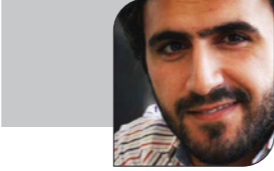
سليم البيك *

المخرج ليتعاطف معها إن يطلب من الجندي بانتقادها تعريفة لأحدهم يكلم من الجندي إطلاق رصاصاً على ركبته. في هذه المهزلة من المشاعر الإنسانية الكتابية أو اللفظية ثانياً والاستعمارية دائماً، يستحضر الفنان عهد التميمي.