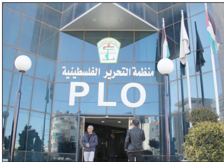
مكتب منظمة التحرير في واشنطن

ويكشف هذا القرار، حسب البيان، أن الإدارة الأمريكية تعتمد صيغاً سياسية شكلية ليس لها أي أثر أو وزن من شأنها إجبار إسرائيل على وقف عمليات تعميق وتوسيع الاستيطان، وبالتالي فإن الموقف الأمريكي المعلن بشأن حل الدولتين يفقد مصداقيته ويتآكل بالتدريج. وكان الرئيس بايدن، قد أبلغ بينيت خلال لقائهما في أغسطس/آب الماضي في البيت الأبيض، أنه «لن يتنازل» عن إعادة فتح القنصلية الأمريكية في القدس لخدمة الفلسطينيين، كما كمر مسؤولون في إدارته تمسكهم بـ«حل الدولتين» ورفض الاستيطان، لكن دون ضغوط حقيقية على إسرائيل لتنفيذ الأمر.