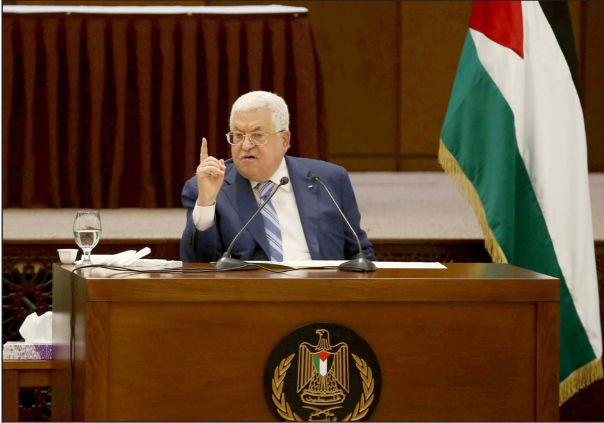
الرئيس الفلسطيني محمود عباس

السلمية وتوسيعها، وتعزيز دور القيادة الوطنية الموحدة وصولاً إلى «العصيان الوطني الشامل، ضد الاحتلال. وأدانت القيادة، القرار الإسرائيلي بتصنيف ست مؤسسات أهلية فلسطينية، وتعمل وفق القانون الفلسطيني، ووصفها بأنها «منظمات إرهابية»، وأكدت دعمها لاستمرار عمل هذه المؤسسات، ورفض القرار الإسرائيلي.