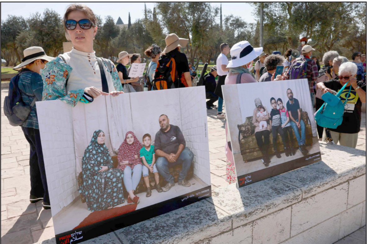
وقفة احتجاجية نظمها يهود ضد محاولة إخلاء منزل عائلة فلسطينية في سلوان

الاندماج في المجتمع والاقتصاد الإسرائيلي، وكذلك... تعزيز الحصانة الاقتصادية والاجتماعية للعاصمة بأكمله». ويشدد «مدار» على أنه لا بد من التوقف عند مفهوم «تعزيز الحصانة... للجمعة الدوالي لقبول «القدس الموحدة» كعاصمة لإسرائيل: إحدى القمات لذلك عن الكف عن اعتبار المقدسين مجتمعاً محتلاً من خلال قيام إسرائيل بمعايهم على قدم وساق مع باقي المواطنين الإسرائيليين. وتسوية الأراضي قد تأتي في هذا السياق لتقليل الفجوات الاقتصادية والاجتماعية بين المقدسين واليهود في المدينة، وتأتي إلى جانب خطة التدخل في حقل التعليم، العمل، البنية التحتية وغيرها من المجالات. ويعتقد زئيف الكين، وزير القدس البيئي المتطرف (حزب «أمل جديد») بأن ضم الشطر الشرقي من القدس المحتلة كان خلال الخمسين سنة الماضية ضما على السوق فقط. ويرى الكين وهو مهاجر جديد من روسيا أنه على أرض الواقع، فإن «القدس الموحدة» ظلت قدساً من شطرين بحيث أن كل شطر يختلف عن الثاني من حيث مستوى المعيشة والرفاه، والظروف الاجتماعية، والاقتصادية، والثقافية وعلية، مقدمة لضم القدس الشرقية «علياً» فإن مشروع تسوية الأراضي يعتبر خطوة ضرورية».