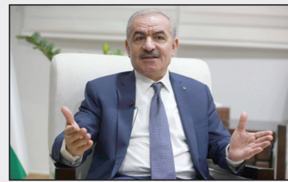
رئيس الوزراء الفلسطيني محمد اشتية

سوريا، كما كانت عام 2013 وقال إن حجم المساعدات الدولية للموازنة الفلسطينية في 2020 لم يتجاوز 350 مليون دولار، وكانت الحكومة الفلسطينية بسبب العجز المالي، قد أقرت الموازنة العامة للسنة المالية 2021 وسط توقعات بقوّة عجز تصل إلى حوالي مليار دولار. وأثرت جائحة كورونا كثيراً على الوضع الاقتصادي، حيث انكش الاقتاد الفلسطيني بنسبة 11.5% خلال عام 2020 وهو أحد أكبر الانكماش السنوية منذ إنشاء السلطة الوطنية الفلسطينية عام 1994.