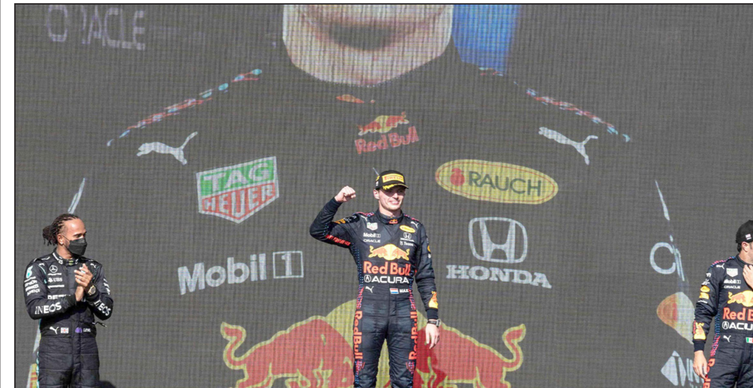
الفائز بالسباق الأمريكي فيرستابن يتوسط وصيفه هاميلتون (يسار) والثالث بيريز

السباق، واستبدل هاميلتون إطراره في اللفة 38 وخرج خلف فيرستابن بفارق قرابة 8 ثوان مع بقاء 18 لفة حتى النهاية، ثم بدأ ضغطه وتقليص الفارق تدريجياً حتى وصل إلى قرابة 4 ثوان ونصف في اللفة 43. ومع الدخول في اللفات العشر الأخيرة، نزل الفارق بين