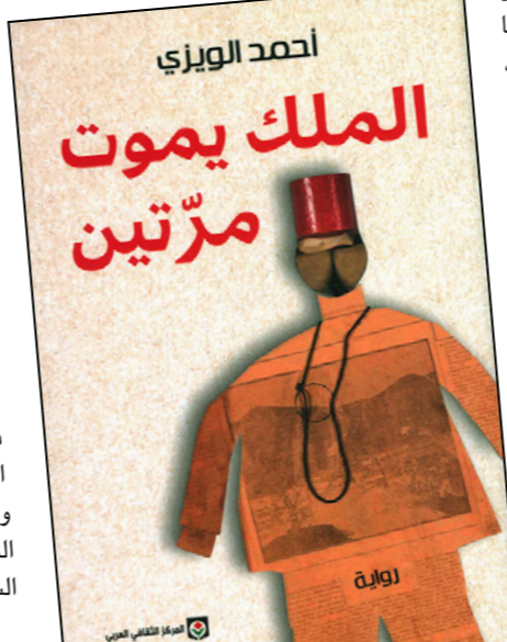
أحمد الويزي الملك يموت مرتين

● يتحدث الترجمة الذي نهض بأعباء ترجمة هذا النص الروائي إلى العربية عن مقصدية المؤلف من تأليفه له: (كان قصد كتابته تصوير جانب من جوانب الأجواء التي اكتنفت بغيوها القاتمة سماء المملكة، وهي نقاد من تاريخها. في مستهل القرن العشرين) ويذكر المترجم أن قدر هذه الرواية أن تكون تاريخية (مع أنها لم تكن تنشد سوى الانتماء إلى سجلاته، والتقاطع نسبياً مع ما حففته دواوينه الزاخرة بالوقائع والأحداث). لكن، على انتماء الرواية للتاريخ ولوقائعه وسجلاته، فإنها تتنصر دائماً لغنصر التخيل الذي يُعد مزيتها البارزة. إن نهوضها على عنصر التخيل يجعل الروائي يبذل شأؤ المورخ في النبش، وملء