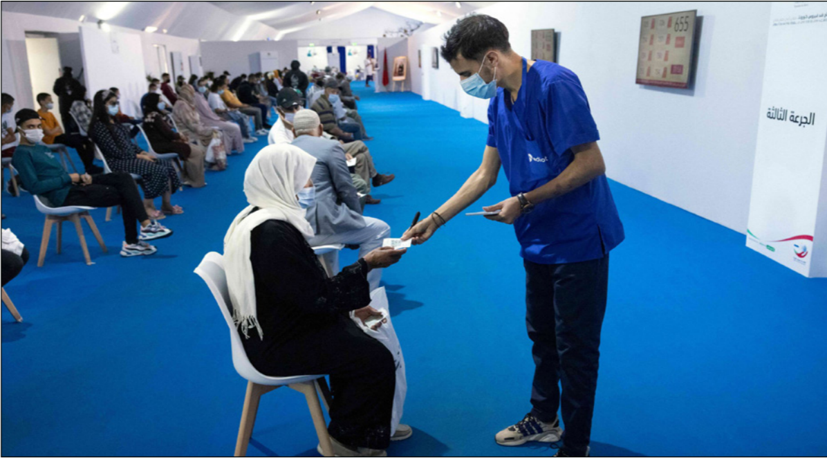
مغاربة ينتظرون دورهم خارج مركز تطعيم كوفيد-19