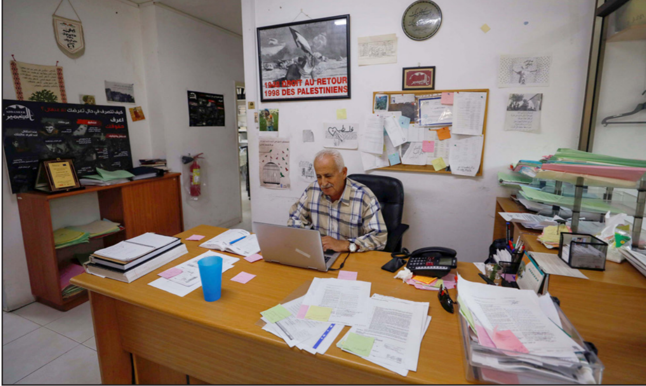
أحد العاملين في مكتب منظمة «الضمير» التي وضعتها إسرائيل على قائمة الإرهاب