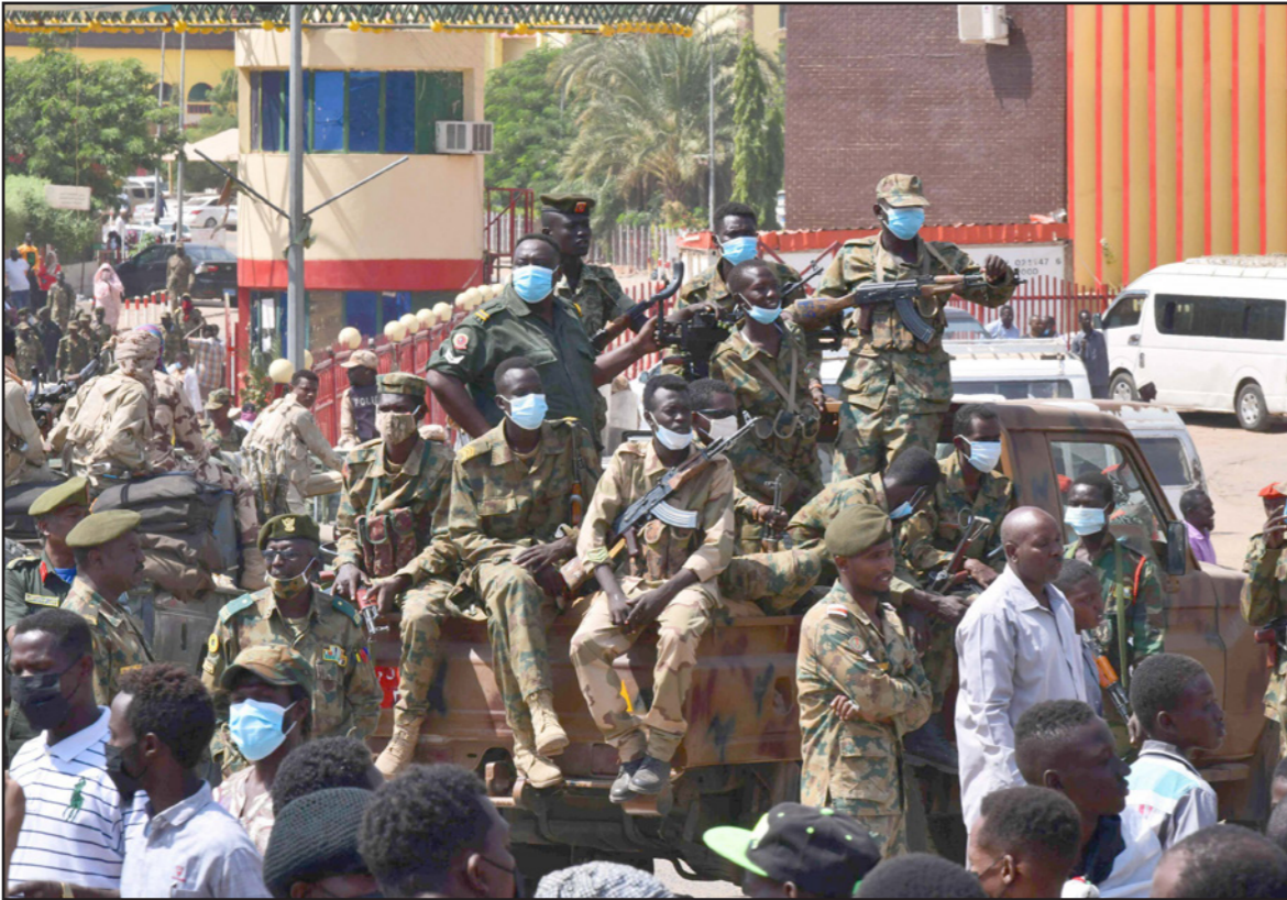
... وعناصر من الجيش السوداني في أم درمان