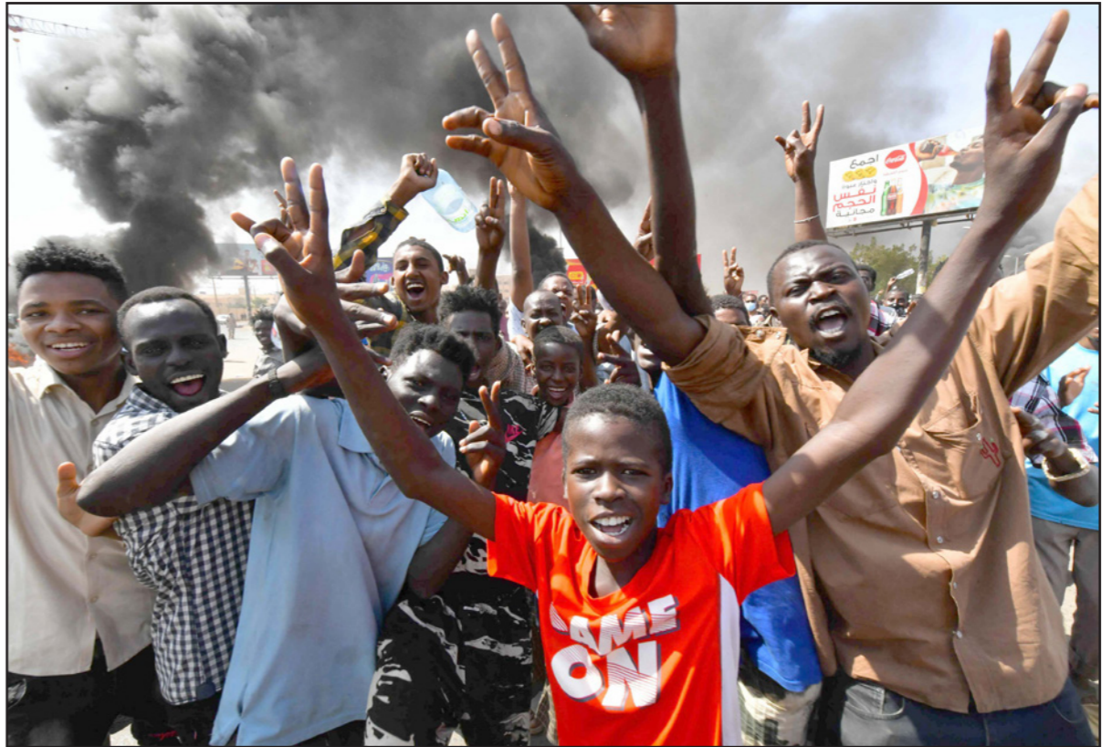
جانب من الاحتجاجات التي خرجت في السودان على انقلاب الجيش أمس