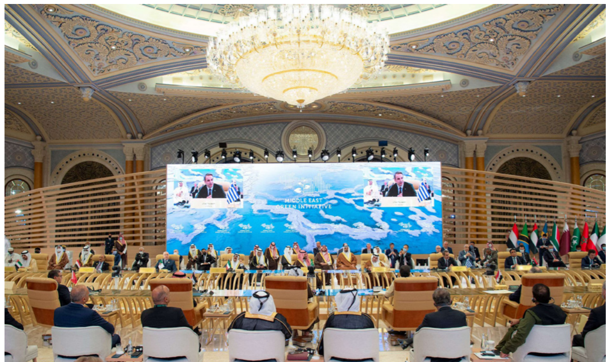
جانب من قمة «الشرق الأوسط الأخضر» أمس في الرياض

وقال رئيس وزراء الجزائر، أيمن بن عبد الرحمن، إن بلاده تدعم مبادرة السعودية لخلق رؤية مشتركة لمكافحة التغير المناخي. وتجمع قمة مبادرة الشرق الأوسط الأخضر