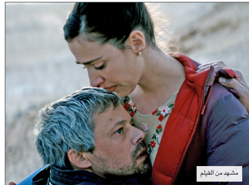
مشهد من الفيلم

بجراوا الحروب، مَن يعانون من نقص في الحريات، وهم بالدرجة الأخيرة أولئك الواكعبن تحت استعمار دولة «المتعاطفين». أما الأكثر تقبلاً في ذلك، ما لا يقص مضاجع الدولة، فهي صورة لغفاعة صغيرة تصرخ على جندي إسرائيلي مسلح. لا يحتاج أحدنا مشاعر استثنائية كي يتعاطف مع الغفاعة في الفيديو الشهير الذي ترفع فيه الطفلة عهد قبضتها في وجه الجندي - وتُشاهد كذلك في الفيلم - ولا نقمة انقلابية تجاه الدولة في ذلك، وفيه يجيد «داعي السلام» راحته الظهوية. أيضاً كان المشهد، لأي طفلة كأي جندي، مستقبل الأنظمة السياسية، مهما كانت عسكريتارية، تعاطف سطحيًا (متواطئ مع) الدولة في العقم (لأي فنان مع الطفلة، فيمكن، دائماً، إحالة المشهد إلى رحمة الجندي، وسعة صدر الدولة).