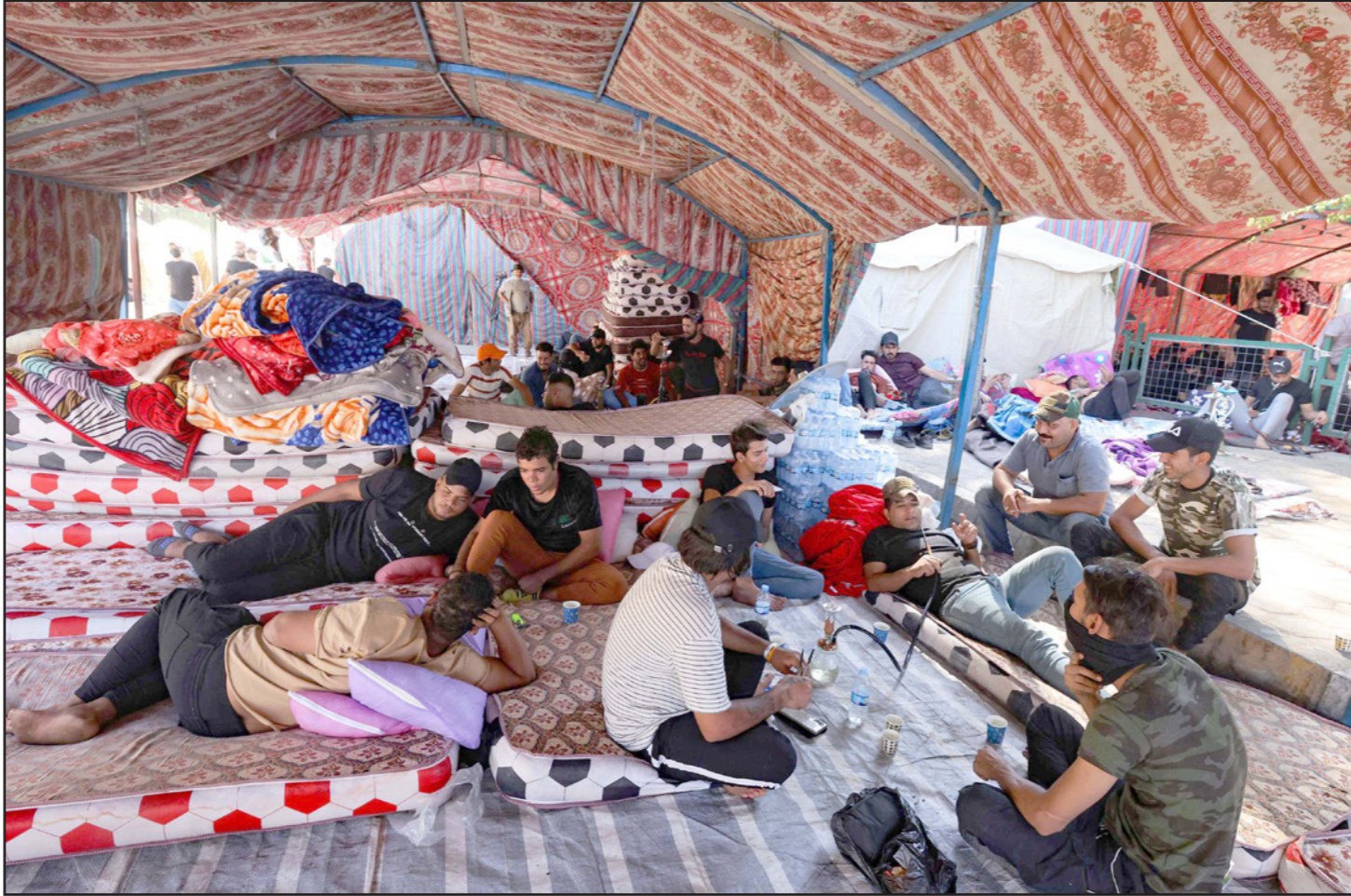
انصار القوى الشيعية المعترضة على نتائج الانتخابات في خيم الاعتصام قرب المنطقة الخضراء