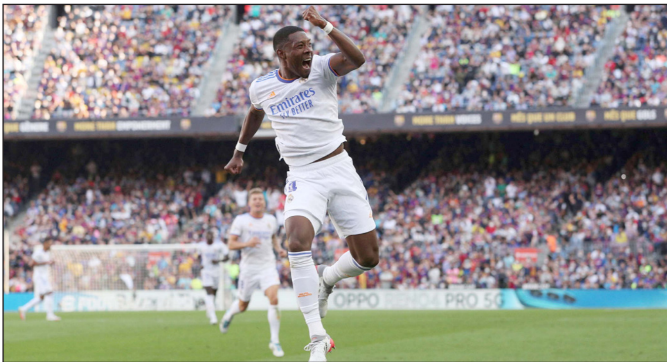
الابا يحتفل بتسجيل الهدف الأول للريال في مرمى برشلونة في الكلاسيكو

الثلاث الذي يفصله عن الريال الثاني وإشبييلية الثالث، فرط سوسيسيدا يتقدمه على مضيه أتلتيكو حامل اللقب الرابع والتتو الرابع الذي يحل الخمس صيفا على ليفانتي التاسع عشر، وعلى غرار الريال والتتو، سيكون اشبيلية الثالث بفارق نقطة عن الصدارة والأهداف عن الريال، مرتبعا لاقتناص المركز الأول لكن أول العودة الأربعة من ملعب مايوركا الثاني بعشر بالناقص الثلاث.