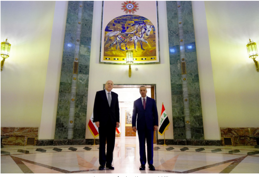
الكاظمي مستقبلاً ميفاتي أمس في بغداد

على سعيد آخر، وبعد رد رئيس الجمهورية ميشال عون التعديلات على قانون الانتخاب إلى البرلمان لإعادة النظر فيه، دعا رئيس مجلس النواب نبيه بري إلى عقد جلسة تشريعية في تمام الساعة الحادية عشرة من قبل ظهر يوم الخميس في قصر الأونيسكو، وذلك بعد اجتماع لهيئة المكتب في عين التينة.