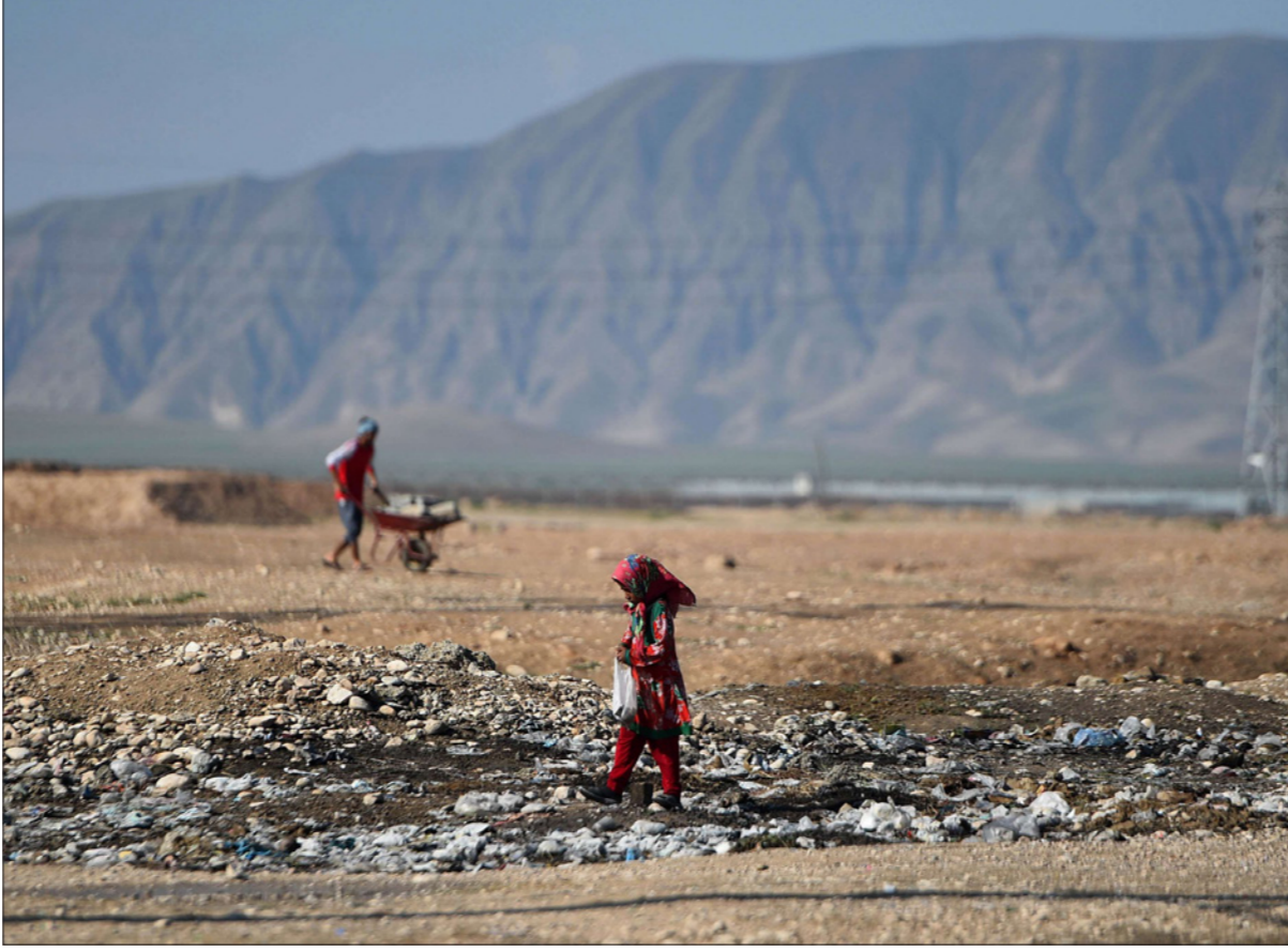
فتاة أفغانية تبحث عن مواد قابلة لإعادة التدوير في مكب للنفايات في ضواحي مزار الشريف

وكانت أزمة الغذاء، التي فاقمها تغير المناخ، حادة في أفغانستان حتى قبل سقوط الحكم في أيدي طالبان. وقال بيزلي: «ما نتوقع حدوثه يحدث بسرعة أكبر بكثير مما نتوقعه. سقطت كابول بأسرع مما توقع أحد وينهار الاقتصاد بوتيرة أسرع من ذلك». وأضاف أن المبالغ المخصصة للمساعدات التنموية يجب أن توجّه للمساعدة الإنسانية، وهو ما أقدمت عليه بعض الدول بالفعل، أو أن يتم صرف الأموال المجمدة وتحويلها عبر البرنامج. وقال: «عليك فك تجميد هذه الأموال حتى يتنجح الناس».