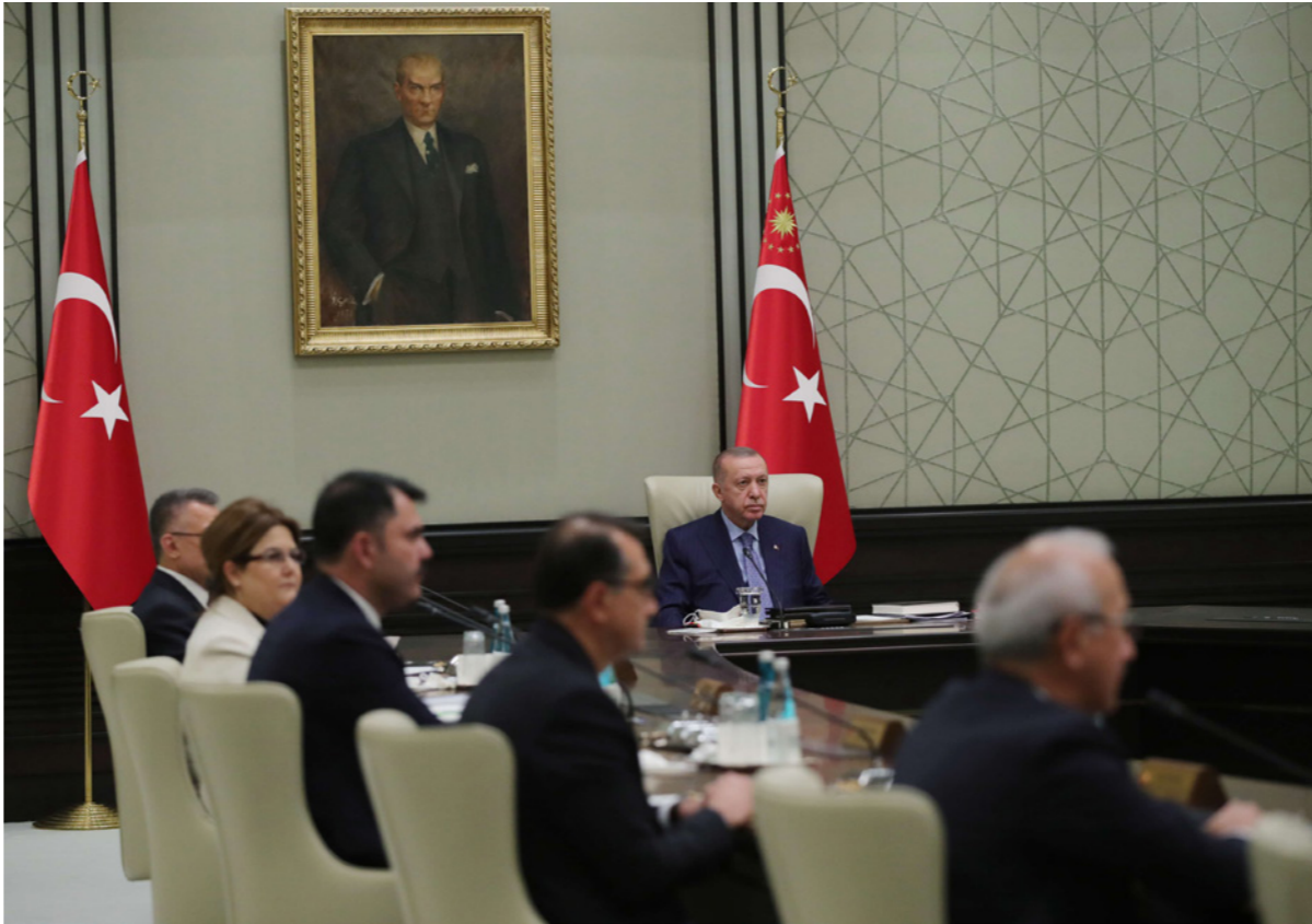
اردوغان خلال اجتماع حكومي في أنقرة

وفي واقعة أخرى، شارك السفير الإيراني في أنقرة منوچهر متقي، الذي كان متحمساً