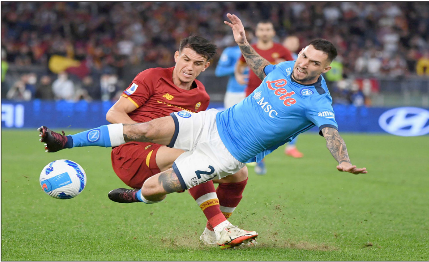
المنافسة كانت محتدمة في صراع روما ونابولي خلال التعادل السلبي

71 من ركلة حرة لديبالا لولا تاقف هاندانوفيتش. ونجح ديبالا في إدراك التعادل للضيوف من ركلة جزاء في الوقت القاتل تسببب بها دينزل ديفريس بعد خطأ في المنطقة المحرمة على اليكس سانرو (89). ويبقى يوفنتوس على نفس المسافة من أتالانتا الخامس الذي فرض عليه التعادل أمام ضيفه أودينيزي 1-1 في الوقت القاتل. وتقدم أصحاب الأرض بفضل رسلان أليونوفسكي في الدقيقة 56، إلا أن أودينيزي ردّ في الدقيقة الرابعة من الوقت المحتسب بدل الضائع للشوط الثاني برأسية من بيتو. ورفع