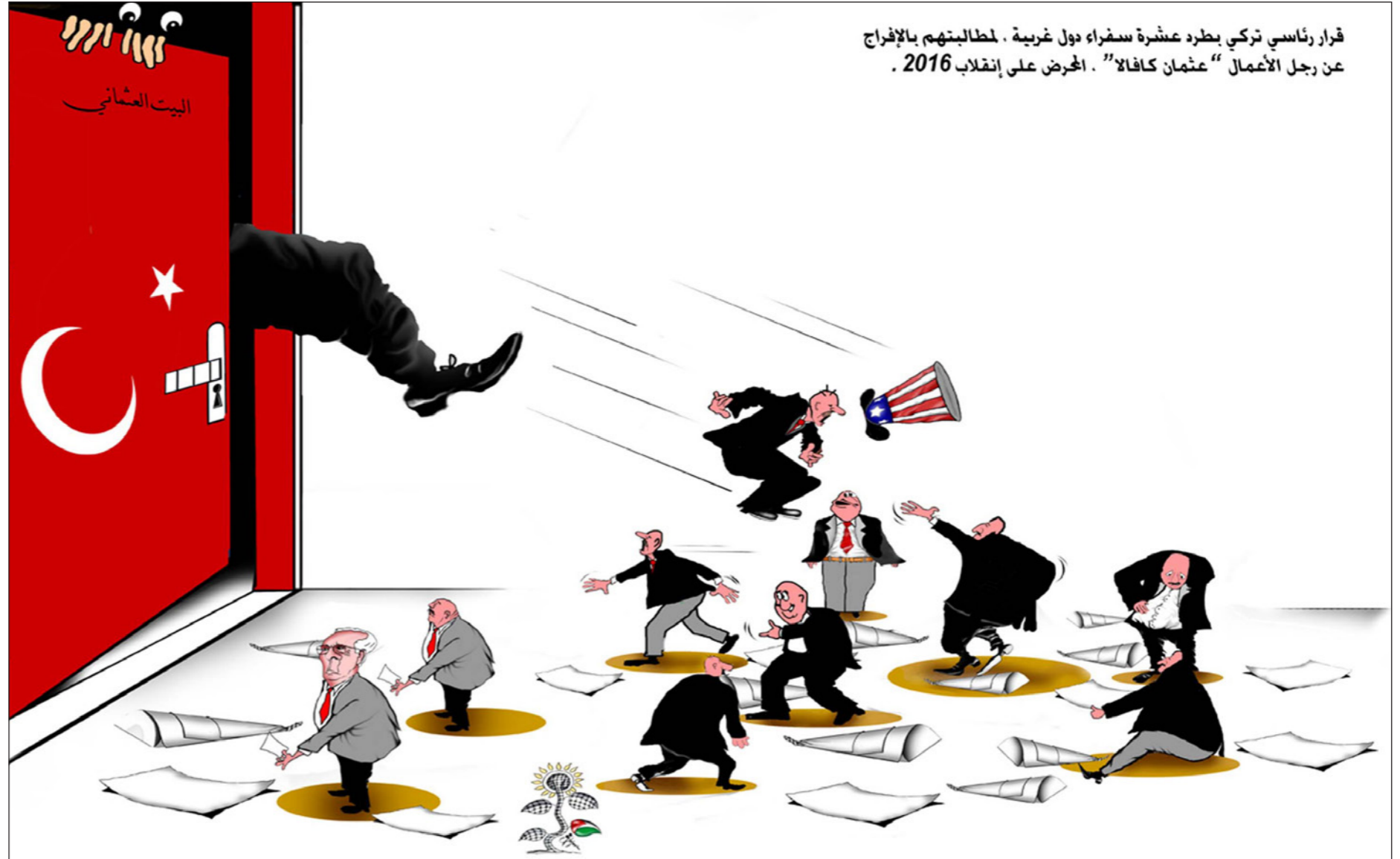
قرار رئاسي تركي بطرد عشرة سفراء دول غربية . لحطالبتهم بالإفراج عن رجل الأعمال "عثمان كافالا" . الحرض على إنقلاب 2016 .