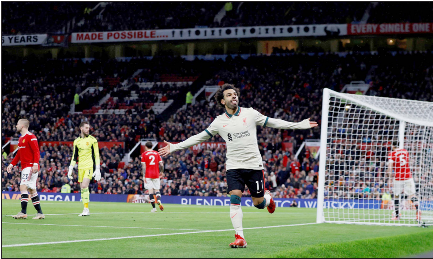
صلاح يحتفل بتسجيل هدفه الشخصي الثالث والخامس لليفربول في مرمى يونايتد

ودفع سولشاير ببوغيا مطلع الشوط الثاني بلا من غرينوود في محاولة أقله لتقليص الفارق، إلا أن الرد جاء سريعا بهدف ثالث لصلاح الذي وصلته كرة بنية في العمق من القائد جوردان هندرسون ليفرود دي خيا ويسكنها الشباك في ظل أداء دفاعي متذبذب (50). ويات صلاح أول لاعب يحقق هاتريك في «أولد ترافورد» ضمن «البريميرليغ» (1992) بعد ديفيس باباي لاعب كويتس بارك رينجرز (في الأول من كانون الثاني/يناير 1999) وظن يونايتد أنه حصل على هدف تقليص الفارق بفضل رونالدو الذي توغل عن الجهة اليسرى وتلاعب بالدفاع قبل أن يسد الي يسار اليسون، إلا أنه ألغى بعد الاحتكام الى «الفار». وزادت من يونايتد بطرد مياشيس ليوبغا إثر تدخل بالقدمين على كيتا، علما أن الحكم أشهر بداية الصفراء قبل أن يبدل رأيه بعد الاحتكام الى «الفار».