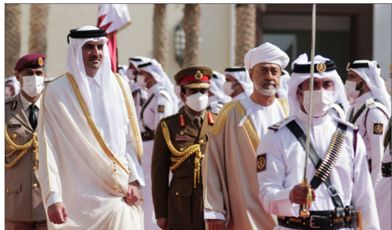
استقبال رسمي لسلطان عُمان في قطر