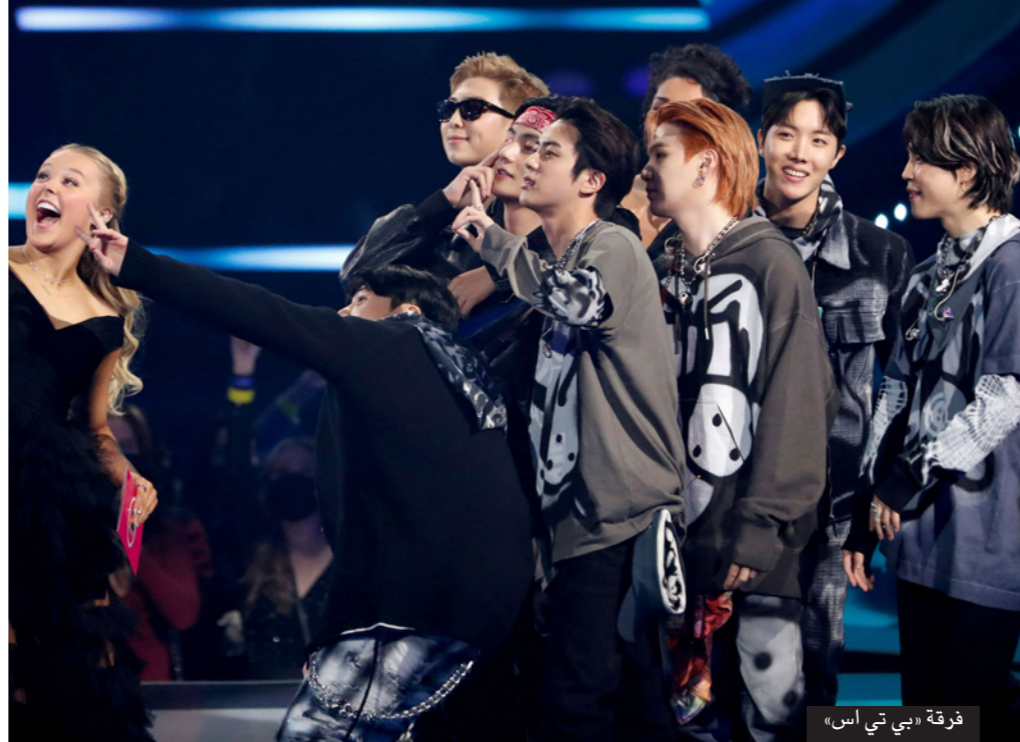
فرقة «بي تي اس»

لوس أنجيليس - ف ب: أصبحت فرقة «بي تي اس» الكورية الجنوبية الشهيرة ليل الأحد أول مجموعة موسيقية آسيوية تفوز بجائزة «فنان العام» في حفل توزيع «أمريكان ميوزيك أوردز» (جوائز الموسيقى الأمريكية). كذلك حصلت الفرقة جائزة «ثنائي أو فرقة البوب المفضلة» عن أغنية «باتر» خلال الحفل الذي أقيم في لوس أنجيليس وقدمته مغنية الراب كاردى بي. وانضمت الفرقة الأكبر في كوريا الجنوبية، التي باتت في رصيدها تسع جوائز «أمريكان ميوزيك أوردز» إلى فرقة السروك البريطانية «كولدبلاي» في العرض التلفزيوني العالمي الأول لأغنية «ماي يونيفرس»، خلال العرض الذي حضرته كوكتبة من النجوم. ونشرت على تويتر صورة للفرقتين معاً. ووجهت «بي تي اس» لاحقاً عبر تويتر تحية إلى معجبي الفرقة الذين يعرفون باسم «جيش بي تي اس». وقد حجزت الفرقة الكورية الجنوبية مكاناً لها في تاريخ سباقات الأغنيات في الولايات المتحدة العام الماضي مع تصدع أغنيتهما المنفردة «بيناميت» قائمة «بيلبورد هوت 100» مما جعلها أول عمل كوري جنوبي يتصدر التصنيف.