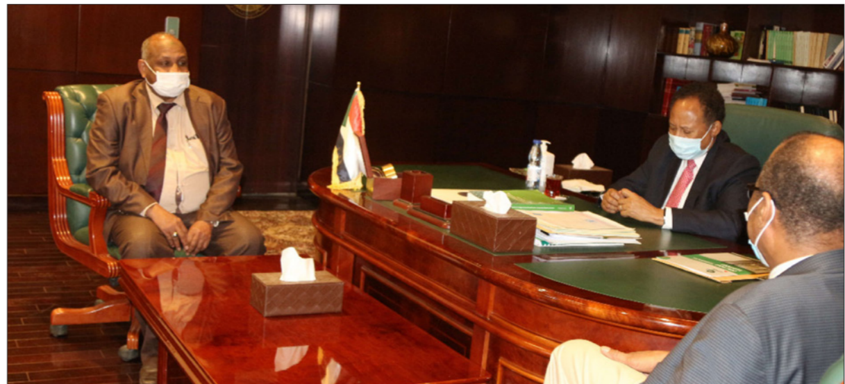
رئيس الوزراء السوداني يباشر مهامه من مكتبه بعد الاتفاق السياسي مع الكون العسكري

وقع في 25 أكتوبر/ تشرين الأول، التزاماً مع إعلان تنسيقية لجان مقاومة أمدرامان، عن تظاهرات «مليونية الوفاء للشهداء» الخميس المقبل. ويصنع اتفاق حمدوك - البرهان على 14 بندا، أبرزها عودة حمدوك رئيساً للوزراء، وتشكيله حكومة كفاءات، وأن يكون المجلس السيادي مشرفاً على الفترة الانتقالية، بالإضافة إلى التأكيد على الالتزام بالوثيقة الدستورية واتفاق السلام.