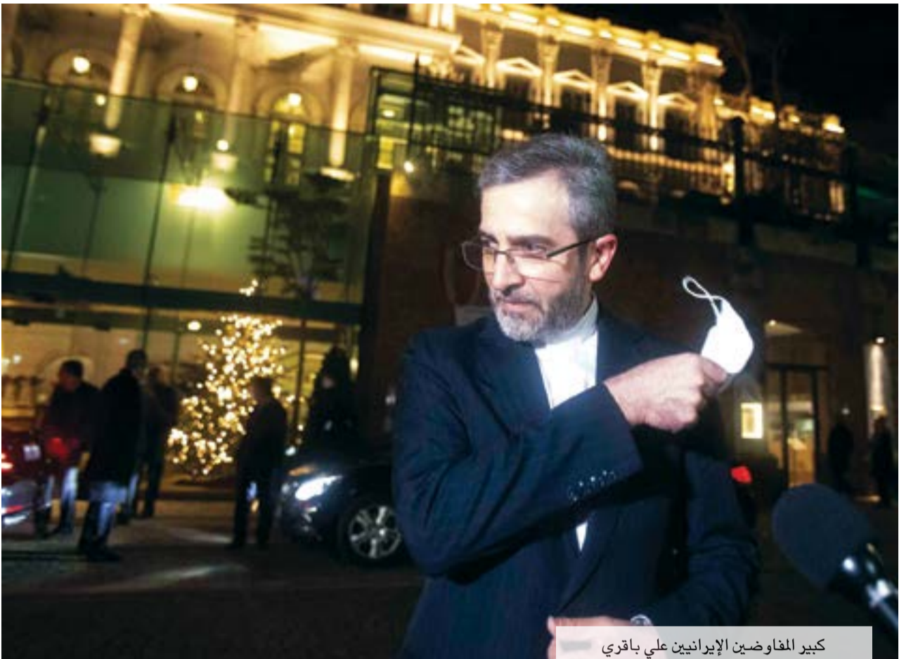
كبير المفاوضين الإيرانيين علي باقري

وزير الخارجية الإيراني أمير عبد اللهيان قال بوضوح في حوار هاتفي مع جوزيب بوريل مسؤول السياسة الخارجية للاتحاد الأوروبي قبيل استئناف المفاوضات أن الولايات المتحدة «ليست دولة محل ثقة» ولذلك من الضروري وجود ضمانات قانونية تضمن أي إدارة مقبلة من ارتكاب الفعل الذي ارتكبته