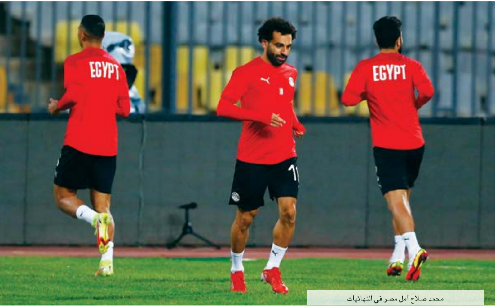
محمد صلاح أمل مصر في النهائيات

المجموعة الخامسة، لتفادي الاصطدام بالمرشح الأوفر حظا لحجز صدارة المجموعة الرابعة المنتخب الجزائري، ومنطقيا وحسابيا، يعد المنتخب المصري المنافس المحتمل لنيجيريا على صدارة المجموعة، إلا إذا أرادت كرة القدم أن يكون دور الـ16 شاهدا على ملحمة مصرية جزائرية جديدة، في حال انتهى المطاف بمحمد صلاح ورفاقه باحتلال المركز الثاني، وفي الجهة الأخرى حجز بلماضي وفريقه صدارة مجموعتهم، أو العكس بحصول الجزائر على وصافة المجموعة التي تضم معهم كوت ديفوار وسييراليون وغينيا الاستوائية. وكذلك يحتاج المنتخب المغربي الابتعاد بقدر الإمكان عن وصافة مجموعته الثالثة، لتفادي الدخول في حلبة برما مع البلد المستضيف الكامبيرون في الدور ثمن النهائي، أما إذا نجح في إزاحة منافسه المباشر غانا من صدارة المجموعة، فسوف ينتظر ثالث المجموعة الأولى التي تضم مع الكامبيرون وبوركينا فاسو كلا من إثيوبيا والراس الأخضر، أو ثالث المجموعة الثانية التي