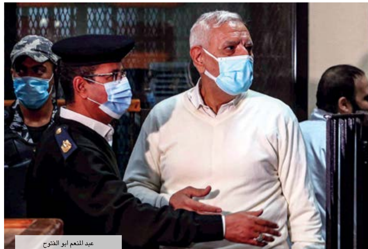
عبد المنعم أبو الفتوح

برقم حصر 1986 لسنة 2020 حصر أمن دولة عليا بتهمة إذاعة ونشر أخبار وبيانات كاذبة داخل وخارج البلاد.