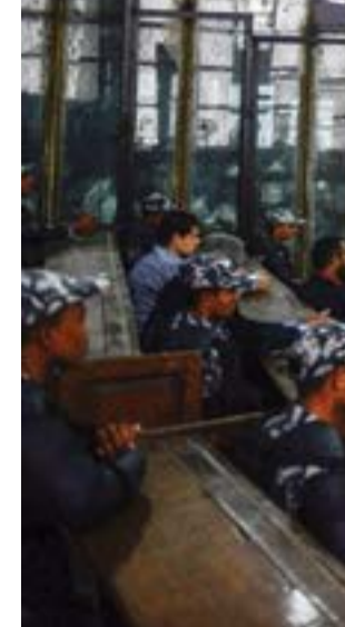
محاكمة مجموعة من الإخوان المسلمين

كما تناول التقرير «تعديل بعض أحكام قانون مكافحة الإرهاب الذي تضمن حظر تسجيل أو تصوير أو بث أو عرض أية وقائع من جلسات المحاكمة في الجرائم الإرهابية إلا بإذن من رئيس المحكمة المختصة، ولرئيس الجمهورية، متى قام خطر من أخطار الجرائم الإرهابية أو ترتب عليها كوارث بيئية، أن يصدر قراراً باتخاذ التدابير المناسبة للمحافظة على الأمن والنظام العام».