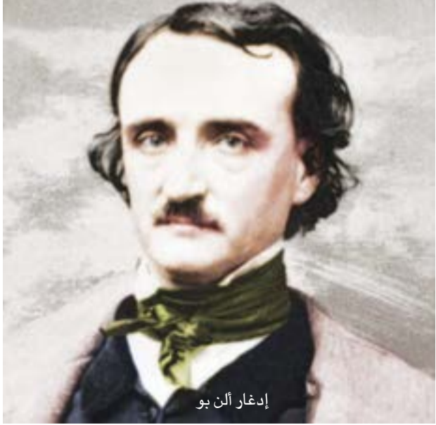
إدغار آلن بو

القصر في التحديد السابق ربما يعد مظهرا كاشفا عن شيء جوهرى يمثل مركز النوع أو بؤرته حيث يرتبط بالسباق الفكري أو المعرفي، ويمثل في الوجود الجزئي القائم على الانقطاع دون تاريخ مؤسس سابق، والقارئ لكي يستكمل هذا السباق الفكري أو المعرفي عليه أن يتجاوز هذا الانقطاع الجزئي. وقد أشار خوليو كورتيزار إلى فكرة قريبة من الفكرة السابقة في قوله: إن القصة القصيرة تشبه لقطة الكاميرا فهي تلتقط شظية من الكل أو لقطة، وتستخدمها للانفتاح صوتميا داخل الآداب القومية. ولكن التحديد الأهم الذي ربما يكون قريبا من تجسير نوع من المشروعية يتمثل في مجموعة المقاربات التي ترى القصة القصيرة مشدودة للحركة والثبات في آن، فهي تنتمي للسرد النثري بوصفه الوسيط، وتستخدم اللغة الاستعارية المشحونة دلاليا للإيحاء وعدم المباشرة. فالقصة القصيرة والانقطاع، ومحاولة الوصول في ظل هذه الجزئية غنائية في الجوهر، فهي تقدم رؤية