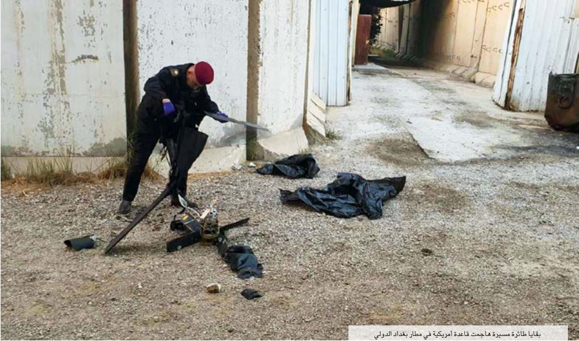
بقايا طائرة مسيرة هاجمت قاعدة أمريكية في مطار بغداد الدولي

مقتل القائد السابق لـ«طليق القدس» قاسم الحرس الثوري الإيراني، قاسم سليماني. وقد أعقب ذلك قيام التحالف بشن عدة ضربات جوية على مواقع إطلاق الصواريخ في سوريا، وقرب الحدود العراقية، تعود إلى الميليشيات التابعة لإيران، مع توقعات ان يمتد الرد الأمريكي إلى مواقع الفصائل الشيعية في العراق، إذا استمر قصف الفصائل. لكون الوجود الأمريكي يعد رسمياً وبموافقة الحكومة