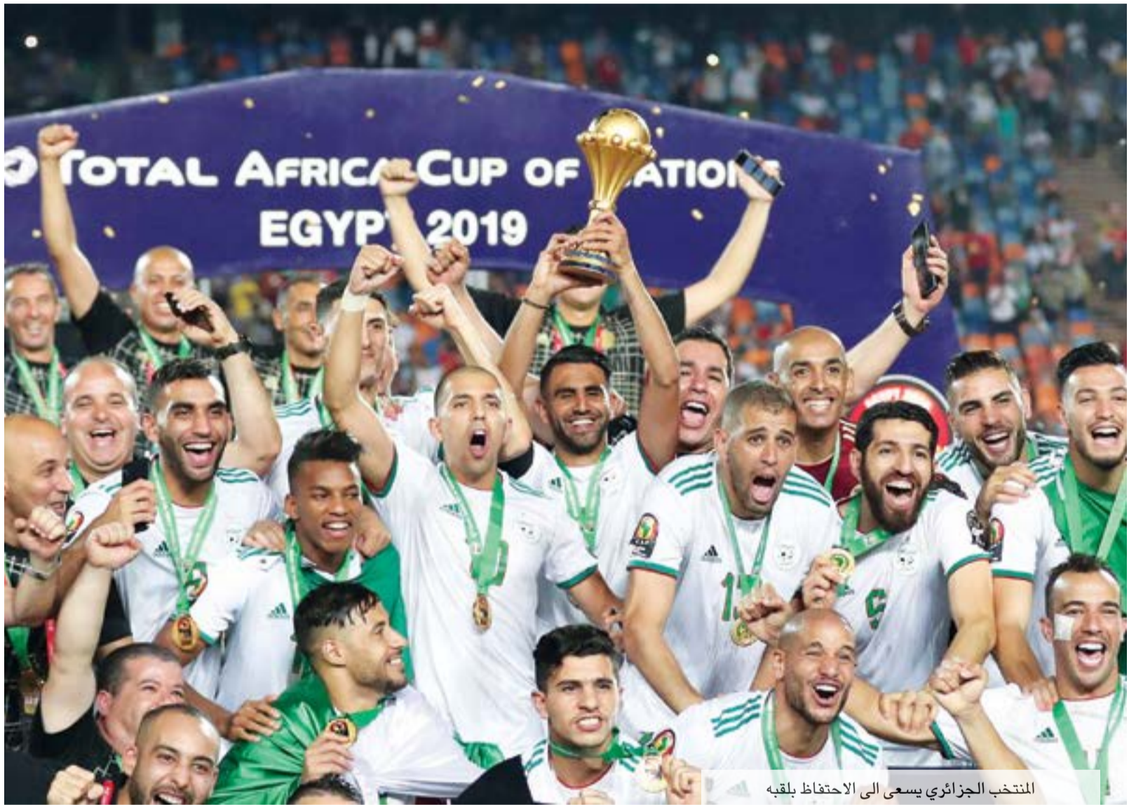
المنتخب الجزائري يسعى الى الاحتفاظ بلقبه

والسؤال الآن، هل يسير بلماضي على خطى نظيره المصري حسن شحاتة ويظفر بالكأس الثانية على التوالي؟ أم سيكون الكان شاهدا على توقف سلسلة اللاهزيمة للخضر؟ هذا ما سنعرفه في الأيام والأسابيع القليلة المقبلة.