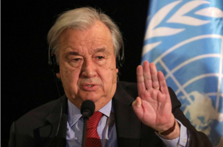
الأمين العام للأمم المتحدة أنطونيو غوتيريش

مليون دولار من هذا الصندوق لعمليات اليونيسيف وبرنامج الأغذية العالمي في البلاد». وأعرب عن أمله في أن «تصبح الموارد المتبقية - أكثر من 1.2 مليار دولار - متاحة لمساعدة الشعب الأفغاني على الصمود في فصل الشتاء»، وتجدد الولايات المتحدة 9.5 مليار دولار من احتياطي المصرف المركزي الأفغاني، أي ما يعادل نصف إجمالي الناتج المحلي لأفغانستان في العام 2020. والى الآن ترفض واشنطن تلبية مطالب الحركة الإسلامية بتحرير الأموال من أجل إنعاش اقتصاد أفغانستان ومكافحة المجاعة التي تتهدد حالياً، وفق الأمم المتحدة 23 مليون أفغان، أي 55 في المئة من سكان البلاد.