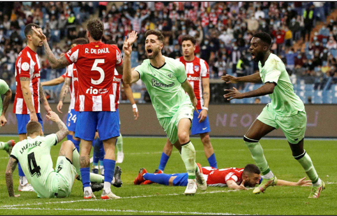
الغازيز (وسط) يحتفل بتسجيل هدف الفوز لبلباو في مرمى أتلتيكو