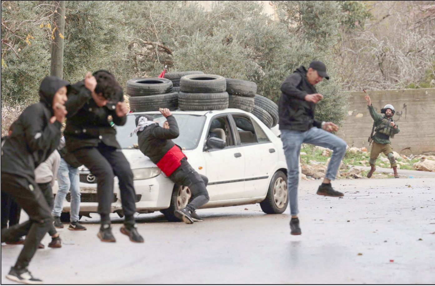
مواجهات بين قوات الاحتلال وفلسطينيين في الضفة