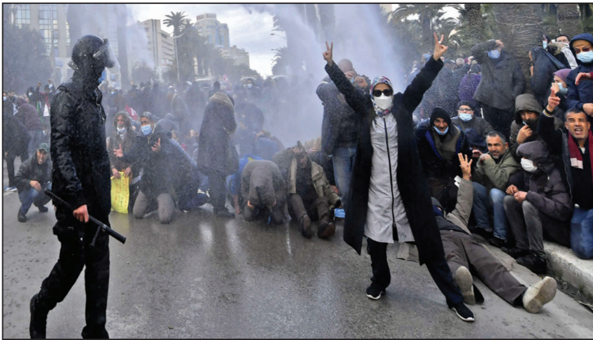
مظاهرة ترفع إشارة النصر فيما توجه الشرطة خراطيم المياه على المحتجين في العاصمة التونسية أمس

تظاهر آلاف التونسيين الجمعة، في العاصمة وعدد من المدن الأخرى للاحتفال بالذكرى الحادية عشرة للثورة والتذيد بتدابير الرئيس قيس سعيد، فيما دعا اتحاد الشغل، الرئيس سعيد، إلى «تصويب» خريطة الطريق التي وضعها الرئيس، في وقت طالب فيه مشرعون أمريكيون إدارة جو بايدن بتقييم مسار سعيد المناهض للديمقراطية.