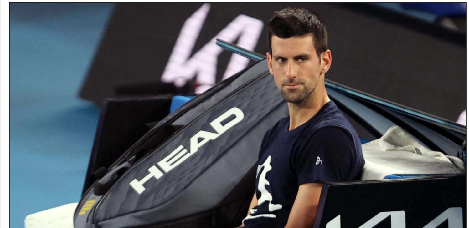
أزمة ديوكوفيتش طالت أكثر من المتوقع مع إلغاء تأشيرته مجدداً

في مقابلة الخميس: "لأستراليا سياسة تقضي بعدم السماح لتغير اللغتين بدخول البلاد، من غير المفهوم كيف وصلنا إلى هذه المرحلة". وأضاف: "كيف تمكن نونافك ديوكوفيتش من القدوم إلى هنا؟" ومع ارتفاع عدد حالات دخول المستشفيات في مليون، أعلنت ولاية فيكتوريا الخميس أنها ستحد من الطاقة الاستيعابية للملاعب بنسبة 70%. ويتعين على جماهير البطولة التي تنطلق الإثنين لتلقي اللقاح والحصول على إعفاء طبي.