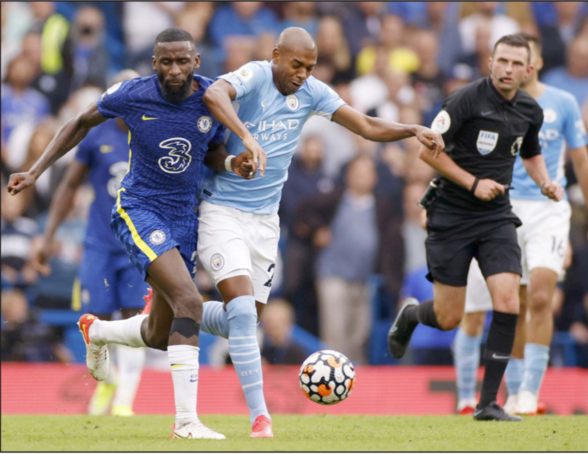
صراع مانشستر سيتي وتشلسي يتجدد اليوم في أبرز مباريات الجولة