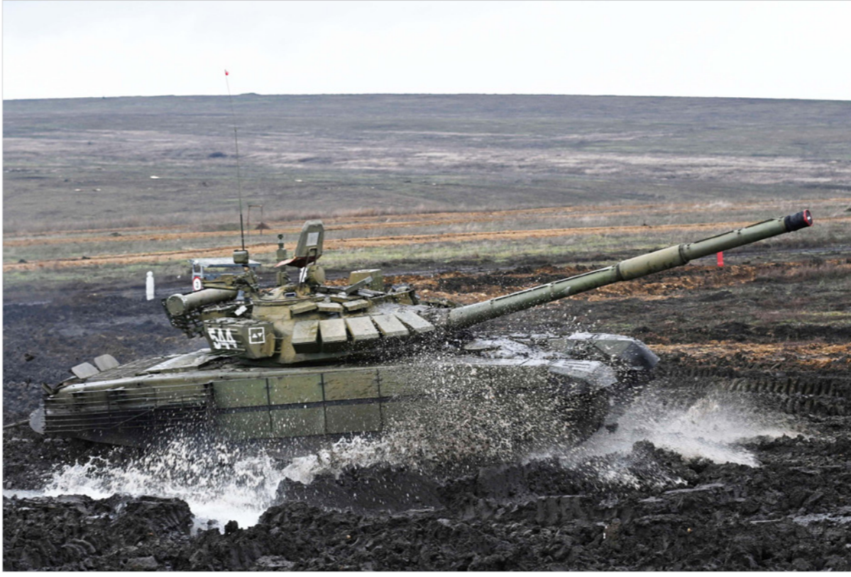
دبابة روسية خلال تدريبات عسكرية في منطقة دوستوف الشهر الماضي

وعلق وزير النمساوي الكسندر شالنبرغ: «إنه أمر مقلق جداً. إن هجوماً إلكترونياً قد تعقبه تحركات عسكرية»، وأضاف نظيره السويدية آن ليندي «إنه واحد من الأمور التي نخشاها»، وقالت: «يجب أن نكون حازمين جداً في ردنا على روسيا وأن نقول إنه إذا كانت هناك هجمات ضد أوكرانيا، فستكون قاسين جداً في ردنا». لكن الأوروبيين لا يزالون يراهنون على الحوار والدبلوماسية، إن قالت الوزيرة الألمانية آنالينا بيربوك إنها ستسوّز موسكو الأسيوع المقبل لإجراء محادثات على المستوى، وأضاف: «تتميز الدبلوماسية، خصوصاً في أوقات الأزمات، بعزيمة وصبر كبيرين وأعصاب قوية».