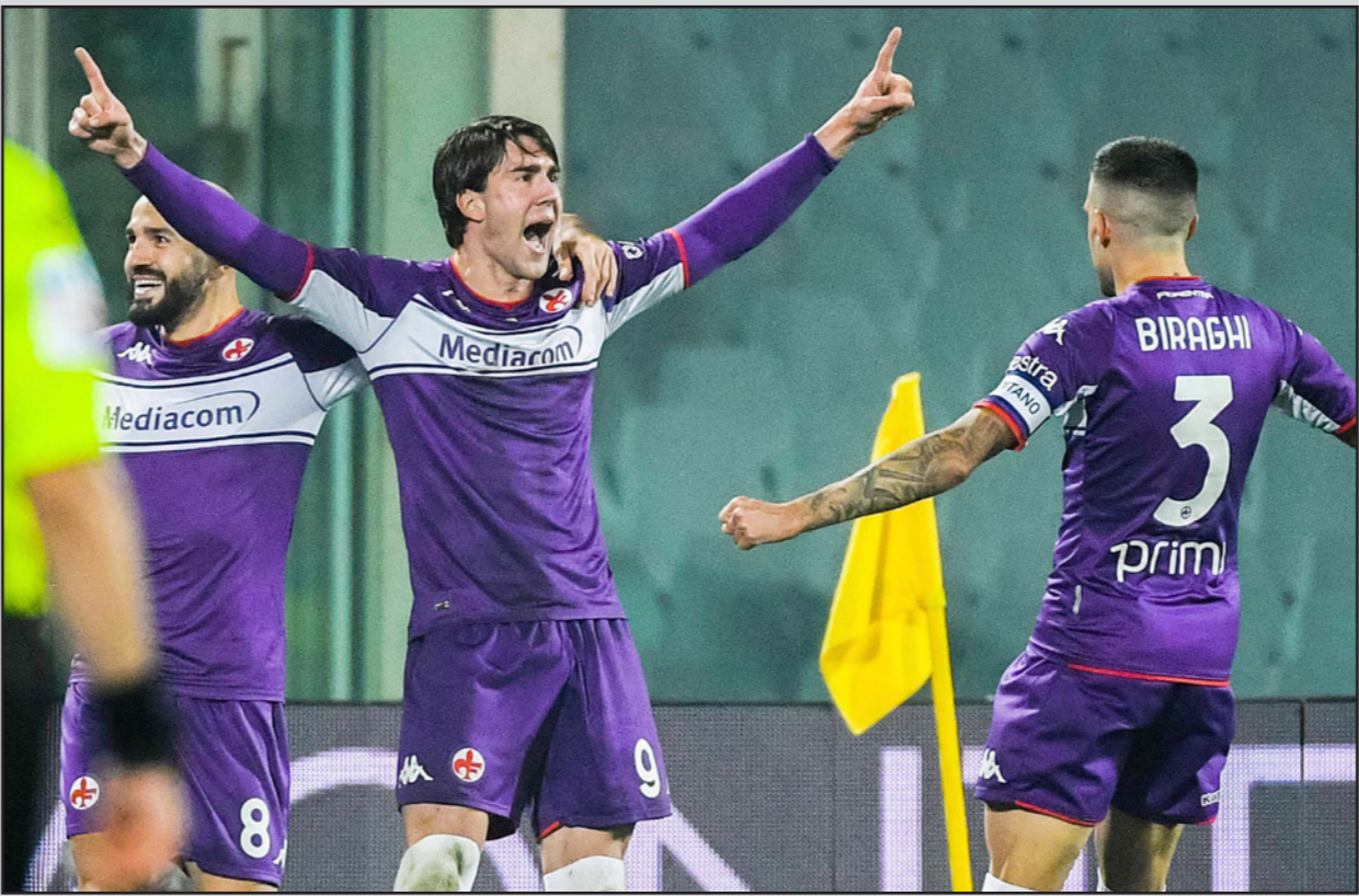
فلاهور فيتش (9) يحتفل بافتتاح التسجيل لفيورنتينا أمام نابولي