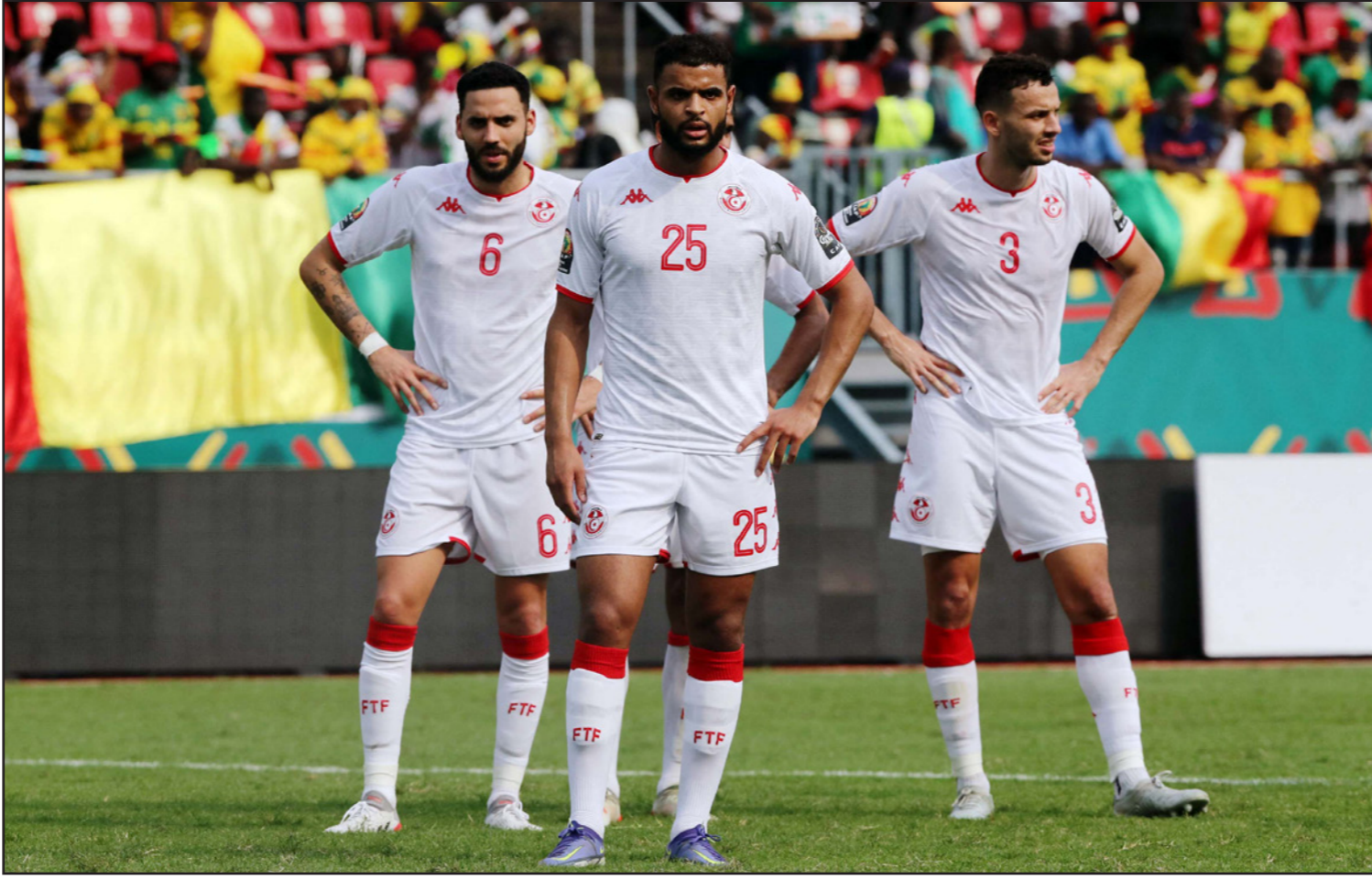
لاعب المنتخب التونسي في مازق بعد الأحداث الأخيرة