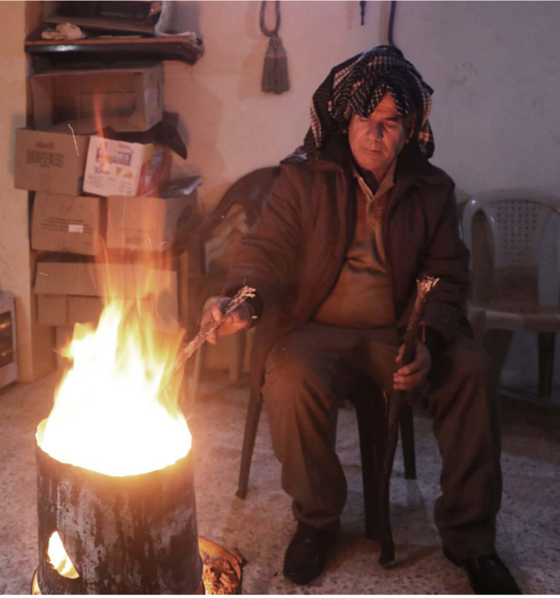
مواطن يشعل الحطب في مدفأة بدائية داخل منزله