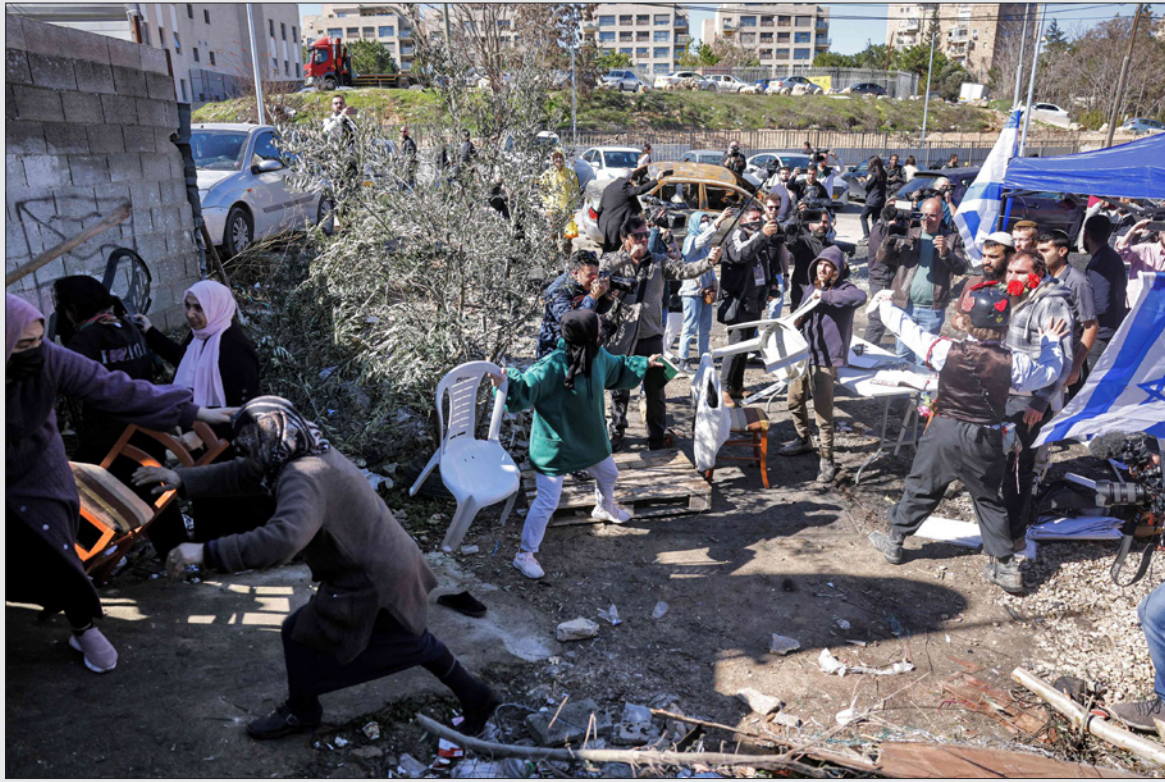
مستوطنون إسرائيليون يحاولون إخراج فلسطينيين من بيوتهم عنوة في حي الشيخ جراح في القدس الشرقية

وفي 2021 وصلت الهجمات التي قام بها المستوطنون على الفلسطينيين والعكس أعلى مستوى. منذ خمس سنوات على الأقل، وتسبب المستوطنون في جرح 170 فلسطينياً على الأقل وقتلوا خمسة، حسب تقارير الأمم المتحدة. وقال الجيش الإسرائيلي إن الفلسطينيين جرحوا 137 مستوطناً في الضفة الغربية العام الماضي. ويعلق كينغزلي بأن الأرقام وإن كانت متقاربة إلا أن دينامية القوة مختلفة. فالستوطنون يتنفعون من نظام قانوني يعمل على سيادة، حيث يرتكب فيه المستوطنون العنف دون أن يعاقب، أما الفلسطينيين المشتبه بهم فهم عرضة للاعتقال والمحكمة أمام المحاكم العسكرية. ومن بين 111 هجوماً رصدها منظمة حقوق