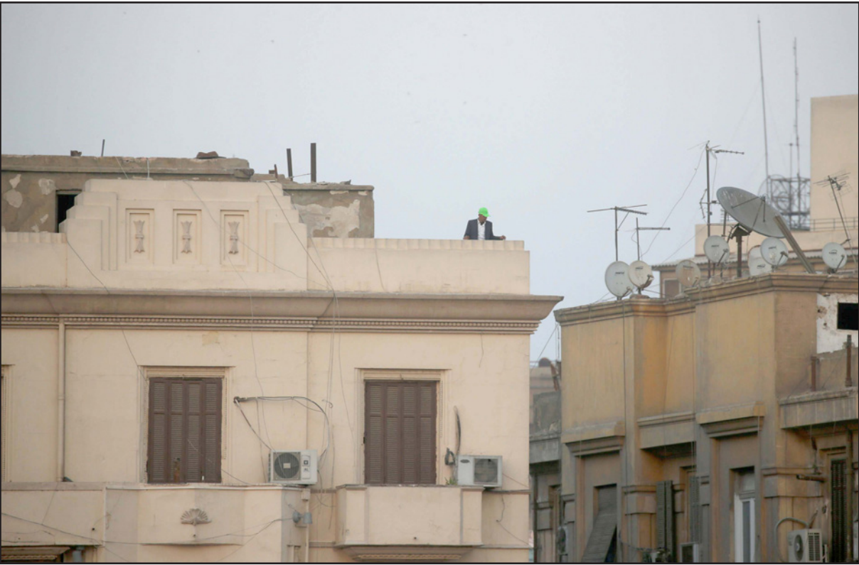
أبنية في ميدان الظاهر في القاهرة

التقدم بطلب لإخلائه، والمادة 22 الفقرة الثانية، إذ إن المستأجر استأجر أكثر من وحدة فهو مخير بأن يأخذ وحدة واحدة ويترك البقية». وأوضح أن «تعديل قانون الإيجار القديم فيه مظلومية خادعة للملاك، وسيطرة كاذبة للمستأجر، ويوجد 3 أمور هي عقد رجائي وهي عندما أريد عمل تعديل ليس من العدالة أن أقيم العلاقة في نهايتها ولكن يجب النظر في مجملها من القيمة الاقتصادية التي أخذها المُوَجَّر وتكلفتها المستأجر».