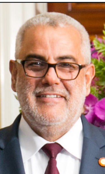
عبد الإله بن كيران

الشعبية الدستورية (يعود تأسيسه إلى 1967) مؤتمراً استثنائياً، دشنه بالتحاق عدد من أطر حركة التوحيد والإصلاح (الإسلامية). وعقد الحزب مجلساً وطنياً عام 1998، تميز بتغيير اسمه إلى حزب العدالة والتنمية.