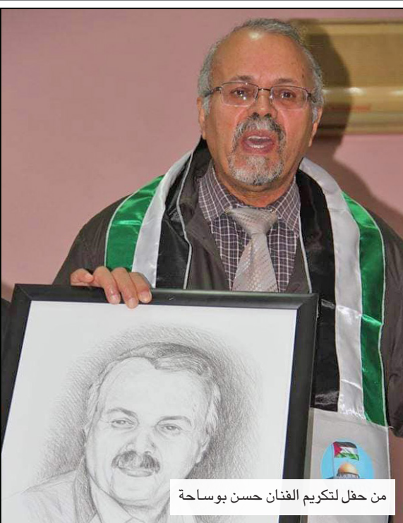
من حفل لتكريم الفنان حسن بوساحة

«المنوية» التي تتضمن أربعة عناصر جد مهمة في بنية العملية التشكيلية لديه، أولها الطفولة باعتبارها العقوبة التي تنتج الحالة الفنية مرتبطة بالخيال في توليده للأشكال والأفكار، وفي حضوره المبات، يتمثل العنصر الثاني في النار الباعثة لتلك «الذبول الأنوية» المتصاعدة والثنوية في حركتها، وهو ما يشكل حجر الأساس في تجربة الفنان التشكيلية، باعتبارها الخيط، هو ما استرجع منه شكل «الحيمين» في مساره نحو هدف معين، «العائلة». أما العنصر الثالث وهو «التلاشي» فالذبول الناري المتصاعد في الفضاء يؤول إلى التلاشي، وهو ما يمثل العنصر في العملية التشكيلية، إذ مهما حدد الفنان عناصرها في تجربته، تبقى هناك زوايا غامضة لا يمكن وعيها، لأن الإلهام يسطع منهية ثم يتلاشى ليظهر في لحظة أخرى بشكل آخر في صورة لا يمكن تغير الفنان/البدع أن يحتر عليها. العنصر الرابع يتمثل في النائرة، تلك الكينونة التي تحفظ بأدق التفاصيل، حتى إذا توقفت مع ركيزة من ركائز الشخصية ذات الأثر والفعل أنتجت أثرها لتوفر الحلم والخروج التاريخي الشخصي الداعم والقدرة على جسر الخيال إلى دوائر الواقع.