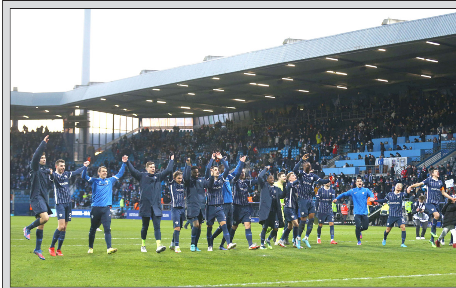
لاعب إداريو بوخوم يحتفلون بالفوز التاريخي على بايرن ميونخ

أمام كليرون-فيرون صفر-1 في المرحلة السابقة بعد سلسلة من انتصارات توالياً، وفضل لاعبو نيس في استغلال المعنويات العالية عقب تاهله إلى نصف نهائي الكأس المحلية للمرة الأولى منذ 11 عاماً، يفوزهم على مارسيليا بالذات 4-1، وتدخلت تقنية "الفار" بعد 5 دقائق من صافرة البداية لاحتساب لسة يد على المهاجم جاستن كلافرت بطل الفوز على مارسيليا بالكاس بتسجيله هدفين، فاندري ليا موسى دمبيلي إلا أن الحارس والتر بنيتيز ارتدى إلى الجهة المتناحية وصدى للكرة، تابعها لوكاس بايكيتا بقدمه اليسرى في الشباك. لكن مع العودة إلى "الفار" مجدداً، تبين أن البرازيلي لم يكن في موقع قانوني، لتسدد الكرة من جديد ولكن بدون أن يقبل دمبيلي في محاولته الثانية (7)، مسجلاً هدفه الثامن هذا الموسم، وفي الشوط الثاني، استحوذ ليون على الكرة بنسبة 62%، وسجل