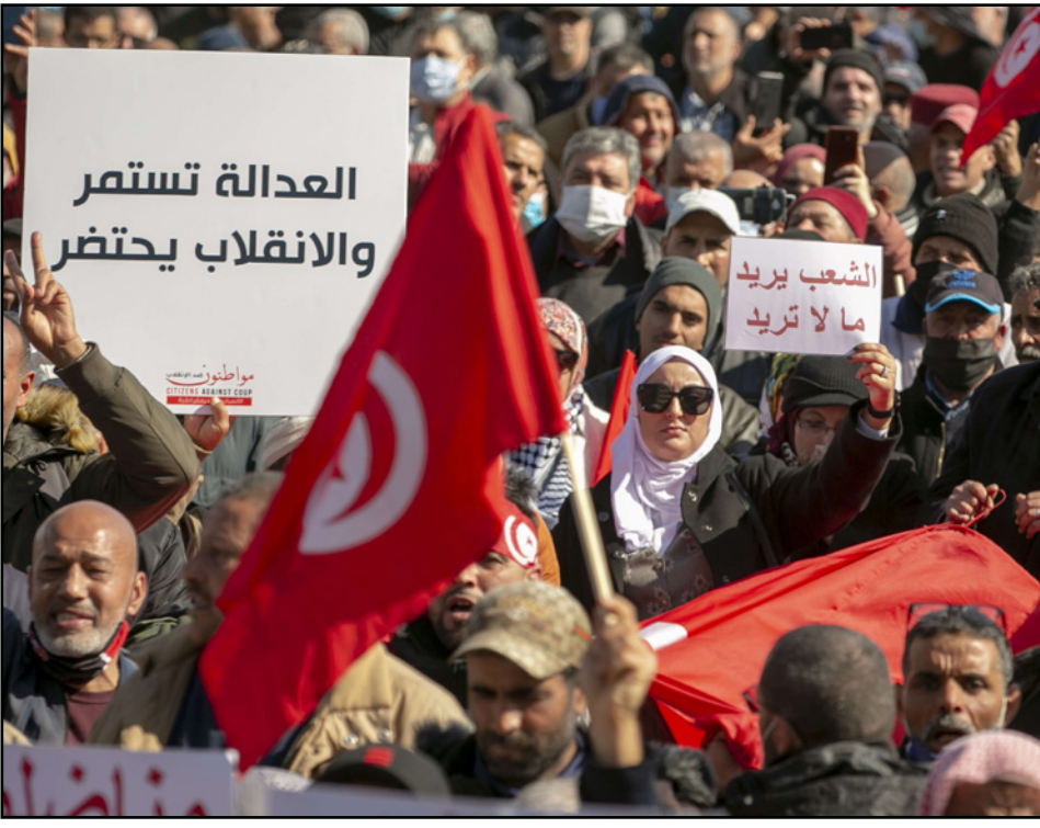
الآلاف يشاركون في وقفة احتجاجية مساندة لاستقلال القضاء في العاصمة تونس أمس

المحى واستمرار فيه بما يهدد بخراب العمران". وكانت حركة النهضة دعت السلطات التونسية لحماية الغنوشي، التي قالت إنه يتعرض من بعض قيادات الحركة تحريز واسعة من قبل مناصري الرئيس قيس سعيد، محملة بسبب وزير الداخلية توفيق شرف الدين المسؤولية عن سلامته.