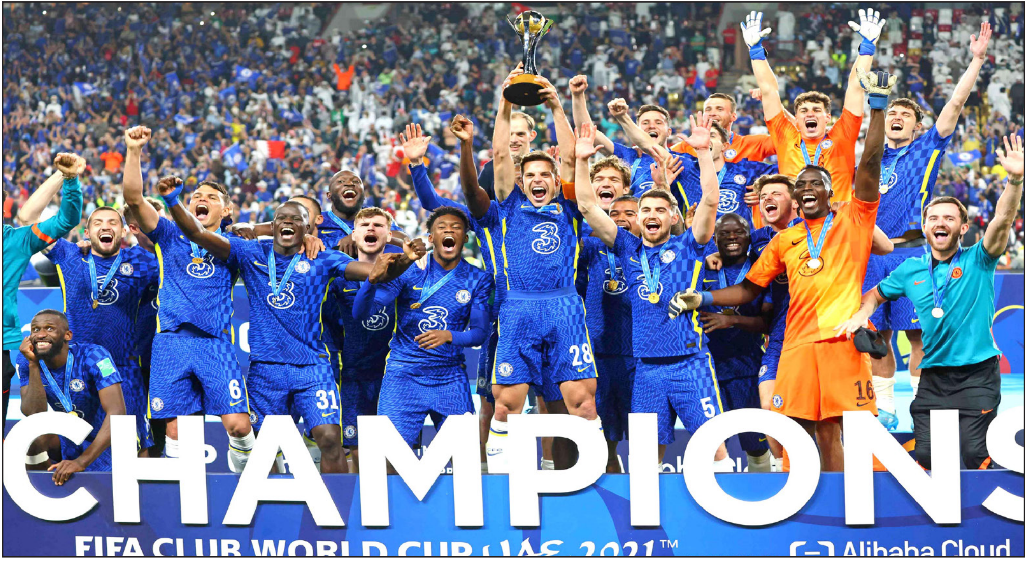
لاعبو واداريو تشلسي يحتفلون بلقبهم الأول أبداً للعالم

يفرتون، ولم يشهد الشوط الأول الشيء الكثير إلى درجة أن حذشه الأيرز كان خروج مايسون ماونت مصاباً ودخول الأمريكي كريستيان بوليسيتش مكانه (31). وتغير الحال في الشوط الثاني الذي جاء أكثر ندبة، حيث افتتح لوكاكو التسجيل براسية قوية إثر ضربة من كالوم هودسون أودوي (55)، ليُسجل هدفه الثاني في البطولة بعدما كان صاحب الهدف الوحيد في مباراة الهلال، ولم يتأخر بالميراس في ادراك التعادل بعدما تطاول تياغو سيلفا مدافع تشلسي لكرة عرضية بيده ليحتسب الحكم ركلة جزاء بعد العودة إلى "الفاز"، سدددها فيجناح (64)، وقام المدرب بتبديلات عدة كان أبرزها خروج الكيكي على الهلال السعودي بطل آسيا 4-صفر والتي أكملها الأخير بتسعة لاعبين منذ الدقيقة 28، وسجل ياسر إبراهيم (8 و17) وأحمد عبد القادر (40) وعمرو السويدي (64) أهداف الأهلي. وسبق لبطل إفريقيا أن نال المركز الثالث العام في نسخة الماضية، فيما احتل الهلال المركز الرابع للمرة الثانية بعد 2019 عندما خسر أمام مونتيري المكسيكي بركلات الترجيح.