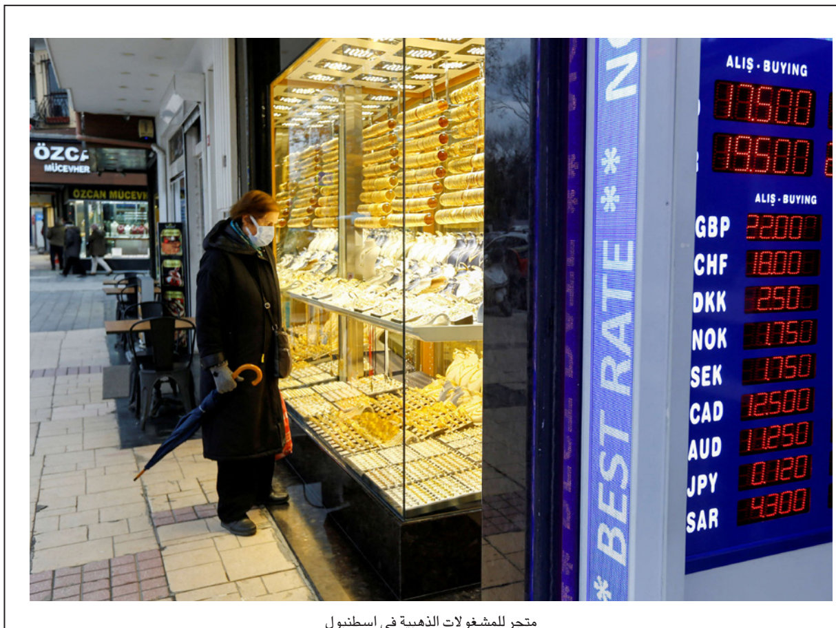
متجر للمشغولات الذهبية في استنبول

الرامية لمواجهة التضخم في البلاد في إطار «النموذج الاقتصادي التركي» الذي أطلقه أردوغان. وقال إن بلاده ستبدأ بنظام جديد «لتشجيع الاستفادة من الذهب المخيا تحت الوسائد» لدى المواطنين في دعم الاقتصاد الوطني. وأوضح أن الحكومة ستبدأ اعتباراً من مطلع الشهر المقبل بالتعاون مع 1500 صانع ذهب، بحيث يكون هناك مركز واحد على الأقل في كل ولاية. وأضاف أن المواطنين سيتمكنون من خلال الآلية الجديدة إدخال مداخلاتهم الذهبية بشكل سهل في النظام الاقتصادي من خلال الصائغين والبنوك المتعاقدة المعنية. وأشار إلى أن الآلية تتيح للمواطنين حماية قيمة مداخلاتهم الذهبية من خلال فتح حساب إيداع لتحويل الذهب وحساب تشاركي باليرة التركية.