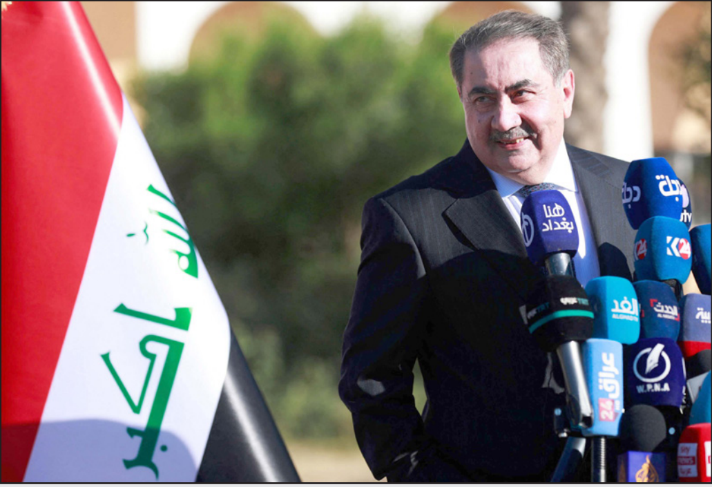
زبياري خلال مؤتمره الصحافي أمس

خرج تشكيلات الدولة ودمجها بالحشد الشعبي، مع الأخذ بالاعتبار ضرورة ضبط وتنظيم الحشد وتطهيره من العناصر غير المنضبطة وحصر السلاح بيد الدولة».