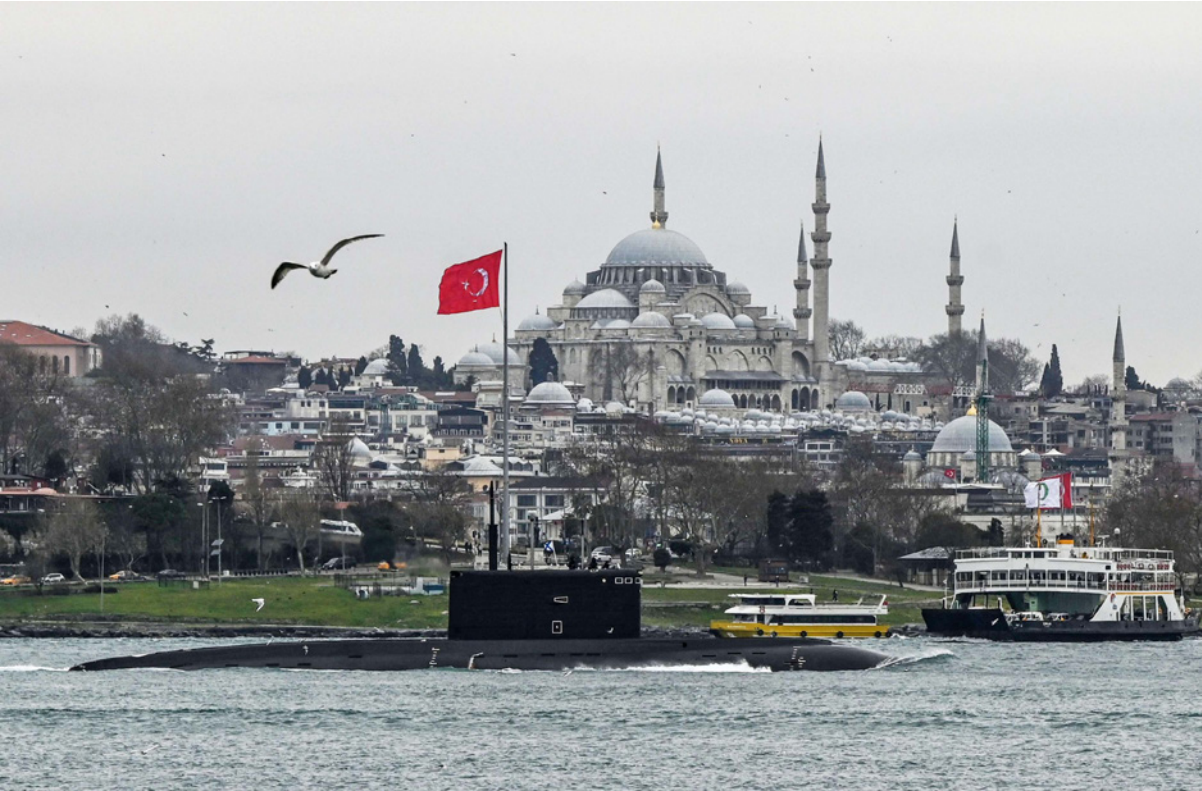
غواصة تابعة للبحرية الروسية في طريقها إلى البحر الأسود مروراً بمدينة إسطنبول

بنفس مستوى مغادرة السفارات»، واستعداداً لاحتمال نشوب حرب، قال وزير الداخلية البولندي، ماريوس كامنسكي، أمس الأحد، إن بلاده تستعد «لسيناريوهات متنوعة»، لتدقق محتمل للاجئين. وقال كامنسكي على تويتر: «فيما يتصل بالوضع في أوكرانيا فإننا نستعد لسيناريوهات متنوعة. أحدها استعدادات إقليمية ترتبط بتدفق محتمل للاجئين من أوكرانيا».