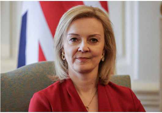
وزيرة الخارجية البريطانية ليز تراس

قطط، بل وعلى المستشار الألماني أولاف شولتس الذي يقف خسارة خط الغاز من روسيا، لكنه انتقد كما الاتحاد الأوروبي، ولو وضعنا «موضحة القلب» جانباً فإن معظم الهجمات مسبوبة وتهدف لإرضاء أمريكا. فمن خلال الخلط بين الحق والتكبير السبق، فإن هذه المياه العكرة تظهر على ما يبدو الرئيس الأمريكي جو بايدن قلقاً وأن بريطانيا ستظل الصيدى المخلص لواشنطن مهما قرر هؤلاء الحلفاء الأوروبيون الجبناء، وحتى في وقت تعرق فيه واشنطن في ضجة طبول الحرب التي أطلقتها.