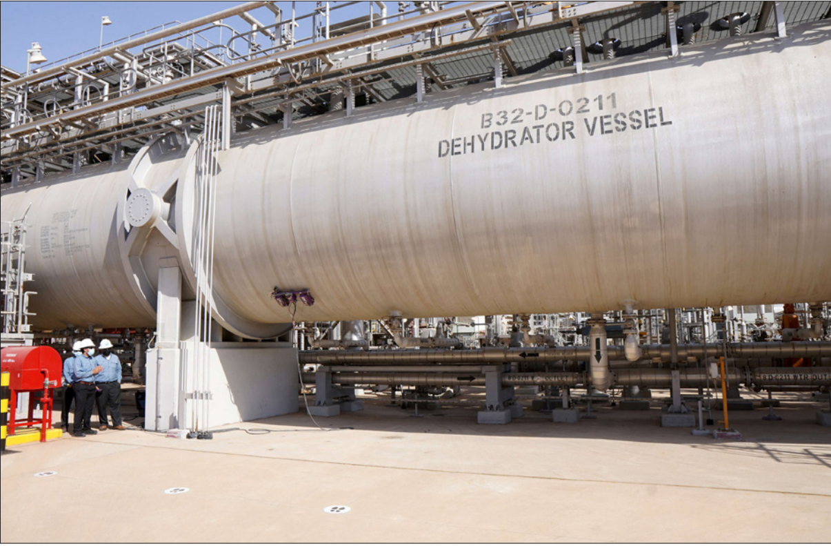
جانب من إحدى منشآت حقل خريص النفطي السعودي

بالفترة نفسها العام السابق، متجاوزة بذلك أرباح الفترة ذاتها قبل حلول الجائحة، على وقع ارتفاع أسعار النفط وزيادة مبيعاتها مع انتعاش الطلب العالمي على الطاقة. وقالت الشركة في بيان على موقعها الإلكتروني إن صافي دخل أرامكو السعودية بلغ 114.1 مليار ريال سعودي (30.4 مليار دولار) في الربع الثالث من العام الجاري مقارنة بـ 44.2 مليار ريال سعودي (11.8 مليار دولار) في الربع الثالث من 2020. وكانت الشركة حققت أرباحاً صافية في الربع الثالث لعام 2019 قبل تفشي الجائحة بلغت 21.3 مليار دولار (الدولار يساوي 3.75 ريال سعودي).