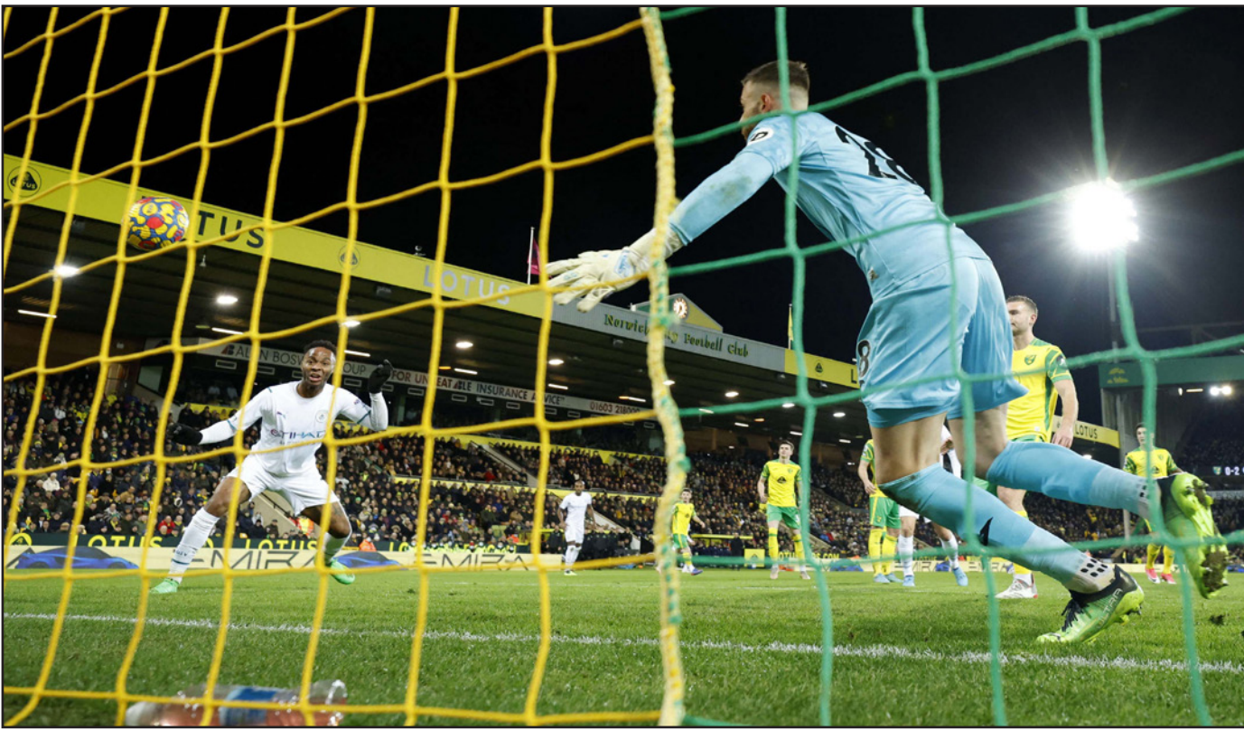
ستيرلنغ (يسار) يسجل الهدف الثالث للسيتي في مرمى نوريتش

الأولى في الدوري مع مدرب ونجم تشلسي السابق ضد نيوكاسل 1-3. ورفع رصيده إلى 22 نقطة في المركز السادس عشر بفارق 4 نقاط أمام نوريتش الثامن عشر ونقطة خلف ليدز الخامس عشر الذي مُني بهزيمته العاشرة.