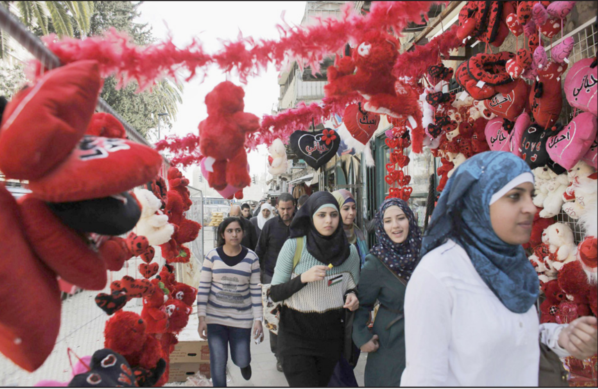
فلسطينيات في أحد الأسواق في القدس للاحتفالات بعيد الحب (فالتاين)

الذي نريده»، وتشعر أنها مدينة لصديقتها التي توفيت بالسرطان، وهي تعتبر أطروحة الماجستير الخاصة بها رسالة لها خصيصاً، «أنا مدينة لرسالتها في المقاطعة وتفضيل المنتج الفلسطيني في أصعب الظروف. أنا أعمل على بحني اليوم من وحي صديقي». وقبل أن تنتهي الحديث معها تقول إنه من المحتل جدا أن تكون باقات الورد التي توضع على قبر الرئيس الراحل ياسر عرفات من ورد المستوطنات، إنها مفارقة مؤلمة تشب يناضل ضد هذه المستوطنات ويخسر خيرة أبنائه في سبيل ذلك. وتقول: «صحيح أن أغلب الناس تفعل ذلك عن جهل ومن دون قصد، والسبب هو غياب المعلومات التي تجعلنا قادرين على اتخاذ القرار والوعي بكل ما نفعه». وتختم إباء زيتاوي: «كثير حلو تكون رونمسيين بالفالتاينين، بس كيف يمكن لورد الاحتلال أن يكون رونمسيا؟».