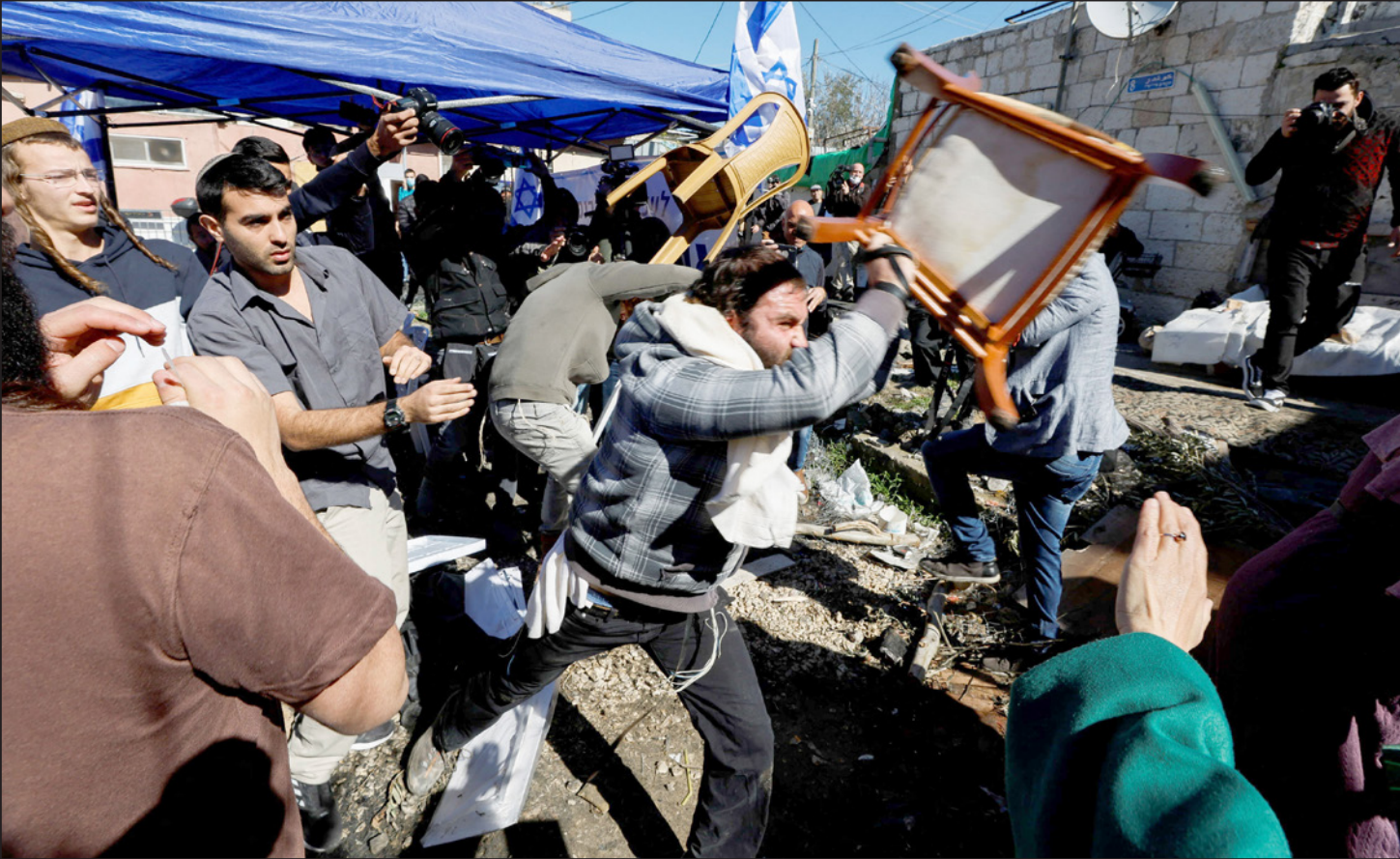
مستوطنون يعتدون على أهالي الشيخ جراح

التهودي في المدينة المقدسة لتكريس ضمها لدولة الاحتلال وفصلها تماما عن محيطها الفلسطيني، بما يؤدي إلى قطع الطريق نهائيا أمام الحلول السياسية للصراع، وحسم مستقبل المدينة من جانب واحد وبقوة الاحتلال. وحذر رئيس دائرة شؤون القدس في منظمة التحرير عدنان الحسيني، من خطورة مخطط عضو الكنيست المتطرف بن غير باعادة فتح مكتب له في حي الشيخ جراح، مؤكدا أن ذلك سيفشل بفعل صوت أهل القدس وأهالي الحي. وأضاف الحسيني أن الاحتلال يقوم بتزوير الأوراق في حي الشيخ جراح، تمهيدا لإخلاء الحي من المواطنين وإحلال المستوطنين مكانهم.