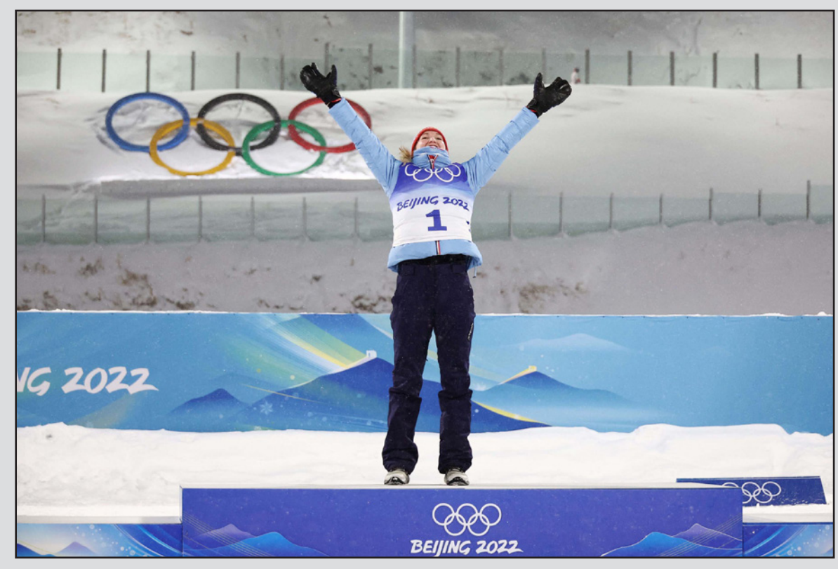
النرويجية رويزيلاند تحتفل بذهبيتها الثالثة في الأولمبياد الشتوية

ويعد يومين من تتويجها في سباق السرعة (سبرينت) وأسرع من فوزها في التتابع المخطط، أضافت رويزيلاند اللقب الأولي الثالث عندما أحرزت المركز الأول في سباق المطاردة (10 كلم) في مسابقة البياتلون برمن 34:46.9 دقيقة، وابتعدت رويزيلاند المسابقة التي تتضمن الرماية وتزلج المسافات الطويلة، بفارق حوالي ثلاثين ثانية عن مطاردها الأولى السويدية الفيسرا أوبيرج في بداية السباق وأنهته بفارق أكثر من دقيقة ونصف، فيما عادت البرونزية لموطنها تيريل إيكهوف. وبعدما أصابت أهدافها الخمسة الأخيرة، تركت رويزيلاند ميدان الرماية ممتسمة لتلكها من ضمان الفوز بذهبية ذهبية أخرى في الصين، في حين أن منافساتها لم يكن بدان مسابقة الرماية، وهي المرة الرابعة التي تصعد فيها رويزيلاند على منصات التتويج في بكين بعد برونزية الفردى (15 كلم)، وبياتن قريبة من تحقيق غراند سلام رائع لأنها لا تزال تنافس على لقبى التتابع (6 مرات كشم الأربعة والانطلاق الجماعي 12% كلم) السبت، وسبق لرويزيلاند، الرياضية الأكثر تتويجا وفوزاً بالدياليات في مسابقة البياتلون في دورة أولمبية واحدة، أن حققت الغراند سلام في مونديال 2020 في أنترسيلفا (إيطاليا) حيث نسبت سبع دياليات من أصل سبع ممكنة بينها خمس ذهبيات (السبرينت، الانطلاق الجماعي، التتابع، التتابع المخطط، التتابع الفردي).