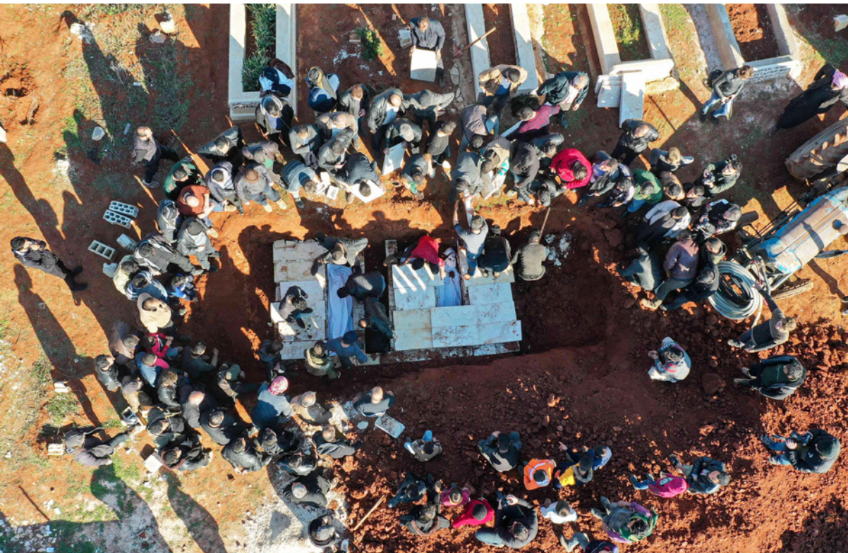
مشهد جوي لدفن جثث ضحايا قصفوا بقصف النظام لقرية معارة النعسان في محافظة إدلب

وقتل أمس، رجل وأصبحت زوجته بانفجار لغم من مخلفات الحرب في بلدة نفتنزان، ليلقي خطر مخلفات الحرب والذخائر غير المنفجرة كالبوس آخر يهدد حياة المدنيين، واستجاب الدفاع البوس السوري منذ بداية العام الحالي لأكثر من 84 هجوماً جويًا ومدفعية وأدت تلك الهجمات لمقتل 31 شخصاً، وإصابة 73 شخصاً آخر. وتتصاعد المشاوش من تكثيف قوات النظام وروسيا وحلفائهم مجاهدين على المدنيين في شمال غربي سوريا مستغلين الأوضاع الدولية الحالية ووجود بؤر صراع أخرى، يستعمروا في سياسة القتل والتهجير بدعم روسي.