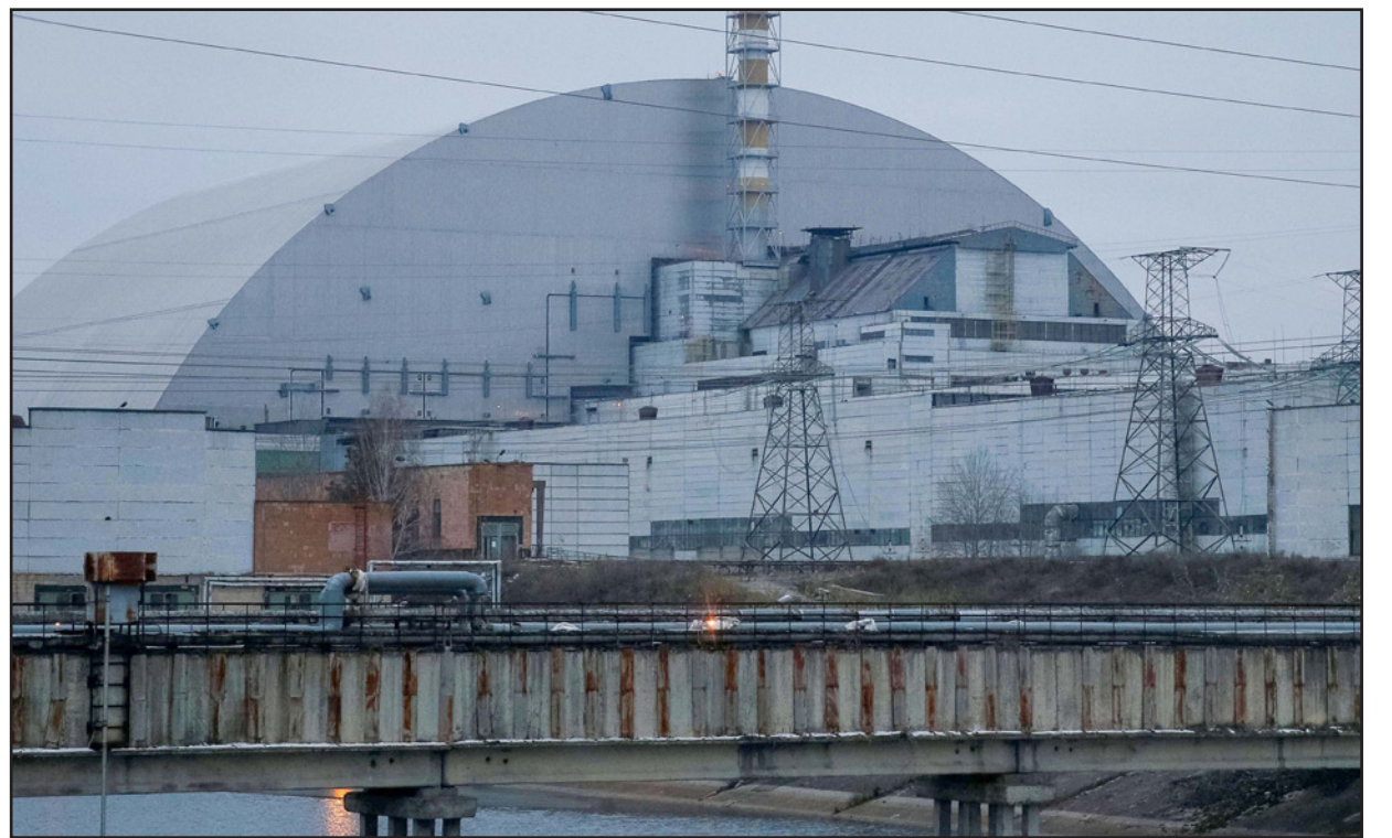
أرضية لحظة تشرنوبيل النووية في أوكرانيا قبل ان يستولي عليها الجيش الروسي

وكتب وزير الخارجية الأوكراني، ديميترو كوليبا، على «تويتر» أن «مولدات الديزل الاحتياطية لديها قدرة 48 ساعة لتشغيل» المنشأة لكنه أضاف بأنه «يعد ذلك ستوقف أنظمة تبريد منشأة تخزين الوقود النووي