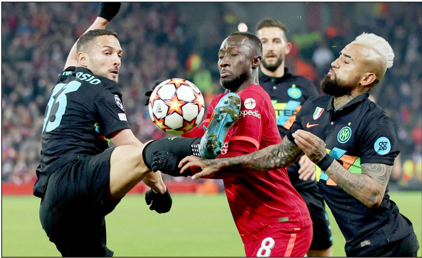
لاعب ليفربول كيتا (8) محاصرًا بلاعبي الاثنتان

في البداية ولكننا حافظنا على الكرة بشكل أفضل في الشوط الثاني. ومع اشهار البطاقة الحمراء انتهت الأمور. وأكد أن "الأهم كان التأهل، على أمل أن تكون المباراة القادمة أفضل". متحدثًا عن الفرص التي أهدرها وأصابتها للقائم مرتين وربما في المباراة القادمة كأساس ثلاثية.