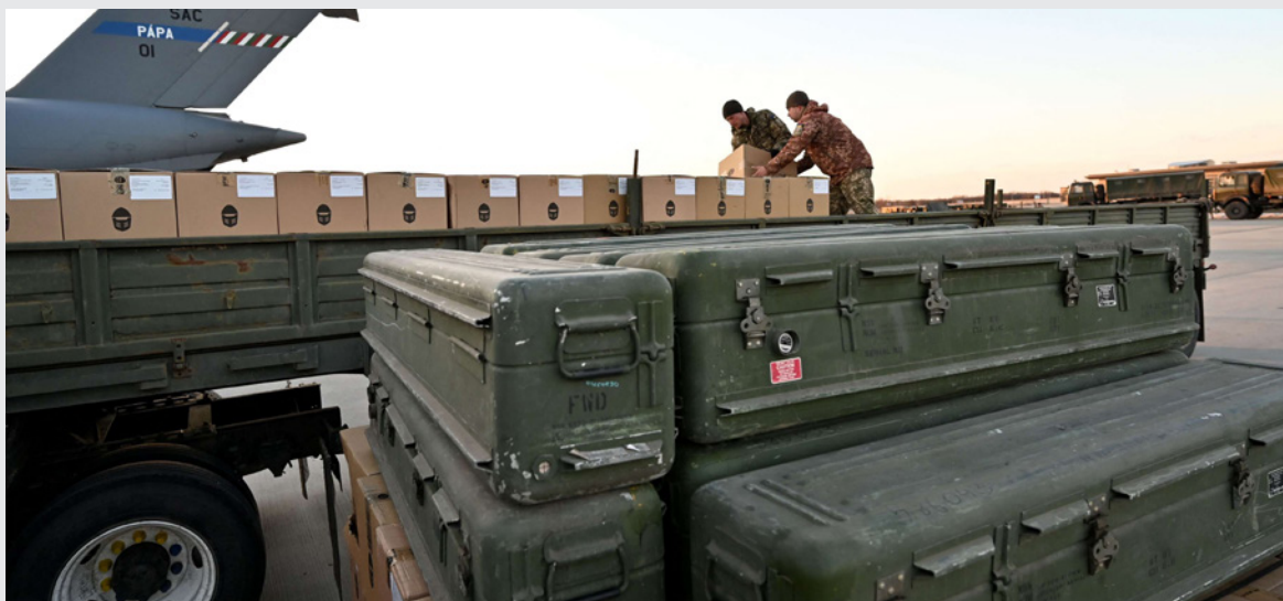
جنود أوكران يقومون بتحميل شاحنة مزودة بصناديق صواريخ «ستينغر» (أرشيفية)

تصل مخزونات الجيش الأمريكي من صواريخ «ستينغر» إلى أوكرانيا إلا في أواخر شباط/فبراير، بعد وقت قصير من الغزو الروسي.