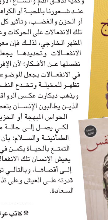
* كاتب عراقي