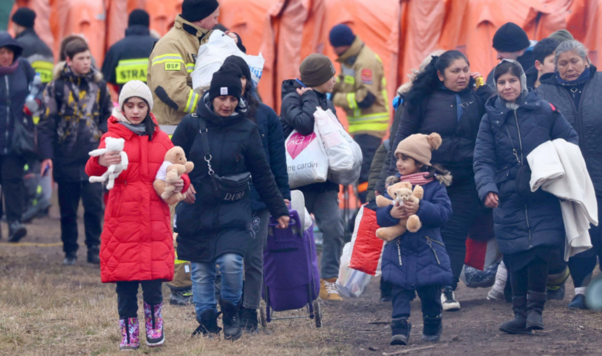
لاجئون أوكرانيون في بولندا

وفي رومانيا، افتتحت السلطات في بوخارست مركزين لاستقبال الأطفال الأوكرانيين، حيث يمكنهم اللعب وممارسة لاجئون أوكرانيون في بولندا