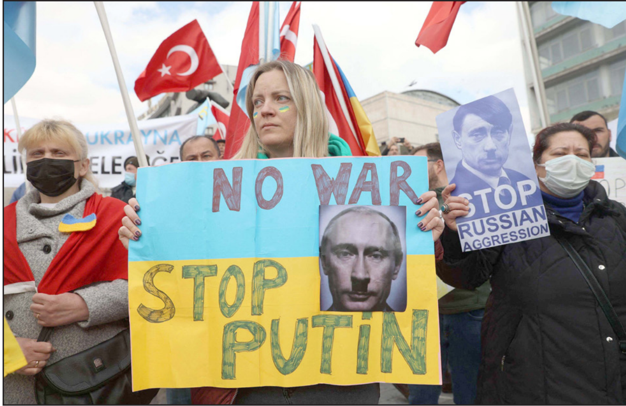
من المظاهرات التي خرجت في اسطنبول ضد غزو أوكرانيا