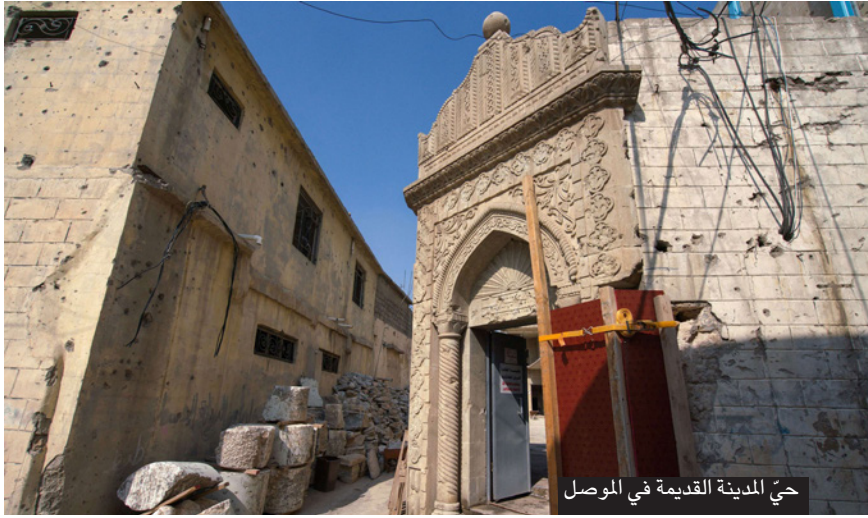
حي المدينة القديمة في الموصل

لاختيار الطماطم والفاصولياء الخضراء من عند بائع خضار، على بعد امتار قليلة من عمال يعملون على خط الإنتاج.