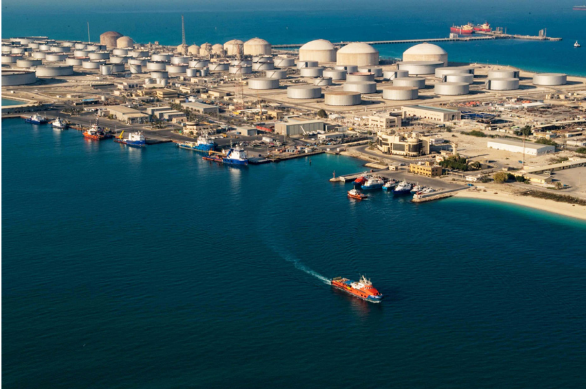
خزانات النفط والغاز في منشأة تابعة لشركة «أرامكو» في الظهران في شرق السعودية

■ لندن – رويترز: تراجعت أسعار النفط صوب 125 دولاراً للبرميل في تعاملات مضطربة أمس الأربعاء، في حين يُقِيم المستثمرون أثر الحظر الأمريكي لواردات النفط الروسية وإعلان روسيا وقف إطلاق نار جديد في أوكرانيا للسماح لمندوبين بالخروج من البلاد.