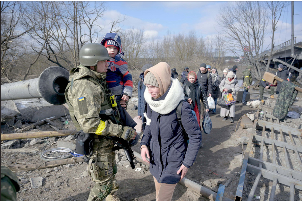
من عمليات الإجلاء في أوكرانيا