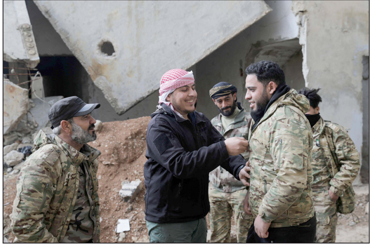
مقاتلون في المعارضة السورية وخلفهم الدمار في مدينة ادلب