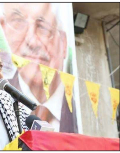
عضو اللجنة السياسية لمنظمة التحرير الفلسطينية أسامة القواسمي (فيديو)

ولمحا يرى البعض في هجمات 11 سبتمبر/ أيلول التي عملت على توجيه ضربة قوية للنضال الفلسطيني يرى محللون أن هذه الحرب