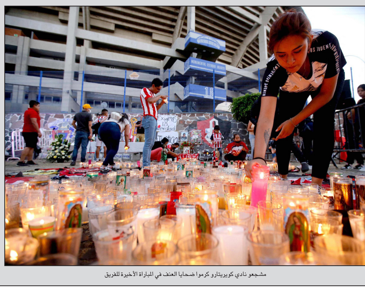
مشعو نادي كويريتارو كرموا ضحايا العنف في المباراة الأخيرة للفريق