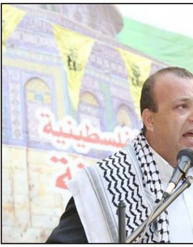
عضو اللجنة السياسية لمنظمة التحرير الفلسطينية أسامة القواسمي (فيديو)

ويؤكد في مقال له نشره في المركز الفلسطيني لأبحاث السياسات والدراسات الاستراتيجية