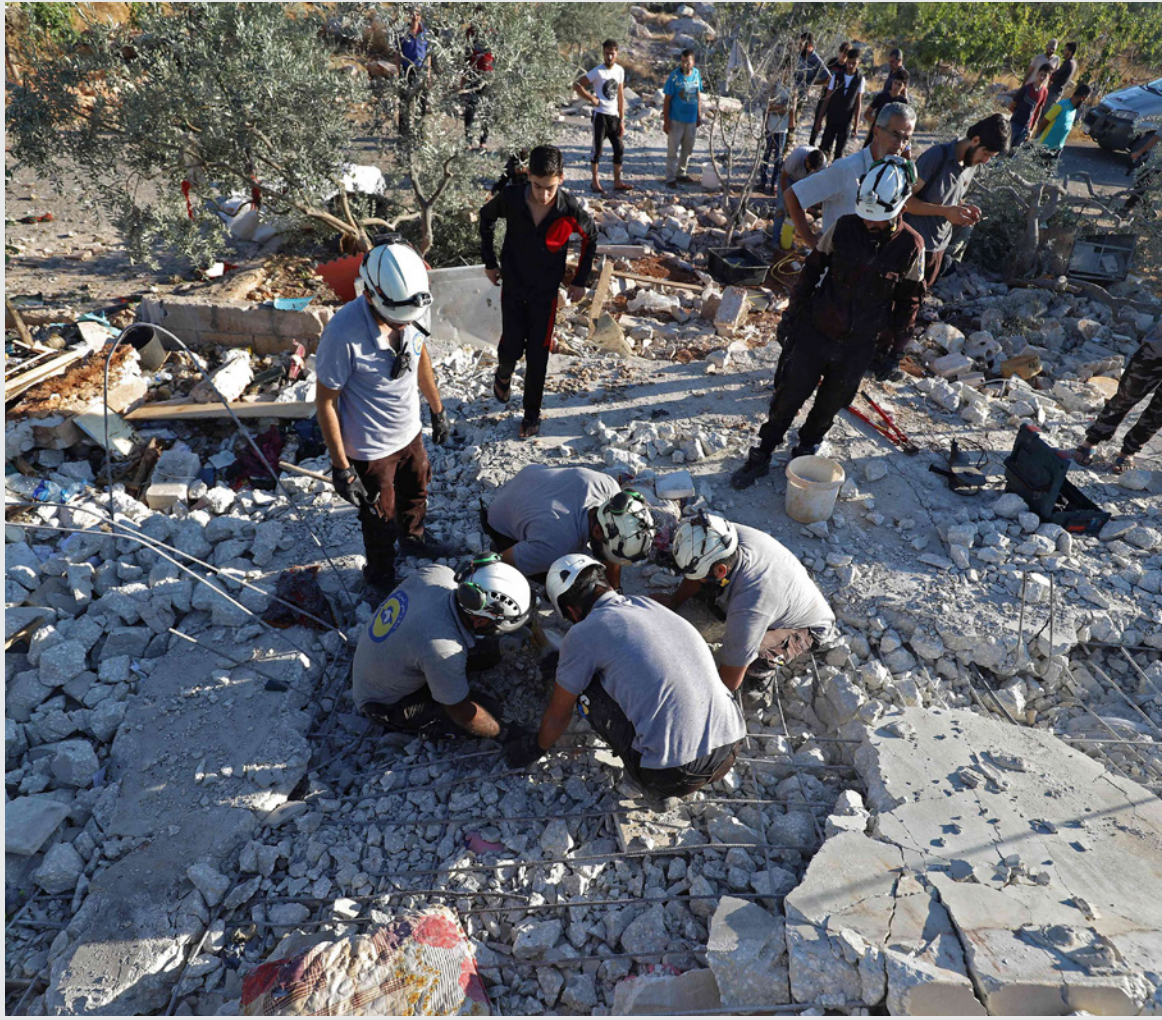
عناصر من «الخوذ البيضاء» يفتشون وسط أنقاض مبنى عن أحياء (أرشيفية)

لندن - «القدس العربي»: نشرت صحيفة «واشنطن بوست» مقال رأي لجوش روغين قال فيه إن أفراد الدفاع المدني أو «الخوذ البيضاء» في سوريا مستعدون لمساعدة أوكرانيا، وأضاف أن توسيع الرئيس فلاديمير بوتين حربه الإجرامية ضد المدنيين في كل أنحاء أوكرانيا، حول المدنيين العاديين إلى جنود في الخط الأمامي للقتال. والسيوريين الذين يواجهون الهجمات العسكرية الروسية منذ سنوات لديهم استعداد لمساعدة الأوكرانيين على تنظيم قوات دفاعهم المدنية. ويحتاج الأوكرانيون لكل المساعدة المتوفرة وإنقاذ حياة أكبر عدد من الأبرياء فيما قد تحول إلى حرب طويلة.