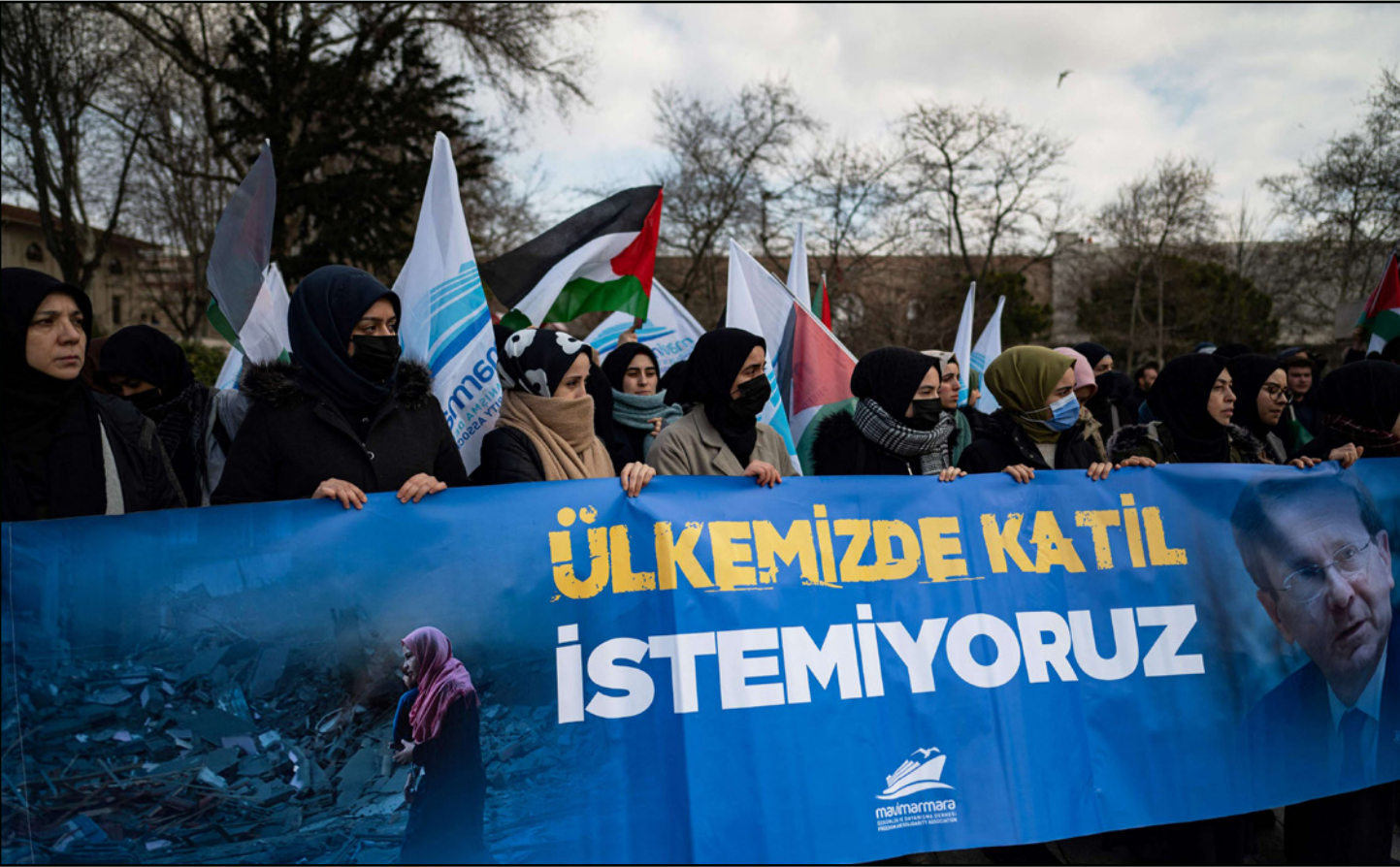
متظاهرون أتراك يحملون لافتة عليها صورة الرئيس الإسرائيلي إسحاق هرتسوغ وكتب عليها «لا نريد قتل في بلادنا» وهم يلحون بالأعلام الفلسطينية في إسطنبول

والى جانب مشاركة وزيرى الخارجية والطاقة الإسرائيليين في المنتدى وعدد من المسؤولين العرب وأمين عام مجلس التعاون الخليجي، يشارك وزير خارجية أرمينيا لأول مرة منذ سنوات طويلة في أحدث مثال على تساعي إعادة تطبيع العلاقات بين أنقرة وبيريفان، وهي خطوة تاريخية قد تمهد لإنهاء قطعية طويلة بين البلدين.