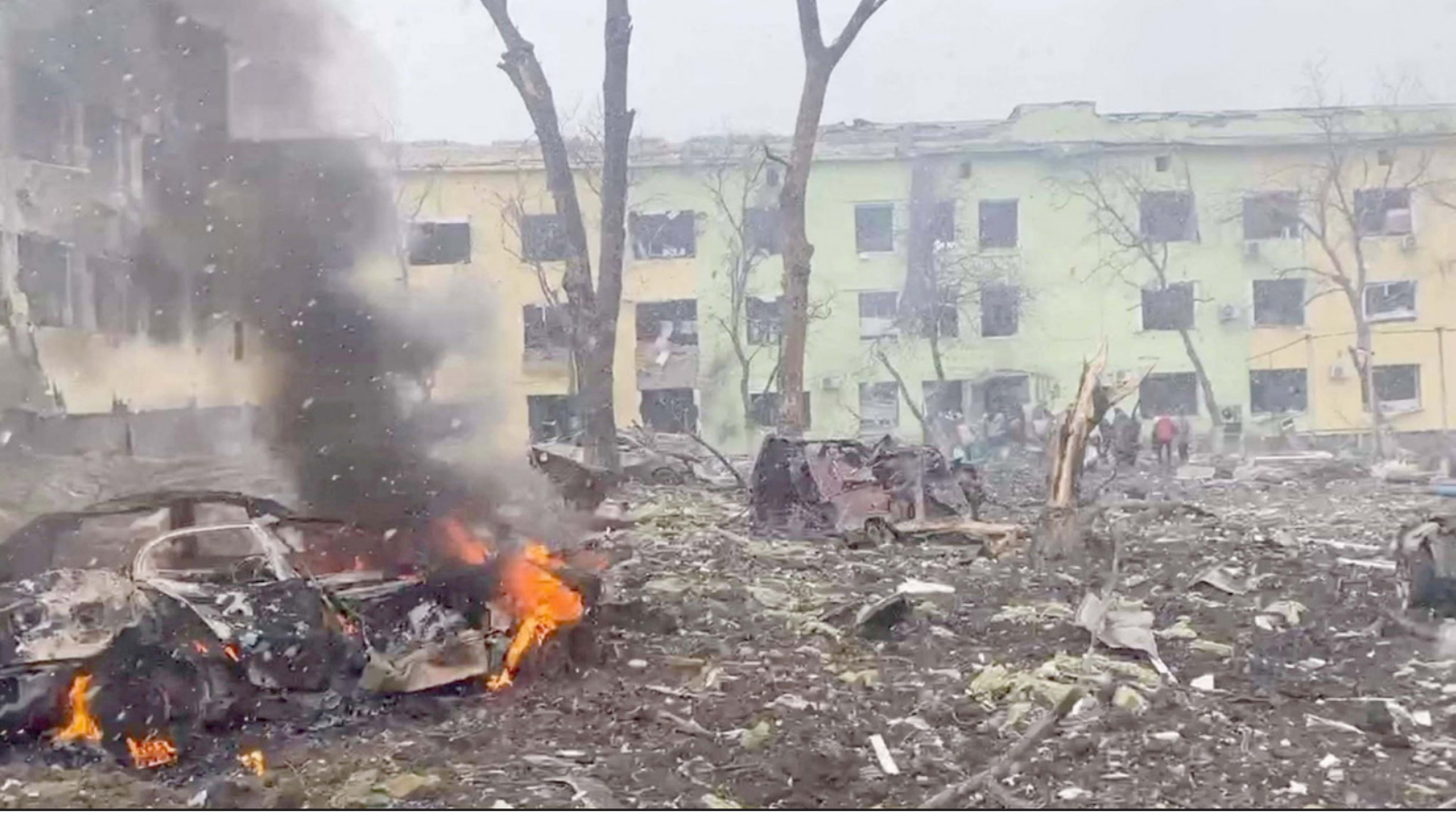
مستشفى الأطفال في مدينة ماريوبول الأوكرانية المحاصرة بعد الغارة الروسية عليها

أضعف النظام الصحي الذي ما زال يقاوم، وأكدت وقوع 18 هجوماً على أهداف صحية. وقال مايكل راين، رئيس برنامج الطوارئ الصحية في منظمة الصحة العالمية، خلال مؤتمر صحافي في جنيف: «لا اعتقد أن النظام الصحي الأوكراني على وشك الانهيار. اعتقد أنه من بشكل ملحوظ». وأضاف شدد المتحدث باسم الأمم المتحدة الصحفي الأوكراني على أنه ينبغي أن تبقى مستيفان دوجاريك على أنه ينبغي أن تبقى المنشآت الصحية في أوكرانيا بمنأى عن القصف، رداً على تقارير عن تدمير الجيش الروسي مستشفى للأطفال في ماريوبول. وقال خلال مؤتمره الصحافي اليومي أن الأمم المتحدة ومنظمة الصحة العالمية طالبتا وما زالتا تطالبان «بوقف فوري للهجمات على المرافق الصحية والمستشفيات والعاملين في مجال الرعاية الصحية وسيارات الإسعاف».