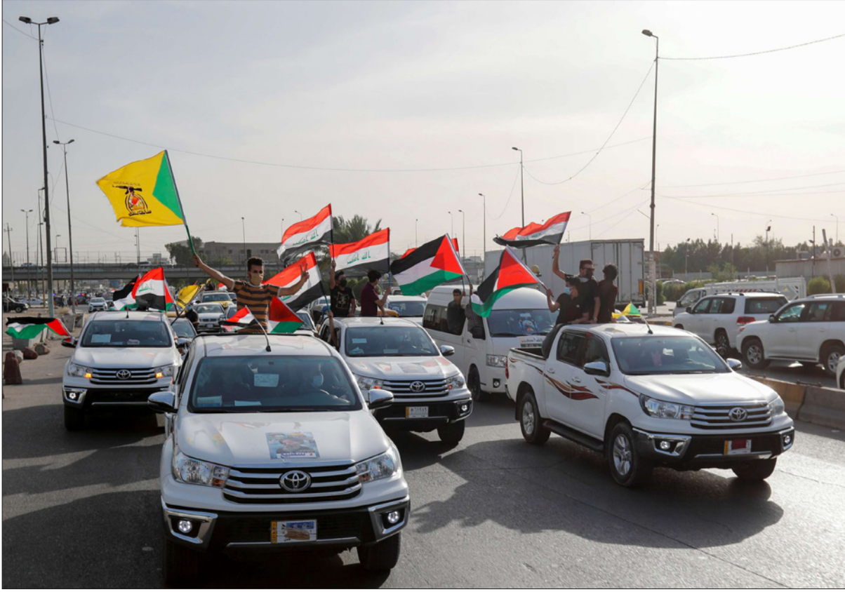
مناصرون لكتائب «حزب الله» العراقي أثناء مشاركتهم في عرض عسكري في بغداد في ذكرى يوم القدس (أرشيفية)