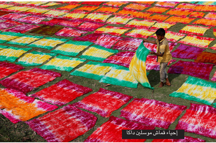
إحياء قماش موسلين دكا

محصولها. لكن سرعان ما برزت عيقة جديدة بددت الأمل في إنتاج الموسلين مجدداً، وتمثلت في عدم توافر الخبرة اللازمة في هذا المجال لدى التساين، مع أن بنغلادش في اليوم ثاني أكبر مصدر للمنسوجات في العالم بعد الصين، إذ توفر الملابس للعلامات التجارية العالمية الكبرى ويبلغ حجم مبيعاتها 35 مليار دولار كل عام. وبدأت بالتالي رحلة البحث عن غزّالين ونساجين يعرفون كيفية العمل بهذه الخيوط البالغة الرقة بين الحرفيين المحليين في كل أنحاء دكا، حيث تتولى مشاغل صغيرة تصنيع أزياء الساري التقليدية باستخدام قطن الجمداري الناعم الشبيه بالوسلين.