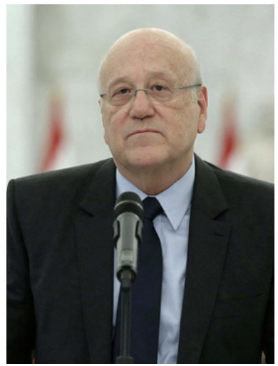
رئيس الحكومة اللبنانية نجيب ميقاتي

وفي إطار التحضير للانتخابات، كثر الكلام عن درس الرئيس فؤاد السنيرة قرار الترشح في دائرة بيروت الثانية بعد عزوف الرئيس سعد الحريري عن خوض الانتخابات وكي لا تُترك الساحة السنيرة في حال فراغ ليستفيد منها حزب الله. وأفيد عن اجتماع السنيرة مع «مجموعة العشرين» التي كانت رفضت التسوية الرئاسية لإيصال الرئيس ميشال عون والتي علقت اجتماعاتها منذ فترة طويلة. ويجري حديث عن تواصل بين السنيرة والحزب التقدمي الاشتراكي والقوات اللبنانية لبحث مجالات التعاون انتخابياً في عدد من الدوائر خشية استغلال محور الممانعة الفراغ السنوي واستثماره لصالحه.