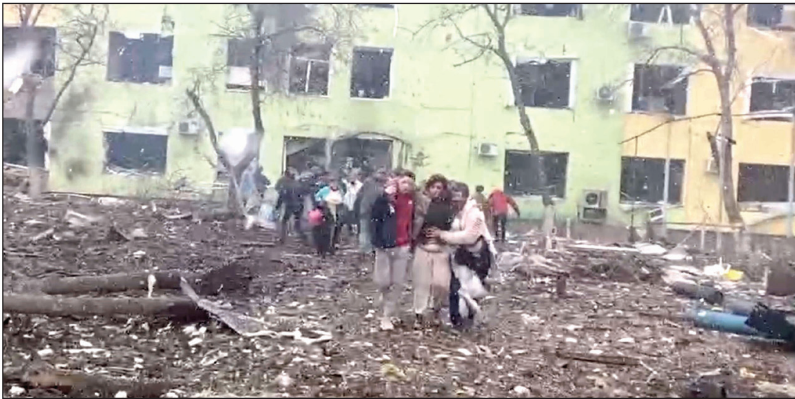
أوكرانيون يفرّون من مشفى ولادة تعرض للقصف في مدينة ماريوبول أمس

في فيديو نُشر على فيسبوك "إلى الآن هناك 17 جرحيا بين أفراد الطاقم الطبي، وتابع "إلى الآن لم يصب أي طفل"، مضيفا أن "لا وفيات". كما قال نائب رئيس بلدية ماريوبول إن 1170 مدنيا قتلوا في المدينة منذ بدء الغزو و47 دفنوا في قبر جماعي. في الموازة، تمكن آلاف المدنيين من الفرار من مدينة سومي شمال شرق أوكرانيا، اتفقت روسيا وأوكرانيا الأربعاء على وقف إطلاق النار للسماح بإقامة ممرات إنسانية حول المناطق المتضررة.