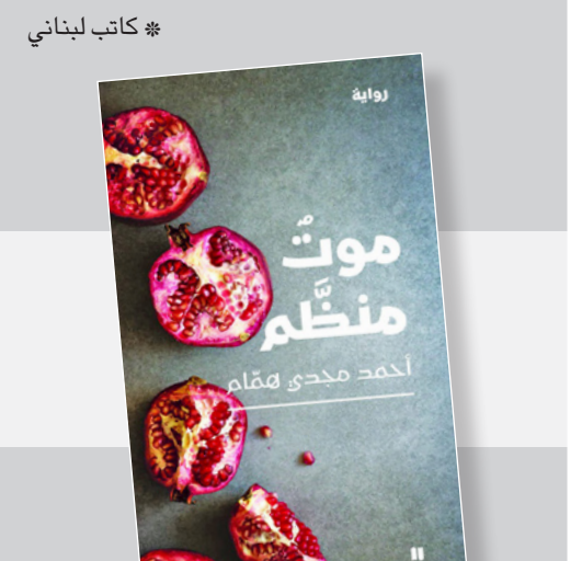
* كاتب لبناني

رواية أحمد مجدي همام «موت منظم» صدرت عن دار نوفل في 189 صفحة سنة 2012.