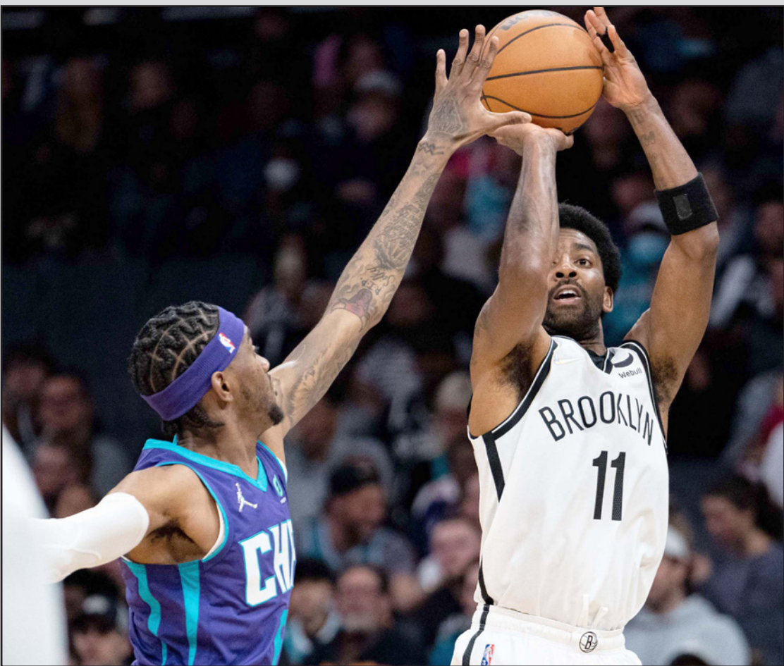
إيرفنج نجم نيتس يهجم بالتصيد على سلة هورنيتس

وسجل العملاق اليوناني يانيس أنتيتوكونميو 39 نقطة لحامل اللقب ميلووكي باكس وقاده للفوز على ضيفه أو كلاهو ما سيتي تاندر 142-115، وتلقى في صفوف الفائز أيضاً كريس ميدلتون مع 25 نقطة، فيما أضاف بوبي بورنتس 18 إلى 14 مرتدة، وحقق باكس فوزه الخامس تالياً، ليعزز مركزه الثالث في المنطقة الشرقية مع 41 فوزاً مقابل 25 هزيمة، وحافظ كليفلاند كافالييرز على حظوظه بالتأهل إلى الأدوار الإقصائية بفوزه على ضيفه إنديانا بايسرز 127-124، في مباراة شهدت تسجيل داريوس غارلاند 41 نقطة هي الأعلى في مسيرته، وأضاف غارلاند إلى سجله الهديفي 13 تمريرة حاسمة و5 مرتدات، في حين نجح الخمسة الأساسيين في تحقيق «أبل-دايل» لكافالييرز، ووضع فينيكس صنز خسارته أمام باكس السبع خلف ظهره، ليفوز على ماجيك 102-99، وخاض صنز اللقاء بصفوف غير متكاملة في ظل استمرار غياب كريس بول المصاب وديفن بوكر لابصاف بروتوكولات كورونا، ما أرحى بثقله على دياندي آيتون الذي عوض غياب زميله بتسجيله 21 نقطة إلى 19 مرتدة، فيما أضاف لاندري شاميت 21 نقطة.