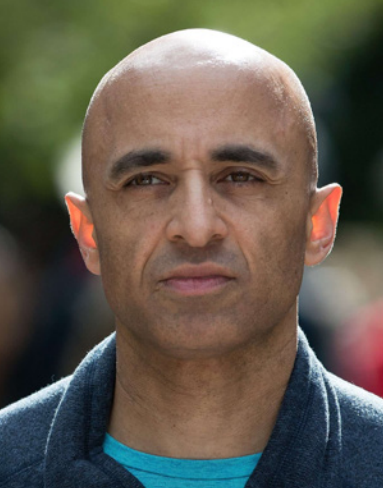
سفير الإمارات لدى واشنطن يوسف العتيبة

بنك «مير وهو» الياباني، تعليقا على تصريح السفير الإماراتي «هذا ليس شيئا بسيطا، فربما يمكنهم ضخ حوالي 800 ألف برميل في السوق بسرعة كبيرة أو بشكل فوري، وبذلك سنحصل على سبع الكمية المطلوبة لتعويض الإمدادات الروسية». وكانت لهجة منظمة «أوبك» قد تغيرت هذا الأسبوع، عندما قال أمينها العام محمد باركيث إن العرض يتخلف بشكل متزايد عن الطلب، رغم أن المنظمة وحلفاءها اقنوا بالولوم في ارتفاع الأسعار على التوتير الناتج عن الأوضاع السياسية، وليس على أي نقص في المعروض، وقرروا عدم زيادة الإنتاج بوتيرة أسرع مما عليه الحال الآن، وقاوموا مطالب الولايات المتحدة والدول المستهلكة الأخرى لنضج المزيد. وروسيا من أكبر مصدري الخام والوقود في العالم إذ تصدر نحو سبعة ملايين برميل يوميا أو سبعة في المئة من الإمدادات العالمية. وارتفعت أسعار النفط بما يزيد عن 30 في المئة منذ بدء أسعار النفط بما يزيد عن 30 في المئة منذ بدء أسعار النفط بما يزيد عن 30 في المئة لتلامس ذروة تجاوزت 139 دولارا للبرميل يوم الاثنين الماضي قبل أن تتراجع لاحقا.