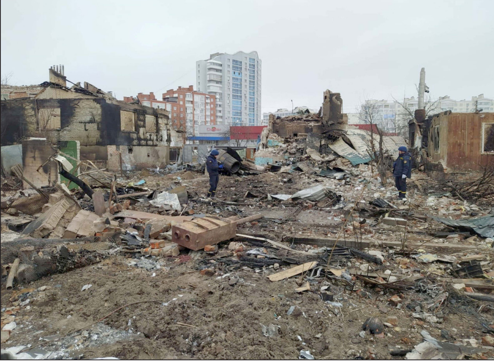
جانب من الدمار الذي خلفته الحرب الدائرة في أوكرانيا

في الثأني من تشرين الثاني/نوفمبر، أرسل بايدن مدير وكالة الاستخبارات المركزية وليم برنز إلى موسكو، لعقد لقاءات مع الرئيس الروسي فلاديمير بوتين. وأعرب برنز، وهو سفير أمريكي سابق لدى موسكو، يتقن اللغة الروسية، لبوتين عن مخاوف واشنطن «الجديدة» بشأن تحركات القوات الروسية، وفق ما أفادت مجلة «سي إن إن» آنذاك. ودق ستة ضباط في مديرية الاستخبارات التابعة لهيئة الأركان الأمريكية بالمعلومات