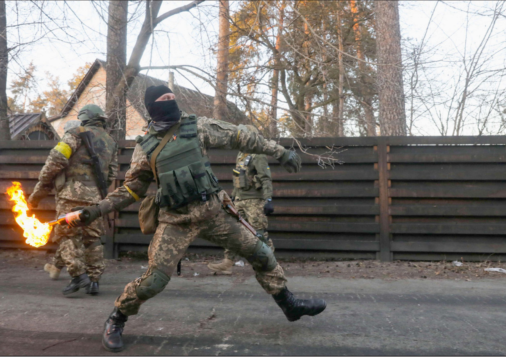
جندي اوكراني يتدرب علىلقاء المولوتوف