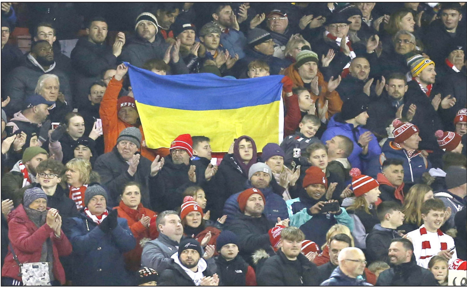
مدرجات ملاعب كرة القدم الأوروبية غصت بالمؤيدين الأوكرانيا والرافضين لروسيا

لوزان (سويسرا) - أف ب: بعد لجوئه إلى القضاء اعترض على إقصائه من المنافسات الدولية، يضع الاتحاد الروسي لكرة القدم الرياضة العالمية في مواجهة أمام تناقضاتها، بين الدفاع الصريح عن حقوق الإنسان ورفض التزامها بالحياد السياسي.