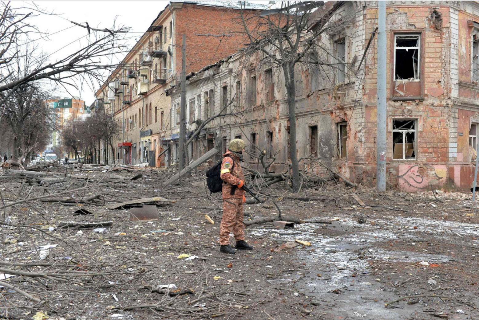
دمار شامل لأحد شوارع خاركييف الأوكرانية إثر القصف الروسي له

الأمريكي بزيادة معدلات إنتاج النفط لتخفيف مخاوف الأسواق العالمية، أما مصر فقد قررت تكثف الانتقاد للغزو والمضي في طلب قرض بقيمة 25 مليار دولار من روسيا لبنا مفاعل نووي. وقال مايكل حنا، مدير برنامج الشؤون الخارجية في مجموعة الأزمات الدولية: «يجب أن تكون لحظة فارقة».