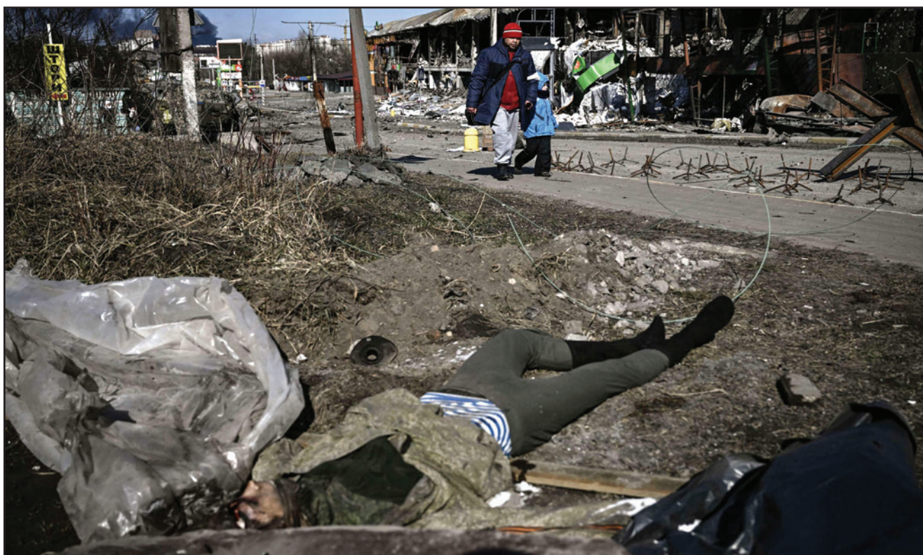
رجل وطفل يمران قرب جثة جندي خلال فرارهما من مدينة أربين شمال كييف أمس

المقابلة وفق بيان رسمي استعرض آخر التطورات على الساحة الأوكرانية، والطرق السلمية والدبلوماسية الكفيلة بحلها، كما تمت مناقشة القضايا الإقليمية والدولية ذات الصلة. في حين، اجتمع قادة الاتحاد الأوروبي في قمة غير رسمية في فرساي، أمس الخميس، لبحث أزمة أوكرانيا، فيما دعت فرنسا والمانيا، الرئيس الروسي، فلاديمير بوتين لـ«وقف إطلاق النار» وقال الرئيس الفرنسي إيمانويل ماكرون والمستشار الألماني أولاف شولتس، لبوتين خلال مكالمة هاتفية، إن حل النزاع في أوكرانيا يجب أن يأتي عبر «مفاوضات بين أوكرانيا وروسيا».