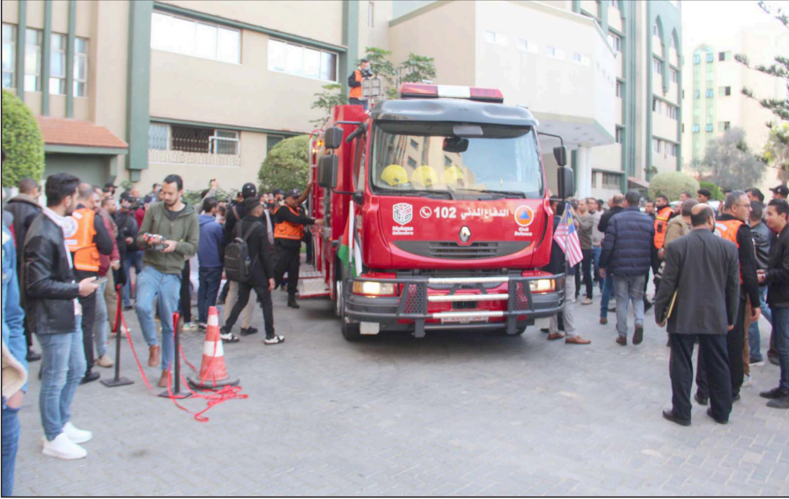
«عربة الإطفاء» التي صنعت تجهيزاتها بأيد فلسطينية من قطاع غزة

يبلغ نحو خمسة عشر صنفاً من المعدات التي تخص الإطفاء من الوصول إلى القطاع، ومن بين الأصناف التي يمنع الاحتلال إدخالها أجهزة الأوكسجين الخاصة بالمنقذين وكذلك الكمادات التي توضع على وجوههم لتمكينهم من التنفس وسط الدخان إضافة إلى اللباس الخاص بفرق الدفاع المدني، للوقاية من لهب النار. استبدال العربات المتهاكلة والجدير بالذكر أن هيكل العربة الجديدة جرى شراؤه عبر موردين من السوق المحلي، قبل أن يوضع تحت تصرف فريق الهندسة المختص، الذي نجح في إعادة تشكيله ليصبح عربة الإطفاء والإطفاء الأكثر تطوراً في قطاع غزة، وذلك بدعم من «مؤسسة أحياء غزة ماليزيا»، وجرى تجريب تلك العربة خلال تمرين إنقاذ نفذت شرق مدينة غزة، بمشاركة العديد من العربات الأخرى، وقد اشتمل التمرين على إطفاء حرائق وإنقاذ مواطنين علقوا في أوتار علوية في أحد المباني. وحسب