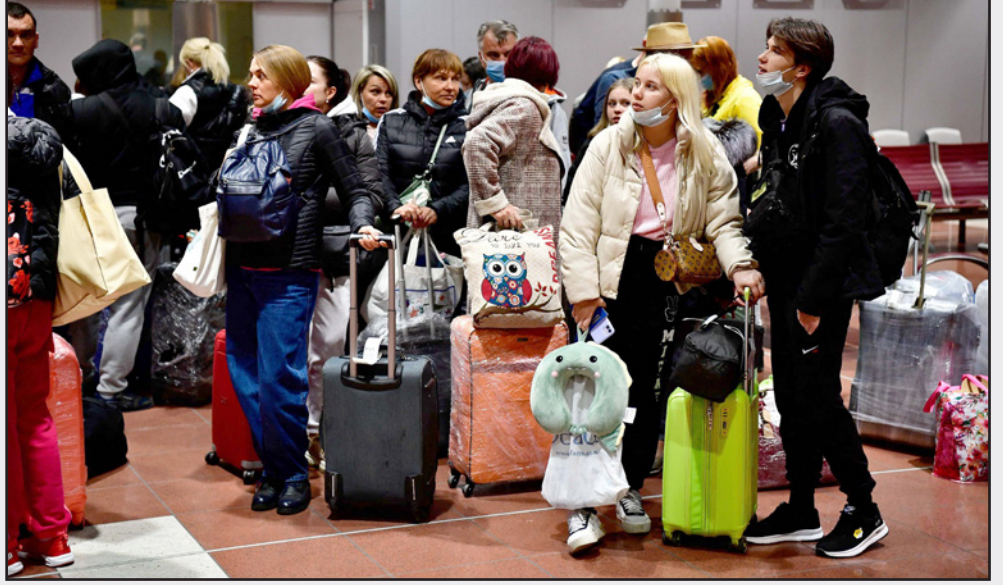
أوكرانيون لدى وصولهم إلى مطار بودابست بعد عودتهم من مصر