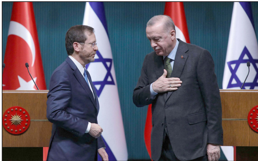
الرئيس التركي خلال لقائه نظيره الإسرائيلي في أنقرة

وأكدت أن التطبيع مع الاحتلال يمثل «خطراً على الأمة الإسلامية كلها، وهو خطر على تركيا كما هو خطر على فلسطين» وأضافت في بيان أصدرته «الكيان الصهيوني شر مطلق، وأصل العلاقة معه هي العداة حتى زواله وتحريم أرضنا ومقدساتنا»، وقالت إن الاحتلال يهدف من وراء التطبيع «إضفاء الشرعية على وجوده كيانه وتثبيت أركانه واستبقاء وجوده محلياً ودولياً، وضمان توسعه ليتمكن من السيطرة على الأمة الإسلامية ومصادرة حريتها ونهضتها وسلب مقدراتها». واعتبرت الجبهة الشعبية لتحرير فلسطين زيارة هرتسوغ إلى تركيا بأنها «تحقيقاً للعلاقات الثنائية» بين البلدين، التي قالت إنها «لم