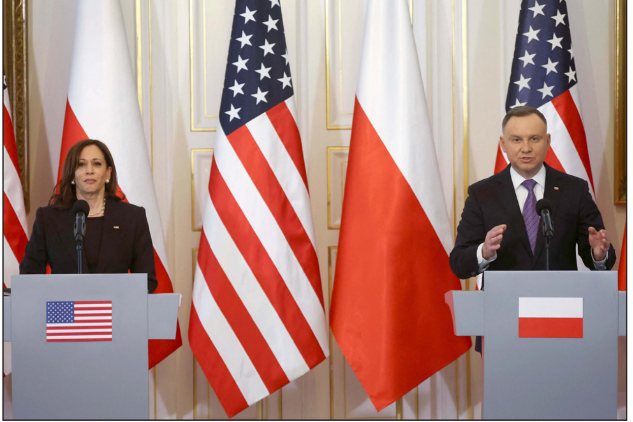
الرئيس البولندي أندري دودا ونائبة الرئيس الأمريكي كامالا هاريس خلال مؤتمر صحافي في العاصمة البولندية وارسو

الإقليمية والدولية ذات الصلة.. وهذا الاتصال هو الثالث بين آل ثاني وزيلينسكي منذ بدء الغزو الروسي لأوكرانيا. إذ سبق أن تواصل الزعيمان، في بداية الأزمة، ووفق وكالة الأنباء القطرية (قنا) أطلع الرئيس الأوكراني، أمير قطر على آخر المستجدات على الساحة الأوكرانية. وسبق أن أجرى أمير قطر اتصالات مع عدد من المسؤولين الدوليين، ومؤخراً اتصل مع الرئيس الفرنسي إيمانويل ماكرون، وبحث معه مستجدات الوضع في أوكرانيا. وحسب بيان صادر عن الديوان الأميري القطري «جرى خلال الاتصال بحث آخر المستجدات على الساحتين الإقليمية والدولية، خاصة ما يتعلق بالأحداث الجارية حاليا في أوكرانيا..»