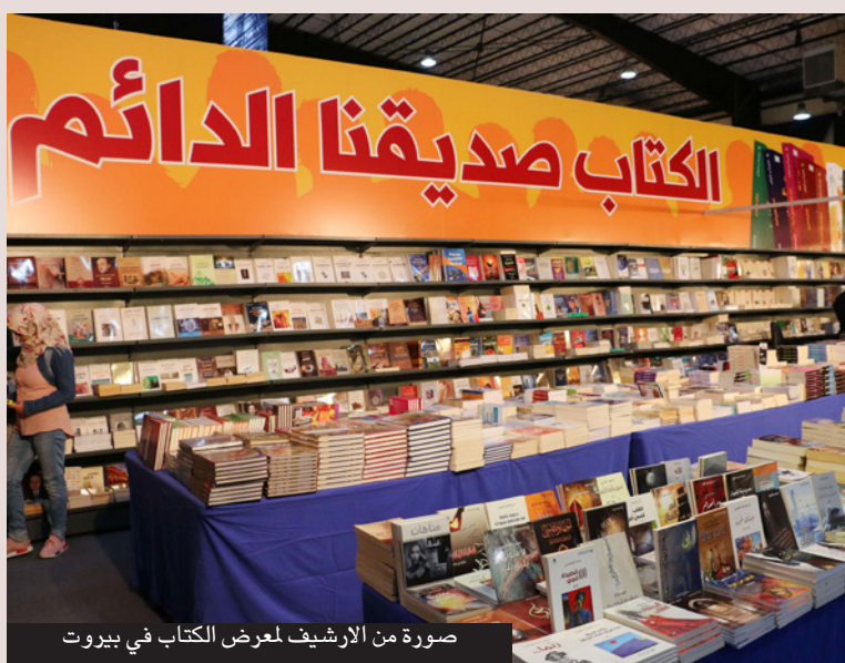
صورة من الأرشيف لمعرض الكتاب في بيروت

لما قبل الإتهام الاقتصادي ويمتد لـ10 أيام فقط. معرض الكتاب في دورته الـ63 تناقست مساحته إلى الربع تقريباً، شعاعه «بيروت لا تنكسر»، يفقد دور النشر غير المحلية باستثناء جناح واسع جداً للجمهورية الإسلامية الإيرانية، تقابله زاوية صغيرة فيها شعاع كبير بالعربية «أوكرانيا لن تخضع» وشاشة تلفزيون تنقل مشاهد من حرب تقضي والبشر والحجر، دور النشر اللبنانية المشاركة 90، وأربعة دور عربية بين سوريا ومصر، وعشر إيرانية، معرض متواضع قياساً