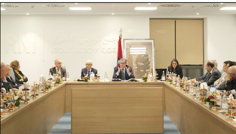
التجمع الوطني للأحرار المغربي

أكد حزب «التجمع الوطني للأحرار» المغربي على ضرورة إيجاد صيغ لتحقيق مصالحة الشباب مع السياسة، عبر تعزيز الفعاليات الحاضنة لكل النقاشات التي تروم تقييم السياسات العمومية المستهدفة لاختلاف أمتنا على كافة المستويات، وتبني مقاربة تجعل من الفعل التشاركي صيغة عامة، سواء أكان جموعيا أو سياسيا من المقدمات الأساسية للمصالحة، ما بين هياكل التأطير والشباب. وفي بيان أرسل إلى «القدس العربي» من الحزب الذي يقود الحكومة عقب اجتماع مكتبه السياسي، جرى التأكيد على أنه «إذا كان التعبير الانتخابي، في استحقاق 8 أيلول/سبتمبر المنصرم، قد انحاز إلى مسار الثقة والنجاح الانتخابي، فإنه في نفس الوقت يمنح الشرعية الكاملة لحكومة صادرة عن أغلبية منتخبة من صناديق الاقتراع. وأكد المكتب السياسي أن المؤتمر الوطني السابع الذي انعقد في وقت كسب فيه الحزب تحدي «مسار الثقة» بتصديره المشهد السياسي المغربي، ليطالع إلى كسب تحد جديد يتمثل في تنفيذ «مسار التنمية»، على الرغم من السياسات المعقدة، وبرهانات جديدة تستجيب لانتقادات وتطلعات المغاربة، وعلى رأسها مصالحة ترسيخ دعائم الدولة الاجتماعية، مرتكزا على برامج الحزب والأغلبية الحكومية المتضمنة في البرنامج الحكومي الذي يشكل التزاما وتعاقدا حقيقيا مع المواطن، وفق ما جاء في البيان، وتوقف أعضاء المكتب السياسي عند مرجعية الحزب السياسية البنية على الديمقراطية الاجتماعية كمنهج للتدبير يروم محاربة الفقر والهشاشة وينشد الانتصار للمناطق