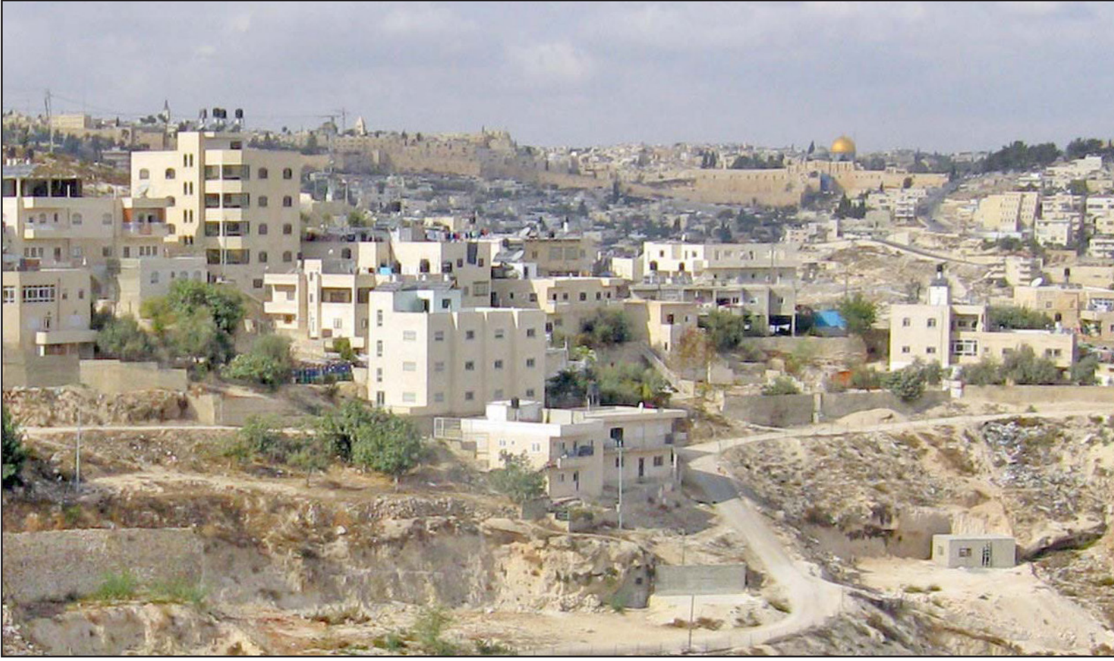
بلدة جبل المكبر الفلسطينية

وقال في بيان أمس، وصل «القدس العربي» نسخة منه إن حكومة الاحتلال تستغل انتشغال المجتمع الدولي في أزمتها دولية لإقرار العديد من المشاريع الاستيطانية والتهودية الهادفة إلى تغيير الوجه الفلسطيني للمدينة. وأضاف: «لا يكاد يمر يوم دون أن يهدم فيه منزل أو يتم إقرار مشاريع استيطانية أو مشاريع تهودية أو اعتداء على المقدسات أو اعتقال والإعتداء على المواطنين». وأشار إلى ما يجري في محيط البلدة القديمة وساحة البراق بالتوازي مع العديد من القرارات