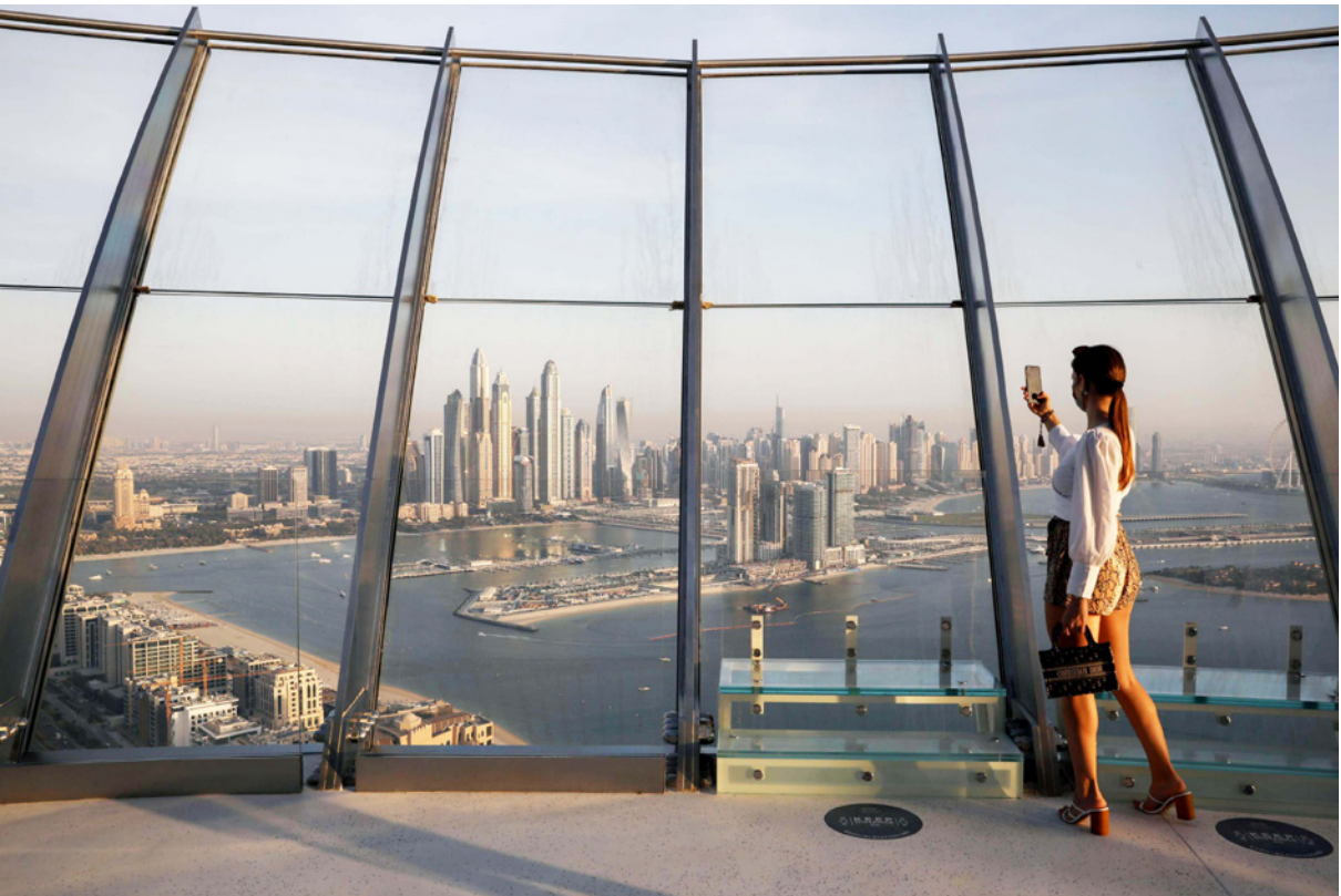
التقاط صورة من برج النخلة لمنطقة مارينا في دبي حيث تكاثرت البنابات التي يقبل الأثرياء الروس على شرائها

يمكنهم أن يفعلوا ذلك، غير أن البنك لديه ضوابط مشددة بتعين الالتزام بها لبقول أموال روسية ومنها تقديم دليل على مصدر الأموال. وقالت المصادر أن صناعة إدارة الثروات الخاصة الناشئة في الإمارات لم تصل بعد إلى النطاق أو التطور الذي يستوعب بالكامل ثروة مخبأة في