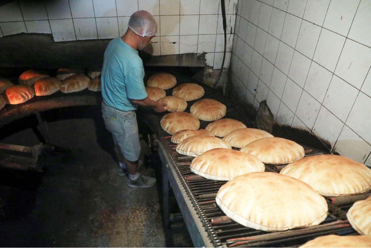
أحد مخازب العاصمة بيروت

■ بيروت – الأناضول: لم يكن ينقص لبنان سوى انعكاس تداعيات التدخل الروسي في أوكرانيا عليه، لتزيد معاناة شعبه اليومية في ظل أزمة الاقتصادية، التي وصفها البنك الدولي بأنها «الأكثر حدة وفساداً في العالم»، وصنفتها ضمن أصعب ثلاث أزمات سجلت في التاريخ منذ أواسط القرن التاسع عشر. فالحرب في أوكرانيا تهدد بأزمة أمن غذائي في لبنان الذي يحتاج سنوياً إلى بين 550 ألف و650 ألف طن من القمح، حسب بيانات حكومية.