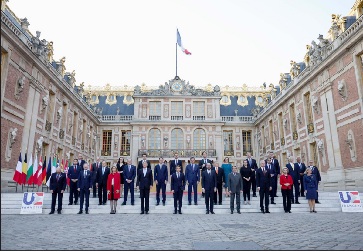
تذكارية لقيادة الاتحاد الأوروبي في قمة فرساي