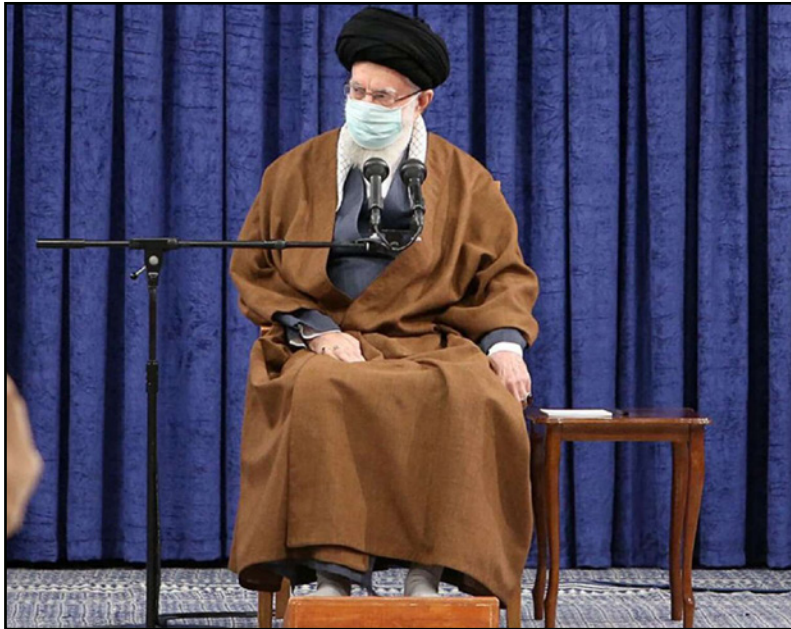
المرشد الأعلى الإيراني، علي خامنئي أثناء خطاب ألقاه أمام مجلس خبراء القيادة

ومع بلوغ المفاوضات في الأونة الأخيرة مراحل حاسمة، بدأ موقف روسي مستجد يلقي