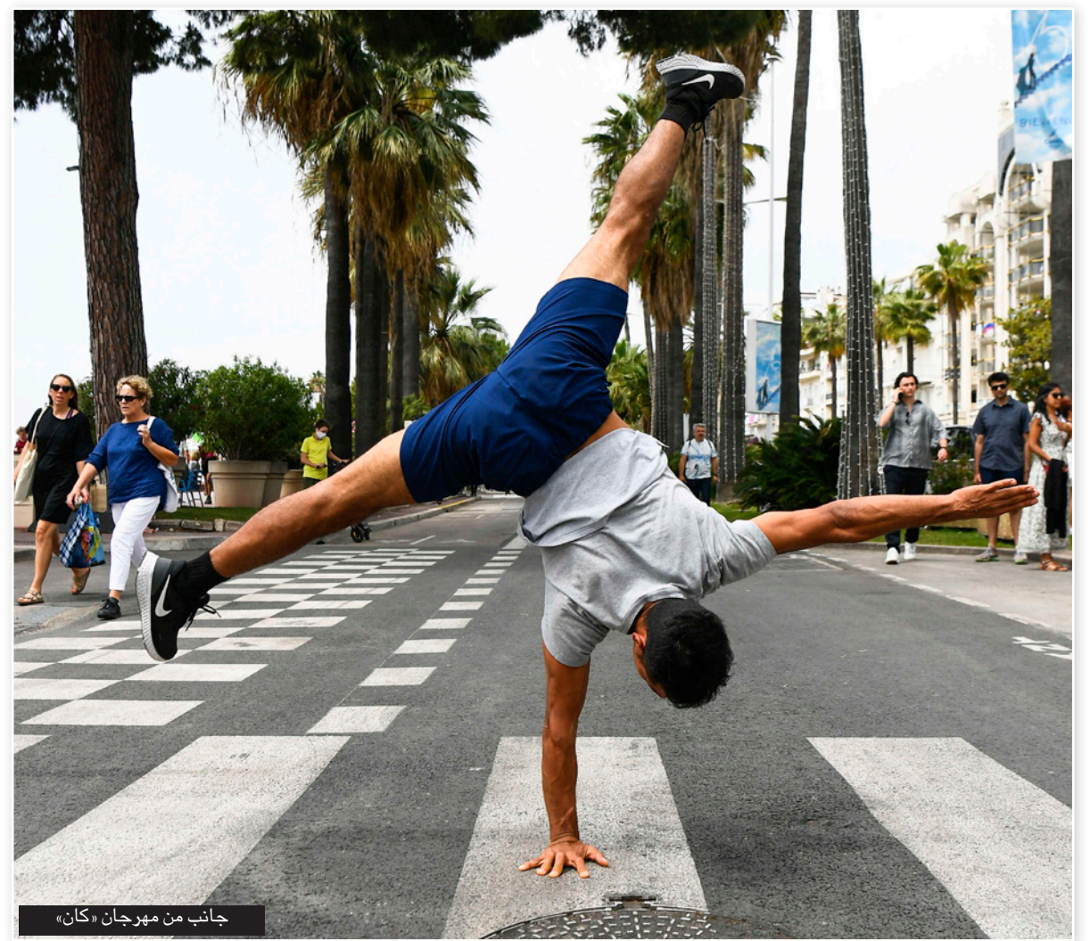
جانب من مهرجان «كان»

كان (فرنسا) - أ ف ب: اعتبر المخرج السويدي من أصل مصري طارق صالح، الذي يسعى فيلمه «صبي من الجنة» إلى الفوز بالسعفة الذهبية لمهرجان كان السينمائي أن «الغرب مهوس بالإسلام وفي الوقت نفسه لا يفهم هذا الدين إطلاقاً». بعد نحو خمس سنوات على فيلمه «حادث النبل هيلتون» عاد المخرج البالغ 50 عاماً، والولود في ستوكهولم لأم سويدية وأب مصري، يعمل تشويعي سياسي ديني ينتقد أداء السلطات المصرية في عهد الرئيس عبد الفتاح السيسي ويغوص في عالم أبرز المؤسسات المعنية بالإسلام السني. ويذكر الفيلم برواية «اسم الوردة» للكاتب الإيطالي أومبرتو إكو، التي تدور أحداثها في أحد الأديرة خلال العصور الوسطى، وتم اقتباس فيلم سينمائي منها. وقال «كنت أعيد قراءة هذا الكتاب عندما سألت نفسي: ماذا لو أخبرت قصة من هذا النوع لكن في سياق إسلامي؟». وأضاف صالح الذي يقمّم في فيلمه لحة من الداخل عن جامعة الأزهر في القاهرة التي تمثل أهم مؤسسة متخصصة في العلوم الإسلامية السنية «أعتقد أن الغرب لا يفهم أي شيء إطلاقاً عن الإسلام». غير مرغوب فيه وعلى غرار «حادث النبل هيلتون» الذي صور في المغرب، لم يصور «صبي من الجنة» في مصر بل في تركيا. وقال صالح لم أعد إلى مصر منذ تصوير «حادث النبل هيلتون» عام 2015 عندما امرت أجهزة الأمن المصرية بمغادرة مصر. منذ ذلك الحين، أصبحت شخصاً غير مرغوب فيه سيتم توقيفه حصصاً إذا وطأت قدمه الأراضي