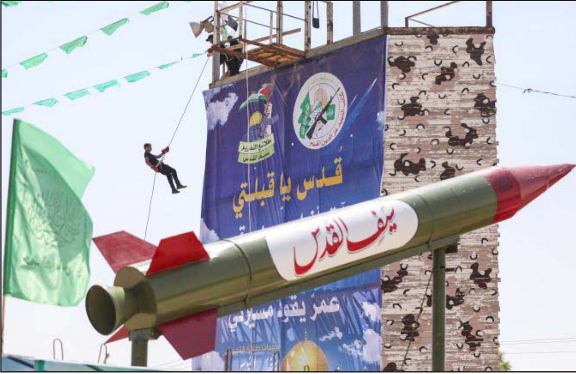
... والمقاومة الإسلامية في غزة تهدد بضرب نظرية الأمن الإسرائيلية