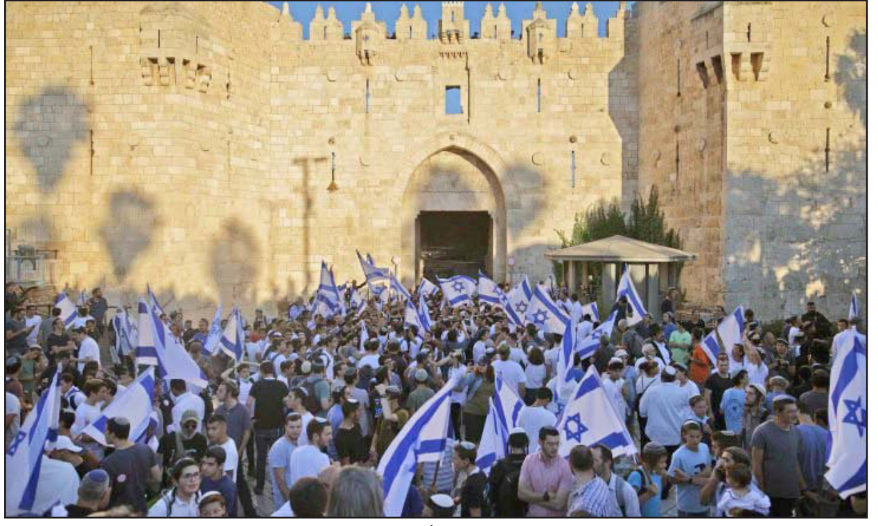
تحذيرات من دعايات «مسيرة الأعلام» للمستوطنين في القدس

قرباية ألف صاروخ جديد منذ العام الماضي، بالإضافة للمخزون القائم، وتطرق أيضا إلى سلاح الطائرات المسيّرة الذي تملكه المقاومة. ويؤكد التقرير نجاح المقاومة الفلسطينية خلال العام الأخير في استئناف عمليات تهريب الأسلحة عبر الحدود البحرية مع سينا بالإضافة للتهريب عبر المعابر البرية عبر تمويه الضائع. جاء ذلك في وقت دعا فيه جنرال إسرائيلي إلى اتخاذ خطوات استباقية قوية لمنع اندلاع «انتفاضة ثالثة» في الأراضي الفلسطينية المحتلة، على ضوء ارتفاع حدة التصعيد والإعدادات مؤخرا، وكتب الجنرال المتقاعد مثير إيندور مقالا في صحيفة «معاريف» العبرية، قال فيه «إن إرهابنا اندلاع انتفاضة ثالثة بدأت فعلياً بالظهور، وقد أشار إلى أن أسباب تفجر الانتفاضة الأولى في 1987، بدأت بالضيء مثلما تظنون والواقع الآن في الضفة الغربية وفي المدن المختلطة، حيث المظاهرات والإضرابات، ورشق الحجارة وتفتيت الطعن.