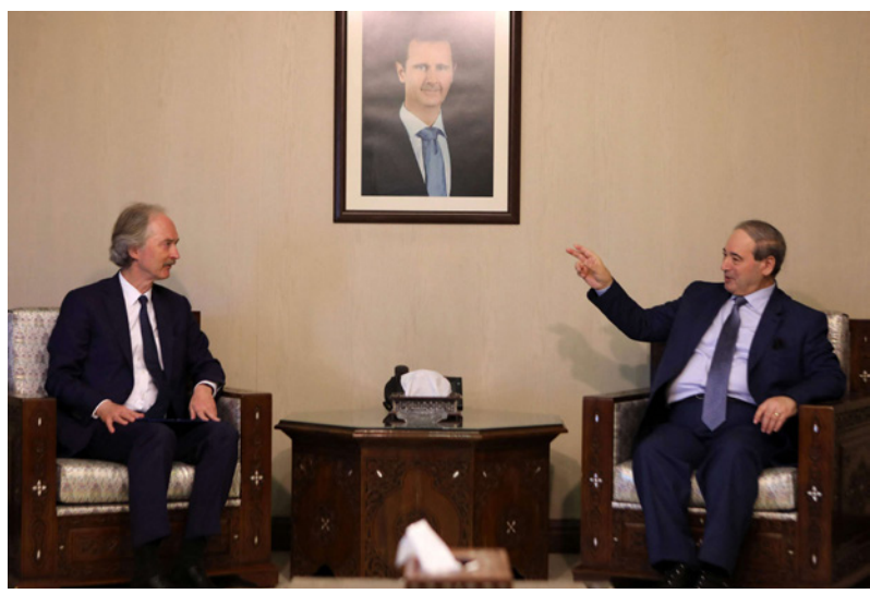
القداد لدى استقباله بيدرسون في دمشق أمس

ورحب المبعوث الخاص بيدرسون بالعضو الرئاسي العام الذي يُفترض بموجبه الإفراج عن آلاف السجناء السوريين المائتين بينهم الإرهاب، وذلك خلال زيارته إلى دمشق قبيل جولة محادثات جديدة ترمي إلى صياغة دستور جديد للبلاد تعقد الأسبوع المقبل في جنيف. وقال المبعوث الأممي الخاص في تصريح صحافي عقب اجتماع مع وزير الخارجية السوري فيصل المقداد «عرضت علي بعض التفاصيل المتعلقة بالعضو الأخير الذي أصدره الرئيس (بشار) الأسد وأمل إيقاظي على اطلاع على خطوات تنفيذ». وأضاف بيدرسون «كما قلت من قبل، إن هذا العفو له أفاق، ونحن ننتقل لثري كيف تستدير الأمور». وأصدر الأسد مطلع أيار/مايو مرسوماً قضى «بمخ عفو عام عن الجرائم الإرهابية المرتكبة من السوريين» قبل 30 نيسان/أبريل 2022، «عدا التي اقتضت إلى موت إنسان والمخصوص عليها في قانون مكافحة الإرهاب».