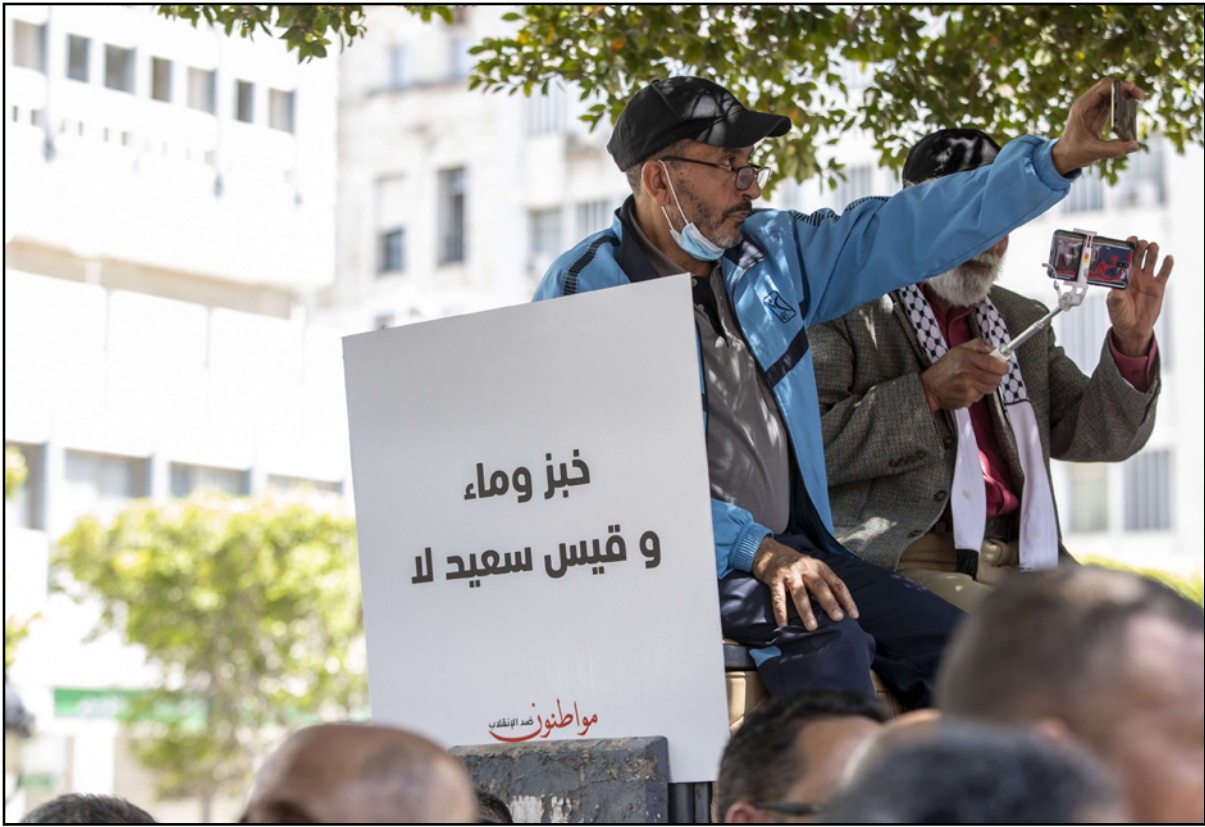
جانب من احتجاجات ضد الرئيس التونسي قيس سعيد

وأكدت تنسيقية الأحزاب الاجتماعية الديمقراطية "شجبها ورفضها لهذا الأمر (الرئاسي) ولكل التوجه الذي يريد رئيس سلطة الأمر الواقع دفع البلاد من خلاله نحو مسار يقزم المجتمع ويلغي دور الأحزاب السياسية ويهشم منظمات المجتمع المدني ويجعلها شاهدة زور على صياغة دستور كتب في الغرف المغلقة بناء على استشارة إلكترونية فاشلة لم تعلن حتى نتائجها للرأي العام".