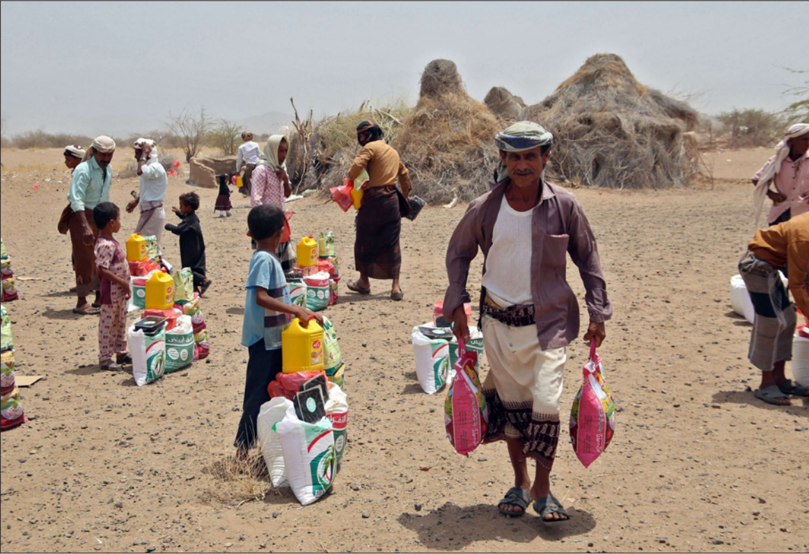
نازحون يمينون يتلقون مساعدات غذائية بسبب النزاع الدائر في بلدهم وتضاعف أسعار المواد الغذائية جراء غزو روسيا لأوكرانيا