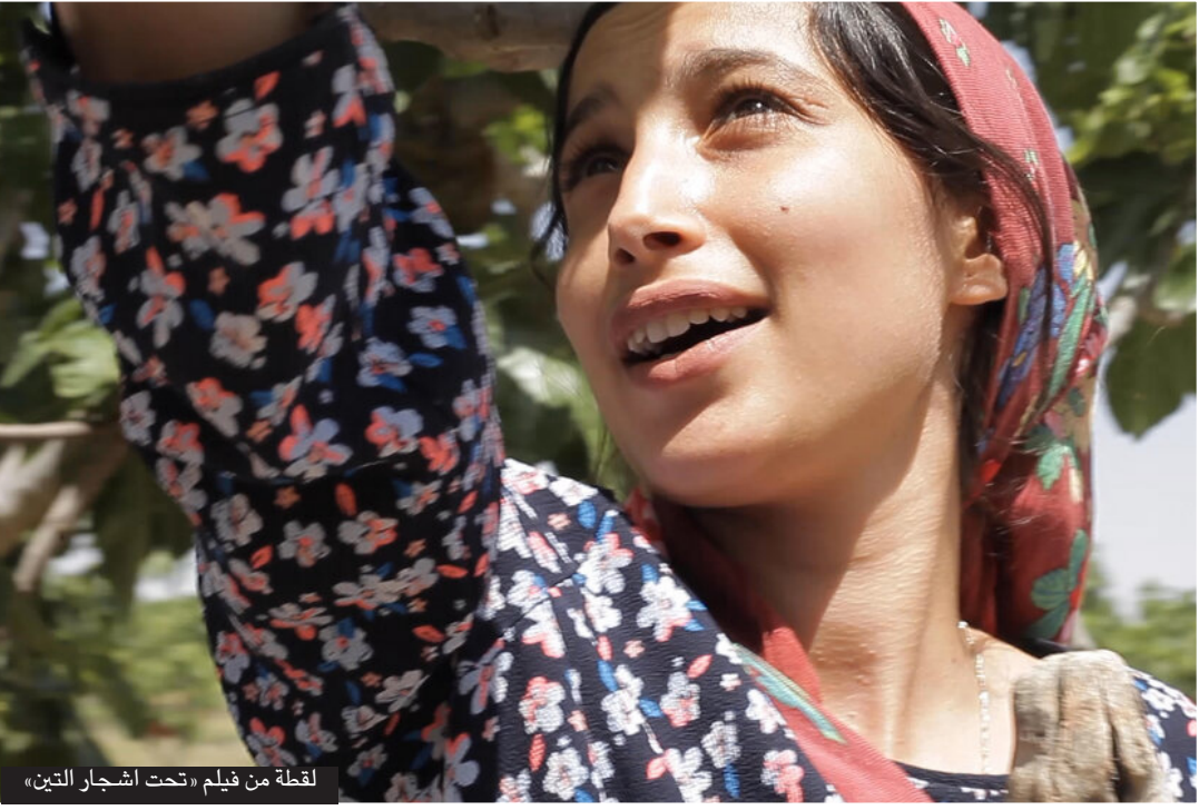
لقطة من فيلم «تحت أشجار التين»