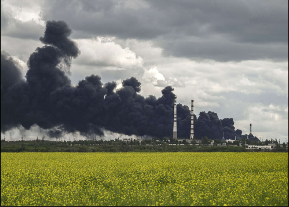
دخان يتصاعد من مصفاة نפט على حدود مدينة ليسيتشانسك في منطقة دونباس بعد هجوم روسي

على المدينة، “ستتم إعادتهم إلى بيوتهم”، في إشارة إلى مناقشات جارية مع فرنسا وتركيا وسويسرا حول هذا الموضوع.