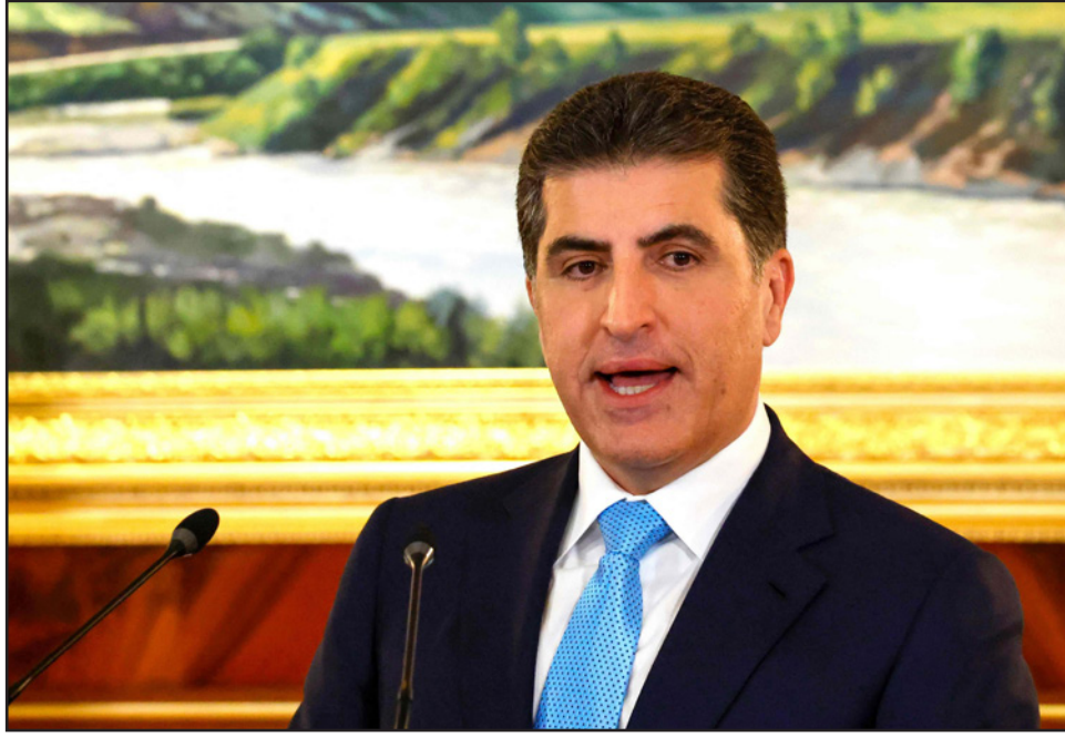
رئيس إقليم كردستان نيجرفان بارزاني

ويشأن طرح إمكانية تشكيل الحكومة الجديدة وفقاً لمبدأ «الأغلبية الوطنية» أشار إلى «أنها تواجه مشكلتين، الأولى مشكلة حفظ تمثيل المكونات الاجتماعية وحفظ المنهج الأكبر على وجه الخصوص، والمشكلة الثانية أنهم لم يقدم ضمانات كافية لعارضة سياسية وقانونية فاعارضة تقويم ومتابعة، مبيّناً أن «سلوك بعض القوى الداعية