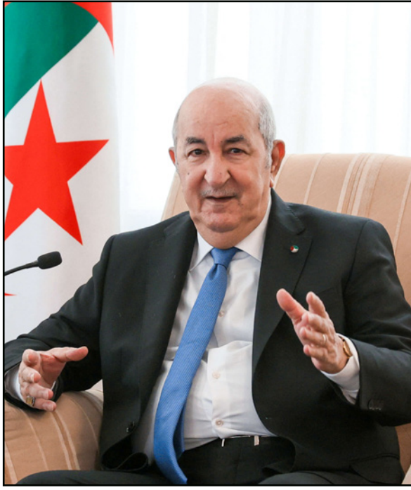
عبد المجيد تبون

وخارج موضوع المغرب "النتفي" بالنسبة للجزائر، يقول المصدر الرسمي إن زيارة وزير الخارجية السعودي كانت مناسبة لاستعراض "المجالات واسعة العلاقات بانظر إلى الحوار الاستراتيجي الطموح القائم بين البلدين اللذين يفتنجان بثقل كبير في المنطقة وعلى مستوى الهيئات العربية والإسلامية وحركة عدم الانحياز، وضمن إطار حوار آخر يتمثل في منظمة أوبك بشكله هو الآخر جانياً هاما في العلاقة الشاملة التي تجمع بين الجزائر