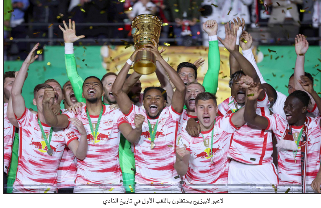
لاعيو لايزرغ يحتفلون باللقب الأول في تاريخ النادي