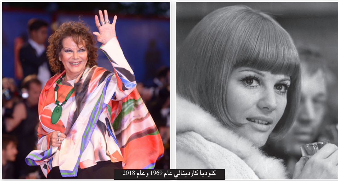
كلوديا كردينالي عام 1969 و عام 2018

وحسب البرنامج ستقوم كردينالي بجولة في سيدي بوسعيد ومدينة تونس العتيقة والموقع الأثري في قرطاج، وسيتم تنظيم سهرة موسيقية في كنيسة "سانت أوغوستان وسانت فيدال" يحييها الفنان هيثم الحضيري. وينظم مسرح الأوبرا والمكتبة السينمائية معرض صور وعرض شريط وثائقي بعنوان "صقلية أفريقية" لتونس الأرض الوعد (Siciliens) Tunisia terre promise (d' Afrique) للمخرج مارشيلو بيفانو ومن إنتاج الفونسو كامبيسي وذلك بمسرح الجهات بمدينة الثقافة. يذكر أن كردينالي ولدت في حلق الوادي يوم 15 نيسان إبريل عام 1938 لأب إيطالي كان يقيم ويعمل في تونس، وفي سن السادسة عشرة فازت في مسابقة أجمل إيطالية في تونس.