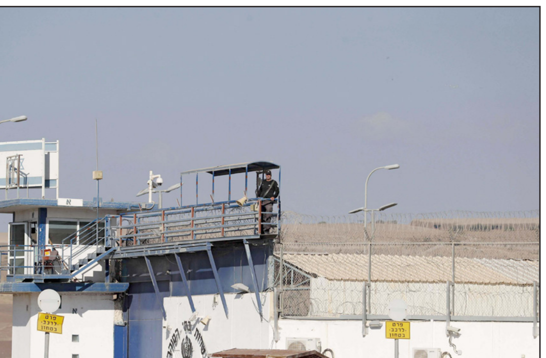
أرشيفية لسجن جيلوع

معاناته من مشاكل في التنفس، ومؤخراً بات يعاني من التهابات في الرئة اليمنى، ورغم ما يشكبه من الام اكتفت عيادة المعتقل بإعطائه المسكنات دون تقديم علاج ناجح لما يعانيه. وحملت هيئة الأسرى إدارة سجون الاحتلال المسؤولية الكاملة، عن استمرار سياسة الإهمال الطبي بحق المعتقلين الفلسطينيين، وطالبت المؤسسات الدولية ومؤسسات حقوق الإنسان والصليب الأحمر بالقيام بدورهم اللازم تجاه قضية الأسرى وبالأخص المرضى منهم. ويواصل الاحتلال اعتقال نحو 4500 أسير، منهم 700 مريض، بينهم 40 يعانون أمراضاً مستعصية، ومن بين العدد الإجمالي هناك نساء وأطفال وكبار في السن، ويشكى جميعهم من سوء المعاملة، ومن تعرضهم للإهانة والتعذيب، فيما هناك العديد منهم محرومون من زيارة الأهل، ويقع آخرون في زنازين عزل اقترابي.