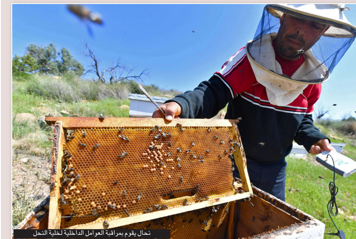
نحال يقوم بمراقبة العوامل الداخلية لخلية النحل

حبيب اللقاح والرحيق من كل زهرة يزورها، وينقل حبوب اللقاح إلى الأزهار الأخرى فتتم عملية التخصيب والتلقيح في النباتات. وهذه العملية هي التي تبرز أهمية النحل عن غيره من الحشرات. وأشارت إلى مقولة العالم أينيشتاين "إذا اختفى النحل من الأرض فإنه سيبقى للإنسان 4 سنوات فقط ليعيش". وتابعت: لن تنتهي الحياة بعد 4 سنوات في ظل التقنيات الموجودة حاليًا، وسوف يتواصل الأمر لفترة أطول، لكن في حال عدم وجود النحل لن يكون هناك إخصاب أو تلقيح في النظام البيئي، وفي هذه الحالة سينخفض الإنتاج النباتي. أي أنه إذا اختفى النحل من العالم ستواجه البشرية صعوبات كبيرة في الحصول على الغذاء. وفي إشارة إلى دراسة أجراها صامويل مايرز، الباحث في جامعة هارفارد عام 2015 قالت أوزديل إن الدراسة تشير إلى أن