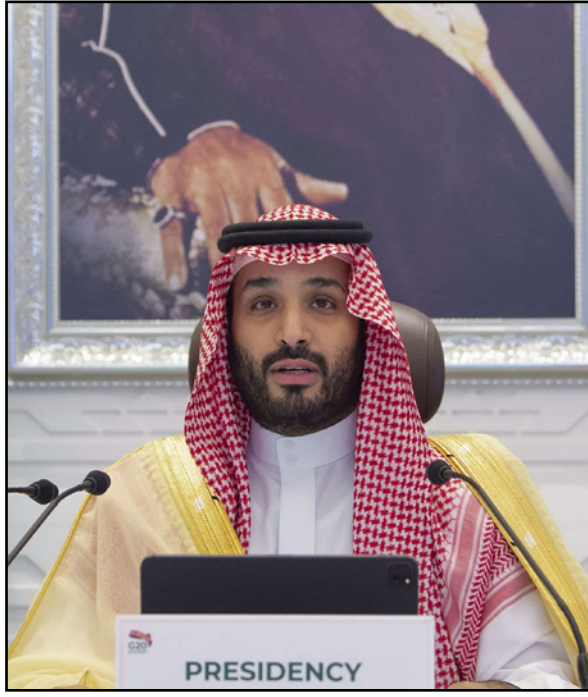
محمد بن سلمان

لمحور الجزائر الرياض الذي أصابه القفور في السنوات الأخيرة بسبب تباين المواقف من قضايا عربية كاللبنان (تحفظ الجزائر على تصنيف حزب الله منظمة إرهابية) وبقاء الجزائر على الحياد في الأزمة بين السعودية