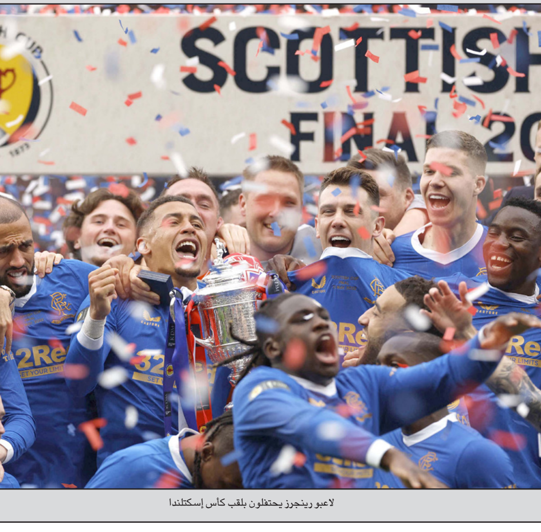
لاعيو رينجرز يحتفلون بلقب كأس إسكتلندا