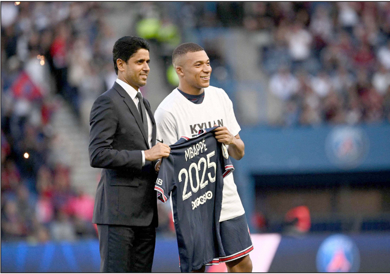
مبابي ورئيس سان جيرمان الخليفي يرفعان قميص التمديد والبقاء حتى 2025