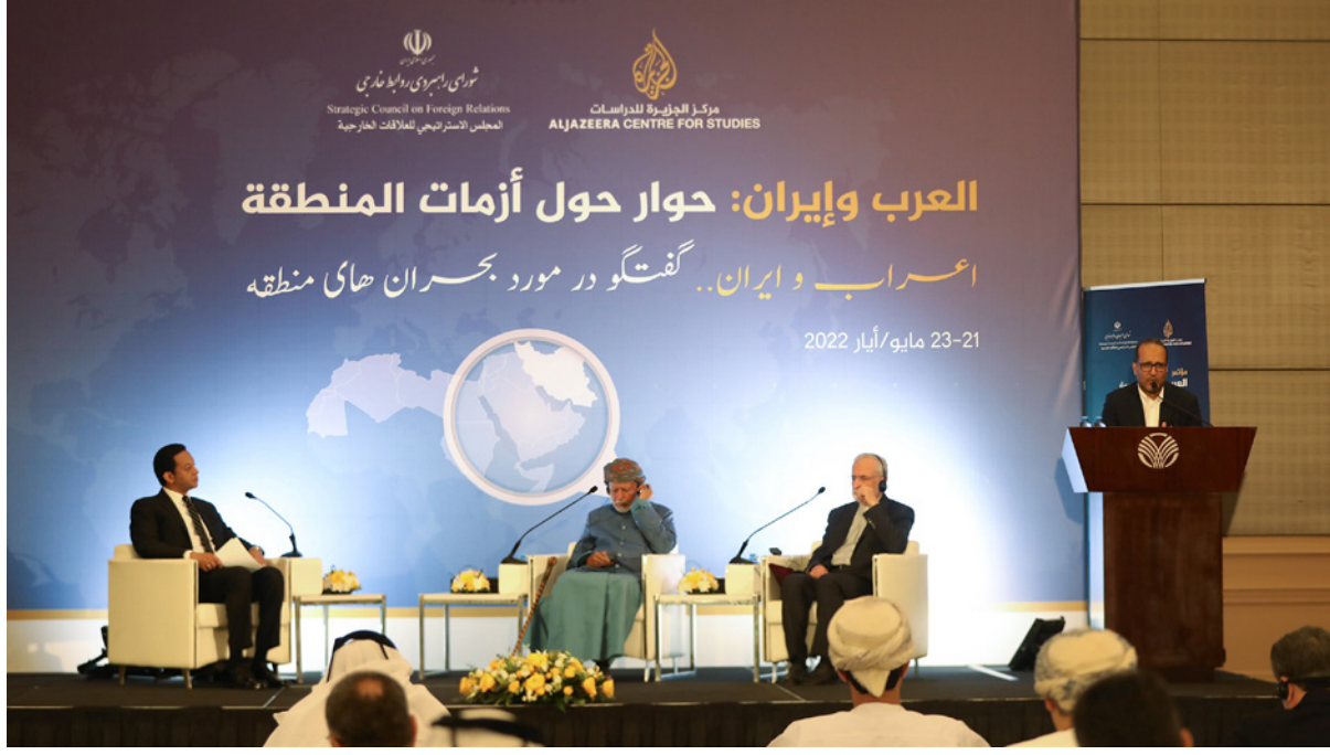
جانب من الندوة

وتحدث عن جهود السلطنة المستمرة حتى الآن في دعم الجهود لحل أزمات المنطقة سلمياً، منتقداً «الوعود والكلام في شرحه لتطور الأحداث»، وأشار بن علوي إلى أهمية الصالح المشتركة، واعتبرها أساساً لإثراء أي حوار بين الدول، كما ألقى على عامل بناء الثقة (ويقتضيه هذا إيران)، وتأثير التصورات الذهنية والاعتقادات الدينية والخرزونية الثقافية في تعزيز الحوار والدفع بوتيرته وتسريع خطواته.