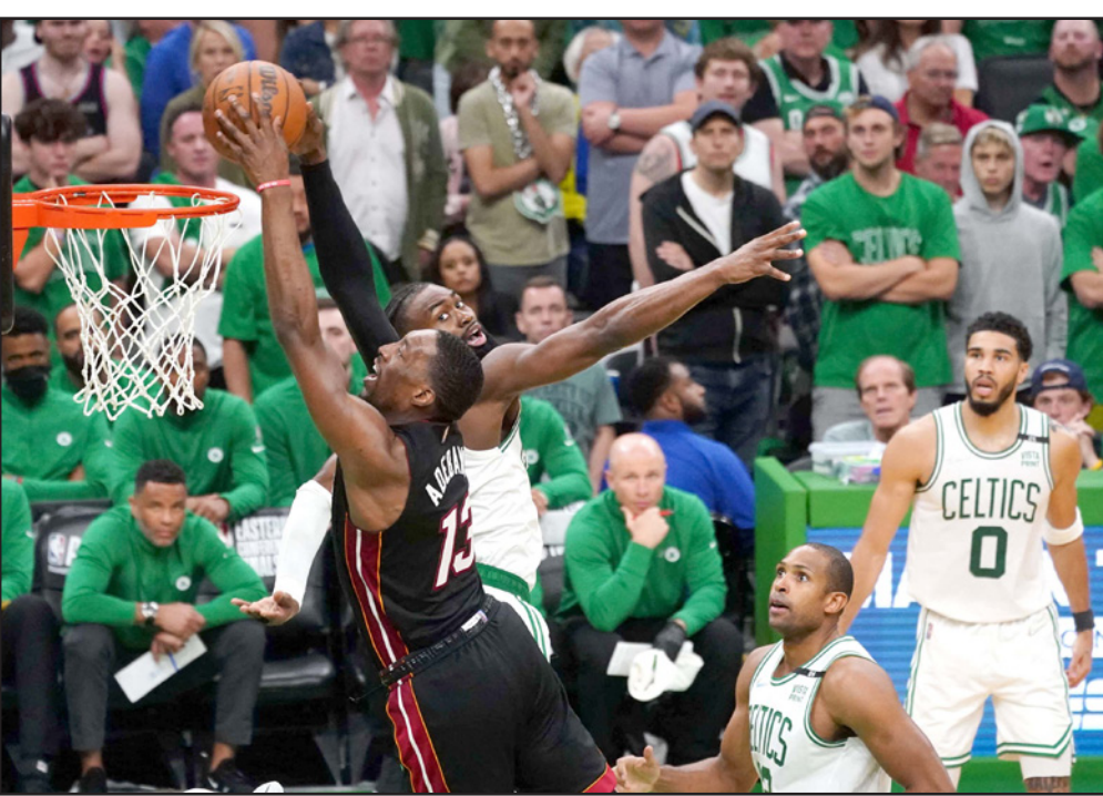
أديبايو نجم ميامي هيت يهجم بالتسجيل في سلة سيلتكس