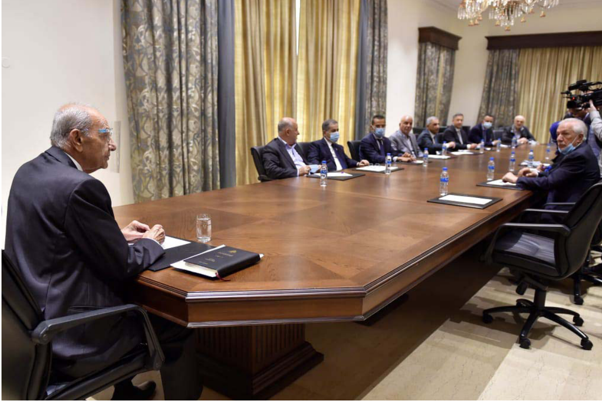
بري مترشحا كئله

نبداله الأصوات مع أي موقع، ونعتز بتجربة القيادة المجلسية التي وضعت هذه السلطة ودورها في موقعها الحقيقي متعاونة مع السلطات كما ينص الدستور». وأضاف خليل «أما ما يحاول أن يضعه من شروط، فالأمر مردود إليه وهو يحاول أن يهزم اللبنانيين بأننا من عطلنا التدقيق الجنائي الذي كان للرئيس بري شرف أن يجعل على إقرار أربعة قوانين تتعلق به ويرفع السرية المصرفية، وكيف عطل فريقه لمرات إقرار الكابيتال كونترول وأوقف التشكيلات القضائية ولم ينفذ أي من قوانين مكافحة الفساد وغيرها الكثير مما أوقع البلاد في المصيبة التي نعيش، وأما تطوير النظام واللامركزية فالجميع سيعلم الموقف الثابت للرئيس بري يوم الثلاثاء الماضي. ويجب الناس وليس نحن عن شروطهم ومطلبهم منه في المحاسبة عن الكهرياء والاتصالات والفساد وصفقاتها». وختم «لم يتعد الرئيس بري أن يفرض من تحت الطاولة على أي من المواقع، وهو يشرفها، ولم يقبل يوماً من أحد أن يضع شروطاً عليه بأكثر بكثير مما هو مطروح».