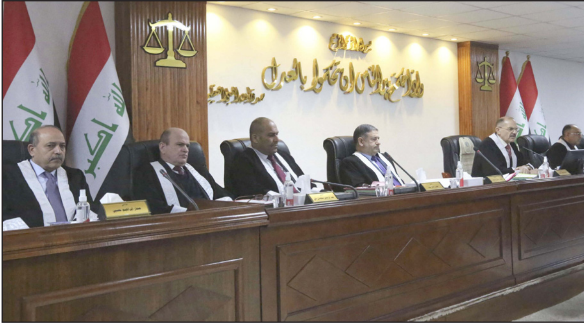
إحدى جلسات المحكمة الاتحادية العراقية

إذا ما كان مخالف لأحكام القوانين وفقاً لتدرجاتها، لكي تُصون الدستور ونيتي دولة يسودها القانون». وشكر القضاء، «القوى السياسية وأعضاء السلطنتين التشريعية والتنفيذية ممن كان لهم رأي واضح في احترام أحكام الدستور من خلال احترامهم لا يصدر عن الحكم وقدرات وإن كانت لم تتوافق مع مصالحهم أو حتى مع قناعاتهم». ودعا في البيان، زلمعهم وأعضاء الإيعاء إلى «أخذ دورهم في المطالبة بما تضمنه هذا البيان أو بما يرونه مناسباً، وبما يحفظ ويضمن الحفاظ على هيبة القضاء واستقلاله وعدم السماح بالنيل منه، خاصة بعد أن أصبح القضاء بعد نفاذ قانون مجلس القضاء الأعلى في 23/1/2017 وبفضل الله ملامة أبناء الشعب وملاحاً حتى للسلطنتين التشريعية والتنفيذية يلجؤون اليه عند اشتداد الأزمت وتضمر حلها».