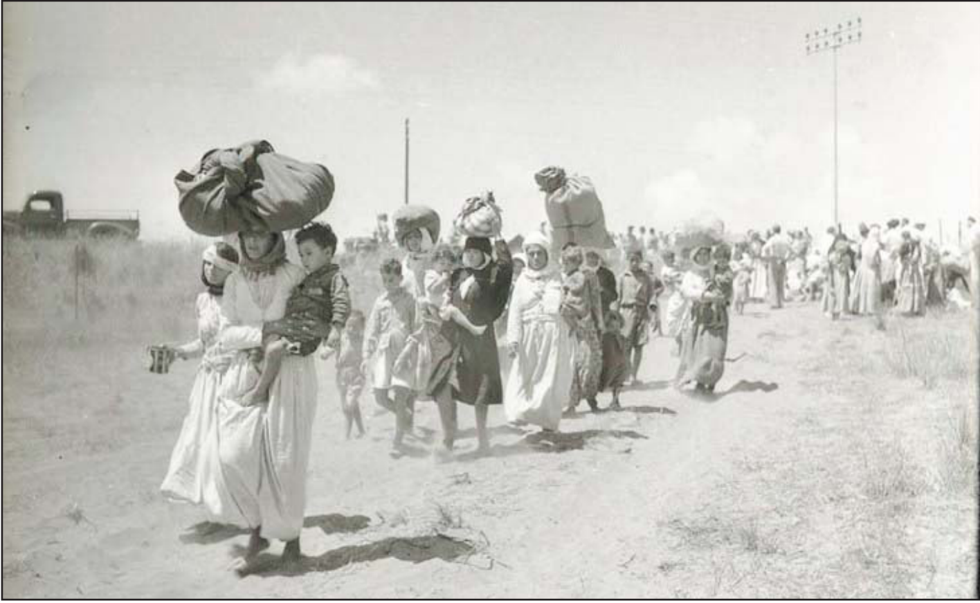
أرشيفية لأهالي قرية الطنظورة

1984 في دمشق التي يعرف كل من راجع أجزاءها الأربعة ضعفيها وسطحيتها، في المقابل يحاول شطانيبيرغ زعزعة الركبتة داخل هذه القرية».