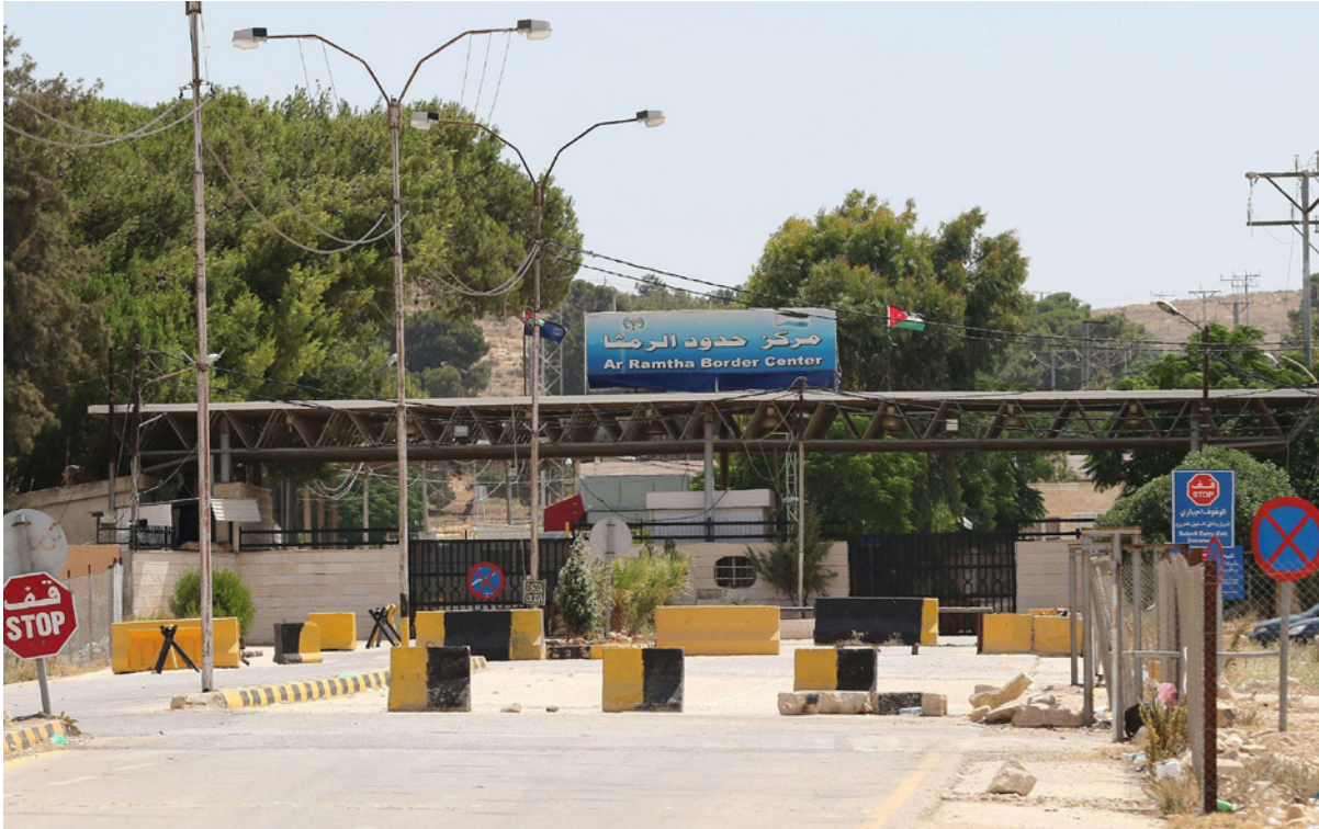
حاجز الرمثا العسكري على طول الحدود الأردنية السورية

فصباح الأحد قتل بالرصاص الأردني أربعة مهربين، وجرح مئتهم، وفر بمعنى عماد إلى الأرض السورية، عدد آخر. وأصبح الأمر سياسياً وإعلامياً ومن الجانب السوري «غزواً» يحتاج إلى تفكير، حيث لا يعرف الرأي العام الأردني ما هي دوافع واحتياجات شبكات تهريب مخدرات وسلاح محترقة تصير صخرة تلو الأخرى على الاختراق والتسلل، فيما تقتضها وتصطادها أسلحة قوات حرس الحدود الأردنية المحترقة جداً، والتي تقوم بواجبات لا تسعج، على حد تعبير أحد كبار المسؤولين السرييين، حتى يمرور عصفور أو نملة بصورة غير شرعية.